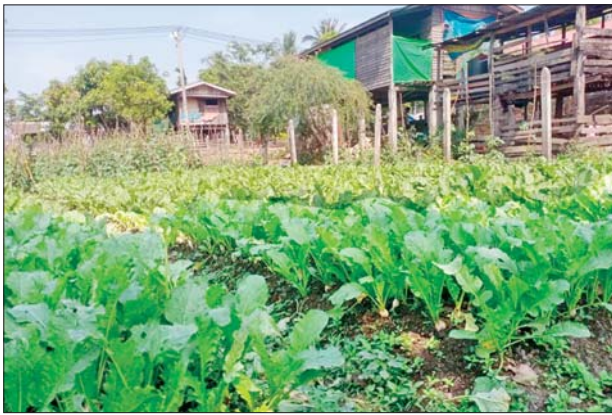
မြေကွက်လပ်များတွင် မုန့်လာ၊ ကန်စွန်း၊ ခဝဲ၊ ပဲသီး၊ ချဉ်ပေါင်နှင့် အခြားဟင်းသီးဟင်းရွက်များကို ရာသီအလိုက် စိုက်ပျိုးကြပြီး

ကျောကရိတ် ဇန်နဝါရီ ၂၉ ကရင်ပြည်နယ် ကျောကရိတ်မြို့ အမှတ်(၄) ရပ်ကွက်၌ စိုက်ပျိုးရေးလုပ်ငန်း လုပ်ကိုင်ကြသည့် တောင်သူများသည် မိသားစုစားဝတ်နေရေးအတွက် မိမိတို့၏ နေအိမ်ခြံဝင်း မြေကွက်လပ်တွင် စားဖိုဆောင်သီးနှံ ဟင်းသီးဟင်းရွက်များ စိုက်ပျိုးကြသဖြင့် မိသားစုများ နေ့စဉ်ပုံမှန် အပိုင်ငွေ ရရှိလျက်ရှိကြောင်း သိရသည်။ အဆိုပါ တစ်နိုင်တစ်ပိုင်စိုက်ပျိုးရေးလုပ်ကိုင်သူများသည် အိမ်ရှိ