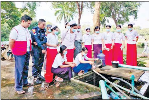
ရေတင်ကျန်နိုင်သော ဘူးခွက်များ၊ ရေပုံး၊ ရေအိုးများ၊ ဘုရားပန်းအိုးများကို ဖုံး၊ သွန်း၊ လဲ၊ စစ်လုပ်ငန်းများ ဆောင်ရွက်ပြီး ရေတိုင်ကီနှင့် ကျောက်စည်ပိုင်း၊ ရေအုတ်ကန်များအတွင်း အဘိတ်ဆေးခတ်ခြင်း၊ ကျန်းမာရေးအသိပညာပေးဟောပြောခြင်း၊ ပတ်ဝန်းကျင်

အလုံ ဇန်နဝါရီ ၂၉ ရန်ကုန်တိုင်းဒေသကြီး အလုံ မြို့နယ် ပြည်သူ့ကျန်းမာရေးဦးစီးဌာနနှင့် ပူးပေါင်းအဖွဲ့များက ယမန်နေ့ နံနက်ပိုင်းက ရောဂါတိုက်ဖျက်ရေးအဖွဲ့ဝင်များက ရုပ်ကွက်သို့ကွင်းဆင်း၍ သွေးလွန်တုပ်ကွေးရောဂါ ကာကွယ်ရေးလုပ်ငန်းများကို အရှိန်အဟုန်မြှင့်ဆောင်ရွက်ခဲ့သည်။