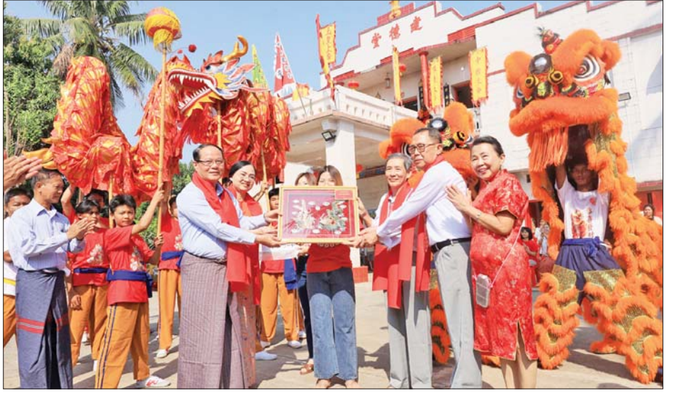
၁၀ သိန်းနှင့် နှစ်သစ်ကူးအထိမ်းအမှတ်လက်ဆောင်များအား ဘုံကျောင်းတာဝန်ရှိသူများထံ ပေးအပ်ချီးမြှင့်ရာ ဘုံကျောင်းတာဝန်ရှိသူများက နှစ်သစ်ကူးအထိမ်းအမှတ်လက်ဆောင်များ အပြန်အလှန်ပေးအပ်ချီးမြှင့်ကြကြောင်း သိရသည်။ စောမျိုးမင်းသိန်း(ပြန်/ဆက်)

ဘားအံကျွန်းတိတ်ဗုဒ္ဓဘာသာဘုံကျောင်းရှိ ဗုဒ္ဓရုပ်ပွားတော်နှင့် နတ်မင်းအပေါင်းတို့အား နှစ်သစ်မင်္ဂလာ စုပေါင်း ကန်တော့ကြသည်။ အပြန်အလှန်ပေးအပ်ချီးမြှင့် ထိုနောက် ပြည်နယ်ဝန်ကြီးချုပ်နှင့် တာဝန်ရှိသူများသည် ဘားအံကျွန်းတိတ်ဘုံကျောင်း မင်္ဂလာ နဂါးခိုင်းကွမ်း မင်္ဂလာပြုလုပ်ခြင်းအား ကြည့်ရှုအားပေးခဲ့ကြပြီး တရုတ်ရိုးရာ နဂါးအကအလှနှင့် ရွှေခြင်္သေ့အကအလှတို့ဖြင့် စွမ်းရည်ပြသဖျော်ဖြေကြရာ ပြည်နယ်ဝန်ကြီးချုပ်နှင့် တာဝန်ရှိသူများက နှစ်သစ်ကူးအံပေါင်းများ ပေးအပ်ချီးမြှင့်ကြသည်။ ယင်းနောက် ပြည်နယ်ဝန်ကြီးချုပ်နှင့် တာဝန်ရှိသူများက ကျွန်းတိတ်ဘုံကျောင်းအတွက် ငွေကျပ်