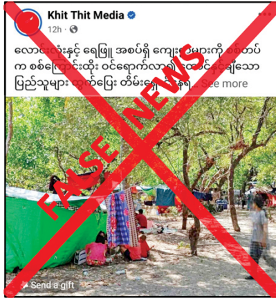
ရေးသား ဝါဒဖြန့်ဝေနေခြင်းသာဖြစ်ကြောင်း သိရသည်။ သတင်းစဉ်

သမားများ တရားမဝင်ခိုအောင်းစိမ့်ဝင်မှုမရှိ စေရေးနှင့် အကြမ်းဖက်လုပ်ငန်းများ မလုပ်ဆောင်နိုင်စေရန်အတွက် လိုအပ်သော နယ်မြေလုံခြုံရေးလုပ်ငန်းများကို နေ့ဉာဏ်စွမ်းစွမ်းတစ်ဆောင်ရွက်လျက်ရှိကြောင်း သိရသည်။ တရားမဝင် ပြည်ပျက်မိဒီယာများက နယ်မြေလုံခြုံရေး ဆောင်ရွက်လျက်ရှိသည့် လုံခြုံရေးတပ်ဖွဲ့ဝင်များအပေါ် ပြည်သူများ အထင်အမြင်လွှဲမှားပြီး စိုးရိမ်ထိတ်လန့် စေရန်နှင့် နယ်မြေတည်ငြိမ်အေးချမ်းမှုပျက်ပြားစေရန် ရည်ရွယ်၍ ယခုကဲ့သို့ အခြေအမြစ်မရှိသည့် သတင်းအမှားများကို လုပ်ကြံ