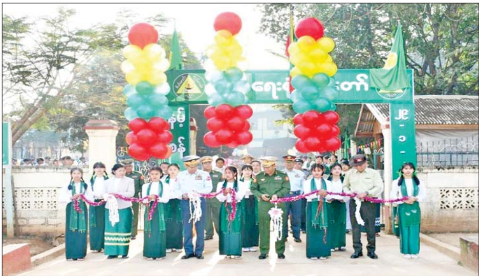
သင်္ချာစွမ်းရည်ပြိုင်ပွဲများ၊ စာစိစာကုံးပြိုင်ပွဲများတွင် ဆုရရှိသော ကျောင်းသား ကျောင်းသူများအား ဆုများပေးအပ်ချီးမြှင့်ပြီး ကျောင်းသား ကျောင်းသူများ၏ တီထွင်ပြုလုပ်ထားသော စက်မှု၊ လက်မှု လက်ရာများ၊ သင်ထောက်ကူပစ္စည်းပြခန်းများနှင့် သိပ္ပံပြခန်းများတွင် လက်တွေ့ပြသနေမှုများကို လိုက်လံကြည့်ရှုအားပေးကြကြောင်း သိရသည်။ သတင်းစဉ်

သိုင်း၊ ပန်းဖွားအကဖြင့် ဖျော်ဖြေတင်ဆက်မှုများကို ကြည့်ရှုအားပေးကြသည်။ ထို့နောက် ကျောင်းသား ကျောင်းသူများက “ကြိုဆိုပါသည် စုံညီပွဲတော်” သီချင်းဖြင့် သီဆိုဖွင့်လှစ်ပြီး တိုင်းမှူးက ဂုဏ်ပြုအားပေးစကားပြောကြားသည်။ ယင်းနောက်တိုင်းမှူးနှင့် တက်ရောက်လာကြသူများက ကျောင်းသား ကျောင်းသူများ၏ မြန်မာ့ရိုးရာနှင့် ခေတ်ပေါ်တေးသီချင်းများ၊ တိုင်းရင်းသားရိုးရာအကများဖြင့် သီဆိုဖျော်ဖြေမှုများကို ကြည့်ရှုအားပေးကြသည်။ ဆက်လက်၍ တိုင်းမှူးက ပညာရေးစုံညီပွဲတော်အတွက် ချီးမြှင့်ငွေများပေးအပ်ရာ ကျောင်းအုပ်ကြီးက လက်ခံရယူပြီး ဂုဏ်ပြုမှတ်တမ်းလွှာများ ပြန်လည်ပေးအပ်သည်။ ထို့နောက် တိုင်းမှူးနှင့် တာဝန်ရှိသူများက ပြည်နယ်/ခရိုင်/မြို့နယ်အဆင့် အင်္ဂလိပ်စာ၊