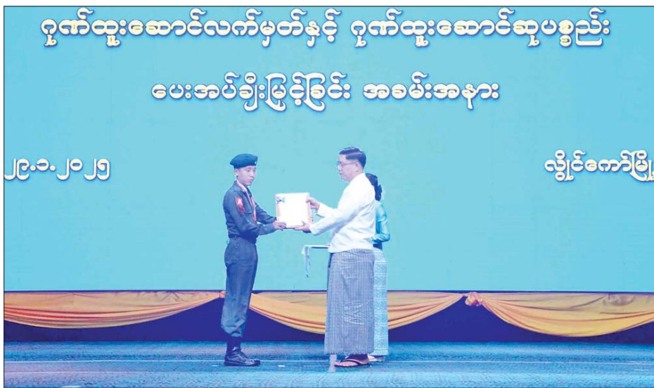
အနက် တိုက်တွန်းမှာကြားလိုကြောင်း ပြောကြားသည့်။ ထို့နောက် ပြည်နယ်ဝန်ကြီးချုပ်၊ ဒေသကွပ်ကဲရေးမှူး၊ ပြည်နယ်တရားသူကြီးချုပ်နှင့် ပြည်နယ်အစိုးရအဖွဲ့ဝင်များက ပြည်နယ်အတွင်း လုံခြုံရေးနှင့် တရားဥပဒေစိုးမိုးရေး၊ စီမံခန့်ခွဲရေး၊ စိုက်ပျိုးမွေးမြူရေး၊ ပတ်ဝန်းကျင်ထိန်းသိမ်းရေး၊ လူမှုရေးကဏ္ဍများ စွမ်းစွမ်းတမ်းဆောင်ရွက်ခဲ့ကြသူများနှင့် ၂၀၂၄ ခုနှစ်

ဦးစွာ ပြည်နယ်ဝန်ကြီးချုပ် ဦးဇော်မျိုးတင်က အဖွဲ့အမှတ်စဉ်ကားပြောကြားရာတွင် ကယားပြည်နယ်အစိုးရအဖွဲ့အနေဖြင့် ပြည်နယ်အတွင်း တည်ငြိမ်အေးချမ်းရေးနှင့် တရားဥပဒေစိုးမိုးရေး၊ ဒေသဖွံ့ဖြိုးတိုးတက်ရေးလုပ်ငန်းများတွင် ပြည်နယ်အစိုးရအဖွဲ့နှင့်အတူ တတ်စွမ်းသမျှ အသိပညာ၊ အတတ်ပညာများနှင့် ကိုယ်ကျိုးမဖက်ဘဲ မိမိတို့ကျရာကဏ္ဍတွင် ထူးချွန်ပြောင်မြောက်စွာ စွမ်းဆောင်ခဲ့ကြသူများကို ယခုကဲ့သို့ ထိုက်ထိုက်တန်တန် ချီးမြှင့်အပ်နှင်းခြင်းဖြစ်ကြောင်း၊ ဆက်လက်၍လည်း ဦးတန်းအရေး(၃)ပါးကို ဦးထိပ်ထားပြီး ပြည်ထောင်စုစိတ်ဓာတ်အပြည့်မွေးမြူကာ ပြည်နယ်ဖွံ့ဖြိုးတိုးတက်ရေး၊ ပြန်လည်ထူထောင်ရေး လုပ်ငန်းစဉ်များတွင် စည်းစည်းလုံးလုံး ပိုင်းဝန်းဆောင်ရွက်ကြရန် အလေး