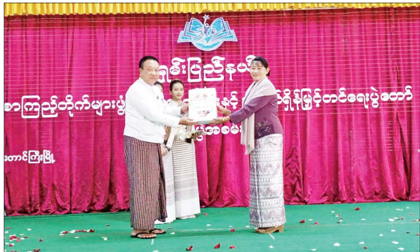
ပညာရှင်များနှင့် အကဖြတ်အမှတ်ပေးခဲ့ကြသည့် အကဖြတ်ခိုင်းများအား အမှတ်တရလက်ဆောင်များ ပေးအပ်သည်။ ယင်းနောက် စာဖတ်ရိုက်မြှင့်တင်ရေးပွဲတော် ကာယ၊ ဉာဏ်ပြိုင်ပွဲများတွင် ဆုရရှိခဲ့သည့် ကျောင်းသား ကျောင်းသူများအား ပြည်နယ်စီးပွားရေးရာဝန်ကြီးနှင့် တာဝန်ရှိသူများက ဆုများပေးအပ်ချီးမြှင့်ပြီး ဆုရရှိသည့် ကျောင်းသား ကျောင်းသူများက သရုပ်ပြတင်ဆက်ကာ အမှတ်(၄)အခြေခံပညာအထက်တန်းကျောင်းမှ ကျောင်းသားကျောင်းသူများက “ပညာဘက်တိုက်စာကြည့်တိုက်” သီချင်းဖြင့် ဖျော်ဖြေတင်ဆက်ခဲ့ကြကြောင်း သိရသည်။ ပြည်နယ်(ပြန်/ဆက်)

တောင်ကြီး ဇန်နဝါရီ ၂၉ ရှမ်းပြည်နယ်(တောင်ပိုင်း) တောင်ကြီးမြို့၌ ရှမ်းပြည်နယ်အစိုးရအဖွဲ့၏ ကြီးကြပ်မှုဖြင့် ပြန်ကြားရေးနှင့် ပြည်သူ့ဆက်ဆံရေးဦးစီးဌာနနှင့် အခြေခံပညာဦးစီးဌာနတို့ ပူးပေါင်းဖွင့်လှစ်သည့် စာကြည့်တိုက်များဖွံ့ဖြိုးတိုးတက်ရေးနှင့် စာဖတ်ရိုက်မြှင့်တင်ရေးပွဲတော် ဆုချီးမြှင့်ပွဲအခမ်းအနားကို ယနေ့နံနက် ၉ နာရီက အမှတ်(၄)အခြေခံပညာအထက်တန်းကျောင်း မြသီရိခန်းမ၌ ကျင်းပသည်။ ဦးစွာ ရှမ်းပြည်နယ်စီးပွားရေးရာဝန်ကြီးဦးခွန်သိန်းမောင်က အဖွင့်အမှာစကားပြောကြားသည်။ ထို့နောက် အမှတ်(၄) အခြေခံပညာအထက်တန်းကျောင်းမှ ကျောင်းသားကျောင်းသူများက ရှမ်းတိုင်းရင်းသားရိုးရာအကဖြင့်လည်းကောင်း၊ ကျောင်းသူတစ်ဦးက တစ်ပင်တိုင်အကဖြင့်လည်းကောင်း ဖျော်ဖြေတင်ဆက်ပြီး စာကြည့်တိုက်များဖွံ့ဖြိုးတိုးတက်ရေးနှင့် စာဖတ်ရိုက်မြှင့်တင်ရေးပွဲတော်တွင် ပါဝင်ဟောပြောဆွေးနွေးပေးခဲ့သည့် စာပေ