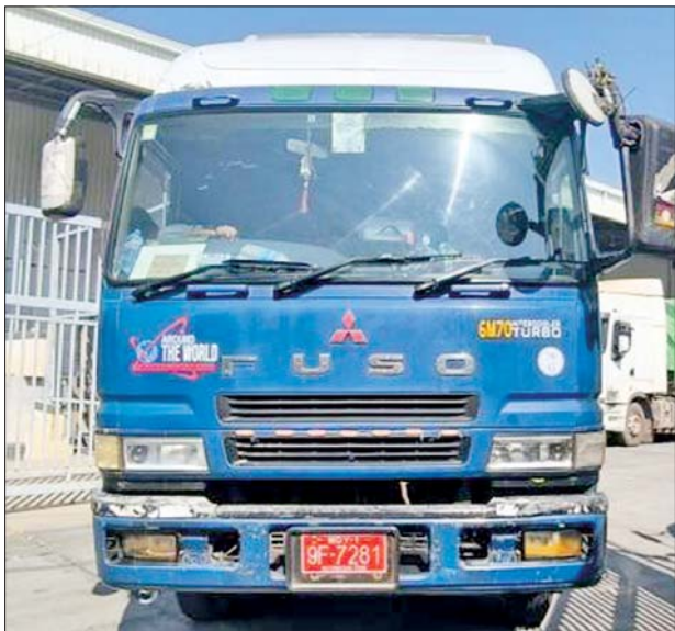
မန္တလေးတိုင်းဒေသကြီး၌ သိမ်းဆည်းရမိမှု။

ယင်းအပြင် ဇန်နဝါရီ ၂၈ ရက်တွင် အကောက်ခွန်ဦးစီးဌာန၏ စီမံခန့်ခွဲမှုဖြင့် တာဝန်ကျပူးပေါင်း အဖွဲ့များက စစ်ဆေးမှုများဆောင်ရွက် ခဲ့ရာ မြန်မာ့စက်မှုဆိပ်ကမ်း၌ ကုန်သွယ်မှုတစ်လုံးအတွင်းမှ တရားဝင် စာရွက်စာတမ်းအထောက်အထား တင်ပြနိုင်ခြင်းမရှိသည့် လုပ်ငန်းသုံး ပစ္စည်းနှစ်မျိုး (ခန့်မှန်းတန်ဖိုးငွေ ၂၄၉၃၆၅၅၅ကျပ်) ကိုလည်းကောင်း၊ မရမ်းချောင်း အမြဲတမ်းစစ်ဆေးရေးစခန်း၌ မော်လမြိုင်မြို့မှ မှုရွာမြို့သို့ မောင်းနှင်လာသည့် ယာဉ်တစ်စီးပေါ်မှ တရားဝင်စာရွက်စာတမ်း အထောက်အထား တင်ပြနိုင်ခြင်းမရှိသည့် စားသောက်ကုန်ပစ္စည်း နှစ်မျိုး (ခန့်မှန်းတန်ဖိုးငွေကျပ် ၆၃၅၂၀၀၀)နှင့် အဆိုပါပစ္စည်းများ တင်ဆောင်လာသည့် Yutong Bus တစ်စီး (ခန့်မှန်းတန်ဖိုးငွေကျပ်