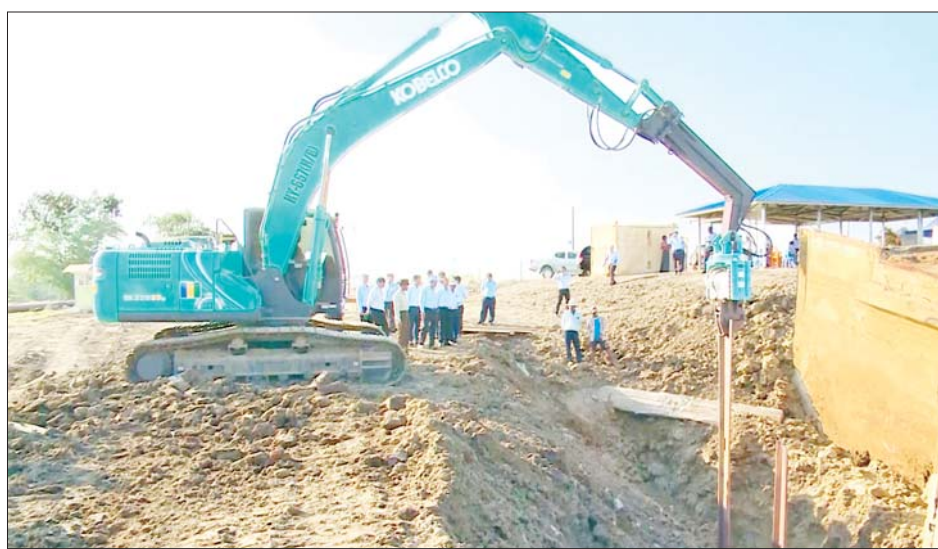
ပူးပေါင်းဆောင်ရွက် ထိုမှတစ်ဆင့် ဒုတိယဝန်ကြီးသည် မိတ္ထီလာတောင်ကန်ဥယျာဉ်မြောင်း ရေသောက်စနစ်အတွင်း နွေစပါးဧက ၅၀ နှင့် နွေနှမ်းဧက ၅၀ စိုက်ပျိုးမည့် နေရာ၌ ပေါင်ကြီးတင်စနစ်ဖြင့် စိုက်ပျိုးနိုင်ရန် အမှတ်(၂၅) စက်မှုလယ်ယာစခန်း တာဝန်ရှိသူများ၏ ပေါင်တင်ခြင်းလုပ်ငန်း ဆောင်ရွက်နေမှု၊ မိတ္ထီလာမြောက်ကန် ရေသောက်စနစ် ကောက်ကွေ့

နေပြည်တော် ဇန်နဝါရီ ၂၉ စိုက်ပျိုးရေး၊ မွေးမြူရေးနှင့် ဆည်မြောင်းဝန်ကြီးဌာန ဒုတိယဝန်ကြီး ဦးဗိုလ်ဗိုလ်ကျော်သည် ဇန်နဝါရီ ၂၇ ရက် နံနက်ပိုင်းက မန္တလေးတိုင်းဒေသကြီးရမည်းသင်းမြို့နယ် တာဘက္ကကျေးရွာရှိ စီပင်စိုက်ပျိုးရေး သုတေသနဌာနတွင် နေကြာမျိုးသန့် စိုက်ပျိုးထားရှိသည့် ဆင်းရွှေကြာ(၂) ဧက ၄၀ စိုက်တွင်းကို ကြည့်ရှုစစ်ဆေးပြီး ပြည်တွင်းစားသုံးဆီ ဖူလုံပိုလျှံစေရေးအတွက် ဒေသရေမြေရာသီဥတုနှင့်ကိုက်ညီသော အထွက်နှုန်းကောင်းသည့် နေကြာမျိုးကောင်းမျိုးသန့်များ ပိုမိုစိုက်ပျိုးထုတ်လုပ်ဖြန့်ဖြူးပေးနိုင်ရေး အကြံပြုဆွေးနွေးမှာကြားသည်။