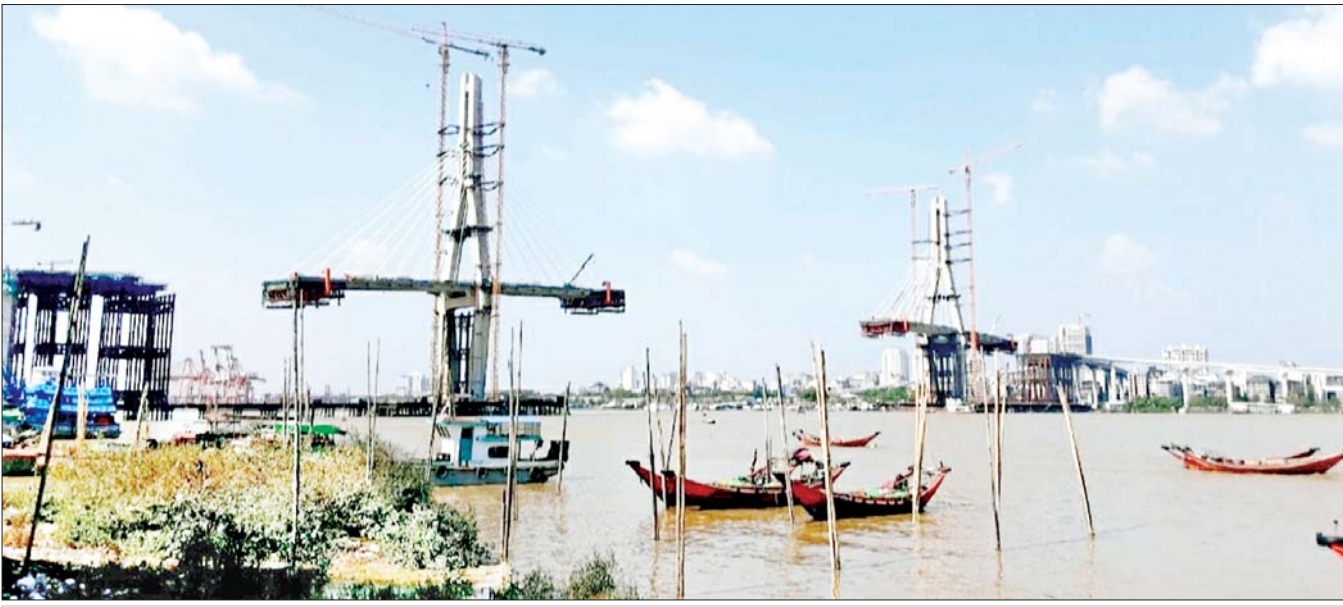
ကိုရီးယား-မြန်မာချစ်ကြည်ရေး (ဒလ)တံတား တည်ဆောက်နေမှုကို တွေ့ရစဉ်။

ချစ်ခင်လေးစားအပ်ပါသော ရှမ်းပြည်နယ်အတွင်းရှိ အားလုံးအနက် ဧရိယာအကျယ်ပြန့်ဆုံးဖြစ်ပြီး တိုင်းရင်းသား တိုင်းရင်းသား မိဘပြည်သူ့အစိတ်အပိုင်းအားလုံး မျိုးနွယ်စုအများဆုံး မှီတင်းနေထိုင်လျက်ရှိသည့် ပြည်နယ် ကြီးလည်းဖြစ်ပါသည်။ ရှမ်းပြည်နယ်အတွင်း ရှမ်း၊ ပအိုဝ်း၊ မင်္ဂလာပါခင်များ- ယနေ့ ၂၀၂၅ ခုနှစ်၊ ဖေဖော်ဝါရီလ ၇ ရက်နေ့တွင် ကျရောက်သည့် (၇၈)နှစ်မြောက် ရှမ်းပြည်နယ်နေ့ နေ့ထူး နေ့မြတ်အခါသမယ၌ ရှမ်းပြည်နယ်နှင့် နိုင်ငံတစ်ဝန်းရှိ ပြည်ထောင်စုဖွား တိုင်းရင်းသားပြည်သူများအားလုံး ကိုယ်စိတ်နှစ်ဖြာ ကျန်းမာချမ်းသာကြပါစေကြောင်း ဆုမွန် ကောင်းတောင်းလျက် နှုတ်ခွန်းဆက်သအပ်ပါသည်။ ရှမ်းပြည်နယ်သည် တိုင်းဒေသကြီးနှင့် ပြည်နယ်များ အားလုံးအနက် ဧရိယာအကျယ်ပြန့်ဆုံးဖြစ်ပြီး တိုင်းရင်းသား မျိုးနွယ်စုအများဆုံး မှီတင်းနေထိုင်လျက်ရှိသည့် ပြည်နယ် ကြီးလည်းဖြစ်ပါသည်။ ရှမ်းပြည်နယ်အတွင်း ရှမ်း၊ ပအိုဝ်း၊ မင်္ဂလာပါခင်၊ ဓနု၊ အင်းသား၊ တောင်ရိုး၊ ဝါ ထနေ့၊ ကိုးကန်၊ လားဟူ၊ ယင်းနက်၊ ယင်းကြား၊ မြောင်စီး၊ အာခါ စသည့် ရှမ်းမျိုးနွယ်စုများနှင့်အတူ ကချင်၊ ကယား၊ လီဆူး စသည့် တိုင်းရင်းသားများသည် ကာလရှည်ကြာ အတူယှဉ်တွဲ စုပေါင်းနေထိုင် ခဲ့ကြခြင်းသည် ပြည်ထောင်စုစိတ်ဓာတ်ဖြင့် စည်းလုံးညီညွတ်မှုကို ဖော်ပြခဲ့သည့် အစဉ်အလာကောင်း ပင်ဖြစ်ပါသည်။ စာမျက်နှာ ၃ ကော်လံ ၁ သို့ ☆