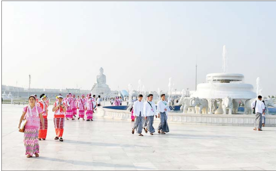
ဘုရားကြီး တည်ထားကိုးကွယ်ပူဇော်ရခြင်း ရည်ရွယ်ချက်၊ ရုပ်ပွားတော်မြတ်ကြီးအား လုပ်ငန်းစဉ်

ဦးစွာ တိုင်းရင်းသားရိုးရာယဉ်ကျေးမှုအက အဖွဲ့များသည် ပြည်ထောင်စုနယ်မြေ နေပြည်တော် ဒက္ခိဏသီရိမြို့နယ်ရှိ ဗုဒ္ဓဥယျာဉ်ဝတ္ထုကံတော်တွင် တည်ထားပူဇော်ထားသည့် ကမ္ဘာပေါ်ရှိ ထိုင်တော်မူ ကျောက်ဆစ် ဗုဒ္ဓရုပ်ပွားတော်များအနက် ဉာဏ်တော် အမြင့်ဆုံးဖြစ်သည့် မာရဝိဇယဗုဒ္ဓရုပ်ပွားတော် မြတ်ကြီးအား သွားရောက်ဖူးမြော်ကြည့်ညိကြရာ ရှင်းလင်းဆောင်၌ တာဝန်ရှိသူများက မာရဝိဇယ