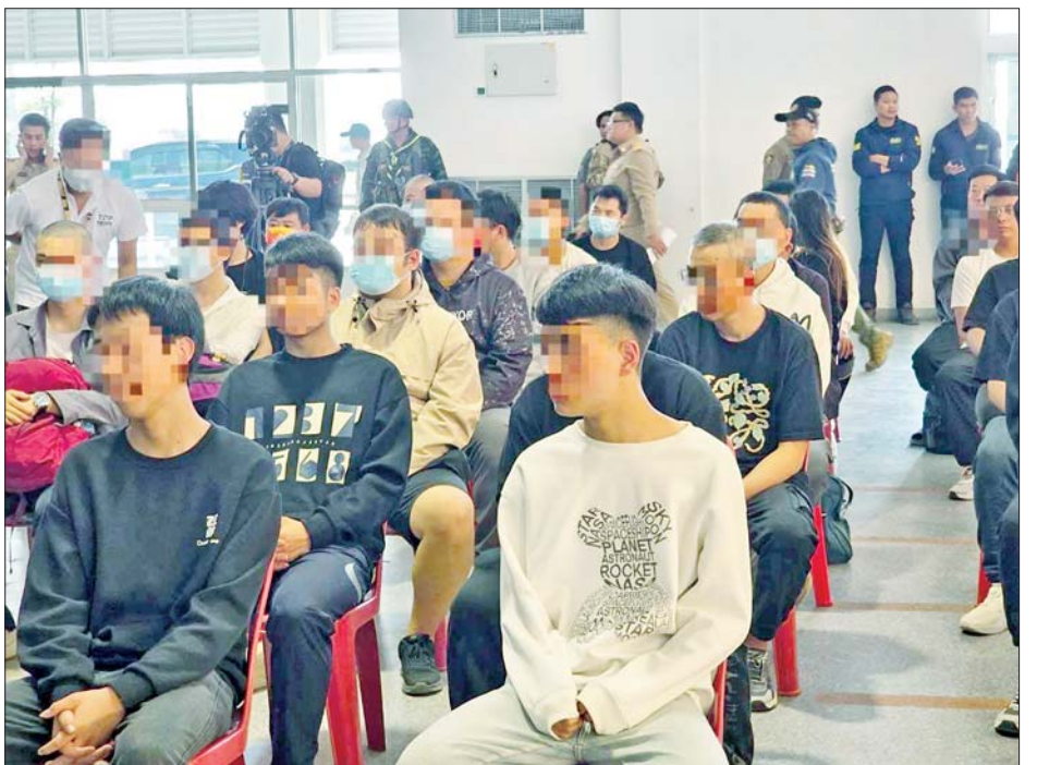
မြန်မာနိုင်ငံအတွင်းသို့ အထောက်အထားမဲ့ဝင်ရောက်လာသူများအား လုပ်ထုံးလုပ်နည်းများနှင့်အညီ လွှဲပြောင်းပေးအပ်လျက်ရှိမှု မှတ်တမ်းဓာတ်ပုံများ။