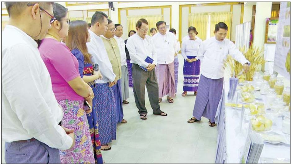
စိုက်ပျိုးရေးသုတေသနဦးစီးဌာန ညွှန်ကြားရေးမှူး ချုပ်များက ပြည်တွင်း၌ လက်ရှိ ဂျုံသီးနှံစိုက်ပျိုး ထုတ်လုပ်နေမှုနှင့် အရည်အသွေးကောင်း ဂျုံမျိုးများ တိုးချဲ့စိုက်ပျိုးမည့်အစီအစဉ်များ၊ ဂျုံမျိုးများ မျိုးစပ် ထုတ်လုပ်ထားရှိမှုအခြေအနေများကို ရှင်းလင်းတင်ပြ ကြပြီး မြန်မာနိုင်ငံ ဂျုံစက်လုပ်ငန်းရှင်များနှင့် အစည်း အဝေး တက်ရောက်လာကြသူများက သက်ဆိုင်ရာ ကဏ္ဍများအလိုက် တင်ပြဆွေးနွေးကြသည်။ ဆွေးနွေးချက်များအရ ပြည်တွင်း၌ လက်ရှိ ဂျုံမျိုး ၁၅ မျိုးကို တိုင်းဒေသကြီးနှင့် ပြည်နယ် ခြောက်ခုတွင်စတင် ၂၀၂၅ ခုနှစ် ကျော်စိုက်ပျိုးထားရှိပြီး စုစုပေါင်း ဂျုံအထွက် တင်း ၂၉၇၀၀၀၀ ကျော် ထွက်ရှိ ကာ ဂျုံမှုန့် တန်ချိန် ၇၂၇၀၀၀ ကျော်ကို နှစ်စဉ် ထုတ်လုပ်လျက်ရှိပြီး ဂျုံစက်လုပ်ငန်းရှင်များက ပြည်တွင်းစိုက်ပျိုးထုတ်လုပ်သော ဂျုံမျိုးများကို ဓာတ်ခွဲစမ်းသပ်ပြီး ၎င်းတို့ကြိုက်နှစ်သက်သည့် ဂျုံမျိုးများကို ပြန်ကြားပေးသွားမည်ဖြစ်ကြောင်း သိရသည်။ သတင်းစဉ်

ထိုနေ့က ညှိနှိုင်းဆွေးနွေးပွဲကို စတင်ကျင်းပရာ ပြည်ထောင်စုဝန်ကြီးက ဂျုံသီးနှံသည် နိုင်ငံအတွင်း အောင်မြင်စွာ စိုက်ပျိုးနိုင်သော သီးနှံဖြစ်သည့်အပြင် အမျိုးအစားအလိုက် အရည်အသွေးများရှိသော ကြောင့် ပြည်ပနိုင်ငံများမှ ဂျုံကုန်ကြမ်းများကို အဓိကထားတင်သွင်းဆောင်ရွက်ခြင်းမပြုဘဲ အရည် အသွေးကောင်းသော ဂျုံမျိုးကောင်းမျိုးစေ့များကို အသုံးပြု၍ ပြည်တွင်း၌ ကျယ်ကျယ်ပြန့်ပြန့် စိုက်ပျိုး ထုတ်လုပ်သွားရန် စီမံလျက်ရှိကြောင်း၊ ယခုလေ့လာ ကြည့်ရှုခဲ့ကြသည့် ဂျုံအမျိုးအစားများမှ လုပ်ငန်းရှင် များ နှစ်သက်သဘောကျသည့် ဂျုံမျိုးများကို ရွေးချယ်တင်ပြလာပါက လိုအပ်မှုအပေါ်မူတည်၍ ဒေသအလိုက် စိုက်ပျိုးထုတ်လုပ်နိုင်ရေး ဂျုံစိုက် တောင်သူများ၊ ဂျုံသီးနှံစိုက်ပျိုးထုတ်လုပ်မှုကွင်းဆက် တစ်လျှောက်တွင် ပါဝင်ပတ်သက်သူ အစုအဖွဲ့များနှင့် ပေါင်းစပ်ညှိနှိုင်းပြီး ပြည်တွင်း၌ အရည်အသွေးကောင်း ဂျုံမျိုးများ တိုးချဲ့စိုက်ပျိုးရေး ဆက်လက်ဆောင်ရွက် ပေးသွားမည်ဖြစ်ကြောင်း ပြောကြားသည်။