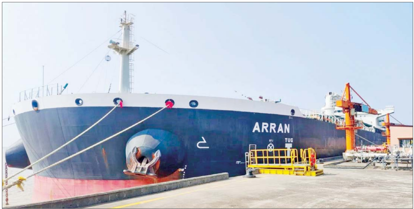
သီလဝါရှိ ဆီချဆိပ်ကမ်းတွင် ဆိုက်ကပ်ထားသည့် ဆီတင်သင်္ဘောတစ်စင်းကို တွေ့ရစဉ်။