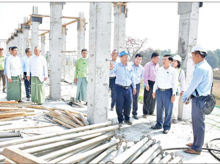
ရန်အောင်မြင် ကျေးရွာအုပ်စု ရန်အောင်မြင်ကျေးရွာ ကွင်း အမှတ် ၁၆၂၈ တွင် နေပြည်တော် ဆည်မြောင်းနှင့် ရေအသုံးချမှုစီမံ ခန့်ခွဲရေးဦးစီးဌာန(ရေအရင်းအမြစ်) က စိုက်ပျိုးရေးပေးဝေရန်အတွက် မြေအောက်ရေ စက်ရေတွင်း တူးဖော်မည့်နေရာအား ကြည့်ရှု စစ်ဆေးပြီး သစ်စိမ်းမြေဩဇာ (ပိုက်ဆံလျှော်)များ စိုက်ပျိုးထားရှိ မှုကို ကြည့်ရှုအားပေးသည်။ ယင်းနောက် နေပြည်တော်

နေပြည်တော်ကောင်စီဥက္ကဋ္ဌ ဦးသန်းထွန်းဦးနှင့် တာဝန်ရှိသူ များသည် ယနေ့နံနက်ပိုင်းတွင် ဒက္ခိဏသီရိမြို့နယ် ကျွန်းတက်ပုံ ကျေးရွာအုပ်စုညောင်ကုန်းကျေးရွာ ကွင်းအမှတ် ၁၈၁၇ တွင် နေပြည်တော် ဆည်မြောင်းနှင့် ရေအသုံးချမှုစီမံခန့်ခွဲရေးဦးစီးဌာန (ရေအရင်းအမြစ်)မှ စိုက်ပျိုးရေး ပေးဝေရန်အတွက် မြေအောက်ရေ စက်ရေတွင်း တူးဖော်မည့်နေရာ အားကြည့်ရှုစစ်ဆေးပြီး အဆိုပါ ကွင်းအမှတ် ၁၈၁၇ အတွင်း ဆောင်းသီးနှံ နေကြာစိုက်ခင်းနှင့် မတ်ပဲသီးနှံစိုက်ခင်းများ အောင်မြင် ဖြစ်ထွန်းနေမှုကို ကြည့်ရှုအားပေး သည်။ ထို့နောက် ဒက္ခိဏသီရိမြို့နယ်