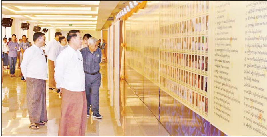
(Red Carpet)နေရာများ၊ ၁၉၅၂ ခုနှစ်မှ ၂၀၂၃ ခုနှစ် မှတ်တမ်းဓာတ်ပုံများနှင့် ၂၀၂၄ ခုနှစ်အတွင်း ရုံတင်ပြသခဲ့သည့် ရုပ်ရှင်ဇာတ်ကားအမည်များ ပြသ အထိ မြန်မာ့ရုပ်ရှင်ထူးချွန်ဆု ရရှိခဲ့ကြသူများ၏

၂၀၂၄ ခုနှစ်အတွက် မြန်မာ့ရုပ်ရှင်ထူးချွန်ဆု ချီးမြှင့်ပွဲအခမ်းအနားကို ဖေဖော်ဝါရီ ၉ ရက်တွင် နေပြည်တော်ရှိ မြန်မာအပြည်ပြည်ဆိုင်ရာ ကွန်ဗင်းရှင်းဗဟိုဌာန-၁ ၌ ခမ်းနားထည်ဝါစွာကျင်းပ သွားမည်ဖြစ်ရာ မြန်မာ့ရုပ်ရှင်ထူးချွန်ဆုချီးမြှင့်ပွဲ အခမ်းအနားကျင်းပရေး ဦးစီးကော်မတီဥက္ကဋ္ဌ ပြန်ကြားရေးဝန်ကြီးဌာန ပြည်ထောင်စုဝန်ကြီး ဦးမောင်မောင်အုန်းသည် တာဝန်ရှိသူများနှင့်အတူ ယနေ့ညနေပိုင်းတွင် အခမ်းအနားအောင်မြင်စွာ ကျင်းပနိုင်ရေး ကြိုတင်ပြင်ဆင် ဆောင်ရွက်နေမှုများ ကို ကြည့်ရှုစစ်ဆေးသည်။