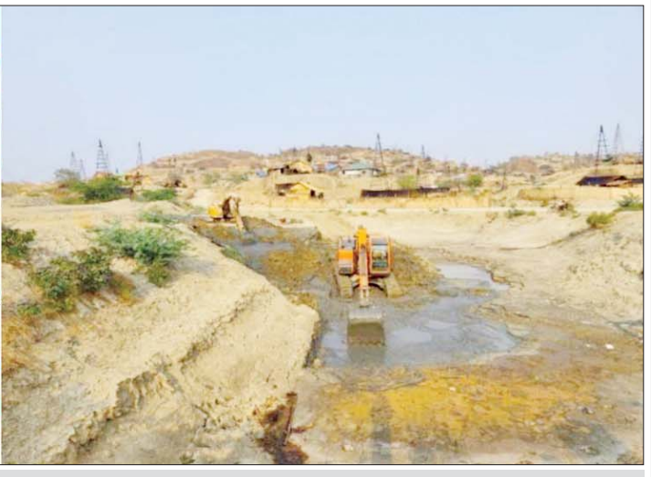
ရေနံလက်ယက်တွင်းပေါင်းများစွာတူးဖော်ခဲ့မှုနှင့် ပတ်ဝန်းကျင်ထိခိုက်ပျက်စီးနေမှုမှတ်တမ်းဓာတ်ပုံ။

ရေနံကို မင်းသုံးစိုးသုံးအဖြစ် စတင်ခဲ့သော ကာလသည် အနော်ရထာမင်းလက်ထက် ဖြစ်သည်။ ရေနံဆက်သွင်းခဲ့သော မူလရေနံတွင်းရိုး အိမ်ထောင်စုတို့ကို ဘွဲ့ထူးဂုဏ်ထူးတို့ဖြင့် ချီးမြှင့်ခဲ့သည်။ တွင်းရိုးအိမ်ထောင်စုတို့သည် အခြားတစ်ပါးသောမျိုးရိုးတို့နှင့် မဆက်နွှယ်ဘဲ သီးသန့်နေထိုင်ကြ၍ အနော်ရထာမင်းလက်ထက်တွင် တွင်းရိုး ၂၄ ဦး ရှိခဲ့သည်။