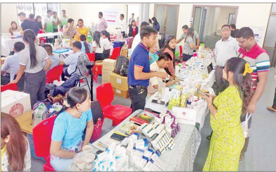
နံနက် ၉ နာရီက ကျင်းပသည်။ ရောင်းချပွဲကို ဖေဖော်ဝါရီ ၇ ရက် သောကြာနေ့အထိ) နေ့စဉ်နံနက် ၉ နာရီမှ ညနေ ၄ နာရီအထိ

ရန်ကုန် ဖေဖော်ဝါရီ ၆ မြန်မာနိုင်ငံဆေးနှင့်ဆေးပစ္စည်းလုပ်ငန်းရှင်များ အသင်းက ဆေးဝါးသုံးစွဲသူ ပြည်သူများ သင့်တင့်မျှတသော ဈေးနှုန်းဖြင့် အဆင်ပြေစွာ ဝယ်ယူသုံးစွဲနိုင်ရန်နှင့် ဆေးဝါးများ မပြတ်လပ်ရန် ရည်ရွယ်၍ စီးပွားရေးနှင့် ကူးသန်းရောင်းဝယ်ရေး ဝန်ကြီးဌာန၏ ကြီးကြပ်မှုဖြင့် ရန်ကုန်တိုင်းဒေသကြီး ပန်းဘဲတန်းမြို့နယ် ကုန်သည်လမ်းနှင့် လမ်း(၃၀) ထောင့်ရှိ မြန်မာ့ကုန်သွယ်မှု မြှင့်တင်ရေး အဆောက်အအုံ၌ ဒုတိယအကြိမ် ဆေးကုမ္ပဏီများက သုံးစွဲသူပြည်သူများသို့ ဆေးဝါးများ တိုက်ရိုက်ရောင်းချပွဲကို ဖေဖော်ဝါရီ ၃ ရက်