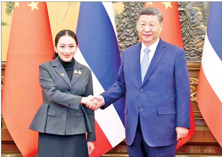
တရုတ်သမ္မတ ရှီကျင့်ဖျင်နှင့် ထိုင်းဝန်ကြီးချုပ် ပေတုံတန်တို့ တရုတ်နိုင်ငံမြို့တော်ပေကျင်း၌ တွေ့ဆုံစဉ်။

ထို့ပြင် ဒစ်ဂျစ်တယ်စီးပွားရေးနှင့် လျှပ်စစ်ကားများကဲ့သို့သော ထွန်းသစ်စက်မှုလုပ်ငန်းများတွင်