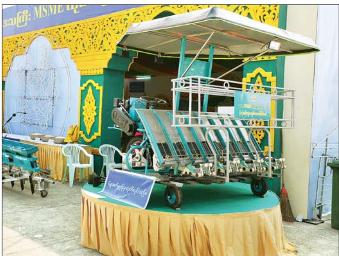
(၇၈) နှစ်မြောက် ပြည်ထောင်စုနေ့ အထိမ်းအမှတ် ပြည်ထောင်စုအဆင့် MSME ထုတ်ကုန်ပြပွဲနှင့်ပြိုင်ပွဲတွင် ပဲခူးတိုင်းဒေသကြီးပြခန်း၌ ခေတ်မီလယ်ယာသုံး စက်ကိရိယာဖြစ်သည့် မြောက်တန်းသွား လက်ဆွဲကောက်စိုက်စက်ကို ခင်းကျင်းပြသထားစဉ်။

နေပြည်တော် ဖေဖော်ဝါရီ ၇ (၇၈) နှစ်မြောက် ပြည်ထောင်စုနေ့ အထိမ်းအမှတ် ပြည်ထောင်စုအဆင့် MSME ထုတ်ကုန်ပြပွဲနှင့်ပြိုင်ပွဲတွင် ပဲခူးတိုင်းဒေသကြီးပြခန်း၌ ခေတ်မီလယ်ယာသုံး စက်ကိရိယာများဖြစ်သည့် မြောက်တန်းသွား လက်ဆွဲကောက်စိုက်စက်နှင့် ရှစ်တန်းသွား လူစီးကောက်စိုက်စက်များကို ခင်းကျင်းပြသရောင်းချမည်ဖြစ်ပြီး ပြပွဲမစတင်မီကပင် စိတ်ဝင်တစား လာရောက်ကြည့်ရှု လေ့လာသူ များပြားကြောင်း သိရသည်။ အဆိုပါ လက်ဆွဲကောက်စိုက်စက်များကို ပဲခူးစက်မှုနယ်မြေနှင့် ပြည်စက်မှုဇုန်နယ်မြေတို့တွင် တိုင်းဒေသကြီးအစိုးရအဖွဲ့၏ ကြီးကြပ်မှုဖြင့် တိုင်းဒေသကြီးအတွင်းမှ လုပ်ငန်းရှင်များက စိုက်ပျိုးရေးကဏ္ဍအတွက် ခေတ်မီလယ်ယာသုံးစက်ကိရိယာအဖြစ် တီထွင်ထုတ်လုပ်ထားခြင်းဖြစ်သည်။ “ကျွန်တော်တို့ တိုင်းဒေသကြီးက တီထွင်ထုတ်လုပ်ထားတဲ့ လက်ဆွဲကောက်စိုက်စက်ရဲ့ အင်ဂျင်ပါဝါက မြင်းကောင်ရေ တစ်ကောင်ခွဲ ကနေ နှစ်ကောင်အားပဲ ရှိတဲ့အတွက် တစ်နာရီကို တစ်စက်စိုက်ပျိုးနိုင်ပြီး စာမျက်နှာ ၁၅ ကော်လံ ၁ ♦