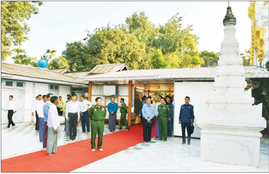
နိုင်ငံတော်စီမံအုပ်ချုပ်ရေးကောင်စီဥက္ကဋ္ဌ နိုင်ငံတော်ဝန်ကြီးချုပ် ဗိုလ်ချုပ်မှူးကြီး မင်းအောင်လှိုင် မဟာလောကသင်းကျစ်စေတီတော်ကြီး ပရိဂုဏ်တော်အတွင်းရှိ သာသနိကအဆောက်အအုံများ ထိန်းသိမ်းထားရှိမှုများကို ကြည့်ရှုစစ်ဆေးစဉ်။

ရောက်ရှိကြပြီး အုတ်ပြာသာဒ် တော်အတွင်းရှိ လောကသရဖူ ရုပ်ပွားတော်ကြီးအား ဖူးမြော် ကြည်ညို၍ ပန်း၊ ရေချမ်း၊ ဆီမီး ကပ်လှူပူဇော်သည်။ ထို့နောက် ဘုရားကြီး အတွင်းအပြင်နှင့် လောကသရဖူ ရုပ်ပွားတော်မြတ် ကြီး ကိန်းဝပ်ပယ်ရာ အုတ်ပြာသာဒ်၏ အနောက်ဘက် ကပ်လျက်တွင် တည်ထားပူဇော် သည့် မဟာလောကသင်းကျစ် စေတီတော်ကြီးတို့အား လက်ယာ ရစ် လှည့်လည်ပူဇော်ပြီး ပရိဂုဏ်တော်အတွင်းရှိ သာသနိက အဆောက်အအုံများ ထိန်းသိမ်း ထားရှိမှုများကို ကြည့်ရှုစစ်ဆေး ရာ တာဝန်ရှိသူများက လောက သရဖူဘုရားကြီးနှင့် မဟာလောက သင်းကျစ် စေတီတော်ကြီးတို့၏ သမိုင်းအကျဉ်းနှင့် ခေတ်အဆက် ဆက် ပြုပြင်မွမ်းမံထိန်းသိမ်း ထားရှိမှု အခြေအနေများကို ရှင်းလင်း တင်ပြကြသည်။