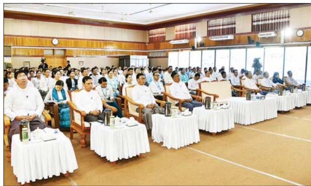
ပြည်ထောင်စုဝန်ကြီး ဦးမောင်မောင်အုန်း ပြန်ကြားရေးနှင့် ပြည်သူ့ဆက်ဆံရေးဦးစီးဌာန၏ (၃၄) နှစ်မြောက် နှစ်ပတ်လည်နေ့ အခမ်းအနားတွင် အမှာစကားပြောကြားစဉ်။

ဝန်ကြီးက အမှာစကား ပြောကြား ရာတွင် ပြန်ကြားရေးနှင့် ပြည်သူ့ ဆက်ဆံရေး ဦးစီးဌာနသည် ပြန်ကြားရေး ဝန်ကြီးဌာန၏ အရေးပါသည့်ဌာနတစ်ခုအနေဖြင့် နိုင်ငံတစ်ဝန်းလုံးတွင် လျှောက်လှမ်း လာခဲ့သည့်မှာ ယခုဆိုလျှင် ၃၄နှစ် ရှိခဲ့ပြီ ဖြစ်ပါကြောင်း၊ ယခုကဲ့သို့ ဌာနကြီးတစ်ခု နိုင်ငံတစ်ဝန်း ရပ်တည်နိုင်ခဲ့ခြင်းမှာ ဌာနရှိ ဦးဆောင်ဦးရွက်ပြုနေသူများရော တာဝန်အသီးသီးကို ကျေပွန်စွာ ထမ်းဆောင်နေကြသည့် ဝန်ထမ်း များပါ တက်ညီလက်ညီဖြင့် စည်းလုံးညီညွတ်မှုကြောင့်ဖြစ်ပြီး နောင်အနာဂတ် အတွက်လည်း အရေးပါသည့်ကဏ္ဍမှ ရှေ့ဆက် လျှောက်လှမ်းလျက်ရှိကြောင်း ဟု ယုံကြည်စွာဖြင့် အသိအမှတ်ပြု ပြောကြားလိုပါကြောင်း။ ၂၀၂၄ ခုနှစ်သည် ပြန်ကြားရေး နှင့် ပြည်သူ့ဆက်ဆံရေးဦးစီးဌာန ၏ ထူးခြားသည့် စွမ်းဆောင်နိုင်မှု များကို ပြသနိုင်ခဲ့သည့် နှစ်တစ် နှစ်ဟု ဆိုနိုင်ပါကြောင်း၊ ၂၀၂၄ ခုနှစ် ဖေဖော်ဝါရီလအတွင်း ၂၀၂၄