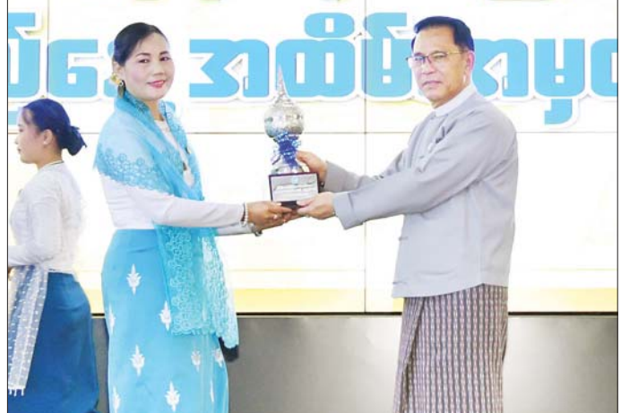
ပြည်ထောင်စုဝန်ကြီး ဦးမောင်မောင်အုန်း တိုင်းဒေသကြီး/ပြည်နယ်အဆင့် လုပ်ငန်းစွမ်းဆောင်ရည် ထူးချွန်ဆုရရှိသည့် မန္တလေးတိုင်းဒေသကြီးရုံးအား ဆုပေးအပ်ချီးမြှင့်စဉ်။

ခုနှစ်အတွက် မြန်မာ့ရုပ်ရှင် ထူးချွန်ဆု ချီးမြှင့်ပွဲအခမ်းအနား ကို အဆင့်မီစွာ ကျင်းပနိုင်ခဲ့ခြင်း၊ မြန်မာနိုင်ငံ တစ်ဝန်းလုံးရှိ စာကြည့်တိုက်များ ဖွံ့ဖြိုးတိုးတက် ရေးနှင့် စာဖတ်ရှိန်မြှင့်တင်ရေး လှုပ်ရှားမှု အခမ်းအနားများကို နိုင်ငံတစ်ဝန်းတွင် နိုင်ငံတော် အကြီးအကဲ၏ လမ်းညွှန်ချက်များ နှင့်အညီ အောင်မြင်စွာကျင်းပနိုင်