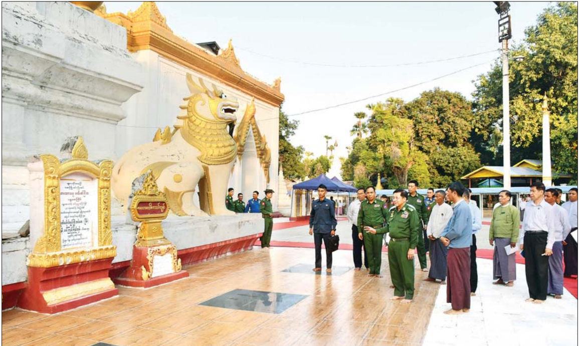
နိုင်ငံတော်စီမံအုပ်ချုပ်ရေးကောင်စီဥက္ကဋ္ဌ နိုင်ငံတော်ဝန်ကြီးချုပ် ဗိုလ်ချုပ်မှူးကြီး မင်းအောင်လှိုင် မန္တလေးတိုင်းဒေသကြီး အင်းဝမြို့ဟောင်းရှိ လောကသရဖူဘုရားကြီး ပရိဝဏ် အတွင်း သာသနိကအဆောက်အအုံများ ထိန်းသိမ်းထားရှိမှုကို ကြည့်ရှုစစ်ဆေးစဉ်။

နေပြည်တော် ဖေဖော်ဝါရီ ၇ နိုင်ငံတော် စီမံအုပ်ချုပ်ရေး ကောင်စီဥက္ကဋ္ဌ နိုင်ငံတော်ဝန်ကြီး ချုပ်ဗိုလ်ချုပ်မှူးကြီး မင်းအောင်လှိုင် သည် ယနေ့မွန်းလွဲပိုင်းတွင် ဇနီး ဒေါ်ကြူကြူလှ၊ ကောင်စီတွဲဖက် အတွင်းရေးမှူး ဗိုလ်ချုပ်ကြီး ရဲဝင်းဦး၊ ကောင်စီအဖွဲ့ဝင်များ၊ ပြည်ထောင်စုဝန်ကြီးများနှင့် ဇနီး များ၊ ကာကွယ်ရေးဦးစီးချုပ်ရုံးမှ အဆင့်မြင့်တပ်မတော်အရာရှိကြီး များနှင့် ဇနီးများ၊ မန္တလေးတိုင်း ဒေသကြီးဝန်ကြီးချုပ် အလယ်ပိုင်း တိုင်းစစ်ဌာနချုပ် တိုင်းမှူးနှင့် တာဝန်ရှိသူများ လိုက်ပါ၍ မန္တလေးတိုင်းဒေသကြီး အင်းဝ မြို့ဟောင်းရှိ လောကသရဖူ ဘုရားကြီးနှင့် မောင်အိုအုတ်လမ်း ထိန်းသိမ်းထားရှိမှု အခြေအနေ များကို သွားရောက်ကြည့်ရှု စစ်ဆေးသည်။ ဦးစွာ နိုင်ငံတော်စီမံအုပ်ချုပ် ရေးကောင်စီဥက္ကဋ္ဌ နိုင်ငံတော် ဝန်ကြီးချုပ်နှင့်ဇနီး၊ အဖွဲ့ဝင်များ သည် လောကသရဖူဘုရားကြီးသို့ စာမျက်နှာ ၃ ကော်လံ ၁ ❖