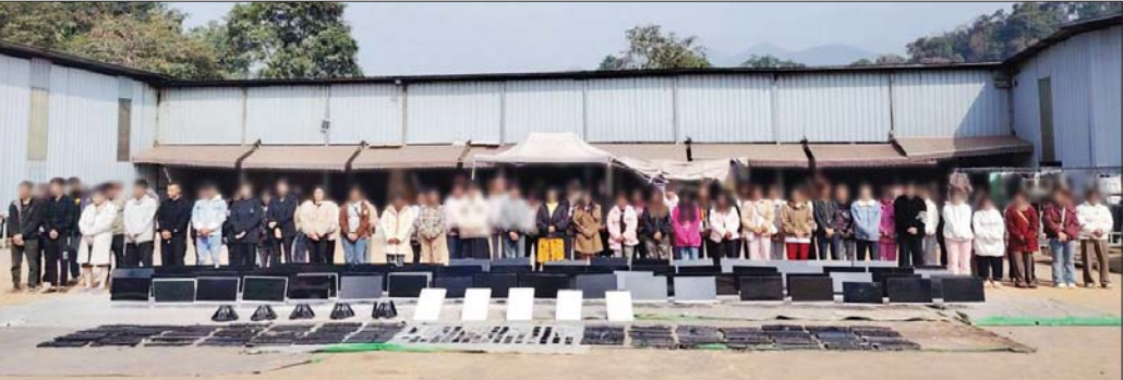
တရားမဝင်အွန်လိုင်းလောင်းကစားနှင့် ငွေကြေးလိမ်လည်မှု (ကျားဖြန့်)လုပ်ငန်းမှ ဖမ်းဆီးရမိသည့် အဖွဲ့ဝင်များနှင့် သိမ်းဆည်းရမိသည့်ပစ္စည်းများ။

အထက်ပါ ဖြစ်စဉ်များတွင် ဖမ်းဆီးရမိသူများ အား စနစ်တကျ စိစစ်ဆောင်ရွက်လျက်ရှိပြီး ဥပဒေ နှင့်အညီ တရားစွဲဆို အရေးယူဆောင်ရွက်နိုင်ရန်နှင့် ပြည်ပနိုင်ငံသားများအား လူသားချင်းစာနာထောက် ထားမှုနှင့် နိုင်ငံအချင်းချင်း ချစ်ကြည်ရင်းနှီးမှုတို့ကို ရှေးရှု၍ သက်ဆိုင်ရာနိုင်ငံများသို့ ပြန်လည်လွှဲပြောင်း ပေးအပ်နိုင်ရေး ဆောင်ရွက်သွားမည်ဖြစ်သည်။ နိုင်ငံတော်အစိုးရအနေဖြင့် တရားမဝင်အွန်လိုင်း လိမ်လည်မှုလုပ်ငန်းများအား စုံစမ်းဖော်ထုတ် စစ်ဆေး၍ ထိရောက်စွာ အရေးယူဆောင်ရွက်လျက် ရှိပြီး မြန်မာနိုင်ငံ၏ နယ်စပ်ဒေသများတွင်လည်း တရားမဝင် အွန်လိုင်းလောင်းကစားနှင့် ငွေကြေး လိမ်လည်မှု (ကျားဖြန့်)လုပ်ငန်းများအား တားဆီး ကာကွယ်တိုက်ဖျက်နိုင်ရန်အတွက် အိမ်နီးချင်းနိုင်ငံ များအပါအဝင် နိုင်ငံတကာမှအဖွဲ့အစည်းများနှင့် ပူးပေါင်း၍ စုံစမ်းဖော်ထုတ် အရေးယူမှုများကို ဆက်လက်ဆောင်ရွက်သွားမည်ဖြစ်ကြောင်း သတင်း ရရှိသည်။ သတင်းစဉ်