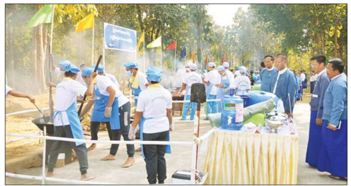
အသင်းနှင့် တတိယဆုရရှိသည့် ဥက္ကဋ္ဌ ဦးအောင်သော်က လည်း ကောင်း ဆုချီးမြှင့်ခဲ့ကြောင်း သိရသည်။ သတင်းစဉ်

အက်ဖြတ် အမှတ်ပေးခြင်းများ ဆောင်ရွက်ကြသည်။ ဆုချီးမြှင့်ပေးအပ် ထို့နောက် ပါဝင်ယှဉ်ပြိုင်ကြ သည့်အသင်းများနှင့် ဆုရရှိသော အသင်းများကို ပြည်ထောင်စု ရာထူးဝန်အဖွဲ့ ဥက္ကဋ္ဌနှင့် အဖွဲ့ဝင်များက ဆုများ ချီးမြှင့် ပေးအပ်ကြ ရာ ပထမဆုရရှိသည့် ဝန်ထမ်းရေးရာဦးစီးဌာန အဖွဲ့ (၁) အသင်း၊ ဒုတိယဆုရရှိသည့် ဝန်ထမ်းရေးရာဦးစီးဌာနအဖွဲ့ (၂)