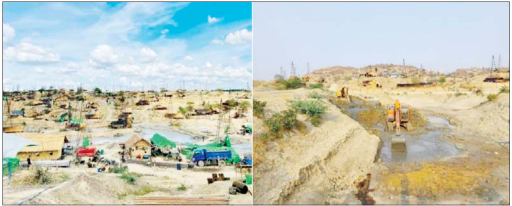
ရေနံလက်ယက်တွင်းပေါင်းများစွာတူးဖော်ခဲ့မှုနှင့် ပတ်ဝန်းကျင်ထိခိုက်ပျက်စီးနေမှုမှတ်တမ်းဓာတ်ပုံ။

ရေနံလက်ယက်တွင်း တူးဖော်ခြင်းနှင့် ထုတ်လုပ်ခြင်းဆောင်ရွက်ရာတွင် ပတ်ဝန်းကျင်