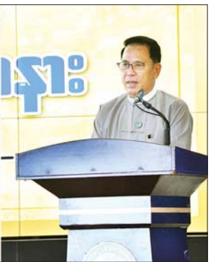
ပြည်ထောင်စုဝန်ကြီး ဦးမောင်မောင်အုန်း ပြန်ကြားရေးနှင့် ပြည်သူ့ဆက်ဆံရေးဦးစီးဌာန၏ (၃၄) နှစ်မြောက် နှစ်ပတ်လည်နေ့ အခမ်းအနားတွင် အမှာစကားပြောကြားစဉ်။