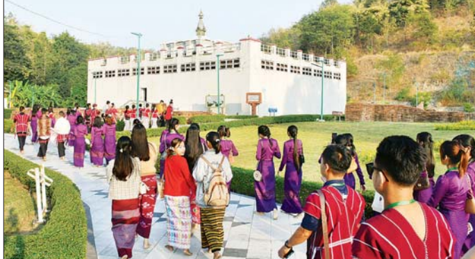
ဆက်လက်၍ လေ့လာရေးအဖွဲ့သည် Junction Centre ကျောက်မျက်ရတနာ ပြတိုက်၊

ဖွားမြင်တော်မူရာ လူမွန်ဥယျာဉ်တော်အတွင်း လှည့်လည်ဖူးမြော်ကြပြီး အမှတ်တရပစ္စည်းအရောင်းဆိုင်များတွင် အမှတ်တရလက်ဆောင်ပစ္စည်းများ ဝယ်ယူကြသည်။ ယင်းနောက်လေ့လာရေးအဖွဲ့သည် နေပြည်တော်ရေပန်းဥယျာဉ်သို့ ရောက်ရှိလေ့လာကြပြီး ရေပန်း၊ သုံးထပ်ရေတံခွန်နှင့် Fountain Park တို့တွင် အမှတ်တရ အလှဓာတ်ပုံများ ရိုက်ကြသည်။