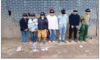
မြန်မာနိုင်ငံသား အမျိုးသား ၃ ဦး၊ အမျိုးသမီး ၄ ဦး