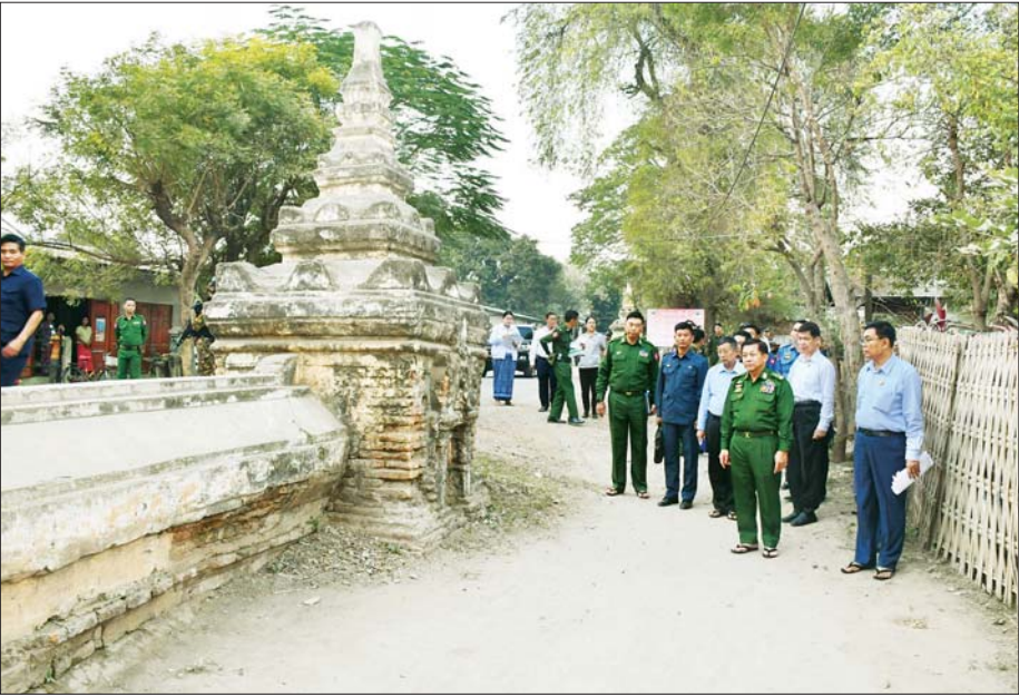
နိုင်ငံတော်စီမံအုပ်ချုပ်ရေးကောင်စီဥက္ကဋ္ဌ နိုင်ငံတော်ဝန်ကြီးချုပ် ဗိုလ်ချုပ်မှူးကြီး မင်းအောင်လှိုင် တံတားဦး - အင်းဝ လမ်းပိုင်းရှိ မဟာဇေယျပထ - မောင်အိုတံတားနှင့် အုတ်လမ်းအား ကြည့်ရှုစစ်ဆေးစဉ်။

စာမျက်နှာ ၃ မှ လောကသရဖူ ရုပ်ပွားတော်မြတ်ကြီး ကိန်းဝပ်စံပယ်ရာ အုတ်ပြာသာဒ်၏ အနောက်ဘက်ကပ်လျက်တွင် မဟာလောကသင်းကျစ်ဟူ၍ စေတီတော်တစ်ဆူကို တည်ထား ကိုးကွယ်ခဲ့ကြောင်း၊ သက္ကရာဇ် ၁၁၄၀ ပြည့်နှစ်တွင် ကုန်းဘောင်မင်းဆက် ဖြစ်သော စဉ့်ကူးမင်းက စေတီတော်ကိုပိုင်၍ ထပ်မံ တည်ဆောက်ပူဇော်ခဲ့ပြီး ဘိုးတော်ဘုရား၏ သားတော် ပခန်းမင်းသား ဟံသာဝတီမင်းနှင့် ပုဂံမင်းတို့ကလည်း ပြုပြင်ခဲ့ကြကြောင်း၊ သက္ကရာဇ် ၁၂၀၀ ပြည့်နှစ်တွင် ငလျင်ကြီးလှုပ်ခဲ့သဖြင့် မဟာလောကသင်းကျစ်စေတီတော်နှင့် လောကသရဖူရုပ်ပွားတော်ကြီးစံပယ်ရာ အုတ်ပြာသာဒ်တော်တို့ မြေခဲခဲ့ပြီး မင်းတုန်းမင်းက ပြန်လည် ပြုပြင်တည်ဆောက်ခဲ့သော်လည်း မပြီးမပြတ်နိုင်ခဲ့ကြောင်း၊ လက်ရှိအခြေအနေအတိုင်း ပူးတွေရသည်မှာ စစ်ကိုင်းတောင်ရိုး ဒီပဲခေါ်မြေချောင် ဆရာတော် ဦးနန္ဒာသီရိက သက္ကရာဇ် ၁၃၄၂ ခုနှစ်တွင် ပြန်လည်ပြုပြင်တည်ဆောက် ပူဇော်ခဲ့ခြင်းဖြစ်ကြောင်းနှင့် ခေတ်အဆက်ဆက် တာဝန်ရှိသူများက ဆက်လက် မွမ်းမံပြုပြင်ထိန်းသိမ်းခဲ့ကြခြင်း ဖြစ်ကြောင်း သိရှိရသည်။