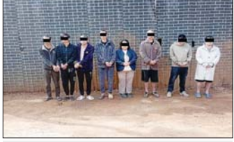
တရုတ်နိုင်ငံသား အမျိုးသား ၇ ဦး၊ အမျိုးသမီး ၁ ဦး