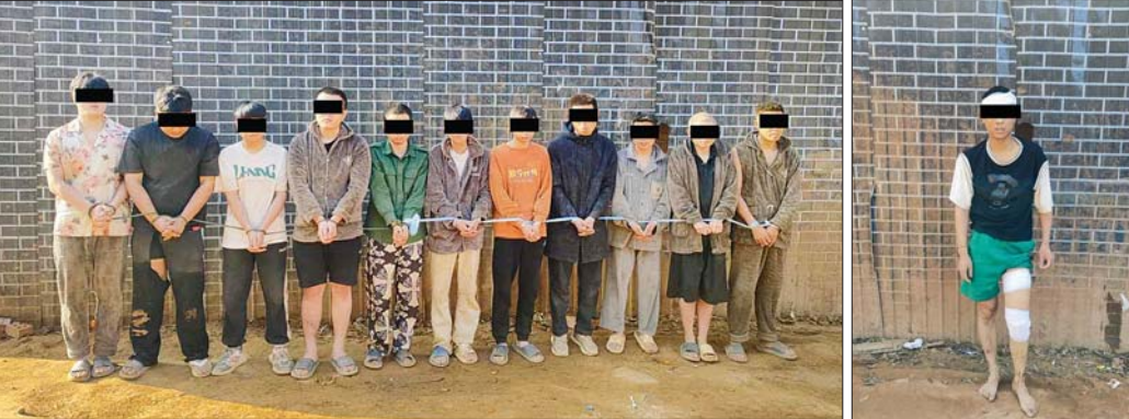
တရားမဝင်အွန်လိုင်းလောင်းကစားနှင့် ငွေကြေးလိမ်လည်မှု (ကျားဖြန့်)လုပ်ငန်းမှ အဖွဲ့ဝင်များပုံ။