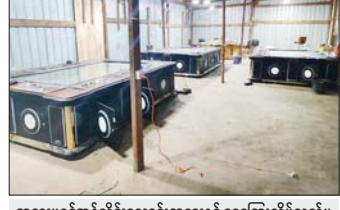
တရားမဝင်အွန်လိုင်းလောင်းကစားနှင့် ငွေကြေးလိမ်လည်မှု (ကျားဖြန့်)လုပ်ငန်းမှ သိမ်းဆည်းရမိသည့် ငါးဂရိမ်းစက်များ။