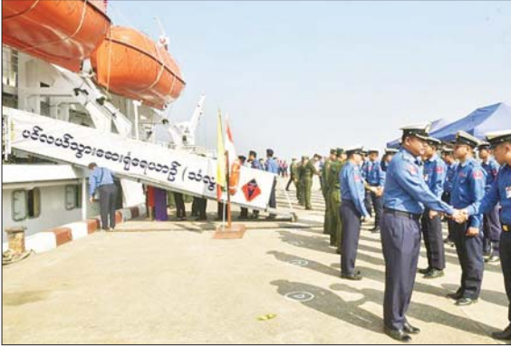
ခွာခေါင်း၊ လည်ချောင်းရောဂါ ၃၆၀၊ မျက်စိရောဂါ ၁၄၀၄ ဦးနှင့် သွားနှင့်ခံတွင်းရောဂါ ၈၀၃ ဦး စုစုပေါင်းဒေသခံပြည်သူ ၆၅၅၉ ဦးတို့ကို လိုအပ်သည့်ဆေးဝါးကုသမှုများ ဆောင်ရွက်ပေးနိုင်ခဲ့ပြီး ၎င်းတို့အနက် အထွေထွေခွဲစိတ်လူနာ ၇၁ ဦး၊ မျက်စိခွဲစိတ်လူနာ ၁၂၅ ဦးတို့ကို ဆေးရုံရေယာဉ်ပေါ်တွင် ခွဲစိတ်ကုသမှုများဆောင်ရွက်ပေးခဲ့သည်။

အဆိုပါ တပ်မတော်ပင်လယ် သွား ဆေးရုံရေယာဉ်(သံလွင်)မှ အထူးကု ဆေးအဖွဲ့များသည် တနင်္သာရီကမ်းရိုးတန်းဒေသများ ဖြစ်သော ပုလောမြို့နယ် မလိကျွန်း၊ ပတ်ဝန်းကျင်ကျေးရွာများ၊ ကျွန်းစုမြို့နယ် ကျွန်းစုမြို့နယ်၊ ဘုတ်ပြင်မြို့နယ် ပုလဲကျွန်း၊ ပတ်ဝန်းကျင် ကျေးရွာများ၊ ကော့သောင်းမြို့နယ် စာဒက်ကြီးကျွန်းပတ်ဝန်းကျင်ကျေးရွာများ၊ ရန်ကုန်တိုင်းဒေသကြီး ကိုကျွန်းမြို့နယ်အနီးတစ်ဝိုက်ဒေသများနှင့် ဧရာဝတီတိုင်းဒေသကြီး ငပုတောမြို့နယ် ဟိုင်းကြီးကျွန်းမြို့နှင့် ချောင်းဝကျေးရွာအနီး ဝန်းကျင်ကျေးရွာများရှိ ဒေသခံပြည်သူများအား ကျန်းမာရေးစောင့်ရှောက်မှုဆိုင်ရာဆောင်ရွက်ပေးမှုအနေဖြင့် ဆေးကုသမှုဆိုင်ရာ ရောဂါ ၁၇၃ ဦး၊ ခွဲစိတ်ရောဂါ ၄၃၉ ဦး၊ သားဖွားဗီးယပ်ရောဂါ ၅၂၈ ဦး၊ ကလေးရောဂါ ၅၂၈ ဦး၊ အရိုးရောဂါ ၈၉၄ ဦး၊ နှာမ၊