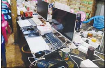
တရားမဝင်အွန်လိုင်းလောင်းကစားနှင့် ငွေကြေးလိမ်လည် မှု (ကျားဖြန့်)လုပ်ငန်းမှ အသုံးပြုသည့် အဆောက်အဦများနှင့် ဖမ်းဆီးရမိသည့် ပစ္စည်းများ မှတ်တမ်းဓာတ်ပုံ။