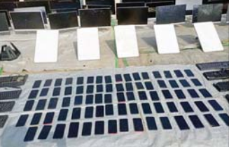
တရားမဝင်အွန်လိုင်းလောင်းကစားနှင့် ငွေကြေးလိမ်လည်မှု (ကျားဖြန့်)လုပ်ငန်းမှ ဖမ်းဆီးရမိသည့် ပစ္စည်းများ။