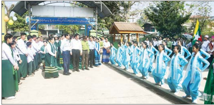
ဦးကျော်ဆန်းလင်းတို့က ဖဲကြိုးဖြတ်၍ ဖွင့်လှစ်ခဲ့ကြသည်။ ထို့နောက် တိုင်းဒေသကြီးဝန်ကြီးချုပ်ဦးစိုးသိန်း၊

ဦးစွာ အခမ်းအနားကို ရန်ကုန်တိုင်းဒေသကြီး စာကြည့်တိုက်များ ကြီးကြပ်ရေးကော်မတီဥက္ကဋ္ဌ တိုင်းဒေသကြီး လူမှုရေးရာဝန်ကြီး ဦးဌေးအောင်၊ တိုင်းဒေသကြီးပညာရေးမှူး ဒေါက်တာ ချိုချိုမြတ်အောင်၊ တိုင်းဒေသကြီး ပြန်ကြားရေးနှင့် ပြည်သူ့ဆက်ဆံရေးဦးစီးဌာန ဒုတိယညွှန်ကြားရေးမှူး ဒေါ်ဥမ္မာချို၊ တိုက်ကြီးခရိုင် စီမံအုပ်ချုပ်ရေးအဖွဲ့ ဥက္ကဋ္ဌ ဦးသူအောင်၊ အခြေခံပညာအထက်တန်းကျောင်း(မြို့မ) ကျောင်းအကျိုးတော်ဆောင်