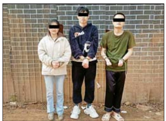
တရားမဝင်အွန်လိုင်းလောင်းကစားနှင့် ငွေကြေးလိမ်လည်မှု (ကျားဖြန့်)လုပ်ငန်းမှ အဖွဲ့ဝင်များပုံ။

လိမ်လည်မှု (ကျားဖြန့်) လုပ်ငန်းများ ဆောင်ရွက် လျက်ရှိကြောင်း သတင်းအရ လုံခြုံရေးတပ်ဖွဲ့ဝင် များက ဝင်ရောက်ရှင်းလင်းခဲ့ရာ ဖေဖော်ဝါရီလ ၅ ရက်နေ့တွင် မိုင်းရယ်မြို့၏ အရှေ့တောင်ဘက် ဝန်းကျင်တွင် ကျားဖြန့်လုံခြုံရေးအဖွဲ့များနှင့် အပြန် အလှန် ထိတွေ့တိုက်ပွဲဖြစ်ပွားခဲ့သည်။ ဖြစ်စဉ်တွင် ကျားဖြန့်လုံခြုံရေးအဖွဲ့မှ အလောင်း ၂ လောင်းနှင့် အထွေ ထွေ ကျားဖြန့်လုံခြုံရေး ၅ ဦး၊ လက်နက်မျိုးစုံ ၆