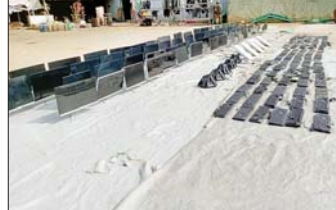
တရားမဝင်အွန်လိုင်းလောင်းကစားနှင့် ငွေကြေးလိမ်လည်မှု (ကျားဖြန့်)လုပ်ငန်းမှ သိမ်းဆည်းရမိသည့် ငါးဂရိမ်းစက်များ။