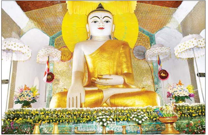
နိုင်ငံတော်စီမံအုပ်ချုပ်ရေးကောင်စီဥက္ကဋ္ဌ နိုင်ငံတော်ဝန်ကြီးချုပ် ဗိုလ်ချုပ်မှူးကြီး မင်းအောင်လှိုင်နှင့် ဇနီးဒေါ်ကြာကြာလှ လောကသရဖူရုပ်ပွားတော်ကြီးအား ဖူးမြော်ကြည်ညို၍ ပန်း၊ ရေချမ်း၊ ဆီမီး ကပ်လှူပူဇော်စဉ်။