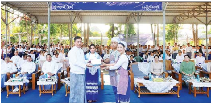
ထို့နောက် ပြည်ထောင်စုဝန်ကြီးနှင့် တာဝန်ရှိသူများသည် ပြိုင်ပွဲဝင်အသင်းများ၏ မြန်မာ့ရိုးရာ ထမနဲထိုးပြိုင်ပွဲယှဉ်ပြိုင်နေမှုများကို လိုက်လံကြည့်ရှုအားပေးပြီး ပြိုင်ပွဲတွင် ဆုရရှိသည့်အသင်းများကို ဆုများချီးမြှင့်ကြကြောင်း သိရသည်။ (အပေါ်ပို) သတင်းစဉ်

သည့် မြန်မာ့ရိုးရာထမနဲထိုးပြိုင်ပွဲသည် ၁၂ လရာသီပွဲတော်များ၌ စုပေါင်းအင်အားဖြင့် စည်းလုံးညီညွတ်စွာ ဆောင်ရွက်ရသည့် ထူးခြားသောရိုးရာပွဲတစ်ခုဖြစ်ကြောင်း၊ စည်းလုံးညီညွတ်မှု၊ သတ်မှတ်ချိန်အတွင်း ဆောင်ရွက်နိုင်မှုတို့က အနိုင်ရရှိရေးကို အဆုံးအဖြတ်ပေးသွားမည်ဖြစ်ကြောင်း၊ ပြိုင်ပွဲဝင်အသင်းများအနေဖြင့် စည်းစည်းလုံးလုံး တက်တက်ကြွကြွ ယှဉ်ပြိုင်သွားကြရန် မှာကြားသည်။