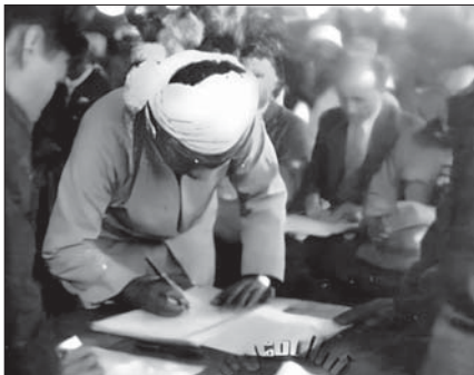
၁၉၄၇ ခုနှစ် ဖေဖော်ဝါရီလ ၁၂ ရက်က ဗိုလ်ချုပ်အောင်ဆန်းနှင့် တိုင်းရင်းသား ခေါင်းဆောင်ကြီးများ ပင်လုံစာချုပ်ကို လက်မှတ်ရေးထိုးစဉ်။

“မြန်မာပြည်ဘုရင်ခံ၏ အမှုဆောင်ကောင်စီမှ အဖွဲ့ဝင်အချို့နှင့် စပ်ဖများအားလုံးတို့အပြင် ရှမ်းပြည်နယ်များ၊ ကချင်ပြည်နယ် တောင်တန်းဒေသများနှင့် ချင်းတောင်တန်းဒေသတို့မှ ကိုယ်စားလှယ်