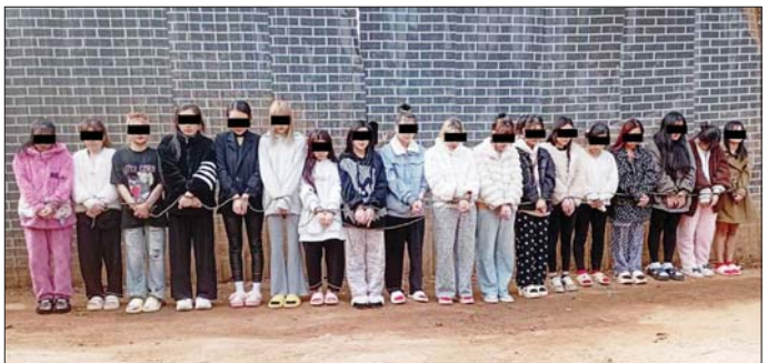
ဖမ်းဆီးရမိ ဗီယက်နမ်နိုင်ငံသား(၈) (၁၈)ဦး