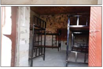
တရားမဝင်အွန်လိုင်းလောင်းကစားနှင့် ငွေကြေးလိမ်လည်မှု (ကျားဖြန့်)လုပ်ငန်းမှ အသုံးပြုသည့် အဆောက်အဦများ မှတ်တမ်းဓာတ်ပုံ။

လိမ်လည်မှု (ကျားဖြန့်) လုပ်ငန်းများ ဆောင်ရွက် လျက်ရှိကြောင်း သတင်းအရ လုံခြုံရေးတပ်ဖွဲ့ဝင် များက ဝင်ရောက်ရှင်းလင်းခဲ့ရာ ဖေဖော်ဝါရီလ ၅ ရက်နေ့တွင် မိုင်းရယ်မြို့၏ အရှေ့တောင်ဘက် ဝန်းကျင်တွင် ကျားဖြန့်လုံခြုံရေးအဖွဲ့များနှင့် အပြန် အလှန် ထိတွေ့တိုက်ပွဲဖြစ်ပွားခဲ့သည်။ ဖြစ်စဉ်တွင် ကျားဖြန့်လုံခြုံရေးအဖွဲ့မှ အလောင်း ၂ လောင်းနှင့် အထွေ ထွေ ကျားဖြန့်လုံခြုံရေး ၅ ဦး၊ လက်နက်မျိုးစုံ ၆