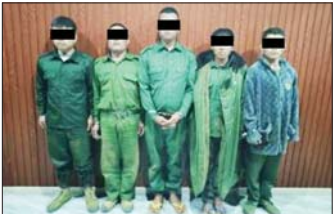
တရားမဝင်အွန်လိုင်းလောင်းကစားနှင့် ငွေကြေးလိမ်လည်မှု (ကျားဖြန့်) လုပ်ငန်းမှ ဖမ်းဆီးရမိသည့်လုံခြုံရေးအဖွဲ့များနှင့် လက်နက်၊ ခဲယမ်းများ မှတ်တမ်းဓာတ်ပုံ။

ထိုသို့ ရှာဖွေဖော်ထုတ်ဖမ်းဆီးလျက်ရှိရာ ရှမ်းပြည်နယ်(မြောက်ပိုင်း) မိုင်းရယ်မြို့နယ်အတွင်း တရားမဝင် အွန်လိုင်းလောင်းကစားနှင့် ငွေကြေး