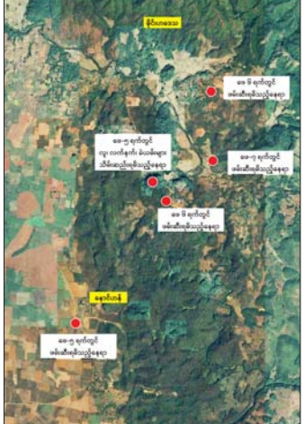
မိုင်းရယ်မြို့နယ်၊ မိုင်းဟဒေသအတွင်း တရားမဝင်အွန်လိုင်း လောင်းကစားနှင့် ငွေကြေးလိမ်လည်မှု(ကျားဖြန့်)လုပ်ငန်း လုပ် ဆောင်နေသူများအား ဖော်ထုတ်ဖမ်းဆီးရမိခဲ့သည့် ဓနရာပြင်ပုံ။

ဗီယမ်နမ်နိုင်ငံသား အမျိုးသမီး ၁၈ ဦး၊ မြန်မာနိုင်ငံ သား အမျိုးသား ၂ ဦး၊ အမျိုးသမီး ၂၅ ဦးတို့အား တရားမဝင် အွန်လိုင်းလိမ်လည်မှုလုပ်ငန်းများ လုပ်ကိုင်ရာတွင် အသုံးပြုသည့် ကွန်ပျူတာ ၇၂ လုံး၊ StarLink ၅ စုံ၊ ဖုန်းမျိုးစုံ ၇၉ လုံး၊ ငါးဂိမ်းစက် ၅ လုံး၊ မော်တော်ယာဉ် ၂ စီးတို့အား လည်းကောင်း ဖမ်းဆီးရမိခဲ့သည်။ ဖေဖော်ဝါရီလ ၇ ရက်နေ့တွင် လည်း နောင်ဟန်ကျေးရွာအနီးတစ်ဝိုက်တွင် တရုတ် နိုင်ငံသား အမျိုးသား ၁၂ ဦး၊ AlphaD မော်တော်ယာဉ်