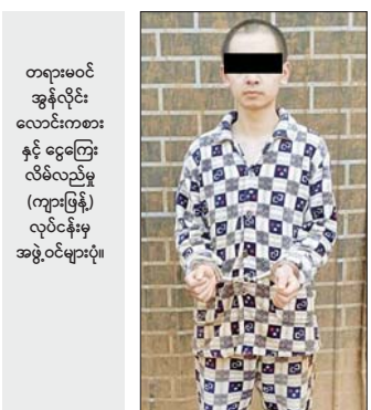
တရားမဝင် အွန်လိုင်း လောင်းကစား နှင့် ငွေကြေး လိမ်လည်မှု (ကျားဖြန့်) လုပ်ငန်းမှ အဖွဲ့ဝင်များပုံ။

၎င်းအပြင် ဖေဖော်ဝါရီလ ၆ ရက်နေ့တွင် အဆိုပါ မိုင်းဟဒေသ၊ နောင်ဟန်ကျေးရွာတစ်ဝိုက်မှ တရုတ် နိုင်ငံသား အမျိုးသား ၈ ဦး၊ အမျိုးသမီး ၁ ဦး၊