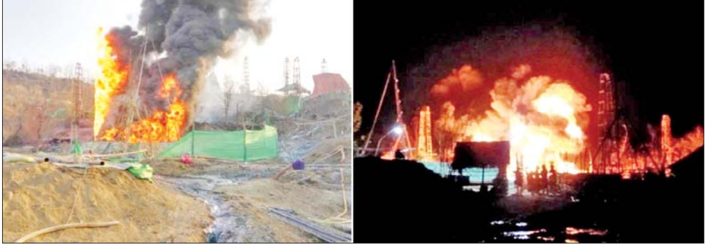
ရေနံလက်ယက်တွင်းများ စီးလောင်နေမှုမှတ်တမ်းဓာတ်ပုံ။

ရေနံလက်ယက်တွင်းများ တူးဖော်ခြင်းသည် ရှေးယခင်ကတည်းကပင်ရှိခဲ့ပြီး ယနေ့ကာလတွင် ခေတ်မီစက်ကိရိယာများအသုံးပြု၍ တူးဖော်ထုတ်လုပ်နေကြပြီဖြစ်ပါသည်။ မန္တလေးတိုင်းဒေသကြီး၊ စစ်ကိုင်းတိုင်းဒေသကြီးနှင့် မကွေးတိုင်း