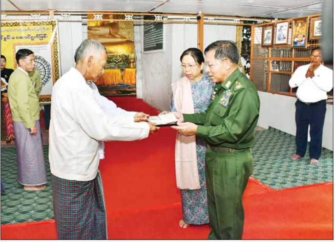
နိုင်ငံတော်စီမံအုပ်ချုပ်ရေးကောင်စီဥက္ကဋ္ဌ နိုင်ငံတော်ဝန်ကြီးချုပ် ဗိုလ်ချုပ်မှူးကြီး မင်းအောင်လှိုင်နှင့် ဇနီး ဒေါ်ကြာကြာလှ ဘုရားကြီးအတွက် ဘက်စုံအလှူတော်ငွေများကို ပေးအပ်လှူဒါန်းရာ ဂေါပကအဖွဲ့ဝင်များ က လက်ခံရယူစဉ်။

ရေထွက်ကောင်းမွန်ကာ ရေရှည် တည်တံ့ခိုင်မြဲစေရေး စနစ်တကျ ပြန်လည် သုတေသနပြု၍ ဆောင်ရွက်သွားရန် လိုကြောင်း၊ ရှေးဟောင်းသာသနိက အဆောက် အအုံများကိုလည်း စနစ်တကျဖြင့် ထိန်းသိမ်း စောင့်ရှောက်သွားရန် လိုကြောင်း၊ ဘုရားကြီးပတ်လည် ရှိ ဆွမ်းလောင်းစောင်းတန်းများ ကိုလည်း မူလလက်ရာမပျက် ပြန်လည်ပြုပြင်ခြင်း၊ မွမ်းမံခြင်း များ ဆောင်ရွက်သွားရန်လိုပြီး ရှေးဟောင်းလက်ရာနှင့် ရေးဟောင်း ယဉ်ကျေးမှု အမူအကျင့်များကို ဆက်လက်ထိန်းသိမ်းဆောင်ရွက် သွားရမည်ဖြစ်ကြောင်း၊ ဘုရား ကြီးနှင့်သာသနိကအဆောက်အအုံ များအား နေ့ညမပျက် ဆီမီးပူဇော် နိုင်ရေးအတွက်လည်း ဆိုလာ လျှပ်စစ်မီးဆက်ကပ်ပူဇော်နိုင်ရေး စီစဉ်ဆောင်ရွက်ပေးသွားမည်ဖြစ် ကြောင်းနှင့် အခြားလိုအပ်သည် များကို မှာကြားသည်။