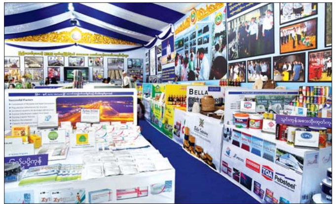
ရန်ကင်းတိုင်းဒေသကြီး MSME ထုတ်ကုန်ပြခန်းတွင် သွင်းကုန်အစားထိုးထုတ်ကုန်များနှင့် ပြည်ပပို့ကုန်များ ခင်းကျင်းပြသထားသည်ကို တွေ့ရစဉ်။