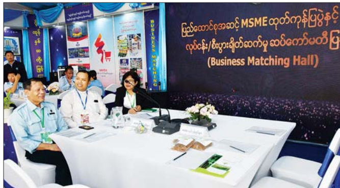
လုပ်ငန်း/စီးပွားချိတ်ဆက်မှုဆက်ကော်မတီပြခန်းကို တွေ့ရစဉ်။