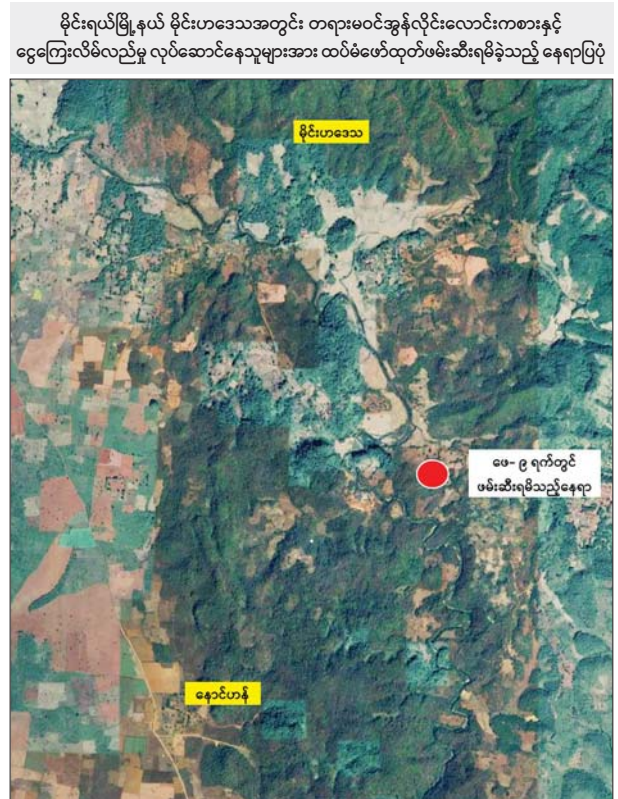
မိုင်းရယ်မြို့နယ် မိုင်းဟဒေသအတွင်း တရားမဝင်အွန်လိုင်းလောင်းကစားနှင့် ငွေကြေးလိမ်လည်မှု လုပ်ဆောင်နေသူများအား ထပ်မံဖော်ထုတ်ဖမ်းဆီးရမိခဲ့သည့် နေရာပြပုံ

ဖြစ်သည်။ လီဗာပူးအသင်းသည် ပလိုင်းမောက်အသင်းကို မြေစွမ်းအားဖြင့် ဖိအားပေးကစားနိုင်ခဲ့သော်လည်း ပြိုင်ဘက်အသင်းခံစစ်နှင့် ဂိုးသမားတို့ကို ကျော်ဖြတ်နိုင်ခြင်း မရှိသည့်အတွက် ရှုံးပွဲကြုံတွေ့ကာ အက်ဖ်အေလောင်းပြိုင်ပွဲမှ ထွက်ခွာခဲ့ရခြင်းဖြစ်သည်။ ပလိုင်းမောက်အသင်းသည် အက်ဖ်အေလောင်းပဉ္စမအဆင့်ကို ထိုက်ထိုက်တန်တန် တက်လှမ်းနိုင်ခဲ့ခြင်းဖြစ်ပြီး ယခုပွဲစဉ်တွင် နာမည်ကြီး လီဗာပူးအသင်း၏ တိုက်စစ်အစုအဖွဲ့ကို ပြသနိုင်ခဲ့သည်။ အက်ဖ်အေလောင်းပြိုင်ပွဲစတုတ္ထအဆင့်မှ ဖေဖော်ဝါရီ ၁၀ ရက် နံနက်အစောပိုင်းက ယှဉ်ပြိုင်ကစားခဲ့သည့် အက်ဖ်တူနီဗီလာနှင့် စပါးအသင်းပွဲစဉ်တွင် အက်ဖ်တူနီဗီလာအသင်းက အကြိတ်အနယ်ကစားပြီး နှစ်ဂိုး - တစ်ဂိုးဖြင့် နိုင်ငံပွဲရရှိကာ နောက်တစ်ဆင့်သို့ တက်လှမ်းနိုင်ခဲ့သည်။ အောင်ဇော်