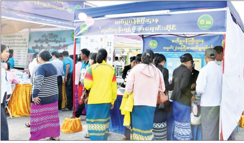
(၇၈)နှစ်မြောက် ပြည်ထောင်စုနေ့အထိမ်းအမှတ် ပြည်ထောင်စုအဆင့် MSME ထုတ်ကုန်ပြပွဲနှင့် ပြိုင်ပွဲတွင် စက်မှုဝန်ကြီးဌာန ထုတ်ကုန်ပစ္စည်းအရောင်းဆိုင်သို့ လာရောက်လေ့လာ ဝယ်ယူသူများဖြင့် စည်ကားနေမှုကို တွေ့ရစဉ်။

တိုင်းဒေသကြီးနှင့် ပြည်နယ်များအလိုက် ရိုးရာယဉ်ကျေးမှုအကလုများ၊ ရိုးရာ ယဉ်ကျေးမှုလေ့စရိုက်များကို ပေါ်လွင် စေသည့် တေးသီချင်းများနှင့် မျိုးချစ်စိတ် နှင့် ဇာတိမာန်ကို တက်ကြွစေမည့် သီချင်းများ ဖွင့်လှစ်ဖော်ပြတင်ဆက် ပေးကြရာ ပွဲတော်လာပြည်သူများအနေ ဖြင့် တောင်ပေါ်မြေပြန့်မချခဲ့ဘဲ စည်းလုံးညီညွတ်သည့် သွေးချင်း ညီအစ်ကိုစိတ်ဓာတ်များ ခံစားရရှိစေခဲ့ပြီး ပြည်ထောင်စု၏ အနှစ်သာရကိုလည်း ပိုမိုပေါ်လွင်စေခဲ့သည်။ အလားတူ နေပြည်တော်ကောင်စီ အပါအဝင် တိုင်းဒေသကြီးနှင့် ပြည်နယ် များအလိုက် ထွက်ရှိသည့် MSME ထုတ်ကုန်များနှင့် ရိုးရာအစားအစာများ၊ တိုင်းရင်းသားရိုးရာ အမှတ်တရပစ္စည်း များ၊ ရိုးရာဝတ်စုံများကို ပြည်သူများ စိတ်ကြိုက် ဝယ်ယူနိုင်ရန်အတွက် ဈေးနှုန်းချိုသာစွာ ရောင်းချပေးလျက်ရှိပြီး ချစ်ခင်နှစ်သက်မြတ်နိုးစွာဖြင့် ဝယ်ယူ ကြသူများဖြင့်လည်း စည်ကားလျက်ရှိကာ နည်းပညာပြခန်းများ၊ စက်ပစ္စည်းများ နှင့် ထုတ်ကုန်ပြခန်းများ၊ အသေးစား စက်မှုလက်မှုလုပ်ငန်းများနှင့် ကုန်ထုတ် သမဝါယမပြခန်းများ၌လည်း စိတ်ဝင်