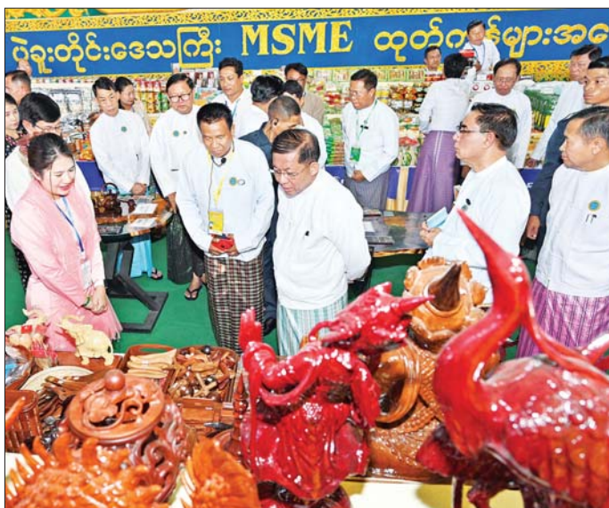
နိုင်ငံတော်စီမံအုပ်ချုပ်ရေးကောင်စီဥက္ကဋ္ဌ နိုင်ငံတော်ဝန်ကြီးချုပ် ဗိုလ်ချုပ်မှူးကြီး မင်းအောင်လှိုင်နှင့် အဖွဲ့ဝင်များ ပဲခူးတိုင်းဒေသကြီး MSME ထုတ်ကုန်ပြခန်းအား စိတ်ပါဝင်စားစွာ ကြည့်ရှုစဉ်။

စာမျက်နှာ ၄ မှ မြန်မာနိုင်ငံကုန်သည်များနှင့် စက်မှုလက်မှုလုပ်ငန်း ရှင်များအသင်းချုပ်ပြခန်း၊ မြန်မာနိုင်ငံ တိုင်းရင်း ဆေးဝါးထုတ်လုပ်သူများနှင့် ဆေးပစ္စည်းလုပ်ငန်းရှင် များ အသင်းပြခန်း၊ မြန်မာနိုင်ငံ ဆီစက်ပိုင်ရှင်များ အသင်းထုတ်ကုန်ပြခန်းနှင့် အရောင်းပြခန်းတို့အား ပြခန်းတစ်ခုချင်းစီအလိုက် စိတ်ပါဝင်စားစွာဖြင့် လိုက်လံကြည့်ရှုအားပေးပြီးထုတ်ကုန်များအလိုက် လုပ်ငန်းဆောင်ရွက်မှုများ၊ ကုန်ကြမ်းရရှိမှုနှင့်သုံးစွဲ မှု၊ ထုတ်ကုန်များ ထုတ်လုပ်မှု၊ ပြည်တွင်း၊ ပြည်ပ ဈေးကွက်ရရှိမှုအခြေအနေများ၊ လုပ်ငန်းလိုအပ်ချက် များနှင့် ပြည်တွင်း၊ ပြည်ပသို့ ပို့ချပို့ဆောင်ခြင်းနှင့် မည် အခြေအနေများနှင့် သိရှိလိုသည်များ မေးမြန်း ဆွေးနွေးပြီး လိုအပ်သည်များ လမ်းညွှန်မှာကြား ဖြည့်ဆည်းဆောင်ရွက်ပေးသည်။