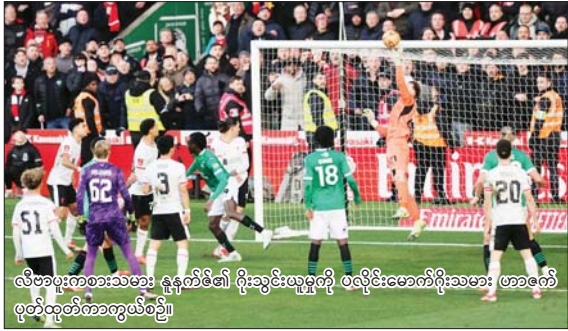
လီဗာပူးကစားသမား နွနက်စ်၏ ဂိုးသွင်းယူမှုတို့ ဝလီဇ်ဇေးကရီးအေး ဖာဒေါ့ဇ်ထုတ်ကော့တွယ်စဉ်။

ပလိုင်းမောက်ကို နာမည်ကြီး လီဗာပူး ရှုံးနိမ့်ပြီး အက်စ်အေပလားပြိုင်ပွဲမှ ထွက်ရပြီ အက်စ်အေပလားပြိုင်ပွဲ စတုတ္ထအဆင့်မှ စိတ်ဝင်စားဖွယ်ရာ အကောင်းဆုံးပွဲစဉ် တစ်ပွဲဖြစ်သည့် ချန်နီယံရစ်ကလပ် ပလိုင်းမောက်နှင့် ပရီမီယာလိဂ်ကလပ် လီဗာပူးအသင်းပွဲစဉ်တွင် ပလိုင်းမောက်အသင်းက တစ်ဂိုး - ဂိုးမရှိဖြင့် နိုင်ပွဲရရှိပြီး နောက်တစ်ဆင့်သို့ တက်လှမ်းနိုင်ခဲ့သည်။ အဆိုပါ ပွဲစဉ်ကို ဖေဖော်ဝါရီ ၉ ရက် ည ၉ နာရီခွဲက စာမျက်နှာ ၁၅ ကော်လံ ၃