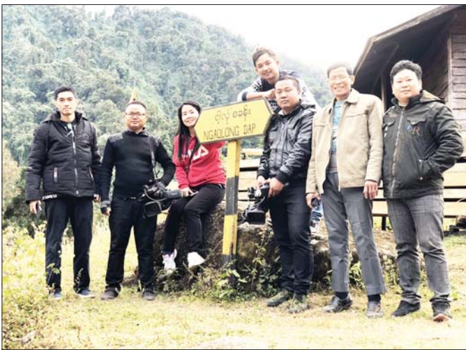
မဂ္ဂဇ - ခေါင်လန်ဖူးကားလမ်းပေါ်က ငါ့လုံစခန်းမှာ MRTV အဖွဲ့သားများနှင့် အမှတ်တရ။

တစ်ချိန်က ကျွန်တော်တာဝန်ထမ်းဆောင်ခဲ့ဖူး သည့် နယ်စပ်ရေးရာဝန်ကြီးဌာန၊ သူထက်စော၍ ဖွဲ့စည်းခဲ့သော နယ်စပ်/ စည်ပင်ဝန်ကြီးဌာနတို့မှာ ရှိစဉ်ကတည်းက မြန်မာပြည်တစ်ဝန်းလုံးမှ ရောက်ရှိလာကြသော တိုင်းရင်းသားလေ့လာရေး အဖွဲ့များအတွက် ကြည့်ရှုလေ့လာရမည့်နေရာများ သတ်မှတ်ရာ၌ မြန်မာ့အသံနှင့် ရုပ်မြင်သံကြား သည်လည်း ပါတစ်ခုအပါအဝင် ဖြစ်ခဲ့သည်။ ရန်ကုန် မှာ ရှိစဉ်တုန်းကလည်း ပို့ဆောင်ပေးခဲ့သည်။ နေပြည်တော်ကြီး တည်ထောင်အပြီး နေပြည်တော် နှင့် ပတ်ဝန်းကျင်လေ့လာရေး ခရီးစဉ်များကို ကျွန်တော်တို့ ဆက်လက်စီစဉ်ပေးခဲ့ကြသည်။ ထိုနိမိတ်ကြောင့် ဌာနမှ အငြိမ်းစားယူပြီး သက္ကလ