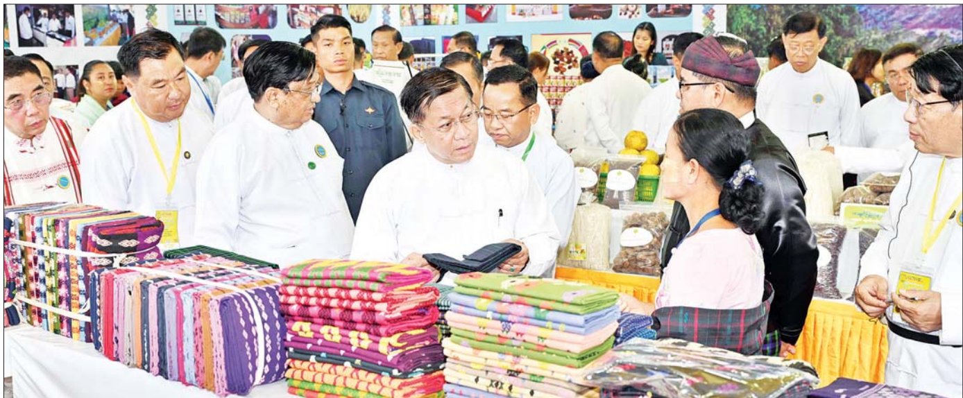
နိုင်ငံတော်စီမံအုပ်ချုပ်ရေးကောင်စီဥက္ကဋ္ဌ နိုင်ငံတော်ဝန်ကြီးချုပ် ဗိုလ်ချုပ်မှူးကြီး မင်းအောင်လှိုင်နှင့် အဖွဲ့ဝင်များ ကချင်ပြည်နယ် MSME ထုတ်ကုန်ပြခန်း၌ သိရှိလိုသည်များ မေးမြန်းဆွေးနွေးစဉ်။