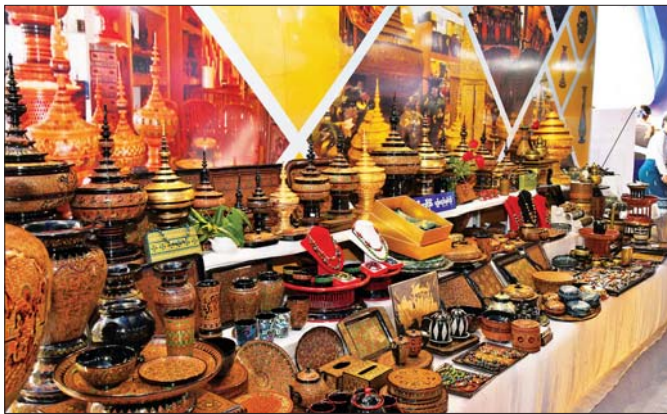
မွန္တလေးတိုင်းဒေသကြီး MSME ထုတ်ကုန်ပြခန်းတွင် ယွန်းထည်အမျိုးမျိုး ခင်းကျင်းပြသထားသည်ကို တွေ့ရစဉ်။