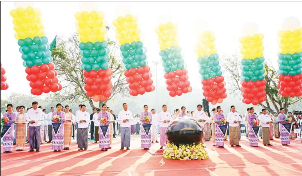
နိုင်ငံတော်စီမံအုပ်ချုပ်ရေးကောင်စီဒုတိယဥက္ကဋ္ဌ ဒုတိယဝန်ကြီးချုပ် ဒုတိယဗိုလ်ချုပ်မှူးကြီး စိုးဝင်း၊ ပြည်ထောင်စုဝန်ကြီးများဖြစ်ကြသည့် ဦးဝင်းရှိန်၊ ဦးမင်းနောင်၊ ဦးလှမိုး၊ ဒေါက်တာချာလီသန်း၊ ဒေါက်တာ မျိုးသိန်းကျော်နှင့် နေပြည်တော်ကောင်စီဥက္ကဋ္ဌ ဦးသန်းထွန်းဦးတို့က ပြည်ထောင်စုအဆင့် MSME ထုတ်ကုန်ပြပွဲနှင့်ပြိုင်ပွဲ ဖွင့်ပွဲအခမ်းအနားကို ဖဲကြိုးဖြတ်ဖွင့်လှစ်ပေးစဉ်။

ထို့နောက် (၇၈)နှစ်မြောက် ပြည်ထောင်စုနေ့အထိမ်းအမှတ် MSME ထုတ်ကုန်ပြပွဲနှင့်ပြိုင်ပွဲအခမ်းအနား ဂုဏ်ပြုတေးသီချင်းဖြင့် တိုင်းရင်းသားရိုးရာယဉ်ကျေးမှု အကအဖွဲ့များက ကပြဖျော်ဖြေတင်ဆက်ကြရာ နိုင်ငံတော်စီမံအုပ်ချုပ်ရေးကောင်စီဥက္ကဋ္ဌ နိုင်ငံတော်ဝန်ကြီးချုပ်နှင့် တက်ရောက်လာကြသူများက ကြည့်ရှုအားပေးနှုတ်ဆက်ကြသည်။