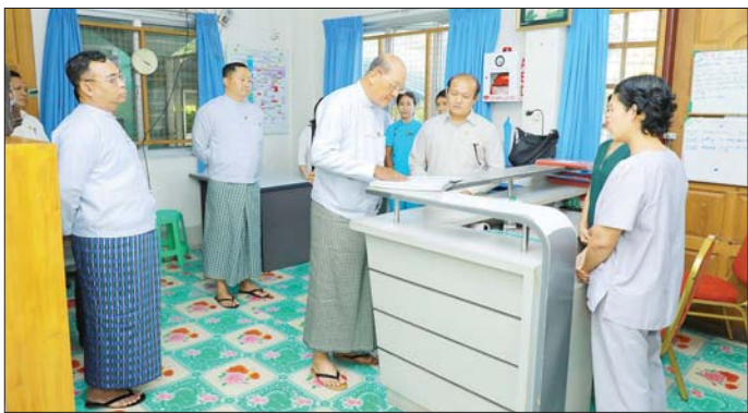
များကို မှာကြားသည်။ ယင်းနောက် တိုင်းရင်းသားရိုးရာယဉ်ကျေးမှု အဖွဲ့များ၏ အိမ်ဆောင်များအား ကြည့်ရှုစစ်ဆေးပြီး ရေ/မီး အဆင်ပြေစေရေး ဖြည့်ဆည်းဆောင်ရွက် ပေးသွားရန် မှာကြားခဲ့ကြောင်း သိရသည်။ သတင်းစဉ်

နေပြည်တော် ဖေဖော်ဝါရီ ၁၀ အားကစားနှင့် လူငယ်ရေးရာဝန်ကြီးဌာန ပြည်ထောင်စုဝန်ကြီး Jeng Phang နော်တောင်သည် ဒုတိယဝန်ကြီး ဦးထိန်လင်း၊ ဦးစင်မင်းထက်နှင့် တာဝန်ရှိသူများနှင့်အတူ ယနေ့မှန်းလွဲပိုင်းတွင် နေပြည်တော် အားကစားလေ့ကျင့်ရေးစခန်း (Gold Camp) ရှိ ဆေးပေးခန်းနှင့် တိုင်းရင်းသားရိုးရာယဉ်ကျေးမှုအဖွဲ့များ တည်းခိုနေထိုင်သည့်နေရာများအား ကြည့်ရှုစစ်ဆေးသည်။ (ယာဝု)