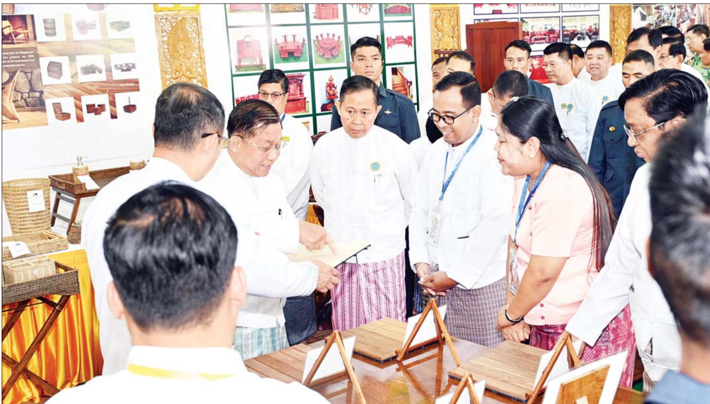
နိုင်ငံတော်စီမံအုပ်ချုပ်ရေးကောင်စီဥက္ကဋ္ဌ နိုင်ငံတော်ဝန်ကြီးချုပ် ဗိုလ်ချုပ်မှူးကြီး မင်းအောင်လှိုင်နှင့် အဖွဲ့ဝင်များ မန္တလေးတိုင်းဒေသကြီး MSME ထုတ်ကုန်ပြပွဲအား စိတ်ပါဝင်စားစွာဖြင့် ကြည့်ရှုစဉ်။