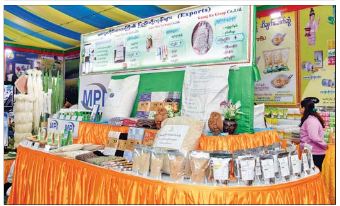
မကွေးတိုင်းဒေသကြီး MSME ထုတ်ကုန်ပြခန်းတွင် ခင်းကျင်းပြသထားသည့် ဒေသထုတ်ကုန်များကို တွေ့ရစဉ်။