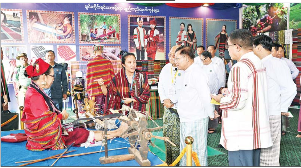
နိုင်ငံတော်စီမံအုပ်ချုပ်ရေးကောင်စီဥက္ကဋ္ဌ နိုင်ငံတော်ဝန်ကြီးချုပ် ဗိုလ်ချုပ်မှူးကြီး မင်းအောင်လှိုင်နှင့် အဖွဲ့ဝင်များ ချင်းပြည်နယ် MSME ထုတ်ကုန်ပြခန်းအား စိတ်ပါဝင်စားစွာဖြင့် ကြည့်ရှုစဉ်။

စိတ်ပါဝင်စားစွာဖြင့် လိုက်လံကြည့်ရှုရုံဖြင့်ပင် အဖွဲ့ဝင်များအနားအငြိမ်းတွင် နိုင်ငံတော်စီမံအုပ်ချုပ်ရေးကောင်စီဥက္ကဋ္ဌ နိုင်ငံတော်ဝန်ကြီးချုပ်သည် အဖွဲ့ဝင်များနှင့်အတူ စက်မှုဝန်ကြီးဌာနပြခန်း၊ စိုက်ပျိုးရေး၊ မွေးမြူရေးနှင့် ဆည်မြောင်းဝန်ကြီးဌာနပြခန်း၊ သမဝါယမနှင့်ကျေးလက်ဖွံ့ဖြိုးရေးဝန်ကြီးဌာနပြခန်း၊ သယံဇာတနှင့် သဘာဝပတ်ဝန်းကျင်ထိန်းသိမ်းရေးဝန်ကြီးဌာနပြခန်း၊ စီးပွားရေးနှင့် ကူးသန်းရောင်းဝယ်ရေးဝန်ကြီးဌာနပြခန်း၊ သိပ္ပံနှင့် နည်းပညာဝန်ကြီးဌာနပြခန်း၊ ကျန်းမာရေးဝန်ကြီးဌာနပြခန်း၊ ပြည်ထောင်စုနယ်မြေ နေပြည်တော် MSME ထုတ်ကုန်ပြခန်း၊ ကချင်ပြည်နယ် MSME ထုတ်ကုန်ပြခန်း၊ ကယားပြည်နယ် MSME ထုတ်ကုန်ပြခန်း၊ ကရင်ပြည်နယ် MSME ထုတ်ကုန်ပြခန်း၊ ချင်းပြည်နယ် MSME ထုတ်ကုန်ပြခန်း၊ စစ်ကိုင်းတိုင်းဒေသကြီး MSME ထုတ်ကုန်ပြခန်း၊ တနင်္သာရီတိုင်းဒေသကြီး MSME ထုတ်ကုန်ပြခန်း၊ ပဲခူးတိုင်းဒေသကြီး MSME ထုတ်ကုန်ပြခန်း၊ မကွေးတိုင်းဒေသကြီး MSME ထုတ်ကုန်ပြခန်း၊ မွန်ပြည်နယ် MSME ထုတ်ကုန်ပြခန်း၊ ရခိုင်ပြည်နယ် MSME ထုတ်ကုန်ပြခန်း၊ ရန်ကုန်တိုင်းဒေသကြီး MSME ထုတ်ကုန်ပြခန်း၊ ရှမ်းပြည်နယ် MSME ထုတ်ကုန်ပြခန်း။