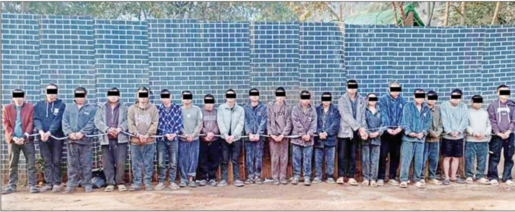
ဖေဖော်ဝါရီ ၉ ရက်တွင် ထပ်မံဖော်ထုတ်ဖမ်းဆီးရမိသည့် တရားမဝင်အွန်လိုင်းလောင်းကစားနှင့် ငွေကြေးလိမ်လည်မှု လုပ်ဆောင်နေသူများအား တွေ့ရစဉ်။

နေပြည်တော် ဖေဖော်ဝါရီ ၁၀ မြန်မာနိုင်ငံအတွင်းသို့ တရားမဝင် ဝင်ရောက်လျက်ရှိသည့် ပြည်ပနိုင်ငံသားများအား စိစစ်ဖော်ထုတ်မှုများ ဆောင်ရွက်ခဲ့ရာ အများစုသည် အိမ်နီးချင်းနိုင်ငံအချို့ကို တစ်ဆင့်ခံပြတ်သန်း၍ မြန်မာနိုင်ငံအတွင်းသို့ ၎င်းတို့၏ ကိုယ်ကျိုးစီးပွားများအတွက် အလုပ်လုပ်ကိုင်ရန် တရားမဝင် ဝင်ရောက်လာကြသူများ ဖြစ်ကြောင်း တွေ့ရှိရသည်။ နိုင်ငံတော်အစိုးရအနေဖြင့်လည်း အဆိုပါ တရားမဝင် အွန်လိုင်းလောင်းကစားနှင့် ငွေကြေးလိမ်လည်မှုလုပ်ငန်းအပါအဝင် အခြားဒုစရိုက်လုပ်ငန်းများကို တိုင်းဒေသကြီးနှင့် ပြည်နယ်များမှ တာဝန်ရှိသူများ၊ လုံခြုံရေးတပ်ဖွဲ့ဝင်များအပါအဝင် ပူးပေါင်းအဖွဲ့များက တက်ကြွစွာဖြင့် တင်းတင်းကျပ်ကျပ် ရှာဖွေစစ်ဆေးဖော်ထုတ်ဖမ်းဆီးမှုများ အဆက်မပြတ် ဆောင်ရွက်လျက်ရှိသည်။ စာမျက်နှာ ၁၅ ကော်လံ ၃