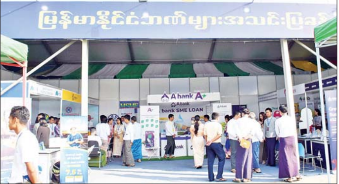
(၇၈)နှစ်မြောက် ပြည်ထောင်စုနေ့အထိမ်းအမှတ် ပြည်ထောင်စုအဆင့် MSME ထုတ်ကုန်ပြပွဲနှင့် ပြိုင်ပွဲ တွင် မြန်မာနိုင်ငံဘဏ်များအသင်းပြခန်းအား တွေ့ရစဉ်။