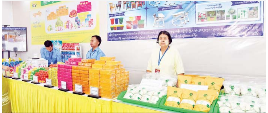
မြန်မာ့စီးပွားရေးဦးပိုင် အများနှင့်သက်ဆိုင်သော ကုမ္ပဏီလီမိတက် MSME ထုတ်ကုန်ပြခန်းတွင် ခင်းကျင်းပြသထားသည့် ထုတ်ကုန်များကို တွေ့ရစဉ်။