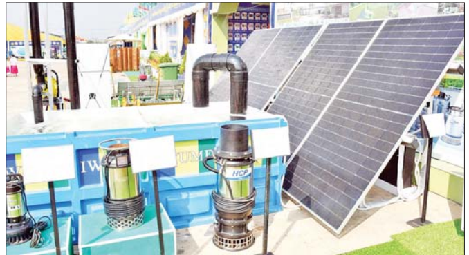
စိုက်ပျိုးရေး၊ မွေးမြူရေးနှင့် ဆည်မြောင်းဝန်ကြီးဌာနပြခန်းတွင် ပြသထားသည့် စိုက်ပျိုးရေးလုပ်ငန်းဆိုင်ရာ ပစ္စည်းများကို တွေ့ရစဉ်။