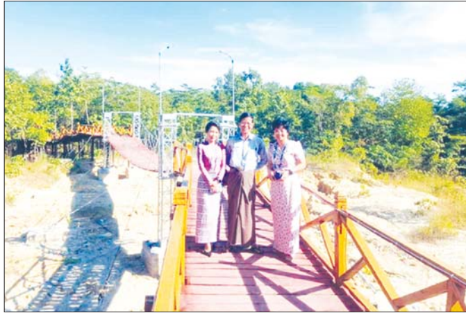
ကြိုးတံတားနှင့် အမှတ်တရ။

ထူးထူးခြားခြား မှတ်သားမိသည်များမှာ ၁၉၆၆ ခုနှစ် ဖေဖော်ဝါရီ ၁၅ ရက်ကို မြန်မာ့အသံ ရေဒီယို စတင်ထုတ်လွှင့်သည့်နှစ်ဟု သတ်မှတ်ခဲ့သော ကြောင့် ၂၀၂၁ ခုနှစ် ဖေဖော်ဝါရီ ၁၅ ရက်သည် (၇၅) နှစ်ပြည့် စိန်ရတုနေ့ဖြစ်လာခြင်း၊ ၁၉၈၀ ပြည့် နှစ် နိုဝင်ဘာ ၁ ရက်တွင် ရုပ်မြင်သံကြား အစီအစဉ်