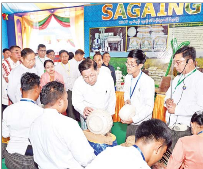
နိုင်ငံတော်စီမံအုပ်ချုပ်ရေးကောင်စီဥက္ကဋ္ဌ နိုင်ငံတော်ဝန်ကြီးချုပ် ဗိုလ်ချုပ်မှူးကြီး မင်းအောင်လှိုင်နှင့်အဖွဲ့ ဝင်များ စစ်ကိုင်းတိုင်းဒေသကြီး MSME ထုတ်ကုန်ပြခန်းအား စိတ်ပါဝင်စားစွာ ကြည့်ရှုစဉ်။

( ၃-၉-၂၀၂၄ ရက်နေ့တွင် နိုင်ငံတော်စီမံအုပ်ချုပ်ရေးကောင်စီဥက္ကဋ္ဌ နိုင်ငံတော်ဝန်ကြီးချုပ် ဗိုလ်ချုပ်မှူးကြီး မင်းအောင်လှိုင် ရှမ်းပြည်နယ်အစိုးရအဖွဲ့ဝင်များ၊ ပြည်နယ်နှင့် ခရိုင်အဆင့်ဌာနဆိုင်ရာတာဝန်ရှိသူများအားပြောကြားသည့် အမှာစကားမှကောက်နုတ်ချက် )