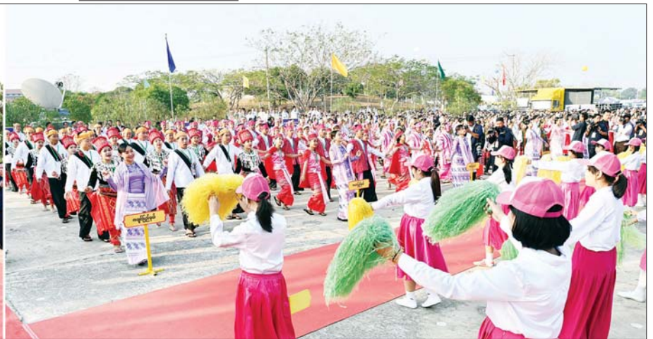
နိုင်ငံတော်စီမံအုပ်ချုပ်ရေးကောင်စီဥက္ကဋ္ဌ နိုင်ငံတော်ဝန်ကြီးချုပ် ဗိုလ်ချုပ်မှူးကြီး မင်းအောင်လှိုင်နှင့် အဖွဲ့ဝင်များ (၇၈)နှစ်မြောက် ပြည်ထောင်စုနေ့အထိမ်းအမှတ် MSME ထုတ်ကုန်ပြပွဲနှင့် ပြိုင်ပွဲ ဖွင့်ပွဲအခမ်းအနား ဂုဏ်ပြုတေးသီချင်းဖြင့် တိုင်းရင်းသားရိုးရာ ယဉ်ကျေးမှုအကအဖွဲ့များက ကပြဖျော်ဖြေ တင်ဆက်နေမှုကို ကြည့်ရှုအားပေးစဉ်။