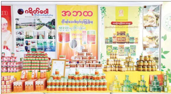
မြန်မာနိုင်ငံတိုင်းရင်းဆေးဝါးထုတ်လုပ်သူများနှင့် ဆေးပစ္စည်းလုပ်ငန်းရှင်များအသင်းပြခန်းတွင် ပြသထားသည့် တိုင်းရင်းဆေးများကို တွေ့ရစဉ်။