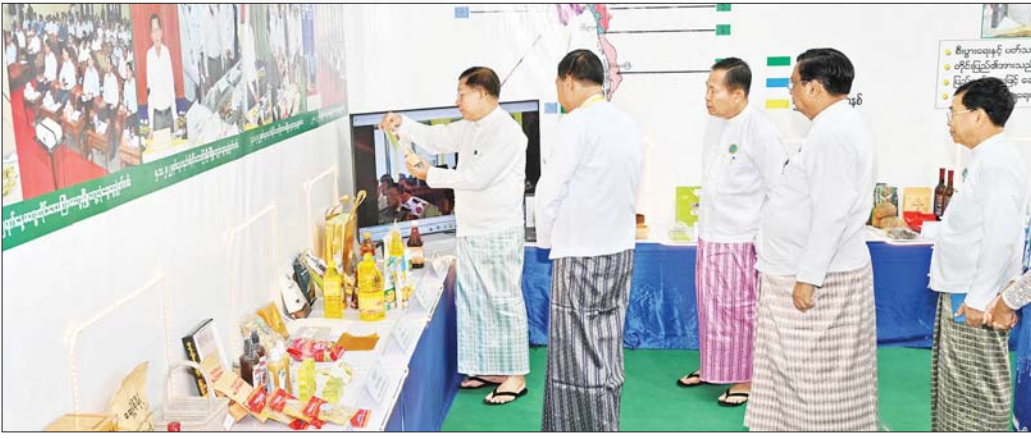
နိုင်ငံတော်စီမံအုပ်ချုပ်ရေးကောင်စီဥက္ကဋ္ဌ နိုင်ငံတော်ဝန်ကြီးချုပ် ဗိုလ်ချုပ်မှူးကြီး မင်းအောင်လှိုင်နှင့် အဖွဲ့ဝင်များ ရန်ကုန်တိုင်းဒေသကြီး MSME ထုတ်ကုန် ပြခန်းအား စိတ်ပါဝင်စားစွာ ကြည့်ရှုစဉ်။

လိုက်လံကြည့်ရှုအားပေး ယင်းနောက် အသေးစား စက်မှုလက်မှုလုပ်ငန်း နှင့် ကုန်ထုတ်လုပ်မှုအသင်းများ၏ ပြခန်းများ၊ ပုဂ္ဂလိကအသင်းအဖွဲ့များ၏ MSME ကုန်ထုတ်လုပ်မှု လုပ်ငန်းပြခန်းများ လင်းကျင်းပြသထားမှုများကိုဘာကို ယာဉ်ငယ်များဖြင့် လိုက်လံကြည့်ရှုအားပေးခဲ့သည်။ အဆိုပါ ပြည်ထောင်စုအဆင့် MSME ထုတ်ကုန် ပြပွဲနှင့်ပြိုင်ပွဲကို နေပြည်တော် ဥပုတားစိမ့်တော် တောင်ဘက် တပေါင်းကင်း၌ ဖေဖော်ဝါရီ ၁၀ ရက်မှ ၁၄ ရက်အထိ ကျင်းပပြုလုပ်သွားမည်ဖြစ်ကြောင်း၊ တိုင်းဒေသကြီး၊ ပြည်နယ်အသီးသီးရှိ MSME များ ပူးပေါင်းဆောင်ရွက်မှု တိုးပွားလာစေပြီး ကုန်ထုတ် လုပ်မှုကွင်းဆက်တစ်လျှောက် ဒေသတစ်ခု၏ လိုအပ်ချက်ကို အခြားဒေသမှ ဖြည့်ဆည်းလာရန်နှင့်