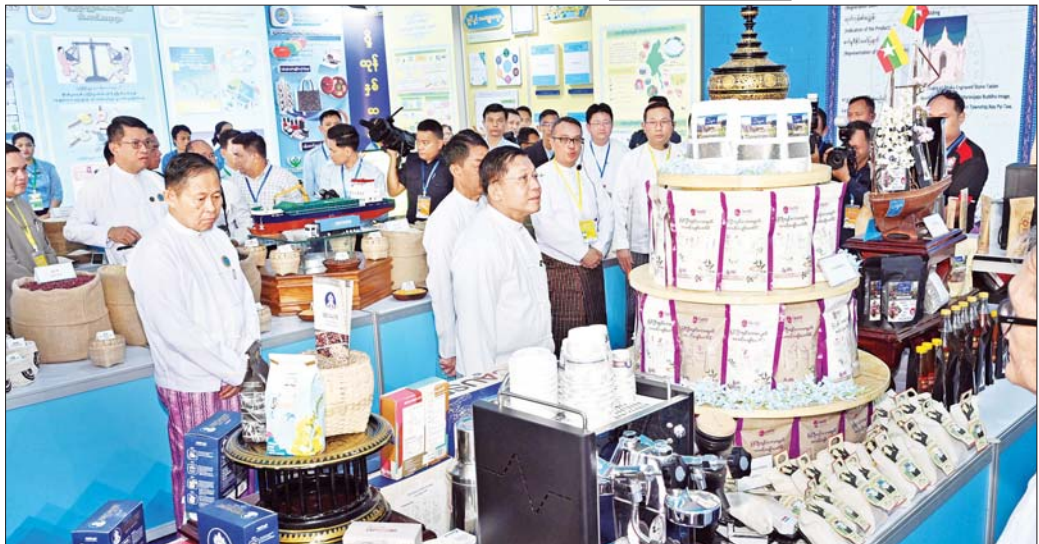
နိုင်ငံတော်စီမံအုပ်ချုပ်ရေးကောင်စီဥက္ကဋ္ဌ နိုင်ငံတော်ဝန်ကြီးချုပ် ဗိုလ်ချုပ်မှူးကြီး မင်းအောင်လှိုင်နှင့်အဖွဲ့ဝင်များ မန္တလေးတိုင်းဒေသကြီး MSME ထုတ်ကုန်ပြခန်းအား စိတ်ပါဝင်စားစွာဖြင့် ကြည့်ရှုစဉ်။

ဧရာဝတီတိုင်းဒေသကြီး MSME ထုတ်ကုန်ပြခန်းတို့အား ပြခန်းတစ်ခုချင်းစီအလိုက် စိတ်ပါဝင်စားစွာဖြင့် လိုက်လံကြည့်ရှုပြီး ထုတ်ကုန်များအလိုက် လုပ်ငန်းဆောင်ရွက်မှုများ၊ ကုန်ကြမ်းရရှိမှုနှင့် သုံးစွဲမှု၊ ထုတ်ကုန်များထုတ်လုပ်မှု၊ ပြည်တွင်း၊ ပြည်ပဈေးကွက်ရရှိမှု အခြေအနေများ၊ လုပ်ငန်းလိုအပ်ချက်များနှင့် ပြည်တွင်း၊ ပြည်ပသို့ ပို့ဆောင်မှုဖြန့်ဖြူးနိုင်မည့် အခြေအနေများနှင့် သိရှိလိုသည်များမေးမြန်းဆွေးနွေးပြီး လိုအပ်သည်များကို တာဝန်ရှိသူများနှင့် ပေါင်းစပ်ညှိနှိုင်း ပြည့်ဆည်းဆောင်ရွက်ပေးကာ ကြည့်ရှုမှုများကို ဆောင်ရွက်ခဲ့သည်။ မွန်လွိုင်တိုင်းတွင် နိုင်ငံတော်စီမံအုပ်ချုပ်ရေးကောင်စီဥက္ကဋ္ဌ နိုင်ငံတော်ဝန်ကြီးချုပ်နှင့် အဖွဲ့ဝင်များသည် မန္တလေးတိုင်းဒေသကြီး MSME ထုတ်ကုန်ပြခန်း၊ ပြန်ကြားရေးဝန်ကြီးဌာန ထုတ်ကုန်ပြခန်း၊ လုပ်ငန်း/စီးပွား ချိတ်ဆက်မှုပြခန်း (Business Matching Hall)၊ မြန်မာနိုင်ငံ ဘဏ်များအသင်းပြခန်း၊ Digital Corner နည်းပညာပြခန်း၊ မြန်မာ့စီးပွားရေးဦးပိုင်အများနှင့် သက်ဆိုင်သော ကမ္ဘာလီလီမိတက် MSME ထုတ်ကုန်များပြခန်း၊ မြန်မာစီးပွားရေးကော်ပိုရေးရှင်း MSME ထုတ်ကုန်များပြခန်း၊