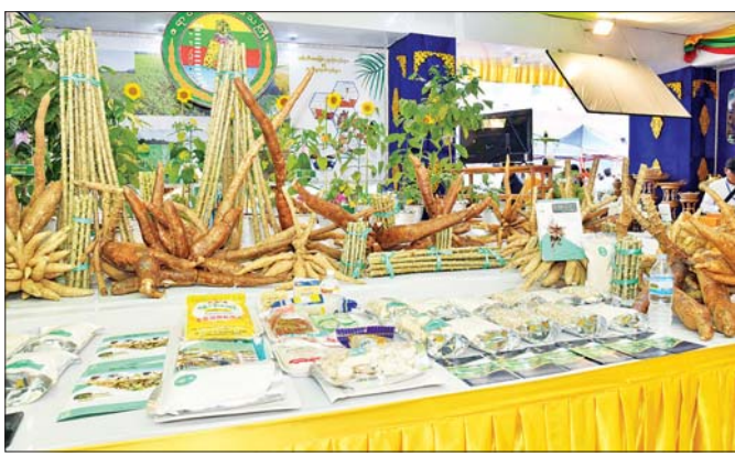
ဧရာဝတီတိုင်းဒေသကြီး MSME ထုတ်ကုန်ပြခန်းတွင် ဒေသထွက် အဆင့်မြင့်စားသောက်ကုန်များကို ခင်းကျင်းပြသထားစဉ်။