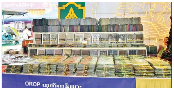
ပဲခူးတိုင်းဒေသကြီး MSME ထုတ်ကုန်ပြခန်းတွင် ခင်းကျင်းပြသထားသည့် ဒေသထုတ်ကုန်များကို တွေ့ရစဉ်။