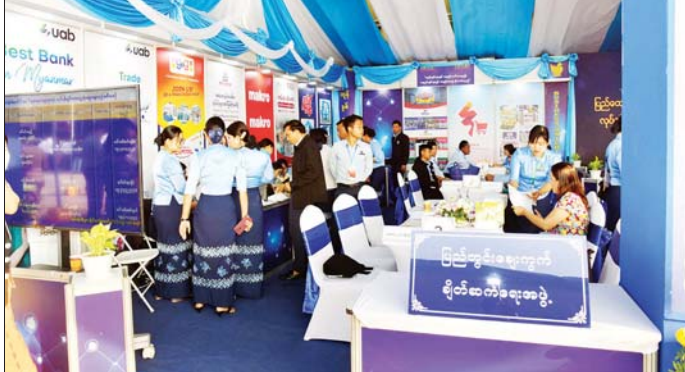
(၇၈)နှစ်မြောက် ပြည်ထောင်စုနေ့အထိမ်းအမှတ် ပြည်ထောင်စုအဆင့် MSME ထုတ်ကုန်ပြပွဲနှင့် ပြိုင်ပွဲ တွင် လုပ်ငန်းစီးပွားချိတ်ဆက်မှုပြခန်းအား တွေ့ရစဉ်။