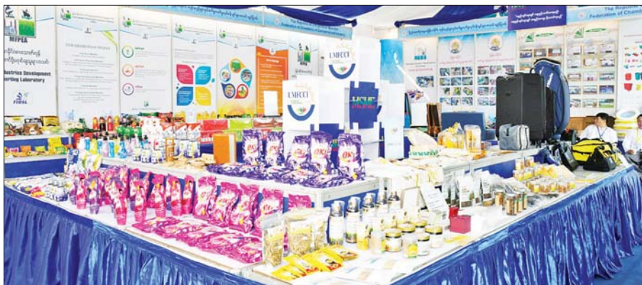
မြန်မာနိုင်ငံ ကုန်သည်များနှင့် စက်မှုလက်မှုလုပ်ငန်းရှင်များအသင်းချုပ်ပြခန်းတွင် ခင်းကျင်းပြသထားသည့် ထုတ်ကုန်များကို တွေ့ရစဉ်။