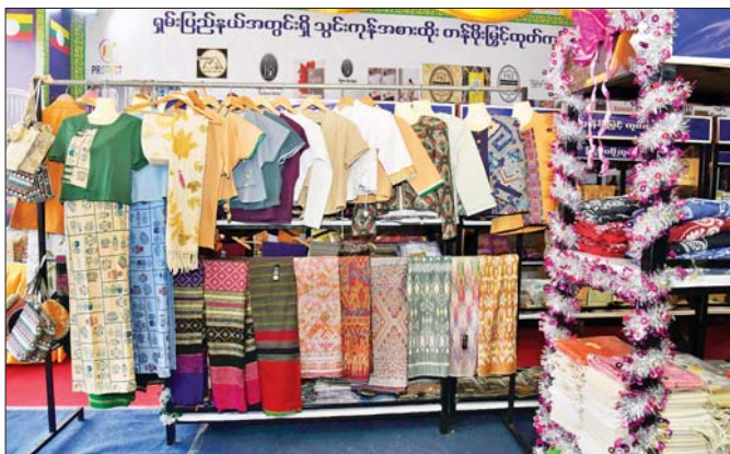
ရှမ်းပြည်နယ် MSME ထုတ်ကုန်ပြခန်းတွင် ဒေသထွက်အဝတ်အထည်များ ခင်းကျင်းပြသထားသည်ကို တွေ့ရစဉ်။