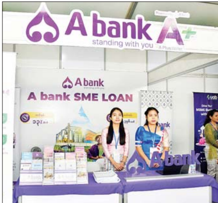
မြန်မာနိုင်ငံဘဏ်များအသင်းပြခန်းကို တွေ့ရစဉ်။