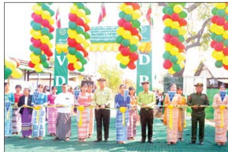
မြို့နယ်(ပြန်/ဆက်)

အဆိုပါလမ်းမှာ အရှည်ပေ ၁၇၀၀၊ အကျယ် ၁၂ ပေနှင့် ဒုခြောက် လက်မရှိပြီး လမ်းခင်းခြင်းနှင့် ဆိုလာရေသန့်စင်စနစ် တပ်ဆင်ခြင်း တို့အတွက် စီမံကိန်းရန်ပုံငွေကျပ်သိန်း ၁၅၀ နှင့် ကျေးရွာပြည်သူ ထည့်ဝင်ငွေကျပ် ၁၄၈ သိန်းတို့ဖြင့် ဆောင်ရွက်ခဲ့ခြင်းဖြစ်ကြောင်း သိရသည်။