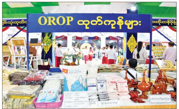
မွန်ပြည်နယ် MSME ထုတ်ကုန်ပြခန်းတွင် ဒေသထွက်ကုန်များ ခင်းကျင်းပြသထားသည်ကို တွေ့ရစဉ်။