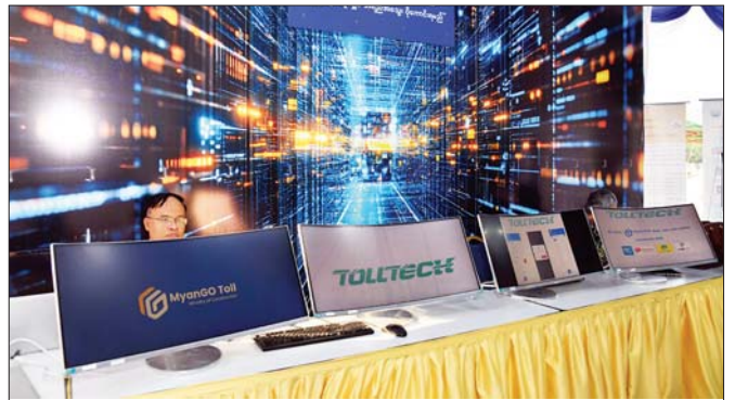
သိပ္ပံနှင့် နည်းပညာဝန်ကြီးဌာနပြခန်းကို တွေ့ရစဉ်။