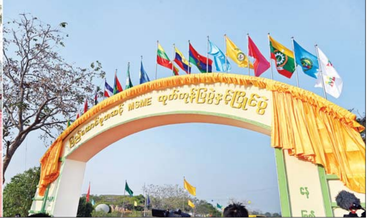
နိုင်ငံတော်စီမံအုပ်ချုပ်ရေးကောင်စီဥက္ကဋ္ဌ နိုင်ငံတော်ဝန်ကြီးချုပ် ဗိုလ်ချုပ်မှူးကြီး မင်းအောင်လှိုင် ပြည်ထောင်စုအဆင့် MSME ထုတ်ကုန်ပြပွဲနှင့်ပြိုင်ပွဲ ဖွင့်ပွဲအခမ်းအနားကို စက်ခလုတ်နှိပ်ဖွင့်လှစ်ပေးစဉ်။