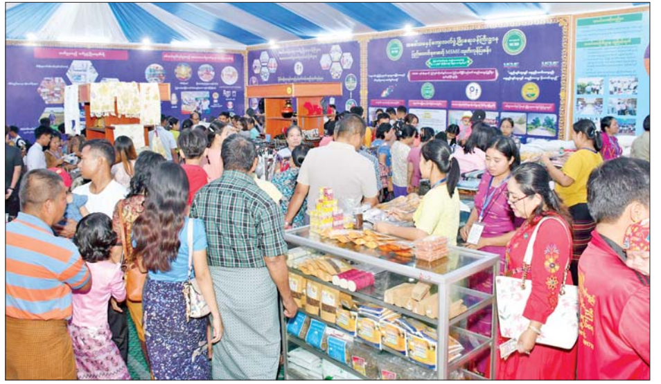
ပြည်ထောင်စုအဆင့် MSME ထုတ်ကုန်ပြပွဲနှင့် ပြိုင်ပွဲသို့ လာရောက်ကြသူများဖြင့် စည်ကားလျက်ရှိသည်ကို တွေ့ရစဉ်။

○ ကျော့ဖုံးမှ တစ်နိုင်တစ်ပိုင် MSME လုပ်ငန်းများ စတင်လုပ်ဆောင်ကြမည့်လုပ်ငန်းရှင်များသည်လည်း စိတ်ဝင်စားစွာဖြင့် လာရောက်လေ့လာကြသည်ကို တွေ့ရသည်။ တိုင်းဒေသကြီးနှင့် ပြည်နယ် ထုတ်ကုန်ပြခန်းအလိုက် ရိုးရာယဉ်ကျေးမှုဆိုင်ရာ ဗဟုသုတများ၊ ဒေသန္တရဗဟုသုတများ၊ ဒေသ၏ အထင်ကရနေရာများ၊ ဒေသတွင်း လူမှုစီးပွားဘဝ ဖွံ့ဖြိုးတိုးတက်ရေးဆောင်ရွက်ချက်များ၊ ဒေသအလိုက်ရိုးရာအစားအစာများနှင့် MSME ထုတ်ကုန်များကို အများပြည်သူ စိတ်ဝင်စားစွာ လေ့လာကြည့်ရှုနိုင်ရန် ခင်းကျင်းပြသရောင်းချလျက်ရှိသည့်အတွက် လေ့လာဝယ်ယူသူများဖြင့် စည်ကားလျက်ရှိပြီး ပြခန်းလာရောက်လေ့လာကြသူများကို ပြခန်းအလိုက် တာဝန်ရှိသူများက သတင်းအချက်အလက်နှင့် နည်းပညာများ