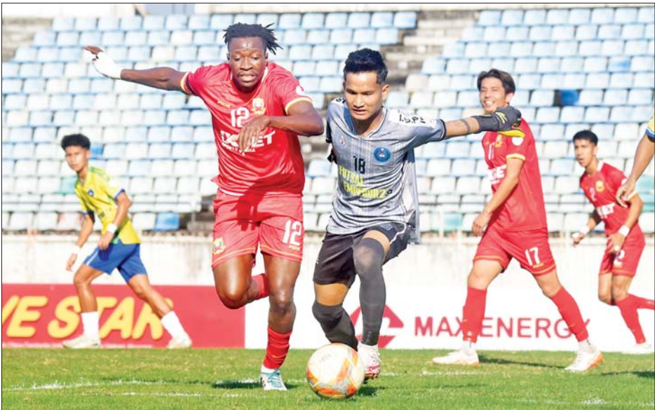
ဟက်ထရစ်သွင်းယူခဲ့သည့် ရှမ်းယူနိုက်တက် တိုက်စစ်ကစားသမား ဘာကာယိုကို၏ ထိုးဖောက်မှုကို အား/ကာသိပ္ပံ ဂိုးသမား ကာကွယ်နေစဉ်။

ရှမ်းယူနိုက်တက်အသင်းသည် ရန်ကုန်ယူနိုက်တက်အသင်း ခြေချော်မှုကို အသုံးပြုပြီး အား/ကာသိပ္ပံကို အနိုင်ယူကာ လက်ကျန်သုံးပွဲ အလိုမှာပင် ချန်ပီယံဆု ဆွတ်ခူးနိုင်ခဲ့သည်။ ရှမ်းယူနိုက်တက်အသင်းသည် MNL အမှတ်ပေးချန်ပီယံဆုကို နောက်ဆုံးခုနှစ်ရာသီတွင် ခြောက်ကြိမ် မြောက် ရယူနိုင်ခဲ့ပြီး ငါးရာသီဆက် ဗိုလ်စွဲနိုင်ခဲ့ခြင်း ဖြစ်သည်။ ထို့ကြောင့် ရှမ်းယူနိုက်တက်အသင်းသည် ချန်ပီယံဆု ခြောက်ကြိမ်ဖြင့် MNL ပြိုင်ပွဲ၏ စာမျက်နှာ ၁၉ ကော်လံ ၁ သို့ *