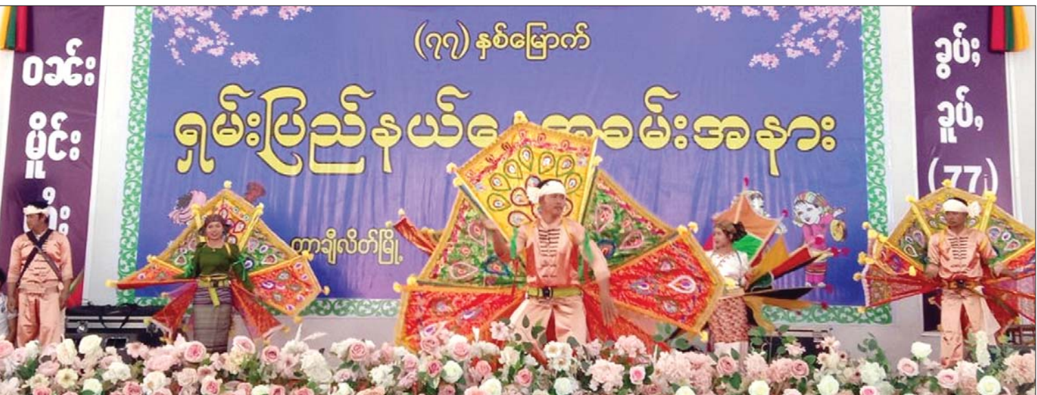
၇-၂-၂၀၂၄ ရက်နေ့က ရှမ်းပြည်နယ် တာချီလိတ်မြို့၌ကျင်းပသည့် (၇၇)နှစ်မြောက် ရှမ်းပြည်နယ်နေ့အခမ်းအနားတွင် ရှမ်းတိုင်းရင်းသားယဉ်ကျေးမှုအဖွဲ့များက ရိုးရာအဆိုအကများဖြင့် ဂုဏ်ပြုတင်ဆက်စဉ်။

၂၀၀၄ ခုနှစ်ခန့်က မြစ်ကြီးနား-မိုးကောင်း-မိုးညှင်း၊ ဟိုပင်၊ ကောလင်း-ဝန်းသို-ရွှေတိုသို့ တစ်ပတ်ကြာ သွားရောက် ခဲ့ဖူးသည်။ သဘာဝရှုမျှော်ခင်းများ၊ လမ်းဘေးဝဲယာတစ်လျှောက် မှိုင်းညို အုပ်ဆိုင်းနေသော ကျွန်းတောကြီးများဖြင့် ရှုမငြီးနိုင်စရာ သာယာလှပလွန်းလှသည်။ ဟူးကောင်းချိုင့်ဝှမ်းဒေသ တစ်ခုမှာ တစ်ဆင့် စစ်ကိုင်းတိုင်းဒေသကြီး နာဂ ကိုယ်ပိုင်အုပ်ချုပ်ခွင့်ရ ဒေသဖြစ်သည့် နန်းယွန်း၊ ထိုမှ ပန်ဆောင်မြို့သို့ ရောက်ပြန်တော့လည်း နွေခေါင်ခေါင်ပင် မိုးစက်မိုးပေါက်များ ရွာသွန်းပြီးပြီး မှုန်ရီ မှိုင်းဝေလျက်ရှိသည်။ လမ်းပန်းဆက်သွယ် မှုခက်ခဲ၍ ငြိမ်းချမ်းသော ကာလမှာပင် ဒေသခံပြည်သူအချို့မှာ ဖွံ့ဖြိုးတိုးတက်မှု နှင့် အလှမ်းကွာဝေးနေဆဲဖြစ်ပါသည်။