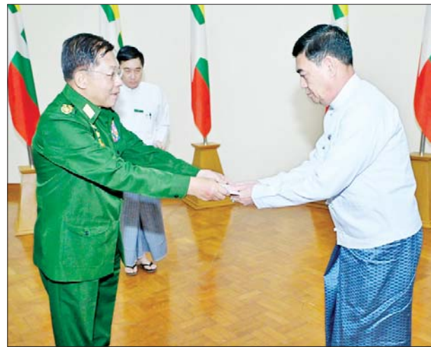
နိုင်ငံတော်စီမံအုပ်ချုပ်ရေးကောင်စီဥက္ကဋ္ဌ နိုင်ငံတော်ဝန်ကြီးချုပ် ဗိုလ်ချုပ်မှူးကြီးမင်းအောင်လှိုင် အကြမ်းဖက်ဖြစ်စဉ်များကြောင့် ယာယီနေရပ်စွန့်ခွာနေရသည့် ပြည်သူများအတွက် ထောက်ပံ့ငွေများပေးအပ်ရာ နေပြည်တော်ကောင်စီဥက္ကဋ္ဌနှင့် ပြည်နယ်ဝန်ကြီးချုပ်တို့က လက်ခံရယူစဉ်။