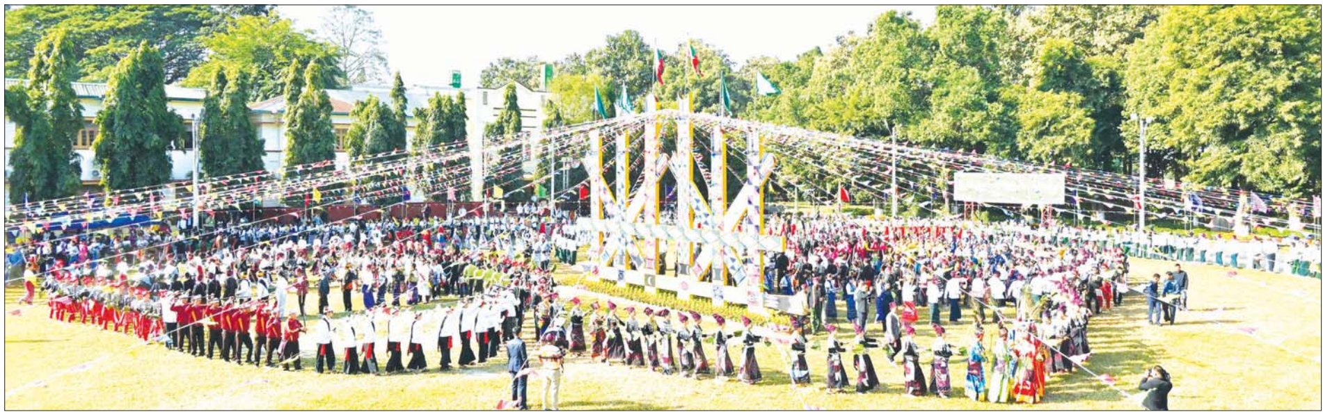
၁၀-၁၂-၂၀၂၅ ရက်နေ့က ကချင်ပြည်နယ် မြစ်ကြီးနားမြို့၊ ပြည်နယ်အစိုးရအဖွဲ့ရုံးရှေ့ မြက်ခင်းပြင်ရှိ မနောကွင်း၌ ကျင်းပသည့် (၇၇)နှစ်မြောက် ကချင်ပြည်နယ်နေ့ အထိမ်းအမှတ်အခမ်းအနားတွင် မနောအကဖြင့် တပျော်တပါး စုပေါင်းဆင်နွှဲကြစဉ်။