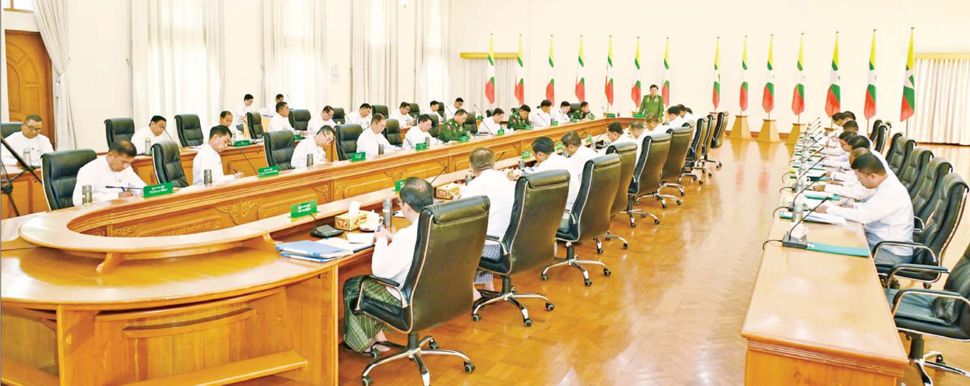
နိုင်ငံတော်စီမံအုပ်ချုပ်ရေးကောင်စီဥက္ကဋ္ဌ နိုင်ငံတော်ဝန်ကြီးချုပ် ဗိုလ်ချုပ်မှူးကြီးမင်းအောင်လှိုင် တိုင်းဒေသကြီးနှင့် ပြည်နယ်ဝန်ကြီးချုပ်များအား တွေ့ဆုံအမှာစကားပြောကြားစဉ်။

နိုင်ငံတော်စီမံအုပ်ချုပ်ရေးကောင်စီဥက္ကဋ္ဌ နိုင်ငံတော်ဝန်ကြီးချုပ် ဗိုလ်ချုပ်မှူးကြီး မင်းအောင်လှိုင် တိုင်းဒေသကြီးနှင့် ပြည်နယ်ဝန်ကြီးချုပ်များအား တွေ့ဆုံအမှာစကားပြောကြား အကြမ်းဖက်ဖြစ်စဉ်များကြောင့် နေရပ်စွန့်ခွာနေရသည့် ပြည်သူများအတွက် အမျိုးသားသဘာဝဘေးအန္တရာယ်ဆိုင်ရာ စီမံခန့်ခွဲမှုရန်ပုံငွေမှ ထောက်ပံ့ငွေများ ပေးအပ်