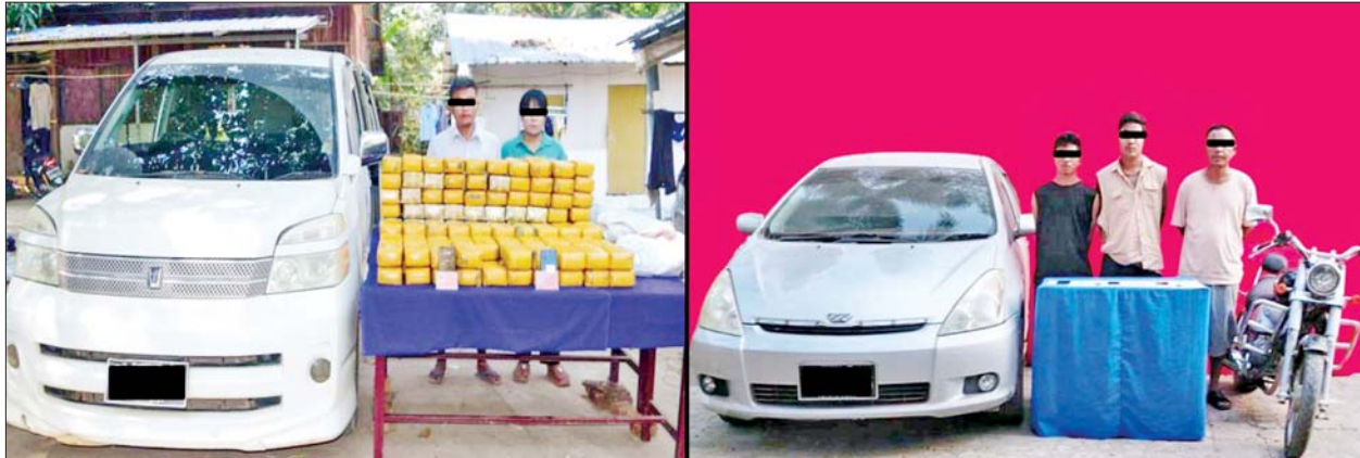
ဘားအံမြို့၌ ဖမ်းဆီးရမိသူများအား စိတ်ကြွေးရင်းနှီးမြှုပ်နှံရေးများနှင့်အတူ တွေ့ရစဉ်။

နေပြည်တော် ဖေဖော်ဝါရီ ၁၁ သာစည်မြို့နယ်နှင့် ဘားအံမြို့နယ်တို့တွင် ငွေကျပ် ၃ ဒသမ ၇ ဘီလီယံကျော်တန်ဖိုးရှိ စိတ်ကြွေးရင်းနှီးမြှုပ်နှံရေးများ ၁၄ ဒသမ ၉ သိန်း သိမ်းဆည်းရမိကြောင်း မြန်မာနိုင်ငံရဲတပ်ဖွဲ့မှ သိရသည်။ ဖြစ်စဉ်မှာ မူးယစ်ဆေးဝါး တားဆီးနှိမ်နင်းရေး ရဲတပ်ဖွဲ့မှ တပ်ဖွဲ့ဝင်များပါဝင်သော ပူးပေါင်းအဖွဲ့သည် ဖေဖော်ဝါရီ ၆ ရက် ည ၁၀ နာရီခွဲတွင် မန္တလေးတိုင်းဒေသကြီး သာစည်မြို့နယ် ကျွဲတပ်ဆုံကျေးရွာအနီးတွင် တောင်ကြီးမှ ရန်ကုန်ဘက်သို့ အားဘ(ခ) အားဆာ မောင်းနှင်ပြီး မိုးမိုးအေး လိုက်ပါလာသည့် MITSUBISHI PAJERO ယာဉ်ကို သတင်းအရ ရှာဖွေရာ ယာဉ်ပေါ်မှ စိတ်ကြွေးရင်းနှီးမြှုပ်နှံရေး ငါးသိန်း သိမ်းဆည်းရမိခဲ့သည်။ ဖေဖော်ဝါရီ ၇ ရက် နံနက် ၈