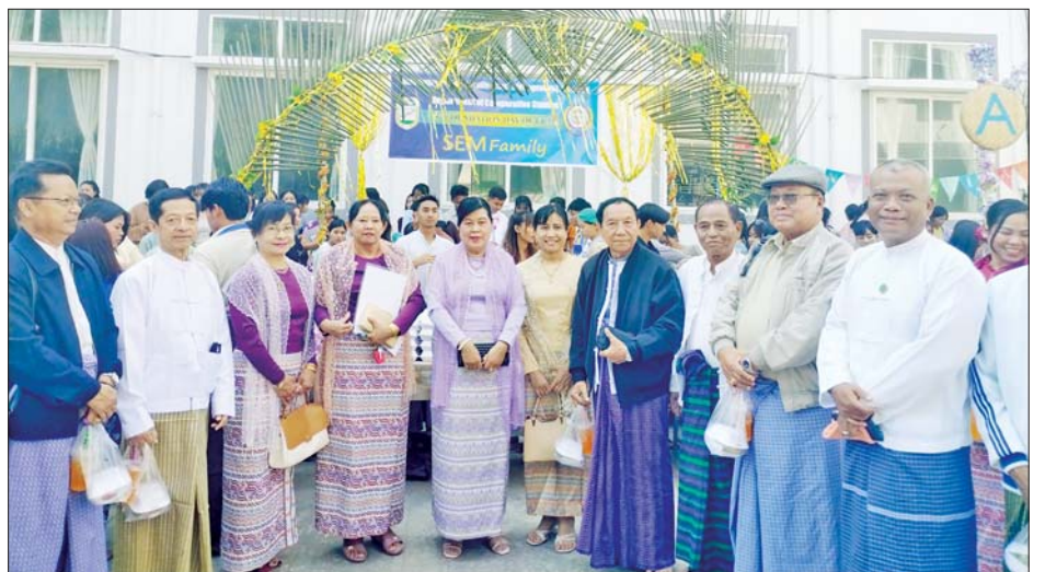
အားပေးကြပြီး ဝန်ထမ်းများအား ငွေသားဆုကံစမ်းမဲများ ပေးအပ်သည်။ ထို့အပြင် တက္ကသိုလ်တည်ထောင်သည့်နေ့ (၁၃)နှစ်မြောက် အထိမ်းအမှတ်ဂုဏ်ပြုသုတေသနစာတမ်းဖတ်ပွဲကို ဖေဖော်ဝါရီ ၆ ရက်က ကျင်းပပြီး ဒေသအကျိုးပြု၊ တက္ကသိုလ်အကျိုးပြု၊ ဘာသာရပ်အကျိုးပြု သုတေသနစာတမ်း ၁၃ စောင် ဖတ်ကြားခဲ့ကြောင်း သိရသည်။ ဝင်းနိုင်ထွန်း

ဆက်ကပ်၍ တရားနာယူကြသည်။ အခမ်းအနားတွင် ပါမောက္ခချုပ်က အဖွင့်အမှာစကားပြောကြားပြီး ပြည်သူ့ဝန်ထမ်းကောင်းဆုရရှိသူနှစ်ဦး၊ ပြက္ခဒိန်နှစ်အတွင်း မည်သည့်ခွင့်မှ ခံစားခြင်းမရှိသည့် အရာထမ်း၊ အမှုထမ်း ၂၀၊ အရိုးသားဆုံးဆုရရှိသူ အမှုထမ်းသုံးဦးတို့အား ဆုများချီးမြှင့်ကြသည်။ ဆက်လက်၍ တက္ကသိုလ်တည်ထောင်သည့်နေ့အထိမ်းအမှတ် ဈေးရောင်းပွဲတော်ရှိ ကျောင်းသားကျောင်းသူများနှင့် HRD Programme များမှရောင်းချသည့် ဆိုင်ခန်း ၁၀ ခန်းအား လှည့်လည်ကြည့်ရှု