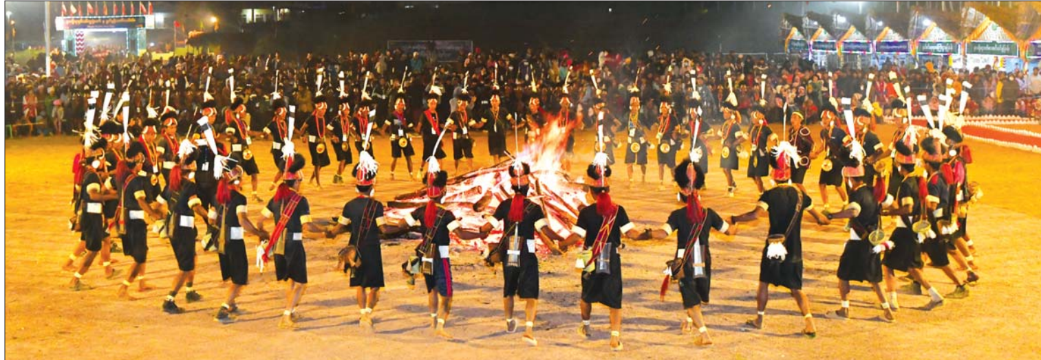
နာဂကိုယ်ပိုင်အုပ်ချုပ်ခွင့်ရဒေသ လဟယ်မြို့၌ (၁၆-၁-၂၀၂၅)ရက်နေ့က ကျင်းပသည့် ၂၀၂၅ ခုနှစ် နာဂရိုးရာ နှစ်သစ်ကူးပွဲတော် နာဂရိုးရာယဉ်ကျေးမှု မီးပုံပွဲတွင် နာဂရိုးရာမျိုးနွယ်စုများအလိုက် ရိုးရာအကများဖြင့် ကပြဖော်ပြနေစဉ်။

ပဒေါင်တိုင်းရင်းသားတို့သည် ကယား ပြည်နယ် အနောက်မြောက်ပိုင်းနှင့် ရှမ်းပြည်နယ်(တောင်ပိုင်း)တို့တွင် နေထိုင် ကြပြီး လည်ပင်းနှင့် ခြေထောက်တို့တွင် ကြေးကွင်းများ ဝတ်ဆင်လေ့ရှိကြသည်။ ပဒေါင်တို့သည် ပျော်ပျော်ရွှင်ရွှင်နေတတ် သည်။ အလုပ်ကို အပင်ပန်းခံ၍ လုပ်နိုင် ကြသည်။ တောင်ယာလုပ်ငန်းကို မညည်း မညူလုပ်ကြသည်။ ကုန်ရောင်းကုန်ဝယ် အလုပ်လည်း လုပ်ကိုင်တတ်ကြသည်။