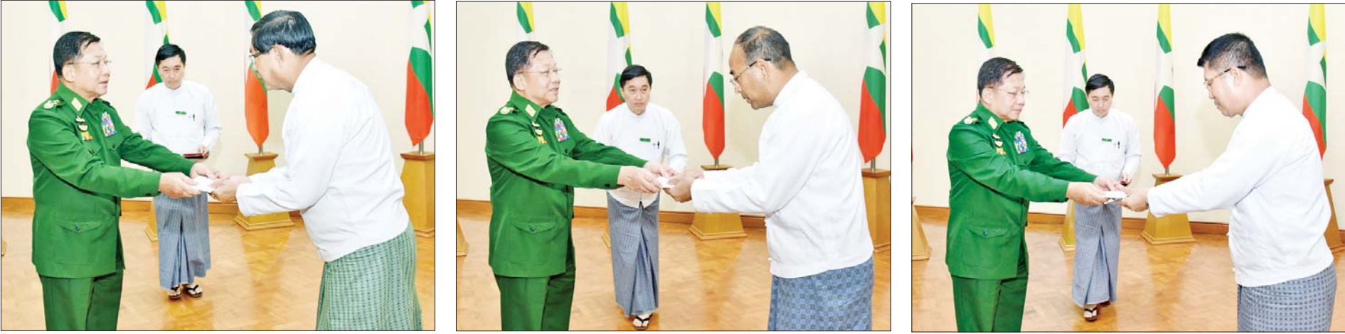
နိုင်ငံတော်စီမံအုပ်ချုပ်ရေးကောင်စီဥက္ကဋ္ဌ နိုင်ငံတော်ဝန်ကြီးချုပ် ဗိုလ်ချုပ်မှူးကြီးမင်းအောင်လှိုင် အကြမ်းဖက်ဖြစ်စဉ်များကြောင့် ယာယီနေရပ်စွန့်ခွာနေရသည့်ပြည်သူများအတွက် ထောက်ပံ့ငွေများ ပေးအပ်ရာ တိုင်းဒေသကြီးနှင့် ပြည်နယ်ဝန်ကြီးချုပ်များက လက်ခံရယူစဉ်။

(၃-၉-၂၀၂၄ ရက်နေ့တွင် နိုင်ငံတော်စီမံအုပ်ချုပ်ရေးကောင်စီဥက္ကဋ္ဌ နိုင်ငံတော် ဝန်ကြီးချုပ် ဗိုလ်ချုပ်မှူးကြီး မင်းအောင်လှိုင် ရှမ်းပြည်နယ် အစိုးရအဖွဲ့ဝင်များ၊ ပြည်နယ်နှင့် ခရိုင်အဆင့် ဌာနဆိုင်ရာတာဝန်ရှိသူများအား ပြောကြားသည့် အမှာ စကားမှ ကောက်နုတ်ချက်)