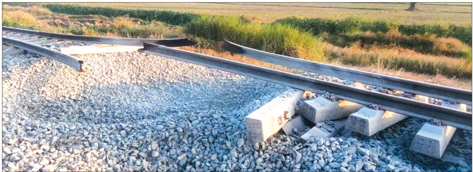
လမ်းပန်းဆက်သွယ်ရေးကောင်းမွန်စေရန် နိုင်ငံတော်က ရထားလမ်းများ တည်ဆောက်ပေးထားသော်လည်း ၁၄-၁၂-၂၀၂၄ ရက်နေ့က ရန်ကုန်-မန္တလေး ရထားလမ်းပိုင်းရှိ တော်ဝိနှင့် ပိန်းဇလုပ်ဘူတာကြား အစုန်ရထားလမ်းပေါ်၌ အကြမ်းဖက်သောင်းကျန်းမှုကြောင့် ရထားလမ်းများ ဤသို့ပျက်စီးခဲ့ရသည်။

“ပြည်ထောင်စု၏ အလှတရားသည် ငြိမ်းချမ်းမှု အပေါ် တည်မှီပါသည်။ ငြိမ်းချမ်းမှု သာယာ မည်။ သာယာမှ ဝပြောမည်။ သာယာဝပြောမှ ဖွံ့ဖြိုးစည်ပင်လာမည် ဖြစ်ပါသည်။ လက်ရှိ ကာလတွင် နိုင်ငံတော်နှင့် နိုင်ငံသားတို့အတွက် အလိုအပ်ဆုံးအရာကား ထာဝရငြိမ်းချမ်းရေး ပင်ဖြစ်