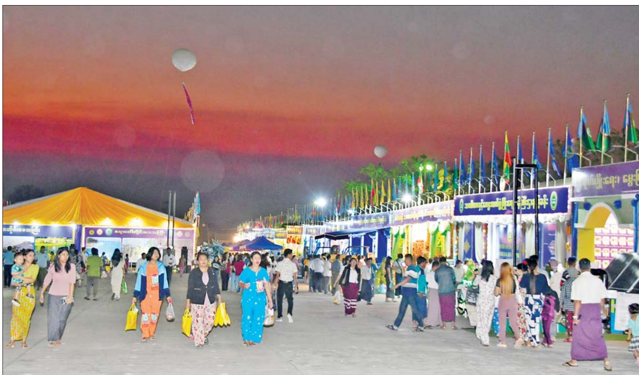
ပြည်ထောင်စုအဆင့် MSME ထုတ်ကုန်ပြပွဲနှင့် ပြိုင်ပွဲသို့ လာရောက်ကြည့်ရှုသူများဖြင့် စည်ကားလျက်ရှိသည်ကို တွေ့ရစဉ်။

ထို့ပြင် ပြပွဲသို့ အသေးစား၊ အငယ်စားနှင့် အလတ်စားစီးပွား ရေးလုပ်ငန်း (MSME) များ လုပ်ကိုင် နေကြသည့် လုပ်ငန်းရှင်များ၊ စာမျက်နှာ ၁၅ ကော်လံ ၁ သို့ ၀