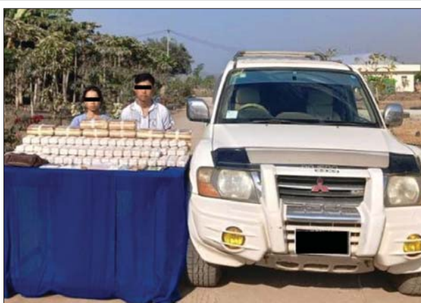
သာစည်မြို့နယ်၌ ဖမ်းဆီးရမိသူများအား စိတ်ကြွေးရင်းနှီးမြှုပ်နှံရေးများနှင့်အတူ တွေ့ရစဉ်။

နေပြည်တော် ဖေဖော်ဝါရီ ၁၁ သာစည်မြို့နယ်နှင့် ဘားအံမြို့နယ်တို့တွင် ငွေကျပ် ၃ ဒသမ ၇ ဘီလီယံကျော်တန်ဖိုးရှိ စိတ်ကြွေးရင်းနှီးမြှုပ်နှံရေးများ ၁၄ ဒသမ ၉ သိန်း သိမ်းဆည်းရမိကြောင်း မြန်မာနိုင်ငံရဲတပ်ဖွဲ့မှ သိရသည်။ ဖြစ်စဉ်မှာ မူးယစ်ဆေးဝါး တားဆီးနှိမ်နင်းရေး ရဲတပ်ဖွဲ့မှ တပ်ဖွဲ့ဝင်များပါဝင်သော ပူးပေါင်းအဖွဲ့သည် ဖေဖော်ဝါရီ ၆ ရက် ည ၁၀ နာရီခွဲတွင် မန္တလေးတိုင်းဒေသကြီး သာစည်မြို့နယ် ကျွဲတပ်ဆုံကျေးရွာအနီးတွင် တောင်ကြီးမှ ရန်ကုန်ဘက်သို့ အားဘ(ခ) အားဆာ မောင်းနှင်ပြီး မိုးမိုးအေး လိုက်ပါလာသည့် MITSUBISHI PAJERO ယာဉ်ကို သတင်းအရ ရှာဖွေရာ ယာဉ်ပေါ်မှ စိတ်ကြွေးရင်းနှီးမြှုပ်နှံရေး ငါးသိန်း သိမ်းဆည်းရမိခဲ့သည်။ ဖေဖော်ဝါရီ ၇ ရက် နံနက် ၈