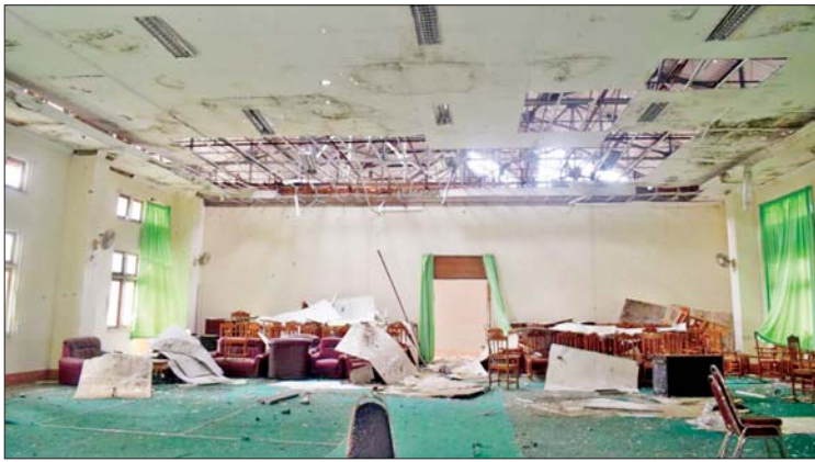
ပညာတတ်လူ့စွမ်းအားအရင်းအမြစ်များ မွေးထုတ်ပေးရာ ကယားပြည်နယ် လွိုင်ကော်တက္ကသိုလ်အား ၂၀၂၃ ခုနှစ် နိုဝင်ဘာ ၁၃ ရက် နှင့် ၁၄ ရက်တို့တွင် အကြမ်းဖက် သောင်းကျန်းသူများ ဖျက်ဆီးမှုကြောင့် ပျက်စီးနေမှုများကို တွေ့ရစဉ်။