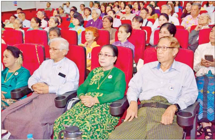
ဝန်ထမ်းဟောင်းများတွေ့ဆုံပွဲအခမ်းအနားသို့ တက်ရောက်လာကြသူများကို တွေ့ရစဉ်။

ဆယ်စုနှစ်တစ်စုမျှ ခင်မင်ရင်းနှီးခွင့် ရခဲ့သော မြန်မာ့အသံနှင့် ရုပ်မြင်သံကြား ကို ကျွန်တော်ချစ်သည်။ ဆုံခဲ့ဖူးသော အနုပညာရှင်များနှင့် ၎င်းတို့၏ အနုပညာ စွမ်းပကားကို ကျွန်တော်လေးစားသည်။ ကွယ်လွန်သွားကြပြီဖြစ်သော ဝန်ထမ်း ဟောင်းများကို သတိရမိသကဲ့သို့ မြန်မာ့ အသံနှင့် ရုပ်မြင်သံကြား ဝန်ထမ်းဟောင်း များအသင်း ခိုင်ခိုင်မာမာရပ်တည်နိုင် ရန်အတွက်လည်း ဇောစေတနာ ရည်သန်မိ