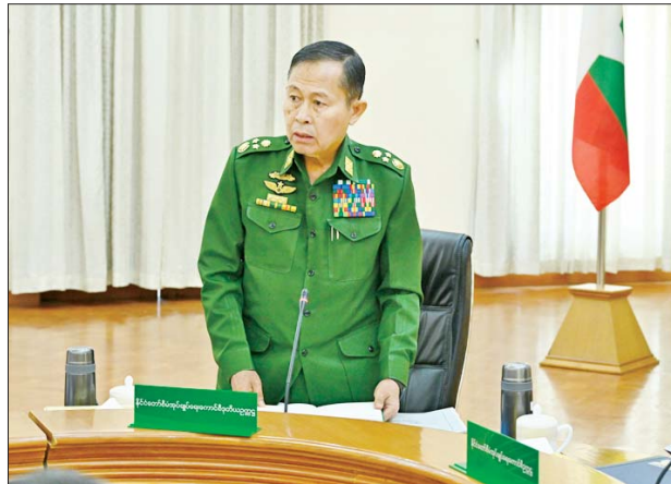
နိုင်ငံတော်စီမံအုပ်ချုပ်ရေးကောင်စီဥက္ကဋ္ဌ နိုင်ငံတော်ဝန်ကြီးချုပ် ဗိုလ်ချုပ်မှူးကြီးမင်းအောင်လှိုင် အကြမ်းဖက်ဖြစ်စဉ်များကြောင့် ယာယီ နေရပ်စွန့်ခွာနေရသည့် ပြည်သူများအတွက် ထောက်ပံ့ငွေများပေးအပ်ရာ တိုင်းဒေသကြီးနှင့် ပြည်နယ်ဝန်ကြီးချုပ်များက လက်ခံရယူစဉ်။