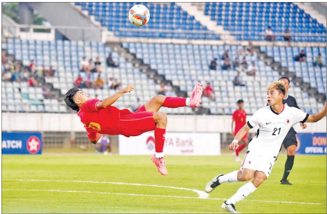
ဟောင်ကောင်အသင်းဘက်သို့ မြန်မာ ယူ-၂၂ အသင်း ရိုးသွင်းရန် ကြိုးပမ်းစဉ်။