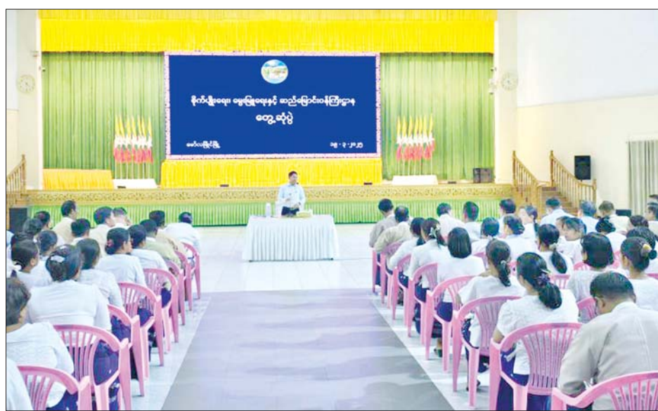
ကဏ္ဍအလိုက် လိုအပ်ချက်များကို တင်ပြကြရာ ပေးခဲ့ကြောင်း သိရသည်။ ပြည်ထောင်စုဝန်ကြီးက ညှိနှိုင်းပေါင်းစပ်ဆောင်ရွက် သတင်းစဉ်

အသိပညာပေးရန် လိုကြောင်း၊ သီးနှံစိုက်ပျိုးမှုနှင့် ထွက်ရှိမှုဆိုင်ရာ ကိန်းဂဏန်းစာရင်းဇယားများ တိကျမှန်ကန်ရေးနှင့် မိမိတို့တာဝန်ယူထားကြသည့် လုပ်ငန်းများ အောင်မြင်ရေးအတွက် ကြိုးပမ်းဆောင် ရွက်ကြစေလိုကြောင်း၊ လုပ်ငန်းများတွင် ကြုံတွေ့ ရတတ်သည့် အခက်အခဲနှင့် စိန်ခေါ်မှုများကို ဆက်စပ်ဌာနအဖွဲ့အစည်းများနှင့် ညှိနှိုင်းပေါင်းစပ် ဆောင်ရွက်ရန်ဖြစ်ကြောင်း၊ တာဝန်ရှိသူအဆင့်ဆင့် က ဝန်ထမ်းသက်သာချောင်ချိရေးနှင့် ဝန်ထမ်းများ ရသင့်ရထိုက်သည့် ဝန်ထမ်းခံစားခွင့်များကို စနစ်တကျစီမံဆောင်ရွက်ပေးပြီး လိုအပ်ချက်ရှိပါက သက်ဆိုင်ရာသို့ အချိန်နှင့်တစ်ပြေးညီ တင်ပြ ဆောင်ရွက်ကြရမည်ဖြစ်ကြောင်း ဆွေးနွေးမှာကြား သည်။ ထို့နောက် အရာထမ်း၊ အမှုထမ်းများက လုပ်ငန်း