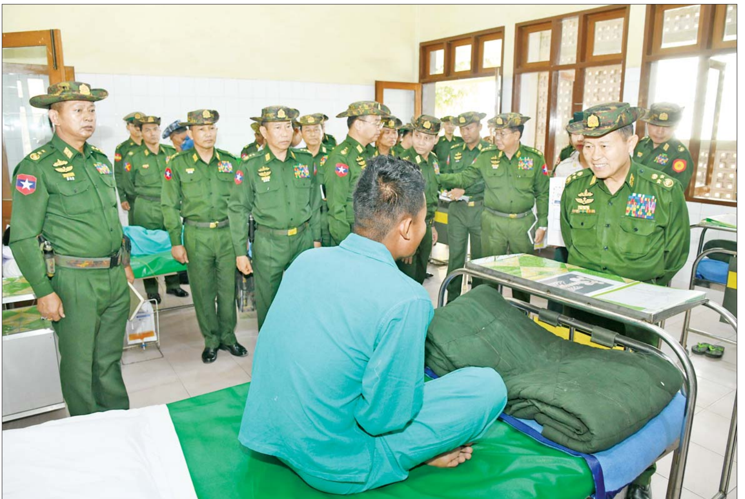
နိုင်ငံတော်စီမံအုပ်ချုပ်ရေးကောင်စီဒုတိယဥက္ကဋ္ဌ ဒုတိယတပ်မတော်ကာကွယ်ရေးဦးစီးချုပ် ကာကွယ်ရေးဦးစီးချုပ်(ကြည်း) ဒုတိယဗိုလ်ချုပ်မှူးကြီးစိုးဝင်း အောင်ပန်းမြို့ရှိ တပ်မတော်ဆေးရုံ၌ တက်ရောက်ကုသမှုခံယူနေသူတစ်ဦးအား ရင်းရင်းနှီးနှီးမေးမြန်းအားပေးစကားပြောကြားစဉ်။