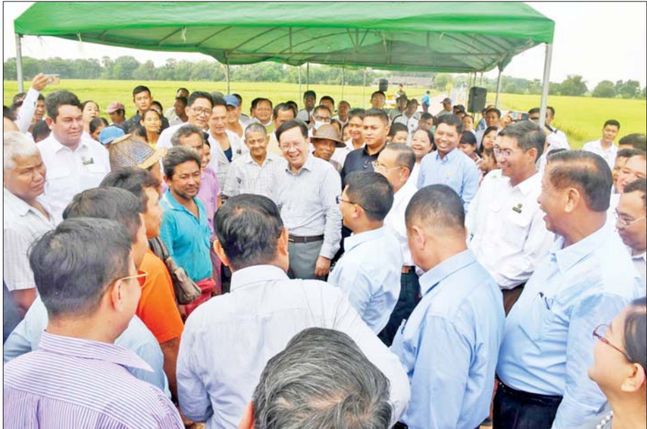
နိုင်ငံတော်စီမံအုပ်ချုပ်ရေးကောင်စီအတွင်းရေးမှူး ဗိုလ်ချုပ်ကြီး အောင်လင်းဒွေး မုဒုံမြို့နယ် ဘဲရမ်း ကျေးရွာရှိ ဧက ၁၀၀ စံပြစိုက်ခင်း၌ တောင်သူများနှင့် ရင်းရင်းနှီးနှီးတွေ့ဆုံစဉ်။

ဆုများပေးအပ်ချီးမြှင့်ပြီး ဆုရရှိသူ များနှင့်အတူ မှတ်တမ်းတင် ဓာတ်ပုံရိုက်ကြသည်။ ထိုမှတစ်ဆင့် နိုင်ငံတော်စီမံ အုပ်ချုပ်ရေးကောင်စီအတွင်းရေး မှူး ဗိုလ်ချုပ်ကြီး အောင်လင်းဒွေး နှင့် အဖွဲ့ဝင်များသည် မုဒုံမြို့နယ် ဘဲရမ်းကျေးရွာသို့ ရောက်ရှိကြရာ ရှင်းလင်းဆောင်၌ စိုက်ပျိုးရေး ဦးစီးဌာနမှ တာဝန်ရှိသူက မွန်ပြည်နယ်အတွင်း မြေယာ အသုံးချမှုအခြေအနေ၊ ၂၀၂၄-၂၀၂၅ ဘဏ္ဍာနှစ်တွင် အဓိကသီးနှံများ စိုက်ပျိုးထုတ်လုပ်မှု အခြေအနေ၊ ပြည်နယ်အတွင်း အခြားသီးနှံများ စိုက်ပျိုးထုတ်လုပ်မှု အခြေအနေ နှင့် အောင်နိုင်တိုးစပါးမျိုးသစ် စိုက်ပျိုးထုတ်လုပ်ခြင်း ဆောင်ရွက် ပြီးစီးမှုအခြေအနေများကို ရှင်းလင်း တင်ပြသည်။ ထို့နောက် နိုင်ငံတော်စီမံ အုပ်ချုပ်ရေးကောင်စီအတွင်းရေး