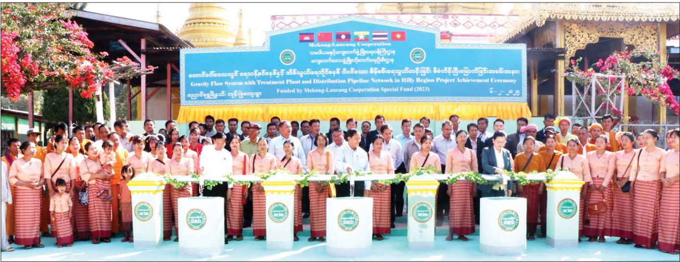
ညောင်ရွှေမြို့နယ် ကုန်းခြံကျေးရွာ၌ ဖေဖော်ဝါရီ ၆ ရက်က ပြည်ထောင်စုဝန်ကြီး ဦးလှမိုး၊ မြန်မာနိုင်ငံဆိုင်ရာ တရုတ်ပြည်သူ့သမ္မတနိုင်ငံ သံအမတ်ကြီး H.E.Ms.Ma Jia နှင့် တာဝန်ရှိသူများ ကုန်းခြံကျေးရွာ ရေဖြန့်ဖြူးရေးစနစ် ဖွင့်ပွဲအခမ်းအနားကို ဖွင့်လှစ်ပေးကြစဉ်။

ပျော်ရွှင်မှုအပြည့်နှင့် ကျေနပ်မှုများ ထင်ဟပ်နေသော မျက်နှာဟန်ပန်အမူအရာများဖြင့် ဒေသခံ တိုင်းရင်းသား တိုင်းရင်းသူများက ရွာအလယ်ဗဟိုရှိ မဏ္ဍပ်နေရာတွင် စုဝေးရောက်ရှိနေကြသည်။ ကျေးရွာအတွက် အထူးလိုအပ်လျက်ရှိသော သန့်ရှင်းသည့် သောက်သုံးရေကို အချိန်မရွေးရရှိ စေရန်အတွက် ကျေးလက်ဒေသ ဖွံ့ဖြိုးတိုးတက်ရေး ဦးစီးဌာနက မဲခေါင်-လန်ချန်း ပူးပေါင်းဆောင်ရွက်မှု အထူးရန်ပုံငွေဖြင့် ဆောင်ရွက်သည့် ကျေးရွာရေပေး ရေးစီမံကိန်း အောင်မြင်ပြီးမြောက်ခြင်း အခမ်း အနားကို ယခုလို စည်ကားသိုက်မြိုက်စွာ ကျင်းပ နေခြင်းဖြစ်သည်။