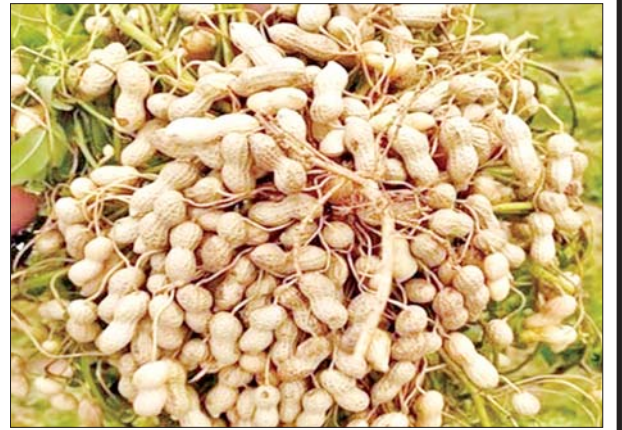
၁၉-၃-၂၀၂၅ ရက်နေ့ တိုင်းဒေသကြီးနှင့်ပြည်နယ်၊ မြို့နယ်အလိုက် ဆန်၊ ဆီ၊ မီးဖိုချောင်သုံးပစ္စည်းများ၊ သားငါးဈေးနှုန်းများ

ပွဲစားများနှင့် ဒေသတွင်းဆီစက်လုပ်ငန်းရှင်များက ကျေးရွာများသို့ လာရောက်ဝယ်ယူ၍ အရောင်းအဝယ် ဖြစ်လျက်ရှိသည့်အပြင် တောင်သူများက ကျောက်ဆည်မြို့ပေါ်ရှိ ပွဲရုံများသို့ တိုက်ရိုက်တင်ပို့ရောင်းချကြပြီး ပွဲရုံများမှတစ်ဆင့် ရန်ကုန်နှင့် မန္တလေးမြို့တို့သို့ တင်ပို့ရောင်းချကြောင်း၊ မြေပဲစိုက်ပျိုးခြင်းသည် စားသုံးဆီဖူလုံသည့်အပြင် ဈေးနှုန်းကောင်းမွန်သောကြောင့် တောင်သူများအကျိုး အမြတ်ရရှိကြောင်း သိရသည်။