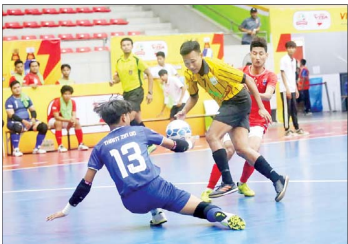
Gold Dream အသင်းနှင့် Maryar အသင်းတို့ ယှဉ်ပြိုင်ကစားကြစဉ်။