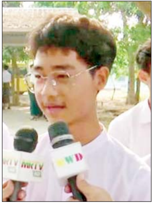
ကျောင်းသား