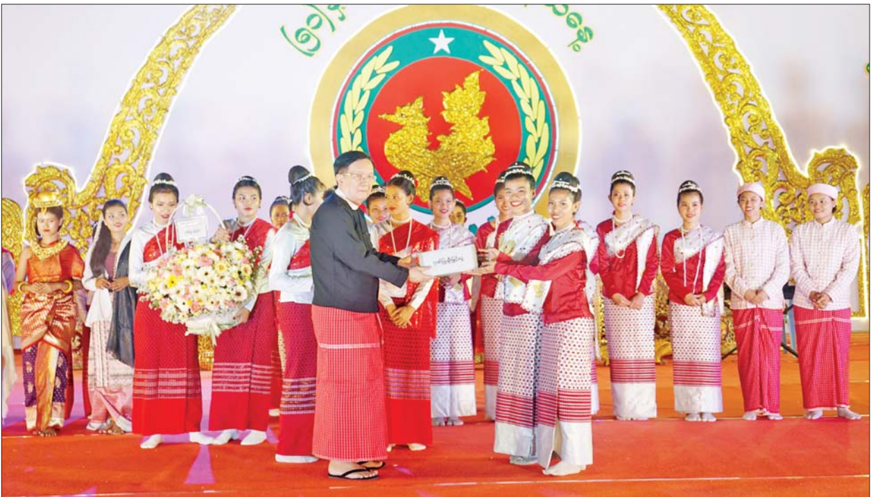
နိုင်ငံတော်စီမံအုပ်ချုပ်ရေးကောင်စီအတွင်းရေးမှူး ဗိုလ်ချုပ်ကြီး အောင်လင်းဒွေး မွန်ပြည်နယ်နေ့အထိမ်းအမှတ် ဂုဏ်ပြုညစာစားပွဲ အခမ်းအနားတွင် ကပြသီချင်းဖျော်ဖြေခဲ့ကြသည့် ရိုးရာယဉ်ကျေးမှုအဖွဲ့များအား ဂုဏ်ပြုဆုငွေပေးအပ်ချီးမြှင့်စဉ်။

မွန်ပြည်နယ်နေ့ အထိမ်းအမှတ် ဂုဏ်ပြုညစာစားပွဲ အခမ်းအနား သို့ တက်ရောက်ချီးမြှင့်ကြ သည်။ ဦးစွာ မွန်ရိုးရာယဉ်ကျေးမှုအဖွဲ့ များက (၅၁)နှစ်မြောက် မွန် ပြည်နယ်နေ့ ဂုဏ်ပြုသီချင်းများ ဖြင့် ဖျော်ဖြေတင်ဆက်ကြသည်။ ထို့နောက် မွန်ပြည်နယ်နေ့ အထိမ်းအမှတ် သနပ်ခါးအလှမယ် ပြိုင်ပွဲ၌ ဆုရရှိသူများအား သာသနာရေးနှင့် ယဉ်ကျေးမှု ဝန်ကြီးဌာန ဒုတိယဝန်ကြီးနှင့် တာဝန်ရှိသူများက ဆုများပေးအပ် ချီးမြှင့်ကြသည်။ ကြည့်ရှုအားပေး ယင်းနောက် နိုင်ငံတော်စီမံ အုပ်ချုပ်ရေးကောင်စီအတွင်းရေး မှူး ဗိုလ်ချုပ်ကြီး အောင်လင်းဒွေး သည် အခမ်းအနားသို့ တက် ရောက်လာကြသူများနှင့် အတူ မွန်ပြည်နယ်နေ့ အထိမ်းအမှတ် ဂုဏ်ပြုညစာကို အတူတကွ