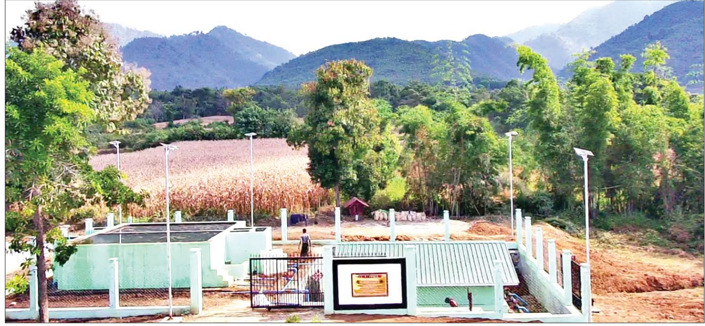
မဲခေါင်-လန်ချန်း ပူးပေါင်းဆောင်ရွက်မှု အထူးရန်ပုံငွေဖြင့် ရေသန့်စင်စနစ်ပါဝင်သော ကျေးလက်ရေရရှိရေးလုပ်ငန်း ဆောင်ရွက်ထားရှိမှုကို တွေ့ရစဉ်။

မဲခေါင်-လန်ချန်းစီမံကိန်း ရည်ရွယ်ချက် မဲခေါင်-လန်ချန်းစီမံကိန်းကို မဲခေါင်ဒေသတွင်း