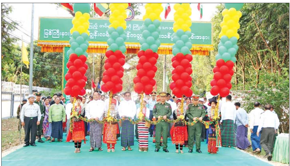
နေရောင်အောက်က သက်ရှိတွေကို စောင့်ရှောက်ဖို့ အိုဇုန်းလွှာကို ထိန်းသိမ်းစို့

ကြသည်။ ဦးစွာ မြစ်ကြီးနားမြို့နယ် စည်ပင်သာယာရေး အဖွဲ့မှ တာဝန်ရှိသူတစ်ဦးက ကတ္တရာလမ်းသစ်နှင့် ပတ်သက်၍ ရှင်းလင်းပြောကြားပြီး ရပ်ကွက်နေ ပြည်သူတစ်ဦးက ကျေးဇူးတင်စကား ပြန်လည် ပြောကြားသည်။ ထို့နောက် ပြည်နယ်ဝန်ကြီးချုပ်၊ တိုင်းမှူးနှင့် တာဝန်ရှိသူများက နိုင်လွန်ကတ္တရာ လမ်းသစ်ဖွင့်ပွဲအထိမ်းအမှတ် မုခ်ဦးကို ဖဲကြိုးဖြတ် ဖွင့်လှစ်ပေးပြီး ဇော်ဂျွန်းလမ်းနိုင်လွန်ကတ္တရာ လမ်းသစ်အား လှည့်လည်ကြည့်ရှုခဲ့ကြောင်း သိရ သည်။ သတင်းစဉ်