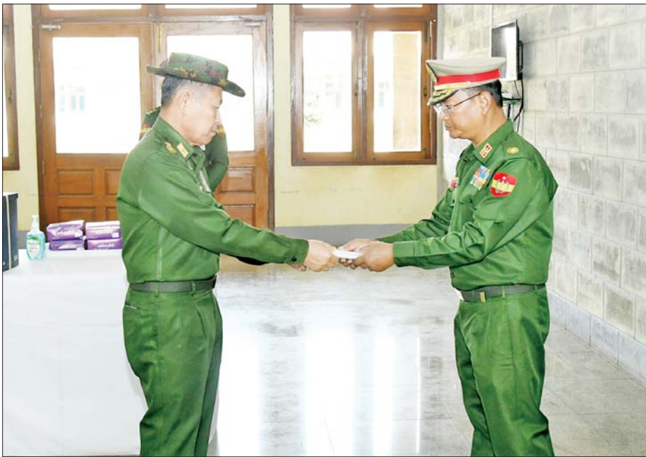
နိုင်ငံတော်စီမံအုပ်ချုပ်ရေးကောင်စီဒုတိယဥက္ကဋ္ဌ ဒုတိယတပ်မတော်ကာကွယ်ရေးဦးစီးချုပ် ကာကွယ်ရေးဦးစီးချုပ်(ကြည်း) ဒုတိယဗိုလ်ချုပ်မှူးကြီး စိုးဝင်း အောင်ပန်းမြို့ရှိ တပ်မတော်ဆေးရုံ၌ တာဝန်ထမ်းဆောင်လျက်ရှိသည့် ကျန်းမာရေးဝန်ထမ်းများအတွက် ချီးမြှင့်ငွေများ ပေးအပ်စဉ်။

( ၃-၉-၂၀၂၄ ရက်နေ့တွင် နိုင်ငံတော်စီမံအုပ်ချုပ်ရေးကောင်စီဥက္ကဋ္ဌ နိုင်ငံတော် ဝန်ကြီးချုပ် ဗိုလ်ချုပ်မှူးကြီး မင်းအောင်လှိုင် ရှမ်းပြည်နယ် အစိုးရအဖွဲ့ဝင်များ၊ ပြည်နယ်နှင့် ခရိုင်အဆင့် ဌာနဆိုင်ရာတာဝန်ရှိသူများအား ပြောကြားသည့် အမှာ စကားမှ ကောက်နုတ်ချက် )