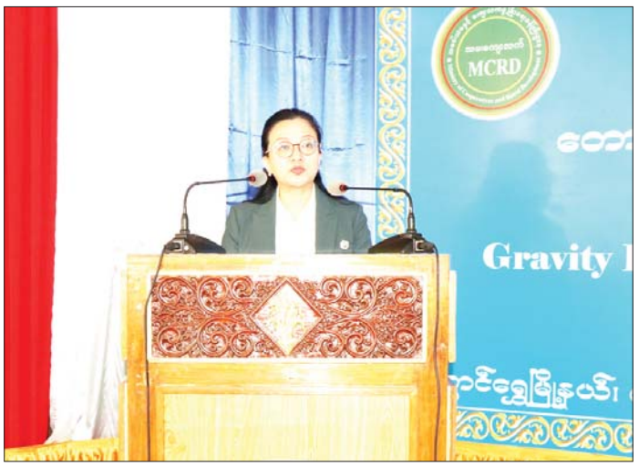
ကျေးလက်ရေရရှိ ရေး စီမံကိန်း ပြီးမြောက်ခြင်း အခမ်း အနားတွင် မြန်မာနိုင်ငံ ဆိုင်ရာ တရုတ်ပြည်သူ့ သမ္မတ နိုင်ငံ သံအမတ်ကြီး H.E. Ms. Ma Jia မိန့်ခွန်း ပြောကြားစဉ်။

ကျေးရွာနေ တိုင်းရင်းသူတစ်ဦးက “အရင်က ကျွန်မတို့ရွာလေးဟာ ရေရှားပါးမှုဒဏ်ကို အတော် လေး ခံစားခဲ့ရပါတယ်။ အိမ်တွေ၊ စာသင်ကျောင်း တွေအတွက် လိုအပ်တဲ့ သောက်ရေ၊ သုံးရေကို ရွာနဲ့