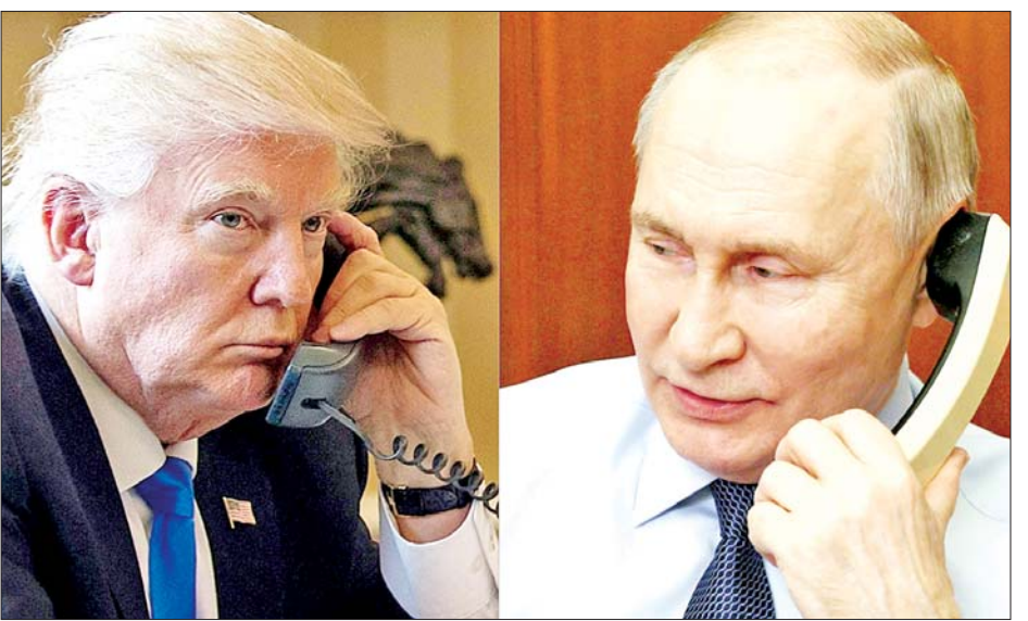
ဖြေရှင်းရန် လိုအပ်ကြောင်းနှင့် ရုရှား၏ တရားဝင် သင့်ကြောင်း အဆိုပါရုံးက ပြောကြားသည်။ လိုခြုံရေး အကျိုးစီးပွားများကို ထည့်သွင်းစဉ်းစား ကိုကား-အင်န်အိတ်ချ်ကော့ ဘာသာပြန်-အောင်ကျော်ကျော်

ဆိုင်ရာ အဆောက်အအုံများကို ရက်ပေါင်း ၃၀ ကြာ တိုက်ခိုက်ခြင်းမှ ရှောင်ရှားရန် သမ္မတ ဒေါ်နယ်ထရမ်၏ အဆိုပြုချက်ကို ရုရှားသမ္မတ ပူတင်က အပြုသဘောဖြင့် တုံ့ပြန်ခဲ့ကြောင်း ကရင်မလင်က ပြောကြားသည်။ ထို့ပြင် ရုရှား-ယူကရိန်း ပဋိပက္ခကို ဖြေရှင်းရန် ကြိုးပမ်းမှုအဖြစ် ရုရှားနှင့် အမေရိကန် ကျွမ်းကျင်သူ အဖွဲ့များ ဖွဲ့စည်းရန် သဘောတူညီခဲ့ကြောင်း အဆိုပါ ရုံးက ဆိုသည်။ ပဋိပက္ခများ ပြင်းထန်လာခြင်းကို တားဆီးရန် အဓိက ဆောင်ရွက်ရမည်မှာ ယူကရိန်းအား နိုင်ငံခြား စစ်ဘက်ဆိုင်ရာ အကူအညီများနှင့် ထောက်လှမ်းရေး သတင်းများ ပေးအပ်ခြင်းကို အပြီးအပြတ် ရပ်ဆိုင်းရန်ဖြစ်ကြောင်း ကရင်မလင်က ပြောသည်။ ထို့ပြင် အကျပ်အတည်း၏ မူလစစ်ဖြစ်မှုကို