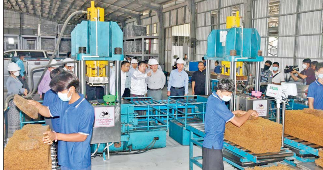
နိုင်ငံတော်စီမံအုပ်ချုပ်ရေးကောင်စီအတွင်းရေးမှူး ဗိုလ်ချုပ်ကြီး အောင်လင်းဒွေးနှင့်အဖွဲ့ဝင်များ မော်လမြိုင်မြို့ ကျောက်တန်းစက်ရုံစု နယ်မြေရှိ M Rubber စက်ရုံတွင် ရော်ဘာကုန်ကြမ်းများအား စက်ယန္တရားများအသုံးပြု၍ အရည်အသွေးမြင့်ရော်ဘာများအဖြစ် အဆင့်ဆင့် ထုတ်လုပ်နေမှုကို လှည့်လည်ကြည့်ရှုစဉ်။