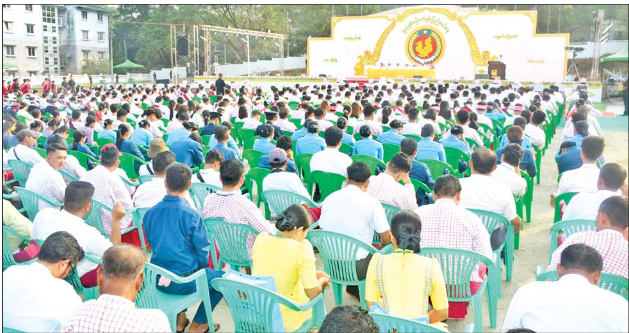
နိုင်ငံတော်စီမံအုပ်ချုပ်ရေးကောင်စီဥက္ကဋ္ဌ နိုင်ငံတော်ဝန်ကြီးချုပ် ဗိုလ်ချုပ်မှူးကြီး သတိုးမဟာသရေစည်သူ သတိုးသီရိသုဓမ္မ မင်းအောင်လှိုင် တံမှပေးပို့သည့် ၂၀၂၅ ခုနှစ် (၅၁)နှစ်မြောက် မွန်ပြည်နယ်နေ့ အထိမ်းအမှတ်သဝဏ်လွှာကို နိုင်ငံတော်စီမံအုပ်ချုပ်ရေးကောင်စီအတွင်းရေးမှူး ဗိုလ်ချုပ်ကြီး အောင်လင်းဒွေးက ဖတ်ကြားစဉ်။

အုပ်ချုပ်ရေးကောင်စီဥက္ကဋ္ဌ နိုင်ငံ တော်ဝန်ကြီးချုပ် ဗိုလ်ချုပ်မှူးကြီး သတိုးမဟာသရေစည်သူ သတိုး သီရိသုဓမ္မ မင်းအောင်လှိုင်တံမှ ပေးပို့သည့် ၂၀၂၅ခုနှစ် (၅၁)နှစ် မြောက် မွန်ပြည်နယ်နေ့အထိမ်း အမှတ်သဝဏ်လွှာကို နိုင်ငံတော် စီမံအုပ်ချုပ်ရေးကောင်စီအတွင်းရေး မှူး ဗိုလ်ချုပ်ကြီး အောင်လင်းဒွေး က ဖတ်ကြားသည်။ ယင်းနောက် မွန်ပြည်နယ် ဝန်ကြီးချုပ် ဦးအောင်ကြည်သိန်း က (၅၁)နှစ်မြောက် မွန်ပြည်နယ် နေ့အထိမ်းအမှတ် နှုတ်ခွန်းဆက် စကားပြောကြား၍ အခမ်းအနား ကို ရုပ်သိမ်းလိုက်သည်။ ဆက်လက်၍ နိုင်ငံတော်စီမံ အုပ်ချုပ်ရေးကောင်စီအတွင်းရေး မှူး ဗိုလ်ချုပ်ကြီး အောင်လင်းဒွေး နှင့် အဖွဲ့သည် မော်လမြိုင်မြို့ ပြည်နယ်ခန်းမ၌ ကျင်းပသည့် (၅၁)နှစ်မြောက် မွန်ပြည်နယ်နေ့ အထိမ်းအမှတ် ပြည်နယ်ဂုဏ်ထူး ဆောင်ဆုများ ချီးမြှင့်ခြင်းအခမ်း အနားသို့ တက်ရောက်ကြသည်။ အခမ်းအနားတွင် ပြည်နယ် ဝန်ကြီးချုပ် ဦးအောင်ကြည်သိန်း က ဂုဏ်ပြုစကား ပြောကြားသည်။ ထို့နောက် နိုင်ငံတော်စီမံ အုပ်ချုပ်ရေးကောင်စီအတွင်းရေး မှူး ဗိုလ်ချုပ်ကြီး အောင်လင်းဒွေး နှင့် ကောင်စီအဖွဲ့ဝင်များက ပြည်နယ်ဂုဏ်ထူးဆောင်ထူးချွန် ဆုများဖြစ်ကြသည့် စီးပွားရေး ထူးချွန်မှု ဂုဏ်ထူးဆောင်ဆု၊ စိုက်ပျိုးရေးထူးချွန်မှု ဂုဏ်ထူး ဆောင်ဆု၊ မွေးမြူရေးထူးချွန်မှု ဂုဏ်ထူးဆောင်ဆု၊ စက်မှုလက်မှု ထူးချွန်မှုဂုဏ်ထူးဆောင်ဆု၊ စီမံ ထူးချွန်မှုဂုဏ်ထူးဆောင်ဆု၊ စီမံ ခန့်ခွဲရေးထူးချွန်မှု ဂုဏ်ထူးဆောင် ဆု၊ ဝန်ဆောင်မှုထူးချွန်မှုဂုဏ်ထူး ဆောင်ဆုနှင့် လူမှုရေးထူးချွန်မှု ဂုဏ်ထူးဆောင်ဆုများကို