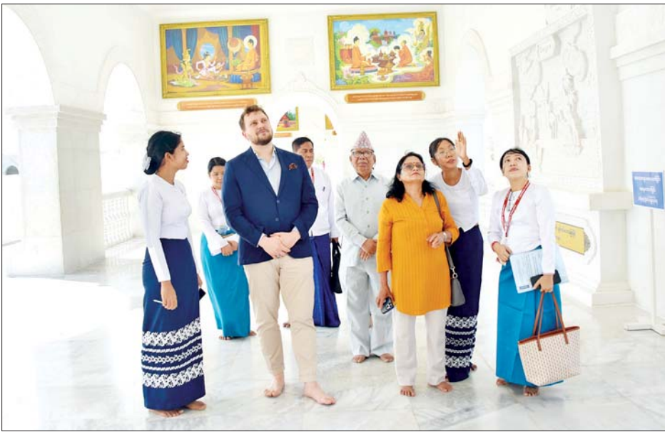
နိုင်ငံတကာမှ ပထဝီစီးပွားရေးနှင့် ပထဝီနိုင်ငံရေးဆိုင်ရာ ကျွမ်းကျင်ပညာရှင်များ၊ လေ့လာသုံးသပ်သူများ မာရဝိဇယဗုဒ္ဓရုပ်ပွားတော်မြတ်ကြီးတွင် လှည့်လည်ဖူးမြော်ကြည့်ညှိကြစဉ်။

ဝန်ကြီး ဦးရဲတင့်၊ ဒေါ်နန္ဒာ၊ ဌာနဆိုင်ရာ တာဝန်ရှိသူများ၊ တရုတ်၊ ရုရှား၊ အိန္ဒိယ၊ ဂျပန်၊ ထိုင်း၊ အီတလီ၊ နီပေါ နိုင်ငံတို့မှ ပထဝီစီးပွားရေးနှင့် ပထဝီနိုင်ငံရေးဆိုင်ရာ ကျွမ်းကျင်ပညာရှင်များနှင့် ဖိတ်ကြားထားသူများ တက်ရောက်ကြသည်။ ရင်းရင်းနှီးနှီးနှုတ်ဆက် ညစာစားပွဲ မစတင်မီ ပြည်ထောင်စုဝန်ကြီးများက ညစာစားပွဲသို့ တက်ရောက်လာကြသော နိုင်ငံတကာမှ ပထဝီစီးပွားရေးနှင့် ပထဝီနိုင်ငံရေးဆိုင်ရာ ကျွမ်းကျင်ပညာရှင်များ၊ လေ့လာသုံးသပ်သူများအား ရင်းရင်းနှီးနှီး လိုက်လံနှုတ်ဆက်သည်။ ထို့နောက် “ရွှေမြန်မာနိုင်ငံ (Golden Land Myanmar)” မှတ်တမ်း Video Clip ကို ဖွင့်လှစ်ပြသသည်။ ယင်းနောက် ပြည်ထောင်စုဝန်ကြီး ဦးမောင်မောင်အုန်းက မိမိအနေဖြင့် အဆွေတော်တို့ကို မြန်မာနိုင်ငံ၏မြို့တော် နေပြည်တော်၌ ယခုကဲ့သို့ ညစာစားပွဲဖြင့်