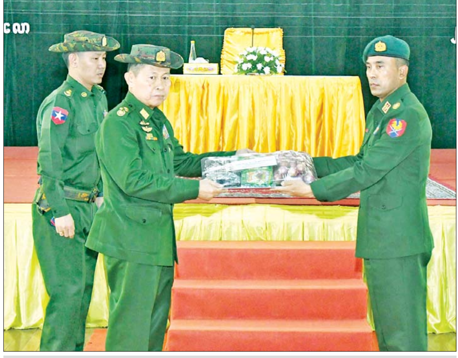
နိုင်ငံတော်စီမံအုပ်ချုပ်ရေးကောင်စီဒုတိယဥက္ကဋ္ဌ ဒုတိယတပ်မတော်ကာကွယ်ရေးဦးစီးချုပ် ကာကွယ်ရေးဦးစီးချုပ်(ကြည်း) ဒုတိယဗိုလ်ချုပ်မှူးကြီးစိုးဝင်း ကလောတပ်နယ်မှ အရာရှိ၊ စစ်သည်၊ မိသားစုများအတွက် စားသောက်ဖွယ်ရာများ ပေးအပ်စဉ်။

ရှင်းလင်းပြောကြား ဦးစွာ နိုင်ငံတော်စီမံအုပ်ချုပ်ရေးကောင်စီဒုတိယဥက္ကဋ္ဌ ဒုတိယတပ်မတော်ကာကွယ်ရေးဦးစီးချုပ်(ကြည်း) ဒုတိယဗိုလ်ချုပ်မှူးကြီးစိုးဝင်းက အမှာစကား ပြောကြားရာတွင် နိုင်ငံတော်၏ နိုင်ငံရေးဖြစ်ပေါ်ပြောင်းလဲမှုများ၊ ၂၀၂၀ ပြည့်နှစ် ပါတီစုံဒီမိုကရေစီ အထွေထွေ ရွေးကောက်ပွဲတွင် အာဏာရပါတီ အစိုးရအနေဖြင့် ထပ်မံ၍ နိုင်ငံတော်၏ အာဏာကို ဥပဒေနှင့်မညီဘဲ