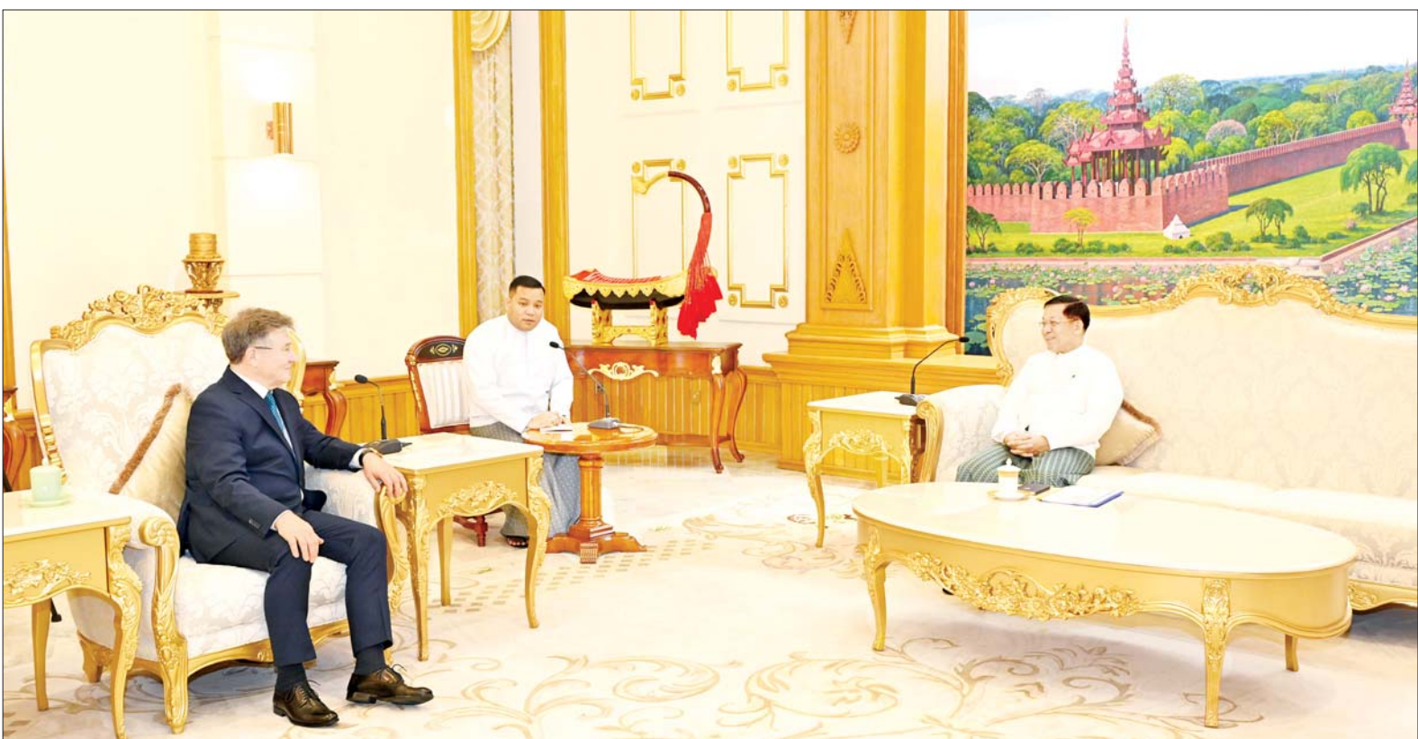
နိုင်ငံတော်စီမံအုပ်ချုပ်ရေးကောင်စီဥက္ကဋ္ဌ နိုင်ငံတော်ဝန်ကြီးချုပ် ဗိုလ်ချုပ်မှူးကြီးမင်းအောင်လှိုင် မြန်မာနိုင်ငံဆိုင်ရာ ရုရှားဖက်ဒရေးရှင်းနိုင်ငံ သံအမတ်ကြီး H.E. Mr. Iskander Azizov အား လက်ခံတွေ့ဆုံစဉ်။

● ရှေးဦးမှ ခရီးစဉ်ဖြစ်ခဲ့မှု အခြေအနေများ၊ ချစ်ကြည်ရေးခရီးစဉ်အတွင်း ရရှိခဲ့ သည့် သဘောတူညီချက်များကို ဆက်လက်အကောင်အထည်ဖော် ဆောင်ရွက်လျက်ရှိမှု အခြေအနေ များနှင့် ဆွေးနွေးရန်ကျန်ရှိသည့် အချက်များကို ဆက်လက် ဆွေးနွေး အကောင်အထည်ဖော် ဆောင်ရွက်သွားမည့် အခြေအနေ များ၊ မြန်မာနိုင်ငံနှင့် ရုရှားနိုင်ငံ လွှတ်တော်များအကြား ပူးပေါင်း ဆောင်ရွက်မှုများ တိုးမြှင့် ဆောင်ရွက်သွားမည့် အခြေအနေ များနှင့် ရုရှားဖက်ဒရေးရှင်းနိုင်ငံ လွှတ်တော်များသို့ လေ့လာရေး အဖွဲ့များ စေလွှတ်သွားမည့် အခြေ အနေများ၊ ကာကွယ်ရေးပိုင်း ဆိုင်ရာများ၊ လူသားချင်းစာနာ ထောက်ထားမှုဆိုင်ရာကိစ္စရပ်များ နှင့် အခြားကဏ္ဍပေါင်းစုံ၌ ပူးပေါင်း ဆောင်ရွက်မှုများ ဆက်လက် တိုးမြှင့်သွားမည့် အခြေအနေများ နှင့် နှစ်နိုင်ငံအကြားချစ်ကြည်ရေး ခရီးစဉ်များ အပြန်အလှန်လည်ပတ် ရေးဆိုင်ရာကိစ္စရပ်များကို ရင်းနှီး ပွင့်လင်းစွာ အမြင်ချင်းဖလှယ် ဆွေးနွေးခဲ့ကြကြောင်း သိရ သည်။