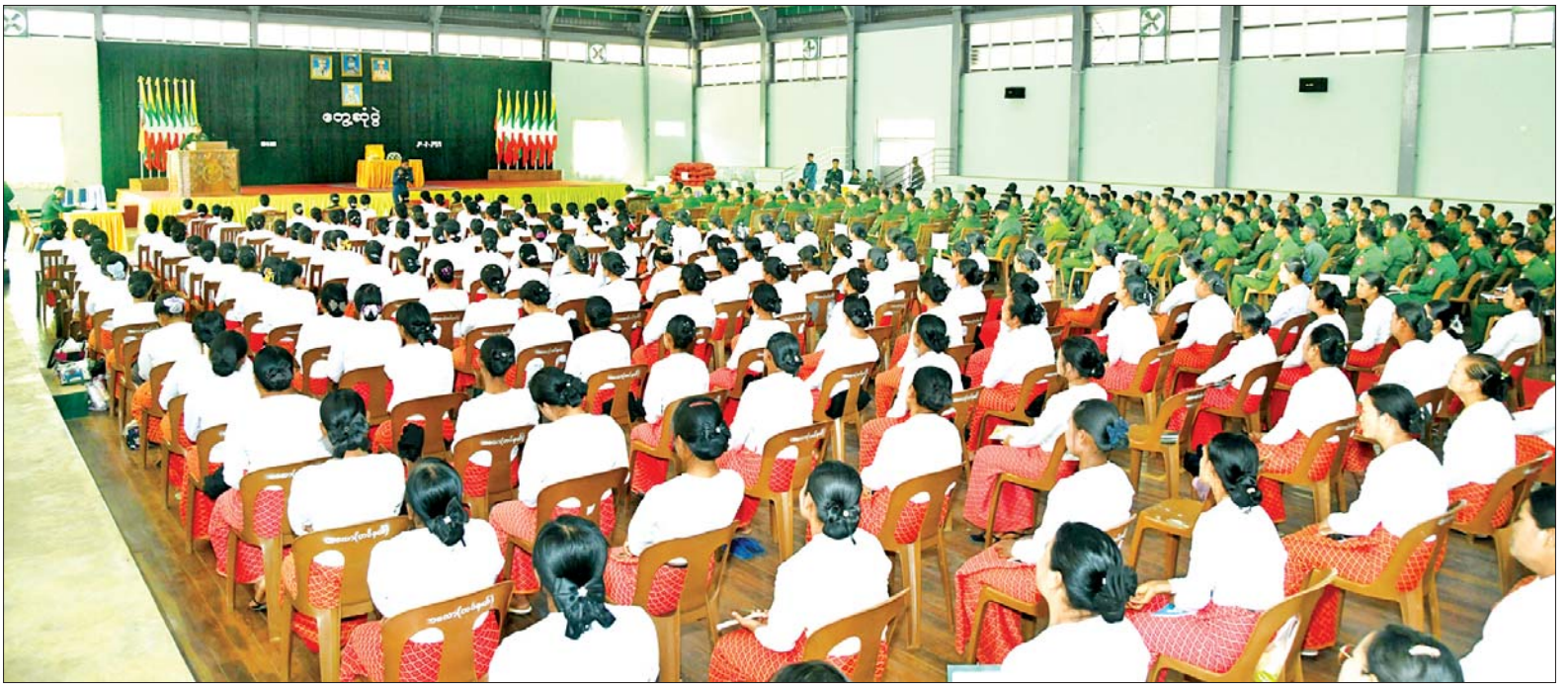
နိုင်ငံတော်စီမံအုပ်ချုပ်ရေးကောင်စီဒုတိယဥက္ကဋ္ဌ ဒုတိယတပ်မတော်ကာကွယ်ရေးဦးစီးချုပ် ကာကွယ်ရေးဦးစီးချုပ်(ကြည်း) ဒုတိယဗိုလ်ချုပ်မှူးကြီးစိုးဝင်း ကလောတပ်နယ်မှ အရာရှိ၊ စစ်သည်၊ မိသားစုများအား တွေ့ဆုံအမှာစကား ပြောကြားစဉ်။

○ ကျောမိုးမှ ကာကွယ်ရေး ဦးစီးချုပ်ရုံးမှ တပ်မတော် အရာရှိကြီးများ၊ အရှေ့ပိုင်းတိုင်း စစ်ဌာနချုပ် တိုင်းမှူးနှင့် တာဝန်ရှိသူများ၊ ကလောတပ်နယ်မှ အရာရှိ၊ စစ်သည်၊ မိသားစုများ တက်ရောက်ကြသည်။