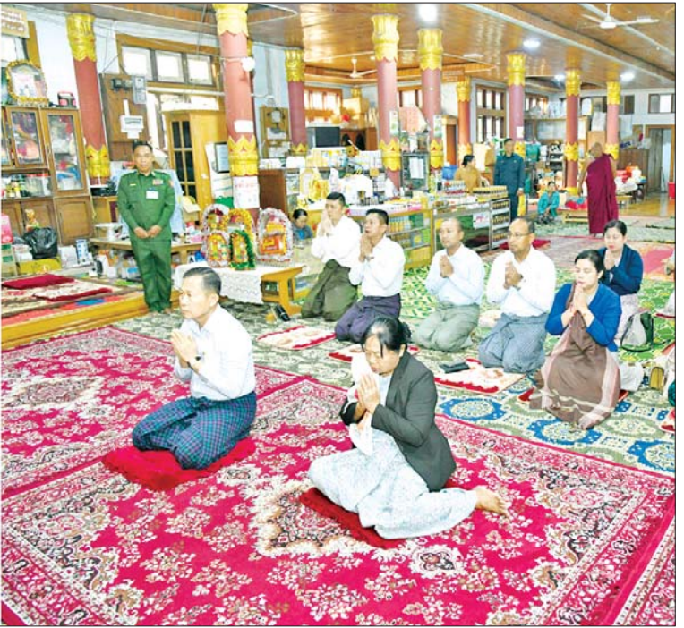
နိုင်ငံတော်စီမံအုပ်ချုပ်ရေးကောင်စီဒုတိယဥက္ကဋ္ဌ ဒုတိယတပ်မတော်ကာကွယ်ရေးဦးစီးချုပ် ကာကွယ်ရေးဦးစီးချုပ်(ကြည်း) ဒုတိယဗိုလ်ချုပ်မှူးကြီးစိုးဝင်းနှင့် ဇနီး ဒေါ်သန်းသန်းနွယ် ကလောမြို့ရှိ ဆုတောင်းပြည့်နီးဘုရားအား ဖူးမြော်ကြည်ညိုစဉ်။

ကျန်းမာရေး စသည့်ကဏ္ဍများ၌ အနည်းနှင့်အများဆိုသလို အခက်အခဲများ ရှိနိုင်သည့်အတွက် တာဝန်ရှိသူများ အနေဖြင့် မျက်ခြည်မပြတ် ကြည့်ရှုပြီး အချိန်မီဖြည့်ဆည်း ပံ့ပိုးဆောင်ရွက်ပေးနိုင်ရန် လိုအပ်ကြောင်း၊ ၎င်းအပြင် သက်ဆိုင်ရာ ကွပ်ကဲအုပ်ချုပ်သည့် တပ်မှူးများအနေဖြင့်လည်း မိမိတပ်ရင်း/တပ်ဖွဲ့ရှိ အရာရှိ စစ်သည်၊ မိသားစုဝင်များအတွက် လိုအပ်သည့် အုပ်ချုပ်ထောက်ပံ့မှုဆိုင်ရာ ကိစ္စရပ်များကို တပ်မှူးကောင်း စိတ်ဓာတ်ဖြင့် ညီညွတ်မျှတစွာ အုပ်ချုပ်ကွပ်ကဲကာ လိုအပ်သည်များ ဖြည့်ဆည်းဆောင်ရွက်ပေးသွားကြရန် လိုကြောင်း၊ အုပ်ချုပ်မှုနှင့် သက်သာချောင်ချိမှုများ အားကောင်းပါက စိတ်ဓာတ်သည်လည်း အလိုလိုအားကောင်း လာမည်ဖြစ်ကြောင်း၊ တပ်မတော်အနေဖြင့် စစ်သည်အဆင့်အတန်း အားလုံးကို အဆင့်အလိုက် လျော်ညီသည့် ရပိုင်ခွင့်များ၊ ခံစားခွင့်များ ပေးထားပြီးဖြစ်ကြောင်း၊ ရသင့်ရထိုက်သည်များ မှန်မှန်ကန်ကန်