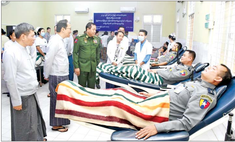
ဒုတိယဝန်ကြီး ဗိုလ်ချုပ် အောင်ကျော်ကျော်၊ ကျန်းမာရေးဝန်ကြီးဌာန ဒုတိယဝန်ကြီး ဒေါက်တာအေးထွန်း၊ ပြည်ထဲရေးဝန်ကြီးဌာနနှင့် ကျန်းမာရေးဝန်ကြီးဌာန တို့မှ အမြဲတမ်းအတွင်းဝန်များ၊ ညွှန်ကြားရေးမှူး

နှစ်(၈၀)ပြည့် တပ်မတော်နေ့ကို ကြိုဆိုဂုဏ်ပြုသောအားဖြင့် ပြည်ထဲရေးဝန်ကြီးဌာန မြန်မာနိုင်ငံရဲတပ်ဖွဲ့ဝင်များနှင့် စာရေးဝန်ထမ်းများသည် နေပြည်တော် ဧည့်သည်တော်များအဖွဲ့ဝင်များနှင့် နေပြည်တော်မြို့နယ်ရှိ ဧည့်သည်တော်များအဖွဲ့ဝင်များ (ခုတင်-၁၀၀၀)နှင့် ဧည့်သည်တော်များအဖွဲ့ဝင်များ (ခုတင်-၁၀၀၀) တို့၌ ယနေ့စုပေါင်းသွေးလှူဒါန်းကြသည်။ ယနေ့နံနက်ပိုင်းတွင် အဆိုပါအဖွဲ့ဝင်များသည် မြန်မာနိုင်ငံရဲတပ်ဖွဲ့ဌာနချုပ်ရှိ ဌာနကြီးများနှင့် တပ်ဖွဲ့များမှ တပ်ဖွဲ့ဝင်နှင့် စာရေးဝန်ထမ်းစုစုပေါင်း ၁၈၂ ဦးတို့က ဂုဏ်ပြုသွေးလှူဒါန်းကြသည်။ သွေးလှူရှင်တပ်ဖွဲ့ဝင်နှင့် စာရေးဝန်ထမ်းများကို ပြည်ထဲရေးဝန်ကြီးဌာန ပြည်ထောင်စုဝန်ကြီး ဒုတိယဗိုလ်ချုပ်ကြီး ထွန်းထွန်းနောင်၊ ကျန်းမာရေး ဝန်ကြီးဌာန ပြည်ထောင်စုဝန်ကြီး ပါမောက္ခ ဒေါက်တာ သက်ခိုင်ဝင်း၊ ပြည်ထဲရေးဝန်ကြီးဌာန