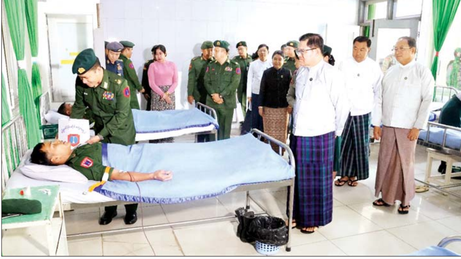
ဦးစွာ အရာရှိ၊ စစ်သည်၊ မိသားစုဝင်များ၊ မြန်မာနိုင်ငံ ရဲတပ်ဖွဲ့ဝင်များ၊ မြန်မာနိုင်ငံ စီးသတ်တပ်ဖွဲ့ဝင်များ၊ ဌာနဆိုင်ရာ ဝန်ထမ်းများ၊ စေတနာရှင် သွေးအလှူရှင် ပြည်သူများ စုစုပေါင်း ၁၈၅ ဦးတို့အား လိုအပ်သည့် ကျန်းမာရေးစစ်ဆေးပေးခြင်း၊ သွေးပေါင်ချိန်ခြင်းနှင့် သွေးအုပ်စု ခွဲခြားခြင်းများ ဆောင်ရွက်ပေးပြီး သတ်မှတ်နေရာများ၌ စုပေါင်းသွေးလှူဒါန်းကြသည်။ ထိုသို့ သွေးလှူဒါန်းနေမှုများကို ကချင်ပြည်နယ် ဝန်ကြီးချုပ်၊ တိုင်းမှူးနှင့် တာဝန်ရှိသူများက လိုက်လံကြည့်ရှုအားပေးကာ သွေးအလှူရှင်များအတွက် အာဟာရဖြည့်စွက်စာပေးအပ်ရာ များ ချီးမြှင့်ပေးအပ်ခဲ့ကြောင်း သိရသည်။ သတင်းစဉ်

နှစ်(၈၀)ပြည့် တပ်မတော်နေ့ကို ကြိုဆိုဂုဏ်ပြုသောအားဖြင့် စုပေါင်းသွေးလှူဒါန်းပွဲကို ယနေ့နံနက်ပိုင်းတွင် ကချင်ပြည်နယ် မြစ်ကြီးနားမြို့ရှိ နယ်မြေခံ တပ်မတော်ဆေးရုံနှင့် ကချင်ပြည်နယ်အစိုးရအဖွဲ့ရုံးရှိ ဆမားဒူပါဆင်းဒါးနော်ခန်းမတို့၌ ကျင်းပရာ ကချင်ပြည်နယ်ဝန်ကြီးချုပ် ဦးခက်ထိန်နန်၊ မြောက်ပိုင်းတိုင်းစစ်ဌာနချုပ် တိုင်းမှူး ဗိုလ်ချုပ် အောင်ဇော်ထွန်းနှင့် တာဝန်ရှိသူများ၊ အရာရှိ၊ စစ်သည်၊ မိသားစုဝင်များ၊ မြန်မာနိုင်ငံ ရဲတပ်ဖွဲ့ဝင်များ၊ မြန်မာနိုင်ငံ စီးသတ်တပ်ဖွဲ့ဝင်များ၊ ဌာနဆိုင်ရာ ဝန်ထမ်းများ၊ စေတနာရှင် သွေးအလှူရှင် ပြည်သူများ တက်ရောက်ကြသည်။