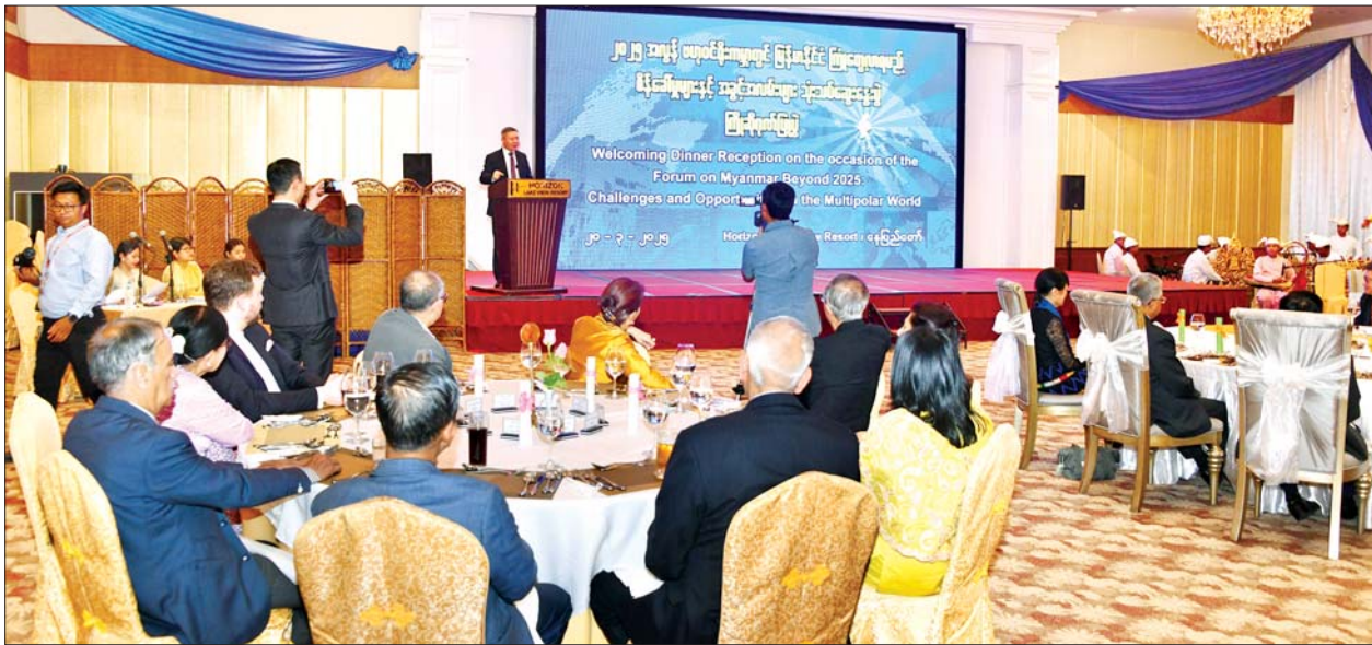
“၂၀၂၅ အလွန် ဗဟုဝင်ရိုးကမ္ဘာတွင် မြန်မာနိုင်ငံ ကြုံတွေ့လာရမည့် စိန်ခေါ်မှုများနှင့် အခွင့်အလမ်းများ” သုံးသပ်ဆွေးနွေးပွဲသို့ တက်ရောက်လာသူများအား ကြိုဆိုဂုဏ်ပြုညစာစားပွဲအခမ်းအနားတွင် တရုတ်ပြည်သူ့သမ္မတနိုင်ငံ Fudan တက္ကသိုလ်မှ ပါမောက္ခ Mr.Zhang Wei နှုတ်ခွန်းဆက်စကားပြောကြားစဉ်။

○ စာမျက်နှာ ၈ မှ ဖြစ်ပေါ်လာစေရေး ကြိုးပမ်းနိုင်မည်ဖြစ်ပြီး ယင်းလမ်းကို ဗီယက်နမ်နိုင်ငံအထိ ဆွဲဆန့်နိုင်ပါသည်။ တစ်ချိန်တည်းမှာပင် မြန်မာနိုင်ငံအနေဖြင့် တရုတ်-မြန်မာစီးပွားရေးစင်္ကြံ (CMEC) ကို အိန္ဒိယနိုင်ငံအထိ တိုးချဲ့ ရန်ကြိုးပမ်းနိုင်ပါသည်။ သို့သော် အဆိုပါ အချက်သည် ၂၀၂၄ ခုနှစ် အောက်တိုဘာလက ကျင်းပခဲ့သည့် Kazan BRICS ထိပ်သီးဆွေးနွေးပွဲအပြီးတွင် နှစ်နိုင်ငံဆက်ဆံရေးပုံမှန်အခြေအနေ ရောက်လာသည့် တရုတ်နှင့် အိန္ဒိယနိုင်ငံတို့အကြားတွင် လေးလေးနက်နက် ဆွေးနွေးပြောဆိုရန် လိုအပ်ပါလိမ့်မည်။ ရေကြောင်းလမ်းကို ကြည့်မည်ဆိုပါက မြန်မာ နိုင်ငံသည် စစ်တွေနှင့် ကျောက်ဖြူဆိုသည့်