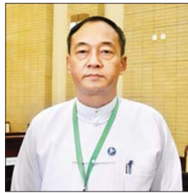
ဗိုလ်မှူးကြီး ဝဏ္ဏအောင်

ငြိမ်းချမ်းရေးစကားပိုင်းကို သုံးရက်တာ ကျင်းပဆောင်ရွက်သွားမှာဖြစ်ပါတယ်။ ဒီလိုဆောင်ရွက်တဲ့အခါမှာ နိုင်ငံရေးနဲ့၊ လုံခြုံရေးကဏ္ဍ၊ စီးပွားရေးနဲ့ နိုင်ငံတော်ဖွံ့ဖြိုးတိုးတက်ရေး ကဏ္ဍတို့ကို အဖွဲ့နှစ်ဖွဲ့ ခွဲပြီး ဆွေးနွေးသွားကြမှာဖြစ်ပါတယ်။ ဆွေးနွေးမယ့် ခေါင်းစဉ်အနေနဲ့ နိုင်ငံရေးနဲ့ လုံခြုံရေးကဏ္ဍမှာ တော့ လက်ရှိမြန်မာငြိမ်းချမ်းရေးလုပ်ငန်းစဉ်နဲ့ အနာဂတ်အလားအလာ၊ ပဋိပက္ခလျော့ချရေးနဲ့ ပစ်ခတ်တိုက်ခိုက်မှုရပ်စဲရေး လုပ်ငန်းစဉ်တစ်ရပ်ဖြစ်ပေါ်ရေး၊ နိုင်ငံတကာဆက်ဆံရေး၊ ဒေသတွင်းနိုင်ငံတကာ ပူးပေါင်းဆောင်ရွက်မှုနဲ့ မြန်မာ့ငြိမ်းချမ်းရေး အခန်းကဏ္ဍ၊ ရွေးကောက်ပွဲ၊ လုံခြုံရေး၊ တည်ငြိမ်ရေးနဲ့ တရားဥပဒေစိုးမိုးရေးဆိုင်ရာတို့ကို ဆွေးနွေးကြမှာဖြစ်ပါတယ်။ စီးပွားရေးနဲ့ နိုင်ငံတော်ဖွံ့ဖြိုးတိုးတက်ရေးကဏ္ဍမှာတော့ ငြိမ်းချမ်းရေး