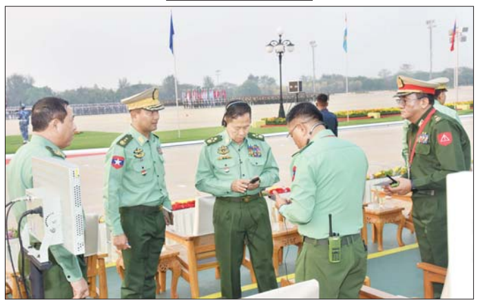
နိုင်ငံတော်စီမံအုပ်ချုပ်ရေးကောင်စီ ဒုတိယဥက္ကဋ္ဌ ဒုတိယတပ်မတော်ကာကွယ်ရေးဦးစီးချုပ် ကာကွယ်ရေးဦးစီးချုပ်(ကြည်း) ဒုတိယဗိုလ်ချုပ်မှူးကြီး စိုးဝင်း ပြည်ပဧည့်သည်တော်ကြီးများအတွက် SIS (Simultaneous Interpretation System) ဘာသာပြန်စက်တပ်ဆင်ထားရှိမှုကို ကြည့်ရှုစစ်ဆေးစဉ်။

အတွင်း ချီတက်ဝင်ရောက်နေရာယူမှုများ၊ နှစ်(၈၀) ပြည့်တပ်မတော်နေ့ စစ်ရေးပြအခမ်းအနားသို့ တက်ရောက်လာကြမည့် ဧည့်သည်တော်ကြီးများအတွက် ထိုင်ခုံနေရာချထားမှုများ၊ ပြည်ပဧည့်သည်တော်ကြီးများအတွက် SIS (Simultaneous Interpretation System) ဘာသာပြန်စက် တပ်ဆင်ထားရှိမှုများ၊ မြင်းစီးတပ်နှင့် အရေးကြီးပုဂ္ဂိုလ်များ တန်း ဝင်ရောက်နေရာယူမှုများကို ဦးစွာကြည့်ရှုစစ်ဆေးသည်။ ဆက်လက်၍ နိုင်ငံတော်စီမံအုပ်ချုပ်ရေးကောင်စီ ဒုတိယဥက္ကဋ္ဌ ဒုတိယတပ်မတော်ကာကွယ်ရေးဦးစီးချုပ် ကာကွယ်ရေးဦးစီးချုပ် (ကြည်း) နှင့် အဖွဲ့ဝင်များသည် တပ်မတော်(လေ)မှ လေယာဉ်၊ ရဟတ်ယာဉ်များ၏ အချိန်ကိုက်အုပ်ဖွဲ့၊ ပျံသန်းလေ့ကျင့်မှုများ၊ အလံတော်အဖွဲ့နှင့် စစ်ကြောင်းတပ်ခွဲများ၏ ဝတ်စားဆင်ယင်မှုဆိုင်ရာများ၊ စစ်ရေးပြအလံများ၊ စစ်ရေးပြလက်နက်ငယ်များနှင့်