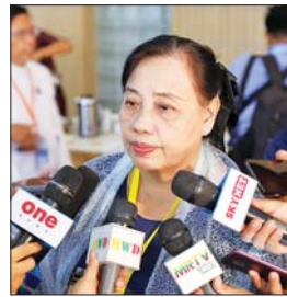
စောမြရာဇာလင်း

ကျွန်ုပ်တို့ NCA ကို လက်မှတ်ရေးထိုးပြီး ၂၁ ရာစုပင်လုံညီလာခံကို ကျင်းပခဲ့ကြတာပါ။ ပင်လုံညီလာခံက သဘောတူညီချက်တွေကိုလည်း ပြန်လည်အကောင်