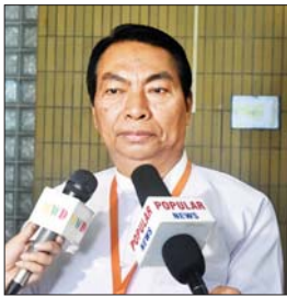
ဒုတိယဗိုလ်ချုပ်ကြီး မြင့်စိုး(ငြိမ်း)

ဒီနေ့အခြေအနေက နိုင်ငံတော်စီမံအုပ်ချုပ်ရေးကောင်စီ တာဝန်ယူနေတဲ့ အချိန်ကာလအတွင်းမှာ တဖြည်းဖြည်းနဲ့ကောင်းမွန်တဲ့ အပြောင်းအလဲဖြစ်ပေါ်လာတယ်ဆိုတဲ့ ပုံသဏ္ဌာန်ပုံရိပ်ကို လူထုက အကဲခတ်လို့ရမှာပါ။ နောက်တစ်ခုကတော့ NUG၊ PDF တွေက ချက်ချင်းပဲ အာဏာပဲ သိမ်းတော့မလို့ အချို့လူထုက ယုံကြည်မှုလွှဲလွှဲလားနဲ့ကြပြီး လေးနှစ်တာကာလမှာ သူတို့မျှော်မှန်းသလို ဘာမှဖြစ်မလာတာ တကယ်ဒုက္ခရောက်ရတာ ပြည်သူတွေပဲဆိုတာ လူထုကသိလာပြီး မျက်စိလည်နေတာကနေ လမ်းမှန်