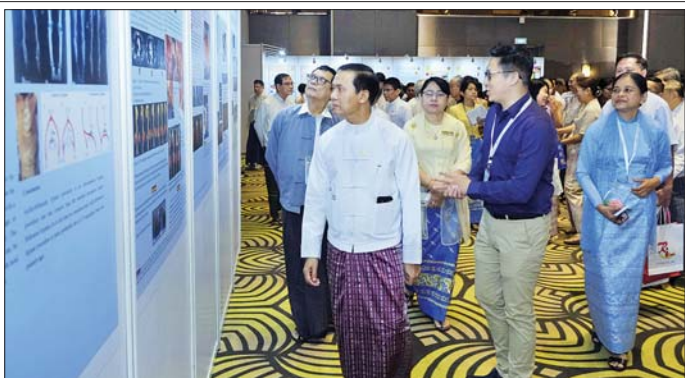
တာဝန်ရှိသူများသည် ညီလာခံကို ဖွင့်လှစ်ပေးပြီး Poster Presentation နှင့် ဆေးနှင့်ဆေးပစ္စည်းပြခန်း များကို လှည့်လည်ကြည့်ရှုသည်။

ကြောင်း၊ ယနေ့ ကျင်းပသည့် ညီလာခံမှတစ်ဆင့် အသိပညာ၊ အတတ်ပညာ နည်းလမ်းသစ်များ လေ့လာဆည်းပူးနိုင်သော အရည်အသွေးပြည့်ဝသည့် သမားကျင့်ဝတ်နှင့်အညီ ပြုမူ ကျင့်ကြံနေထိုင်သော ခွဲစိတ်အထူး ကုပညာရှင်များဖြစ်ပါစေကြောင်း ပြောကြားသည်။