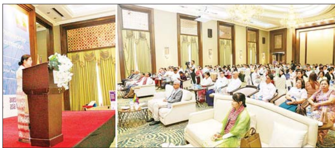
တွင်လည်း အရေးကြီးသည့် အစိုးရကဏ္ဍများတွင် Digital ပိုင်းနှင့် Data သုံးသပ်မှုများကို ဆောင်ရွက်

ဦးစွာ မြန်မာနိုင်ငံတော်ဗဟိုဘဏ်ဥက္ကဋ္ဌက အမှာစကားပြောကြားရာတွင် ၂၀ ရာစု ယနေ့ခေတ် ကာလတွင် စီးပွားရေးနှင့် လူမှုစီးပွားရေးဖွံ့ဖြိုး တိုးတက်မှုများအတွက် ဒစ်ဂျစ်တယ်အသွင် ကူးပြောင်းမှုများကိုပြုလုပ်ရန် အထူးလိုအပ်ကြောင်း၊ ငွေရေးကြေးရေး ကဏ္ဍဆိုင်ရာ လုပ်ငန်းများကို ခေတ်နှင့်အညီဆောင်ရွက်နိုင်စေရန် Public Sector