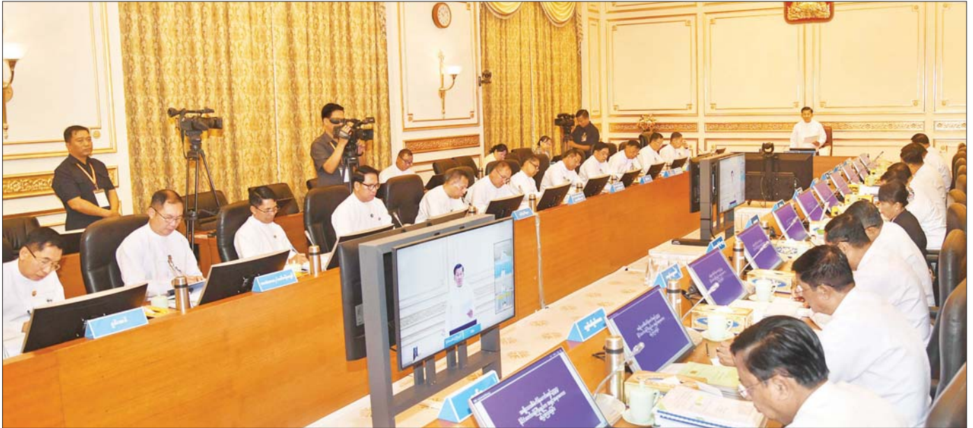
အမျိုးသားစီမံကိန်းကော်မရှင်ဥက္ကဋ္ဌ နိုင်ငံတော်စီမံအုပ်ချုပ်ရေးကောင်စီဥက္ကဋ္ဌ နိုင်ငံတော်ဝန်ကြီးချုပ် ဗိုလ်ချုပ်မှူးကြီး မင်းအောင်လှိုင် အမျိုးသားစီမံကိန်းကော်မရှင်အစည်းအဝေးတွင် အမှာစကားပြောကြားစဉ်။