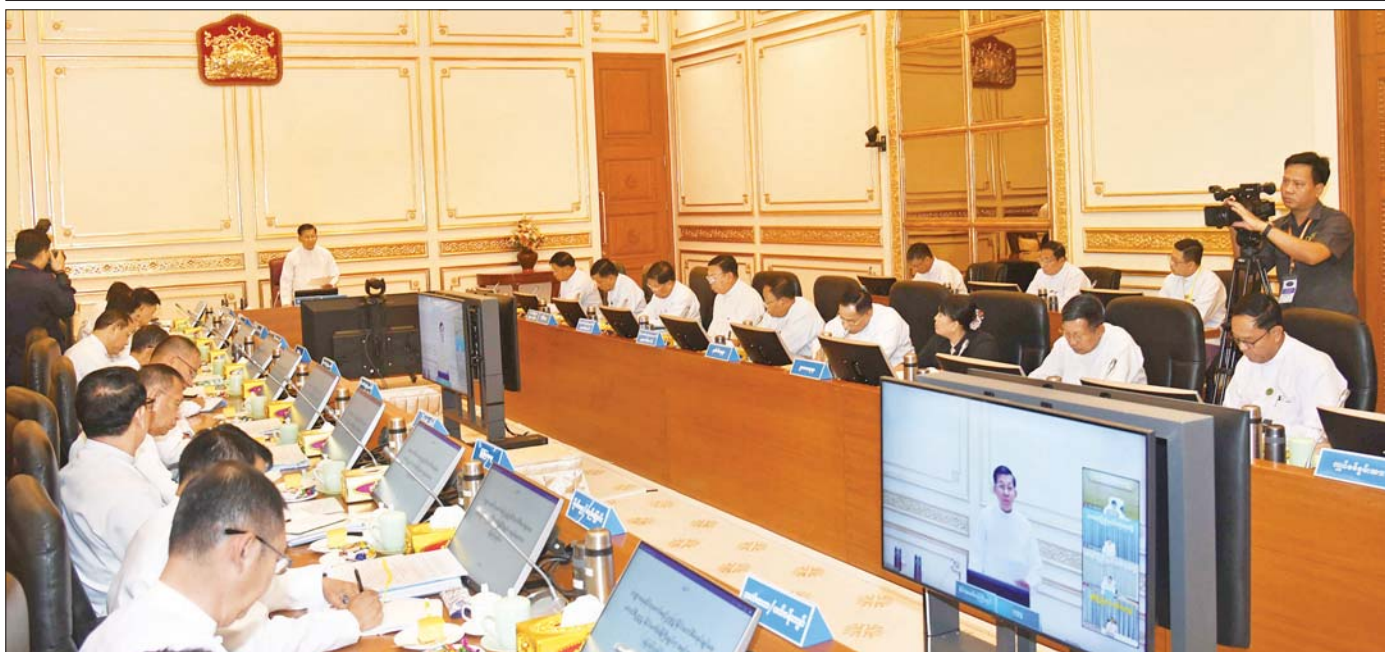
ဘဏ္ဍာရေးဆိုင်ရာကော်မရှင်ဥက္ကဋ္ဌ နိုင်ငံတော်စီမံအုပ်ချုပ်ရေးကောင်စီဥက္ကဋ္ဌ နိုင်ငံတော်ဝန်ကြီးချုပ် ဗိုလ်ချုပ်မှူးကြီး မင်းအောင်လှိုင် ဘဏ္ဍာရေးဆိုင်ရာကော်မရှင်အစည်းအဝေးတွင် အမှာစကားပြောကြားစဉ်။

ဘဏ္ဍာရေးဆိုင်ရာကော်မရှင်ဥက္ကဋ္ဌ နိုင်ငံတော်စီမံအုပ်ချုပ်ရေးကောင်စီဥက္ကဋ္ဌ နိုင်ငံတော်ဝန်ကြီးချုပ် ဗိုလ်ချုပ်မှူးကြီး မင်းအောင်လှိုင် ဘဏ္ဍာရေးဆိုင်ရာကော်မရှင်အစည်းအဝေးသို့ တက်ရောက်အမှာစကားပြောကြား ပြည်သူများကို တိုက်ရိုက်အကျိုးဖြစ်ထွန်းစေမည့် လုပ်ငန်းများကို သတ်မှတ်ထားသည့် အချိန်ကာလအတွင်း အပြည့်အဝ အကောင်အထည်ဖော်ဆောင်ရွက်ပေးနိုင်မှသာ နိုင်ငံတော်၏လူမှုစီးပွားဖွံ့ဖြိုးတိုးတက်မှုကို အထောက်အကူပြုနိုင်မည်