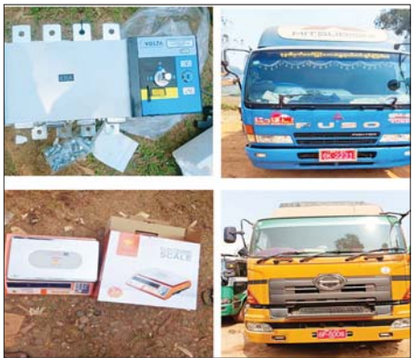
ကရင်ပြည်နယ်၌ ဖမ်းဆီးရမိမှု။

ထို့ပြင် ရန်ကုန်တိုင်းဒေသကြီး တရားမဝင်ကုန်သွယ်မှုတိုက်ဖျက် ရေးအထူးအဖွဲ့၏ စီမံခန့်ခွဲမှုဖြင့် တာဝန်ကျပူးပေါင်းအဖွဲ့များက စစ်ဆေး မှုများဆောင်ရွက်ခဲ့ရာ ဒဂုံမြို့သစ်(တောင်ပိုင်း)မြို့နယ်နှင့် အင်းစိန်မြို့နယ်တို့၌ လိုင်စင်မဲ့မော်တော်ယာဉ်နှစ်စီး ခန့်မှန်းတန်ဖိုး ငွေကျပ် ၁၁,၅၀၀၀၀၀ ကို ဖမ်းဆီးရမိခဲ့ပြီး ပို့ကုန်သွင်းကုန်ဥပဒေနှင့်အညီ အရေးယူဆောင်ရွက်လျက်ရှိသည်။ ယင်းအပြင် အကောက်ခွန်ဦးစီးဌာန၏ စီမံခန့်ခွဲမှုဖြင့် တာဝန်ကျ ပူးပေါင်းအဖွဲ့များက စစ်ဆေးမှုများဆောင်ရွက်ခဲ့ရာ ရန်ကုန်အပြည်ပြည် ဆိုင်ရာလေဆိပ်၌ မြန်မာနိုင်ငံသားခရီးသည် ရှစ်ဦးနှင့် တရုတ်နိုင်ငံသား ခရီးသည် တစ်ဦးတို့၏ ဝန်စည်များအတွင်းမှ တရားဝင်စာရွက်စာတမ်း အထောက်အထားတင်ပြနိုင်ခြင်းမရှိသည့် လူသုံးကုန်ပစ္စည်း ၂၁ မျိုး၊ လုပ်ငန်းသုံးပစ္စည်းခြောက်မျိုး၊ စားသောက်ကုန်ပစ္စည်း နှစ်မျိုး (ခန့်မှန်း တန်ဖိုးငွေကျပ် ၉၁၆၅၀၀၀)ကိုလည်းကောင်း၊ မြန်မာစက်မှုဆိပ်ကမ်း၌ ကုန်သေတ္တာတစ်လုံးအတွင်းမှ တရားဝင်စာရွက်စာတမ်းအထောက် အထား တင်ပြနိုင်ခြင်းမရှိသည့် လုပ်ငန်းသုံးပစ္စည်းတစ်မျိုး (ခန့်မှန်း တန်ဖိုးငွေကျပ် ၁၃၇၀၆၂၈၀) ကို လည်းကောင်း စုစုပေါင်း ခန့်မှန်း တန်ဖိုးငွေကျပ် ၂၂၈၇၁၂၈၀ ကို ဖမ်းဆီးရမိခဲ့ပြီး အကောက်ခွန် လုပ်ထုံးလုပ်နည်းများနှင့်အညီ အရေးယူဆောင်ရွက်လျက်ရှိသည်။ မတ် ၂၃ ရက်တွင် ကရင်ပြည်နယ် တရားမဝင်ကုန်သွယ်မှုတိုက်ဖျက် ရေးအထူးအဖွဲ့၏ စီမံခန့်ခွဲမှုဖြင့် တာဝန်ကျပူးပေါင်းအဖွဲ့က စစ်ဆေးမှု