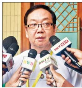
ဒေါက်တာ အောင်မြတ်ဦး

နဲ့ ဖွံ့ဖြိုးတိုးတက်ရေးကြိုးပမ်းရာမှာ စီးပွားရေးဖွံ့ဖြိုးတိုးတက်မှုရဲ့ အရေးပါတာကဏ္ဍ၊ ပဋိပက္ခလျော့ချရေးကာလအတွင်း စီးပွားရေးကြုံကြံခံမှုကို ကြိုးပမ်းရာမှာ ဆက်စပ်တဲ့ကဏ္ဍတွေကို ထည့်သွင်းစဉ်းစားခြင်း၊ ဖွဲ့စည်းပုံအခြေခံဥပဒေပြင်ဆင်ရေးနဲ့ ဒီမိုကရေစီဖက်ဒရယ်ပြည်ထောင်စုကိုပုံဖော်ခြင်းတို့ကို ဆွေးနွေးသွားကြမှာ ဖြစ်ပါတယ်။