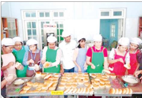
စိုက်ပျိုးရေးကုန်ကြမ်း သီးနှံအခြေခံ တန်ဖိုးမြှင့်စားသောက်ကုန်ထုတ်လုပ်မှုနည်းပညာသင်တန်းများ ဖွင့်လှစ်မှုကို တွေ့ရစဉ်။

“MSME လုပ်ငန်းများမြှင့်တင်ရေးနှင့် ဒစ်ဂျစ်တယ်စီးပွားရေး စဉ်ဆက်မပြတ်ဖွံ့ဖြိုးတိုးတက်ရေးအတွက် အသေးစားနှင့် အငယ်စားစက်မှုလုပ်ငန်းများ၏ ဒစ်ဂျစ်တယ်နည်းပညာကျွမ်းကျင်မှု မြှင့်တင်ခြင်းစီမံကိန်း”ကို အောက်ပါရည်ရွယ်ချက်များဖြင့် ဆောင်ရွက်ခြင်းဖြစ်ပါသည်-