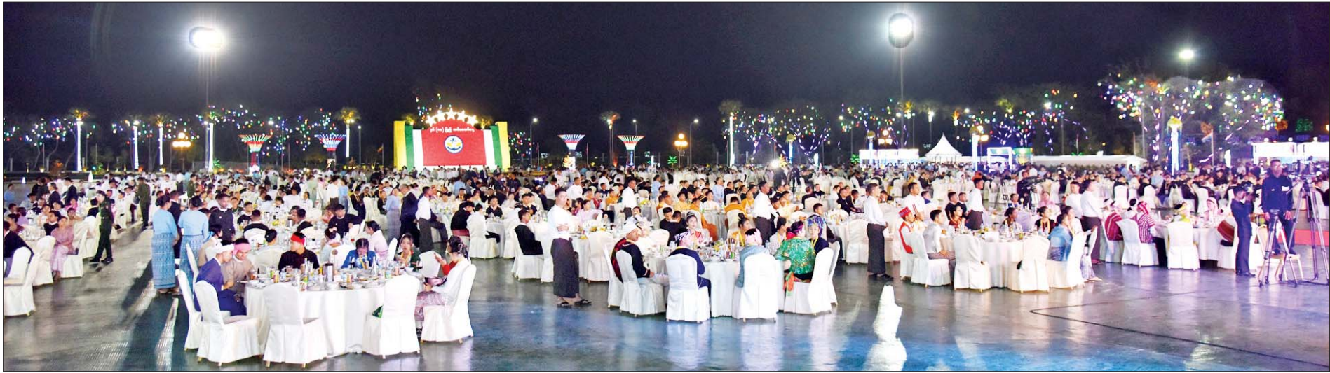
နှစ် (၈၀) ပြည့် တပ်မတော်နေ့အထိမ်းအမှတ် အကြိုဂုဏ်ပြုညစာစားပွဲ အခမ်းအနားကျင်းပစဉ်။

* စာမျက်နှာ ၇ မှ ဖျော်ဖြေတင်ဆက်မှု အပြီးတွင် နိုင်ငံတော်စီမံအုပ်ချုပ်ရေးကောင်စီဥက္ကဋ္ဌ တပ်မတော် ကာကွယ်ရေးဦးစီးချုပ်နှင့် ဇနီးတို့က စစ်သည်၊ စစ်သမီးများအား နှစ်(၈၀)ပြည့် တပ်မတော်နေ့အထိမ်းအမှတ်တရ ဂုဏ်ပြုပုဒ်များဖြင့် အမှတ်ကို ဂုဏ်ပြုသောအားဖြင့် တော်တို့ကို တည်ထောင်ခဲ့ကြသော မင်းသုံးပါးရုပ်တုများကို မီးအလှအပ များဖြင့် လှပစွာဂုဏ်ပြုပုံဖော် ထွန်းညှိ ထားရှိကြောင်းနှင့် တပ်မတော်နေ့ အမှတ်တရ ဂုဏ်ပြုပုဒ်များဖြင့် တက်ရောက်လာကြသူ များအား ရင်းရင်းနှီးနှီး နှုတ်ဆက်ခဲ့ သည်။ နှစ်(၈၀)ပြည့် တပ်မတော်နေ့အထိမ်းအမှတ်ကို ဂုဏ်ပြုသောအားဖြင့် တော်တို့ကို တည်ထောင်ခဲ့ကြသော မင်းသုံးပါးရုပ်တုများကို မီးအလှအပ များဖြင့် လှပစွာဂုဏ်ပြုပုံဖော် ထွန်းညှိ ထားရှိကြောင်းနှင့် တပ်မတော်နေ့ ပထမ၊ ဒုတိယနှင့် တတိယမြန်မာနိုင်ငံ အကြိုဂုဏ်ပြု ညစာစားပွဲအခမ်းအနားသို့ တက်ရောက်လာကြသူများ က စိတ်ချမ်းမြေ့ကြည်နူးစွာ ကြည့်ရှုခဲ့ကြ ကြောင်း သိရသည်။ သတင်းစဉ်