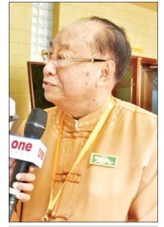
ဦးစိုင်းအိုက်ပေါင်း

ဦးစိုင်းအိုက်ပေါင်း ဥက္ကဋ္ဌ၊ ရှမ်းတိုင်းရင်းသားများ ဒီမိုကရက်တစ်ပါတီ နိုင်ငံတော် အကြီးအကဲက ၂၀၂၅ ဒီဇင်ဘာမှာ ရွေးကောက်ပွဲ ပြုလုပ်သွားမယ်လို့ ပြောကြားထား တယ်။ တိုင်းပြည်က ဒီမိုကရေစီကို သွားမယ်ဆိုရင် ရွေးကောက်ပွဲက မဖြစ်မနေ လုပ်ဆောင်ရမှာဖြစ်ပါ တယ်။ လုံခြုံရေးက ရွေးကောက်ပွဲ အတွက် အင်မတန်အရေးကြီး တယ်။ ပြည်သူလူထု မဲလာပေးတဲ့ အခါမှာ စိုးရိမ်မှုမရှိဖို့လိုပါတယ်။ ဒါကြောင့် ရွေးကောက်ပွဲမတိုင်မီ တိုင်းရင်းသားလက်နက်ကိုင်တွေ အားလုံးကို ဖိတ်ခေါ်ပြီး အားလုံး