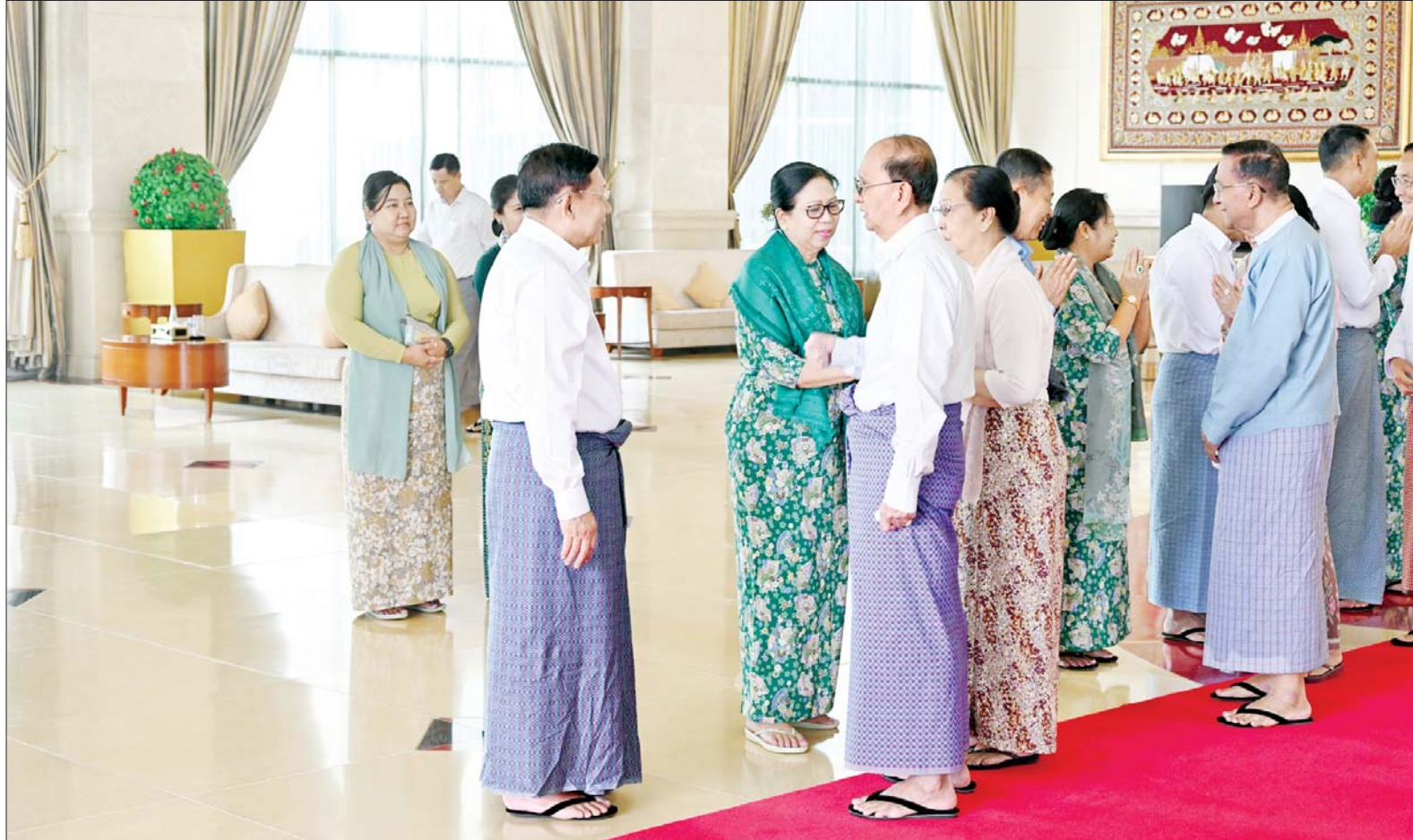
နိုင်ငံတော် စီမံအုပ်ချုပ်ရေး ကောင်စီဥက္ကဋ္ဌ တပ်မတော် ကာကွယ်ရေးဦးစီးချုပ် ဗိုလ်ချုပ် မှူးကြီး မင်းအောင်လှိုင် အငြိမ်းစား တပ်မတော်အရာရှိ ကြီးထံ ဂါရဝပြုလက်ဆောင် ပစ္စည်းများ ရှိသောစွာ ဂါရဝပြု ပေးအပ်စဉ်။