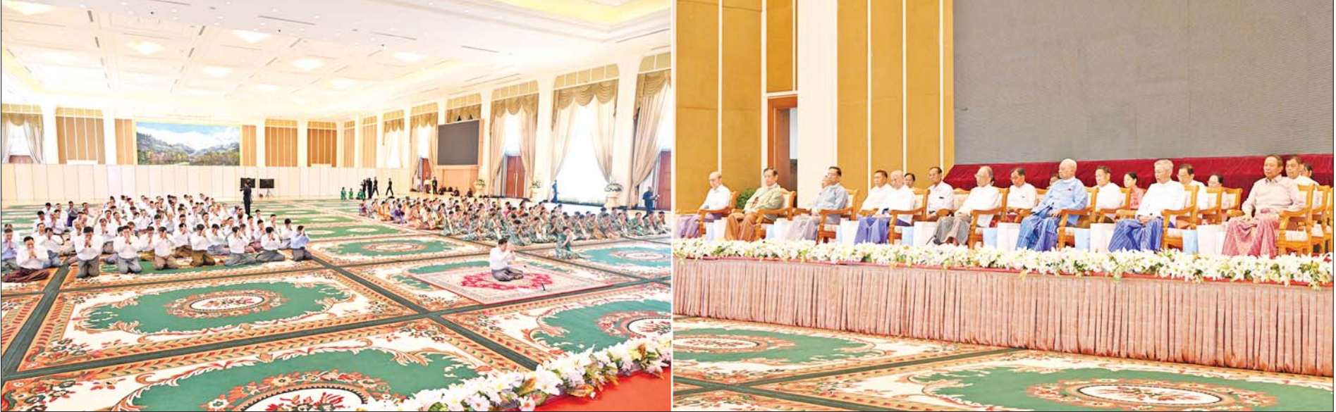
နိုင်ငံတော်စီမံအုပ်ချုပ်ရေးကောင်စီဥက္ကဋ္ဌ တပ်မတော်ကာကွယ်ရေးဦးစီးချုပ် ဗိုလ်ချုပ်မှူးကြီး မင်းအောင်လှိုင်နှင့် ဇနီးဒေါ်ကြူကြူလှ ဦးဆောင်သည့် တပ်မတော်(ကြည်း၊ ရေ၊ လေ) မိသားစုများက နှစ်(၈၀)ပြည့် တပ်မတော်နေ့ အခမ်းအနားသို့ တက်ရောက်ကြမည့် အငြိမ်းစားတပ်မတော်အရာရှိကြီးများအား ဂါရဝပြုကန်တော့စဉ်။