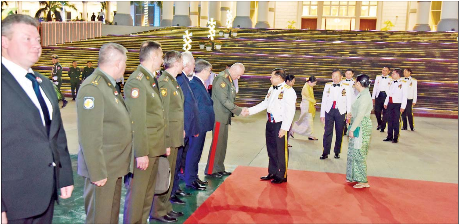
နိုင်ငံတော်စီမံအုပ်ချုပ်ရေးကောင်စီဥက္ကဋ္ဌ တပ်မတော်ကာကွယ်ရေးဦးစီးချုပ် ဗိုလ်ချုပ်မှူးကြီးမင်းအောင်လှိုင်နှင့် ဇနီး ဒေါ်ကြူကြူလှ နှစ်(၈၀)ပြည့် တပ်မတော်နေ့အထိမ်းအမှတ်အကြို ဂုဏ်ပြုညစာစားပွဲအခမ်းအနားသို့ တက်ရောက်လာသည့် ရုရှားဖက်ဒရေးရှင်းနိုင်ငံ ဒုတိယကာကွယ်ရေးဝန်ကြီး Colonel General Alexander Vasilyevich Fomin နှင့် အဖွဲ့ဝင်များအား ရင်းရင်းနှီးနှီးနှုတ်ဆက်စဉ်။

ထို့နောက် နိုင်ငံတော်စီမံအုပ်ချုပ်ရေးကောင်စီဥက္ကဋ္ဌ တပ်မတော်ကာကွယ်ရေးဦးစီးချုပ် ဗိုလ်ချုပ်မှူးကြီး မင်းအောင်လှိုင်နှင့် ဇနီး ဒေါ်ကြူကြူလှတို့သည် နှစ် (၈၀) ပြည့်တပ်မတော်နေ့ အထိမ်းအမှတ် အကြိုဂုဏ်ပြုညစာစားပွဲသို့ တက်ရောက်လာကြသည့် ရုရှားဖက်ဒရေးရှင်းနိုင်ငံ ဒုတိယကာကွယ်ရေးဝန်ကြီး Colonel General Alexander Vasilyevich Fomin