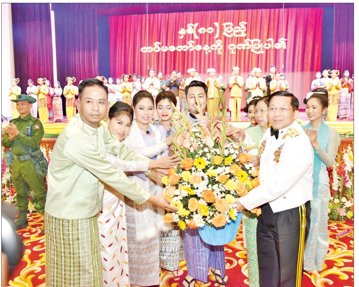
နိုင်ငံတော်စီမံအုပ်ချုပ်ရေးကောင်စီဥက္ကဋ္ဌ တပ်မတော်ကာကွယ်ရေးဦးစီးချုပ် ဗိုလ်ချုပ်မှူးကြီးမင်းအောင်လှိုင်နှင့် ဇနီး ဒေါ်ကြူကြူလှတို့က ဖျော်ဖြေတင်ဆက်ခဲ့ကြသည့် စစ်သည်၊ စစ်သမီးများအား အမှတ်တရဂုဏ်ပြုပန်းခြင်း ပေးအပ်စဉ်။

အထူးဖိတ်ကြားထားသည့် ဧည့်သည်တော်များအား ရင်းရင်းနှီးနှီးနှုတ်ဆက်သည်။ မျိုးချစ်စိတ်ရှင်သန်ထက်မြက်စေမည့် ဂုဏ်ပြုတေးသီချင်းများဖြင့် သီဆိုကပြဖျော်ဖြေ နှစ်(၈၀)ပြည့်တပ်မတော်နေ့ အကြို ဂုဏ်ပြုညစာစားပွဲတွင် ညစာမသုံးဆောင်မီနှင့် သုံးဆောင်နေစဉ်အတွင်း ကာကွယ်ရေးဦးစီးချုပ်ရုံး(ကြည်း) ပြည်သူ့ဆက်ဆံရေးနှင့် စိတ်ဓာတ်စစ်ဆင်ရေးညွှန်ကြားရေးမှူးရုံးကွပ်ကဲမှုအောက် မြဝတီတေးဂီတအဖွဲ့မှ အနုပညာရှင်များ၊ မြန်မာနိုင်ငံရဲတပ်ဖွဲ့မှ အနုပညာရှင်များ၊ ရုရှားတပ်မတော်သံစုံတီးဝိုင်းအဖွဲ့မှ အနုပညာရှင်များက မျိုးချစ်စိတ်ရှင်သန်ထက်မြက်စေမည့် ဂုဏ်ပြုတေးသီချင်းများဖြင့် သီဆိုကပြဖျော်ဖြေကြသည်။ အကြိုဂုဏ်ပြုညစာစားပွဲအပြီးတွင် နိုင်ငံတော်စီမံအုပ်ချုပ်ရေးကောင်စီဥက္ကဋ္ဌ တပ်မတော် ကာကွယ်ရေးဦးစီးချုပ် ဗိုလ်ချုပ်မှူးကြီးမင်းအောင်လှိုင်နှင့်အဖွဲ့ဝင်များက တက်ရောက်လာကြသူများအား ရင်းရင်းနှီးနှီး နှုတ်ဆက်ခဲ့ကာ အခမ်းအနားအောင်မြင်ခြင်း အထိမ်းအမှတ်အဖြစ် မီးရှူးမီးပန်းများ ပစ်ဖောက်မှုကို ကြည့်ရှုအားပေးကြသည်။ ဆက်လက်ပြီး နိုင်ငံတော်စီမံအုပ်ချုပ်ရေးကောင်စီဥက္ကဋ္ဌ တပ်မတော်ကာကွယ်ရေးဦးစီးချုပ် ဗိုလ်ချုပ်မှူးကြီး