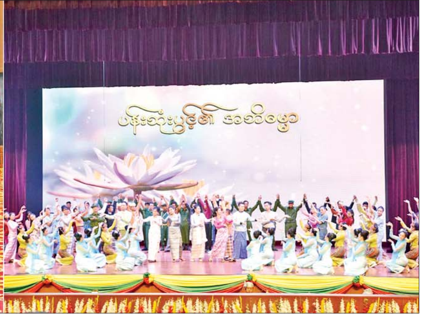
နိုင်ငံတော်စီမံအုပ်ချုပ်ရေးကောင်စီဥက္ကဋ္ဌ တပ်မတော်ကာကွယ်ရေးဦးစီးချုပ် ဗိုလ်ချုပ်မှူးကြီးမင်းအောင်လှိုင်၊ ဇနီး ဒေါ်ကြူကြူလှနှင့် အခမ်းအနားတက်ရောက်လာကြသူများ ပြည်သူ့ဆက်ဆံရေးနှင့် စိတ်ဓာတ်စစ်ဆင်ရေးညွှန်ကြားရေးမှူးရုံး ကွပ်ကဲမှုအောက်ရှိ တပ်ဖွဲ့ဝင်စစ်သည်၊ စစ်သမီးများ၏ “ပန်းသုံးပွင့်၏ အဘိဓမ္မာ” ပြဇာတ်တင်ဆက်ဖျော်ဖြေမှုကို ကြည့်ရှုအားပေးကြစဉ်။