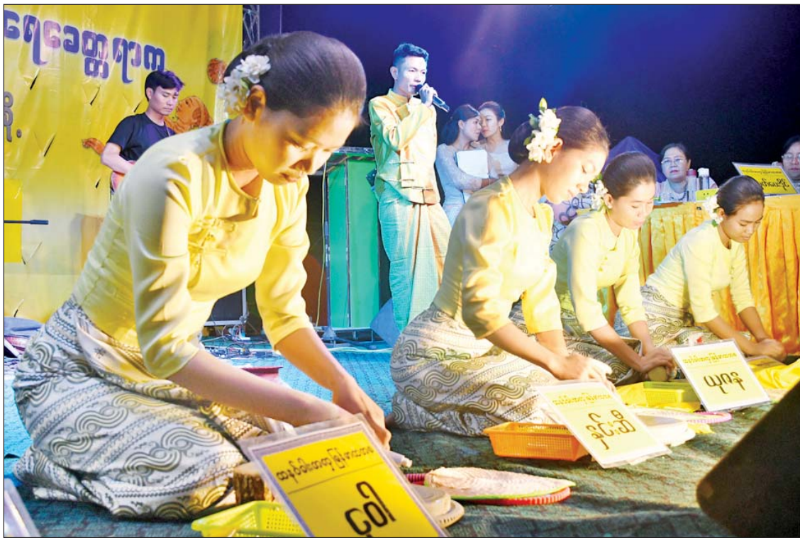
သနပ်ခါးအလှ လိမ်းချယ်ပြိုင်ပွဲတွင် ပါဝင်ယှဉ်ပြိုင်နေကြသူများကို တွေ့ရစဉ်။

(နိုင်ငံတော်စီမံအုပ်ချုပ်ရေးကောင်စီဥက္ကဋ္ဌ တပ်မတော်ကာကွယ်ရေးဦးစီးချုပ် ဗိုလ်ချုပ်မှူးကြီး မင်းအောင်လှိုင် ၏ ၂၀၂၄ ခုနှစ်၊ ဇွန်လ ၇ ရက်နေ့တွင် ပြုလုပ်သော ၂၀၂၄ ခုနှစ်၊ ကာကွယ်ရေးဦးစီးချုပ်ရုံး(ကြည်း၊ ရေ၊ လေ)မိသားစုများ၏ ပထမအကြိမ် မိုးရာသီသစ်ပင်စိုက်ပျိုးပွဲ အခမ်းအနားသို့ တက်ရောက်အမှာစကား ပြောကြားမှုမှ ကောက်နုတ်ချက်)