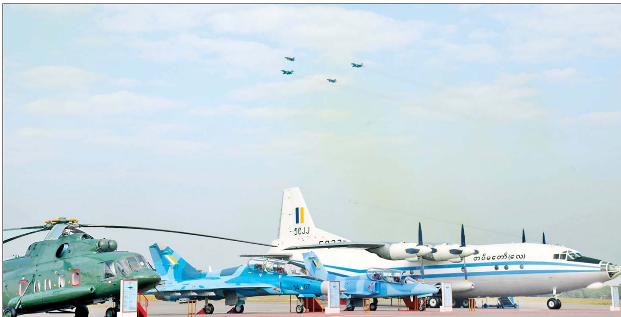
(၁၅-၁၂-၂၀၂၄) ရက်က မိတ္ထီလာတပ်နယ်ရှိ လေကြောင်းအတတ်သင် လေတပ်စခန်းဌာနချုပ်၌ ကျင်းပသည့် တပ်မတော်(လေ)၏ ဖွဲ့စည်းတည်ထောင်မှု(၇၇)နှစ်မြောက် နှစ်ပတ်လည်နေ့အခမ်းအနားနှင့် လေယာဉ်၊ ရဟတ်ယာဉ်များ တပ်တော်ဝင်အခမ်းအနားတွင် လေယာဉ်၊ ရဟတ်ယာဉ်များ စွမ်းရည်ပြသကြစဉ်။