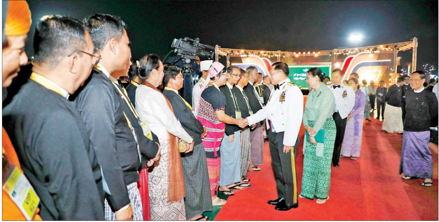
နိုင်ငံတော်စီမံအုပ်ချုပ်ရေးကောင်စီဥက္ကဋ္ဌ တပ်မတော်ကာကွယ်ရေးဦးစီးချုပ် ဗိုလ်ချုပ်မှူးကြီးမင်းအောင်လှိုင်နှင့် ဇနီး ဒေါ်ကြူကြူလှ နှစ်(၈၀)ပြည့် တပ်မတော်နေ့အထိမ်းအမှတ်အကြို ဂုဏ်ပြုညစာစားပွဲအခမ်းအနားသို့ တက်ရောက်လာကြသူများအား ရင်းရင်းနှီးနှီးနှုတ်ဆက်စဉ်။

(လေ) ဗိုလ်ချုပ်ကြီး ထွန်းအောင်နှင့်ဇနီး၊ ကောင်စီအတွင်းရေးမှူးနှင့်ဇနီး၊ တွဲဖက်အတွင်းရေးမှူးနှင့်ဇနီး၊ ကောင်စီဝင်များနှင့်ဇနီးများ၊ ပြည်ထောင်စုအဆင့်ပုဂ္ဂိုလ်များ၊ ပြည်ထောင်စုဝန်ကြီးများနှင့်ဇနီးများ၊ ကာကွယ်ရေးဦးစီးချုပ်ရုံးမှ အဆင့်မြင့်တပ်မတော်အရာရှိကြီးများနှင့် ဇနီးများ၊ ရဲဘော်သုံးကျိပ်ဝင် မိသားစုဝင်များ၊ အငြိမ်းစား တပ်မတော်ကာကွယ်ရေးဦးစီးချုပ်များ၏ မိသားစုဝင်များ၊ အငြိမ်းစား တပ်မတော် (ကြည်း၊ ရေ၊ လေ) အရာရှိကြီးများ၊ လွတ်လပ်ရေးမော်ကွန်းဝင် ပထမအဆင့်၊ ဒုတိယအဆင့်နှင့် တတိယအဆင့် မော်ကွန်းဝင်ပုဂ္ဂိုလ်များ၊ အကြံပေးပုဂ္ဂိုလ်များ၊ ဒုတိယဝန်ကြီးများ၊ တပ်မတော်သား အငြိမ်းစားသံအမတ်ကြီးများ၊ နေပြည်တော်ကောင်စီဝင်များ၊ နိုင်ငံခြားစစ်သံရုံးများမှ စစ်သံမှူးများနှင့် တာဝန်ရှိသူများ၊ တစ်နိုင်လုံး ပစ်ခတ်တိုက်ခိုက်မှုရပ်စဲရေး သဘောတူစာချုပ်(NCA) လက်မှတ်ရေးထိုးထားသည့် တိုင်းရင်းသား လက်နက်ကိုင်အဖွဲ့များမှ ကိုယ်စားလှယ်များ၊ နိုင်ငံရေးပါတီများမှ ဥက္ကဋ္ဌများနှင့် တာဝန်ရှိသူများ၊ အောင်ဆန်းသူရိယာဘွဲ့ ရရှိခဲ့သူများ၏ မိသားစုဝင်များနှင့် ဆွေမျိုးများ၊ စာမျက်နှာ ၇ သို့ *