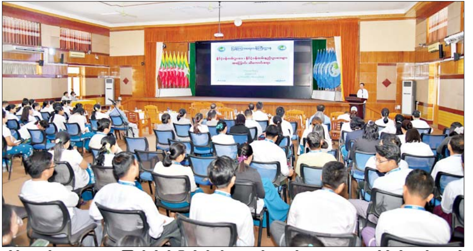
ဆိုင်ရာနည်းဥပဒေများ၊ စာကြည့်တိုက်၊ ပြတိုက်နှင့် တက်ရောက်လာသူများက သိရှိလိုသည်များကို ပြပွဲများ ကြီးကြပ်အုပ်ချုပ်ရေးဥပဒေနှင့် နည်းဥပဒေ မေးမြန်းဆွေးနွေးကြသည်။

ထို့နောက် တာဝန်ရှိသူများက စာချုပ်စာတမ်းများ စိစစ်ခြင်း၊ နိုင်ငံ့ဝန်ထမ်းဥပဒေ၊ နည်းဥပဒေများ၊ ရုပ်မြင်သံကြားနှင့် အသံထုတ်လွှင့်ခြင်းဆိုင်ရာ ဥပဒေ၊ နည်းဥပဒေများ၊ သတင်းမီဒီယာဥပဒေ၊ နည်းဥပဒေများ၊ ပုံနှိပ်ခြင်းနှင့် ထုတ်ဝေခြင်းလုပ်ငန်းဥပဒေ၊ နည်းဥပဒေများ၊ ရုပ်ရှင်ဥပဒေ၊ နည်းဥပဒေများ၊ ရုပ်မြင်သံကြားနှင့် ဗီဒီယိုဥပဒေ၊ ဗီဒီယိုလုပ်ငန်း