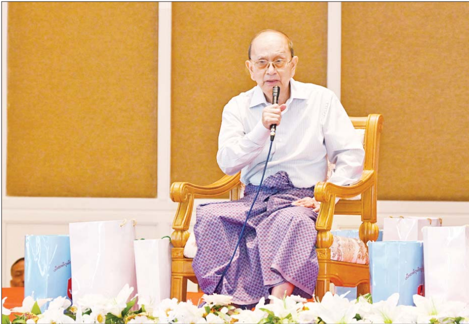
ကန်တော့ခံအငြိမ်းစားတပ်မတော်အရာရှိကြီးများကိုယ်စား ဗိုလ်ချုပ်ကြီး သိန်းစိန်က ဆွေမိမိကောင်းတောင်း စကားနှင့် ဩဝါဒစကားများ ပြောကြားစဉ်။

★ စာမျက်နှာ ၃ မှ ဥပဒေနှင့်အညီသာ ထိန်းထိန်း သိမ်းသိမ်းဖြင့် ဆောင်ရွက်နေခြင်း ဖြစ်ပါကြောင်း၊ နိုင်ငံတော်နှင့် နိုင်ငံသားတို့၏အကျိုးကို တစိုက် မတ်မတ် ဆက်လက်ဖော်ဆောင် သွားမည်ဖြစ်ပါကြောင်း၊ ပြည်သူ ကအားကိုးရသည့် တပ်မတော်၊ တိုင်းပြည်က အားထားရသည့် တပ်မတော်ဖြစ်အောင် ဆောင်ရွက် သွားမည်ဖြစ်ကြောင်း။