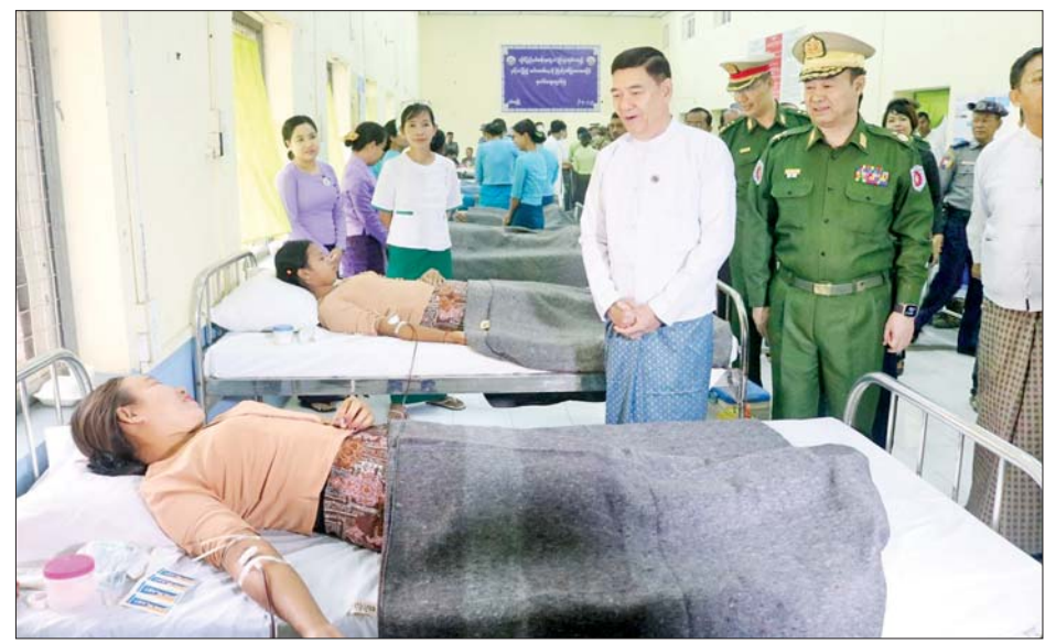
ရခိုင်ပြည်နယ်ဝန်ကြီးချုပ် ဦးထိန်လင်းနှင့် အနောက်ပိုင်းတိုင်းစစ်ဌာနချုပ် တိုင်းမှူး ဗိုလ်ချုပ်ကျော်စွာဦး တို့ သွေးအလှူရှင်များအား ကြည့်ရှုအားပေးစဉ်။

ဦးစွာ ကျန်းမာရေးဝန်ထမ်းများက သွေးအလှူရှင် များအား သွေးအမျိုးအစားခွဲခြင်းနှင့် လိုအပ်သည့် ကျန်းမာရေးစစ်ဆေးမှုများ ဆောင်ရွက်ပေးကြသည်။ ထို့နောက် သွေးအလှူရှင်များက သတ်မှတ်နေရာ အသီးသီး၌ စုပေါင်းသွေးလှူဒါန်းကြသည်။ ထိုသို့ သွေးလှူဒါန်းနေမှုများကို ပြည်နယ်ဝန်ကြီး ချုပ်၊ သက်ဆိုင်ရာတိုင်းစစ်ဌာနချုပ်များမှ တိုင်းမှူး များနှင့် တာဝန်ရှိသူများက လိုက်လံကြည့်ရှုအားပေး ပြီး သွေးအလှူရှင်များအတွက် အာဟာရဖြည့် စားသောက်ဖွယ်ရာများ ပေးအပ်ခဲ့ကြောင်း သိရ သည်။