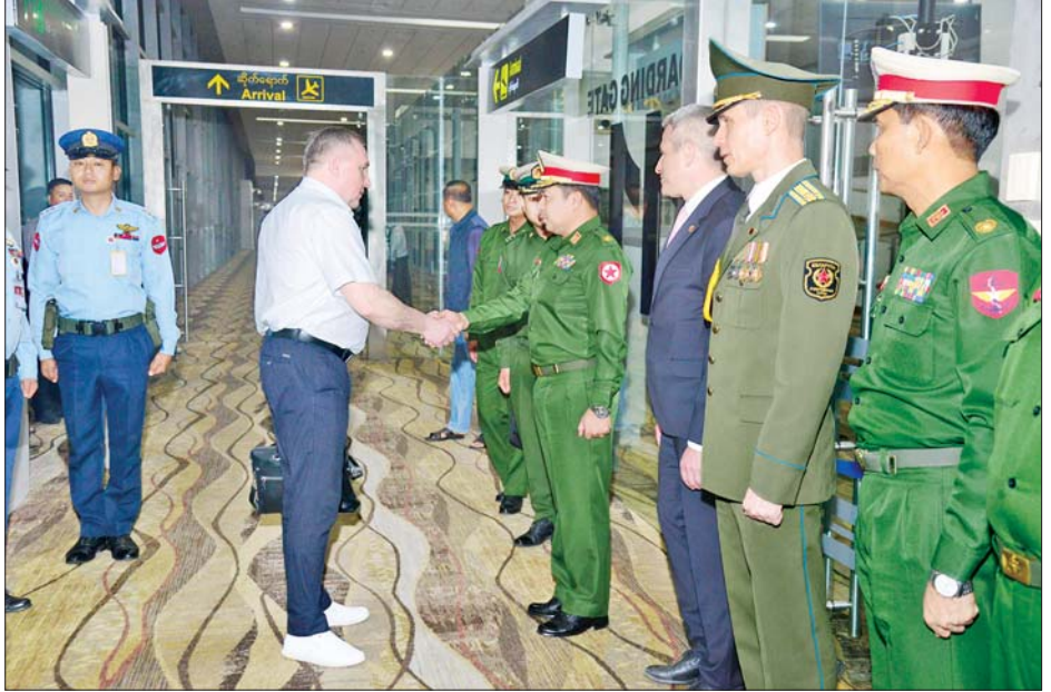
ဘယ်လာရုစ်သမ္မတနိုင်ငံ ကာကွယ်ရေးဝန်ကြီး Lieutenant General Viktor Gennadyevich Khrenin ဦးဆောင်သော ကိုယ်စားလှယ်အဖွဲ့အား ရန်ကုန်တိုင်းစစ်ဌာနချုပ်တိုင်းမှူး ဗိုလ်မှူးချုပ်ပြည့်စုံလင်းနှင့် တာဝန်ရှိသူများက လေဆိပ်၌ ကြိုဆိုနှုတ်ဆက်ကြစဉ်။

နေပြည်တော် မတ် ၂၆ မတ် ၂၇ ရက်တွင် ကျရောက်သည့် နှစ်(၈၀) ပြည့်တပ်မတော်နေ့အခမ်းအနားသို့ တက်ရောက်ရန် ရုရှားဖက်ဒရေးရှင်းနိုင်ငံ ဒုတိယကာကွယ်ရေးဝန်ကြီး Colonel General Alexander Vasilyevich Fomin ဦးဆောင်သော ကိုယ်စားလှယ်အဖွဲ့သည် ယနေ့ နေ့လယ်ပိုင်းတွင် နေပြည်တော်ရှိ တပ်မတော် လေဆိပ်သို့ ရောက်ရှိကြသည်။ အဆိုပါ ရုရှားဖက်ဒရေးရှင်းနိုင်ငံ ဒုတိယကာကွယ်ရေးဝန်ကြီး Colonel General Alexander Vasilyevich Fomin ဦးဆောင်သော ကိုယ်စားလှယ်အဖွဲ့အား နေပြည်တော်တိုင်းစစ်ဌာနချုပ် တိုင်းမှူး