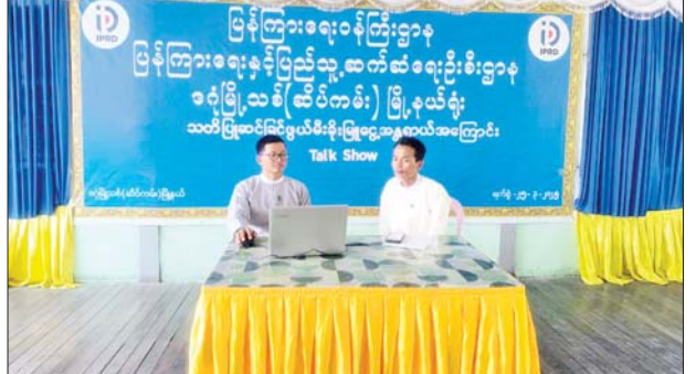
ဒဂုံမြို့သစ်(ဆိပ်ကမ်း)မြို့နယ်၌ မီးခိုးမြူငွေအန္တရာယ်အကြောင်း အသိပညာပေးဆွေးနွေး