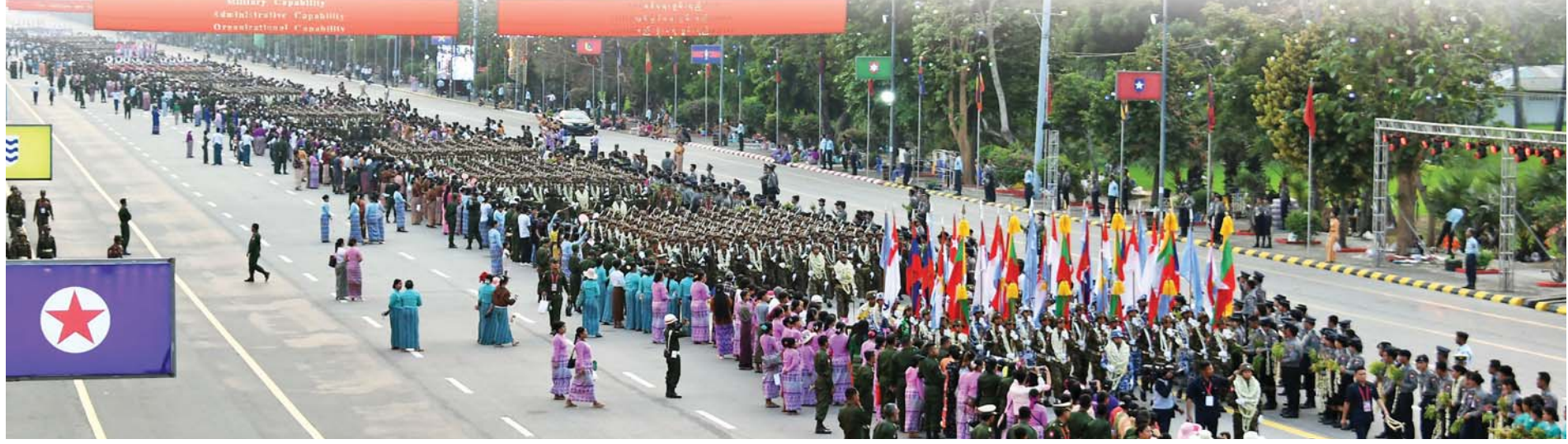
(၂၇-၃-၂၀၂၄)ရက်က ကျင်းပသည့် (၇၉)နှစ်မြောက် တပ်မတော်နေ့အခမ်းအနားတွင် စစ်ရေးပြစစ်ကြောင်းကြီးများ ချီတက်ရာလမ်းတစ်လျှောက် ကာကွယ်ရေးဦးစီးချုပ်ရုံး(ကြည်း)မှ အရာရှိ၊ စစ်သည်၊ မိသားစုများ၊ နေပြည်တော်တိုင်းစစ်ဌာနချုပ်နှင့် တပ်နယ်အသီးသီးမှ အရာရှိ၊ စစ်သည်၊ မိသားစုများ၊ မြန်မာနိုင်ငံရဲတပ်ဖွဲ့ဝင်များနှင့် မိသားစုဝင်များ၊ ရုပ်ရှင်၊ ဂီတ၊ အနုပညာရှင်များ၊ ဒေသခံမိဘပြည်သူများက ဂုဏ်ပြုပန်းကုံးများစွပ်၍ သောင်းသောင်းဖြဖြကြိုဆိုကြစဉ်။

ဆက်လက်၍ အနိုင်ရပါတီအစိုးရကလည်း ၂၀၁၅ ခုနှစ် ပါတီစုံဒီမိုကရေစီ အထွေထွေရွေးကောက်ပွဲတွင် အနိုင်ရခဲ့သောပါတီအစိုးရထံ နိုင်ငံတော်၏ အာဏာကို ဒီမိုကရေစီစနစ်နှင့်အညီ ငြိမ်းချမ်းစွာ လွှဲပြောင်းပေးအပ်ခဲ့ပါသည်။ ၁၉၄၈ ခုနှစ် မြန်မာ့ လွတ်လပ်ရေးရရှိချိန်မှစပြီး ရွေးကောက်ခံအာဏာရ အထူးထုတ် [ ၁ ] သို့ »»