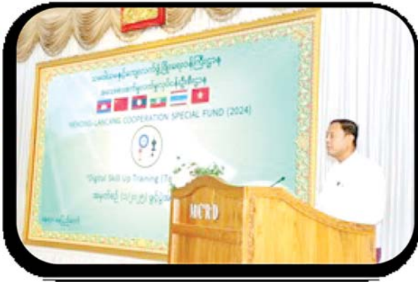
သမဝါယမနှင့် ကျေးလက်ဖွံ့ဖြိုးရေးဝန်ကြီးဌာန ပြည်ထောင်စုဝန်ကြီး ဦးလှမိုး Digital Skill Up (ToT) Training (၁/၂၀၂၅) သင်တန်းဖွင့်ပွဲအခမ်းအနားတွင် အဖွင့်အမှာစကားပြောကြားစဉ်။

စီမံကိန်းများမှရရှိလာမည့် အကျိုးကျေးဇူးများ အဆိုပါစီမံကိန်းများ အကောင်အထည်ဖော်ဆောင်ရွက်ခြင်းဖြင့် မြန်မာနိုင်ငံရှိ စိုက်ပျိုးရေးအခြေခံအသေးစားလုပ်ငန်းများ အားကောင်းလာစေခြင်း၊ ခေတ်မီကုန်ထုတ်လုပ်မှုနည်းပညာများကို အသုံးပြုလာနိုင်ခြင်း၊ အသေးစားကုန်ထုတ်လုပ်ငန်းများ ဖွံ့ဖြိုးတိုးတက်လာစေခြင်း၊ အလုပ်အကိုင်အခွင့်အလမ်းများ ဖန်တီးပေးနိုင်ခြင်း၊ အွန်လိုင်းမှတ်ပုံတင် Platform မှတစ်ဆင့် အသေးစားစက်မှုလုပ်ငန်းများကို ဥပဒေနှင့်အညီ စနစ်တကျဆောင်ရွက်ပေးနိုင်ခြင်း၊ ဌာနရှိဝန်ထမ်းများအား ခေတ်နှင့်အညီ နည်းပညာရပ်ဆိုင်ရာ လုပ်ငန်းစွမ်းဆောင်ရည်များကို မြှင့်တင်ပေးနိုင်ခြင်း၊ နိုင်ငံတစ်ဝန်းရှိ အသေးစားလုပ်ငန်းရှင်များက ဒီဂျစ်တယ်နည်းပညာဆိုင်ရာ အသိပညာ၊ ဗဟုသုတများနှင့် အကျိုးကျေးဇူးများကို သိမြင်နားလည်စေခြင်း၊ MSME လုပ်ငန်းများ၏ ဈေးကွက်ဖွံ့ဖြိုးရေးအတွက် ဒစ်ဂျစ်တယ်နည်းပညာ