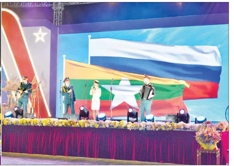
နှစ်(၈၀)ပြည့် တပ်မတော်နေ့အထိမ်းအမှတ်အကြို ဂုဏ်ပြုညစာစားပွဲအခမ်းအနားတွင် ရုရှားတပ်မတော်သံစုံတီးဝိုင်းအဖွဲ့မှ အနုပညာရှင်များက ဂုဏ်ပြုတေးသီချင်းများဖြင့် သီဆိုကပြပျော်ဖြေစဉ်။