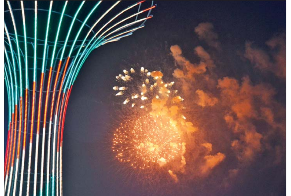
နှစ်(၈၀)ပြည့် တပ်မတော်နေ့ကို ကြိုဆိုဂုဏ်ပြုသည့် အထိမ်းအမှတ်အဖြစ် တပ်မတော်နေ့စစ်ရေးပြကွင်းနှင့် ဘုရင့်နောင်ရိပ်သာတို့မှ မီးရှူးမီးပန်းများ ပစ်ဖောက်စဉ်။