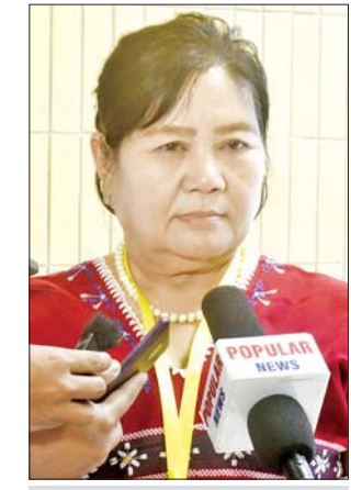
နန်းစေအော

တယ်။ တက်ရောက်လာသူတွေက ပြန်လည်ပြီးတော့ မျှဝေမယ်ဆိုရင် တဖြည်းဖြည်းနဲ့ သိလာကြပြီး တော့ လက်ခံလာမယ်ထင်ပါ တယ်။ ကျွန်မတို့ တိုင်းရင်းသား ဒေသ တွေမှာ ပဋိပက္ခတွေဖြစ်တော့ လုံခြုံမှုက ပိုပြီးတော့ အရေးကြီး ပါတယ်။ လုံခြုံမှုမရှိတဲ့ ဒေသတွေ မှာ ပြည်သူတွေ ဒုက္ခရောက်ကြ ရတယ်။ တိုင်းပြည်အေးအေး ချမ်းချမ်း ပြန်နေနိုင်ဖို့က အစိုးရ မှာ တာဝန်ရှိသလို အခြားအဖွဲ့ အစည်းအသီးသီးနဲ့ ပြည်သူတွေ မှာလည်း တာဝန်ရှိတယ်။ စကား ပိုင်းတွေဆုံ ဆွေးနွေးပွဲမှာ ကဏ္ဍစုံ ကလူတွေပါတယ်။ အထူးသဖြင့် အမျိုးသမီးတွေ၊ လူငယ်တွေနဲ့ မိဒီယာတွေပါ ဆွေးနွေးပွဲမှာ ပါဝင်လာတယ်။ အခုလိုစကားပိုင်း တွေကို သုံးလတစ်ခါ ဒါမှမဟုတ် ခြောက်လတစ်ခါ ပြုလုပ်တဲ့အခါ မှာ အလွှာပေါင်းစုံကလည်း ပါလာ စေချင်တယ်။ အားလုံးပါဝင်မှ ပဋိပက္ခတွေကို ဖြေလျှော့နိုင်မယ်။ ဖြေလျှော့နိုင်မှ ငြိမ်းချမ်းရေး ရလာမယ်။ ငြိမ်းချမ်းရေးရမှ တည်ငြိမ်အေးချမ်း ဖွံ့ဖြိုးတိုးတက် လာမှာ ဖြစ်ပါတယ်။