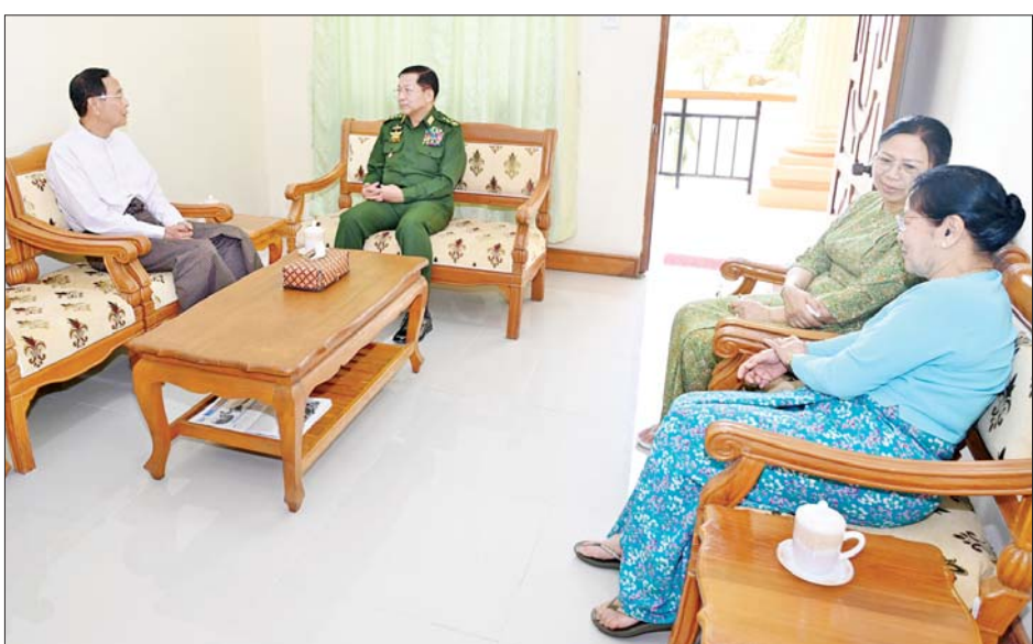
နိုင်ငံတော်စီမံအုပ်ချုပ်ရေးကောင်စီဥက္ကဋ္ဌ တပ်မတော်ကာကွယ်ရေးဦးစီးချုပ် ဗိုလ်ချုပ်မှူးကြီး မင်းအောင်လှိုင်နှင့် ဇနီး ဒေါ်ကြူကြူလှ နှစ် (၈၀)ပြည့် တပ်မတော်နေ့အခမ်းအနားသို့ တက်ရောက်ကြမည့် အငြိမ်းစားတပ်မတော်အရာရှိကြီးများနှင့်ဇနီးများအား တွေ့ဆုံဂါရဝပြုနှုတ်ဆက်စဉ်။