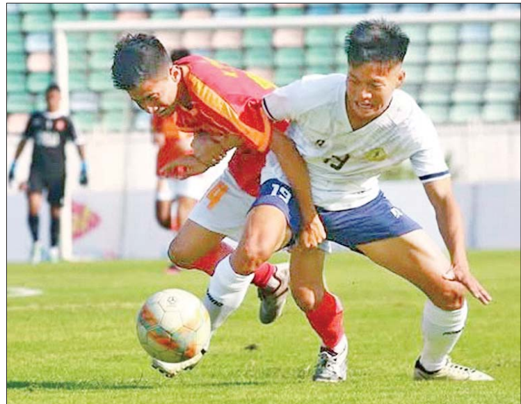
Young Boy အသင်းနှင့် 10/Mon အသင်းတို့ ယှဉ်ပြိုင်ကစားကြစဉ်။