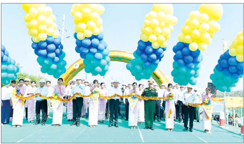
ဖြစ်ပြီး ငရုတ်ကောင်းမြို့ ကမ်းခြေဒေသရှိ များအပြင် ကုန်စည်စီးဆင်းမှုများအတွက် များစွာကျေးရွာများအတွက် ပညာရေး၊ ကျန်းမာရေး၊ အကျိုးပြုမည်ဖြစ်ကြောင်း သိရသည်။ လူမှုရေးကိစ္စရပ်များ၊ ခရီးသွားလာရေးလုပ်ငန်း ကျော်ဟိန်း(ပြန်/ဆက်)

တည်တံ့ခိုင်မြဲအောင် ထိန်းသိမ်းစောင့်ရှောက်သွားကြရန် လိုအပ်ကြောင်း ပြောကြားသည်။ ထို့နောက် တိုင်းဒေသကြီး ဝန်ကြီးချုပ်သည် တာဝန်ရှိသူများနှင့်အတူ ချောင်းဝတံတားအား ဖဲကြိုးဖြတ်ဖွင့်လှစ်ပေးကာ တာဝန်ရှိသူများက အမှတ်တရလက်ဆောင်ပေးအပ်သည်။ ဆက်လက်၍ တိုင်းဒေသကြီး ဝန်ကြီးချုပ်သည် ချောင်းဝတံတားကမ္ဘာ့အမွေအနှစ်ကျောက်စာတိုင်ကို စက်ခလုတ်နှိပ်ဖွင့်လှစ်ပေးပြီး အမွှေးနံ့သာရည်များ ပက်ဖျန်းပေးကာ တံတားသစ်ကို လှည့်လည်ကြည့်ရှုစစ်ဆေးသည်။ အဆိုပါ ငရုတ်ကောင်း-ချောင်းဝ-နံ့သာပု-ဂျိုင်လေး-ဂေါ်ရန်ဂျီလမ်းပေါ်ရှိ ချောင်းဝတံတားကို တိုင်းဒေသကြီး ဘဏ္ဍာရန်ပုံငွေဖြင့် ဆောင်ရွက်ခဲ့ခြင်း