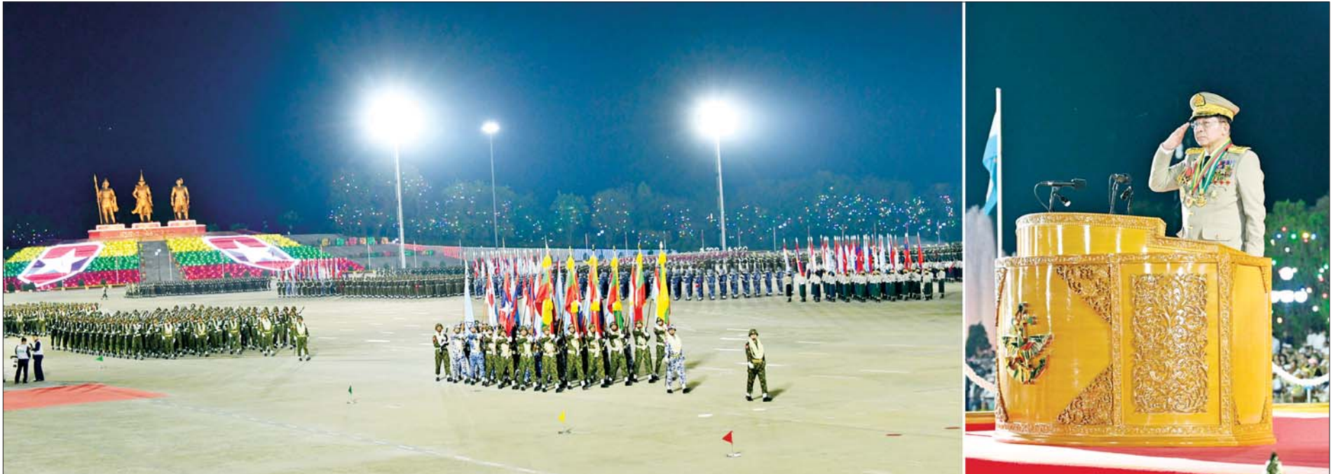
နိုင်ငံတော်စီမံအုပ်ချုပ်ရေးကောင်စီဥက္ကဋ္ဌ တပ်မတော်ကာကွယ်ရေးဦးစီးချုပ် ဗိုလ်ချုပ်မှူးကြီး သတိုးမဟာသရေစည်သူ သတိုးသီရိသုဓမ္မ မင်းအောင်လှိုင်အား စစ်ရေးပြစစ်ကြောင်းကြီးများက ချီတက်အလေးပြုစဉ်။