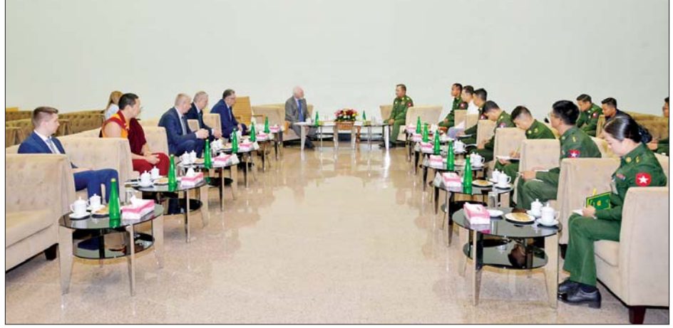
ပြည်သူ့ဆက်ဆံရေးနှင့် စိတ်ဓာတ်စစ်ဆင်ရေးညွှန်ကြားရေးမှူးရုံး ညွှန်ကြားရေးမှူး ဗိုလ်ချုပ်ဇော်မင်းထွန်း ရုရှားဖက်ဒရေးရှင်းနိုင်ငံ ကာကွယ်ရေးဝန်ကြီးဌာန ပြည်သူ့ရေးရာကောင်စီဥက္ကဋ္ဌ Mr. Pavel Nikoleaevich GUSEV နှင့်အဖွဲ့အား လက်ခံတွေ့ဆုံစဉ်။

ဆွေးနွေးကြပြီး အမှတ်တရလက်ဆောင်ပစ္စည်းများ အပြန်အလှန်ပေးအပ်ကြကာ စုပေါင်းမှတ်တမ်းတင် ဓာတ်ပုံရိုက်ကြသည်။ ထို့နောက် ရုရှားဖက်ဒရေးရှင်းနိုင်ငံမှ ရုရှား ကာကွယ်ရေးဝန်ကြီးဌာန ပြည်သူ့ရေးရာကောင်စီ ဥက္ကဋ္ဌ Mr. Pavel Nikoleaevich GUSEV ဦးဆောင် သော ကိုယ်စားလှယ်အဖွဲ့သည် တပ်မတော်စစ် သမိုင်းပြတိုက်(နေပြည်တော်)ရှိ ပြခန်းများအား လေ့လာကြရာ တာဝန်ရှိသူများက လိုက်လံရှင်းလင်း ပြသခဲ့ကြောင်း သိရသည်။ သတင်းစဉ်