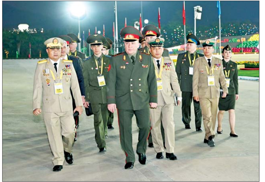
ဘယ်လာရုစ်သမ္မတနိုင်ငံ ကာကွယ်ရေးဝန်ကြီး Lieutenant General Viktor Gennadyevich Khrenin နှင့် အဖွဲ့ဝင်များ နှစ်(၈၀)ပြည့် တပ်မတော်နေ့ စစ်ရေးပြ အခမ်းအနားသို့ တက်ရောက်လာစဉ်။

»» စာမျက်နှာ ၆ မှ ထိုသို့ချိတ်ဆက်ချိန်တွင် နိုင်ငံတော် စီမံအုပ်ချုပ်ရေးကောင်စီ ဥက္ကဋ္ဌ တပ်မတော်ကာကွယ်ရေးဦးစီးချုပ်၏ ဇနီးဒေါ်ကြူကြူလှ၊ ကောင်စီ ဒုတိယဥက္ကဋ္ဌ ဒုတိယတပ်မတော်ကာကွယ်ရေးဦးစီးချုပ် ကာကွယ်ရေးဦးစီးချုပ်(ကြည်း)၏ ဇနီးဒေါ်သန်းသန်းနွယ်၊ ညှိနှိုင်းကွပ်ကဲရေးမှူး(ကြည်း၊ ရေ၊ လေ)၏ဇနီး၊ ကာကွယ်ရေးဦးစီးချုပ်(ရေ)၏ဇနီး၊ ကာကွယ်ရေးဦးစီးချုပ်(လေ)၏ဇနီး၊ ကာကွယ်ရေးဦးစီးချုပ်ရုံးမှ တပ်မတော် အရာရှိကြီးများ၏ ဇနီးများက ဂုဏ်ပြုပန်းကုံးများ ဖြန့်ဖြူးကြိုဆိုကြသည်။ အလားတူ ကာကွယ်ရေးဦးစီးချုပ်ရုံး(ကြည်း) မှ အရာရှိ၊ စစ်သည်၊ မိသားစုများ၊ နေပြည်တော် တိုင်းစစ်ဌာနချုပ် နှင့် တပ်နယ်အသီးသီးတို့မှ အရာရှိ၊ စစ်သည်၊ မိသားစုများ၊ မြန်မာနိုင်ငံ ရဲတပ်ဖွဲ့ဝင်များနှင့် မိသားစုများ၊ ဝန်ကြီးဌာနအသီးသီးမှ နိုင်ငံ့ဝန်ထမ်းများ၊ ရုပ်ရှင်၊ ဂီတအနုပညာရှင်များ၊ ဒေသခံမိဘပြည်သူများ ကလည်း စစ်ကြောင်းကြီးများ ချိတ်ဆက်ရာ လမ်းတစ်လျှောက် သောင်းသောင်းဖြဖြ ကြိုဆိုကာ ဂုဏ်ပြုပန်းကုံးများစွပ်၍ ကြိုဆိုခဲ့ကြပြီး စစ်ကြောင်းကြီးများမှ တပ်မတော်သားများနှင့် မြန်မာနိုင်ငံ ရဲတပ်ဖွဲ့ဝင်များသည် ဇာတိသွေး၊ ဇာတိမာန်အပြည့်ဖြင့် စစ်ချီတေး