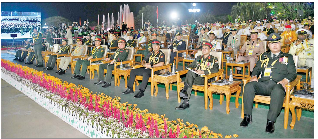
နှစ်(၈၀)ပြည့် တပ်မတော်နေ့ စစ်ရေးပြအခမ်းအနားသို့ တက်ရောက်လာကြသူများကို တွေ့ရစဉ်။

Eurocopter နှစ်စင်းက Trail Formation ပုံစံဖြင့် ရှုရပ်၏ လက်ဝဲဘက်မှ လက်ယာဘက်သို့ ပျံသန်း၍ လည်းကောင်း၊ H-125 ရဟတ်ယာဉ် နှစ်စင်းက ရှုရပ်၏ အရှေ့ဘယ်ဘက် ၄၅ ဒီဂရီမြင်ကွင်းမှ ၂၉၅ ဒီဂရီလမ်းကြောင်းအတိုင်း Echelon Formation ပုံစံဖြင့် လည်းကောင်း၊ Bell-206 ရဟတ်ယာဉ် တစ်စင်းက ရှုရပ်၏ ရှေ့တည့်တည့်မှ ဒုတိယအကြိမ် ပျံသန်း၍ လည်းကောင်း၊ Eurocopter နှစ်စင်းက ရှုရပ်၏ အရှေ့ဘက် ၄၅ ဒီဂရီမြင်ကွင်းမှ ၀၂၅ ဒီဂရီလမ်းကြောင်းအတိုင်း Echelon Formation ပုံစံဖြင့် ဒုတိယအကြိမ် ပျံသန်း၍ လည်းကောင်း၊ BEECH 1900D အမျိုးအစား သယ်ယူပို့ဆောင်ရေးလေယာဉ် တစ်စင်းက ရှုရပ်၏ အရှေ့ဘယ်ဘက် ၄၅ ဒီဂရီမြင်ကွင်းမှ ၂၉၅ ဒီဂရီလမ်းကြောင်းအတိုင်း ပျံသန်း၍ လည်းကောင်း၊ BEECH 1900D အမျိုးအစား သယ်ယူပို့ဆောင်ရေးလေယာဉ် တစ်စင်းက ရှုရပ်၏ အရှေ့ဘယ်ဘက် ၄၅ ဒီဂရီမြင်ကွင်းမှ ၀၂၅ ဒီဂရီလမ်းကြောင်းအတိုင်း ပျံသန်း၍ လည်းကောင်း၊ ATR 72 သယ်ယူပို့ဆောင်ရေး လေယာဉ်တစ်စင်းက ရှုရပ်၏ ရှေ့တည့်တည့် တောင်မှ မြောက်သို့ ပျံသန်း၍လည်းကောင်း၊ K-8 W တိုက်ခိုက်ရေးလေယာဉ် နှစ်စင်းက ရှုရပ်၏ အရှေ့ဘက် ၄၅ ဒီဂရီမြင်ကွင်းမှ ၀၂၅ ဒီဂရီလမ်းကြောင်းအတိုင်း Echelon