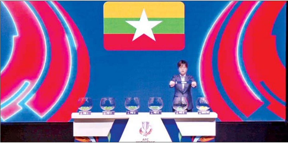
၂၀၂၆ အာဂူဖလား အမျိုးသမီးခြေစစ်ပွဲ အုပ်စုမဲခွဲပွဲ ကျင်းပစဉ်။