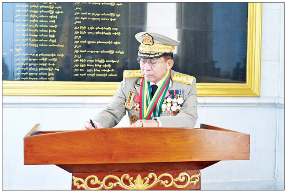
နိုင်ငံတော်စီမံအုပ်ချုပ်ရေးကောင်စီဥက္ကဋ္ဌ တပ်မတော်ကာကွယ်ရေးဦးစီးချုပ် ဗိုလ်ချုပ်မှူးကြီး သတိုးမဟာသရေစည်သူ သတိုးသီရိသုဓမ္မ မင်းအောင်လှိုင် သူရဲကောင်းဗိမာန်(နေပြည်တော်) ဧည့်သည် တော် မှတ်တမ်းစာအုပ်တွင် လက်မှတ်ရေးထိုးစဉ်။

နှင့် လွတ်လပ်စွာအုပ်ချုပ်ခွင့်ရရှိ ပြီးသည့်နောက် အသိအမှတ်ပြု ဖွယ်ရာ ရဲစွမ်းသတ္တိရှိစွာ ကြိုးစား အားထုတ်မှုများ ပြုလုပ်ရာတွင် အသက်ကိုစွန့်လွှတ်ခဲ့သည့် သူရဲ ကောင်းများကို ဂုဏ်ပြုရန်၊ ယင်း သူရဲကောင်းများအား နောင်လာ နောက်သားများ အမြဲအမှတ်ရနေ စေရန်နှင့် မျိုးဆက်သစ်လူငယ် များ၏စိတ်ထဲတွင် နိုင်ငံတော်ကို ချစ်သည့်စိတ်နှင့် နိုင်ငံတော် အတွက် စွန့်လွှတ်စွန့်စားလိုသည့် စိတ်ဓာတ်များ ရှင်သန်ကိန်း အောင်းလာစေရန် စသည့် ရည်ရွယ်ချက်များဖြင့် နိုင်ငံတော် စီမံအုပ်ချုပ်ရေးကောင်စီဥက္ကဋ္ဌ တပ်မတော်ကာကွယ်ရေး ဦးစီး ချုပ်၏လမ်းညွှန်ချက်အရ ၂၀၁၇ ခုနှစ် မတ် ၂၇ ရက်တွင် ဖွင့်လှစ် ခဲ့ခြင်းဖြစ်ကြောင်း၊ ဗိမာန်အတွင်း နံရံများ၌ နိုင်ငံတော်ကာကွယ်ရေး တာဝန်များကို ထမ်းဆောင်ရင်း အသက်စွန့်လွှတ်ပေးလှူခဲ့ရသည့် အောင်ဆန်းသူရိယာဘွဲ့ ရရှိခဲ့သူ၊