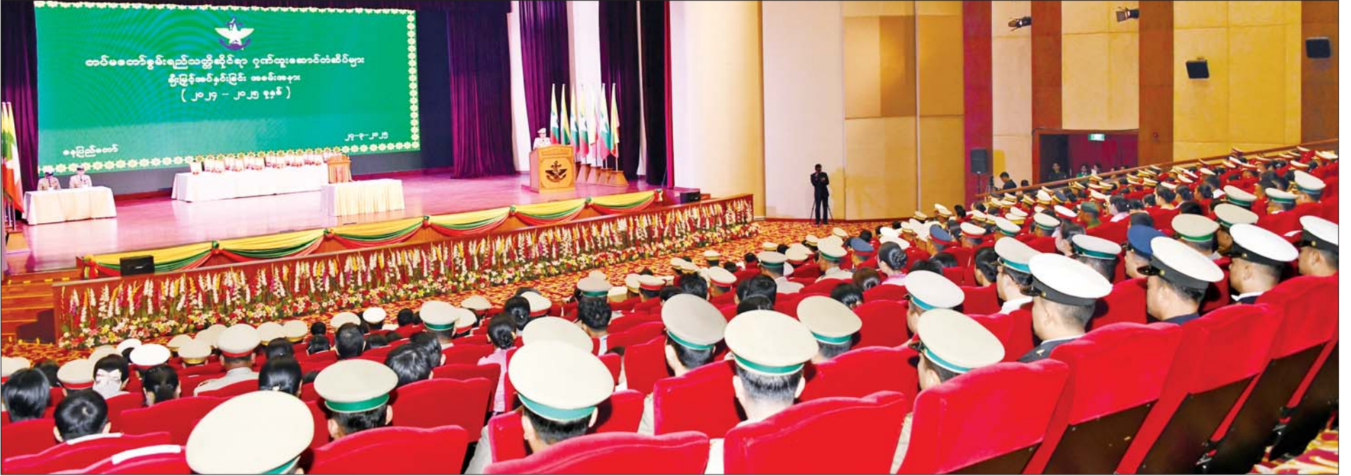
နိုင်ငံတော်စီမံအုပ်ချုပ်ရေးကောင်စီဥက္ကဋ္ဌ တပ်မတော်ကာကွယ်ရေးဦးစီးချုပ် ဗိုလ်ချုပ်မှူးကြီး သတိုးမဟာသရေစည်သူ သတိုးသီရိသုဓမ္မ မင်းအောင်လှိုင် တပ်မတော်စွမ်းရည်သတ္တိဆိုင်ရာ ဂုဏ်ထူးဆောင် တံဆိပ်များချီးမြှင့်အပ်နှင်းခြင်း အခမ်းအနားတွင် ဂုဏ်ပြုအမှာစကားပြောကြားစဉ်။

နေပြည်တော် မတ် ၂၇ ပြုလုပ်ရာ နိုင်ငံတော်စီမံအုပ်ချုပ် ဂုဏ်ထူးဆောင် တံဆိပ်များကို မဟာသရေစည်သူ သတိုးသီရိ ချုပ်(ကြည်း) ဒုတိယဗိုလ်ချုပ်မှူး ကာကွယ်ရေးဦးစီးချုပ် (ရေ) တပ်မတော် စွမ်းရည်သတ္တိ ရေးကောင်စီဥက္ကဋ္ဌ တပ်မတော် ချီးမြှင့်အပ်နှင်းပေးသည်။ အဆိုပါအခမ်းအနားသို့ နိုင်ငံ ဗိုလ်ချုပ်ကြီး ဇေယျကျော်ထင် ဆိုင်ရာ ဂုဏ်ထူးဆောင်တံဆိပ်များ ကာကွယ်ရေးဦးစီးချုပ် ဗိုလ်ချုပ်မှူး ကြီး သတိုးမဟာသရေစည်သူ တော်စီမံ အုပ်ချုပ်ရေးကောင်စီ ဥက္ကဋ္ဌ ဒုတိယတပ်မတော်ကာကွယ် ဦးစီးချုပ် ဗိုလ်ချုပ်မှူးကြီး သတိုး ကို ယနေ့မွန်းလွဲပိုင်းတွင် နေပြည် သတိုးသီရိသုဓမ္မ မင်းအောင်လှိုင် ဥက္ကဋ္ဌ ဒုတိယတပ်မတော်ကာကွယ် ရေးဦးစီးချုပ် ကာကွယ်ရေးဦးစီး ချုပ်(ကြည်း) ဒုတိယဗိုလ်ချုပ်မှူး ကာကွယ်ရေးဦးစီးချုပ် (ရေ) ဗိုလ်ချုပ်ကြီး ဇေယျကျော်ထင် ထိန်ဝင်းနှင့်ဇနီး ဒေါ်သန်းသန်းနွယ်၊ ဦးစီးချုပ် (လေ) ဗိုလ်ချုပ်ကြီး ဇေယျ ကျော်ထင် စည်သူ ထွန်းအောင်နှင့် ဇနီး၊ စာမျက်နှာ ၁၁ သို့ +