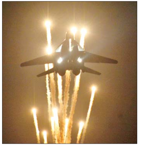
စစ်ရေးပြစစ်ကြောင်းကြီးများ ချီတက်အလေးပြုချိန်တွင် တပ်မတော် (လေ) မှ လေယာဉ်များ သရုပ်ပြပျံသန်းကြစဉ်။