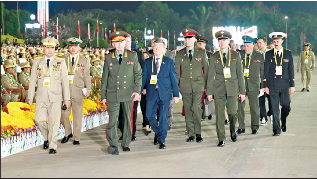
ရုရှားဖက်ဒရေးရှင်းနိုင်ငံ ဒုတိယကာကွယ်ရေးဝန်ကြီး Colonel General Alexander Vasilyevich Fomin နှင့် အဖွဲ့ဝင်များ နှစ်(၈၀)ပြည့် တပ်မတော်နေ့ စစ်ရေးပြအခမ်းအနားသို့ တက်ရောက်လာစဉ်။