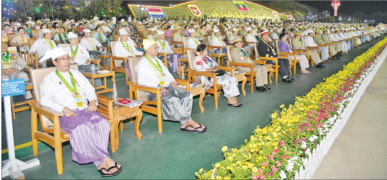
နှစ်(၈၀)ပြည့် တပ်မတော်နေ့ စစ်ရေးပြအခမ်းအနားသို့ တက်ရောက်လာကြသူများကို တွေ့ရစဉ်။

တပ်ဖွဲ့တို့မှ ပုဂ္ဂိုလ်များ၊ ဝန်ကြီးဌာန အသီးသီးမှ တာဝန်ရှိသူများနှင့် ဝန်ထမ်းများ၊ ပိုင်အမ်ဘီအေ အသင်းကြီး၊ မြန်မာနိုင်ငံအမျိုးသမီးရေးရာအဖွဲ့ချုပ်၊ မြန်မာနိုင်ငံ မိခင်နှင့် ကလေးစောင့်ရှောက်ရေး အသင်းနှင့် ဘာသာပေါင်းစုံ ချစ်ကြည်ညီညွတ်ရေးအသင်းဗဟို ဘဏ္ဍာဝန်ရှိသူများ၊ တပ်မတော် နေ့ဂုဏ်ပြုဇာတ်လမ်းတွင် ပါဝင်ခဲ့သည့် အနုပညာရှင်များ၊ စစ်ချီသီချင်း၊ စစ်သည်တေးသီချင်း၊ ကဗျာ၊ ဝတ္ထုတို၊ ဝတ္ထုရှည်ပြိုင်ပွဲများတွင် ဆုရရှိကြသူများ၊ တပ်မတော်နေ့ အလှူရှင်များ၊ သတင်းမီဒီယာကောင်စီ၊ ရုပ်ရှင်၊ သဘင်၊ ဂီတအစည်းအရုံးနှင့် သေနင်္ဂဗျူဟာ လေ့လာရေးအဖွဲ့တို့မှ တာဝန်ရှိသူများ၊ တက္ကသိုလ်လေ့ကျင့်ရေးတပ်များမှ တပ်ဖွဲ့ဝင်များ၊ တိုင်းရင်းသား ဖွံ့ဖြိုးရေးတက္ကသိုလ်မှ ဆရာဆရာမများနှင့် ကျောင်းသားကျောင်းသူများ၊ အထူးဖိတ်ကြားထားသည့် ဧည့်သည်တော်များနှင့် ပြည်တွင်း၊ ပြည်ပ သတင်းမီဒီယာများ တက်ရောက်ကြသည်။