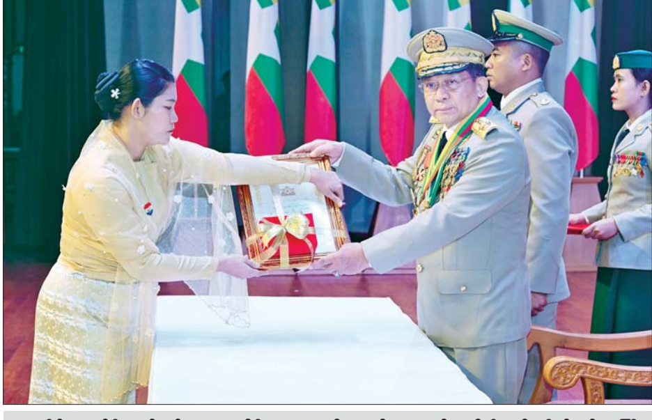
နိုင်ငံတော်စီမံအုပ်ချုပ်ရေးကောင်စီဥက္ကဋ္ဌ တပ်မတော်ကာကွယ်ရေးဦးစီးချုပ် ဗိုလ်ချုပ်မှူးကြီး သတိုးမဟာသရေစည်သူ သတိုးသီရိသုဓမ္မ မင်းအောင်လှိုင် သူရဲကောင်းမှတ်တမ်းဝင်တံဆိပ်ရရှိသူများ အား ဆုတံဆိပ်များပေးအပ်ချီးမြှင့်စဉ်။

ထူးချွန်သူများအားလည်းဘွဲ့တံဆိပ် များ ပေးအပ်ချီးမြှင့်လျက် ရှိကြောင်း၊ ယနေ့အခမ်းအနားတွင် တပ်မတော်စွမ်းရည်သတ္တိဆိုင်ရာ ဂုဏ်ထူးဆောင်တံဆိပ်များ ဖြစ် သည့် သူရဲကောင်းမှတ်တမ်းဝင် တံဆိပ်ရရှိသူ ၂၂ ဦးအား ချီးမြှင့် ပေးအပ်သွားမည် ဖြစ်ကြောင်း၊ နိုင်ငံတော်အနေဖြင့် လူမှုရေး၊ စီးပွားရေး၊ သိပ္ပံနှင့်နည်းပညာ၊ အားကစားကဏ္ဍများအပြင် တိုင်း ပြည် တည်ငြိမ်အေးချမ်းရေးနှင့် ဖွံ့ဖြိုးရေးတို့အတွက် နယ်ပယ်အစုံ မှ တိုင်းပြည်အကျိုး အားသွန် ခွန်စိုက် သယ်ပိုးနေသူများအား ထိုက်သင့်သည့် ဂုဏ်ပြုမှုများ ပြုလုပ်ပေးလျက် ရှိကြောင်းကို ပြောကြားလိုကြောင်း။