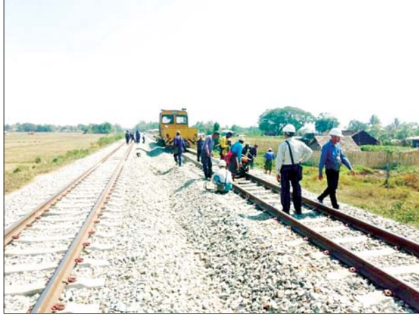
အဆန်ရထားလမ်းပေါ်၌ အကြမ်းဖက်သောင်းကျန်းသူအဖွဲ့က မိုင်းထောင်ဖောက်ခွဲဖျက်ဆီးမှုကြောင့် ရထားလမ်းပျက်စီးမှုကို ပြန်လည်ပြုပြင်ဆောင်ရွက်နေမှုကို တွေ့ရစဉ်။

အကြမ်းဖက်သောင်းကျန်းသူများအနေဖြင့် နိုင်ငံတော်ပိုင်ရထား စက်ခေါင်းနှင့် တွဲများ၊ ရထားလမ်းနှင့် တံတားများ၊ ခရီးသည်များနှင့် ကုန်စည်များ ထိခိုက်ပျက်စီးဆုံးရှုံးစေရေး၊ ရထားစီးခရီးသွားပြည်သူများ ရထားဖြင့် ခရီးသွားလာရာတွင် ကိုယ်၊ စိတ်နှလုံးချမ်းမြေ့ပြီး အသက် အန္တရာယ်ကင်းရှင်းစွာဖြင့် လုံခြုံစိတ်ချစွာ သွားလာနိုင်မှုမရှိစေရေး အတွက် ရည်ရွယ်ပြီး ယခုကဲ့သို့ အကြိမ်ကြိမ်ကျူးလွန်ဖျက်ဆီးနေ ကြခြင်းဖြစ်သော်လည်း နိုင်ငံတော်အစိုးရအနေဖြင့် အများပြည်သူ ခရီး သွားလာမှုနှင့် ကုန်စည်ပို့ဆောင်မှု အဆင်ပြေချောမွေ့မြန်ဆန်စေရေး အတွက် ရထားလမ်းနှင့် အခြေခံအဆောက်အအုံများ ပိုမိုတိုးတက် ကောင်းမွန်လာစေရေးနှင့် ရထားပို့ဆောင်ရေးစနစ် အဆင့်မြှင့်တင်ရေး စီမံကိန်းလုပ်ငန်းများကို ရည်မှန်းချက်ထားရှိ၍ အစဉ်တစိုက် အလေးထား စီမံဆောင်ရွက်ပေးလျက်ရှိကြောင်း သိရသည်။