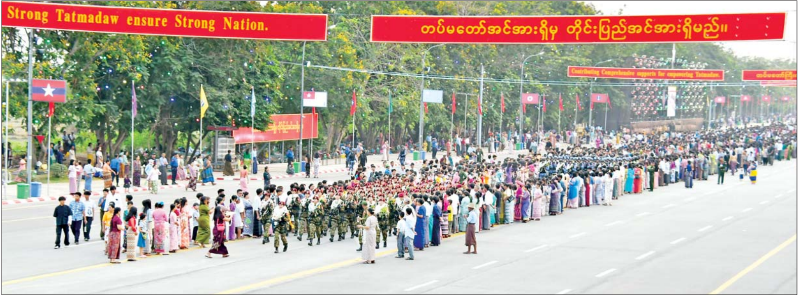
ကာကွယ်ရေးဦးစီးချုပ်ရုံး(ကြည်း)မှ အရာရှိ၊ စစ်သည်၊ မိသားစုများ၊ နေပြည်တော်တိုင်းစစ်ဌာနချုပ်နှင့် တပ်နယ်အသီးသီးတို့မှ အရာရှိ၊ စစ်သည်၊ မိသားစုများ၊ မြန်မာနိုင်ငံ ရဲတပ်ဖွဲ့ဝင်များနှင့် မိသားစုများ၊ ဝန်ကြီးဌာနအသီးသီးမှ နိုင်ငံ့ဝန်ထမ်းများ၊ ရုပ်ရှင်ဂီတအနုပညာရှင်များ၊ ဒေသခံမိဘပြည်သူများက စစ်ကြောင်းကြီးများချီတက်ရာ လမ်းတစ်လျှောက် ခွဲ ဂုဏ်ပြုပန်းကုံးများစွပ်၍ သောင်းသောင်းဖြဖြ ကြိုဆိုကြစဉ်။

ကျန်စစ်သားစစ်ကြောင်း စစ်ကြောင်းမှူး ဗိုလ်မှူးချုပ် ထွန်းနိုင်ဦး ဦးဆောင်သည့် ဂုဏ်ပြု တပ်ခွဲ၊ စစ်အင်ဂျင်နီယာညွှန်ကြား ရေးမှူးရုံးကိုယ်စားပြု စစ်ရေးပြ တပ်ခွဲ၊ ကာကွယ်ရေးပစ္စည်း ထုတ်လုပ်ရေး အရာရှိချုပ်ရုံး ကိုယ်စားပြု စစ်ရေးပြတပ်ခွဲ၊ စစ်လက်နက်ပစ္စည်း ညွှန်ကြားရေး မှူးရုံးကိုယ်စားပြု စစ်ရေးပြတပ်ခွဲ၊ အရှေ့မြောက်တိုင်း စစ်ဌာနချုပ် ကိုယ်စားပြု စစ်ရေးပြတပ်ခွဲ၊ ကြိမ်ဒေသတိုင်း စစ်ဌာနချုပ် ကိုယ်စားပြု စစ်ရေးပြတပ်ခွဲ၊ အနောက်တောင်တိုင်း စစ်ဌာန ချုပ်ကိုယ်စားပြု စစ်ရေးပြတပ်ခွဲ၊ အလယ်ပိုင်းတိုင်း စစ်ဌာနချုပ် ကိုယ်စားပြုစစ်ရေးပြတပ်ခွဲတို့ပါဝင် သည့် ကျန်စစ်သားစစ်ကြောင်း။