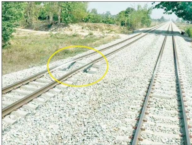
ရန်ကုန်-မန္တလေးရထားလမ်းပိုင်းအတွင်းရှိ ညောင်ခြေထောက် နှင့် ကျွဲပွဲဘူတာအကြား အဆန်ရထားလမ်းပေါ်၌ အကြမ်းဖက် သောင်းကျန်းသူအဖွဲ့က မိုင်းထောင်ဖောက်ခွဲဖျက်ဆီးမှုကြောင့် ရထားလမ်းပျက်စီးမှုအခြေအနေမှတ်တမ်းဓာတ်ပုံ။

ထို့အတူ ယနေ့နံနက် ၉ နာရီ ၁၅ မိနစ်တွင် ရန်ကုန်-မန္တလေး ရထားလမ်းပိုင်းအတွင်း ပဲခူးတိုင်းဒေသကြီး အုတ်တိုင်းမြို့နယ် ညောင်ခြေထောက်ဘူတာနှင့် ကျွဲပွဲဘူတာအကြား မိုင်တိုင်အမှတ် ၁၄၄/၁၀-၁၁ နေရာရှိ အဆန်ရထားလမ်းပေါ်တွင် အကြမ်းဖက် သောင်းကျန်းသူအဖွဲ့က ထောင်ထားသည့် မိုင်းပေါက်ကွဲမှုကြောင့် အဆန် ရထားလမ်း ထိခိုက်ပျက်စီးခဲ့ကြောင်းသတင်းအရ ညောင်ခြေထောက် ဘူတာနှင့် ကျွဲပွဲရထားလမ်းပိုင်းကို ဧကလမ်းစနစ်အသုံးပြု၍ အစုန် လမ်းမှ နံနက် ၉ နာရီ ၁၈ မိနစ်တွင် ရထားများကို ဖြတ်သန်းခွင့်ပြုထား ကြောင်း သိရသည်။