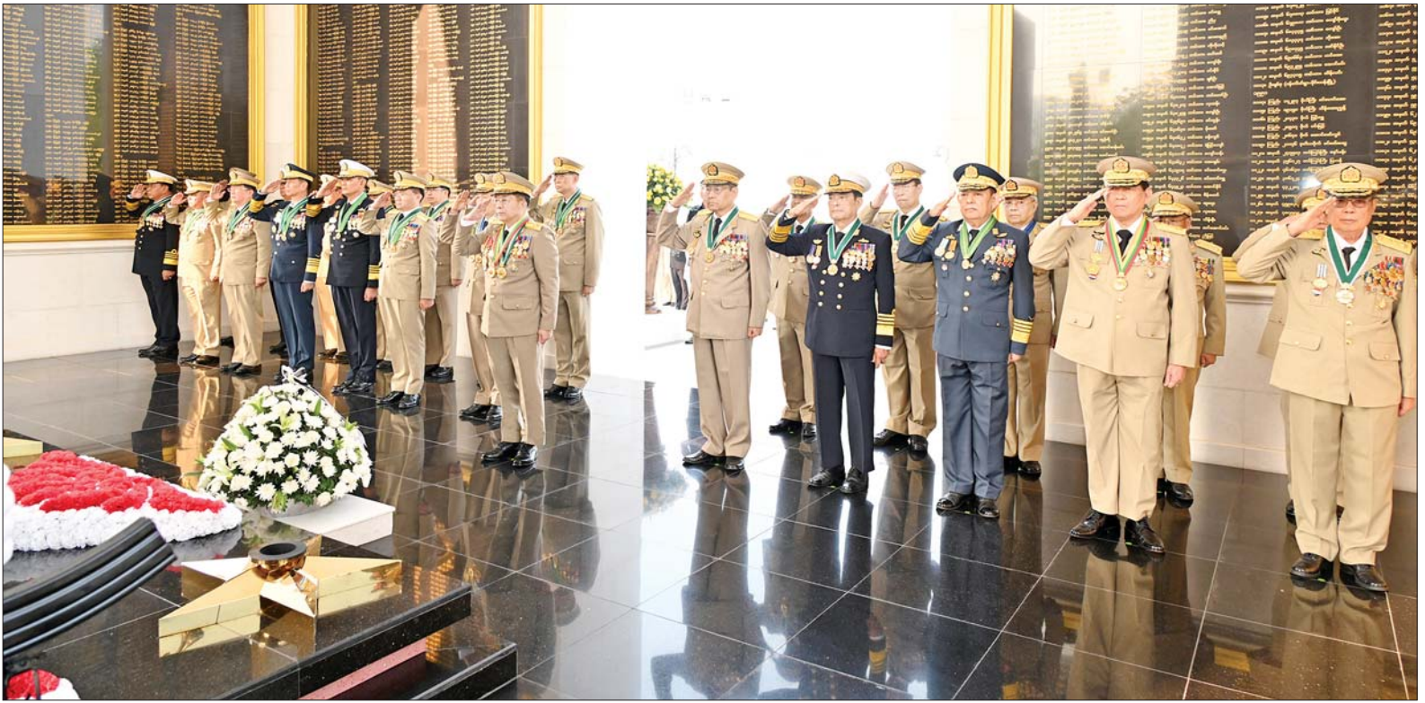
နိုင်ငံတော်စီမံအုပ်ချုပ်ရေးကောင်စီဥက္ကဋ္ဌ တပ်မတော်ကာကွယ်ရေးဦးစီးချုပ် ဗိုလ်ချုပ်မှူးကြီး သတိုးမဟာသရေစည်သူ သတိုးသီရိသုဓမ္မ မင်းအောင်လှိုင်နှင့် တပ်မတော် အရာရှိကြီးများ သူရဲကောင်းဗိမာန်(နေပြည်တော်)၌ ဂုဏ်ပြုပန်းခြင်းချအလေးပြုစဉ်။

ဦးစွာ နိုင်ငံတော်စီမံအုပ်ချုပ် ရေးကောင်စီဥက္ကဋ္ဌ တပ်မတော် ကာကွယ်ရေး ဦးစီးချုပ်နှင့် တပ်မတော်အရာရှိကြီးများသည် သူရဲကောင်းဗိမာန်အတွင်းနှင့် ရင်ပြင်တွင် နေရာယူကြကာ နိုင်ငံတော် စီမံအုပ်ချုပ်ရေး ကောင်စီဥက္ကဋ္ဌ တပ်မတော် ကာကွယ်ရေးဦးစီးချုပ်က ဂုဏ်ပြု ပန်းခြင်းချပြီး တက်ရောက်လာ