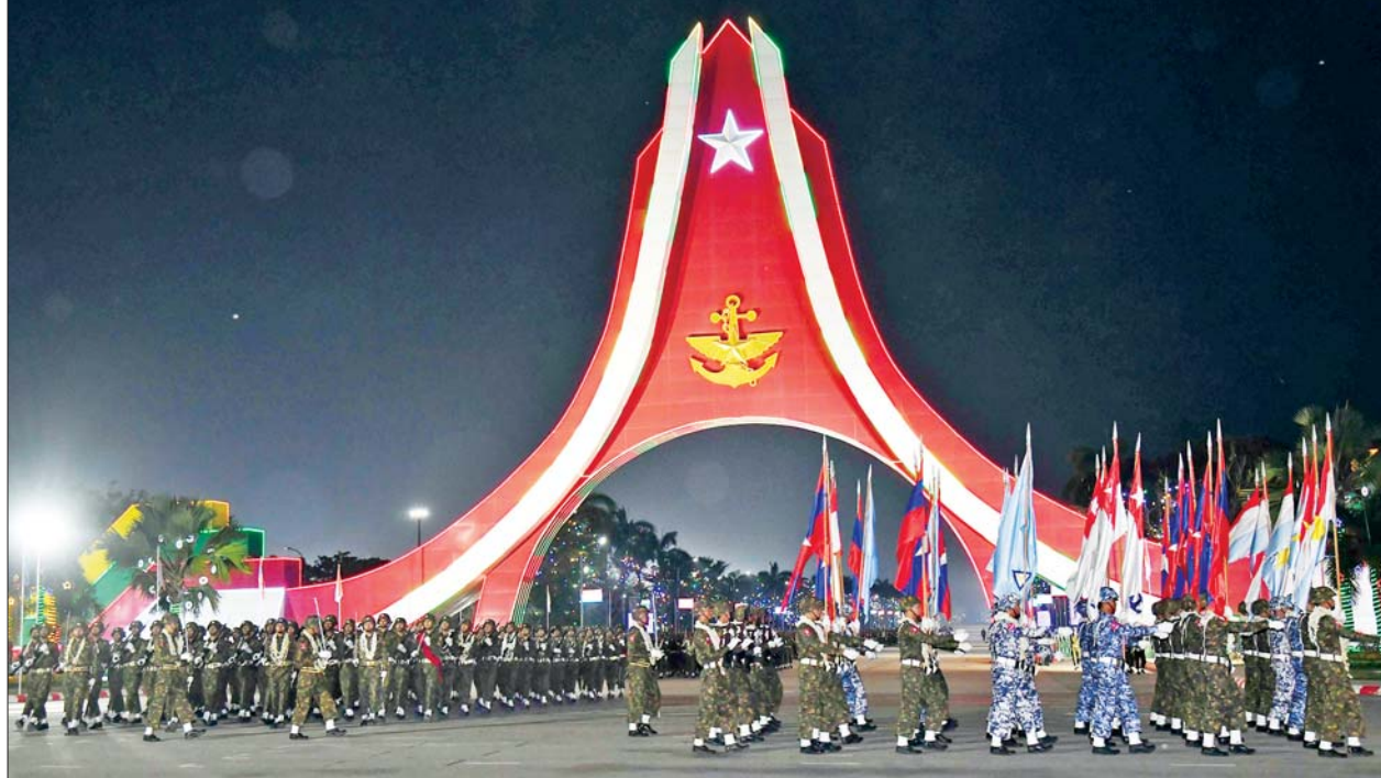
စစ်ရေးပြစစ်ကြောင်းကြီးများ စစ်ရေးပြကွင်းကြီးအတွင်းမှ ပြန်လည်ထွက်ခွာကြစဉ်။

တပ်မတော် (ကြည်း)၊ ရေ၊ လေ) အလံများကို Lighting Effect မီးအလှူများဖြင့် ပုံဖော်၍လည်းကောင်း၊ စစ်ရေးပြကွင်းအတွင်း အလေးပြုခံစင်မြင့် မျက်နှာမူရာရှိ သစ်ပင်များ၌လည်း Handmade အလှမီးများဖြင့်လည်းကောင်း၊ မင်းကြီးသုံးပါးရုပ်တု အောက်ခံ၌ တပ်မတော်အလံပုံဖော်ထားသည့် ကြယ်တံဆိပ်နှစ်ခုအား LED Strip Light များဖြင့် လည်းကောင်း၊ နိုင်ငံတော်စီမံအုပ်ချုပ်ရေးကောင်စီ ဥက္ကဋ္ဌ တပ်မတော်ကာကွယ်ရေးဦးစီးချုပ် ဗိုလ်ချုပ်မှူးကြီး သတိုးမဟာသရေစည်သူ သတိုးသီရိသုဓမ္မ မင်းအောင်လှိုင် ပြန်လည်ထွက်ခွာမည့် လမ်းတစ်လျှောက်တွင်လည်း Flag Light Box များ၊ LED Strip Light များဖြင့် အသီးသီးပုံဖော် အလှဆင်ထားသည်ကို တွေ့မြင်နိုင်မည်ဖြစ်သည်။ ထို့အပြင် နှစ်(၈၀)ပြည့် တပ်မတော်နေ့ကို ဂုဏ်ပြုသော အားဖြင့် ရန်ကုန်-မန္တလေး ကားလမ်းမနှင့် ပင်လောင်းလမ်းဆုံတွင် မျိုးချစ်စိတ်ဓာတ် ရှင်သန်ထက်မြက်ပြီး ဇာတိသွေး၊ ဇာတိမာန် တက်ကြွစေမည့် တပ်မတော် (ကြည်း)၊ ရေ၊ လေ) စစ်သည်များ၏ လှုပ်ရှားမှုပုံရိပ်များကို ဖော်ကြားထားသော ပိုစတာကြီးများကို စိုက်ထူထားရှိပြီး စစ်ရေးပြကွင်း ရှေ့ရှိလမ်းတစ်လျှောက်တွင်လည်း တပ်မတော်၏ ဆောင်ပုဒ်များကို မြန်မာ၊ အင်္ဂလိပ် နှစ်ဘာသာဖြင့် ဆိုင်းဘုတ်များစိုက်ထူကာ စာတန်းများကိုလည်း ချိတ်ဆွဲထားရှိကြောင်း သိရသည်။ သတင်းစဉ်