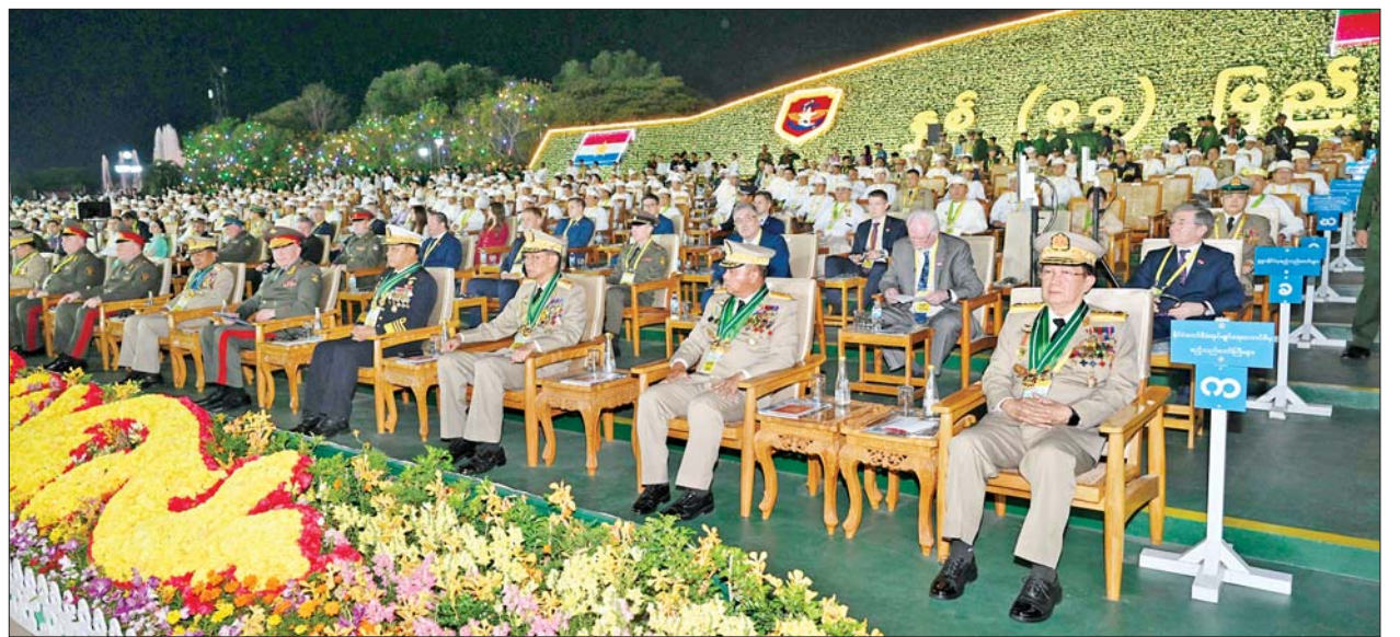
နှစ်(၈၀)ပြည့် တပ်မတော်နေ့ စစ်ရေးပြအခမ်းအနားသို့ တက်ရောက်လာကြသူများကို တွေ့ရစဉ်။

များကို သံပြိုင်ဟစ်ကြွေးသီဆို ချိတ်ဆက်လာကြပြီး စစ်ရေးပြကွင်း အတွင်းသို့ ရောက်ရှိနေရာယူကြသည်။ တက်ရောက် အဆိုပါ နှစ်(၈၀)ပြည့် တပ်မတော်နေ့ စစ်ရေးပြ အခမ်းအနားသို့ ရုရှားဖက်ဒရေးရှင်းနိုင်ငံ ဒုတိယ ကာကွယ်ရေးဝန်ကြီး Colonel General Alexander Vasilyevich Fomin နှင့် အဖွဲ့ဝင်များ၊ ဘယ်လာရုစ်သမ္မတနိုင်ငံ ကာကွယ်ရေးဝန်ကြီး Lieutenant General Viktor Gennadyevich Khrenin နှင့် အဖွဲ့ဝင်များ၊ ညှိနှိုင်းကွပ်ကဲရေးမှူး(ကြည်း၊ ရေ၊ လေ) ဗိုလ်ချုပ်ကြီး ဇေယျကျော်ထင် သရေစည်သူ ကျော်စွာလင်း၊ ကာကွယ်ရေး ဦးစီးချုပ်(ရေ) ဗိုလ်ချုပ်ကြီး ဇေယျကျော်ထင် ထိန်ဝင်း၊ ကာကွယ်ရေးဦးစီးချုပ်(လေ) ဗိုလ်ချုပ်ကြီး ဇေယျကျော်ထင် စည်သူ ထွန်းအောင်၊ ကောင်စီအတွင်းရေးမှူး၊ တွဲဖက် အတွင်းရေးမှူးနှင့် ကောင်စီဝင်များ၊ ပြည်ထောင်စုအဆင့်ပုဂ္ဂိုလ်များ၊ ကာကွယ်ရေးဦးစီးချုပ်ရုံးမှ အဆင့်မြင့်တပ်မတော်အရာရှိကြီးများ၊ ရဲဘော်သုံးကျိပ်ဝင် မိသားစုဝင်များ၊ အငြိမ်းစား တပ်မတော် ကာကွယ်ရေး ဦးစီးချုပ်များ၏ မိသားစုဝင်များ၊ အငြိမ်းစား တပ်မတော်(ကြည်း၊ ရေ၊ လေ)