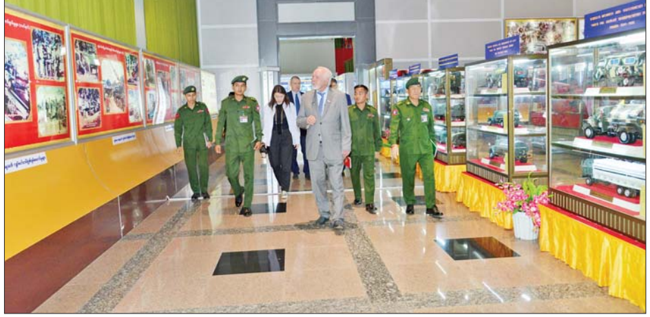
ရုရှားဖက်ဒရေးရှင်းနိုင်ငံ ကာကွယ်ရေးဝန်ကြီးဌာန ပြည်သူ့ရေးရာကောင်စီဥက္ကဋ္ဌ Mr. Pavel Nikoleaevich GUSEV နှင့်အဖွဲ့ တပ်မတော်စစ်သမိုင်းပြတိုက်(နေပြည်တော်)ရှိ ပြခန်းများအား လေ့လာကြည့်ရှုစဉ်။