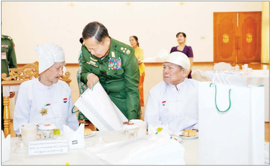
နိုင်ငံတော်စီမံအုပ်ချုပ်ရေးကောင်စီဒုတိယဥက္ကဋ္ဌ ဒုတိယတပ်မတော်ကာကွယ်ရေးဦးစီးချုပ် ကာကွယ်ရေးဦးစီးချုပ်(ကြည်း) ဒုတိယဗိုလ်မှူးကြီး စိုးဝင်း လွတ်လပ်ရေးမော်ကွန်းဝင်ပုဂ္ဂိုလ်များအား ဂါရဝပြုချီးမြှင့်ငွေနှင့် အားဖြည့်ငှက်သိုက်များ ပေးအပ်စဉ်။

ယင်းနောက် နိုင်ငံတော်စီမံအုပ်ချုပ်ရေး ကောင်စီဒုတိယဥက္ကဋ္ဌ ဒုတိယတပ်မတော် ကာကွယ်ရေးဦးစီးချုပ် ကာကွယ်ရေးဦးစီးချုပ် (ကြည်း)နှင့် ဇနီးတို့သည် လွတ်လပ်ရေးမော်ကွန်းဝင် ပုဂ္ဂိုလ်များနှင့် အတူ လက်ဖက်ရည်နှင့် စားသောက် ဖွယ်ရာများကို အတူတကွသုံးဆောင်ခဲ့ကြ သည်။