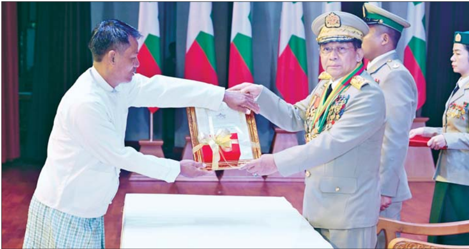
နိုင်ငံတော်စီမံအုပ်ချုပ်ရေးကောင်စီဥက္ကဋ္ဌ တပ်မတော်ကာကွယ်ရေးဦးစီးချုပ် ဗိုလ်ချုပ်မှူးကြီး သတိုးမဟာသရေစည်သူ သတိုးသီရိသုဓမ္မ မင်းအောင်လှိုင် သူရဲကောင်းမှတ်တမ်းဝင်တံဆိပ်ရရှိသူအား ဆုတံဆိပ် ပေးအပ်ချီးမြှင့်စဉ်။

† စာမျက်နှာ ၁၁ မှ အမှုထမ်းဘဲ အသက်ခန္ဓာ စွန့်လွှတ်ရသော ကြံ့ခိုင်သည့် စိတ်ဓာတ်၊ ပြောင်မြောက်သည့် သူရဲသတ္တိများဖြင့် ရဲရဲဝံ့ဝံ့တိုက်ပွဲ ဝင်ခဲ့ကြသည့် ပြည်သူ့သားကောင်း ဇာနည်များဖြစ်ကြောင်း၊ မိမိတို့ ထမ်းဆောင်ရသည့် တာဝန်များကို ခိုင်မာသည့် သန္နိဋ္ဌာန်စိတ်ဓာတ်၊ သူရဲကောင်းစိတ်ဓာတ်ပြည့်ဝစွာ တာဝန်ထမ်းဆောင်ခဲ့သူများဖြစ် သဖြင့် အစဉ်အမြဲအမှတ်ရနေမည် ဖြစ်ကြောင်းကို ပြောကြားလို ကြောင်း၊ ယခုကဲ့သို့ ပြည်သူ သားကောင်း ဇာနည်များ၏ ကောင်းမွန်မြင့်မြတ်သည့် ယုံကြည် ချက် ခံယူချက်ကောင်းများဖြင့် သူရဲကောင်းပီသစွာ ရဲဝံ့စွန့်စားမှု များကို မျိုးဆက်သစ်များထံ လက်ဆင့်ကမ်း အမွေပေးနိုင်ရေး