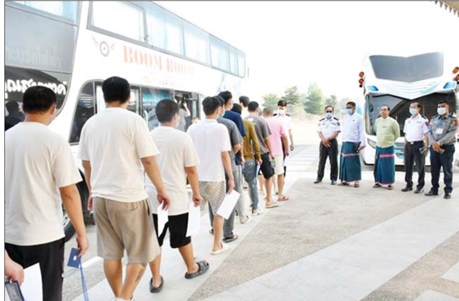
အွန်လိုင်းလိမ်လည်မှု(Telecom Fraud) နှင့် ဒုစရိုက်မှုလုပ်ငန်းများတွင် ဆက်စပ်ပါဝင်ခဲ့ကြသည့် တရုတ်နိုင်ငံသား ၃၆၅ ဦးကို သက်ဆိုင်ရာနိုင်ငံသို့ ပြည်နှင့်လွှဲပြောင်းပေးအပ်စဉ်။

မြန်မာ-တရုတ်-ထိုင်း သုံးနိုင်ငံအကြား သုံးပွင့် ဆိုင် ပူးပေါင်းဆောင်ရွက်မှုစုံစုံ (Trilateral Cooperation) ဖြင့် အွန်လိုင်းအသုံးပြုလိမ်လည်မှု (Online Scam) နှင့် အွန်လိုင်းလောင်းကစားမှု (Online Gambling) လုပ်ဆောင်နေကြသူများ ပါဝင်ပတ်သက် သူများနှင့် နောက်ကွယ်မှကြိုးကိုင်သော ပြည်ပနိုင်ငံ သားများကို ပြတ်ပြတ်သားသား စုံစမ်းဖော်ထုတ် တိုက်ဖျက်လျက်ရှိရာ ယနေ့တွင် အဆိုပါလုပ်ငန်းများ ၌ ဆက်စပ်ပါဝင်ခဲ့ကြသည့် တရုတ်နိုင်ငံသား ၃၆၅ ဦးကို မြန်မာ-ထိုင်း အမှတ်(၂) ချစ်ကြည်ရေးတံတား မှတစ်ဆင့် သက်ဆိုင်ရာနိုင်ငံသို့ လူသားချင်းစာနာ ထောက်ထားမှုနှင့် နိုင်ငံအချင်းချင်း ချစ်ကြည်ရင်းနှီး မှုတို့ကို ရှေးရှု၍ ဥပဒေလုပ်ထုံးလုပ်နည်းများနှင့် အညီ ထပ်မံပြည်နှင့်လွှဲပြောင်းပေးသည်။