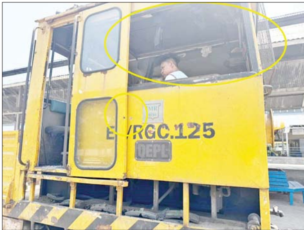
ရန်ကုန်-မန္တလေးရထားလမ်းပိုင်းအတွင်းရှိ ညောင်ခြေထောက် နှင့် ကျွဲပွဲဘူတာအကြား အကြမ်းဖက်သောင်းကျန်းသူအဖွဲ့က လုံခြုံရေးကင်းလှည့် RGC ရထားကို လက်နက်ငယ်ဖြင့်ပစ်ခတ်မှုကြောင့် အနောက်ဘက်မှန်ကွဲထိခိုက်မှုအခြေအနေမှတ်တမ်းဓာတ်ပုံ။

ယနေ့ ဖြူး- တောင်ငူလမ်းပိုင်း လုံခြုံရေးစစ်ဆေးသည့် RGC-125 သည် ညောင်ခြေထောက်ဘူတာမှ နံနက် ၇ နာရီ ၃၆ မိနစ် ထွက်ခွာလာပြီး ညောင်ခြေထောက်နှင့် ကျွဲပွဲဘူတာအကြား မိုင်တိုင် ၁၄၄/၁၀-၁၁ ခန့်အရောက် နံနက် ၇ နာရီ ၅၀ တွင် သံလမ်းအနောက်ဘက် ရန်ကုန်-မန္တလေး ကားလမ်းဘက်မှ လက်နက်ငယ်ဖြင့်ပစ်ခတ်သဖြင့် RGC-125 စက်ခေါင်း၏ အနောက်ဘက်မှန်တစ်ချပ်ကွဲပြီး အနောက်ဘက် သံပေါင်တွင် ကျည်ထိမှန်ခဲ့ကြောင်းနှင့် အဆိုပါပစ်ခတ်မှုကြောင့် စက်ခေါင်း မောင်းနှင့် လုံခြုံရေးတပ်ဖွဲ့များ ထိခိုက်မှုမရှိကြောင်း သိရသည်။