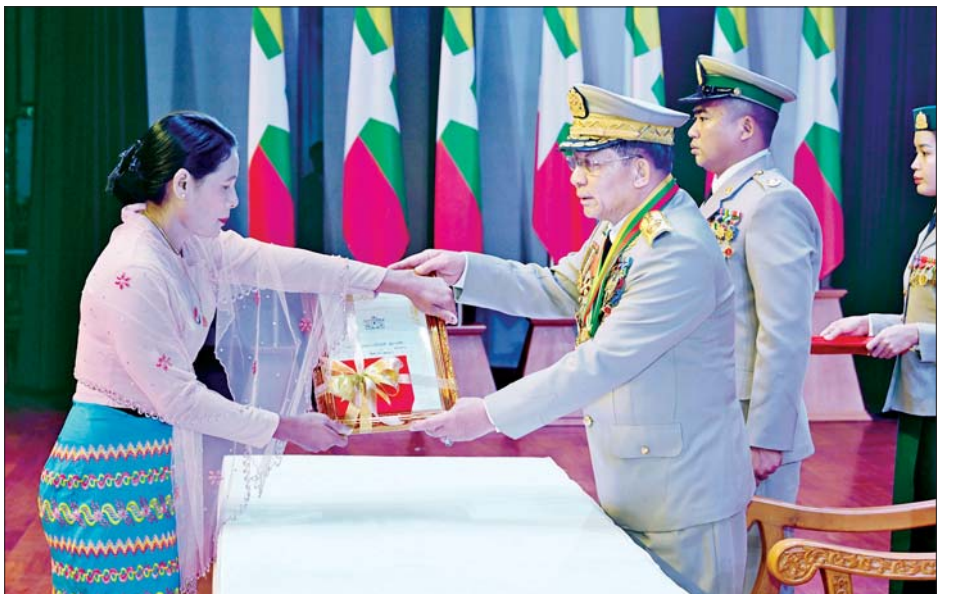
နိုင်ငံတော်စီမံအုပ်ချုပ်ရေးကောင်စီဥက္ကဋ္ဌ တပ်မတော်ကာကွယ်ရေးဦးစီးချုပ် ဗိုလ်ချုပ်မှူးကြီး သတိုးမဟာသရေစည်သူ သတိုးသီရိသုဓမ္မ မင်းအောင်လှိုင် သူရဲကောင်းမှတ်တမ်းဝင်တံဆိပ်ရရှိသူများအား ဆုတံဆိပ်များပေးအပ်ချီးမြှင့်စဉ်။