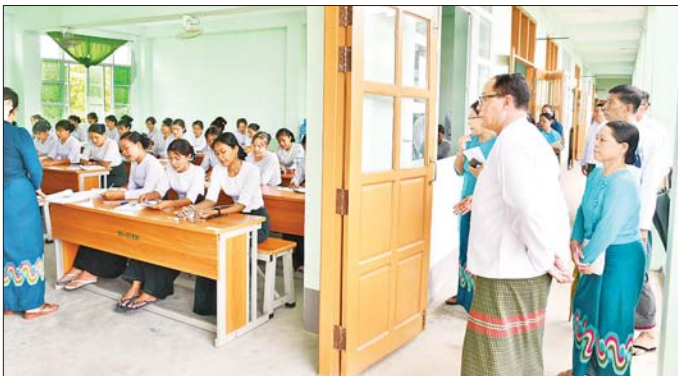
ကို လှည့်လည်ကြည့်ရှုအားပေး မှာကြားသည်။ လိုအပ်သည်များကို ထို့နောက် ပြည်နယ်ဝန်ကြီး

ကရင်ပြည်နယ် ဝန်ကြီးချုပ် ဦးစောမြင့်ဦးသည် တာဝန်ရှိသူများနှင့်အတူ ယနေ့နံနက်ပိုင်းတွင် ဘားအံတက္ကသိုလ်၌ တက္ကသိုလ်ပါမောက္ခချုပ်၊ တာဝန်ရှိသူများနှင့် တွေ့ဆုံရာ တက္ကသိုလ်ပါမောက္ခချုပ်နှင့် တာဝန်ရှိသူများက တက္ကသိုလ်တွင် ပါရဂူတန်း၊ မဟာဘွဲ့၊ မဟာအရည်အချင်းစစ်၊ ဂုဏ်ထူးတန်းများ အပါအဝင် ကျောင်းသား ကျောင်းသူ ၁၆၈၀ တက်ရောက်ပညာသင်ယူနေမှုကို ရှင်းလင်းတင်ပြကြပြီး ပြည်နယ်ဝန်ကြီးချုပ်က သင်ကြားသင်ယူနေမှု အခြေအနေများ