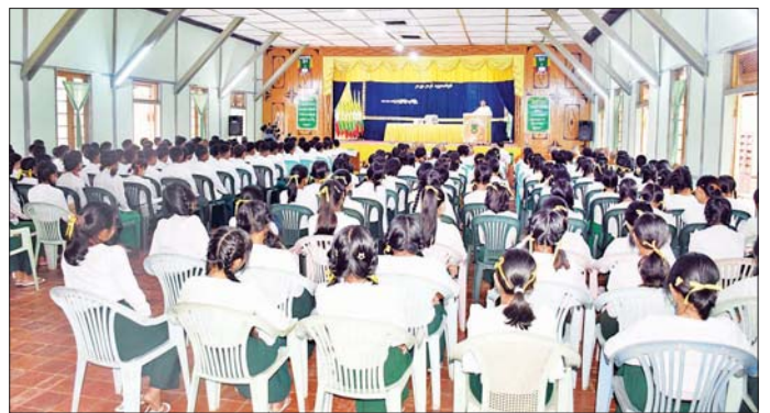
ဒုတိယဝန်ကြီး ဦးရဲတင့် ပြင်ဦးလွင်မြို့ အမှတ်(၃) အခြေခံပညာအထက်တန်းကျောင်း၌ ကျောင်းသား ကျောင်းသူများအား တွေ့ဆုံအမှာစကား ပြောကြားစဉ်။

ထို့နောက် မြန်မာ့အသံနှင့် ရုပ်မြင်သံကြား ထပ်ဆင့်လွှင့် စက်ရုံသို့ရောက်ရှိပြီး စက်ပစ္စည်း များ စနစ်တကျ ထိန်းသိမ်းအသုံး