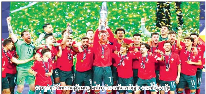
နေ့ရှင်းလိဂ်ဖလားနှင့်အတူ ပေါ်တူဂီအသင်းအား အောင်မြင်စွာပွဲစဉ်

အသင်းပွဲစဉ်တွင် ပေါ်တူဂီအသင်းက ပယ်နယ်တီ အဆုံးအဖြတ်တွင် ငါးဂိုး- သုံးဂိုးဖြင့် နိုင်ငံရပ်ခြား နေ့ရှင်းလိဂ်ဖလားကို ဒုတိယအကြိမ်မြောက် ဆွတ်ခူး နိုင်ခဲ့ပြီဖြစ်သည်။ စာမျက်နှာ ၁၃ ကော်လံ ၁ ၁