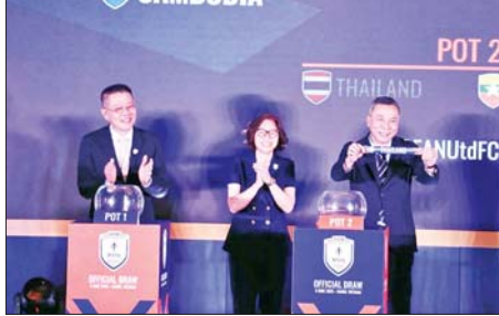
၂၀၂၅ အာဆီယံ အမျိုးသမီးချန်ပီယံရှစ်ပြိုင်ပွဲ အုပ်စုမဲခွဲပွဲ ကျင်းပစဉ်။

နေရာလုပွဲကို ဩဂုတ် ၁၉ ရက် တွင် ကျင်းပမည်ဖြစ်သည်။ မြန်မာလက်ရွေးစင်အမျိုးသမီး အသင်းသည် ၂၀၀၄ ခုနှစ်တွင် စတင်ကျင်းပသည့် ယင်းပြိုင်ပွဲ တစ်လျှောက် ချန်ပီယံဆုနှစ်ကြိမ်၊ ဒုတိယ သုံးကြိမ်၊ တတိယ သုံးကြိမ်ရရှိထားပြီး နောက်ဆုံး ကျင်းပသည့် ၂၀၂၂ ပြိုင်ပွဲတွင် တတိယဆုရထားသည်။ အာဆီယံ ဘောလုံးအဖွဲ့ချုပ် သည် ၂၀၂၃ နှင့် ၂၀၂၄ ခုနှစ်တွင် ပြိုင်ပွဲကျင်းပဘဲ ယခုနှစ်မှ ပြန်လည်ကျင်းပခြင်းဖြစ်သည်။ မြန်မာအမျိုးသမီး အသင်းသည် ၂၀၀၄ ခုနှစ်နှင့် ၂၀၀၇ ခုနှစ်တို့တွင် ချန်ပီယံဆုရရှိပြီးနောက် နှစ်ပေါင်း ၂၀ နီးပါး ချန်ပီယံဆုနှင့် ဝေးကွာ လျက်ရှိသည်။ ကိုညီလေး၊ ဓာတ်ပုံ-VFF