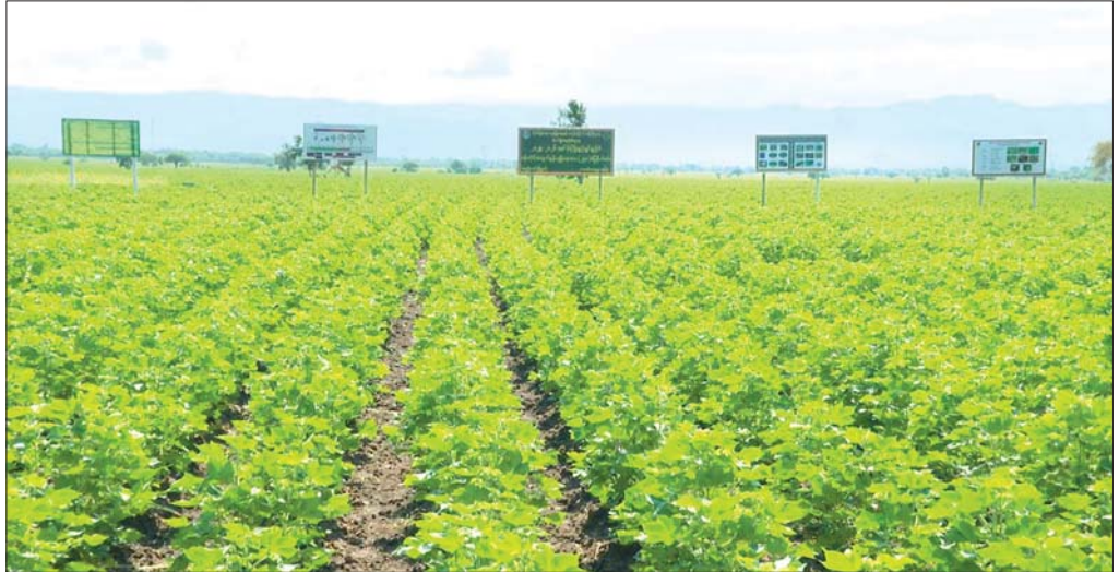
ကတင်ရွာ က ၂၅၀ ဝါစိုက်ကွင်း၌ အောင်မြင်ဖြစ်ထွန်းနေသော ဝါစိုက်ခင်းများကို တွေ့ရစဉ်။

ကတင်ကျေးရွာ၏ သမိုင်းအစကို ခရစ်နှစ် ၆၆၆ ခုနှစ်က ရမည်းသင်းမြို့နယ်၏ မြို့စာရေးကြီး ရှင်စံဝ