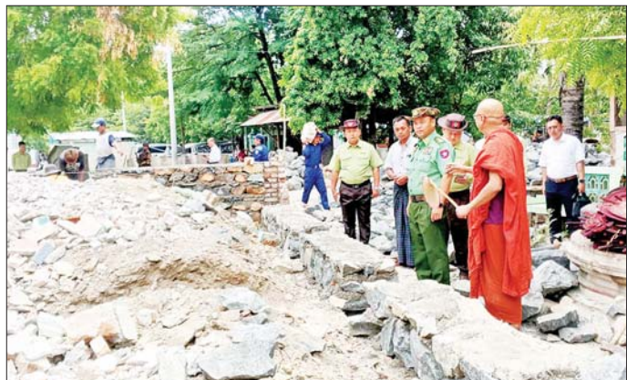
ကာကွယ်ရေးဦးစီးချုပ်ရုံး(ကြည်း)မှ ဒုတိယဗိုလ်ချုပ်ကြီး မျိုးသန့်နိုင် ကျောက်ဆည်မြို့ ကြက်မင်းတုန် ရပ်ကွက်ရှိ ရွှေစေတီစာသင်တိုက်၌ ငလျင်ဒဏ်ကြောင့် ထိခိုက်ပျက်စီးမှုအခြေအနေများနှင့် ပြန်လည်ပြုပြင် ဆောင်ရွက်နေမှုအခြေအနေများ ကြည့်ရှုစစ်ဆေးစဉ်။

သည်များ ပေါင်းစပ်ညှိနှိုင်းဆောင်ရွက်ပေးသည်။