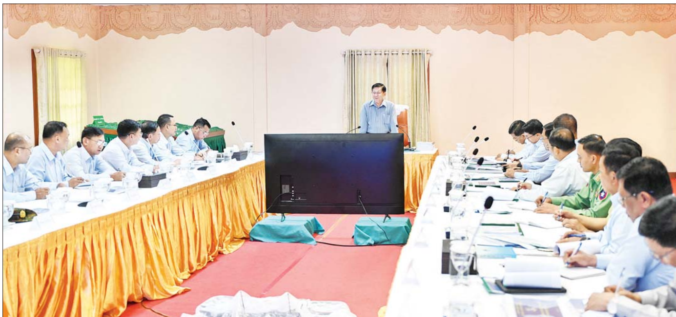
နိုင်ငံတော်စီမံအုပ်ချုပ်ရေးကောင်စီဥက္ကဋ္ဌ နိုင်ငံတော်ဝန်ကြီးချုပ် ဗိုလ်ချုပ်မှူးကြီး မင်းအောင်လှိုင် မန္တလေးတိုင်းဒေသကြီး ပြင်ဦးလွင်ခရိုင် ပြင်ဦးလွင်မြို့နယ်အတွင်း ရေရရှိရေး၊ စိုက်ပျိုးရေးနှင့် စိမ်းလန်းစိုပြည်ရေး ဆိုင်ရာ လုပ်ငန်းညှိနှိုင်းအစည်းအဝေးတွင် အမှာစကားပြောကြားစဉ်။