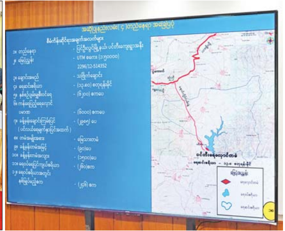
နိုင်ငံတော်စီမံအုပ်ချုပ်ရေးကောင်စီဥက္ကဋ္ဌ နိုင်ငံတော်ဝန်ကြီးချုပ် ဗိုလ်ချုပ်မှူးကြီး မင်းအောင်လှိုင် အား စိုက်ပျိုးရေး၊ မွေးမြူရေးနှင့် ဆည်မြောင်းဝန်ကြီးဌာန ပြည်ထောင်စုဝန်ကြီး ဦးမင်းနောင်က ပြင်ဦးလွင်ခရိုင် ပြင်ဦးလွင်မြို့နယ်အတွင်း သောက်သုံးရေဖူလုံစွာရရှိရေးနှင့် ပတ်သက်၍ အကောင်အထည်ဖော်ဆောင်ရွက်လျက်ရှိမှုအခြေအနေများကို ရှင်းလင်းတင်ပြစဉ်။

အစည်းအဝေးသို့ ကောင်စီတွဲဖက်အတွင်းရေးမှူး ဗိုလ်ချုပ်ကြီး ရဲဝင်းဦး၊ ကောင်စီဝင်၊ ဒုတိယဝန်ကြီး ချုပ်နှင့် ကာကွယ်ရေးဝန်ကြီးဌာန ပြည်ထောင်စု ဝန်ကြီး ဗိုလ်ချုပ်ကြီး မောင်မောင်အေး၊ ပြည်ထောင်စု ဝန်ကြီးများ၊ ကာကွယ်ရေးဦးစီးချုပ်ရုံးမှ အဆင့်မြင့် တပ်မတော်အရာရှိကြီးများနှင့် ခရီးစဉ်တွင် လိုက်ပါ လာသည့်အဖွဲ့ဝင်များ၊ မန္တလေးတိုင်းဒေသကြီး ဝန်ကြီးချုပ်၊ အလယ်ပိုင်းတိုင်းစစ်ဌာနချုပ်တိုင်းမှူး၊ ပြင်ဦးလွင်ခရိုင်နှင့် မြို့နယ်အဆင့် ဌာနဆိုင်ရာ ဝန်ထမ်းများနှင့် တာဝန်ရှိသူများ တက်ရောက်ကြ သည်။