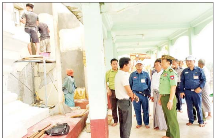
ကာကွယ်ရေးဦးစီးချုပ်ရုံး(ကြည်း)မှ ဒုတိယဗိုလ်ချုပ်ကြီး စိုးတင်နိုင် မန္တလေးမြို့ အမရပူရမြို့နယ်ရှိ ရွှေကြက်ကျ ဆုတောင်းပြည့်မြတ်စွာဘုရား ထိခိုက်ပျက်စီးခဲ့သော စေတီတော်၏ အနောက်မြောက် ထောင့်ရှိ ဂန္ဓကုဋီတိုက်အစိုးများ ပြန်လည်ပြုပြင်ဆောင်ရွက်နေမှုအခြေအနေများအား ကြည့်ရှု စစ်ဆေးစဉ်။