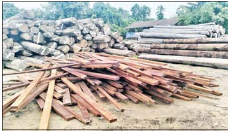
ပဲခူးတိုင်းဒေသကြီး၌ ဖမ်းဆီးရမိမှု။

ထို့ပြင် နေပြည်တော် တရားမဝင်ကုန်သွယ်မှုတိုက်ဖျက်ရေးအထူးအဖွဲ့၏ စီမံခန့်ခွဲမှုဖြင့် တာဝန်ကျပူးပေါင်းအဖွဲ့က စစ်ဆေးမှုများ ဆောင်ရွက်ခဲ့ရာ လယ်ဝေးခရိုင်အတွင်း၌ တရားမဝင် ကျွန်းသစ် ၀ ဒသမ ၂၆၈ တန် ခန့်မှန်းတန်ဖိုးငွေကျပ် ၈၅၀၀၀ ကို ဖမ်းဆီးရမိ