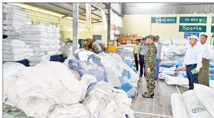
ကာကွယ်ရေးဦးစီးချုပ်ရုံး(ကြည်း)မှ ဒုတိယဗိုလ်ချုပ်ကြီး သက်ဝံ စစ်ကိုင်းမြို့ မြို့မအားကစားခန်းမ၌ ငလျင်ဒဏ်သင့်ပြည်သူများ ကူညီကယ်ဆယ်ရေးပစ္စည်းများရရှိ/ထုတ်ပေးနေမှု ကြည့်ရှုစစ်ဆေးစဉ်။

ယင်းနောက် စစ်ကိုင်းတောင်ရိုး ငလျင်ဒဏ် ကြောင့် ပြိုကျပျက်စီးခဲ့သော ဘုန်းကြီးကျောင်း၊ သီလရှင်ကျောင်းအချို့ ပြန်လည်နေရာချထားနိုင်ရေး