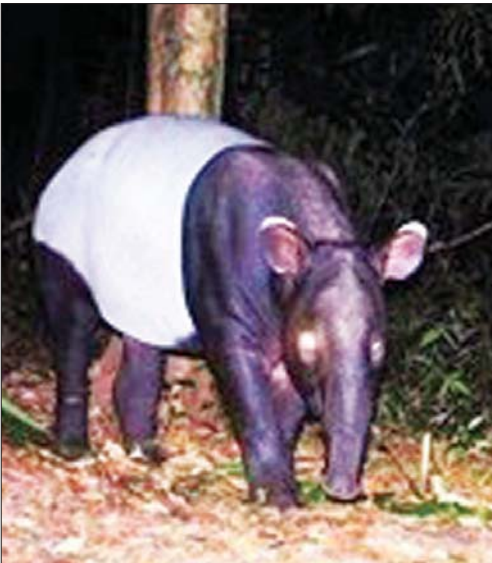
တနင်္သာရီသဘာဝကြိုးပိုင်းအတွင်း ရှင်သန်ကျက်စားလျက်ရှိသည့် အိုင်ဒိုနီးရှားကျားမျိုးစိတ်နှင့် ကြံ့သူတော်ကို တွေ့ရစဉ်။