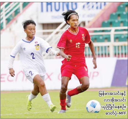
မြန်မာအသင်းနှင့် လာအိုအသင်း ယှဉ်ပြိုင်နေစဉ်၊ ဘတ်ပို-MFF

(နိုင်ငံတော်စီမံအုပ်ချုပ်ရေးကောင်စီဥက္ကဋ္ဌ နိုင်ငံတော်ဝန်ကြီးချုပ် ဗိုလ်ချုပ်မှူးကြီး မင်းအောင်လှိုင်၏ ၂၀၂၄ ခုနှစ်၊ နိုဝင်ဘာလ ၃၀ ရက်နေ့တွင် တွဲတေးမွေးမြူရေးဇုန် အကောင်အထည်ဖော် ဆောင်ရွက်ထားရှိမှု အခြေအနေများအား သွားရောက်ကြည့်ရှုစစ်ဆေးစဉ် လမ်းညွှန်မှာကြားမှုမှ ကောက်နုတ်ချက်)