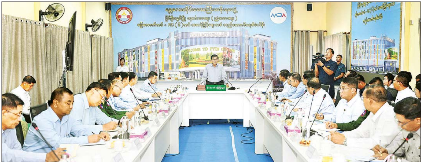
နိုင်ငံတော်စီမံအုပ်ချုပ်ရေးကောင်စီဥက္ကဋ္ဌ နိုင်ငံတော်ဝန်ကြီးချုပ် ဗိုလ်ချုပ်မှူးကြီး မင်းအောင်လှိုင် ပြင်ဦးလွင်မြို့ သုမင်္ဂလာဈေး(ညတောဈေး)အဆင့်မြင့်ဈေးသစ် တည်ဆောက်ရေးစီမံကိန်း ရှင်းလင်းဆောင်ရွက် တာဝန်ရှိသူများအား တွေ့ဆုံအမှာစကားပြောကြားစဉ်။

( ၃-၉-၂၀၂၄ ရက်နေ့တွင် နိုင်ငံတော်စီမံအုပ်ချုပ်ရေးကောင်စီဥက္ကဋ္ဌ နိုင်ငံတော်ဝန်ကြီးချုပ် ဗိုလ်ချုပ်မှူးကြီး မင်းအောင်လှိုင် ရှမ်းပြည်နယ်အစိုးရအဖွဲ့ဝင်များ၊ ပြည်နယ်နှင့် ခရိုင်အဆင့်ဌာနဆိုင်ရာတာဝန်ရှိသူများအား ပြောကြားသည့် အမှာစကားမှ ကောက်နုတ်ချက် )