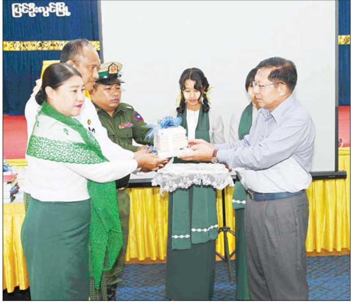
နိုင်ငံတော်စီမံအုပ်ချုပ်ရေးကောင်စီဥက္ကဋ္ဌ နိုင်ငံတော်ဝန်ကြီးချုပ် ဗိုလ်ချုပ်မှူးကြီး မင်းအောင်လှိုင် ကျောင်းစာကြည့်တိုက်အတွက် သုတ၊ ရသ စာအုပ်စာစောင်များကို ကျောင်းအုပ်ချုပ်မှုတာဝန်ခံ အရာရှိနှင့် ဆရာ ဆရာမများထံ ပေးအပ်စဉ်။

နိုင်ငံတော်အနေဖြင့်လည်း ပညာရေးကို ဘက်ပေါင်းစုံမှ အားပေးမြှင့်တင်လျက်ရှိပြီး သင်ကြား ရေးဝန်ထမ်းများအတွက်လည်း ဝတ်စုံစရိတ်များ၊ အိမ်ငှားခများ၊ ထောက်ပံ့ကြေးများ၊ ပညာရပ်ပိုင်း ဆိုင်ရာ ချီးမြှင့်မှုများကို ဆောင်ရွက်ပေးလျက်ရှိ ကြောင်း၊ ထိုသို့ဆောင်ရွက်ပေးနေခြင်းမှာ သင်ကြား ရေးတာဝန်ယူထားရသည့် ဆရာ ဆရာမများအနေ ဖြင့် မိမိတို့၏ လုပ်ငန်းတာဝန်များကို ပျော်ပျော် ရွှင်ရွှင်ဖြင့် ကျေပွန်စွာ အာရုံစူးစိုက်မှုပြည့်ရှိစွာ ဖြင့် ထမ်းဆောင်စေလို၍ဖြစ်ကြောင်း၊ အနာဂတ် တိုင်းပြည်အတွက် စိတ်ဓာတ်စည်းကမ်းကောင်းမွန် သည့် အရည်အသွေးပိုမိုကောင်းမွန်သည့် လူသား အရင်းအမြစ်ကောင်းများ မွေးထုတ်ပေးနိုင်ရေး ဆရာ ဆရာမများအနေဖြင့် ကြိုးပမ်းဆောင်ရွက်ကြ စေလိုကြောင်း၊ နိုင်ငံတော်အနေဖြင့် တစ်နိုင်ငံလုံး စာမျက်နှာ ၄ သို့