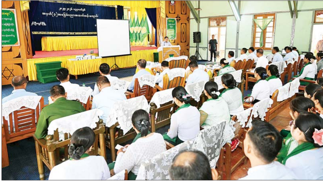
နိုင်ငံတော်စီမံအုပ်ချုပ်ရေးကောင်စီဥက္ကဋ္ဌ နိုင်ငံတော်ဝန်ကြီးချုပ် ဗိုလ်ချုပ်မှူးကြီး မင်းအောင်လှိုင် ပြင်ဦးလွင်မြို့ အမှတ်(၃) အခြေခံပညာအထက်တန်းကျောင်း၌ ဆရာ ဆရာမများအား တွေ့ဆုံအမှာစကားပြောကြားစဉ်။

ယင်းနောက် နိုင်ငံတော်စီမံအုပ်ချုပ်ရေး ကောင်စီဥက္ကဋ္ဌ နိုင်ငံတော်ဝန်ကြီးချုပ်သည် ကျောင်းစုံညီခန်းမ၌ ဆရာ ဆရာမများအား တွေ့ဆုံ ၍ အမှာစကားပြောကြားရာတွင် “အမျိုးသား စည်းကမ်းအစ စာသင်ကျောင်း”ကဟူသည့်အတိုင်း ကျောင်းသား ကျောင်းသူများ၏ အတန်းပညာ