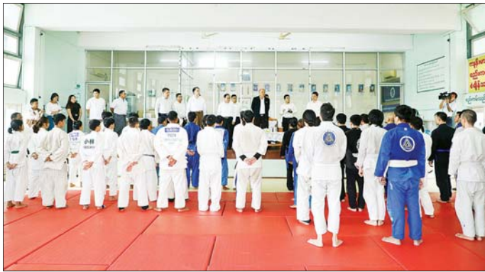
အားကစားပြိုင်ပွဲသို့ သွားရောက်ယှဉ်ပြိုင်ရာတွင် မြှင့်တင်နိုင်အောင် ကြိုးစားကြရန် မှာကြားခဲ့ကြောင်း ရွှေတံဆိပ်များဆွတ်ခူးနိုင်ပြီး နိုင်ငံတော်၏ ဂုဏ်ကို သိရှိရသည်။ သတင်းစဉ်

ပဏာမလက်ရွေးစင် ဟော်ကီအသင်းနှင့် မြန်မာနိုင်ငံရဲတပ်ဖွဲ့အသင်းတို့ သရုပ်ပြယှဉ်ပြိုင်ကစားနေမှုကို ကြည့်ရှုအားပေးပြီး သိမ်ဖြူအားကစားခန်းမရှိ ဓမ္မနှင့် Kickboxing အဖွဲ့ချုပ်၌ အဖွဲ့ချုပ်ဥက္ကဋ္ဌများ၊ ဒုတိယဥက္ကဋ္ဌများနှင့် တာဝန်ရှိသူများနှင့်တွေ့ဆုံ၍ (၃၃)ကြိမ်မြောက် အရှေ့တောင်အာရှအားကစားပြိုင်ပွဲသို့ ဝင်ရောက်ယှဉ်ပြိုင်မည့် ဓမ္မအားကစားနည်းနှင့် Kickboxing အားကစားနည်းတို့တွင် အောင်မြင်မှု ရရှိစေရေး စုပေါင်းကြိုးစားကြရန် တိုက်တွန်းမှာကြားသည်။ ထို့နောက် ပြည်ထောင်စုဝန်ကြီးနှင့် အဖွဲ့ချုပ် ဦးဝိစာရလမ်း အမျိုးသားရေကူးကန်ပိုင်းအတွင်းရှိ မြန်မာနိုင်ငံဂျူဒိုအဖွဲ့ချုပ်၌ ပဏာမလက်ရွေးစင်ဂျူဒိုအားကစားသမားများနှင့် ဂျူဒို အားကစားသမားများ သရုပ်ပြယှဉ်ပြိုင်လေ့ကျင့်နေမှုကို ကြည့်ရှုစစ်ဆေးပြီး (၃၃) ကြိမ်မြောက် အရှေ့တောင်အာရှ