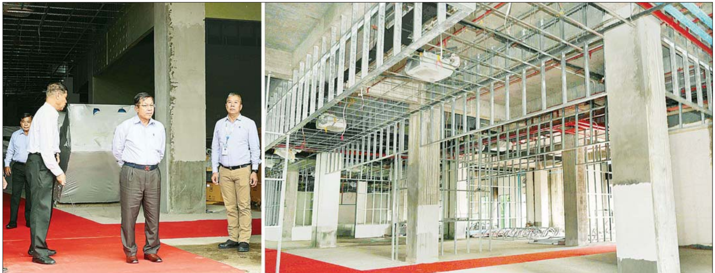
နိုင်ငံတော်စီမံအုပ်ချုပ်ရေးကောင်စီဥက္ကဋ္ဌ နိုင်ငံတော်ဝန်ကြီးချုပ် ဗိုလ်ချုပ်မှူးကြီး မင်းအောင်လှိုင် သုခလီလာဈေး(ညတောဈေး) အဆင့်မြင့်ဈေးသစ် တည်ဆောက်ရေးစီမံကိန်းအတွင်း လုပ်ငန်းအကောင်အထည်ဖော် ဆောင်ရွက်ထားရှိမှုအခြေအနေများကို ကြည့်ရှုစစ်ဆေးစဉ်။