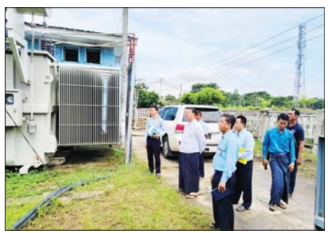
သယံဇာတဖြန့်ဖြူးမှု လုပ်ငန်းစဉ်နေရာရုံးနှင့် စာတန်းခွဲရုံးတို့အား တာဝန်ရှိသူများ ကွင်းဆင်းစစ်ဆေး

ထို့နောက် လက်ထောက် ညွှန်ကြားရေးမှူး (မြို့ပြ)နှင့် တာဝန်ရှိသူများသည် ၂၀၂၁-၂၀၂၆ ဘဏ္ဍာနှစ်တွင် နန်းကျွန်း ကျောင်းကူးတံတား ချင်းကပ်လမ်း တာဝန်ရှိသူများနှင့် တွေ့ဆုံကာ ချင်းကပ်လမ်း အကောင်အထည် ဖော်ဆောင်ရွက်ခဲ့ရာ ယခုအခါ ရာနန်းပြည့် ဆောင်ရွက်ပြီးစီးပြီ ဖြစ်သည်။