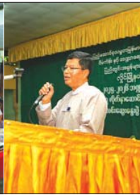
တက်ရောက်ခဲ့ကြောင်း အောင်မြင်(ပြန်/ဆက်)

မော်လမြိုင်ကျွန်း ဇွန် ၁၄ ဧရာဝတီတိုင်းဒေသကြီး မော်လမြိုင်မြို့နယ်မြို့နယ် အစိုးရအဖွဲ့၊ ဦးဆောင်၍ မြို့နယ်အသိပညာပေးခြင်းတွင် စည်းကမ်းမဲ့ အမှိုက်စွန့်ပစ်မှုမှရှောင်ရန် အသိပညာပေးခြင်း