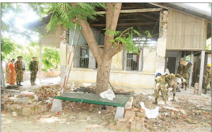
ကာကွယ်ရေးဦးစီးချုပ်ရုံး(ကြည်း)မှ ဒုတိယဗိုလ်ချုပ်ကြီး သက်ဝံ စစ်ကိုင်းမြို့ရှိ အထက(ခွဲ)ဆွမ်းချက်၌ ကြည့်ရှုစစ်ဆေးစဉ်။

ထိုသို့ဆောင်ရွက်ပေးလျက်ရှိရာ ယနေ့တွင် ကာကွယ်ရေးဦးစီးချုပ်ရုံး (ကြည်း)မှ ဒုတိယဗိုလ်ချုပ်ကြီး သက်ဝံနှင့် တာဝန်ရှိသူများသည် စစ်ကိုင်းမြို့အတွင်းရှိ သက္ကတိဘာသီလရှင်စာသင်တိုက်၊ သမ္မတရာမကျောင်းတိုက်နှင့် အခြေခံပညာအထက်တန်းကျောင်း(ခွဲ)တို့တွင် ငလျင်ဒဏ်ကြောင့် ပြိုကျပျက်စီးခဲ့သော သာသနိကအဆောက်အအုံများနှင့် စာသင်ကျောင်းဆောင်များကို လူအင်အား၊ စက်ယန္တရားအင်အားများဖြင့် အရှိန်အဟုန်ဖြင့် ဖယ်ရှားရှင်းလင်းနေမှုအခြေအနေတို့ကို လိုက်လံကြည့်ရှုစစ်ဆေးပြီး ငလျင်ဘေးဒဏ်သင့်ရဟန်း၊ သံသတော်များ၊ သီလရှင်များနှင့် လူပုဂ္ဂိုလ်များအတွက် တပ်မတော်ရေသန့်စက်ယာဉ်ဖြင့် ဧရာဝတီမြစ်ရေကို သန့်စင်၍ သန့်ရှင်းသော သောက်သုံးရေများ ပေးဝေနိုင်ရေးနှင့် ပြည်သူများ သောက်သုံးရေ ပြည့်ပြည့်ဝဝ ဖြန့်ဝေနိုင်ရေးတို့ကို ကြပ်မတ်ဆောင်ရွက်ပေးကာ ဖယ်ရှားရှင်းလင်းပြီးသော သာသနိကအဆောက်အအုံများနှင့် ကျောင်းဆောင်အဆောက်အအုံများကို ပြန်လည်ပြုပြင်မွမ်းမံတည်ဆောက်နိုင်ရေး တာဝန်ရှိသူများနှင့် ပေါင်းစပ်ညှိနှိုင်းဆောင်ရွက်ပေးကာ လုပ်အားပေးဆောင်ရွက်နေသူများအား အချီရည်များ ပေးအပ်သည်။ အလားတူ ကာကွယ်ရေးဦးစီးချုပ်ရုံး(ကြည်း)မှ ဒုတိယဗိုလ်ချုပ်ကြီး မျိုးမိုးအောင် နှင့်တာဝန်ရှိသူများသည် ယနေ့နံနက်ပိုင်းကမန္တလေးတိုင်းဒေသကြီး တံတားဦးခရိုင် တံတားဦးမြို့နယ် တံတားဦးမြို့ အခြေခံပညာအထက်တန်းကျောင်းနှင့် ကျောက်ဆည်ခရိုင် စဉ့်ကိုင်မြို့နယ် စဉ့်ကိုင်မြို့ အခြေခံပညာအထက်တန်းကျောင်း၊ ကျောက်ဆည်မြို့ အမှတ်(၃) အခြေခံပညာအထက်တန်းကျောင်း၊ အမှတ်(၁)အခြေခံပညာ အထက်တန်းကျောင်း၊ အမှတ်(၂)အခြေခံပညာ အထက်တန်းကျောင်း နေရာများသို့ သွားရောက်၍ ၂၀၂၅ ခုနှစ် တက္ကသိုလ်ဝင်စာမေးပွဲ ပြန်လည်ကျင်းပမည့် စာစစ်ဌာနများ