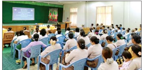
နန်းရွှေရတီ(ပြန်/ဆက်)