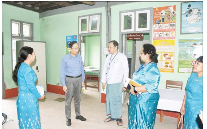
ဖွင့်လှစ်ထားရှိရာ ပြည်သူ့အားလုံးအကျုံးဝင်သည့် အားဖြည့်ဆောင်ရွက်ရန် မှာကြားခဲ့ကြောင်း သတင်း ကျန်းမာရေးစောင့်ရှောက်မှုကို ယခုထက် ပိုမို ဖြည့်ဆည်း ရရှိသည်။ သတင်းစဉ်

ဦးစွာ ပြည်ထောင်စုဝန်ကြီးနှင့်အဖွဲ့သည် လှိုင် မြို့နယ်နှင့် မင်္ဂလာဒုံမြို့နယ်တို့ရှိ ဒေသန္တရကျန်းမာ ရေးဌာနများ၌ အဆိုပါဌာနမှ ကျန်းမာရေးဝန်ထမ်း များနှင့် တွေ့ဆုံပြီး ဒေသန္တရကျန်းမာရေးဌာန များနှင့် ဝန်ထမ်းအိမ်ရာများကို လှည့်လည်ကြည့်ရှု ကာ လိုအပ်ချက်များ ဖြည့်ဆည်းဆောင်ရွက်ပေး သည်။