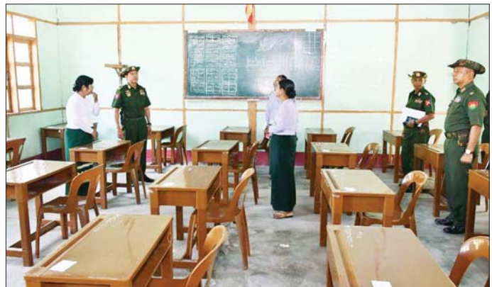
ကာကွယ်ရေးဦးစီးချုပ်ရုံး(ကြည်း)မှ ဒုတိယဗိုလ်ချုပ်ကြီး မျိုးမိုးအောင် ကျောက်ဆည်မြို့ အမှတ်(၃) အခြေခံပညာအထက်တန်းကျောင်း၌ ပြန်လည်ကျင်းပမည့် ၂၀၂၅ ပညာသင်နှစ် တက္ကသိုလ်ဝင်စာမေးပွဲအတွက် ကြိုတင်ပြင်ဆင်ထားရှိမှုအခြေအနေများ ကြည့်ရှုစစ်ဆေးစဉ်။

ညှိနှိုင်း ဆောင်ရွက်ပေးသည်။ ယင်းနောက် အမရပူရမြို့နယ်ရှိ မဟာရတနာမဉ္ဇူတိ လောကမာရ်အောင် အောင်မြေရွှေတံမြတ်စွာဘုရားသို့သွားရောက်၍ ငလျင်ဒဏ်ကြောင့် ပြိုကျပျက်စီးသွားသော သာသနိကအဆောက်အအုံအပျက်အစီးများနှင့် ဘုရားစေတီအပျက်အစီးများကို တပ်မတော်သားစစ်သည်များက အင်တိုက်အားတိုက်ရှင်းလင်းဖယ်ရှားနေမှုများ၊ စက်ယန္တရားကြီးများ အသုံးပြု၍ အပျက်အစီးများ ရှင်းလင်းဆောင်ရွက်နေမှု အခြေအနေများ၊ ပြန်လည်တူးဖော်ရရှိသော ဌာပနာပစ္စည်းများ စနစ်တကျထိန်းသိမ်း ဆောင်ရွက်ထားရှိမှု အခြေအနေများကို ကြည့်ရှုစစ်ဆေးပြီး တာဝန်ရှိသူများ၏ တင်ပြချက်များအပေါ် လိုအပ်သည်များ ပေါင်းစပ်ညှိနှိုင်း ဆောင်ရွက်ပေးသည်။ အလားတူ အလယ်ပိုင်းတိုင်းစစ်ဌာနချုပ်တိုင်းမှူး ဗိုလ်မှူးချုပ် ကျော်ကိုထိုက်နှင့် တာဝန်ရှိသူများသည် မန္တလေးတိုင်းဒေသကြီး မတ္တရာမြို့နယ် ထီးတော်မိုးကျေးရွာရှိ အခြေခံပညာအထက်တန်းကျောင်း(ခွဲ)သို့ သွားရောက်၍ ပြန်လည်ကျင်းပမည့် ၂၀၂၅ ခုနှစ် တက္ကသိုလ်ဝင်စာမေးပွဲအတွက် စာစစ်ဌာန၌ ကြိုတင်ပြင်ဆင်ထားရှိမှု အခြေအနေများ၊ ကျောင်းသား ကျောင်းသူများ ဘေးကင်းလုံခြုံအေးချမ်းစွာဖြေဆိုနိုင်ရေးအတွက် ကြိုတင်ပြင်ဆင်ဆောင်ရွက်ထားရှိမှုအခြေအနေများ၊ ကျန်းမာရေးစောင့်ရှောက်မှုပေးနိုင်ရေးအတွက် ပြင်ဆင်ဆောင်ရွက်ထားရှိမှု အခြေအနေများကို ကြည့်ရှုစစ်ဆေး၍ တာဝန်ရှိသူများ၏ တင်ပြချက်များအပေါ် လိုအပ်သည်များ ပေါင်းစပ်ညှိနှိုင်း ဆောင်ရွက်ပေးသည်။ ထို့နောက် စာမေးပွဲဖြေဆိုမည့် ကျောင်းသားကျောင်းသူများအား ဧွေဆုံအားပေးစကားပြောကြားပြီး ဆရာ ဆရာမများနှင့် ကျောင်းသားကျောင်းသူများအတွက် စားသောက်ဖွယ်ရာများ ပေးအပ်ခဲ့ကြောင်း သတင်းရရှိသည်။ သတင်းစဉ်