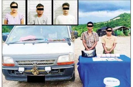
သာစည်မြို့နယ် ကျွဲတပ်ဆုံကျေးရွာအနီး၌ တရားခံများအား ဖမ်းဆီးရမိသည့် မူးယစ်ဆေးဝါးများနှင့်အတူ တွေ့ရစဉ်။

လပွတ္တာ ဇွန် ၁၄ ရောဂတ်တိုင်းဒေသကြီး လပွတ္တာမြို့နယ် သဘာဝရေပြင်အတွင်း ယနေ့နံနက် ၉ နာရီခွဲက ပညာဝန်ကြီးဌာနအုပ်စု ရှမ်းစုကျေးရွာ ဆည်းမြောင်းတာတစ်အတွင်းသို့ ငါးမြစ်ချင်းကောင်ရေ တစ်သိန်းနှင့် ငါးခုံးမကြီးကောင်ရေတစ်သိန်း စုစုပေါင်း ငါးကောင်ရေနှစ်သိန်းကို မျိုးစိုက်ထည့်ခဲ့သည်။ အဆိုပါ အခမ်းအနားသို့ ခရိုင်စီမံအုပ်ချုပ်ရေးအဖွဲ့ ဥက္ကဋ္ဌ