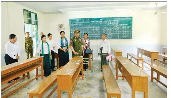
ကာကွယ်ရေးဦးစီးချုပ်ရုံး(ကြည်း)မှ ဒုတိယဗိုလ်ချုပ်ကြီး စိုးတင်နှင့် မန္တလေးမြို့ ချမ်းအေးသာစံမြို့နယ် အမှတ်(၅) အခြေခံပညာ အထက်တန်းကျောင်း၌ ပြန်လည်ကျင်းပမည့် ၂၀၂၅ ပညာသင်နှစ် တက္ကသိုလ်ဝင်စာမေးပွဲအတွက် ကြိုတင်ပြင်ဆင်ထားရှိမှုအခြေအနေများ ကြည့်ရှုစစ်ဆေးစဉ်။