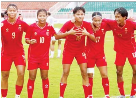
အာဆီယံ ယူ-၁၉ အမျိုးသမီးပြိုင်ပွဲယှဉ်ပြိုင်နေသည့် မြန်မာ ယူ-၁၉ အမျိုးသမီးအသင်း။