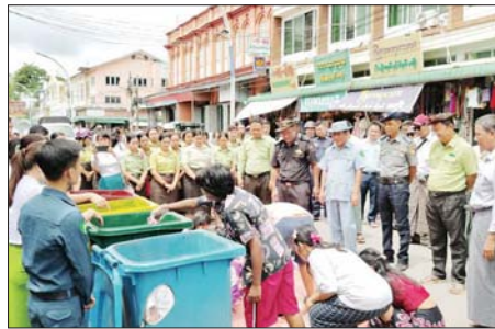
အမှိုက်များခွဲခြားစွန့်ပစ်ရန် အသိပညာပေးခြင်းနှင့် လက်တွေ့သရုပ်ပြဆောင်ရွက်ခြင်းများ ပြုလုပ်

မြောင်းမြ ဇွန် ၁၄ ဧရာဝတီတိုင်းဒေသကြီး မြောင်းမြ မြို့နယ်၌ ယနေ့ နံနက် ၁၀ နာရီ က အမှိုက်များ ခွဲခြားစွန့်ပစ် ရန် အသိပညာပေးခြင်းနှင့် လက်တွေ့သရုပ်ပြ ဆောင်ရွက် ခြင်းတို့ကို မြောင်းမြမြို့နယ် စည်ပင်သာယာရေးအဖွဲ့ ရုံးဝင်း အတွင်း၌ ကျင်းပသည်။