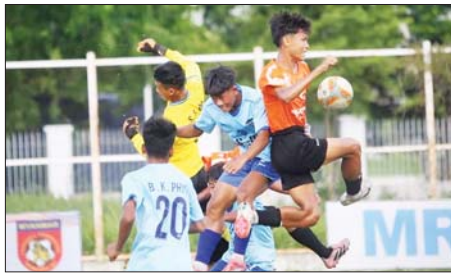
Youth Soccer Future အသင်းနှင့် အနီးစခန်းအသင်း ယှဉ်ပြိုင်စဉ်။

◆ ကျောမိုးမှ သစ်ပုပ်မျော ၄၅ လုံးနှင့် လက်တွန်း ထွန်စက်တစ်စီး စုစုပေါင်း ခန့်မှန်းတန်ဖိုးငွေကျပ် ၄၄၅၇၂၀၀ ကို ဖမ်းဆီးရမိခဲ့ပြီး သစ်တောဥပဒေနှင့်အညီ အရေးယူ ဆောင်ရွက်လျက်ရှိသည်။ ဇွန် ၁၂ ရက်တွင် မန္တလေး တိုင်းဒေသကြီး တရားမဝင် ကုန်သွယ်မှုတိုက်ဖျက်ရေးအထူး အဖွဲ့၏ စီမံခန့်ခွဲမှုဖြင့် တာဝန်ကျ ပူးပေါင်းအဖွဲ့များက စစ်ဆေးမှု များ ဆောင်ရွက်ခဲ့ရာ ဟန်မြင့်မိုရ် ရွာငလမ်း၊ ဆင်ခေါင်းတောင်အနီး ၌ မူဆယ်မြို့မှ မန္တလေးမြို့သို့ မောင်းနှင်လာသည့် မော်တော် ယာဉ် သုံးစီးပေါ်မှ တရားဝင် စာရွက်စာတမ်းအထောက်အထား တင်ပြနိုင်ခြင်းမရှိသည့် လုပ်ငန်း သုံးပစ္စည်းငါးမျိုး၊ လူသုံးကုန် ပစ္စည်းသုံးမျိုး၊ စားသောက်ကုန် ပစ္စည်းနှစ်မျိုး (ခန့်မှန်းတန်ဖိုး ငွေကျပ် ၅၈၈၂၄၂၀၀)နှင့် အဆိုပါ ပစ္စည်းများ တင်ဆောင်လာသည့် စက်မှုဇုန်ထုတ် Hinthar Truck တစ်စီး၊ Nissan Diesel Truck တစ်စီး၊ Nissan Diesel Tractor