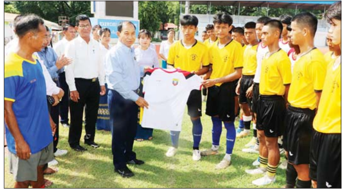
ပန်းတိုင်အထွက်နှုန်းရရှိရေးအတွက် လုပ်ငန်းများ ပြည့်ဆည်းပေါင်းစပ်ဆောင်ရွက်ပေးပြီး နိဂုံးချုပ် ဆောင်ရွက်နေမှုအခြေအနေများနှင့် ပတ်သက်၍ အမှာစကား ပြောကြားခဲ့ကြောင်း သိရသည်။ တိုင်းဒေသကြီး ချုပ်က လိုအပ်သည်များကို တာဝန်ရှိသူများနှင့် (ပြန်/ဆက်)

ဆက်လက်၍ တိုင်းဒေသကြီး ဝန်ကြီးများက တိုင်းဒေသကြီးအတွင်း ဆီထွက်သီးနှံ နှမ်းနှင့်နေကြာ