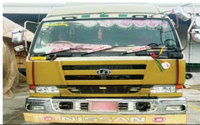
မန္တလေးတိုင်းဒေသကြီး၌ ဖမ်းဆီးရမိမှု။