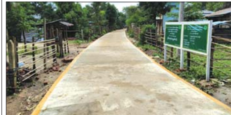
မောင်ခိုင်

အဓိကထား စားကြသောကြောင့် ခြင်္သေ့နို့ခန်းရေး ငါးမျိုးအဖြစ် ကျော်ကြားသည်။ ခြင်္သေ့နို့ခန်းရေးသော ခြင်္သေ့များတစ်ဆင့် ပိုးလောင်လမ်းများဖြစ်နေသော ရေပြင်ထဲသို့ ဒေါင်းငါးမျိုးများကို တစ်ကြိမ်ထည့်ပေး ထားရုံဖြင့် ၎င်းငါးလေးများက ခြင်္သေ့နို့ခန်းရေးကို သားစဉ်မြေးဆက်အလိုက် စဉ်ဆက်မပြတ် ပြုလုပ်ပေးသွားကြမည်ဖြစ်သည်။ ဤနည်းလမ်းသည် သက်ရှိကို သက်ရှိဖြင့် ပြန်လည်ထိန်းချုပ်သည့် ဇီဝနည်း (Biological Control) ဖြစ်သည်။