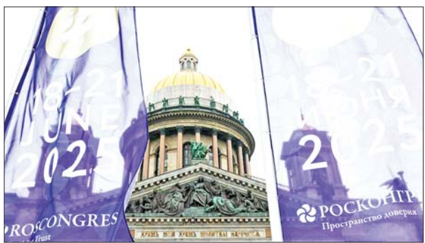
ရုရှားနိုင်ငံ စိန့်ပီတာစဘတ်မြို့၌ နိုင်ငံတကာစီးပွားရေးဖိုရမ် ယနေ့စတင်ဖွင့်လှစ်

မီးတောင် ပေါက် ကွဲမှု ကြောင့် အသေအပျောက်မရှိသော်လည်း လမ်းများတွင် ပြာများနှင့် ကျောက်စရစ် အမြောက်အမြား ဖုံးလွှမ်းထားသည်။ အိမ်ရှေ့မြက်ခင်းပြင်တွင် မီးခိုးပြာများနှင့် ကျောက်ခဲများ မိုးရွာသကဲ့သို့ ကျလာကြောင်း အသက် ၃၄ နှစ်အရွယ်အမျိုးသမီးတစ်ဦးက မီးတောင်ပေါက်ကွဲမှု အတွေ့အကြုံကို ပြန်လည်ပြောကြားသည်။