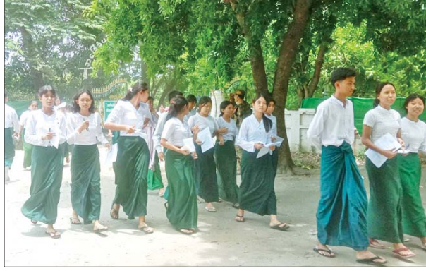
စဉ့်ကိုင်မြို့နယ်၌ တက္ကသိုလ် ဝင်စာမေးပွဲဖြေဆိုပြီး ပြန်လည် ထွက်ခွာလာသည့် ကျောင်းသား ကျောင်းသူများကို တွေ့ရစဉ်။ ကျော်စွာ(စဉ့်ကိုင်)