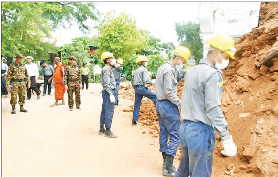
ကာကွယ်ရေးဦးစီးချုပ်ရုံး(ကြည်း)မှ ဒုတိယဗိုလ်ချုပ်ကြီး သက်ပုံ နဝလောဟာကျောင်းတိုက်တွင် ကြည့်ရှုစစ်ဆေးစဉ်။

ထို့နောက် စစ်ကိုင်းမြို့ ငလျင်ဒဏ်သင့် ရဟန်း၊ သံဃာတော်များ၊ သီလရှင်များနှင့် လူပုဂ္ဂိုလ် များအား တပ်မတော်နယ်လှည့်ဆေးကုသရေးအဖွဲ့က ကျန်းမာရေးစောင့်ရှောက်ပေးနေမှု အခြေအနေများ၊ စစ်ကိုင်းတောင်ရှိ ငလျင်ဒဏ်ကြောင့် ပြိုကျပျက်စီး ခဲ့သော ဘုန်းကြီးကျောင်း၊ သီလရှင်ကျောင်းများ ပြန်လည်တည်ဆောက်ရန်အတွက် လျာထား မြေလွတ်နေရာအား စက်ယန္တရားကြီးဖြင့် ဖယ်ရှား