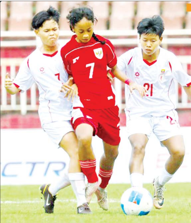
မြန်မာနှင့် အင်ဒိုနီးရှားအသင်းတို့ ယှဉ်ပြိုင်ကစားကြစဉ်။

(နိုင်ငံတော်စီမံအုပ်ချုပ်ရေးကောင်စီဥက္ကဋ္ဌ တပ်မတော် ကာကွယ်ရေးဦးစီးချုပ် ဗိုလ်ချုပ်မှူးကြီး မင်းအောင်လှိုင်၏ ၂၀၂၄ ခုနှစ်၊ ဒီဇင်ဘာလ ၆ ရက်နေ့တွင် ပြုလုပ်သော စစ်တက္ကသိုလ် ဗိုလ်လောင်းသင်တန်း အမှတ်စဉ်(၆၆) သင်တန်းဆင်းပွဲ အခမ်းအနားတွင် ပြောကြားသည့် မိန့်ခွန်းမှ ကောက်နုတ်ချက်)