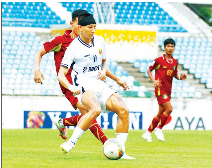
ရှမ်းယူနိုက်တက်အသင်းနှင့် မြဝတီအသင်းတို့ ယှဉ်ပြိုင်ကစားကြစဉ်။

၂၀၂၅ MNL League Cup ပြိုင်ပွဲ ကွာတားဖိုင်နယ် ပထမနေ့ကို ဇွန် ၁၈ ရက်ကကျင်းပရာ လက်ရှိချန်ပီယံ ရှမ်းယူနိုက်တက်နှင့် ရတနာပုံအသင်းတို့ ဆီမီးဖိုင်နယ် တက်ရောက်သွားသည်။ သုဝဏ္ဏကွင်း၌ ကျင်းပသည့်ပွဲတွင် လက်ရှိချန်ပီယံ ရှမ်းယူနိုက်တက်အသင်းက မြဝတီအသင်းကို နှစ်ဂိုး-ဂိုးမရှိဖြင့် အနိုင်ရရှိသည်။ ရှမ်းယူနိုက်တက်အသင်းသည် ပထမပိုင်းသွင်းဂိုးများဖြင့် အနိုင် ရရှိကာ ဆီမီးဖိုင်နယ် တက်ရောက်နိုင်ခဲ့ ခြင်းဖြစ်သည်။ အုပ်စုအဆင့်တွင် ဒဂုံ စတားအသင်းကို ကျော်ဖြတ်ပြီး ကွာတား ဖိုင်နယ် တက်ရောက်လာသည့် မြဝတီ အသင်းသည် ရှမ်းယူနိုက်တက်အသင်းကို စာမျက်နှာ ၁၉ ကော်လံ ၃ သို့ ၂