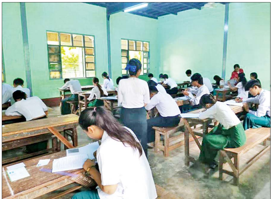
လယ်ဝေးမြို့နယ်၌ ၂၀၂၅ ခုနှစ် တက္ကသိုလ်ဝင်စာမေးပွဲ ပြန်လည်ဖြေဆိုကြသည့် Grade-12 ကျောင်းသား ကျောင်းသူများ သင်္ချာဘာသာရပ် ဖြေဆိုနေမှုကို တွေ့ရစဉ်။ မြို့နယ်(ပြန်/ဆက်)