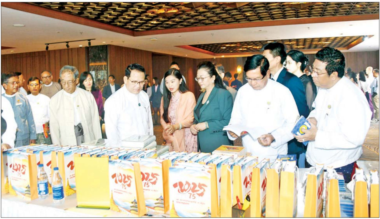
ပြည်ထောင်စုဝန်ကြီး ဦးမောင်မောင်အုန်းနှင့် ဧည့်သည်တော်များ တရုတ်-မြန်မာ သံတမန်ဆက်ဆံရေးထူထောင်ခြင်း (၇၅)နှစ်မြောက် အထိမ်းအမှတ် ဇာတ်လမ်းပုံပြင်များ စုစည်းမှုစာအုပ်များ၊ မှတ်တမ်းနှင့် DVD များ ခင်းကျင်းပြသပေးဝေနေမှုကို ကြည့်ရှုအားပေးကြစဉ်။

ရန်ကုန် ဇွန် ၁၈ မြန်မာ-တရုတ်နှစ်နိုင်ငံအကြား ရေရှည်တည်တံ့သော ပေါက်ဖော် ချစ်ကြည်ရင်းနှီးမှုကို ဖော်ညွှန်း သည့် မြန်မာ-တရုတ် သံတမန် ဆက်ဆံရေး (၇၅)နှစ်မြောက် အထိမ်းအမှတ် ဇာတ်လမ်းပုံပြင် များစုစည်းမှုပေါက်ဖော်နှလုံးသား ထဲမှစကားသံများစာအုပ်မိတ်ဆက် ပွဲနှင့် ဆုချီးမြှင့်ပွဲအခမ်းအနားကို ယနေ့နံနက်ပိုင်းတွင် ရန်ကုန်မြို့၊ Wyndham Grand Yangon Hotel ၌ ကျင်းပသည်။