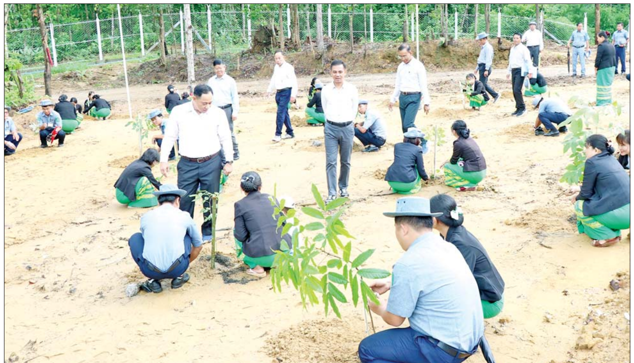
ကြောင်းနှင့် နယ်စပ်ရေးရာဝန်ကြီး တွင် ပျိုးပင်ပေါင်း ၈၆၂၁ ပင် ဖြစ်ထွန်းရေးအတွက် ဆက်လက် မည်ဖြစ်ကြောင်း သိရသည်။ ဌာန တစ်ခုလုံးအနေဖြင့် ယနေ့ စိုက်ပျိုးခဲ့ပြီး ရှင်သန်အောင်မြင် ထိန်းသိမ်းပြုစု ဆောင်ရွက်သွား သတင်းစဉ်