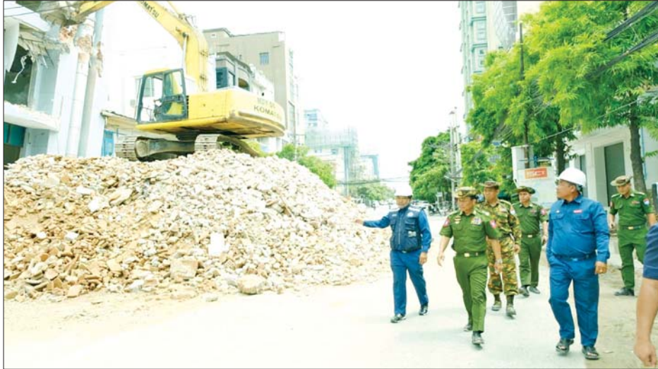
ကာကွယ်ရေးဦးစီးချုပ်ရုံး(ကြည်း)မှ ဒုတိယဗိုလ်ချုပ်ကြီး စိုးတင်နိုင်နှင့် တာဝန်ရှိသူများ ချမ်းအေး သာစံမြို့နယ် အောင်နန်းအရှေ့ရပ်ကွက်ရှိ ငလျင်ဒဏ်ကြောင့်ပြိုကျပျက်စီးခဲ့သည့် အန္တရာယ်ရှိအဆောက် အအုံအပျက်အစီးများ ရှင်းလင်းဖယ်ရှားနေမှုကို ကြည့်ရှုစစ်ဆေးစဉ်။

ရှင်းလင်းနေမှုအခြေအနေများနှင့် အမှိုက်များစွန့်ပစ် သည့်နေရာသို့ သွားရောက်ကြည့်ရှုပြီး စနစ်တကျ စွန့်ပစ်နိုင်ရေး တာဝန်ရှိသူများနှင့် ပေါင်းစပ်ညှိနှိုင်း ဆောင်ရွက်ပေးသည်။