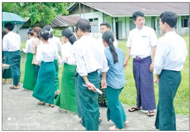
နန်းယွန်း မြို့နယ်၌ တက္ကသိုလ်ဝင် စာမေးပွဲ လာရောက် ဖြေဆိုသည့် ကျောင်းသား ကျောင်းသူများ ကို တွေ့ရစဉ်။ မြို့နယ်(ပြန်/ဆက်)