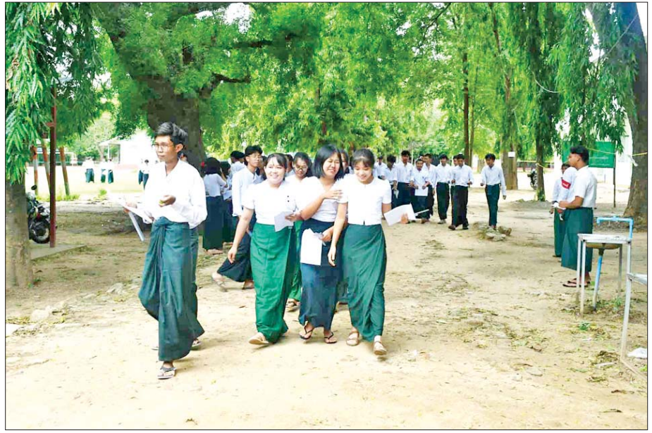
တပ်ကုန်းမြို့နယ်၌ တက္ကသိုလ်ဝင်စာမေးပွဲဖြေဆိုပြီး ပြန်လည်ထွက်ခွာလာသည့် ကျောင်းသား ကျောင်းသူများကို တွေ့ရစဉ်။ တင်စိုးလွင်