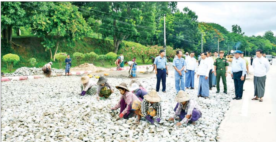
မှာကြားသည်။ ယင်းနောက် ငလျင်ဘေး ကြောင့် ထိခိုက်ပျက်စီးခဲ့သည့် မင်္ဂလာကန် ကန်ပတ်လမ်းအား ပြန်လည်ပြုပြင်မှု၊ ဇမ္ဗူသီရိ မြို့နယ် ပျဉ်းမနား-တောင်ညို လမ်း၊ ရာဇသင်္ဂဟလမ်း၊ ဇေယျဌာနီလမ်း၊ ပုဗ္ဗသီရိမြို့နယ် ရာဇဌာနီလမ်းနှင့် ဥတ္တရသီရိ မြို့နယ်မန္တလေးလမ်း၊ သီရိရတနာ လမ်းများ၌ ငလျင်ဘေးကြောင့် ထိခိုက်ပျက်စီးခဲ့သည့် လမ်းပိုင်း များ ပြန်လည်ပြုပြင်နေမှု အခြေ အနေများကို လှည့်လည်ကြည့်ရှု စစ်ဆေးပြီး လုပ်ငန်းများ အမြန် ပြီးစီးအောင် ဆောင်ရွက်ရေး၊ လုပ်ငန်းသုံးကျောက်များသတ်မှတ် အရွယ်အစားအတိုင်း အသုံးပြု

နေပြည်တော် ဇွန် ၁၈ နေပြည်တော်ကောင်စီဥက္ကဋ္ဌ ဦးသန်းထွန်းဦးသည် နေပြည်တော် ကောင်စီဝင်များနှင့်အတူ ယနေ့ နံနက်ပိုင်းတွင် ၂၀၂၅ ခုနှစ် တက္ကသိုလ်ဝင်စာမေးပွဲ ပြန်လည် ဖြေဆိုနေသည့် ဇမ္ဗူသီရိမြို့နယ် အမှတ်-၆ အခြေခံပညာအထက် တန်းကျောင်း စာစစ်ဌာနသို့ သွားရောက်၍ ကျောင်းသား ကျောင်းသူများ စိတ်ချမ်းမြေ့စွာ စာမေးပွဲဖြေဆိုနေမှုကို လှည့်လည် ကြည့်ရှုအားပေးပြီး စာမေးပွဲ ကာလအတွင်း အနှောင့်အယှက် များ၊ အခက်အခဲများမရှိအောင် ပိုင်းဝန်း ပူးပေါင်းဆောင်ရွက် နိုင်ရေး၊ လိုအပ်ချက်များကို အချိန်နှင့်တစ်ပြေးညီ ဖြည့်ဆည်း ဆောင်ရွက်ပေးနိုင်ရေး တို့ကို