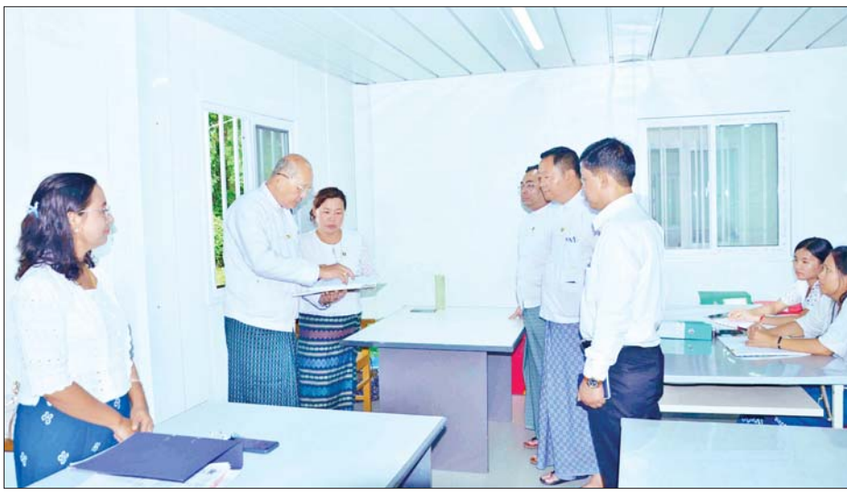
သက်ဆိုင်ရာကဏ္ဍများအလိုက် လုပ်ငန်းတာဝန် လိုအပ်ချက်နှင့် တင်ပြချက်များကို ဖြည့်ဆည်း ထမ်းဆောင်နေမှုကို လှည့်လည်ကြည့်ရှုစစ်ဆေးပြီး ဆောင်ရွက်ပေးခဲ့ကြောင်း သိရသည်။ သတင်းစဉ်

နေပြည်တော် ဇွန် ၁၈ အားကစားနှင့် လူငယ်ရေးရာဝန်ကြီးဌာန ပြည်ထောင်စုဝန်ကြီး Jeng Phang နော်တောင်သည် ဒုတိယဝန်ကြီးများဖြစ်ကြသည့် ဦးထိန်လင်း၊ ဦးဇော်မင်းထက်၊ ဌာနဆိုင်ရာ တာဝန်ရှိသူများနှင့်အတူ ယနေ့နံနက်ပိုင်းတွင် Basha တည်ဆောက်ပြီးစီးမှုနှင့် Prefabricated Offices တွင် ဝန်ထမ်းများ ရုံးလုပ်ငန်းဆောင်ရွက်နေမှုကို လှည့်လည်ကြည့်ရှု စစ်ဆေးသည်။ ဆွေးနွေးမှာကြား ဦးစွာ ပြည်ထောင်စုဝန်ကြီးနှင့်အဖွဲ့သည် နေပြည်တော် အားကစားလေ့ကျင့်ရေးစခန်း (Gold Camp) မိန်းဂိတ်ဝ ဘယ်၊ ညာရှိ နှစ်ခန်းတွဲ လေးခန်း ပါ Basha တည်ဆောက်ပြီးစီးမှုကို ကြည့်ရှုစစ်ဆေးပြီး လိုအပ်သည့် အားကစားနှင့် ကာယ ပညာဦးစီးဌာန အားကစားကွင်း၊ အားကစားရုံနှင့် ဝန်ထမ်းများ၏ ရုံးလုပ်ငန်းဆောင်ရွက်နေမှု