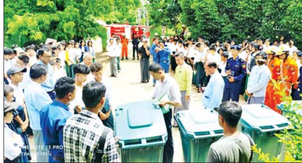
စနစ် ဆောင်ရွက်ရေးအတွက် ကျောင်းသား ကျောင်းသူများနှင့် ပြည်သူများအား အသိပညာပေးဟောပြောခြင်းလက်ကမ်းစာစောင်

ပဲခူးတိုင်းဒေသကြီး ပေါက်ခေါင်းမြို့နယ်၌ ဇွန် ၁၇ ရက် နံနက်ပိုင်းက အထွေထွေအုပ်ချုပ်ရေးဦးစီးဌာန၊ အထက(ပေါက်ခေါင်း)နှင့် မြို့မဈေးတို့၌ အမှိုက်ခွဲခြားစွန့်ပစ်ခြင်းဆိုင်ရာ အသိပညာပေး