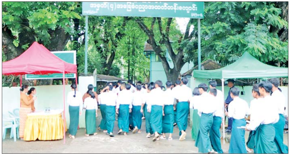
မြစ်ကြီးနားမြို့ အမှတ်(၄)အခြေခံပညာအထက်တန်းကျောင်း၌ တက္ကသိုလ်ဝင်စာမေးပွဲ လာရောက် ဖြေဆိုကြသည့် ကျောင်းသား ကျောင်းသူများကို တွေ့ရစဉ်။

ဝန်ထမ်းများ၊ မီးသတ်တပ်ဖွဲ့နှင့် လုံခြုံရေးတပ်ဖွဲ့ဝင် များ၊ ယာဉ်ထိန်းတပ်ဖွဲ့ဝင်များဖြင့် လုံခြုံရေးဆိုင်ရာ ကိစ္စရပ်များနှင့် အခြားလိုအပ်သည်များကို စနစ်တကျ စီမံဆောင်ရွက်ထားရှိကြောင်း သိရ သည်။ သတင်းစဉ်