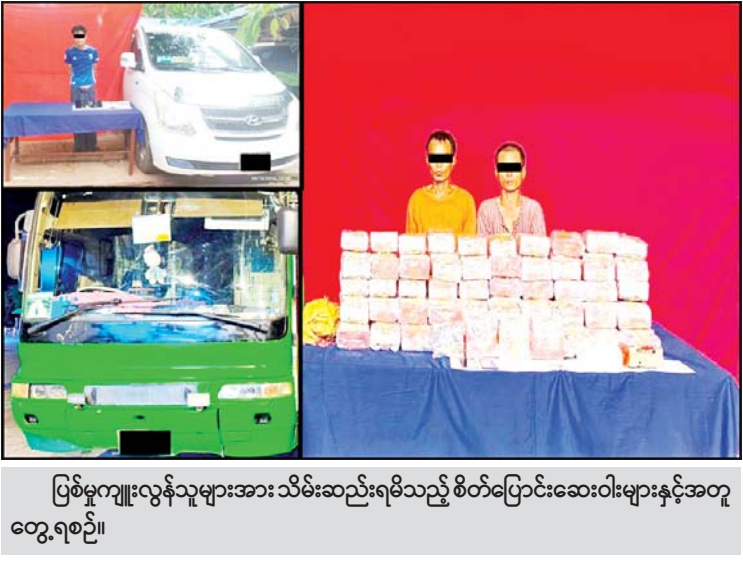
ပြစ်မှုကျူးလွန်သူများအား သိမ်းဆည်းရမိသည့် စိတ်ပြောင်းဆေးဝါးများနှင့်အတူ တွေ့ရစဉ်။

STAREX ယာဉ်တစ်စီးနှင့်အတူ ဖမ်းဆီးရမိခဲ့ပြီး စစ်ဆေးဖော်ထုတ်ချက်များအရ သိမ်းဆည်းရမိ အိုက်စ(မက်သ်အဖက်တမင်း) များကို ရန်ကုန်မြို့မှ တစ်ဆင့် မြဝတီမြို့သို့ သယ်ဆောင် ရောင်းဝယ်ခြင်းဖြစ်ကြောင်း သိရှိရသဖြင့် ၎င်းတို့ သုံးဦးအား ဥပဒေအရအရေးယူ ထားရှိပြီး ကွင်းဆက် ပြစ်မှုကျူးလွန်သူများကို ဆက်လက်ဖော်ထုတ်လျက်ရှိကြောင်း သိရသည်။ သတင်းစဉ်