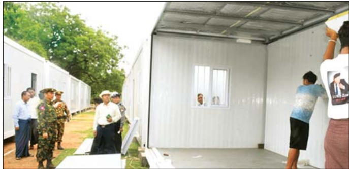
ကာကွယ်ရေးဦးစီးချုပ်ရုံး(ကြည်း)မှ ဒုတိယဗိုလ်ချုပ်ကြီး သက်ဝင် လျှင်ဒဏ်သင့်ပြည်သူများ နေထိုင်ရန် Modular house ဆောက်လုပ်နေမှုများကို ကြည့်ရှုစစ်ဆေးစဉ်။

တာဝန်ရှိသူများနှင့် ပေါင်းစပ်ညှိနှိုင်း ဆောင်ရွက်ပေးသည်။ ထို့နောက် သကျစိတသီလရှင်စာသင်တိုက်၊ ဇေယျမင်္ဂလာဆူတောင်းပြည့်ဘုရား၊ စိန်ရတနာကျောင်းတိုက်နှင့် ရတနာအောင်မြင်ကျောင်းတိုက်များ၌ လျှင်ဒဏ်ကြောင့် သာသနာ့ကအဆောက်အအုံများကိုအဖွဲ့အစည်းအသီးသီးကစက်ယန္တရားကြီးများအသုံးပြု၍ အရှိန်အဟုန်ဖြင့် အပြီးသတ်ဖယ်ရှားရှင်းလင်းပြီး ပြန်လည်တည်ဆောက်နေမှု၊ မဟာစည်းခုံကြီးစေတီတော် ပရိသတ်အတွင်း၌ လျှင်ဒဏ်သင့်ပြည်သူများ နေထိုင်နိုင်ရန်အတွက် Modular House ဆောက်လုပ်ပြီးစီးနေမှု၊ စစ်ကိုင်းမြို့အတွင်း လျှင်ဒဏ်သင့် လူနေအဆောက်အအုံများ၊ လမ်းတစ်လျှောက် လမ်းဘေးဝဲ/ယာများရှိ အပြုအပျက်များကို မြှူအင်္ဂါရပ်နှင့်အညီ သန့်ရှင်းသန့်ရှင်းသန့်ရှင်းရေး လုပ်ငန်းများနှင့် ပေါင်းစပ်ညှိနှိုင်း ဆောင်ရွက်ပေးသည်။ ထို့နောက် မဟာအောင်မြေမြို့နယ် မဟာအောင်မြေအနောက်ရပ်ကွက် ချမ်းအေးသာစံမြို့နယ် အလယ်ရပ်ကွက်နှင့် အနောက်ရပ်ကွက်တို့ရှိ လျှင်ဒဏ်ကြောင့် ပျက်စီးခဲ့သည့် အန္တရာယ်ရှိ အဆောက်အအုံအပျက်အစီးများအား စက်ယန္တရားကြီးများ အသုံးပြု၍ အင်တိုက်အားတိုက် ရှင်းလင်းဖယ်ရှားနေမှုများကို ကြည့်ရှုစစ်ဆေးပြီး လုပ်ငန်းခွင်အန္တရာယ်ကင်းရှင်းစေရေးအထူးဂရုပြုဆောင်ရွက်ရန် မှာကြားပြီး တာဝန်ရှိသူများ၏ တင်ပြချက်များအပေါ် လိုအပ်သည်များ ပေါင်းစပ်ညှိနှိုင်းဆောင်ရွက်ပေးခဲ့ကြောင်း သတင်းရရှိသည်။ သတင်းစဉ်