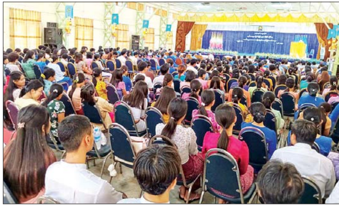
တွင်လည်းကောင်း၊ ပလတ်စတစ်အမှိုက်များကို အပြာရောင်အမှိုက်ပုံးတွင်လည်းကောင်း စနစ်တကျ ခွဲခြားစွန့်ပစ်ခြင်းကို သရုပ်ပြသပြီး ကျောင်းသား ကျောင်းသူများက လက်တွေ့လိုက်ပါဆောင်ရွက်ခဲ့ရာ

ဦးစွာ မြို့နယ်စည်ပင်သာယာရေးကော်မတီ ဝန်ထမ်းများက အမှိုက်များကို စနစ်တကျခွဲခြားစွန့်ပစ်ခြင်းဖြင့် ပြန်လည်အသုံးပြုနိုင်မှု၊ ပတ်ဝန်းကျင် အတွက် ဘေးကင်းစေမှု၊ ကျန်းမာရေးကောင်းမွန်မှု၊ စွမ်းအင်နှင့် သယံဇာတချွေတာမှု စသည်တို့ကို ဆောင်ရွက်နိုင်မည်ဖြစ်ကြောင်း အသိပညာပေး ဟောပြောသည်။ ထို့နောက် အမှိုက်ခြောက်များကို အဝါရောင်အမှိုက်ပုံးတွင်လည်းကောင်း၊ အမှိုက်စိုများကို အစိမ်းရောင်အမှိုက်ပုံးတွင် လည်းကောင်း၊ ဘေးအန္တရာယ်ရှိအမှိုက်များကို အနီရောင်အမှိုက်ပုံး