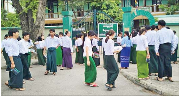
မန္တလေးတိုင်းဒေသကြီးတွင် Grade 12 ကျောင်းသား ကျောင်းသူများ တက္ကသိုလ်ဝင်စာမေးပွဲ စတုတ္ထနေ့ ဓာတုဗေဒဘာသာရပ် လာရောက်ဖြေဆိုစဉ်။

ရေးဝန်ကြီးဌာနမှ တာဝန်ရှိသူများက သွားရောက်ကြည့်ရှုအားပေးကြပြီး ကျောင်းသား ကျောင်းသူများနှင့် လိုက်ပါပို့ဆောင်ပေးသည့် မိဘအုပ်ထိန်းသူများအား ရင်းရင်းနှီးနှီး တွေ့ဆုံအားပေး စကားပြောကြားကာ လိုအပ်သည်များကို တာဝန်ရှိသူများနှင့် ပေါင်းစပ်ညှိနှိုင်း ဆောင်ရွက်ပေးသည်။ စာမေးပွဲများ ပြန်လည်ကျင်းပနေစဉ်ကာလအတွင်း ကျောင်းသား ကျောင်းသူများ အေးချမ်းစွာ ဖြေဆိုနိုင်ရေးအတွက် စာမေးပွဲများကျင်းပနေသည့် မြို့နယ်များအလိုက် တာဝန်ရှိသူများ၊ ကျန်းမာရေးဝန်ထမ်းများ၊ မီးသတ်တပ်ဖွဲ့နှင့် လုံခြုံရေးတပ်ဖွဲ့ဝင်များ၊ ယာဉ်ထိန်းတပ်ဖွဲ့ဝင်များဖြင့် လုံခြုံရေးဆိုင်ရာ ကိစ္စရပ်များနှင့် အခြားလိုအပ်သည်များကို စနစ်တကျ စီမံဆောင်ရွက်ထားရှိကြောင်း သတင်းရရှိသည်။ သတင်းစဉ်