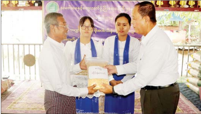
သို့ တက်ရောက်သည်။ အနေဖြင့် မိမိတို့ဒေသအလိုက် အခမ်းအနားတွင် ပြည်စိုက်ပျိုးကြသည့် မျိုးကောင်းမျိုးသန့်များနှင့် သွင်းအားစုများကို နိုင်ငံတော်ထောက်ပံ့ပေး နိုင်ငံစီးပွားဖြင့်တင်ရေး ရန်ပုံငွေ သမဝါယမအသင်း ရန်ပုံငွေ

နေပြည်တော် ဇွန် ၁၉ သမဝါယမနှင့် ကျေးလက်ဖွံ့ဖြိုးရေးဝန်ကြီးဌာန ပြည်ထောင်စုဝန်ကြီး ဦးလှမိုးသည် ယနေ့ နံနက်ပိုင်းက နေပြည်တော် ကောင်စီနယ်မြေ ဒက္ခိဏသီရိမြို့နယ် ညောင်ကုန်းခေတ်စီစံပြကျေးရွာသို့ သွားရောက်၍ ညောင်ကုန်း စိုက်ပျိုးရေးနှင့် အထွေထွေ သမဝါယမအသင်း အပါအဝင်ကျေးရွာပေါင်း ၁၁ ရွာ၊ စိုက်ပျိုးရေး သမဝါယမအသင်းပေါင်း ၁၁ သင်းတို့မှ အသင်းသားတောင်သူ ၁၀၄ ဦးအတွက် ၂၀၂၅-၂၀၂၆ မိုးစပါးစီမံကိန်းတွင် ပန်းတိုင်အထွက်နှုန်းရရှိရေး အထွက်တိုးပျိုးစပါးနှင့် သွင်းအားစုပေးအပ်ပွဲ