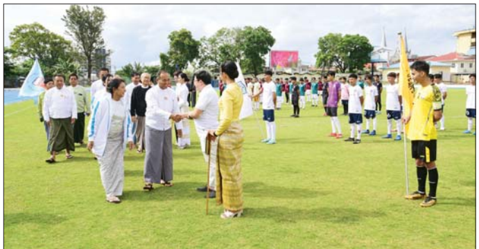
Year 1 FCနှင့် Medical Year3 (5/2025) အသင်းတို့ ယှဉ်ပြိုင်အထိ ကျင်းပသွားမည်ဖြစ်ကြောင်းနှင့် အဆိုပါဘောလုံးပြိုင်ပွဲအသင်း

အားကစားကွင်း၌ ကျင်းပရာ ချုပ်နှင့် ဆရာ ဆရာမများ၊ ကျောင်းသား ကျောင်းသူများ၊ အားကစားဝါသနာရှင်များ တက်ရောက်ကြည့်ရှုအားပေးကြသည်။ အခမ်းအနားတွင် ဆေးတက္ကသိုလ်(တောင်ကြီး) ပါမောက္ခချုပ် ဒေါက်တာလှဝင်းမြင့်က ဤ ပြိုင်ပွဲကျင်းပရခြင်းနှင့်ပတ်သက်၍ ရှင်းလင်းတင်ပြပြီး ဆေးတက္ကသိုလ်(တောင်ကြီး) ပါမောက္ခချုပ် တံခွန်စိုက်ဖလားဘောလုံးပြိုင်ပွဲ အဖွင့်ပွဲစဉ်အဖြစ် Medical