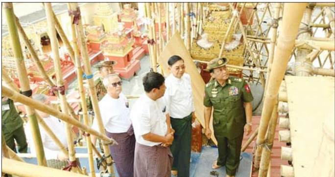
ကာကွယ်ရေးဦးစီးချုပ်ရုံး(ကြည်း)မှ ဒုတိယဗိုလ်ချုပ်ကြီး စိုးတင်နိုင် မန္တလေးမြို့၊ ချမ်းမြသာစည်မြို့နယ် မဟာမုနိဘုရားကြီးရှိ ကျောင်းတော်ကြီး၏ ဘုံခုနစ်ဆင့်နေရာတွင် ငြမ်းများ စနစ်တကျဆင်၍ ပြန်လည်ပြုပြင်တည်ဆောက်ရေးလုပ်ငန်းများ ဆောင်ရွက်နေမှုကို ကြည့်ရှုစစ်ဆေးစဉ်။

ထိုသို့ ဆောင်ရွက်ပေးလျက်ရှိရာ ယနေ့တွင် ကာကွယ်ရေးဦးစီးချုပ်ရုံး(ကြည်း)မှ ဒုတိယဗိုလ်ချုပ်ကြီး သက်ဝင်နှင့် တာဝန်ရှိသူများသည် စစ်ကိုင်းမြို့အတွင်းရှိ ရာဇမဏိ စတုဂံကောင်းမွန်တော်စေတီတော် မြတ်ကြီး၊ ဆွမ်းဦးပညာရှင်စေတီတော်နှင့် ရတနာစေတီ ဆင်များရှင်ဘုရားကြီးတို့၌ လျှင်ဒဏ်ကြောင့် ထိခိုက်ပျက်စီးခဲ့သော သာသနာ့ကအဆောက်အအုံများအား ဒေသခံပြည်သူများနှင့်အတူ အဖွဲ့အစည်းအသီးသီးမှ ပူးပေါင်း၍ အပြီးသတ်ဖယ်ရှားရှင်းလင်းပြီးနောက် ဘက်စုံပြန်လည်ပြုပြင်တည်ဆောက်နေမှုအခြေအနေများကို လိုက်လံကြည့်ရှုစစ်ဆေးပြီး