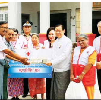
သိန်း ၅၀၀၊ ခရစ္စတီယာန် သခင်မဘုရားကျောင်းအတွက် ငွေကျပ်သိန်း ၅၀၀၊ စဉ့်ကိုင်မြို့နယ် မြောက်ကုန်းကျေးရွာရှိ စိန်ကျောက်နှင့်စိန်အနိနားကက်သလစ်ခရစ်ယာန်ကျောင်းအတွက် ငွေကျပ်သိန်း ၅၀၀၊ အမရပူရမြို့နယ် ဗုံးအိုးကျေးရွာရှိ ဗုံးအိုးအရေဖလီအတွက် ငွေကျပ်သိန်း ၂၅၀။