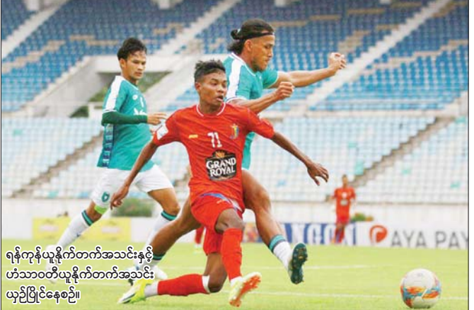
ရန်ကုန်ယူနိုက်တက်အသင်းနှင့် ဟံသာဝတီယူနိုက်တက်အသင်း ယှဉ်ပြိုင်နေစဉ်။

ရန်ကုန် ဇွန် ၁၉ ၂၀၂၅ MNL League Cup ပြိုင်ပွဲ ကွာတားဖိုင်နယ် ဒုတိယနေ့ကို ဇွန် ၁၉ ရက်က ဆက်လက်ကျင်းပရာ ဧရာဝတီယူနိုက်တက်အသင်းနှင့် ရန်ကုန်ယူနိုက်တက်အသင်း ဆီမီးဖိုင်နယ် တက်ရောက်သွားသည်။ သုဝဏ္ဏကွင်း၌ ကျင်းပသည့်ပွဲတွင် ရန်ကုန်ယူနိုက်တက်အသင်းနှင့် ဟံသာဝတီယူနိုက်တက်အသင်းတို့ သာမန်ပွဲကစားချိန် မိနစ် ၉၀၊ အချိန်ပို မိနစ် ၃၀ တို့တွင် ဂိုးမရှိသရေကျနေသဖြင့် ပယ်နယ်တီဖြင့် ဆုံးဖြတ်ရာ ရန်ကုန်ယူနိုက်တက်အသင်းက သုံးဂိုး-တစ်ဂိုးဖြင့် အနိုင်ရခဲ့သည်။ ရန်ကုန်ယူနိုက်တက်အသင်းသည် နိုင်ငံခြားသားကစားသမားများနှင့် လက်ရွေးစင်အဆင့် ကစားသမားအများစု ပါဝင်သော်လည်း ဟံသာဝတီအသင်းကို ပွဲချိန်အတွင်း အနိုင်ရရန် ရုန်းကန်ခဲ့ရပြီး ပယ်နယ်တီအဆုံးအဖြတ်မှသာ စာမျက်နှာ ၁၃ ကော်လံ ၁