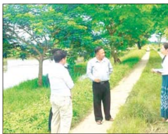
တွင် သန်လျင်မြို့နယ်အတွင်း ၂၀၂၅-၂၀၂၆ ဘဏ္ဍာရေးနှစ် ပြည်ထောင်စု / တိုင်းဒေသကြီး ရန်ပုံငွေဖြင့် ဆောင်ရွက်မည့် ကျေးလက်လမ်းတံတားများကို ကြည့်ရှုစစ်ဆေးပြီး လိုအပ်သည့် မြေပြင်အခြေအနေ၊ လိုက်နာဆောင်ရွက်ရန် လိုအပ်သော အချက်များကို ခရိုင်ကျေးလက်လမ်းဖွံ့ဖြိုးရေးဦးစီးဌာန ခရိုင်ဦးစီးမှူး၊ မြို့နယ်ဦးစီးမှူးနှင့် တာဝန်ရှိသူများအား ဆွေးနွေးရာကြားပြီး လုပ်ငန်းများ ဆောင်ရွက်မည့် နေရာများအား ကြည့်ရှုစစ်ဆေးခဲ့ကြောင်း သိရသည်။