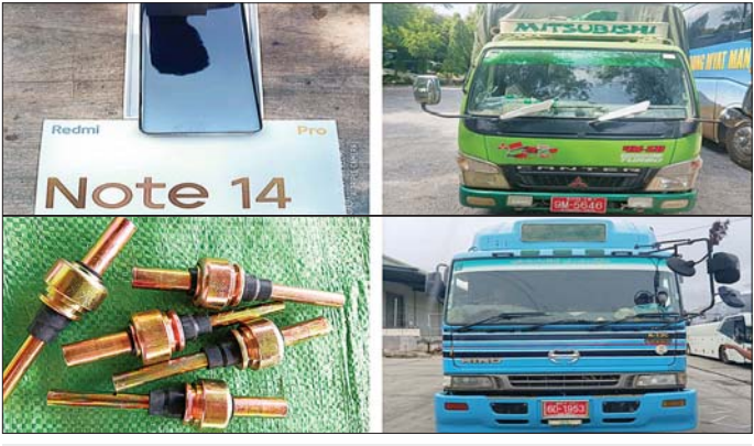
မန္တလေးတိုင်းဒေသကြီး၌ ဖမ်းဆီးရမိမှု။

ကို ဖမ်းဆီးရမိခဲ့ပြီး အကောက်ခွန် လုပ်ထုံးလုပ်နည်းများနှင့်အညီ အရေးယူဆောင်ရွက်လျက်ရှိသည်။ ဇွန် ၁၈ ရက်တွင် နေပြည်တော် တရားမဝင်ကုန်သွယ်မှုတိုက်ဖျက်ရေးအဖွဲ့၏ စီမံခန့်ခွဲမှုဖြင့် တာဝန်ကျပူးပေါင်းအဖွဲ့က စစ်ဆေးမှုများဆောင်ရွက်ခဲ့ရာ ပျဉ်းမနားခရိုင် ဧရာဝတီမြို့နယ်အတွင်း၌ တရားမဝင်ကျွန်းသစ် ၁၃၁၅၅၂ တန် (ခန့်မှန်းတန်ဖိုး ငွေကျပ် ၄၄၂၂၀၀) ကို ဖမ်းဆီးရမိခဲ့ပြီး သစ်တောဥပဒေနှင့်အညီ အရေးယူဆောင်ရွက်လျက်ရှိသည်။ ထို့ပြင် တနင်္သာရီတိုင်းဒေသကြီး တရားမဝင်ကုန်သွယ်မှုတိုက်ဖျက်ရေးအဖွဲ့၏ စီမံခန့်ခွဲမှုဖြင့် တာဝန်ကျပူးပေါင်းအဖွဲ့က စစ်ဆေးမှုများဆောင်ရွက်ခဲ့ရာ မြိတ်မြို့ ရှမ်းချောင်းလမ်းမကြီး AST ဆီဆိုင်အနီး၌ မြိတ်မြို့မှ ရန်ကုန်မြို့သို့ သွားရောက်မည့် မော်တော်ယာဉ်တစ်စီးပေါ်မှ တရားဝင်စာရွက်စာတမ်းအထောက်အထား တင်ပြနိုင်ခြင်းမရှိသည့် လုပ်ငန်းသုံးပစ္စည်း သုံးမျိုး၊ လူသုံးကုန်ပစ္စည်းနှစ်မျိုး (ခန့်မှန်းတန်ဖိုးငွေကျပ် ၂၅၃၅၀၀၀၀) နှင့် အဆိုပါပစ္စည်းများ တင်ဆောင်လာသည့် Zhong Tong Bus