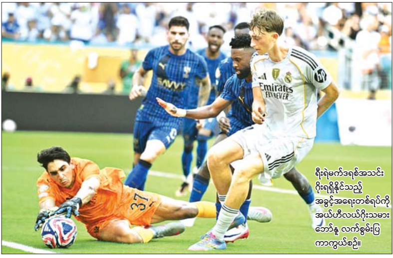
ရိုးရဲမက်ဒရစ်အသင်း ဂိုးရရှိနိုင်သည့် အခွင့်အရေးတစ်ရပ်ကို အယ်ဟီလယ်ဂိုးသမား ဘော်နူ လက်စွမ်းပြကာကွယ်စဉ်။

ကလပ်ကမ္ဘာ့ဖလားပြိုင်ပွဲ ပွဲစဉ် (၁) မှ ရိုးရဲမက်ဒရစ်အသင်းနှင့် ဆော်ဒီအာရေဗျကလပ် အယ်ဟီလယ်အသင်းပွဲစဉ်ကို ဇွန် ၁၉ ရက် နံနက် ၁ နာရီခွဲက ယှဉ်ပြိုင်ကစားခဲ့ရာ ဗယ်လ်လာဒီပယ်နယ်တီအဆုံး သတ်သွင်းယူမှု လွဲချော်ခဲ့သည့်အတွက် တစ်ဖက်တစ်ရိုးစီဖြင့် သရေကျခဲ့သည်။ အဆိုပါပွဲစဉ်သို့ ပရိသတ် ၆၂၀၀၀ ကျော် လာရောက်ကြည့်ရှုခဲ့သည်။ အယ်ဟီလယ်အသင်းသည် ပွဲအစပိုင်းတွင် နာမည်ကြီး ရိုးရဲမက်ဒရစ်အသင်းကို ဖိအားပေး ကစားနိုင်ခဲ့သော်လည်း နောက်ပိုင်းပွဲချိန်များတွင် ပြိုင်ဘက်အသင်း၏ ဖိအားပေးစာမျက်နှာ ၁၃ ကော်လံ ၄