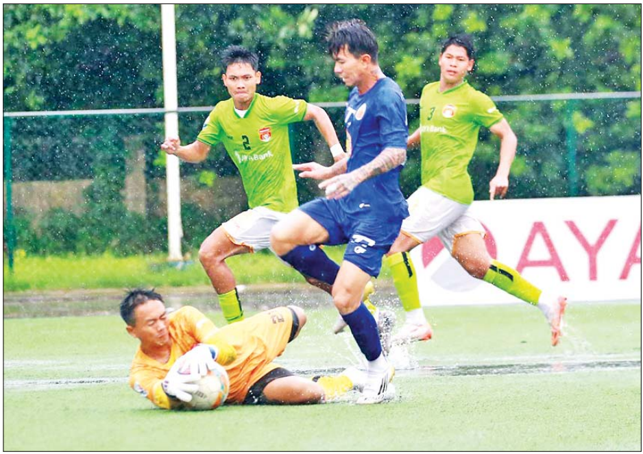
ဧရာဝတီယူနိုက်တက်အသင်းနှင့် ရခိုင်ယူနိုက်တက်အသင်းတို့ ယှဉ်ပြိုင်ကစားကြစဉ်။