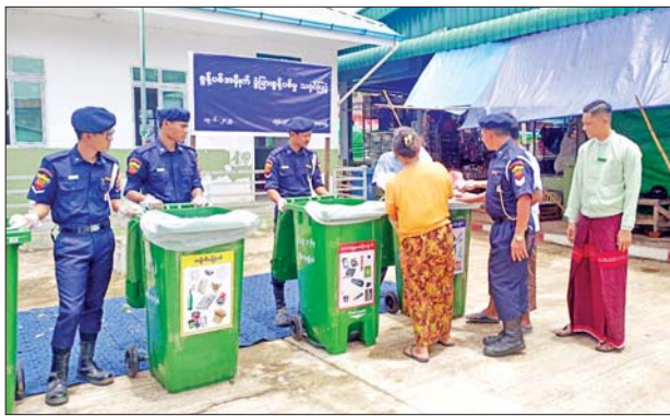
မြို့နယ် အဆင့် ဌာနဆိုင်ရာ ဝန်ထမ်းများ၊ ဈေးသူဈေးသားများက ပူးပေါင်းပါဝင်ဆောင်ရွက်ကြသည်။

လှိုင်းဘွဲ့ ဇွန် ၁၉ ကရင်ပြည်နယ်လှိုင်းဘွဲ့မြို့နယ် စီမံအုပ်ချုပ်ရေးအဖွဲ့က ကြီးမှူး၍ စွန့်ပစ်အမှိုက်များ ခွဲခြားစွန့်ပစ်နိုင်စေရေးအတွက် ဈေးသူဈေးသားများအား အသိပညာပေးသရုပ်ပြပွဲကို လှိုင်းဘွဲ့မြို့ မြို့မဈေးအတွင်း၌ ယနေ့ ဇွန်လ ၁၂ ရက်က ကျင်းပသည်။