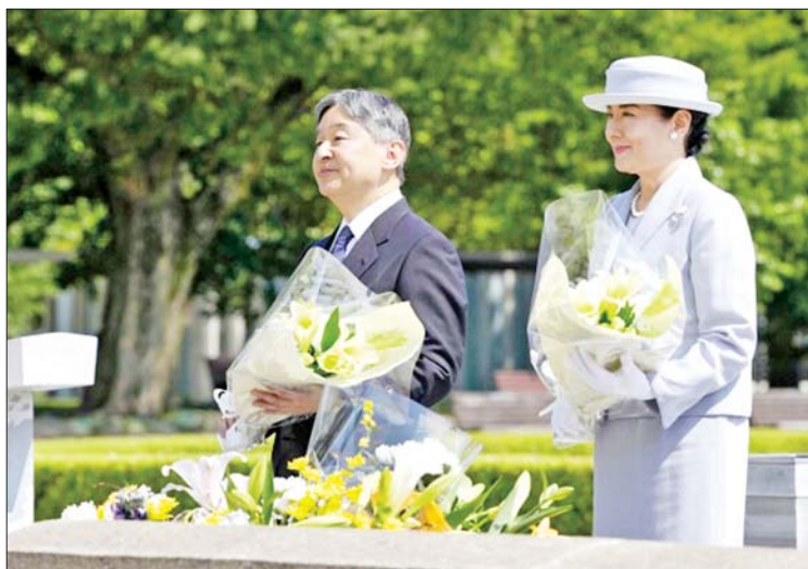
အထိမ်းအမှတ်ပန်းခြံသို့ သွားရောက်ကြ ထိုင် ကျဆုံးစစ်သည်တော်များ အထိမ်းအမှတ် ကျောက်တိုင်ရှေ့သို့ သွားရောက်

တိုကျို ဇွန် ၁၉ ဂျပန်ကေရာဇ် နာဂါဟာတိုနှင့် ကြင်ရာတော် မာဆာကိုတို ဒုတိယကမ္ဘာစစ်ပြီးဆုံးခဲ့သည့် နှစ် (၈၀) ပြည့် အထိမ်းအမှတ်အဖြစ် နျူကလီးယား ဗုံးကြဲခံခဲ့ရသော ဟီရိုရှီးမားမြို့သို့ နှစ်ရက်ကြာ သွားရောက်ခဲ့ကြောင်း သိရသည်။ ဂျပန်ကေရာဇ်နှင့် ကြင်ရာတော်တို့ သည် ဟီရိုရှီးမားမြို့သို့ ယနေ့မုန်းတည့် မတိုင်မီ သွားရောက်ခဲ့ခြင်းဖြစ်သည်။ ယခုခရီးစဉ်သည် ကေရာဇ်နာဂါဟာတို နန်းတက်သည့် ၂၀၁၉ ခုနှစ်နောက်ပိုင်း ပထမဆုံးခရီးစဉ် ဖြစ်သည်။ မုန်းလွှဲပိုင်းတွင် ကေရာဇ်မင်းမြတ်နှင့် ကြင်ရာတော်တို့သည် ငြိမ်းချမ်းရေး