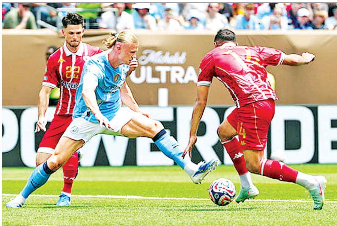
မန်စီးတီးအသင်းနှင့် ဝိုင်ဒက်အေစီအသင်းတို့ ယှဉ်ပြိုင်ကစားကြစဉ်။