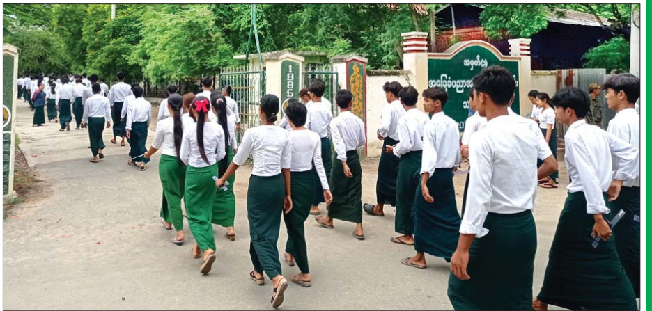
လယ်ဝေးမြို့နယ်၌ တက္ကသိုလ်ဝင်စာမေးပွဲဖြေဆိုပြီး ပြန်လည်ထွက်ခွာလာသည့် ကျောင်းသား ကျောင်းသူများကို တွေ့ရစဉ်။