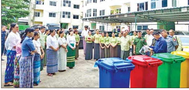
ရေးအဖွဲ့အုပ်ချုပ်ရေးမှူးက ခွဲခြားစွန့်ပစ်ရမည့် အမှိုက် လေးမျိုးအား သတ်မှတ်အမှိုက်ပုံးများအတွင်း စနစ်တကျစွန့်ပစ်ရန်နှင့် စွန့်ပစ်ရမည့် ပုံစံများကို ရှင်းလင်းပြောကြားသည်။

အလုံခရိုင်၌ အမှိုက်ခြောက်၊ အမှိုက်စုံ၊ အန္တရာယ်ရှိသောအမှိုက်နှင့် ပလတ်စတစ်အမှိုက်များ စနစ်တကျခွဲခြားစွန့်ပစ်နည်း အသိပညာပေးသရုပ်ပြခြင်းကို ယနေ့နံနက်ပိုင်းက ခရိုင်အထွေထွေအုပ်ချုပ်ရေးဦးစီးဌာနရုံး၌ ကျင်းပသည်။