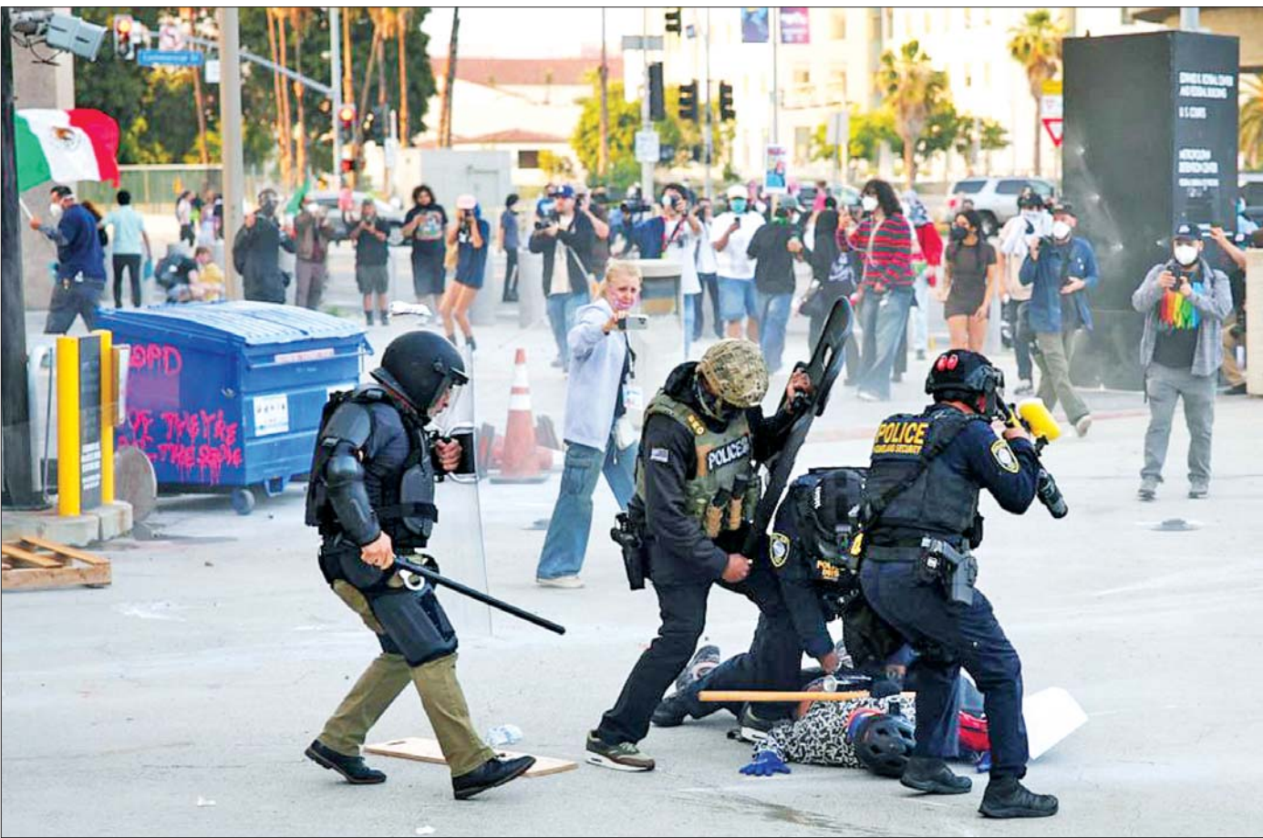
အမေရိကန်နိုင်ငံ လော့စ်အိန်ဂျလစ်မြို့၌ ဆန္ဒပြသူများအား ဖြိုခွင်းနေမှုကို တွေ့ရစဉ်။

အင်အားသုံးဖြိုခွင်းသည့်ကြားက နယူးယောက်၊ ချီကာဂိုစသည့် အခြားမြို့ကြီးများအထိ ဆန္ဒပြပွဲများ ကူးစက်သွားသည်။ ဆန္ဒပြသူများက ကားများကို မီးရှို့ခြင်း၊ လုံခြုံရေးအဖွဲ့ဝင်များကို ပြန်လည် တုံ့ပြန်တိုက်ခိုက်ခြင်းများအပြင် ခိုးဆိုးလုယက်သူများကလည်း တောမီးလောင် တောကြောင် လက်ခမောင်းခတ်ဆိုသည့်နယ် စတိုးဆိုင်ကြီးများ၊ စူပါမားကတ်များ၊ အရောင်းဆိုင်ခန်းများကို ပေါ်ပေါ်ထင်ထင် ဝင်ရောက်လုယက်ကြပြန်သည်။ သို့နှင့် လော့စ်အိန်ဂျလစ်မြို့တွင် ကာဗျူးအမိန့်ကို နောက်တစ်ကြိမ် ထုတ်ပြန်ခဲ့ရသည်။ ဒီမိုကရေစီနှင့် လူ့အခွင့်အရေးဟု မကြာခဏ ကြွေးကြော်လေ့ရှိသော ဒီမိုကရေစီစံပြအင်ပါယာနိုင်ငံကြီးအတွက် နိုင်ငံရေးသံဝေဂယူစရာ ဖြစ်ရလေသည်။