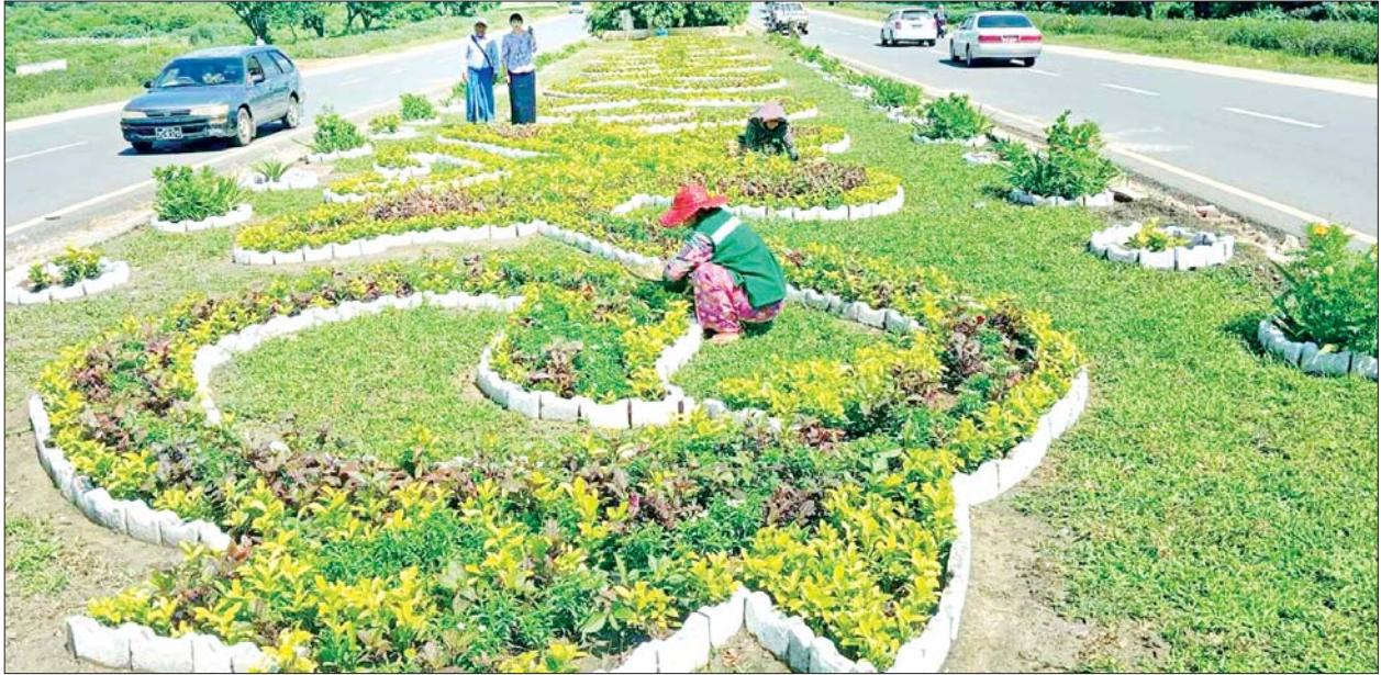
မန္တလေးမြို့ရှိ လမ်းလယ်ကျွန်းတစ်ခု၌ ပန်းအလှပင်များစိုက်ပျိုးထားမှုကို တွေ့ရစဉ်။

မန္တလေး ဇွန် ၁၉ မန္တလေးမြို့တော်အား စိမ်းလန်းစိုပြည်ပြီး သာယာလှပသည့် မြို့တော်ဖြစ်စေရေး အတွက် မန္တလေးမြို့တော် စည်ပင်သာယာရေးကော်မတီက နှစ်စဉ်မိုးရာသီ သစ်ပင်စိုက်ပျိုးပွဲများ ကျင်းပလျက်ရှိရာ ၂၀၂၅ ခုနှစ် မိုးရာသီ သစ်ပင်စိုက်စီမံချက်ဖြင့် မန္တလေးမြို့နယ်တွင် အရိပ်ရပင် ၁၅၀၀၀ နှင့် ပန်းအလှပင် ၅၀၀၀ ကို ဇွန်လအတွင်း သတ်မှတ်ရက်နှင့် သတ်မှတ်နေရာများ၌ စိုက်ပျိုးသွားမည်ဖြစ်ကြောင်း သိရသည်။ မန္တလေးတိုင်းဒေသကြီးအစိုးရအဖွဲ့၏ဦးဆောင်မှုနှင့် မန္တလေးမြို့တော် စည်ပင်သာယာရေးစာမျက်နှာ ၃ ကော်လံ ၁ သို့