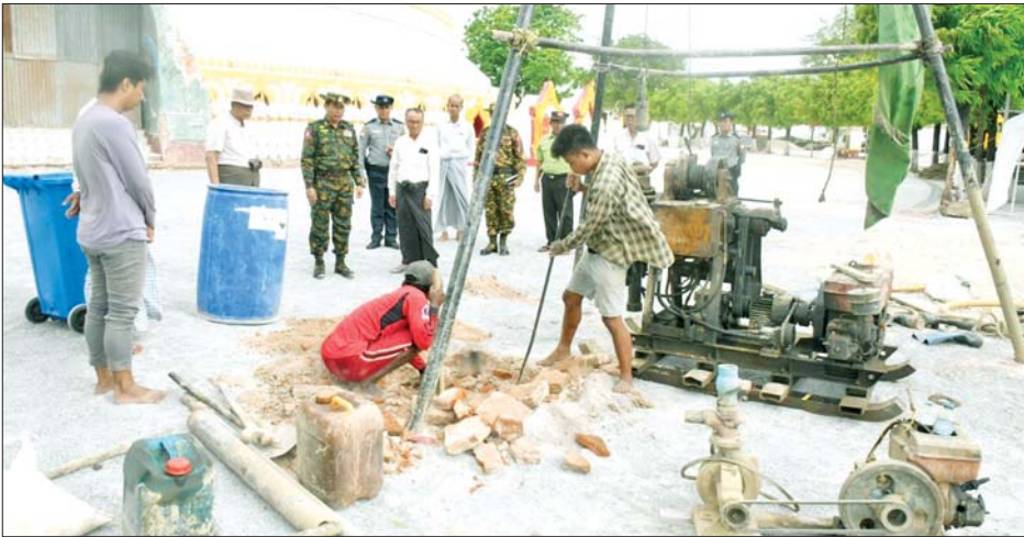
ကာကွယ်ရေးဦးစီးချုပ်ရုံး(ကြည်း)မှ ဒုတိယဗိုလ်ချုပ်ကြီးသက်ပုံ ရာမေဏီစုဌာနကောင်းမှုတော်စေတီ၌ ဘက်စုံပြန်လည်တည်ဆောက်နေမှုကို ကြည့်ရှုစစ်ဆေးစဉ်။

စေတီဆင်များရှင်ဘုရားကြီးတို့၌ လျှင်ဒဏ်အတွင်း ထိခိုက်ပျက်စီးခဲ့ သော သာသနိကအဆောက်အအုံ များကို ဒေသခံပြည်သူများနှင့် အတူ အဖွဲ့အစည်းအသီးသီး ပူးပေါင်း၍ အပြီးသတ်ဖယ်ရှား ရှင်းလင်းပြီးနောက် ဘက်စုံ ပြန်လည်ပြုပြင်တည်ဆောက်နေမှု အခြေအနေများကို လိုက်လံ ကြည့်ရှုစစ်ဆေးခဲ့ပြီး လုပ်အားပေး ဆောင်ရွက် နေကြသူများအား အင်အားဖြည့် အချို့ရည်များ ပေးအပ်ကာ လိုအပ်သည်များကို တာဝန်ရှိသူများနှင့် ပေါင်းစပ် ညှိနှိုင်း ဆောင်ရွက်ပေးသည်။ ထို့နောက် သကျစိတာ သီလရှင် စာသင်တိုက်၊ ဇေယျာမင်္ဂလာဆူတောင်း ပြည့်ဘုရား၊ စိန်ရတနာကျောင်း