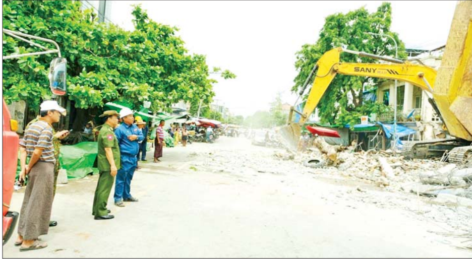
ကာကွယ်ရေးဦးစီးချုပ်ရုံး(ကြည်း)မှ ဒုတိယဗိုလ်ချုပ်ကြီးစိုးတင်နိုင် ချမ်းအေးသာစံမြို့နယ်၌ အဆောက်အအုံများ ရှင်းလင်းဖယ်ရှားနေမှုကို ကြည့်ရှုစစ်ဆေးစဉ်။

သတင်းစဉ် ကင်းရှင်းစေရေး ဆောင်ရွက် ထားရှိမှု၊ ကျောင်းတော်ကြီး၏ ဘုံခုနစ်ဆင့်နေရာတွင် ငြိမ်းချမ်း စနစ်တကျဆင်၍ ပြန်လည်ပြုပြင် တည်ဆောက်ရေး လုပ်ငန်းများ ဆောင်ရွက်နေမှု၊ ဂန္ဓကုဋ်တိုက် ပိုမိုခိုင်ခံ့စေရန်အတွက် ပြန်လည် ပြုပြင်ဆောင်ရွက်နေမှု၊ ဘုရားကြီး ၏ နောက်ကျောတော်နေရာတွင် ပြုကျပျက်စီးသွားသည့် တိုင်များ ကို ပြန်လည်တည်ဆောက်ရန် အတွက် တိုင်ကျင်းများ တူးဖော် ထားရှိမှုနှင့် ချိတ်ဆွဲရတနာပြတိုက် အတွင်း မဟာမုနိဘုရားကြီး၏ ထီးတော်နှင့် စိန်ဖူးတော်အား ပူဇော်ခံထားရှိမှုတို့ကို ကြည့်ရှု စစ်ဆေး၍ ပြန်လည်ပြုပြင် တည်ဆောက်ရေး လုပ်ငန်းများ အတွက် လိုအပ်သည်များကို တာဝန်ရှိသူများနှင့် ပေါင်းစပ် ညှိနှိုင်းဆောင်ရွက်ပေးသည်။ ထို့နောက် မဟာအောင်မြေ မြို့နယ်မဟာအောင်မြေအနောက် ရပ်ကွက်၊ ချမ်းအေးသာစံမြို့နယ် အလယ်ရပ်ကွက်နှင့် အနောက် ရပ်ကွက်တို့ရှိ လျှင်ဒဏ်ကြောင့် ပြုကျပျက်စီးခဲ့သည့် အန္တရာယ်ရှိ အဆောက်အအုံ အပျက်အစီးများ ကို စက်ယန္တရားကြီးများ အသုံး ပြု၍ အင်တိုက်အားတိုက် ရှင်းလင်း ဖယ်ရှားနေမှုများကို ကြည့်ရှု စစ်ဆေးကာ လုပ်ငန်းခွင်အန္တရာယ် ကင်းရှင်းစေရေး အထူးဂရုပြု ဆောင်ရွက်ရန်မှာကြားပြီး တာဝန် ရှိသူများ၏ တင်ပြချက်များအပေါ် လိုအပ်သည်များ ပေါင်းစပ်ညှိနှိုင်း ဆောင်ရွက်ပေးခဲ့ကြောင်း သိရ သည်။