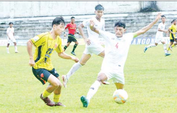
ရာမညယူနိုက်တက်အသင်းနှင့် Falcon အသင်းတို့ ယှဉ်ပြိုင်နေစဉ်။

ယနေ့ ဖတ်စရာ အင်ဒိုနီးရှားနိုင်ငံ၏ အကြီးဆုံး ဆိုလာပြား ထုတ်လုပ်ရေးစက်ရုံ ဖွင့်လှစ် စာမျက်နှာ » ၁၃ တရားမဝင် သစ်မျိုးစုံ၊ လုပ်ငန်းသုံးပစ္စည်းများ၊ လူသုံးကုန်ပစ္စည်းများ၊ လိုင်စင်မဲ့ယာဉ်များ၊ လိုင်စင်မဲ့ဆိုင်ကယ်များနှင့် တရားမဝင်ကုန်ပစ္စည်းတင် ယာဉ်များ သိမ်းဆည်းရမိ စာမျက်နှာ » ၁၄ နေရာအနှံ့အပြား မိုးထစ်ချွန်းရွာပြီး အချို့ဒေသများတွင် နေရာကွက်၍ မိုးကြီးမည် စာမျက်နှာ » ၁၆