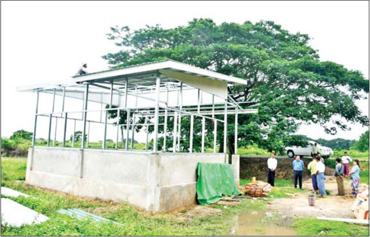
စာဖတ်သူတိုးပွားရေးကို ပြည့်သူများ သွားကြရန် ဆွေးနွေးရာကြားခဲ့ကြောင်း အနေဖြင့် ဝိုင်းဝန်းပူးပေါင်းဆောင်ရွက် သိရသည်။ မျိုးသီဟ(ပြန်/ဆက်)

တာဝန်ရှိသူများနှင့် ပေါင်းစပ်ညှိနှိုင်း ဆောင်ရွက်ပေးခဲ့သည်။ ဆက်လက်၍ နေပြည်တော်ကောင်စီ ဝင်သည် ဒက္ခိဏသီရိမြို့နယ် မိဒီကျေးရွာ စာကြည့်တိုက် ဆောက်လုပ်ပြီးစီးမှု အခြေအနေကို ကြည့်ရှုစစ်ဆေးပြီး စာကြည့်တိုက်ရေရှည် ဖွံ့ဖြိုးတိုးတက် ရေးအတွက် စာကြည့်တိုက်ကော်မတီဖွဲ့၍ စာကြည့်တိုက်ဖွင့်လှစ်နိုင်ရေးနှင့် လစဉ် စာအုပ်၊ စာစောင်များ၊ သတင်းစာများ ဖြည့်ဆည်း၍ စာဖတ်ရန်မြှင့်တင်ရေး၊