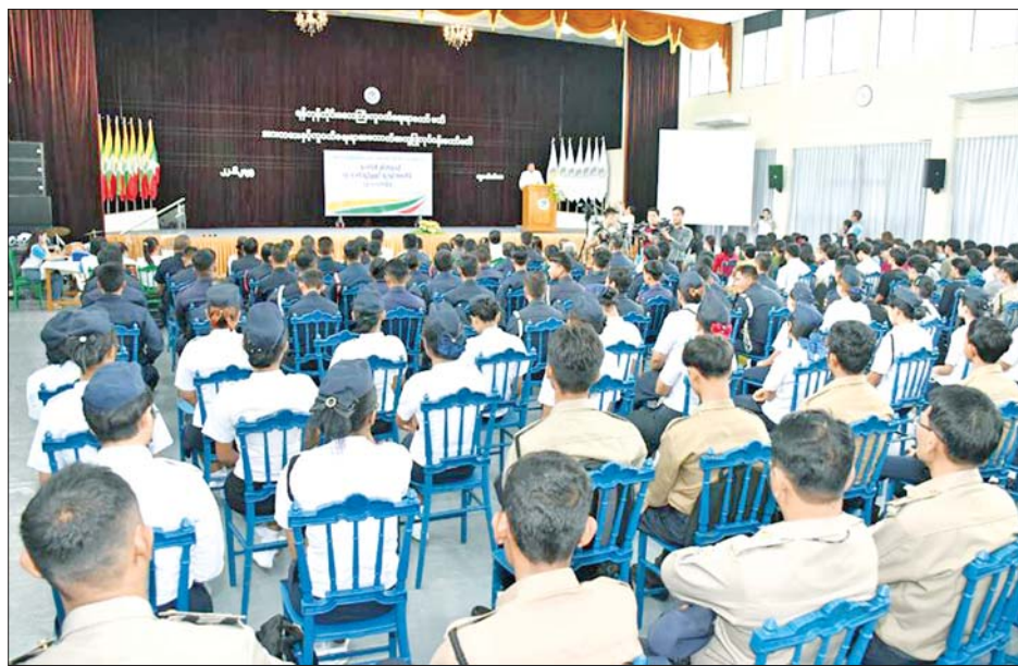
က အသိပညာပေးဟောပြောပွဲ ကျင်းပခြင်းနှင့် ပတ်သက်၍ ရှင်းလင်းပြောကြားပြီး Gender Awareness with a Focus on Gender Stereotypes ဉာဏ်စမ်းမေးခွန်းများ ဖြေဆိုခြင်းများ ပြုလုပ်ခဲ့

ရန်ကုန် ဇွန် ၂၃ ရန်ကုန်တိုင်းဒေသကြီး အားကစားနှင့် လူငယ်ရေးရာအထောက်အကူပြု လုပ်ငန်းကော်မတီက ကျင်းပသော “လူငယ်တို့၏ စွမ်းအားမှသည် ကျား၊ မ တန်းတူညီမျှမှုနှင့် လူ့အခွင့်အရေးဆီသို့” ခေါင်းစဉ်ဖြင့် အသိပညာပေးဟောပြောပွဲကို ယမန်နေ့နံနက်ပိုင်းက ရန်ကုန်မြို့ သာကေတမြို့နယ်ရှိ ရန်ကုန်တိုင်းဒေသကြီး လူငယ်စင်တာ၌ ကျင်းပသည်။ ဦးစွာ ရန်ကုန်တိုင်းဒေသကြီး လူငယ်ရေးရာကော်မတီ ဒုတိယဥက္ကဋ္ဌ တိုင်းဒေသကြီးလူမှုရေးရာဝန်ကြီးဦးဌေးအောင်က အဖွင့်အမှာစကားပြောကြားပြီး တိုင်းဒေသကြီး အားကစားနှင့် လူငယ်ရေးရာအထောက်အကူပြု လုပ်ငန်းကော်မတီဥက္ကဋ္ဌ ဦးဇော်လွင်ဦးက ကြိုဆိုနှုတ်ခွန်းဆက်စကားပြောကြားသည်။ ဆက်လက်၍ ကျား၊ မ တန်းတူညီမျှရေးနှင့် လူ့အခွင့်အရေးကော်မတီဥက္ကဋ္ဌ ဒေါ်ကြည်သာဝင်းမြင့်