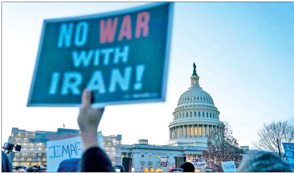
ဥပဒေကို ချိုးဖောက်ခြင်းဖြစ်ကာ ၎င်းတိုက်ခိုက်မှု ပုံစံတစ်ခုတွင် ပြောကြားသည်။ အမေရိကန်နှင့် အစွဲအစားအနေဖြင့် အီရန်နိုင်ငံအား တိုက်ခိုက်နေမှု ကို ချက်ချင်းရပ်တန့်ရန် မိမိတို့တောင်းဆိုကြောင်း

ဝါရှင်တန် ဇွန် ၂၃ အီရန် နယ်လီးယားစက်ရုံများအား အမေရိကန် က တိုက်ခိုက်မှုများနှင့်ပတ်သက်၍ ဆန့်ကျင် ကန့်ကွက်သည့် ဆန္ဒဖော်ထုတ်ပွဲများကို နယူး ယောက်၊ ဝါရှင်တန်ဒီစီနှင့် နိုင်ငံအနှံ့အပြားတွင် ဖြစ်ပွားခဲ့ကြောင်း သိရသည်။