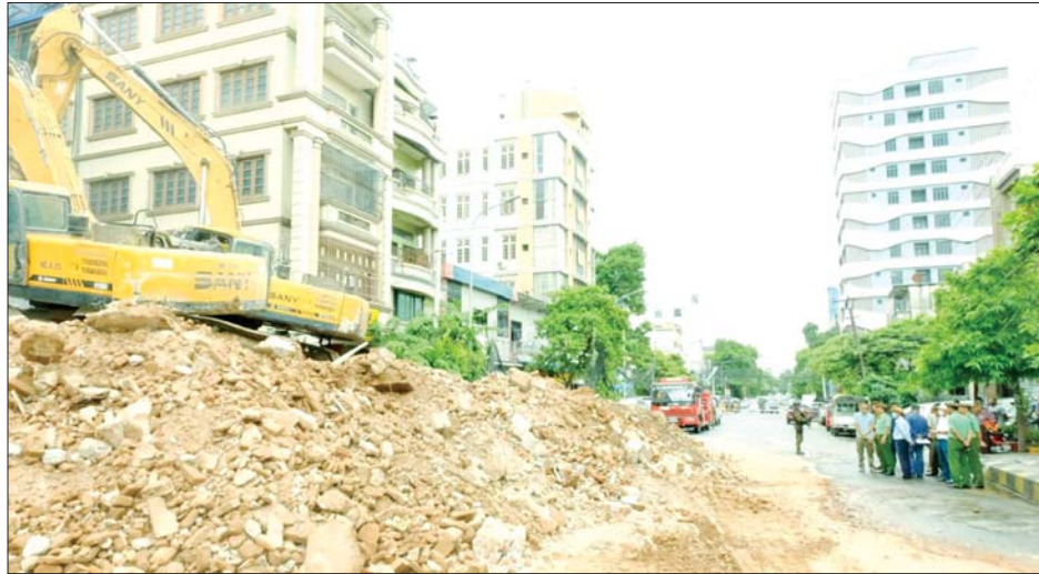
ကာကွယ်ရေးဦးစီးချုပ်ရုံး(ကြည်း)မှ ဒုတိယဗိုလ်ချုပ်ကြီး စိုးတင်နှင့် အောင်မြေသာစံမြို့နယ်၌ အန္တရာယ်ရှိအဆောက်အအုံများ ဖယ်ရှားရှင်းလင်းနေမှုကို ကြည့်ရှုစစ်ဆေးစဉ်။