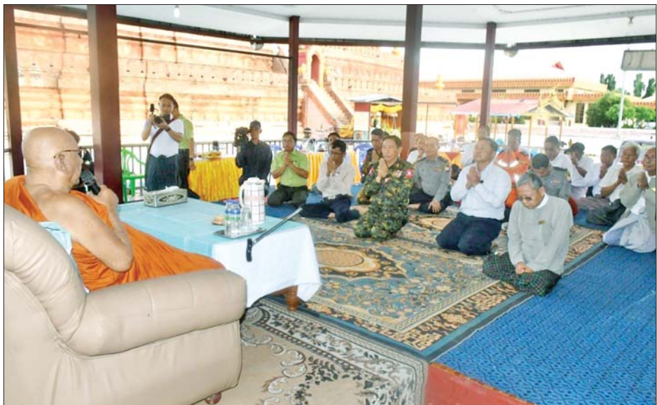
ကာကွယ်ရေးဦးစီးချုပ်(ကြည်း)မှ ဒုတိယဗိုလ်ချုပ်ကြီးသက်ပုံ သီတဂူဆရာတော်ကြီး ဒေါက်တာဘဒ္ဒန္တဉာဏိဿရထံ မဟာစည်းခုံကြီးစေတီတော်မြတ်ကြီး ဘက်စုံပြုပြင်မွမ်းမံရေးလုပ်ငန်းကိစ္စများကို လျှောက်ထားရှင်းလင်းပြီး ဩဝါဒခံယူစဉ်။

ဆရာတော်ကြီးထံမှ ငါးပါးသီလ ခံယူဆောင်တည်ကြပြီး သီတဂူဆရာတော်ကြီးက ပရိတ်တရားတော်များ ချီးမြှင့်တော်မူသည်။ ထို့နောက် ကာကွယ်ရေးဦးစီးချုပ်(ကြည်း)မှ ဒုတိယဗိုလ်ချုပ်ကြီးသက်ပုံက မဟာစည်းခုံကြီးစေတီတော်မြတ်ကြီးအား ဘက်စုံပြုပြင်မွမ်းမံရေး လုပ်ငန်းကိစ္စများကို လျှောက်ထားရှင်းလင်းပြီး ဆရာတော်ကြီးထံမှ ဩဝါဒခံယူသည်။ ယင်းနောက် တိမ်းစောင်းသွားသော ထီးတော်ကြီး၊ ငှက်မြတ်နားတော်နှင့် စိန်ဖူးတော်တို့ကို ကရိန်းစက်ယန္တရားကြီးဖြင့် ပြန်လည်တည်မတ်ခြင်းလုပ်ငန်း ဆောင်ရွက်နေမှုနှင့် ငလျင်ဒဏ်ကြောင့် ထိခိုက်ပျက်စီးခဲ့သော မဟာစည်းခုံကြီးစေတီတော်မြတ်ကြီး၏ သာသနာ့ဗိမာန်အား ဘက်စုံပြုပြင်မွမ်းမံတည်ဆောက်ပြီးစီးမှု အခြေအနေများကို လိုက်လံကြည့်ရှုစစ်ဆေးပြီး လိုအပ်သည်များကို တာဝန်ရှိသူများနှင့် ပေါင်းစပ်ညှိနှိုင်း ဆောင်ရွက်ပေးခဲ့ကြောင်း သိရသည်။ သတင်းစဉ်