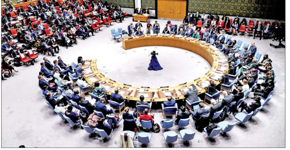
ကြောင်း အမေရိကန်ကပြောကြား သည်။ ကုလသမဂ္ဂနှင့် လုံခြုံရေး ကောင်စီအနေဖြင့် နိုင်ငံတကာ ငြိမ်းချမ်းရေးနှင့် လုံခြုံရေးကို ထိန်းသိမ်းရန် ပျက်ကွက်ပါက ၎င်း တို့၏ ရပ်တည်မှုဆိုင်ရာ ဂုဏ်သိက္ခာ အန်မာ ဆာယိဒ် အိုင်ဗာနီက ပြောကြားသည်။ ကိုးကား - အင်န်အိတ်ချီကော ဘာသာပြန် - စိုးသူရ

သတိပေးပြောကြားသည်။ အဆိုပါ အစည်းအဝေးတွင် ငြိမ်းချမ်းရေးအား အခွင့်အလမ်း တစ်ခုအဖြစ် ကိုင်ဆောင်ရွက်ရန် ၎င်းကပန်ကြားခဲ့သည်။ ၎င်းပဋိပက္ခအား ကျိုးကြောင်း ဆင်ခြင်မှုရှိရှိဖြင့် လက်တုံ့ပြန် မှုများကို ရှောင်ရှားပြီး စစ်ရေး နည်းလမ်းဖြင့်မဟုတ်ဘဲ သံတမန် နည်းလမ်းအရ ပူးပေါင်းဖြေရှင်း ဆောင်ရွက်ရေးအတွက် လုံခြုံရေး ကောင်စီနှင့် လုံခြုံရေးကောင်စီ အဖွဲ့ဝင်နိုင်ငံများအား ၎င်းက တိုက်တွန်းခဲ့သည်။ အမေရိကန်၏ တိုက်ခိုက်မှုများကြောင့် အီရန် နယ်လီးယားစက်ရုံများဖြစ်သည့် ဖော်ဒို၊ နတန်ဇ်နှင့် အစွဲအစားတို့ တွင် ထိခိုက်ပျက်စီးမှုများရှိခဲ့ကြောင်း နိုင်ငံတကာ အဏုမြူစွမ်းအင် အေဂျင်စီ အကြီးအကဲ ရာဖယ် ဂရော့ဆီက ပြောကြားသည်။ မြေအောက် ထိုးဖောက် ဝင်ရောက်နိုင်သည့် ဘန်ကာဗုံး များကို အသုံးပြု၍ တိုက်ခိုက်ခဲ့ သဖြင့် ၎င်းနယ်လီးယားစက်ရုံ များတွင် ထိခိုက်ပျက်စီးမှုများရှိခဲ့