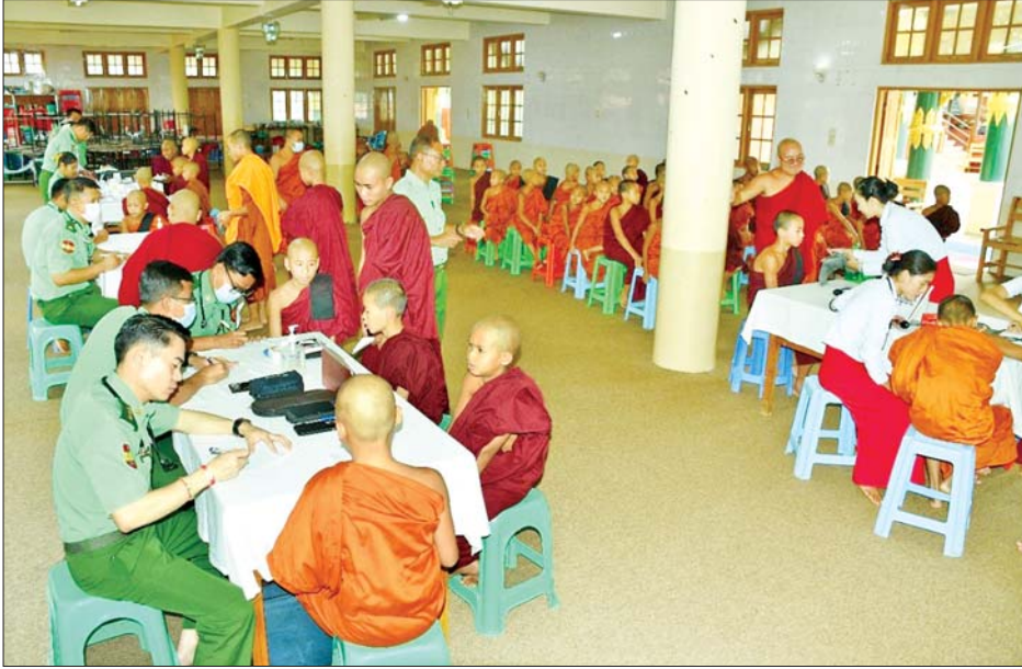
အရှေ့ပိုင်းတိုင်းစစ်ဌာနချုပ် နယ်လှည့်ဆေးကုသရေးအဖွဲ့က တောင်ကြီးမြို့ မင်္ဂလာဦးရပ်ကွက် အရိယဝံသ မြို့ဦးကျောင်းတိုက်ရှိ သံဃာတော်များအား ကျန်းမာရေးစောင့်ရှောက်မှုလုပ်ငန်းများ ဆောင်ရွက်ပေးစဉ်။