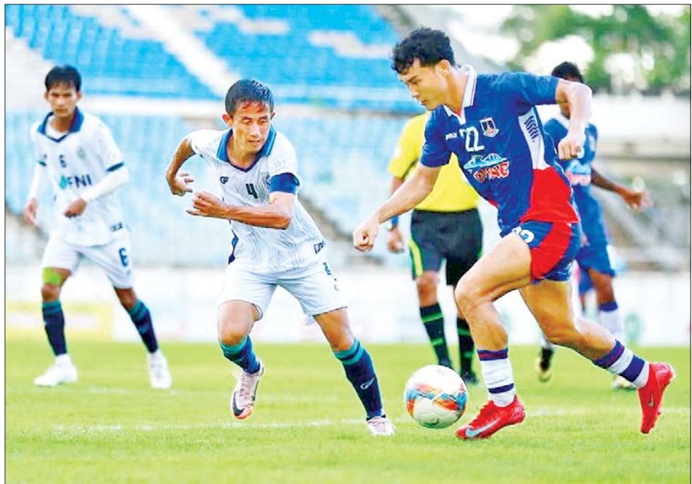
ရန်ကုန်ယူနိုက်တက်အသင်းနှင့် ရတနာပုံအသင်းတို့ ယှဉ်ပြိုင်နေစဉ်။