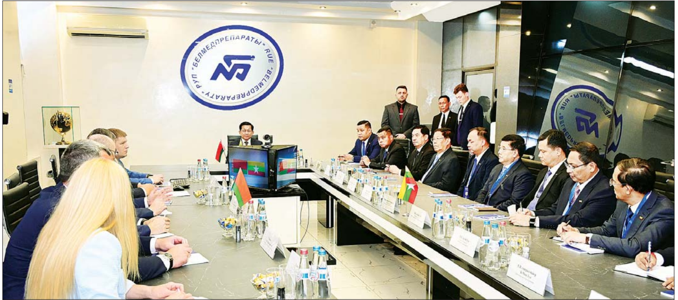
နိုင်ငံတော်စီမံအုပ်ချုပ်ရေးကောင်စီဥက္ကဋ္ဌ နိုင်ငံတော်ဝန်ကြီးချုပ် ဗိုလ်ချုပ်မှူးကြီး မင်းအောင်လှိုင် မင့်စံမြို့ရှိ Belmedpreparaty ဆေးဝါးစက်ရုံ၌ ဘယ်လာရစ်သမ္မတနိုင်ငံ ကျန်းမာရေးဝန်ကြီးဌာနဝန်ကြီး Mr. Aliaksandr Khajayev နှင့် အမြင်ချင်းဖလှယ်ဆွေးနွေးစဉ်။