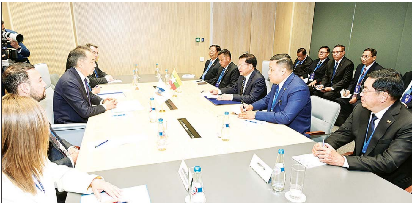
နိုင်ငံတော်စီမံအုပ်ချုပ်ရေးကောင်စီဥက္ကဋ္ဌ နိုင်ငံတော်ဝန်ကြီးချုပ် ဗိုလ်ချုပ်မှူးကြီး မင်းအောင်လှိုင်နှင့် ဥရောပ-အာရှ စီးပွားရေးကော်မရှင်(EEC) ဘုတ်အဖွဲ့ဥက္ကဋ္ဌ Mr.Bakytzhan Abdirovich Sagintayev တို့ တွေ့ဆုံဆွေးနွေးစဉ်။