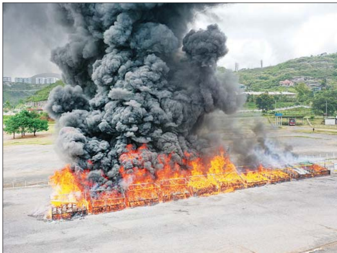
တောင်ကြီးမြို့ အဝေရာကုန်းသာယာမီးပုံးပျံကွင်း၌ ဖမ်းဆီးရမိမူးယစ်ဆေးဝါးများကို မီးရှို့ဖျက်ဆီးစဉ်။