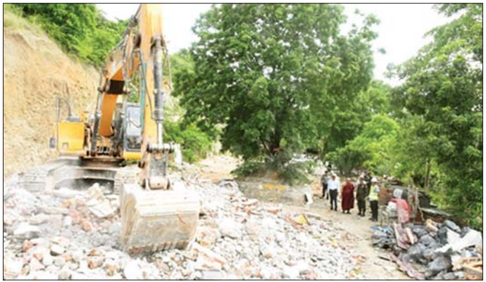
ကာကွယ်ရေးဦးစီးချုပ်ရုံး (ကြည်း) ဒုတိယဗိုလ်ချုပ်ကြီး သက်ဝန် ဇေယျာရာမကျောင်းတိုက်အတွင်း လျှင်ဒဏ်ကြောင့် ထိခိုက်ပျက်စီးခဲ့သော အဆောက်အအုံများ အပြီးသတ် ဖယ်ရှားရင်းလင်းနေမှုကို ကြည့်ရှုစစ်ဆေးစဉ်။

ထိုသို့ ဆောင်ရွက်ပေးလျက် ရှိရာ ယနေ့တွင် ကာကွယ်ရေးဦးစီးချုပ်ရုံး (ကြည်း) မှ ဒုတိယဗိုလ်ချုပ်ကြီး သက်ဝန်နှင့် တာဝန်ရှိသူများသည် စစ်ကိုင်းမြို့အတွင်းရှိ လျှင်ဒဏ်ကြောင့် ပြိုကျပျက်စီးခဲ့သော ပတ္တမြားစေတီနှင့် မဟာစေတီလှစေတီတို့အား အဖွဲ့အစည်းအသီးသီးနှင့် ဒေသပြည်သူများ ပူးပေါင်း၍ အပြီးသတ်ဖယ်ရှားရင်းလင်းပြီးနောက် အသစ်တစ်ဖန် ပြန်လည်တည်ထားကိုးကွယ်မည့် မြေနေရာအား ပြင်ဆင်ဆောင်ရွက်နေသည့် အခြေအနေများနှင့် မူလ မဟာစေတီမှရရှိသော ဌာပနာတို့ကို လိုက်လံကြည့်ရှုစစ်ဆေးပြီး ဌာပနာများအား စနစ်တကျ ထိန်းသိမ်းထားရှိရန် တာဝန်ရှိသူများအား မှာကြားသည်။ ဆက်လက်ပြီး စစ်ကိုင်းမြို့အတွင်းရှိ ဆောင်ပိလာလေးကျွန်းဆီမီး စေတီတော်မြတ်ကြီး၊ ဇေယျာရာမကျောင်းတိုက်၊ နဝလောဟာကျောင်းတိုက်နှင့် တောလေးထပ် ကျောင်းတိုက်များ၌ လျှင်ဒဏ်ကြောင့် ထိခိုက်ပျက်စီးခဲ့သော အဆောက်အအုံများကို လုံခြုံရေးတပ်ဖွဲ့ဝင်များက အပြီးဖယ်ရှားရင်းလင်းပြီး ပြန်လည်တည်ဆောက်နေမှုအခြေအနေများ၊ စစ်ကိုင်းမြို့အတွင်းရှိ လျှင်ဒဏ်ကြောင့် ပြိုကျပျက်စီးခဲ့သော လူနေအဆောက်အအုံများ၊ လမ်းဘေးဝဲ/ယာများရှိ လျှင်ဒဏ်ကြောင့် ပျက်စီးခဲ့သည့် အပြုအမူများအား လုံခြုံရေးတပ်ဖွဲ့ဝင်များက အပြီးသတ်ရှင်းလင်းနေမှုတို့ကို ကြည့်ရှုစစ်ဆေးကာ လုပ်အားပေး ဆောင်ရွက်နေကြ သူများကို အားပြည့်အချိန်များအားပေး၍ လိုအပ်သည်များကို တာဝန်ရှိသူများနှင့် ပေါင်းစပ်