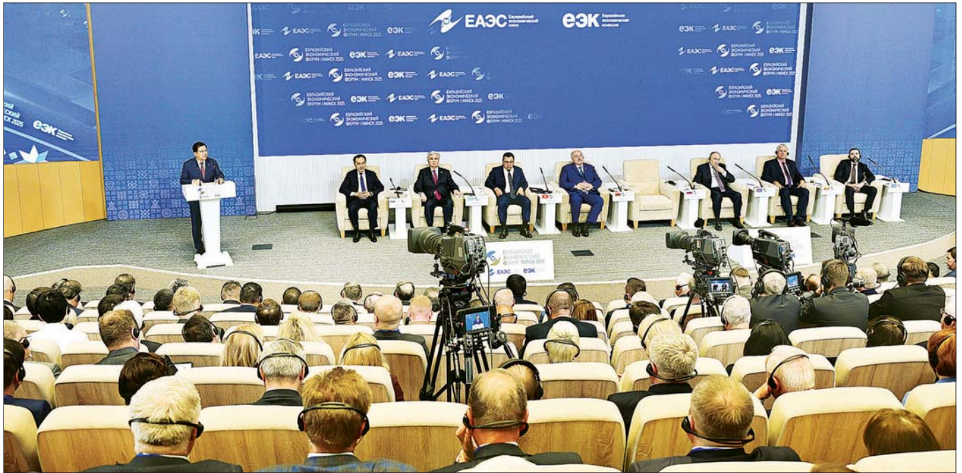
နိုင်ငံတော်စီမံအုပ်ချုပ်ရေးကောင်စီဥက္ကဋ္ဌ နိုင်ငံတော်ဝန်ကြီးချုပ် ဗိုလ်ချုပ်မှူးကြီး မင်းအောင်လှိုင် Minsk International Exhibition Center BELEXPO ၂၀၂၅ ကျင်းပသည့် စတုတ္ထအကြိမ် ဥရောပ-အာရှ စီးပွားရေးဖိုရမ် (EEF 2025) ၏ မျက်နှာစုံညီအစည်းအဝေး၌ မိန့်ခွန်းပြောကြားစဉ်။