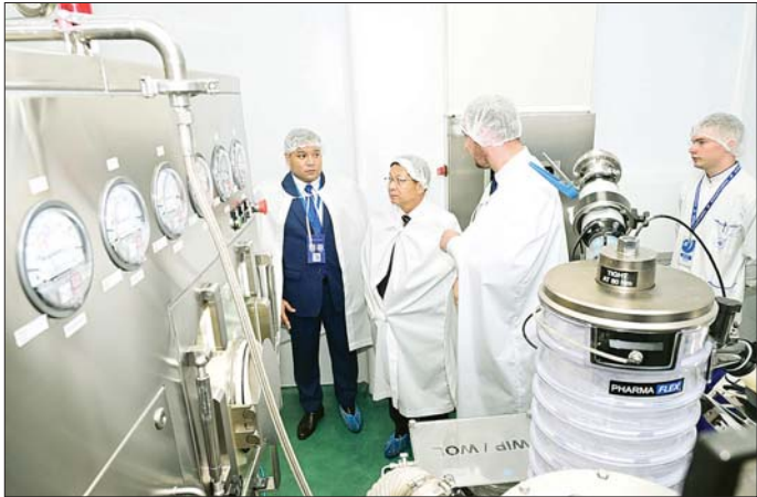
နိုင်ငံတော်စီမံအုပ်ချုပ်ရေးကောင်စီဥက္ကဋ္ဌ နိုင်ငံတော်ဝန်ကြီးချုပ် ဗိုလ်ချုပ်မှူးကြီး မင်းအောင်လှိုင် ဘယ်လာရစ်သမ္မတနိုင်ငံ မင့်စံမြို့ရှိ Belmedpreparaty ဆေးဝါးစက်ရုံအတွင်း ဆေးဝါးထုတ်လုပ်နေမှု အဆင့်ဆင့်ကို ကြည့်ရှုလေ့လာစဉ်။