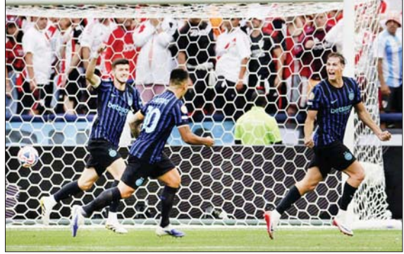
အင်တာမီလန်အသင်းနှင့် ရေးဗားပလိတ်အသင်းတို့ ယှဉ်ပြိုင်ကစားစဉ်။

အင်တာမီလန်အသင်းက အာဂျင်တီးနား အဆိုပါပွဲစဉ်သည် ကလပ်ကမ္ဘာ့ဖလား ကလပ် ရေးဗားပလိတ်အသင်းကို နှစ်ဂိုး ဖြိုင်ပွဲ အုပ်စုအဆင့် နောက်ဆုံးပွဲစဉ်ဖြစ်ပြီး ပြတ်နိုင်ပွဲရရှိပြီး ကလပ်ကမ္ဘာ့ဖလား ဇွန် ၂၆ ရက် နံနက် ၇ နာရီက ယှဉ်ပြိုင်ကစား ဖြိုင်ပွဲ ရှုံးထွက်အဆင့်သို့ အုပ်စုပထမဖြင့် ခဲ့ခြင်းဖြစ်သည်။ စာမျက်နှာ ၁၆ ကော်လံ ၅ ❖