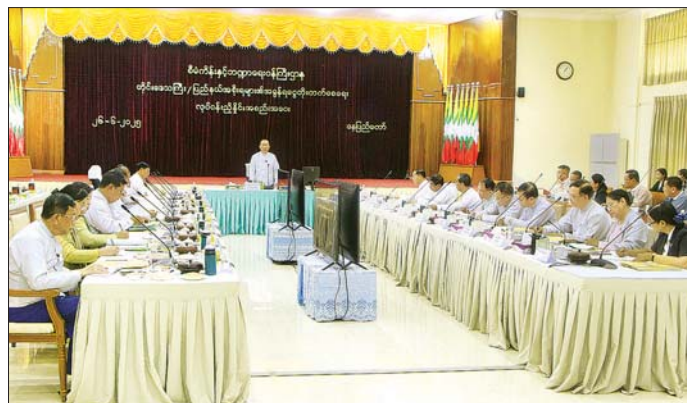
ရန် လိုအပ်ကြောင်း ပြောကြားသည်။

အစိုးရကကောက်ခံရရှိသည့် အခွန်ငွေများထဲမှ အခွန်ဝေစုကို နှစ်လတစ်ကြိမ်အရ တိုင်းဒေသကြီး/ပြည်နယ်များ၏ ဘဏ္ဍာရန်ပုံငွေများသို့ လွှဲပြောင်းပေးသွင်းထောက်ပံ့ပေးလျက်ရှိကြောင်း၊ နောင်ကာလများတွင် တိုင်းဒေသကြီး/ပြည်နယ်များအနေဖြင့် မိမိတို့ တိုင်းဒေသကြီး/ပြည်နယ်အလိုက် ကောက်ခံရရှိသည့် အခွန်များနှင့် ရပ်တည်နိုင်အောင် ကြိုးပမ်းသွားကြရန်ဖြစ်ကြောင်း၊ ယနေ့အစည်းအဝေးတွင် တိုင်းဒေသကြီး/ပြည်နယ် အစိုးရများ၏ အခွန်ရငွေတိုးတက်ရရှိလာစေရေးအတွက် ဆောင်ရွက်မည့် အစီအမံများနှင့် ပစ္စည်းခွန်ဆိုင်ရာကိစ္စရပ်များကို ဆွေးနွေးကြရန်ဖြစ်ကြောင်း။ ပြင်းထန်သည့် မန္တလေးလေ့ကျင့်ရေးကြောင့် စစ်ကိုင်းတိုင်း၊ မန္တလေးတိုင်းနှင့် နေပြည်တော်အတွင်းရှိမြို့များတွင် ဌာနဆိုင်ရာအဆောက်အအုံများ၊ ဝန်ထမ်းအိမ်ရာများ၊ ဘာသာရေးဆိုင်ရာအဆောက်အအုံများ၊ လူနေအဆောက်အအုံများ ပြုကျယ်စီးခြင်း၊ ပြည်သူများထိခိုက်သေဆုံးခြင်းနှင့် အိုးအိမ်များ ပျက်စီးဆုံးရှုံးခြင်းတို့ကြောင့် နိုင်ငံတော်အတွက် ဆုံးရှုံးနစ်နာမှုများစွာ ဖြစ်ပေါ်ခဲ့ကြောင်း။ နိုင်ငံတော်အစိုးရအနေဖြင့် အဆိုပါလျှင်ဒဏ်သင့်ဒေသများတွင် ကူညီကယ်ဆယ်ရေးလုပ်ငန်းများနှင့် ပြန်လည်ထူထောင်ရေးလုပ်ငန်းများကို လျင်မြန်စွာ ဆက်လက်လုပ်ဆောင်လျက်ရှိရာ လိုအပ်သည့်အသုံးစရိတ်များ ပိုမိုတိုးမြှင့်သုံးစွဲနေကြောင်း၊ ယင်းအသုံးစရိတ်များ ကာမိစေရန်နှင့် ဘဏ္ဍာရေးလုံခြုံမှုများလျော့ချနိုင်ရန် ပြည်ထောင်စုအနေဖြင့်လည်း ပြည်ထောင်စု၏ အခွန်ကောက်ခံရန်လျာထားချက်များကို ပြည့်မီအောင် ကြိုးပမ်းဆောင်ရွက်နေသကဲ့သို့ တိုင်းဒေသကြီး/ပြည်နယ်အစိုးရအဖွဲ့များကလည်း မိမိတို့ကောက်ခံရန်အခွန်လျာထားချက်များ ပြည့်မီအောင်ကောက်ခံနိုင်ရေး ကြိုးပမ်းဆောင်ရွက်