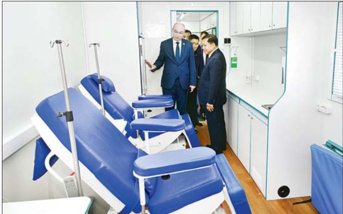
နိုင်ငံတော်စီမံအုပ်ချုပ်ရေးကောင်စီဥက္ကဋ္ဌ နိုင်ငံတော်ဝန်ကြီးချုပ် ဗိုလ်ချုပ်မှူးကြီး မင်းအောင်လှိုင် ဘယ်လာရစ်သမ္မတနိုင်ငံ မင့်စံမြို့ရှိ Belmedpreparaty ဆေးဝါးစက်ရုံအတွင်း ကြည့်ရှုလေ့လာစဉ်။

သည့် ဆေးကုသရေးအထောက် အကူပြု မော်တော်ယာဉ်များအား လိုက်လံကြည့်ရှု လေ့လာကြပြီး ရှင်းလင်းတင်ပြမှုများအပေါ် သိရှိ လိုသည်များ ပြန်လည်မေးမြန်း ဆွေးနွေးပြောကြားသည်။ ကြည့်ရှုလေ့လာ ယင်းနောက် ဘယ်လာရစ် နိုင်ငံမှ ထုတ်လုပ်ထားသည့် ဆေးဝါးများပြခန်း၊ ဆေးကုသ မှုများဆောင်ရွက်ရာတွင်အသုံးပြု သည့် စက်ကိရိယာများပြခန်းတို့ စာမျက်နှာ ၄ သို့