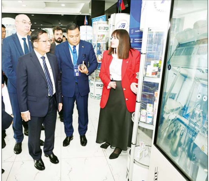
နိုင်ငံတော်စီမံအုပ်ချုပ်ရေးကောင်စီဥက္ကဋ္ဌ နိုင်ငံတော်ဝန်ကြီးချုပ် ဗိုလ်ချုပ်မှူးကြီး မင်းအောင်လှိုင် ဘယ်လာရစ်သမ္မတနိုင်ငံ မင့်စံမြို့ရှိ Belmedpreparaty ဆေးဝါးစက်ရုံအတွင်း ဆေးဝါးထုတ်လုပ်နေမှု အဆင့်ဆင့်ကို ကြည့်ရှုလေ့လာစဉ်။