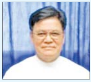
ဒေါက်တာမောင်ကျော် ပါမောက္ခချုပ်(ငြိမ်း)