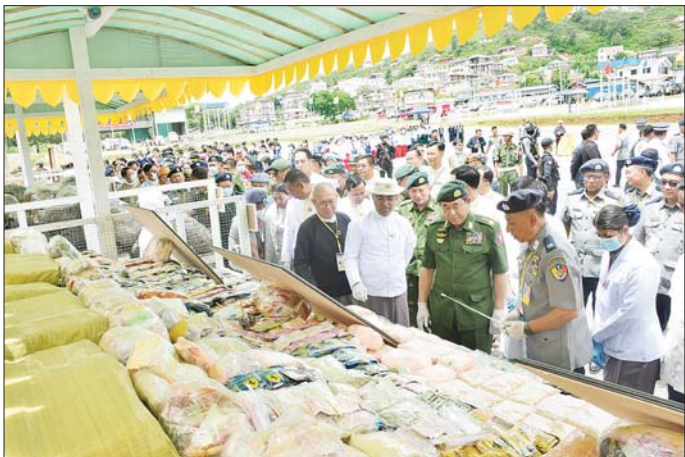
ပြည်ထောင်စုဝန်ကြီး ဒုတိယဗိုလ်ချုပ်ကြီး ထွန်းထွန်းနောင်နှင့် ရှမ်းပြည်နယ်ဝန်ကြီးချုပ် ဦးအောင်အောင် တောင်ကြီးမြို့ အဝေရာကုန်းသာယာမီးပုံးပျံကွင်း၌ မီးရှို့ဖျက်ဆီးမည့် ဖမ်းဆီးရမိမူးယစ်ဆေးဝါးများကို ကြည့်ရှုစဉ်။