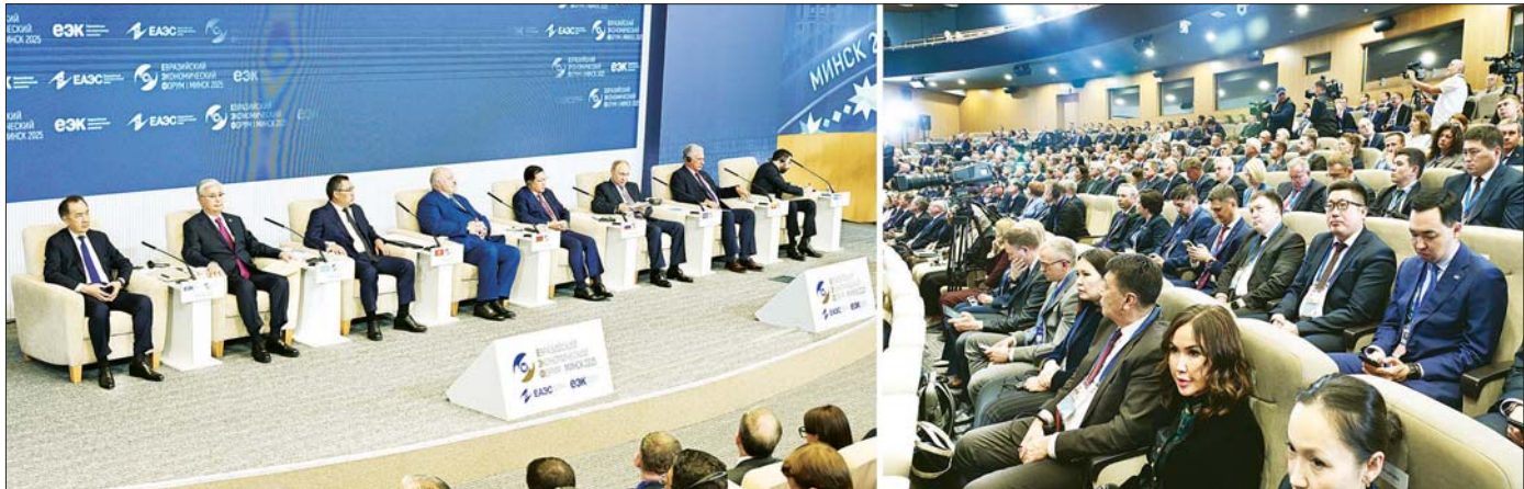
ဘယ်လားရစ်သမ္မတနိုင်ငံ မင့်စီမြို့၌ကျင်းပသည့် စတုတ္ထအကြိမ် ဥရောပ - အာရှစီးပွားရေးဖိုရမ် (EEF 2025) ကျင်းပစဉ်။