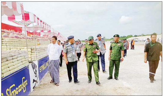
မန္တလေးတိုင်းဒေသကြီးဝန်ကြီးချုပ် ဦးမျိုးအောင်၊ မန္တလေးတိုင်းဒေသကြီး ချမ်းမြသာစည်မြို့နယ် ချမ်းမြသာစည်(တောင်)ရပ်ကွက်ရှိ လေယာဉ်ကွင်းအဟောင်း၌ မီးရှို့ဖျက်ဆီးမည့် ဖမ်းဆီးရမိမူးယစ်ဆေးဝါးများကို ကြည့်ရှုစဉ်။

တောင်ကြီးမြို့ မြို့တော်ခန်းမ၌ အပြည်ပြည်ဆိုင်ရာ မူးယစ်ဆေးဝါးအလွဲသုံးမှုနှင့် တရားမဝင်ရောင်းဝယ်မှုတိုက်ဖျက်ရေးနေ့ အထိမ်းအမှတ် အခမ်းအနားကို ပြုလုပ်ရာ ရှမ်းပြည်နယ်ဝန်ကြီးချုပ် ဦးအောင်အောင်နှင့် ပြည်နယ်ဝန်ကြီးများ၊ ရှမ်းပြည်နယ်မူးယစ်ဆေးဝါးတားဆီးကာကွယ်ရေးအဖွဲ့ဥက္ကဋ္ဌ၊ လုံခြုံရေးနှင့် နယ်စပ်ရေးရာဝန်ကြီး၊ မြန်မာနိုင်ငံရဲတပ်ဖွဲ့မှ အရာရှိကြီးများနှင့် မူးယစ်ဆေးဝါးတားဆီးနှိမ်နင်းရေး လုပ်ငန်းများကို စွမ်းစွမ်းတစ်ဆောင်ရွက်ခဲ့၍ ဆုရရှိသူ ၁၉ ဦး၊ ကျောင်းသား ကျောင်းသူ ၂၀၀ တက်ရောက်ခဲ့ကြပြီး ရှမ်းပြည်နယ်ဝန်ကြီးချုပ်က အဖွင့်အမှာစကားပြောကြား၍ မူးယစ်တားဆီးကာကွယ်ရေးဗဟိုအဖွဲ့ဥက္ကဋ္ဌ၏ သဝဏ်လွှာကို ပြည်နယ်မူးယစ်တားဆီးကာကွယ်ရေးအဖွဲ့ဥက္ကဋ္ဌက ဖတ်ကြားခြင်း၊ ဆုရရှိသူများအား ဆုချီးမြှင့်ခြင်း၊ မူးယစ်ဆေးဝါးအန္တရာယ် တားဆီးကာကွယ်ရေးဆိုင်ရာ အသိပညာပေးပြခန်းများကို လှည့်လည်ကြည့်ရှုခြင်းများ ဆောင်ရွက်ကြသည်။ ထို့အတူ နံနက် ၈ နာရီတွင် ရန်ကုန်တိုင်းဒေသကြီး လိုင်သာယာ(အနောက်ပိုင်း) မြို့နယ် ကုန်တင်ယာဉ်ရပ်နားကွင်း၌ ဖမ်းဆီးရမိမူးယစ်ဆေးဝါးများ မီးရှို့ဖျက်ဆီးခြင်း အခမ်းအနား ပြုလုပ်ရာ ရန်ကုန်တိုင်းဒေသကြီးဝန်ကြီးချုပ် ဦးစိုးသိန်း၊ ရန်ကုန်တိုင်းစစ်ဌာနချုပ် တိုင်းမှူး ဗိုလ်ချုပ် ပြည့်စုံလင်းနှင့် မူးယစ်တားဆီးကာကွယ်ရေးဗဟိုအဖွဲ့ အတွင်းရေး