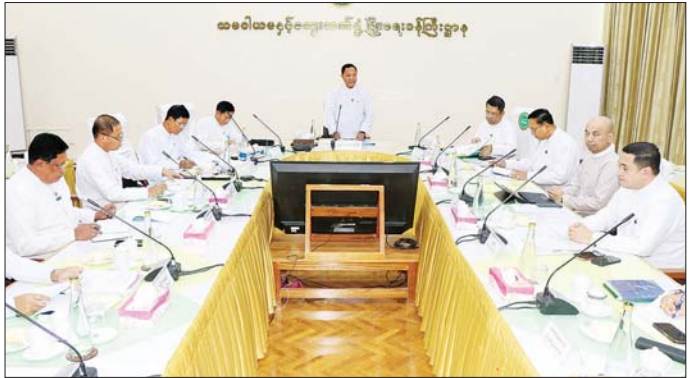
မြန်မာနိုင်ငံ မြေဩဇာ၊ မျိုးစေ့နှင့် စိုက်ပျိုးရေးဆေး ကိုလည်းကောင်း ရှင်းလင်းတင်ပြကြရာ ပြည်ထောင်စု လုပ်ငန်းရှင်များအသင်းဥက္ကဋ္ဌက မြေဩဇာနှင့် ဝန်ကြီးက လိုအပ်သည်များ ဖြည့်စွက်မှာကြား ပိုးသတ်ဆေးများ၏ နိုင်ငံတကာဈေးနှုန်းများ၊ ခွဲကြောင်း သတင်းရရှိသည်။ ဝယ်ယူဖြန့်ဖြူးရောင်းချအသုံးပြုမှု အခြေအနေများ သတင်းစဉ်

လိုအပ်ကြောင်း၊ သတ်မှတ်တန်ချိန်အမီ မတင်သွင်း နိုင်သည့်ကုမ္ပဏီများကို အရေးယူနိုင်ရေး ယခု အစည်းအဝေးတွင်ပိုင်းဝန်းဆွေးနွေးပေးစေလိုကြောင်း၊ ရည်ညွှန်းဈေးနှုန်း ထုတ်ပြန်ပေးမှုအနေဖြင့် သတ်မှတ် ကာလပြည့်ပြီဖြစ်၍ ထပ်မံသတ်မှတ်ပေးရမည်ဖြစ် ကြောင်း၊ ယခုလက်ရှိနိုင်ငံတကာတွင်ဖြစ်ပွားနေသည့် အခြေအနေများကြောင့် မြေဩဇာဈေးနှုန်းများ မြင့်တက်နေပြီး ပြည်တွင်းသုံးစွဲသူ တောင်သူများ အတွက် သင့်တင့်မျှတသော ဈေးနှုန်းဖြစ်စေရေး စီစဉ်ဆောင်ရွက်ပေးရမည်ဖြစ်၍ ယခုအစည်းအဝေး တွင် မြေဩဇာအသင်းကတင်ပြသော ရည်ညွှန်း ဈေးနှုန်းများအပေါ် ကော်မတီအဖွဲ့ဝင်များက ပိုင်းဝန်း ဆွေးနွေးပေးကြရန် ပြောကြားသည်။ ထို့နောက် ဦးဆောင်ကော်မတီအတွင်းရေးမှူး က ယခင်အစည်းအဝေးဆုံးဖြတ်ချက်များအပေါ် ဆောင်ရွက်ထားမှုနှင့် ၂၀၂၅ ခုနှစ် မေနှင့် ဇွန်တွင် ကုမ္ပဏီအလိုက် ထောက်ခံပေးထားသည့် မြေဩဇာ နှင့် ပိုးသတ်ဆေးတန်ချိန်များကိုလည်းကောင်း၊