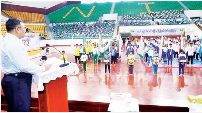
သော ဧည့်သည်တော်များ၊ ပြိုင်ပွဲ ဝင်အသင်းများမှ အုပ်ချုပ်သူ၊ နည်းပြများနှင့် အားကစားသမားများ တက်ရောက်ကြသည်။

၂၀၂၅ ခုနှစ် တိုင်းဒေသကြီးနှင့် ပြည်နယ် တိုက်ကွမ်ဒီပြိုင်ပွဲ ဖွင့်ပွဲ အခမ်းအနားကို ယနေ့ နံနက်ပိုင်းတွင် ရန်ကုန်မြို့ အမျိုးသား အားကစားပြိုင်ပွဲရုံ(၁) သုဝဏ္ဏ၌ ကျင်းပရာ မြန်မာနိုင်ငံအိုလံပစ်ကော်မတီဒုတိယဥက္ကဋ္ဌအားကစားနှင့် လူငယ်ရေးရာဝန်ကြီးဌာန ဒုတိယဝန်ကြီး ဦးထိန်လင်း၊ ရန်ကုန်တိုင်းဒေသကြီး လူမှုရေးရာဝန်ကြီး ဦးဌေးအောင်၊ ဌာနဆိုင်ရာ တာဝန်ရှိသူများ၊ မြန်မာနိုင်ငံတိုက်ကွမ်ဒီအားကစားအဖွဲ့ချုပ်ဥက္ကဋ္ဌ ဒုတိယဥက္ကဋ္ဌများနှင့် အဖွဲ့ဝင်များ၊ ဖိတ်ကြားထား