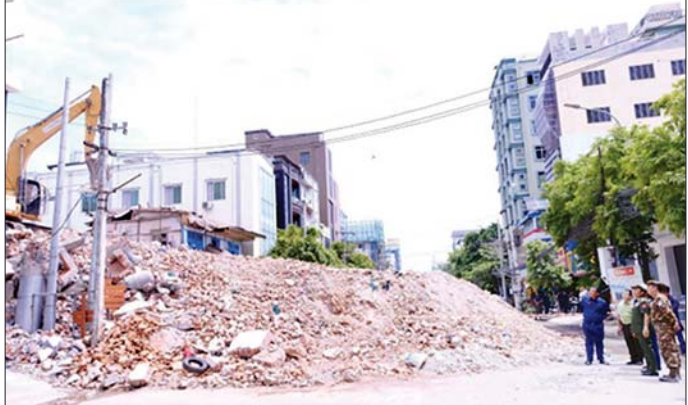
ကာကွယ်ရေးဦးစီးချုပ်ရုံး(ကြည်း)မှ ဒုတိယဗိုလ်ချုပ်ကြီး စိုးတင်နိုင် မန္တလေးမြို့ ချမ်းအေးသာစံမြို့နယ် အောက်နန်းရိပ်သာ အရှေ့ရပ်ကွက်ရှိ လျှင်ဒဏ်ကြောင့် ပြိုကျပျက်စီးခဲ့သည့် အန္တရာယ်ရှိအဆောက်အအုံ အပျက်အစီးများအား စက်ယန္တရားကြီးများ အသုံးပြု၍ ရှင်းလင်းဖယ်ရှားနေမှုကို ကြည့်ရှုစစ်ဆေးစဉ်။

ည့်နိုင်ဆောင်ရွက်ပေးသည်။ ထို့နောက် စစ်ကိုင်းမြို့အတွင်းရှိ ရဟန်းသံဃာတော်များ၊ သီလရှင်များနှင့် လူပုဂ္ဂိုလ်များအတွက် ကျေးလက်ဒေသဖွံ့ဖြိုးတိုးတက်ရေးဦးစီးဌာနမှ ရေသန့်စက်ယာဉ်ဖြင့် စရေဝတီမြစ်ရေကို သန့်စင်ပြီး သန့်ရှင်းသော သောက်သုံးရေ ပြန်ဖြူးပေးနေမှုတို့ကို ကြည့်ရှုစစ်ဆေးပြီး လိုအပ်သည်များကို တာဝန်ရှိသူများနှင့် ပေါင်းစပ်ညှိနှိုင်း ဆောင်ရွက်ပေးသည်။ အလားတူ ကာကွယ်ရေးဦးစီးချုပ်ရုံး (ကြည်း) မှ ဒုတိယဗိုလ်ချုပ်ကြီး စိုးတင်နိုင်နှင့် တာဝန်ရှိသူများသည် မန္တလေးမြို့ အောင်မြေသာစံမြို့နယ် အနိပ်တော် ရပ်ကွက်ရှိ Sky Villa နေရာသို့ သွားရောက်၍ လျှင်ဒဏ်ကြောင့် ထိခိုက်ပျက်စီးခဲ့သော ရင်းလင်းပေါင်းစပ်အဖွဲ့အစည်းများအား အသုံးပြု၍ ဖယ်ရှားရင်းလင်းရေးလုပ်ငန်းများ ဆောင်ရွက်နေသည့် အခြေအနေများကို လည်းကောင်း၊ ဖယ်ရှားရင်းလင်းရာမှ ရှာဖွေတွေ့ရှိသော ပစ္စည်းများအား ပစ္စည်းလက်ခံရာဌာနမှ စုဆောင်းရေးနှင့် ပြန်လည်အပ်နှံရေးအဖွဲ့ထံသို့ စနစ်တကျအပ်နှံမှုနှင့် ထိန်းသိမ်းထားရှိမှု၊ သက်ဆိုင်ရာပိုင်ရှင်များလက်ဝယ်သို့ ပြန်လည်လွှဲပြောင်းပေးနိုင်မှုအခြေအနေများကို လည်းကောင်း၊ ကြည့်ရှုစစ်ဆေး၍ လုပ်ငန်းခွင် အန္တရာယ်မရှိစေရေး စနစ်တကျ ပြုလုပ်ဆောင်ရွက်ရန်ရှိသည်။ သတင်းစဉ်