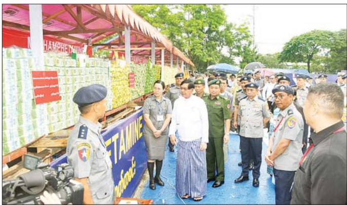
ရန်ကုန်တိုင်းဒေသကြီးဝန်ကြီးချုပ် ဦးစိုးသိန်း၊ ရန်ကုန်တိုင်းဒေသကြီး လိုင်သာယာ(အနောက်ပိုင်း) မြို့နယ် ကုန်တင်ယာဉ်ရပ်နားကွင်း၌ မီးရှို့ဖျက်ဆီးမည့် ဖမ်းဆီးရမိမူးယစ်ဆေးဝါးများကို ကြည့်ရှုစဉ်။

နှင့် ပြည်နယ်ဝန်ကြီးများ၊ အရှေ့ပိုင်းတိုင်းစစ်ဌာနချုပ် ဒုတိယတိုင်းမှူးနှင့် တပ်မတော်အရာရှိကြီးများ၊ ကိုယ်ပိုင်အုပ်ချုပ်ခွင့်ရတိုင်းနှင့် ဒေသဦးစီးအဖွဲ့၊ ဥက္ကဋ္ဌများ၊ မူးယစ်တားဆီးကာကွယ်ရေးဗဟိုအဖွဲ့ တို့အဖွဲ့အတွင်းရေးမှူး၊ မူးယစ်ဆေးဝါးတားဆီးနှိမ်နင်းရေးရဲတပ်ဖွဲ့၊ တပ်ဖွဲ့မှူး၊ ရဲမှူးချုပ် သန့်လွင်မောင်၊ မြန်မာနိုင်ငံရဲတပ်ဖွဲ့မှ ရဲအရာရှိကြီးများ၊ ထိုင်းနိုင်ငံ မူးယစ်ဆေးဝါးထိန်းချုပ်ရေးအဖွဲ့ (ONCB) မှ ကိုယ်စားလှယ်၊ မြန်မာနိုင်ငံအမျိုးသမီးရေးရာအဖွဲ့၊ မြန်မာနိုင်ငံ မိခင်နှင့်ကလေးစောင့်ရှောက်ရေးအသင်း၊ သူနာပြုသင်တန်းကျောင်းတို့မှ ကိုယ်စားလှယ်များ၊ ကျောင်းသား ကျောင်းသူများ၊ ဒေသခံတိုင်းရင်းသားကိုယ်စားလှယ်များ၊ မြို့မိ မြို့ဖများ တက်ရောက်ကြသည်။ အဆိုပါ မီးရှို့ဖျက်ဆီးပွဲတွင် ရှမ်းပြည်နယ်၊ ကယားပြည်နယ်တို့မှ ဖမ်းဆီးရမိသည့် ဘိန်း ၉၁၉ ကီလိုကျော်၊ ဘိန်းဖြူ ၄၆၁ ကီလိုကျော်၊ စိတ်ကြွရူးသွပ်ဆေးပြား ၉၂ သန်းကျော်၊ အိုက်စ် ၅၀၉၃ ကီလိုကျော်၊ စိတ်ပြောင်းဆေးဝါး (Happy Water) ၉၇ ကီလိုကျော်၊ ကက်တမင်း ၂၇၅၅ ကီလိုကျော်၊ ဆေးခြောက် ၅၉ ကီလိုကျော်အပါအဝင် မူးယစ်ဆေးဝါး ၁၉ ချိုးနှင့် ဓာတုပစ္စည်း ၁၂ ချိုး စုစုပေါင်း တန်ဖိုး မြန်မာငွေကျပ် ၃၇၃ ဘီလီယံကျော် (အမေရိကန်ဒေါ်လာ ၉၈ သန်းကျော်) ကို ဖျက်ဆီးခဲ့သည်။ ထို့ပြင် နံနက် ၈ နာရီတွင် ရှမ်းပြည်နယ်