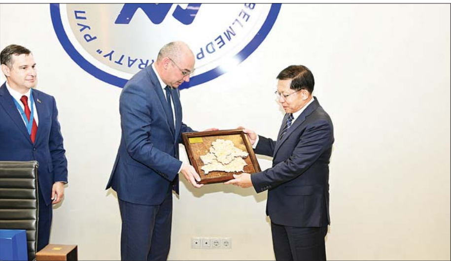
နိုင်ငံတော်စီမံအုပ်ချုပ်ရေးကောင်စီဥက္ကဋ္ဌ နိုင်ငံတော်ဝန်ကြီးချုပ် ဗိုလ်ချုပ်မှူးကြီး မင်းအောင်လှိုင်နှင့် ဘယ်လားရစ်သမ္မတနိုင်ငံ ကျန်းမာရေးဝန်ကြီးဌာနဝန်ကြီး Mr. Aliaksandr Khajajeyev တို့ လက်ဆောင်ပစ္စည်းများ အပြန်အလှန်လဲလှယ်စဉ်။

အပြန်အလှန်လဲလှယ်ထို့နောက် နိုင်ငံတော်စီမံအုပ်ချုပ်ရေး ကောင်စီဥက္ကဋ္ဌ နိုင်ငံတော်ဝန်ကြီးချုပ်နှင့် ဘယ်လားရစ်သမ္မတနိုင်ငံ ကျန်းမာရေးဝန်ကြီးဌာန ဝန်ကြီးတို့သည် လက်ဆောင်ပစ္စည်းများ အပြန်အလှန်လဲလှယ်ခဲ့ကြသည်။ ယင်းနောက် နိုင်ငံတော်စီမံအုပ်ချုပ်ရေး ကောင်စီဥက္ကဋ္ဌ နိုင်ငံတော်ဝန်ကြီးချုပ်နှင့် အဖွဲ့ဝင်များသည် Belmedpreparaty ဆေးဝါးစက်ရုံအတွင်း လှည့်လည်၍ ဆေးဝါးထုတ်လုပ်နေမှုအဆင့်ဆင့်အား ကြည့်ရှုလေ့လာခဲ့ကြပြီး တာဝန်ရှိသူများ၏ ရှင်းလင်းတင်ပြမှုများအပေါ် သိရှိလိုသည်များ ပြန်လည်မေးမြန်းဆွေးနွေး