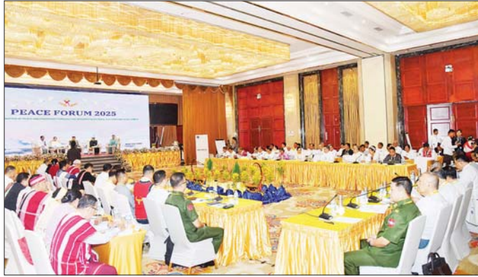
ဆွေးနွေးကြသည်။

ငြိမ်းချမ်းရေးဖိုရမ်သို့ အမျိုးသားစည်းလုံးညီညွတ်ရေးနှင့် ငြိမ်းချမ်းရေးဖော်ဆောင်မှုညှိနှိုင်းရေးကော်မတီဥက္ကဋ္ဌ ဒုတိယဗိုလ်ချုပ်ကြီး ရာပြည့်၊ အတွင်းရေးမှူး ဒုတိယဗိုလ်ချုပ်ကြီး မင်းနိုင်နှင့် ညှိနှိုင်းရေးကော်မတီဝင်များ၊ တပ်မတော်အငြိမ်းစားအရာရှိကြီးများ၊ ပစ်ခတ်တိုက်ခိုက်မှုရပ်စဲရေးဆိုင်ရာ ပူးတွဲစောင့်ကြည့်ရေးကော်မတီ (JMC)မှ ကိုယ်စားလှယ်များ၊ နိုင်ငံရေးပါတီများမှ ကိုယ်စားလှယ်များ၊ NCA လက်မှတ်ရေးထိုးထားသည့် တိုင်းရင်းသားလက်နက်ကိုင်အဖွဲ့အစည်းများမှ ကိုယ်စားလှယ်များ၊ NCA လက်မှတ်ရေးထိုးထားခြင်း မရှိသေးသည့် တိုင်းရင်းသားလက်နက်ကိုင် အဖွဲ့အစည်းများမှ ကိုယ်စားလှယ်များ၊ ငြိမ်းချမ်းရေးလှုပ်ငန်းစဉ်တွင် ပါဝင်ဆောင်ရွက်သူများ၊ ပါဝင်သင့်ပါဝင်ထိုက်သူများ၊ အသိပညာရှင်၊ အတတ်ပညာရှင်များ၊ ပြည်ထောင်စုဝန်ကြီးဌာနများနှင့် အဖွဲ့အစည်းများမှ ညွှန်ကြားရေးမှူးချုပ်များ၊ တက္ကသိုလ်များမှ ပါမောက္ခများ၊ အစိုးရမဟုတ်သော နိုင်ငံတကာအဖွဲ့အစည်းများ၊ အစိုးရမဟုတ်သော ပြည်တွင်းအဖွဲ့အစည်းများ၊ အသင်းအဖွဲ့ကိုယ်စားလှယ်များ၊ မီဒီယာများနှင့် လေ့လာသူများ တက်ရောက်ကြပြီး အဖွဲ့ (၂) ဖွဲ့ခွဲ၍