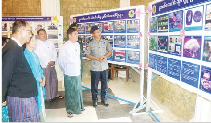
ရခိုင်ပြည်နယ်ဝန်ကြီးချုပ် ဦးထိန်လင်း စစ်တွေမြို့၌ကျင်းပသည့် (၃၈)ကြိမ်မြောက် အပြည်ပြည်ဆိုင်ရာ မူးယစ်ဆေးဝါးအလှည့်သုံးမှုနှင့် တရားမဝင်ရောင်းဝယ်မှုတိုက်ဖျက်ရေးနေ့အခမ်းအနားတွင် အသိပညာပေး ဇာတ်ပုံများ၊ နံရံကပ်စာစောင်များကို လှည့်လည်ကြည့်ရှုစဉ်။

ထို့နောက် မန္တလေးတိုင်းဒေသကြီး၊ မြန်မာနိုင်ငံ အထက်ပိုင်းဒေသများနှင့် အလယ်ပိုင်းဒေသများမှ ဖမ်းဆီးရမိသည့် ဘိန်း၊ ၃၈၀ ကီလိုဂရမ်၊ ဘိန်းဖြူ ၁၁၀၀ ကီလိုဂရမ်၊ စိတ်ကြွေးသွပ်ဆေးပြား ၁၅၅ သန်းကျော်၊ အိုက်စ် ၆၄၀ ကီလိုဂရမ်၊ စိတ်ပြောင်းဆေးဝါး (Happy Water) ၈၆ ကီလိုကျော်၊ ကက်တမင်း ၉၃ ကီလိုကျော်၊ ဆေးခြောက် ၁၃၄ ကီလိုဂရမ်အပါအဝင် မူးယစ်ဆေးဝါး ၂၆ မျိုးနှင့် ဓာတုပစ္စည်း ၁၇ မျိုး စုစုပေါင်းတန်ဖိုး မြန်မာငွေကျပ် ၂၉၅ ဘီလီယံကျော် (အမေရိကန် ဒေါ်လာ ၈၂ သန်းကျော်)ကို ဖျက်ဆီးခဲ့ကြသည်။