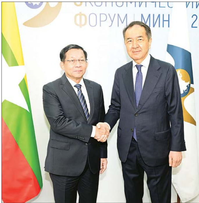
နိုင်ငံတော်စီမံအုပ်ချုပ်ရေးကောင်စီဥက္ကဋ္ဌ နိုင်ငံတော်ဝန်ကြီးချုပ် ဗိုလ်ချုပ်မှူးကြီး မင်းအောင်လှိုင်အား ဥရောပ-အာရှ စီးပွားရေးကော်မရှင်(EEC) ဘုတ်အဖွဲ့ဥက္ကဋ္ဌ Mr.Bakytzhan Abdirovich Sagintayev က ရင်းနှီးနှေးနှေးနှုတ်ဆက်စဉ်။

ယင်းနောက် နိုင်ငံတော်စီမံအုပ်ချုပ်ရေးကောင်စီဥက္ကဋ္ဌ နိုင်ငံတော်ဝန်ကြီးချုပ်က ယခုတွေ့ဆုံဆွေးနွေးမှုမှတစ်ဆင့် မိမိတို့မြန်မာနိုင်ငံနှင့် ဥရောပ-အာရှ စီးပွားရေးသမဂ္ဂ (EAEU) အဖွဲ့ဝင်နိုင်ငံများအကြား ပူးပေါင်းဆောင်ရွက်မှုများကို လက်တွေ့အကောင်အထည်ဖော်ဆောင်ရွက်နိုင်ရန် တွန်းအားဖြစ်စေမည်ဟု ယုံကြည်ကြောင်း၊ မြန်မာနိုင်ငံနှင့် ဥရောပ-အာရှ စီးပွားရေးသမဂ္ဂ (EAEU) တို့အကြား ၂၀၂၃ ခုနှစ်တွင် ပူးပေါင်းဆောင်ရွက်မှုစာချုပ်လက်မှတ်ရေးထိုးခဲ့ပြီးဖြစ်ကြောင်း၊ ထို့ပြင် ၂၀၂၃ ခုနှစ် ဇူလိုင်လတွင် ရှာဖွေဖက်ဒရေရှင်းနိုင်ငံ စိန့်ပီတာစဘတ်မြို့၌ ပြည်ထောင်စုသမ္မတမြန်မာနိုင်ငံတော်အစိုးရနှင့် ဥရောပ-အာရှ စီးပွားရေးကော်မရှင် (EEC) တို့အကြား ပူးပေါင်းဆောင်ရွက်မှုစာချုပ် (Memorandum of Cooperation - MOC) အား လက်မှတ်ရေးထိုးခဲ့ကြောင်း၊ မြန်မာနိုင်ငံနှင့် (EAEU) အဖွဲ့ဝင်နိုင်ငံများအကြား ပူးပေါင်းဆောင်ရွက်နိုင်မည့် အခွင့်အလမ်းများစွာကိုလည်း လေ့လာတွေ့ရှိရပါကြောင်း၊ လက်မှတ်ရေးထိုးထားသည့် ပူးပေါင်းဆောင်ရွက်မှုစာချုပ်အား အကောင်အထည်ဖော်ဆောင်ရွက်ခြင်းမှတစ်ဆင့် ဥရောပ-အာရှ စီးပွားရေးသမဂ္ဂ (EAEU) ၏ လေ့လာသူနိုင်ငံအဆင့်အထိ တက်လှမ်းနိုင်မည်ဟုလည်း ယုံကြည်မျှော်လင့်ထားကြောင်း၊ မြန်မာနိုင်ငံအနေဖြင့် လက်တွေ့အကောင်အထည်ဖော်ဆောင်ရွက်မှုများဖြင့် ပူးပေါင်းဆောင်ရွက်မှုကို ပိုမိုခိုင်မာကျယ်ပြန့်စေရေး ဆောင်ရွက်သွား