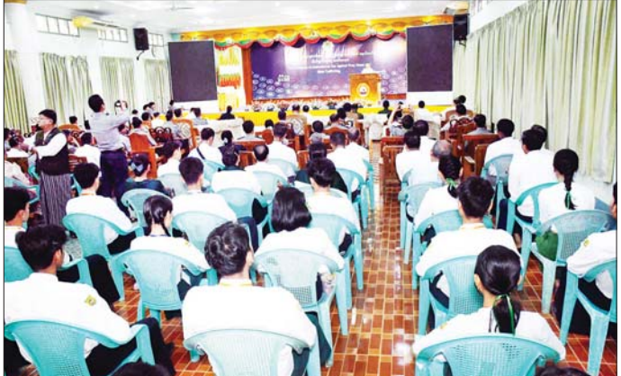
တနင်္သာရီတိုင်းဒေသကြီးဝန်ကြီးချုပ် ဦးမြတ်ကို ထားဝယ်မြို့၌ကျင်းပသည့် အပြည်ပြည်ဆိုင်ရာမူးယစ်ဆေးဝါးအလှည့်သုံးမှုနှင့် တရားမဝင်ရောင်းဝယ်မှုတိုက်ဖျက်ရေးနေ့အထိမ်းအမှတ်အခမ်းအနားတွင် အမှာစကား ပြောကြားစဉ်။

မီးရှို့ဖျက်ဆီးခြင်းအစီအစဉ်ကို မန္တလေးတိုင်းဒေသကြီး ချမ်းမြသာစည်မြို့နယ် ချမ်းမြသာစည်(တောင်) ရပ်ကွက်ရှိ လေယာဉ်ကွင်းအဟောင်း၌ နံနက် ၈ နာရီတွင်ပြုလုပ်ရာ မန္တလေးတိုင်းဒေသကြီးဝန်ကြီးချုပ် ဦးမျိုးအောင်၊ အလယ်ပိုင်းတိုင်းစစ်ဌာနချုပ် တိုင်းမှူး ဗိုလ်မှူးချုပ် ကျော်ကိုထိုက်နှင့် တိုင်းဒေသကြီးဝန်ကြီးများ၊ မြန်မာနိုင်ငံရဲတပ်ဖွဲ့ ဒုတိယရဲချုပ်(၂) ရဲဗိုလ်ချုပ် အောင်နိုင်သူနှင့် ရဲအရာရှိကြီးများ၊ မန္တလေးမြို့အခြေစိုက် ကောင်စစ်ဝန်ရုံးများမှ ကိုယ်စားလှယ်များနှင့် မိတ်ဖက်အဖွဲ့အစည်းများမှ ကိုယ်စားလှယ်များ၊ မူးယစ်ဆေးဝါးတားဆီး နှိမ်နင်းရေးလုပ်ငန်းများကို စွမ်းစွမ်းတမ်းတမ်း ဆောင်ရွက်ခဲ့၍ ဆုရရှိသူ ၂၀ တက်ရောက်ခဲ့ကြပြီး မန္တလေးတိုင်းဒေသကြီးဝန်ကြီးချုပ်က အဖွင့်အမှာစကားပြောကြားခြင်း၊ မူးယစ်တားဆီးကာကွယ်ရေးဗဟိုအဖွဲ့ ဥက္ကဋ္ဌ၏ သဝဏ်လွှာကို တိုင်းဒေသကြီးမူးယစ်တားဆီးကာကွယ်ရေးအဖွဲ့ ဥက္ကဋ္ဌက ဖတ်ကြားခြင်း၊ ဆုရရှိသူများကို ဆုချီးမြှင့်ခြင်း၊ မူးယစ်ဆေးဝါးအန္တရာယ်တားဆီးကာကွယ်ရေးဆိုင်ရာ အသိပညာပေး ပြခန်းများကို လှည့်လည်ကြည့်ရှုခြင်းများ ဆောင်ရွက်ခဲ့သည်။