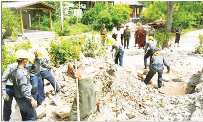
စစ်ကိုင်းတိုင်းဒေသကြီးဝန်ကြီးချုပ် ဦးမြတ်ကျော်နှင့် ကာကွယ်ရေးဦးစီးချုပ်ရုံး(ကြည်း)မှ ဒုတိယ ဗိုလ်ချုပ်ကြီး သက်ပုံ တို့ ရှင်ပင်နန်းဦးစေတီသို့ သွားရောက်ကြည့်ရှုစစ်ဆေးစဉ်။

ပေးဆောင်ရွက်နေကြသူများကို အားဖြည့်အချိန်ရည် များ ပေးအပ်ပြီး လိုအပ်သည်များကို တာဝန်ရှိသူများ နှင့် ပေါင်းစပ်ညှိနှိုင်း ဆောင်ရွက်ပေးသည်။ ဆက်လက်ပြီး ဒုတိယဗိုလ်ချုပ်ကြီး သက်ပုံနှင့် တာဝန်ရှိသူများသည် လျှင်ဒဏ်ကြောင့် ထိခိုက်ပျက်စီးခဲ့သော ရှင်ပင်နန်းဦးစေတီအား လုံခြုံရေး တပ်ဖွဲ့ဝင်များက အပြီးသတ်ဖယ်ရှားရှင်းလင်းနေမှု များ၊ လျှင်ဒဏ်ကြောင့် ထိခိုက်ပျက်စီးခဲ့သော မဟိယင်္ဂဏစေတီအား ပြန်လည်ပြုပြင်မွမ်းမံ တည်ဆောက်နေသည့် အခြေအနေများကို ကြည့်ရှု စစ်ဆေးကာ လိုအပ်သည်များကို တာဝန်ရှိသူများနှင့် ပေါင်းစပ်ညှိနှိုင်း ဆောင်ရွက်ပေးသည်။ ဆက်လက်၍ စစ်ကိုင်းမြို့ရှိ အခြေခံပညာ အလယ်တန်းကျောင်း(ခွဲ)ဇေယျာ၌ လုံခြုံရေး တပ်ဖွဲ့ဝင်များက လျှင်ဒဏ်ကြောင့် ထိခိုက်ပျက်စီး သွားသော ကျောင်းအုတ်တံတိုင်းနံရံများအား ဖယ်ရှားရှင်းလင်းနေမှုတို့ကို ကြည့်ရှုစစ်ဆေးကာ လုပ်အားပေးဆောင်ရွက်နေကြသူများကို အားဖြည့်