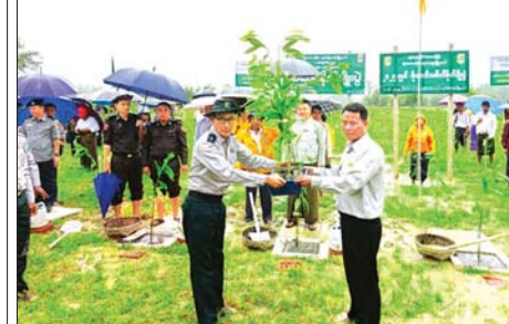
ကွမ်းခြံကုန်းမြို့နယ်၌ မိုးရာသီသစ်ပင်စိုက်ပျိုးပွဲတော်ကျင်းပ

နှင့်အတူ လေပြင်းတိုက်ခတ်ခြင်း၊ မိုးထစ်ချန်း ခြင်း၊ မိုးကြိုးပစ်ခြင်း၊ လျှပ်စီးလက်ခြင်း၊ မိုးသီးကြေခြင်း၊ လျှပ်တစ်ပြက်ရေကြီးခြင်းနှင့် မြေပြိုခြင်းစသည့်သဘာဝဘေးအန္တရာယ်များ ဖြစ်ပေါ်နိုင်ပါသဖြင့် အဆိုပါဒေသများရှိ ကုန်းမြင့်ဒေသအနီးတွင် နေထိုင်ကြသူများ အနေဖြင့် မြေပြိုမှုအန္တရာယ်၊ မြစ်ဝယ်၊ ချောင်းငယ်များအနီးတွင် နေထိုင်ကြသူများ အနေဖြင့် ရေကြီး၊ ရေလျှံမှုများကို ကြိုတင် သတိပြုရှောင်ရှားနိုင်ပါရန်နှင့် ပြည်တွင်း ရေကြောင်းသွားလာရေး၊ လေကြောင်းပျံသန်း ရေးနှင့် ဆည်မြောင်းတာဝန်များအနေဖြင့် လိုအပ်သည်များ ကြိုတင်ပြင်ဆင်ဆောင်ရွက် ထားနိုင်ပါရန် သတိပေးနှိုးဆော်အပ်ပါသည်။ မိုး/ဇေ