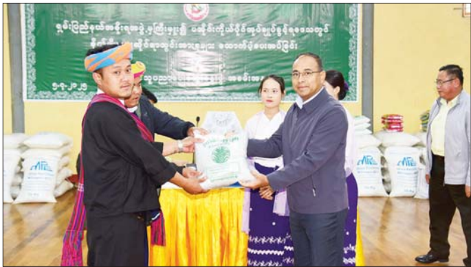
စက်ရန်နှင့် အာလူးမျိုး ထုတ်လုပ်ခြင်းလုပ်ငန်းကို ပေါင်းစပ်ညှိနှိုင်း ဆောင်ရွက်ပေးခဲ့ကြောင်း သိရ သွားရောက်ကြည့်ရှုစစ်ဆေး၍ လိုအပ်သည်များကို သည်းပေးအပ်ကြသည်။

ချုပ်၊ ပြည်နယ်ဝန်ကြီးများ၊ ပြည်နယ်အတွင်းရေးမှူး၊ ပအိုဝ်းကိုယ်ပိုင် အုပ်ချုပ်ခွင့်ရဒေသ စီမံအုပ်ချုပ်ရေး အဖွဲ့ ဥက္ကဋ္ဌတို့က ဓာတ်မြေဩဇာများ ထောက်ပံ့ပေး အပ်ကြကာ ခန်းမအတွင်း ခင်းကျင်းပြသထားသော ဒေသထွက်ကုန်ပစ္စည်းများနှင့် စိုက်ပျိုးရေးသုံးပစ္စည်း များကို ကြည့်ရှုအားပေးကြသည်။