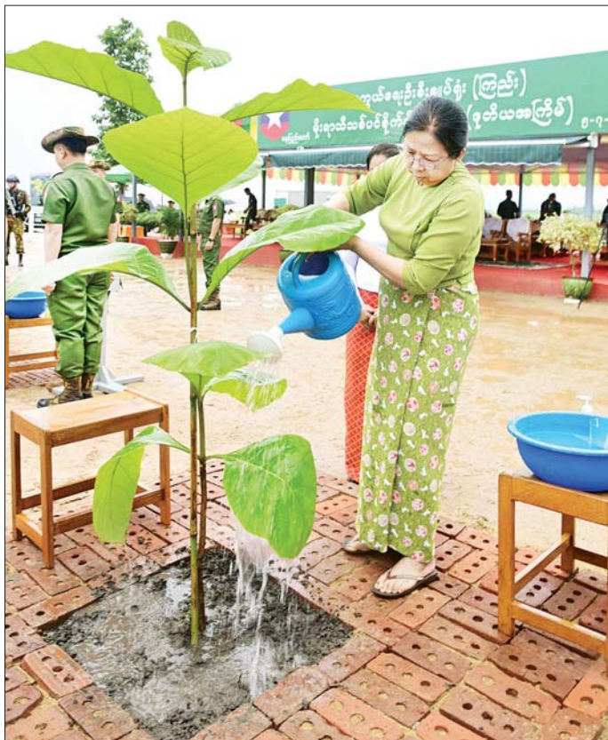
နိုင်ငံတော်စီမံအုပ်ချုပ်ရေးကောင်စီဥက္ကဋ္ဌ တပ်မတော်ကာကွယ်ရေးဦးစီးချုပ် ဗိုလ်ချုပ်မှူးကြီး မင်းအောင်လှိုင်နှင့် ဇနီး ဒေါ်ကြူကြူလှ ရတနာတန်းဝင်ကျွန်းပင်ကို ဦးဆောင်စိုက်ပျိုးပေးကြစဉ်။

❖ ရှေ့ဖုံးမှ အဆိုပါ အခမ်းအနားသို့ နိုင်ငံတော်စီမံအုပ်ချုပ် ရေးကောင်စီဥက္ကဋ္ဌ တပ်မတော်ကာကွယ်ရေးဦးစီး ချုပ်၏ ဇနီးဒေါ်ကြူကြူလှ၊ နိုင်ငံတော်စီမံအုပ်ချုပ်ရေး ကောင်စီ ဒုတိယဥက္ကဋ္ဌ ဒုတိယတပ်မတော်ကာကွယ် ရေးဦးစီးချုပ် ကာကွယ်ရေးဦးစီးချုပ်(ကြည်း) ဒုတိယ ဗိုလ်ချုပ်မှူးကြီး စိုးဝင်းနှင့် ဇနီး ဒေါ်သန်းသန်း နွယ်၊ ညွှန်ကြားကွပ်ကဲရေးမှူး (ကြည်း) ရေ၊ လေ) ဗိုလ်ချုပ်ကြီး ကျော်စွာလင်းနှင့် ဇနီး၊ ကာကွယ်ရေး ဦးစီးချုပ် (ရေ)နှင့်ဇနီး၊ ကာကွယ်ရေးဦးစီးချုပ်(လေ) နှင့်ဇနီး၊ ကာကွယ်ရေးဦးစီးချုပ်မှူးမှ တပ်မတော် အရာရှိကြီးများနှင့် ဇနီးများ၊ ပြည်ထောင်စုအဆင့် ပုဂ္ဂိုလ်များနှင့် ဇနီးများ၊ နိုင်ငံတော်ကာကွယ်ရေး တက္ကသိုလ်မှ သင်တန်းသားအရာရှိကြီးများ၊ ကာကွယ်ရေးဦးစီးချုပ်ရုံး(ကြည်း)ရှိ ရုံးဌာနအသီးသီး မှ အရာရှိ၊ စစ်သည်များနှင့် မိသားစုဝင်များ တက်ရောက်ကြသည်။