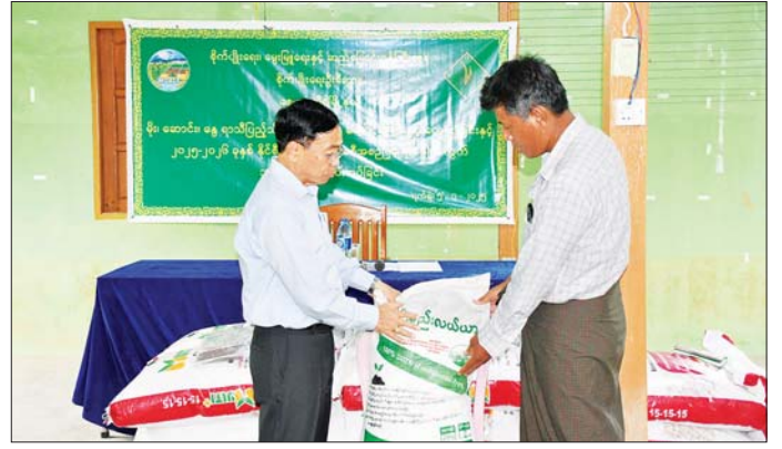
အမြန်ပြီးစီးအောင် ဆောင်ရွက် ရွက်ရေးနှင့် တာဝန်ရှိသူများက ရေး မှာကြားခဲ့ကြောင်း သိရ ရေး၊ ရေရှည်ခိုင်ခံ့မှုရှိအောင် ဆောင် အမြဲပြတ်ကြပ်မတ်ဆောင်ရွက် သည်။ အောင်မျိုးဝင်း(ဥက္ကဋ္ဌ)

နေပြည်တော် ဇူလိုင် ၅ နေပြည်တော်ကောင်စီဥက္ကဋ္ဌ ဦးသန်းထွန်းဦးသည် ယနေ့မုန့်လှိုင်တွင် ရာဇသင်္ဂဟလမ်းမကြီးသို့ သွားရောက်ပြီး ငလျင်ဘေးကြောင့်ထိခိုက်ပျက်စီးခဲ့သော လမ်းပိုင်းများအား ပြန်လည်ပြုပြင်နေမှုအခြေအနေများကို ကြည့်ရှုစစ်ဆေး၍ ရာသီဥက္ကဋ္ဌကောင်းမွန်ချိန်တွင် စက်ယန္တရား၊ လူအင်အားတိုးမြှင့်ပြီး အင်တိုက်အားတိုက်ဆောင်ရွက်ရေး မှာကြားသည်။ ယင်းနောက် လယ်ဝေးမြို့ ကိရိယာများကို လှည့်လည် သိရိမင်္ဂလာခန်းမ၌ ကျင်းပသည့် ကြည့်ရှုစစ်ဆေးသည်။ နေပြည်တော်ကောင်စီမှ မြို့နယ်များသို့ ထွန်စက်ကြီး၊ လက်ဆွဲကောက်စိုက်စက်နှင့် မျိုးစေ့ချက်ရိယာများ ပေးအပ်ပွဲ အခမ်းအနားသို့ တက်ရောက်အမှာစကားပြောကြားပြီး နေပြည်တော်ကောင်စီဥက္ကဋ္ဌက ထွန်စက်ဆိုင်ရာ စာရွက်စာတမ်းများနှင့် လက်ဆွဲကောက်စိုက်စက်ကို တာဝန်ရှိသူများအား ပေးအပ်၍ နေပြည်တော်ကောင်စီဝင်များက မျိုးစေ့ချက်ရိယာများကို တောင်သူများအား ပေးအပ်ကာ ခင်းကျင်းပြသထားသော ထွန်စက်ကြီး၊ လက်ဆွဲကောက်စိုက်စက်နှင့် မျိုးစေ့ချက်ရိယာများကို လှည့်လည်ကြည့်ရှုစစ်ဆေးသည်။ ထို့နောက် ဇေယျာသီရိမြို့နယ် ရှားစေးဖိုကျေးရွာသို့ သွားရောက်ကာ ရွှေသစ္စာခန်းမ၌ နွေ၊ မိုး၊ ဆောင်း၊ ရာသီပြည့်သီးနှံစိုက်ပျိုးရေးနှင့် နိုင်ငံစီးပွားမြှင့်တင်ရေးရန်ပုံငွေဖြင့် သွင်းအားစုများပေးအပ်ပွဲကို တက်ရောက်၍ နေပြည်တော် ကောင်စီဥက္ကဋ္ဌက တစ်ဖက်တစ်ဖန် သွားသွားလာလာ တာဝန်ရှိသူများကို တောင်သူများထံပေးအပ်သည်။ (ယာပုံ) ယင်းနောက် ဆင်သေချောင်းတစ်လျှောက် ဘေးဝဲယာ၌ သီးနှံများစိုက်ပျိုးထားရှိမှု အခြေအနေများကို လှည့်လည်ကြည့်ရှုစစ်ဆေးပြီး ဥက္ကဋ္ဌသီရိရေလှောင်တံစံသို့ သွားရောက်၍ ယာယီရေတာဝန်ဆောင်ရွက်ထားရှိမှု၊ အရေးပေါ် ရေပိုလှုံ့ဆောင်ရွက်နေမှုနှင့် ရေထုတ်ပြန် ပြန်လည်ပြင်ဆင်နေမှု အခြေအနေများကို ကြည့်ရှုစစ်ဆေးကာ လုပ်ငန်း