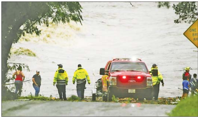
တက္ကဆက်ပြည်နယ်၌ ရှာဖွေကယ်ဆယ်ရေးဆောင်ရွက်နေစဉ်။