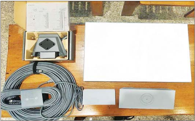
ရန်ကုန်အပြည်ပြည်ဆိုင်ရာလေဆိပ်၌ ဖမ်းဆီးရမိမှု။

နေပြည်တော် ဇူလိုင် ၅ တရားမဝင်ကုန်သွယ်မှုတိုက်ဖျက်ရေး ဦးဆောင် ကော်မတီ၏ ကြီးကြပ်ကွပ်ကဲမှုဖြင့် တရားမဝင် ကုန်သွယ်မှုများကို ဥပဒေနှင့်အညီ ထိရောက်စွာ တားဆီးအရေးယူနိုင်ရေး ဆောင်ရွက်လျက်ရှိသည်။ ဇူလိုင် ၃ ရက်တွင် ရှမ်းပြည်နယ် တရားမဝင် ကုန်သွယ်မှုတိုက်ဖျက်ရေးအဖွဲ့၏ စီမံခန့်ခွဲမှု ဖြင့် တာဝန်ကျပေးပေါင်းအဖွဲ့က စစ်ဆေးမှုများ ဆောင်ရွက်ခဲ့ရာ နမ့်စန်မြို့နယ် နမ့်စန်ကျေးရွာအုပ်စု နောင်ခမ်းကျေးရွာရှိ (၂၈၄-နောင်ခမ်း) ၌ တရားဝင်စာရွက်စာတမ်း အထောက်အထား တင်ပြနိုင်ခြင်းမရှိသည့် လုပ်ငန်းသုံးပစ္စည်း ၇၆ မျိုး၊ လူသုံးကုန်ပစ္စည်း ၁၁ မျိုး စုစုပေါင်း ခန့်မှန်းတန်ဖိုး ငွေကျပ် ၁၉၄၄၆၂၆၀၀ ကို ဖမ်းဆီးရမိခဲ့ပြီး အကောက်ခွန် လုပ်ထုံးလုပ်နည်းများနှင့်အညီ အရေးယူဆောင်ရွက်လျက်ရှိသည်။