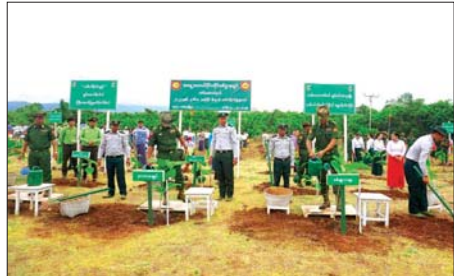
ကျောက်ဖြူမြို့၌ မိုးစပါးများပျိုးထောင်၍ စတင်စိုက်ပျိုး