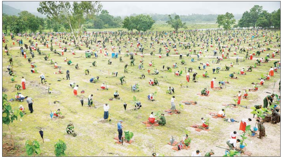
၂၀၂၅ ခုနှစ် ကာကွယ်ရေးဦးစီးချုပ်ရုံး(ကြည်း၊ ရေ၊ လေ) မိသားစုများ၏ ဒုတိယအကြိမ် မိုးရာသီသစ်ပင်စိုက်ပျိုးပွဲအခမ်းအနားတွင် တက်ရောက်လာကြသည့် အရာရှိ၊ စစ်သည်မိသားစုများ သတ်မှတ်နေရာအသီးသီးတွင် သစ်ပင်များ စိုက်ပျိုးကြစဉ်။