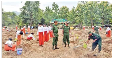
တိုင်းစစ်ဌာနချုပ်အသီးသီး၌ ၂၀၂၅ ခုနှစ် ဒုတိယအကြိမ် မိုးရာသီသစ်ပင်စိုက်ပျိုးပွဲများ ကျင်းပပြုလုပ်စဉ်။