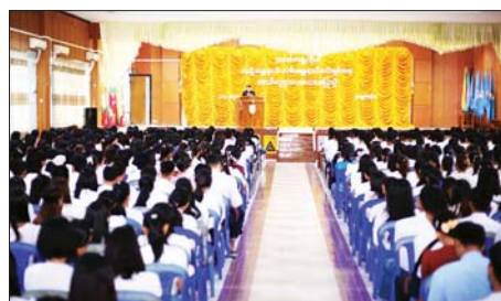
ပြဋ္ဌာန်းချက်များ၊ ဖြစ်မှုဖြစ်ဒဏ် ကြောင်း သိရသည်။ များကို ရှင်းလင်းပြောကြား ခရိုင်(ပြန်/ဆက်)

ပြည်နယ် တရားရေး ဦးစီးမှူး ဒေါ်ခင်ပြုံးရီက မော်တော်ယာဉ် စီမံခန့်ခွဲမှု ဥပဒေပါ ပြဋ္ဌာန်းချက် များနှင့် ပတ်သက်သည့် တရားရုံး များတွင် အရေးယူမှုအများဆုံးဖြစ် သည့် ပုဒ်မ ၈၆၊ ၈၇ ပါ ဖြစ်မှု ပြစ်ဒဏ်များအကြောင်း ရှင်းလင်း ပြောကြားကာ တစ်ဆက်တည်း တွင် ရာဇသတ်ကြီးပုဒ်မ ၂၇၉၊ ၃၃၇၊ ၃၃၈ နှင့် ၃၀၄-က ပါ