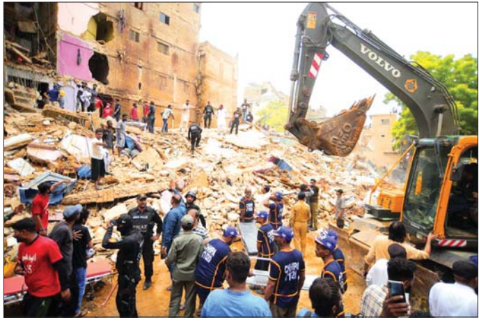
ကရာချီမြို့၌ အဆောက်အအုံပြိုကျမှုကြောင့် ကယ်ဆယ်ရေးလုပ်ငန်းများ ဆောင်ရွက်နေစဉ်။