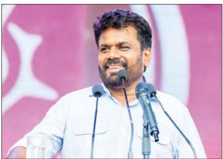
သီရိလင်္ကာသမ္မတ အနူရာကုမာရဒိဆာနာယကီ။

ကိုလံဘို ဇူလိုင် ၅ သီရိလင်္ကာနိုင်ငံသည် ကျေးလက် ဒေသ ဆင်းရဲနွမ်းပါးမှု ပပျောက်ရေးနှင့် ဒေသခံပြည်သူလူထုများ၏ လူနေမှုဘဝ အဆင့်အတန်း မြှင့်တင်ပေးရေးကို ရည်ရွယ်ကာ Praja Shakthi ဟု ခေါ်သည့် အမျိုးသားအဆင့်စီမံကိန်းတစ်ရပ်ကို ကိုလံဘိုမြို့၌ ဇူလိုင် ၄ ရက်တွင် စတင်ခဲ့ကြောင်း သိရသည်။ သမ္မတ အနူရာကုမာရ ဒိဆာနာယကီက စီမံကိန်းစတင်ခြင်းအခမ်းအနားတွင် သဘာပတိ အဖြစ်ဆောင်ရွက်ကာ ကျေးလက် ဒေသ ဆင်းရဲနွမ်းပါးမှု အမြစ်ပြတ်လုပ်ဆောင်ရေးမှာ အစိုးရ၏ ထိပ်တန်း ဦးစားပေးလုပ်ငန်းစဉ် ဖြစ်ကြောင်း အလေးပေး ပြော