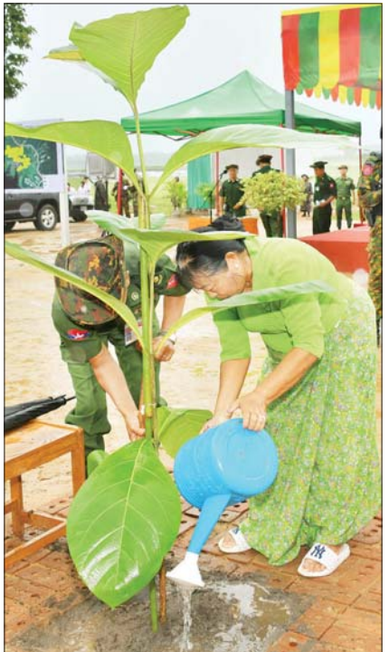
နိုင်ငံတော်စီမံအုပ်ချုပ်ရေးကောင်စီ ဒုတိယဥက္ကဋ္ဌ ဒုတိယတပ်မတော်ကာကွယ်ရေးဦးစီးချုပ် ကာကွယ်ရေးဦးစီးချုပ်(ကြည်း) ဒုတိယဗိုလ်ချုပ်မှူးကြီး စိုးဝင်းနှင့် ဇနီး ဒေါ်သန်းသန်းနွယ် သတ်မှတ်နေရာတွင် သစ်ပင်စိုက်ပျိုးပေးကြစဉ်။