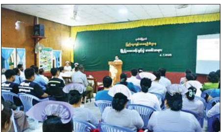
မြို့နယ် ပြည်သူ့ကျန်းမာရေးဦးစီးဌာန မြို့ပြဆေးခန်းကို အပတ်စဉ် တနင်္လာနေ့မှ သောကြာနေ့အထိ နေ့စဉ် နံနက် ၉ နာရီခွဲမှ မွန်းလွဲ ၂ နာရီခွဲအထိ ဖွင့်လှစ်ကုသပေးမည်ဖြစ်ကြောင်း သိရသည်။

အခမ်းအနားတွင် တိုင်းဒေသကြီး ကုသရေးနှင့် ပြည်သူ့ကျန်းမာရေး ဦးစီးဌာနမှူးက အမှာစကားပြောကြားပြီး မြို့နယ်ပြည်သူ့ကျန်းမာ ရေးဦးစီးဌာနမှူးက မြို့ပြဆေးခန်းတွင် ဆောင်ရွက်ပေးမည့် ကျန်းမာ ရေးစောင့်ရှောက်မှုလုပ်ငန်းများကို ရှင်းလင်းတင်ပြသည်။ ထို့နောက် အခမ်းအနားတက်ရောက်လာကြသူများက မိမိတို့ ကဏ္ဍအလိုက် ပူးပေါင်းပါဝင်ပေးနိုင်မည့် အခြေအနေများကို ဆွေးနွေးတင်ပြသည်။