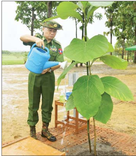
ညှိနှိုင်းကွပ်ကဲရေးမှူး (ကြည်း၊ ရေ၊ လေ) ဗိုလ်ချုပ်ကြီး ကျော်စွာလင်း သတ်မှတ်နေရာတွင် သစ်ပင်စိုက်ပျိုးပေးစဉ်။