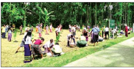
သစ်ပင်စိုက်ပွဲတော်အား ယမန်နေ့က ကျင်းပသည်။ အဆိုပါအခမ်းအနားသို့ ခရိုင်

မအူပင် ဇူလိုင် ၅ ရောဂတ်တိုင်းဒေသကြီး မအူပင်မြို့နယ် ကျေးလက်ဒေသဖွံ့ဖြိုးတိုးတက်ရေးဦးစီးဌာနက ဇူလိုင် ၆ ရက်နေ့တွင် ကျရောက်သည့် ကမ္ဘာ့ကျေးလက် ဖွံ့ဖြိုးရေးနေ့အထိမ်းအမှတ်အဖြစ် ခေတ်မီပြကျေးရွာ ထူထောင်ရေး စီမံကိန်းအကောင်အထည်ဖော် ဆောင်ရွက်လျက်ရှိသည့် စစ်ကိုင်းကျေးရွာအုပ်စုကျေးရွာ၌ မိုးရာသီ