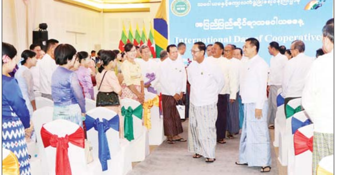
ပြည်ထောင်စုဝန်ကြီး ဦးလှစိုး (၁၀၃)ကြိမ်မြောက် အပြည်ပြည်ဆိုင်ရာသမဝါယမနေ့အခမ်းအနားသို့ တက်ရောက်လာသူများအား ရင်းရင်းနှီးနှီးနှုတ်ဆက်စဉ်။

ယင်းနောက် ဗဟိုသမဝါယမအသင်းလိမိတက်ဥက္ကဋ္ဌက အပြည်ပြည်ဆိုင်ရာသမဝါယမနေ့ ကုဏ်ပြုစကားပြောကြားပြီး အပြည်ပြည်ဆိုင်ရာသမဝါယမအဖွဲ့မှ ပေးပို့သောသဝဏ်လွှာကို ဗဟိုသမဝါယမ