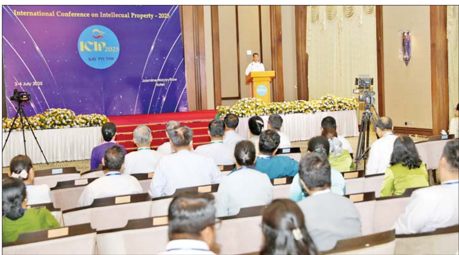
၂၀၂၅ ကို ကျင်းပခြင်းကြောင့် တီထွင်ဆန်းသစ်မှုကို မြှင့်တင်စေ နိုင်ခြင်း၊ စီးပွားရေးဖွံ့ဖြိုးတိုးတက် မှုကို တွန်းအားပေးစေနိုင်ခြင်းနှင့်

နည်းပညာများတွင် မူပိုင်ခွင့် ဆိုင်ရာ စိန်ခေါ်မှုများနှင့် စစ်လျဉ်း သည့်စာတမ်းများကိုလည်းကောင်း၊ ဧရာဝတီခန်းမတွင် စက်မှုဒီဇိုင်း မူပိုင်ခွင့်နှင့် စစ်လျဉ်းသည့်စာတမ်း များ၊ အသေးစား၊ အငယ်စား၊ အလတ်စား စီးပွားရေးလုပ်ငန်းများ နှင့်စစ်လျဉ်းသည့် စာတမ်းများ၊ မူပိုင်ခွင့်အခွင့်အရေးများ ပိုင်ဆိုင် ခြင်းနှင့် နည်းပညာလွှဲပြောင်းမှု များ အားကောင်းစေခြင်း၊ အပင် မျိုးသစ် အကာအကွယ်ပေးခြင်း နှင့်စစ်လျဉ်းသည့် စာတမ်းများကို လည်းကောင်း သက်ဆိုင်ရာ စာတမ်းရှင်က ဖတ်ကြားပြီး တက်ရောက်လာသူများကမေးမြန်း ဆွေးနွေးခဲ့ကြသည်။ နိုင်ငံတကာမူပိုင်ခွင့် ညီလာခံ-