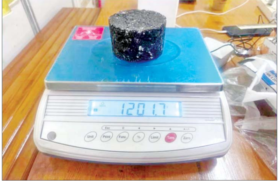
Regulating Course Mix Design ဖြင့် စမ်းသပ်နေမှုကို တွေ့မြင်ရစဉ်။