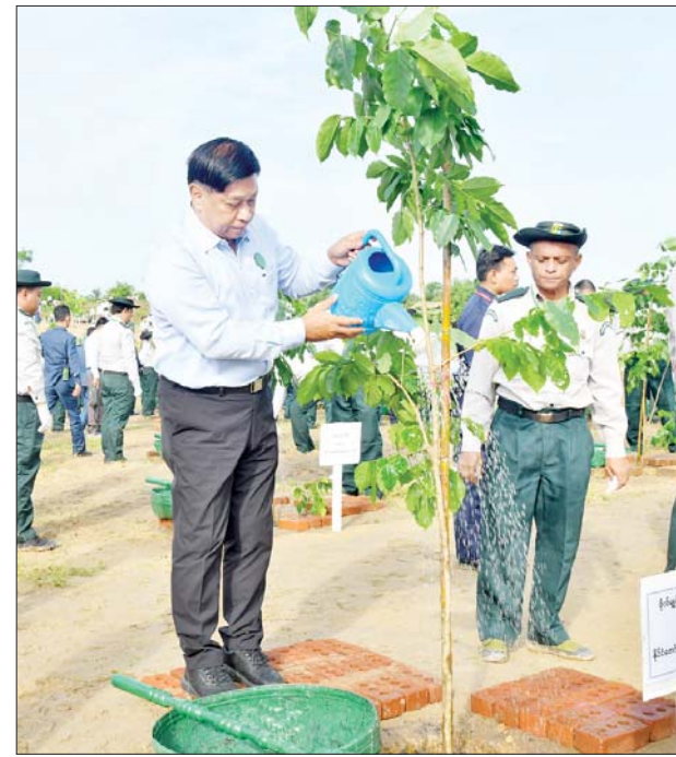
နိုင်ငံတော်စီမံအုပ်ချုပ်ရေးကောင်စီအဖွဲ့ဝင် ဗိုလ်ချုပ်ကြီး တင်အောင်စန်း ပျိုးပင်ကို စိုက်ပျိုးပေးစဉ်။