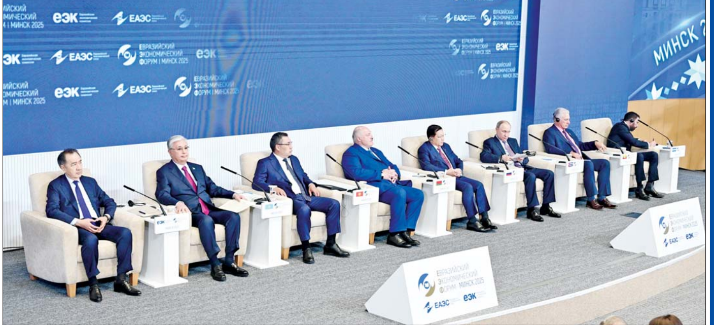
ဇွန် ၂၆ ရက်က နိုင်ငံတော်စီမံအုပ်ချုပ်ရေးကောင်စီဥက္ကဋ္ဌ နိုင်ငံတော်ဝန်ကြီးချုပ် ဗိုလ်ချုပ်မှူးကြီး မင်းအောင်လှိုင်နှင့် စတုတ္ထအကြိမ် ဥရောပ-အာရှစီးပွားရေးဖိုရမ် (EEF 2025) သို့ တက်ရောက်လာကြသည့် နိုင်ငံခြားဆောင်ရွက်မှုကို တွေ့ရစဉ်။

“EAEU သည် တတိယနိုင်ငံများနှင့် ပိုမိုကျယ်ပြန့်သော ကုန်သွယ်မှု ဆက်ဆံရေးများ၊ နိုင်ငံတကာ အဖွဲ့အစည်းများနှင့် ပူးပေါင်းဆောင်ရွက်မှုများ တိုးမြှင့်တည်ဆောက်နေပြီး ဥရောပ-အာရှတိုက်အတွင်း စီးပွားရေး တိုးတက်မှုအတွက် အဓိကအခန်းကဏ္ဍမှ ပါဝင်နေ”