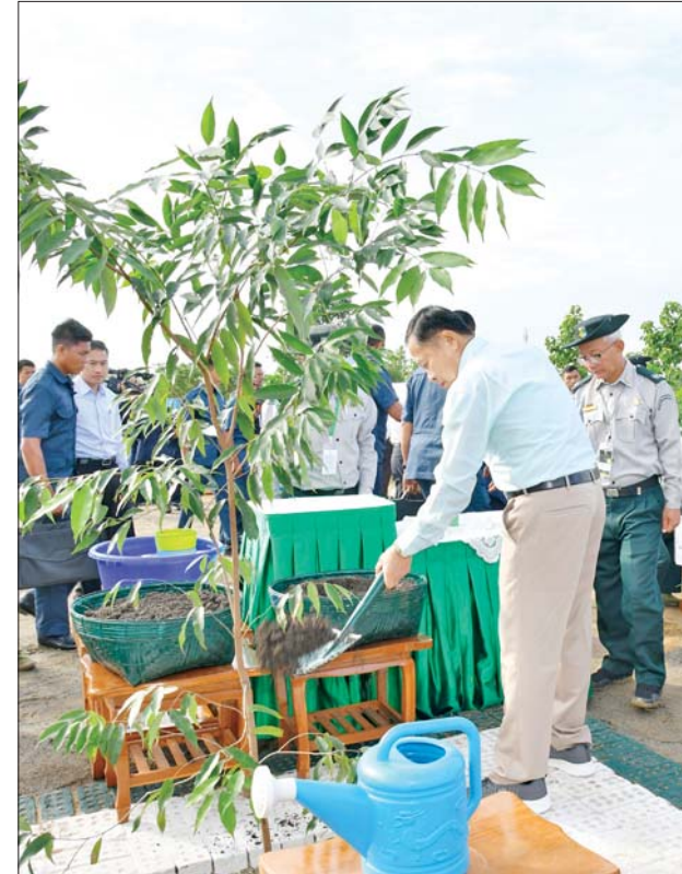
နိုင်ငံတော်စီမံအုပ်ချုပ်ရေးကောင်စီဒုတိယဥက္ကဋ္ဌ ဒုတိယဝန်ကြီးချုပ် ဒုတိယဗိုလ်ချုပ်မှူးကြီးစိုးဝင်း ကဲ့ကျော်ပျိုးပင်ကို စိုက်ပျိုးပေးစဉ်။

မှုအရ ပြင်းထန်သည့် အပူချိန် မြင့်မားမှုဒဏ်ကို ခံစားခဲ့ရသည်မှာ အားလုံးအသိပင်ဖြစ်ကြောင်း။ ထို့ကြောင့် နိုင်ငံတော်အနေဖြင့် အပူပိုင်းဒေသ၏ ဂေဟစနစ် ပိုမိုကောင်းမွန်လာစေရေး၊ အပူပိုင်းဒေသ စိမ်းလန်းစိုပြည်ရေးနှင့် ရာသီဥတု မျှတကောင်းမွန်စေရေး တို့ကို စီမံချက်များဖြင့်ဆောင်ရွက်နေကြောင်း၊ ထိုသို့ဆောင်ရွက်ရာတွင် သစ်တောဧရိယာများ တိုးပွားလာစေရေး၊ ရေနှင့်မြေဆီလွှာ ထိန်းသိမ်းရေးအတွက် လမ်းဘေးဝဲ၊ ယာတို့တွင် သစ်ပင်စိုက်ပျိုးခြင်း၊ တစ်ရွာနှစ်ရွာဖြင့် ကျေးရွာထင်းစိုက်ခင်းများ တည်ထောင်ခြင်းအပါအဝင် ၁၃ ခရိုင် စိမ်းလန်းစိုပြည်ရေး လုပ်ငန်းများကို နည်းလမ်းမျိုးစုံဖြင့် အရှိန်အဟုန် မြှင့်တင် အကောင်အထည်ဖော် ဆောင်ရွက်လျက်ရှိကြောင်း။ ရေးကြီးရေလျှံခြင်း၊ မြေပြိုခြင်း၊ မြေဆီလွှာတိုက်စားခြင်း၊ လေပြင်းမုန်တိုင်း တိုက်ခတ်ခြင်းစသည့်