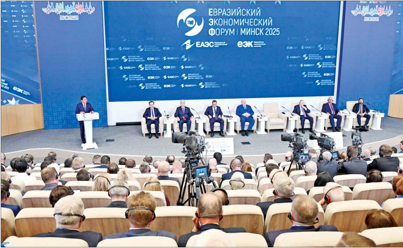
နိုင်ငံတော်စီမံအုပ်ချုပ်ရေးကောင်စီဥက္ကဋ္ဌ နိုင်ငံတော်ဝန်ကြီးချုပ် ဗိုလ်ချုပ်မှူးကြီးမင်းအောင်လှိုင် ဇွန် ၂၆ ရက်က ဘယ်လာရစ်သမ္မတနိုင်ငံ မင့်စ်မြို့၌ ကျင်းပသည့် စတုတ္ထအကြိမ် ဥရောပ-အာရှစီးပွားရေးဖိုရမ် (EEF 2025) တွင် မိန့်ခွန်းပြောကြားစဉ်။

(က) မဟာဗျူဟာကျသော ချိတ်ဆက်မှုများကို စူးစမ်းရှာဖွေခြင်း။ ၂၀၂၅ ခုနှစ်အတွင်း မြန်မာနိုင်ငံသည် EAEU တွင် လေ့လာသူနိုင်ငံ (OBSERVER STATUS) အဖြစ် အဆိုပြုခဲ့ ခြင်းသည် EAEU ၏ အာရှဒေသသို့ ချဲ့ထွင် မှုအတွက် အခွင့်အလမ်းတစ်ရပ်အဖြစ် လည်း ပုံဖော်လာနိုင်စွမ်းရှိမည်ဖြစ်ပါသည်။ EAEU အဖွဲ့ဝင်နိုင်ငံ မဟုတ်သေးသော်လည်း မြန်မာနိုင်ငံသည် အဖွဲ့၏ ပူးပေါင်းဆက်ဆံ ရေး ဗျူဟာများကို အနီးကပ်လေ့လာနိုင်ပါ သည်။ ဤသို့လေ့လာခြင်းမှတစ်ဆင့် မြန်မာ နိုင်ငံအနေဖြင့် ရှိပြီးသား သမားရိုးကျ ဈေးကွက်များအပြင် အခြားသော နိုင်ငံ တကာဈေးကွက်များသို့ ချဉ်းကပ်ရေး နည်းလမ်းများ၊ နိုင်ငံတကာစီးပွားရေး အဖွဲ့အစည်းများနှင့် ပူးပေါင်းဆောင်ရွက်ရန် နည်းဗျူဟာများ၊ ဒေသတွင်းနှင့် နိုင်ငံတကာ အဆင့်တွင် မိမိ၏စီးပွားရေးအခန်းကဏ္ဍကို မြှင့်တင်ရန်နည်းလမ်းများ စသည်တို့ကို ပူးပေါင်းဆောင်ရွက်နိုင်မည်ဖြစ်ပါသည်။