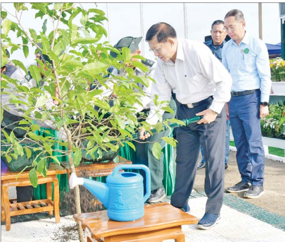
နိုင်ငံတော်စီမံအုပ်ချုပ်ရေးကောင်စီဥက္ကဋ္ဌ နိုင်ငံတော်ဝန်ကြီးချုပ် ဗိုလ်ချုပ်မှူးကြီးမင်းအောင်လှိုင် ခရေပျိုးပင်ကို သတ်မှတ်နေရာတွင် ဦးဆောင်စိုက်ပျိုးပေးစဉ်။

နေပြည်တော် ဇူလိုင် ၄ ပြည်ထောင်စုနယ်မြေ နေပြည်တော် ၂၀၂၅ ခုနှစ် ဒုတိယအကြိမ် မိုးရာသီ သစ်ပင်စိုက်ပျိုးပွဲ အခမ်းအနားကို ယနေ့နံနက်ပိုင်းတွင် ပြည်ထောင်စုနယ်မြေ နေပြည်တော် ဒက္ခိဏသီရိမြို့နယ် ရန်အောင်မြင်ကြီးပိုင်း၌ ကျင်းပရာ နိုင်ငံတော်စီမံအုပ်ချုပ်ရေးကောင်စီဥက္ကဋ္ဌ နိုင်ငံတော်ဝန်ကြီးချုပ် ဗိုလ်ချုပ်မှူးကြီး မင်းအောင်လှိုင် တက်ရောက်၍ ခရေပျိုးပင်ကို ဦးဆောင်စိုက်ပျိုးပေးသည်။