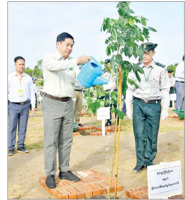
နိုင်ငံတော်စီမံအုပ်ချုပ်ရေးကောင်စီအဖွဲ့ဝင် ဗိုလ်ချုပ်ကြီး ညိုစော ပျိုးပင်ကို စိုက်ပျိုးပေးစဉ်။