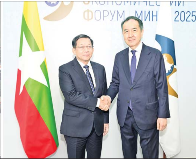
နိုင်ငံတော်စီမံအုပ်ချုပ်ရေးကောင်စီဥက္ကဋ္ဌ နိုင်ငံတော်ဝန်ကြီးချုပ် ဗိုလ်ချုပ်မှူးကြီးမင်းအောင်လှိုင်နှင့် ဥရောပ-အာရှ စီးပွားရေးကော်မရှင် (EEC) ဘုတ်အဖွဲ့ ဥက္ကဋ္ဌ Mr. Bakytzhan Abdirovich Sagintayev တို့ ဇွန် ၂၆ ရက်က တွေ့ဆုံဆွေးနွေးစဉ်။