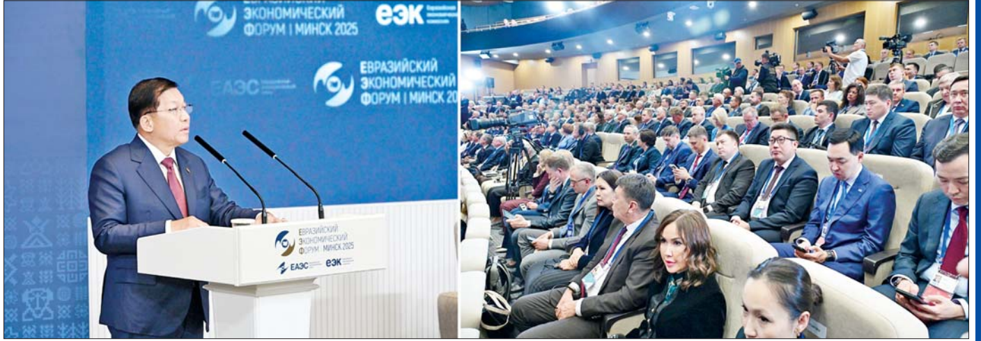
နိုင်ငံတော်စီမံအုပ်ချုပ်ရေးကောင်စီဥက္ကဋ္ဌ နိုင်ငံတော်ဝန်ကြီးချုပ် ဗိုလ်ချုပ်မှူးကြီးမင်းအောင်လှိုင် ဇွန် ၂၆ ရက်က ဘယ်လာရုစ်သမ္မတနိုင်ငံ မင့်စ်မြို့၌ ကျင်းပသည့် စတုတ္ထအကြိမ် ဥရောပ-အာရှစီးပွားရေးဖိုရမ် (EEF 2025) တွင် မိန့်ခွန်းပြောကြားစဉ်။

ဥရောပ-အာရှ စီးပွားရေးသမဂ္ဂ (EURASIAN ECONOMIC UNION- EAEU) သည် ၂၀၁၄ ခုနှစ် မေလ ၂၉ ရက်နေ့တွင် ဘယ်လာရုစ်၊ ကာဇက်စတန်၊ ရုရှားသမ္မတနိုင်ငံတို့က စာချုပ်လက်မှတ်ရေးထိုးခြင်းဖြင့် စတင်တည်ထောင်ခဲ့ပါသည်။ ၂၀၁၅ ခုနှစ် အတွင်းစတင်၍ တရားဝင်ဖွဲ့စည်းဆောင်ရွက်ခဲ့ပြီးနောက်ပိုင်းတွင် အာမေးနီးယားနှင့် ကာဂျစ္စတန် တို့သည် အဖွဲ့ဝင်အဖြစ် ဝင်ရောက်ခဲ့ပါသည်။ ဥရောပ-အာရှ စီးပွားရေးသမဂ္ဂ (EURASIAN ECONOMIC UNION- EAEU) သည် ဥရောပ-အာရှ တိုက်ရှိ အဖွဲ့ဝင်နိုင်ငံ ငါးနိုင်ငံမှ တည်ထောင်ထားသည့် ဒေသတွင်းစီးပွားရေး ပူးပေါင်းဆောင်ရွက်ရေးအဖွဲ့တစ်ခုလည်းဖြစ်ပါသည်။ EAEU ၏ အဓိက ရည်ရွယ်ချက်မှာ အဖွဲ့ဝင်နိုင်ငံများအကြား ကုန်စည်၊ ဝန်ဆောင်မှု၊ အလုပ်သမားနှင့် ရင်းနှီးမြှုပ်နှံမှုများ လွတ်လပ်စွာစီးဆင်းနိုင်ရန်အတွက် တစ်ခုတည်းသော ဈေးကွက်တစ်ခုကို ဖန်တီးရန် ဖြစ်သည်။ ယခုအခါ EAEU သည် လူဦးရေ ၁၈၃ သန်းကျော် စုစုပေါင်း GDP အမေရိကန်ဒေါ်လာ ၂ ဒသမ ၄ ထရီလီယံကျော်ရှိပြီး ကမ္ဘာ့စီးပွားရေးတွင် အရေးပါသည့် စီးပွားရေးသမဂ္ဂတစ်ခုအဖြစ် ရပ်တည်လာပါသည်။ EAEU သည် ကမ္ဘာ့ရေနံထုတ်လုပ်မှု၏ ၁၄ ဒသမ ၅ ရာခိုင်နှုန်း၊ သဘာဝဓာတ်ငွေ့ ၂၀ ဒသမ