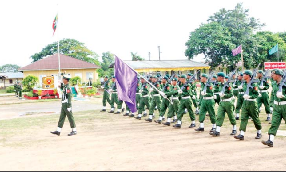
ပြည်သူ့စစ်မှုထမ်းသင်တန်း အမှတ်စဉ်(၁၂)သင်တန်းဆင်းပွဲ အခမ်းအနား ကျင်းပစဉ်။

နိုင်ငံ့တာဝန်များကို ထမ်းဆောင် ကြရမည်ဖြစ်သည်။ ယင်းတာဝန် များကို ကျေပွန်စွာထမ်းဆောင်ရန် ဆန္ဒရှိကြသည့် နိုင်ငံသားကောင်း များသည် ပြည်သူ့စစ်မှုထမ်း သင်တန်းများ တက်ရောက်ကာ နိုင်ငံတော်ကာကွယ်ရေးနှင့် လုံခြုံ ရေးတာဝန်များကို ထမ်းဆောင်နေ ကြပြီဖြစ်သည်။ ယနေ့တွင် သင်တန်းဆင်းခွဲကြ သည့် ပြည်သူ့စစ်မှုထမ်း နိုင်ငံ သားကောင်း စစ်သည်များသည် လည်း အဖွဲ့အစည်းဖြင့် စည်းစနစ် ကျစွာလုပ်ကိုင် ဆောင်ရွက်တတ် သည့် အလေ့အကျင့်များ (Team-Work) ရရှိခဲ့ပြီး နိုင်ငံချစ်စိတ် (Nationalism)၊ မျိုးချစ်စိတ် (Patriotism)၊ အဖွဲ့အစည်းစိတ် (Team Spirit)၊ ရဲဘော်ရဲဘက်စိတ် (Esprit de corps) အပြည့်ဖြင့် တာဝန်ကျရာ တပ်ရင်း၊ တပ်ဖွဲ့ အသီးသီးသို့ သွားရောက်၍ နိုင်ငံတော်ကာကွယ်ရေးနှင့်လုံခြုံ ရေးတာဝန်များကို ဂုဏ်ယူစွာ ထမ်းဆောင်ကြတော့ မည်ဖြစ် သည်။ ပြည်သူ့စစ်မှုထမ်း သင်တန်း အမှတ်စဉ်(၁၂)တွင် တက်ရောက်ခဲ့ ရသည့်အတွေ့အကြုံများ၊ သင်တန်း မှရရှိခဲ့သည့် အလေ့အကျင့်ကောင်း များ၊ ယုံကြည်ချက်၊ ခံယူချက်များ နှင့် သင်တန်းဆင်းပြီးနောက် မိမိတို့ တာဝန်ကျရာတပ်ရင်း၊