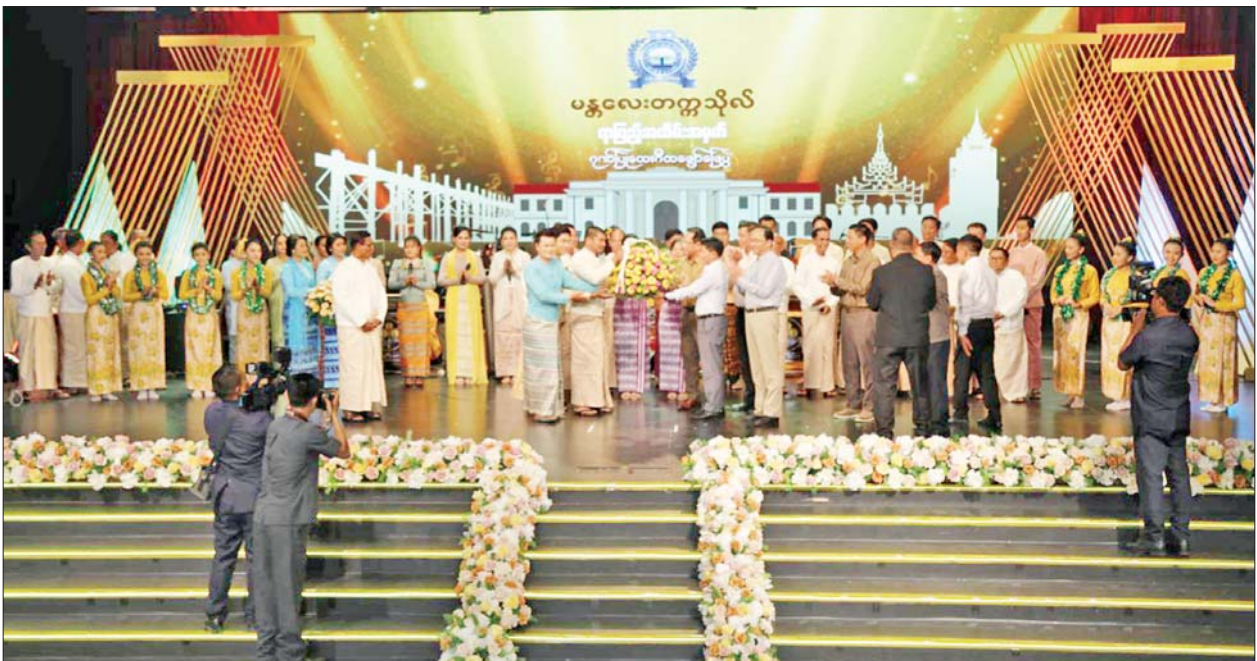
ပြည်ထောင်စုဝန်ကြီးများက အနုပညာရှင်များအား ဂုဏ်ပြုပန်းခြင်း ပေးအပ်စဉ်။

နေပြည်တော် ဇူလိုင် ၄ အစဉ်အလာ ကြီးမားသော မန္တလေး တက္ကသိုလ်ကြီး၏ နှစ်(၁၀၀)ပြည့်မြောက်ခဲ့သည့် နှစ်ပတ်လည်နေ့ကို ဂုဏ်ပြု သောအားဖြင့် မန္တလေးတက္ကသိုလ် ရာပြည့်အထိမ်းအမှတ် ဂုဏ်ပြု တေးဂီတဖျော်ဖြေပွဲကို ယနေ့ ညပိုင်းတွင် နေပြည်တော် တပ်ကုန်းမြို့ရှိ မြန်မာ့အသံနှင့် ရုပ်မြင်သံကြား(MRTV Auditorium) ခန်းမ၌ ကျင်းပသည်။ အဆိုပါ တေးဂီတဖျော်ဖြေပွဲသို့ ပြည်ထောင်စုဝန်ကြီးများ ဖြစ်ကြ သော ဦးမောင်မောင်အုန်း၊ ဦးမင်း နောင်၊ ဒေါက်တာမျိုးသိန်းကျော်၊ ဒေါက်တာသက်ခိုင်ဝင်း၊ ဒေါက်တာ စိုးဝင်းနှင့် ပြည်ထောင်စုရာထူးဝန် အဖွဲ့ဥက္ကဋ္ဌ ဦးအောင်သော်၊ နေပြည်တော် ကောင်စီဥက္ကဋ္ဌ ဦးသန်းထွန်းဦး၊ ပညာရေးဝန်ကြီး ဌာန ဒုတိယဝန်ကြီး ဦးနေမျိုးလှိုင် နှင့် ဌာနဆိုင်ရာ တာဝန်ရှိသူများ၊ မန္တလေးမြို့ မြို့မမြို့ဖများ၊ မန္တလေးတက္ကသိုလ် ကျောင်းသား ကျောင်းသူဟောင်းများနှင့် ဖိတ် ကြားထားသူများ တက်ရောက် ကြည့်ရှုအားပေးကြသည်။ ဖျော်ဖြေပွဲမစတင်မီ MRTV Lobby ၌ မန္တလေးတိုင်းဒေသကြီး ဝန်ကြီးချုပ် (ငြိမ်း) ဦးမောင်ကိုက မြန်မာ့အသံနှင့် ရုပ်မြင်သံကြားမှ cလျင် ဘေးသင့် ဝန်ထမ်းများ