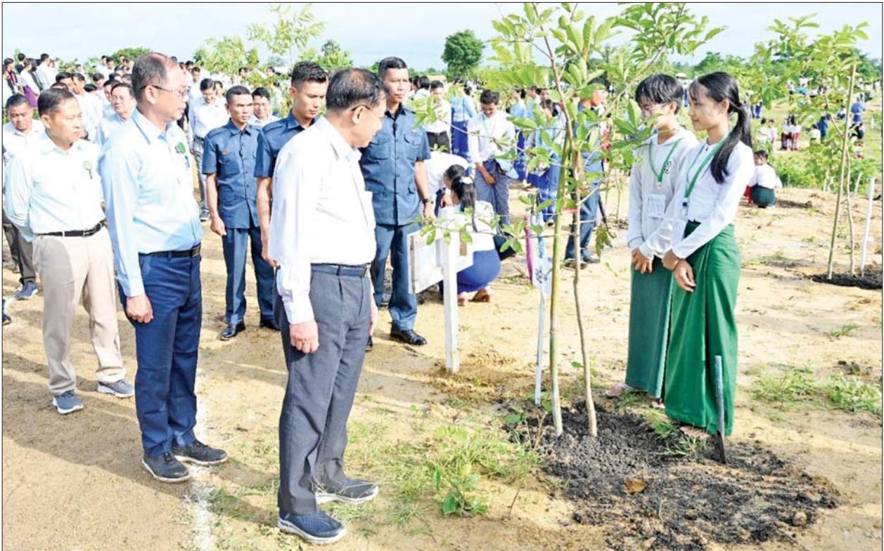
နိုင်ငံတော်စီမံအုပ်ချုပ်ရေးကောင်စီဥက္ကဋ္ဌ နိုင်ငံတော်ဝန်ကြီးချုပ် ဗိုလ်ချုပ်မှူးကြီးမင်းအောင်လှိုင် ၂၀၂၅ ခုနှစ် မိုးရာသီသစ်ပင်စိုက်ပျိုးပွဲ အခမ်းအနားသို့ တက်ရောက်လာကြသူများက ပျိုးပင်များ တပျော်တပါးစိုက်ပျိုးနေမှုကို လှည့်လည်ကြည့်ရှုအားပေးစဉ်။

နိုင်ငံ၏ သစ်တောဖုံးလွှမ်းမှု တိုးပွားလာစေရန်၊ တောရိုင်း တိရစ္ဆာန်နှင့် ထင်ရှားသည့် ဘူမိဗူပ ထူးခြားသည့်နေရာများကို ထိန်းသိမ်း ကာကွယ်နိုင်ရန် အတွက် နိုင်ငံဧရိယာ၏ ၃၀ ရာခိုင်နှုန်းကို ကြိုးပိုင်း၊ ကြိုးပြင် ကာကွယ်တောများ၊ ၁၀ ရာခိုင်နှုန်း ကို သဘာဝထိန်းသိမ်းရေးနယ်မြေ များအဖြစ် ဖွဲ့စည်းသွားရန် ရည်မှန်း ချက်ဖြင့် စီမံဆောင်ရွက်လျက် ရှိကြောင်း၊ မိမိတို့ နိုင်ငံတော်စီမံ အုပ်ချုပ်ရေးကောင်စီ တာဝန်ယူ သည့်ကာလအတွင်း ယနေ့အထိ