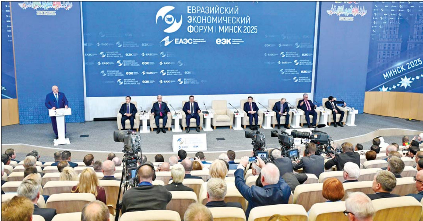
ဘယ်လာရစ်နိုင်ငံသမ္မတ H.E. Mr. Alexander Grigoryevich Lukashenko ဇွန် ၂၆ ရက်က မင့်စံမြို့၌ကျင်းပသည့် စတုတ္ထကြိမ် ဥရောပ-အာရှ စီးပွားရေးဖိုရမ် (EEF 2025) တွင် မိန့်ခွန်းပြောကြားစဉ်။

“EAEU နိုင်ငံများမှ နည်းပညာသစ်များ၊ စက်မှုလုပ်ငန်းနည်းပညာ၊ သုတေသနနှင့် ပညာရေးပူးပေါင်းမှုများသည် မြန်မာနိုင်ငံ၏ လူ့စွမ်းအားဖွံ့ဖြိုးတိုးတက်မှုအတွက် အရေးပါပါသည်။ ပညာရေး၊ သုတေသန၊ လူမှုရေးပူးပေါင်းမှုများအတွက်လည်း အလားအလာများစွာရှိပါသည်။ အထူးသဖြင့် ပညာရေးအဆင့်အတန်းမြှင့်တင်ရေး၊ နည်းပညာလေ့လာရေး၊ ကျောင်းသားလဲလှယ်ရေးအစီအစဉ်များတွင် ပိုမိုတိုးတက်လာနိုင်ပါသည်။ မြန်မာနိုင်ငံအတွက်လိုအပ်သည့် ဓာတ်မြေဩဇာ၊ ရေနံထွက်ပစ္စည်းများ၊ လယ်ယာသုံးစက်ကိရိယာများကို EAEU နိုင်ငံများမှ တင်သွင်းနိုင်သလို၊ မြန်မာထုတ်ကုန်များကိုလည်း ဈေးကွက်အသစ်များသို့ ပို့နိုင်မည်။”