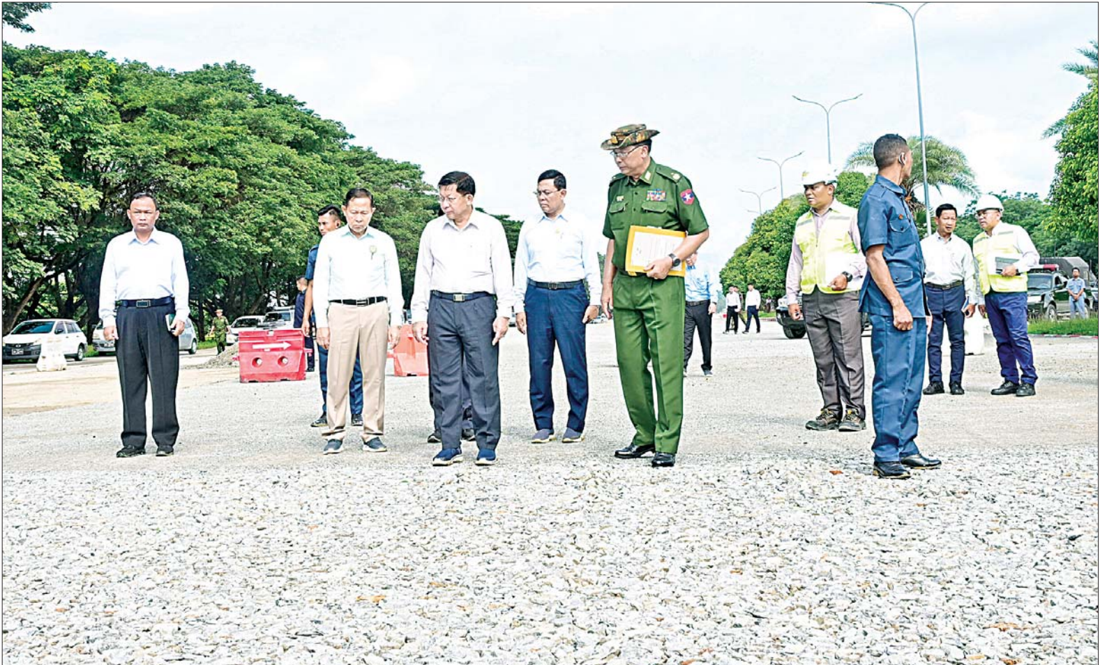
နိုင်ငံတော်စီမံအုပ်ချုပ်ရေးကောင်စီဥက္ကဋ္ဌ နိုင်ငံတော်ဝန်ကြီးချုပ် ဗိုလ်ချုပ်မှူးကြီးမင်းအောင်လှိုင် မန္တလေးငလျင်ကြီးကြောင့် ထိခိုက်ပျက်စီးမှုများဖြစ်ပေါ်ခဲ့သည့် ရာဇဌာနီလမ်းမကြီးပေါ်ရှိ လမ်းပျက်စီးနေရာများအား Regulating Course Mix Design ဖြင့် ပြန်လည်အဆင့်မြှင့်တင်ပြုပြင်နေမှုကို ကြည့်ရှုစစ်ဆေးစဉ်။

☆ ရှေ့ဖုံးမှ ထိုသို့ ကြည့်ရှုစစ်ဆေးရာတွင် နိုင်ငံတော်စီမံအုပ်ချုပ်ရေးကောင်စီ ဥက္ကဋ္ဌ နိုင်ငံတော်ဝန်ကြီးချုပ်အား ကာကွယ်ရေးဦးစီးချုပ်ရုံး(ကြည်း) စစ်အင်ဂျင်နီယာ ညွှန်ကြားရေးမှူး ရုံး ညွှန်ကြားရေးမှူး ဗိုလ်ချုပ် ဇော်နိုင်ဦးနှင့် တာဝန်ရှိသူများက ရာဇဌာနီလမ်းမကြီးပေါ်ရှိပန်းခင်း လမ်း မီးပွိုင့်လမ်းဆုံမှ ကုမုဒြာ ကြာပန်းအပိုင်းအထိ ကွန်ကရစ် လမ်း ပျက်စီးမှုအား စက်ယန္တရား များအသုံးပြု၍ ကျောက်ကတ္တရာ ခင်းခြင်းလုပ်ငန်း ဆောင်ရွက်နေမှု အခြေအနေများကို ရှင်းလင်း တင်ပြသည်။