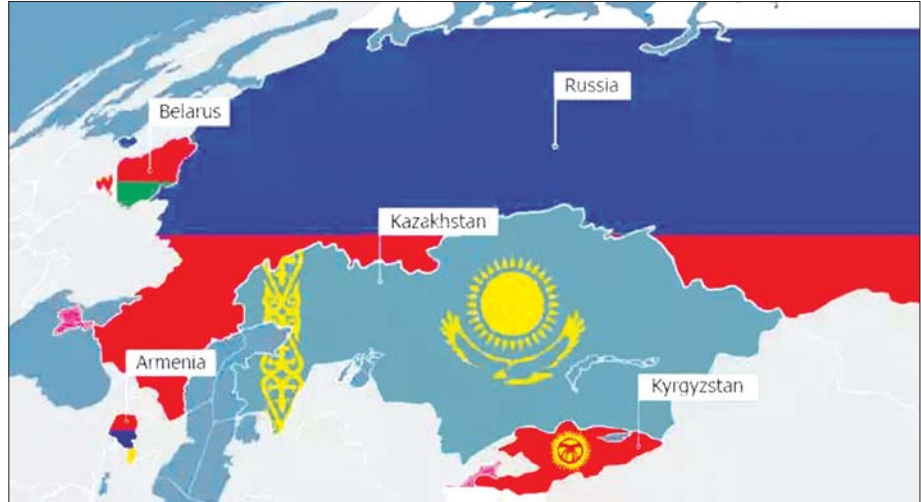
EURASIAN ECONOMIC UNION : RUSSIA, BELARUS, KAZAKHSTAN, ARMENIA, KYRGYZSTAN

INITIATIVE (BRI) နှင့် ချိတ်ဆက်ကာ ကုန်သွယ်ရေး၊ သယ်ယူပို့ဆောင်ရေးနှင့် ရင်းနှီးမြှုပ်နှံမှုများ တိုးမြှင့်လုပ်ဆောင်နိုင်ရေး ကြိုးပမ်းလျက်ရှိပါသည်။ ၂၀၁၈ ခုနှစ်တွင် EAEU-CHINA TRADE AND ECONOMIC COOPERATION AGREEMENT ကို လက်မှတ်ရေးထိုးခဲ့ပြီး ကုန်သွယ်ရေးအခွင့်အလမ်းများ ပိုမိုကျယ်ပြန့်လာခဲ့ပါသည်။ ထို့အတူ ရုန်ဟိုင်းပူးပေါင်းဆောင်ရွက်ရေးအဖွဲ့ (SCO) နှင့် လည်း နီးကပ်စွာပူးပေါင်းဆောင်ရွက်လျက် ရှိပါသည်။ ဗီယက်နမ်၊ ဆားဘီးယား၊ အင်ဒိုနီးရှား၊ အီရန်နိုင်ငံတို့ဖြင့် လွတ်လပ်သောကုန်သွယ်ရေး သဘောတူညီချက်များ (FTAs) ချုပ်ဆိုထားရှိပါသည်။ အိန္ဒိယ၊ အီဂျစ်၊ တူရကီနိုင်ငံများနှင့် စီးပွားရေး ဆွေးနွေးမှုများ ပြုလုပ်လျက်ရှိပါသည်။ ယခုအခါ EAEU သည် တတိယနိုင်ငံများနှင့် ပိုမိုကျယ်ပြန့်သော ကုန်သွယ်မှု ဆက်ဆံရေးများ၊ နိုင်ငံတကာ အဖွဲ့အစည်းများနှင့် ပူးပေါင်းဆောင်ရွက်မှုများ တိုးမြှင့်တည်ဆောက်နေပြီး ဥရောပ-အာရှတိုက် အတွင်း စီးပွားရေးတိုးတက်မှုအတွက် အဓိကအခန်းကဏ္ဍမှ ပါဝင်နေပါသည်။ စိန်ခေါ်မှုများရှိသော်လည်း ဒေသတွင်းနှင့် ကမ္ဘာ့စီးပွားရေးတွင် ၎င်း၏ဩဇာ လွှမ်းမိုးမှုကို ဆက်လက်တည်ဆောက်နိုင်ရန် စာမျက်နှာ ၉ သို့ ★