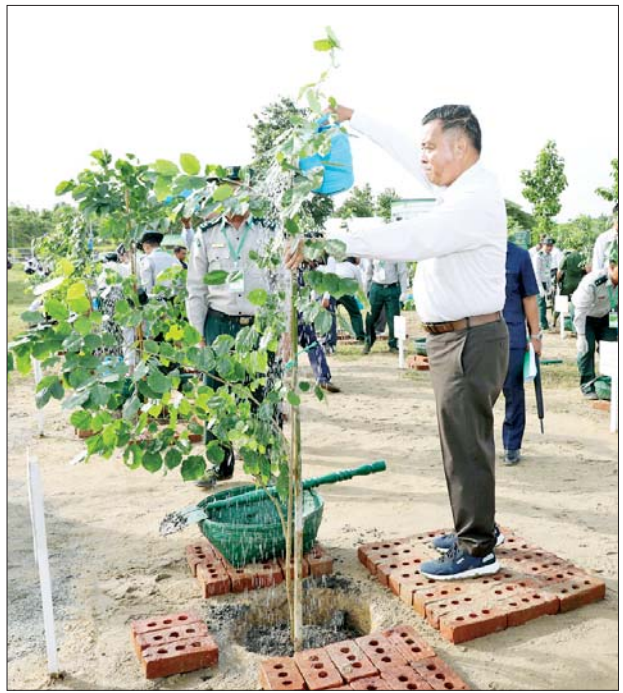
နိုင်ငံတော်စီမံအုပ်ချုပ်ရေးကောင်စီ တွဲဖက်အတွင်းရေးမှူး ဗိုလ်ချုပ်ကြီးရဲဝင်းဦး ပျိုးပင်ကို စိုက်ပျိုးပေးစဉ်။

ယနေ့ ကျင်းပပြုလုပ်သည့် ၂၀၂၅ ခုနှစ် ဒုတိယအကြိမ် မိုးရာသီ သစ်ပင်စိုက်ပျိုးပွဲအခမ်း အနားတွင် သစ်မျိုး ၁၈ မျိုး၊ ပျိုးပင် ပေါင်း ၃၀၀၀ ကို လူထုလှုပ်ရှား မှုအသွင်ဖြင့် စိုက်ပျိုးခဲ့ကြောင်း သိရသည်။ သတင်းစဉ်