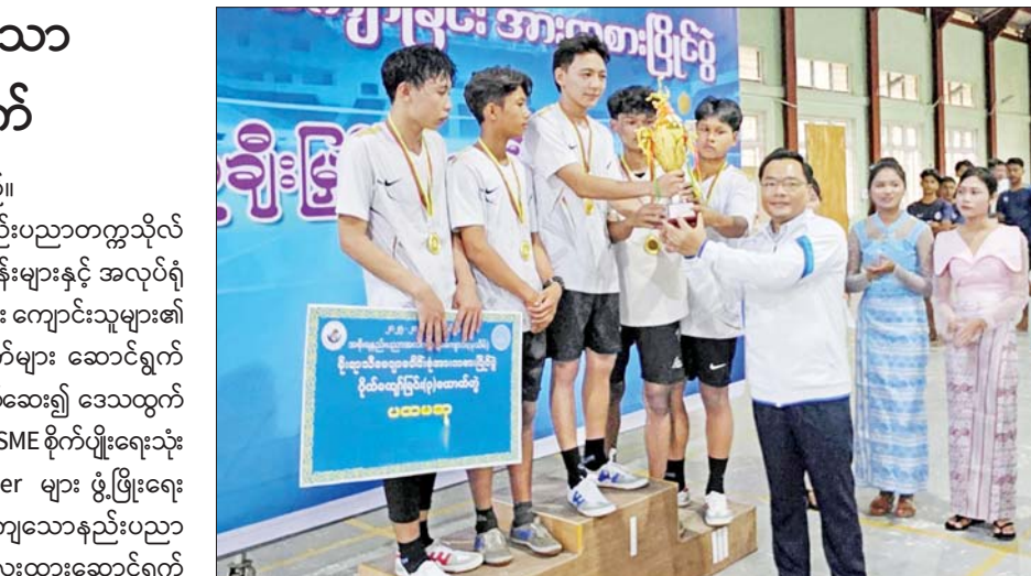
ထို့နောက် ဒုတိယဝန်ကြီးနှင့် အဖွဲ့ သည် အစိုးရနည်းပညာ အထက်တန်း ကျောင်း(ပုသိမ်)၌ ၂၀၂၅ ခုနှစ် မိုးရာသီ ပိုက်ကျော်ခြင်း အားကစားပြိုင်ပွဲ ဗိုလ်လု

ကြည့်ရှုစစ်ဆေးသည်။ ယင်းနောက် နည်းပညာတက္ကသိုလ် (ပုသိမ်) လက်တွေ့ခန်းများနှင့် အလုပ်ရုံ များတွင် ကျောင်းသား ကျောင်းသူများ၏ သုတေသနပရောဂျက်များ ဆောင်ရွက် နေမှုများကို ကြည့်ရှုစစ်ဆေး၍ ဒေသထွက် ကုန်ကြမ်းအခြေပြု MSME စိုက်ပျိုးရေးသုံး စက်များနှင့် Gasifier များ ဖွံ့ဖြိုးရေး အတွက် လက်တွေ့ကျသောနည်းပညာ သုတေသနများ အလေးထားဆောင်ရွက် သွားရန် မှာကြားပြီး ကျောင်းသား ကျောင်းသူများအား နည်းပညာ၊ သုတ၊ ရသစာအုပ်များနှင့် ဂုဏ်ပြုဆုများ ပေးအပ် ချီးမြှင့်သည်။