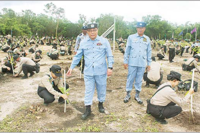
မှပါမောက္ခချုပ်နှင့် ဒုတိယပါမောက္ခချုပ်များ၊ ဌာနကြီးများ၊ ပါမောက္ခ (ပညာဌာနမှူး)များ၊ အရာထမ်း၊ အမှုထမ်းများ၊ သင်တန်းသား မဟော်ဂနီ ၂၅ ပင်နှင့် မန်ဂျန်ရား ၉၄ စုစုပေါင်း ပျိုးပင် ၁၂၀၀ ကို စိုက်ပျိုးခဲ့ကြကြောင်း သိရသည်။ သတင်းစဉ်

ရန်ကုန် ဇူလိုင် ၈ တက္ကသိုလ်တွင်း စိမ်းလန်းစိုပြည်ရေးအတွက် မိုးရာသီသစ်ပင်စိုက်ပျိုးပွဲအခမ်းအနားကို ယမန်နေ့ ညနေပိုင်းက နိုင်ငံဝန်ထမ်းတက္ကသိုလ် (အောက်မြန်မာပြည်) ၌ကျင်းပရာ ပြည်ထောင်စုရာထူးဝန်အဖွဲ့ အဖွဲ့ဝင် ဦးစိုးတင် တက်ရောက်သည်။ အခမ်းအနားတွင် ပြည်ထောင်စုရာထူးဝန်အဖွဲ့ အဖွဲ့ဝင် ဦးစိုးတင်က အမှာစကားပြောကြားပြီး ပါမောက္ခချုပ်နှင့် သင်တန်းသား သင်တန်းသူ ကိုယ်စားလှယ်များကို ပျိုးပင်များပေးအပ်၍ အဖွဲ့ဝင် ဦးစိုးတင်က မဟော်ဂနီပျိုးပင်ကို ဦးဆောင်စိုက်ပျိုးပေးသည်။ အဆိုပါ မိုးရာသီသစ်ပင်စိုက်ပျိုးပွဲသို့ နိုင်ငံဝန်ထမ်းတက္ကသိုလ် (အောက်မြန်မာပြည်)