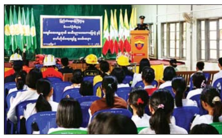
ကြိုတင်ကာကွယ်ရေးနည်းလမ်းများကို ဟောပြောခဲ့ပြီး ငလျင်ဘေးအန္တရာယ် သရုပ်ပြလေ့ကျင့်ခြင်းလုပ်ငန်းများ ဆောင်ရွက်ကြောင်း သိရသည်။ ကျော်သူရ(ကျေးမှူး)

ကျေးမှူး၊ ဇူလိုင် ၈ ငလျင်ဘေးအန္တရာယ်ဆိုင်ရာ အသိပညာပေးဟောပြောခြင်းနှင့် သရုပ်ပြလေ့ကျင့်ခြင်းကို ယမန်နေ့က ရန်ကုန်တိုင်းဒေသကြီး ကျေးမှူးမြို့နယ် မြို့သစ်ရပ်ကွက် အခြေခံပညာအထက်တန်းကျောင်း အ.ထ.က (ကျေးမှူး)၌ ကျင်းပသည်။