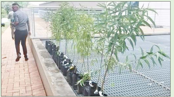
ပြောင်းလဲမှုကို ဖြေရှင်းဆောင်ရွက်ရာတွင် အထောက်အကူဖြစ်စေပြီး ဒေသခံပြည်သူလူထု ကြောင်း ငင်းက ပြောကြားသည်။ ဆင်ဟွာ

ဂျီဟာနန်နစ္စဘတ် ဇူလိုင် ၈ တောင်အာဖရိကနိုင်ငံသည် ရာသီဥတုဖောက်ပြန် ပြောင်းလဲမှု လျော့ပါးစေရေး၊ အလုပ်အကိုင် အခွင့်အလမ်း ပိုမိုရရှိစေရေး၊ စားရေကိစ္စကို လုံခြုံစေ ရေး ရည်ရွယ်ကာ စက်တင်ဘာ ၂၄ ရက် တစ်ရက် တည်းတွင် သစ်ပင်ပေါင်း တစ်သန်းစိုက်ပျိုးသွားမည့် အစီအစဉ်တစ်ရပ်ကို ဇူလိုင် ၇ ရက်တွင် စတင်ခဲ့ ကြောင်း သိရသည်။ တောင်အာဖရိကနိုင်ငံ၏ အုပ်ချုပ်ရေးမြို့တော် ဖြစ်သည့် ဝါ့ရှားရီးယားရှိ အမျိုးသားရေကုဗေဒ ဥပယုဂ်တွင် သစ်တော၊ ငါးလုပ်ငန်းနှင့် ဘာသာ ပတ်ဝန်းကျင်ဆိုင်ရာ ဒုတိယဝန်ကြီး ဘားနီစ်ဆွတ်စ် က လတ်တလောတွင် သစ်ပင်ပေါင်း တစ်သန်း စိုက်ပျိုးမည့်နေ့အတွက် လုပ်ငန်းစီမံခန့်ခွဲမှုများကို အပြီးသတ် လုပ်ဆောင်လျက်ရှိကြောင်း ပြောသည်။ ထို့အပြင် ပြည်သူလူထုသည် အပူလှိုင်းဖြတ် ခြင်း၊ ရေကြီးရေလျှံမှုဖြစ်ပွားခြင်း၊ ကာလရှည် မိုးခေါင်ရေရှားမှုများကို တွေ့ကြုံနေကြကြောင်း၊ ထို့ကြောင့် အဆိုပါ ဖြစ်ရပ်မျိုးကို တုံ့ပြန်နိုင်ရန် သစ်ပင်စိုက်ခြင်းကဲ့သို့ ပူးပေါင်းဆောင်ရွက်မှုများ လုပ်ဆောင်ရန် လိုအပ်ကြောင်း ထပ်လောင်း ပြောသည်။ သမ္မတ ခရေလ်ရာမာဖိုဆာသည် ၂၀၂၆ ခုနှစ် တွင် ပြီးဆုံးမည့် ငါးနှစ်တာသက်တမ်းကာလအတွင်း တောင်အာဖရိက နိုင်ငံတစ်ဝန်း သီးပင်စားပင်နှင့် ဒေသမျိုးရင်းသစ်ပင်ပေါင်း ၁၀ သန်း စိုက်ပျိုးရန် ညွှန်ကြားထားကြောင်း ဆွတ်စ်စ်က ပြောသည်။ သစ်ပင်များစိုက်ပျိုးခြင်းသည် ရာသီဥတုဖောက်ပြန်