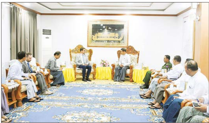
သည့်အသင်းများကို တံခွန်စိုက်ဆုဖလှယ်၊ ဆုတံဆိပ်နှင့် ငွေသားဆုများကိုလည်းကောင်း၊ အကောင်းဆုံးအားကစားသမားဆု ရရှိကြသူများကို ဆုတံဆိပ်နှင့် ငွေသားဆုများကိုလည်းကောင်း ပေးအပ်ချီးမြှင့်ခဲ့ကြောင်း သိရသည်။ သတင်းစဉ်

ပေးအပ်ချီးမြှင့် ယင်းနောက် ဆုချီးမြှင့်ပွဲကိုကျင်းပ၍ တိုင်းဒေသကြီးဝန်ကြီးချုပ်နှင့် တာဝန်ရှိသူများက အမျိုးသားလေးယောက်တွဲပြိုင်ပွဲ၊ အမျိုးသမီး သုံးယောက်တွဲပြိုင်ပွဲ၊ အမျိုးသမီး သုံးယောက်တွဲနှင့် နှစ်ယောက်တွဲပြိုင်ပွဲများတွင် ပထမ၊ ဒုတိယနှင့် တတိယဆုရရှိ