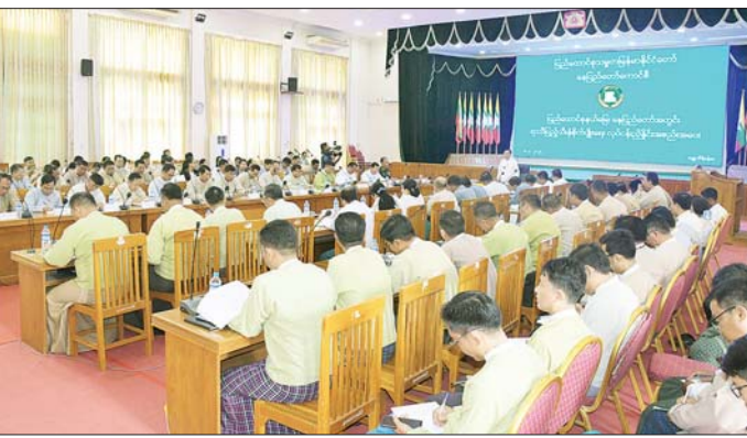
သက်ဆိုင်ရာကဏ္ဍအလိုက် ဆွေးနွေးတင်ပြကြရာ မှာကြားပြီး ပေါင်းစပ်ညှိနှိုင်း ဆောင်ရွက်ပေးခဲ့ နေပြည်တော်ကောင်စီဥက္ကဋ္ဌက လိုအပ်သည်များ ကြောင်း သိရသည်။ ထွန်းလင်း(ဇေယျာမြေ)

နှင့် တန်ဖိုးမြင့်ထုတ်ကုန်များ ထုတ်လုပ်နိုင်ရေး ဆောင်ရွက်ရန်လိုကြောင်း၊ နေပြည်တော်ကောင်စီနယ်မြေအတွင်း သီးနှံစိုက်ပျိုးမြေများကို ပလပ်မြေထထားဘဲ မွေးမြူဆောင်ရွက်ပြီး သီးနှံစိုက်ပျိုးနိုင်ရန်လိုအပ်ကြောင်း၊ တစ်နှစ် သုံးသီးစိုက်ပျိုးပြီး သီးထပ်စွမ်းအားမြှင့်တင်ရန်လိုကြောင်း၊ ပန်းတိုင်အထွက်နှုန်းရရှိရေးအတွက် မျိုး၊ မြေ၊ ရေ၊ နည်းနည်းလမ်းများနှင့်အညီ စနစ်တကျစိုက်ပျိုးရန်လိုကြောင်း၊ ရာသီပြည့် သီးနှံစိုက်ပျိုးနိုင်ရေးအတွက် လိုအပ်သောစိုက်ပျိုးရေး မျိုး၊ သွင်းအစုများအား ဖြည့်ဆည်းဆောင်ရွက်ပေးရန်လိုကြောင်း၊ လယ်ယာမြေများတွင် သတ်မှတ်သီးနှံများကိုသာ စိုက်ပျိုးစေရန်နှင့် သဘာဝမြေဩဇာကို တောင်သူများကိုယ်တိုင် ပြုလုပ်သုံးစွဲနိုင်ရေး အသိပညာပေးဆောင်ရွက်ရန်လိုကြောင်း ပြောကြားသည်။ ယင်းနောက် တက်ရောက်လာကြသူများက