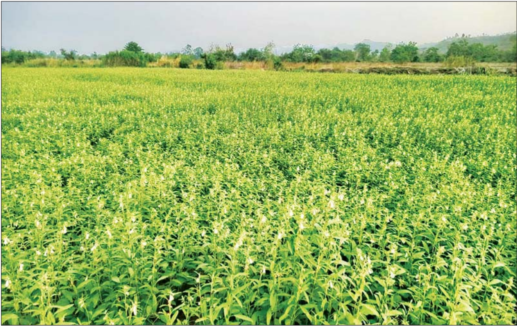
ငမဲမြို့နယ်၌ ဆီထွက်သီးနှံ မိုးနှမ်းစိုက်ခင်း အောင်မြင်ဖြစ်ထွန်းနေမှုကို တွေ့ရစဉ်။

ငမဲ ဇူလိုင် ၈ မကွေးတိုင်းဒေသကြီး မင်းဘူးခရိုင် ငမဲမြို့နယ် တွင် မန်းချောင်းရေလှောင်တံဆံ့ဆည်၊ ရင်းရည်ဆည် နှင့် ဆည်ငယ်ကန်ငယ်တို့မှ ပို့လွှတ်သောရေတို့ဖြင့် ဒေသတွင်း စားသုံးဆီဖုလုံစေရေးအတွက် မိုးသီးနှံ နှမ်း ၁၂၈၉၁ ဧက စိုက်ပျိုးရန်လျာထားခဲ့ရာ ယနေ့ အထိ ၁၂၈၉၁ ဧက စိုက်ပျိုးပြီးစီးနေပြီဖြစ်၍ လျာထားချက်ထက် ၄၉၈ ဧက ပိုမိုကျော်လွန်စိုက်ပျိုး နိုင်ခဲ့ကြောင်းနှင့် နှမ်းသီးနှံများ အောင်မြင်ဖြစ်ထွန်း လျက်ရှိကြောင်း ငမဲမြို့နယ် စိုက်ပျိုးရေးဦးစီးဌာန ရုံးမှ သိရသည်။ ငမဲမြို့နယ်အတွင်း ၂၀၂၅ ခုနှစ်တွင် မိုးသီးနှံများ အဖြစ် စပါး၊ မြေပဲ၊ နေကြာ၊ ပဲစင်းငုံ၊ ပဲတီစိမ်း၊ ငရုတ်စို၊ ဖူးစားပြောင်းနှင့် နှမ်းများကို အများဆုံးစိုက်ပျိုးကြရာ လယ်မြေများတွင် မိုးစပါးစိုက်ပျိုးမှု ကုန်ကျစရိတ် ထက် မိုးနှမ်းစိုက်ပျိုးမှု ကုန်ကျစရိတ်ပိုမိုသက်သာ ပြီး နှမ်းဈေးကောင်းရရှိသောကြောင့် တစ်နှစ်လျှင် နှမ်းကို နှစ်သီးစိုက်ပျိုးကြကြောင်း၊ ယခင်နှစ်က မိုးနှမ်း ၁၂၈၉၁ ဧကစိုက်ပျိုးနိုင်ခဲ့ပြီး တစ်ဧကအထွက် နှမ်း ၈ ဒသမ ၇၆ တင်းခန့် ထွက်ရှိကြောင်း သိရသည်။ ယခုနှစ် မိုးရာသီ နှမ်းသီးနှံကို ကျေးရွာအုပ်စု များတွင် စမန်နက် နှမ်းမျိုး ၄၆၄၂ ဧက၊ ဆင်း ရတနာ-(၃) ၃၂၂၉ ဧက၊ သိပ္ပံနှမ်းနက် ဧက ၂၅၆၀၊ စာမျက်နှာ ၄ ကော်လံ ၅ ၂