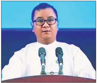
နိုင်ငံတော်စီမံအုပ်ချုပ်ရေးကောင်စီ သတင်းထုတ်ပြန်ရေးအဖွဲ့ ခေါင်းဆောင် ပိုလ်ချုပ် ဇော်မင်းထွန်း

အနေနဲ့ ၂၀၂၃ ခုနှစ်-၂၀၂၄ ခုနှစ် ဘဏ္ဍာနှစ်မှာတော့ ကုန်သွယ်မှုပမာဏ အမေရိကန်ဒေါ်လာ ၇၀၀ ဒသမ ၉ သန်းခန့်ရှိခဲ့ပါတယ်။ ၂၀၂၄ ခုနှစ်-၂၀၂၅ ခုနှစ် မှာတော့ အမေရိကန် ဒေါ်လာ ၅၈၈ ဒသမ ၃ သန်း ကျော်လောက် ရှိခဲ့ပါတယ်။ ဒီစာနဲ့ပတ်သက်ပြီး မြန်မာနိုင်ငံအစိုးရရဲ့ သဘောထားအနေနဲ့ကတော့ နံပါတ်တစ်ကတော့ အပြုသဘောဆောင်တဲ့ ညှိနှိုင်း မှု ပြန်ကြားမှုတွေကို ဆောင်ရွက်သွားမှာ ဖြစ်ပါ တယ်။ နံပါတ်နှစ်အချက်အနေနဲ့ကတော့ ဒီညှိနှိုင်းမှု တွေကနေပြီး နှစ်ဦးနှစ်ဖက် အကျိုးဖြစ်ထွန်းစေမည့် ရလဒ်များ ရရှိမယ်လို့မျှော်လင့်ပါတယ်။ အားလုံးကို ကျေးဇူးတင်ပါတယ်။”