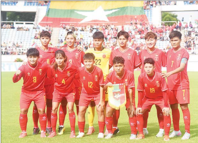
အာရှဖလား အမျိုးသမီးခြေစစ်ပွဲ ယှဉ်ပြိုင်ခဲ့သည့် မြန်မာ့လက်ရွေးစင် အမျိုးသမီးအသင်း။

ရန်ကုန် ဇူလိုင် ၈ မြန်မာ့လက်ရွေးစင် အမျိုးသမီး အသင်းသည် ၂၀၂၅ အာဆီယံ အမျိုးသမီး ချန်ပီယံရှစ်ပြိုင်ပွဲ ဆက်လက်ယှဉ်ပြိုင်ရမည်ဖြစ်ပြီး ရက်ပိုင်းအတွင်း ပြန်လည် လေ့ကျင့်မည်ဖြစ်သည်။ ၂၀၂၅ အာဆီယံ အမျိုးသမီး ချန်ပီယံရှစ်ပြိုင်ပွဲကို ဩဂုတ် ၆ ရက်မှ ၃၀ ရက်အထိ ဗီယက်နမ် နိုင်ငံ၌ ကျင်းပမည်ဖြစ်ပြီး အသင်း စုစုပေါင်း ရှစ်သင်း ဝင်ရောက် ယှဉ်ပြိုင်မည်ဖြစ်ကာ အုပ်စု (က) တွင် အိမ်ရှင်ဗီယက်နမ်၊ ထိုင်း၊ အင်ဒိုနီးရှား၊ ကမ္ဘောဒီးယား၊ အုပ်စု (ခ) တွင် လက်ရှိချန်ပီယံ ဖိလစ်ပိုင်၊ မြန်မာ၊ ဩစတြေးလျ၊ တီမောအသင်းတို့ ပါဝင်နေ သည်။ မြန်မာအသင်းသည် အုပ်စု ပွဲများအဖြစ် ဩဂုတ် ၇ ရက် တွင် ဩစတြေးလျအသင်း၊ စာမျက်နှာ ၁၁ ကော်လံ ၁ ❖