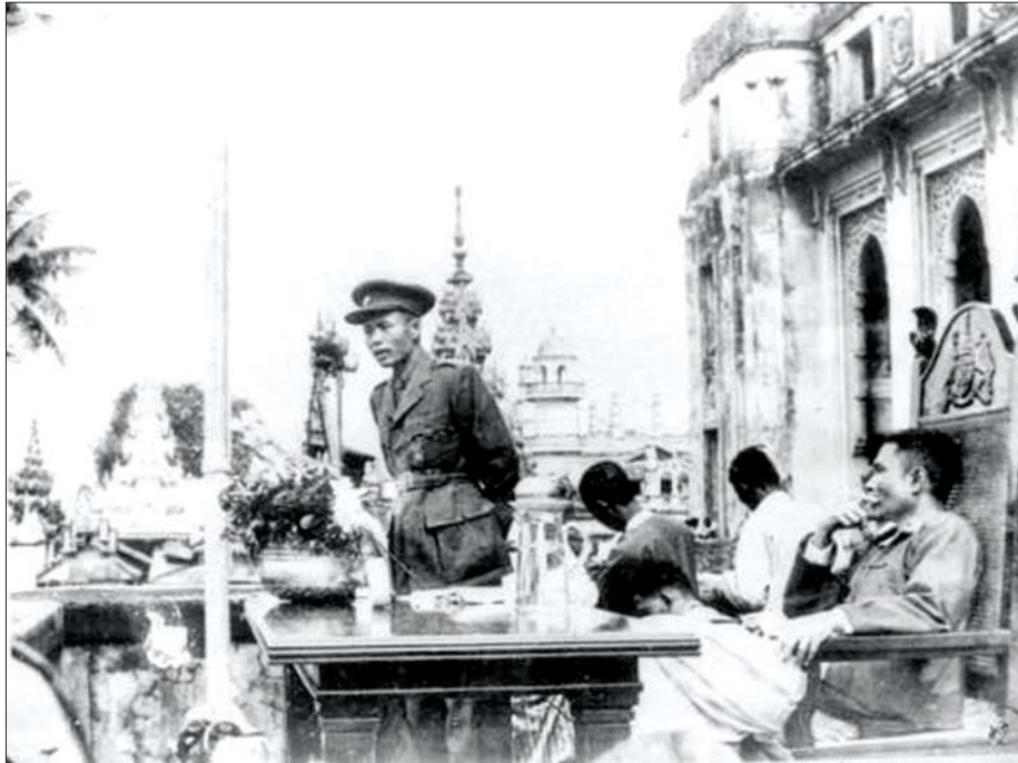
၁၉၄၇ ခုနှစ် ဇူလိုင်လ ၁၃ ရက်နေ့က ရန်ကုန်မြို့ မြို့တော်ခန်းမ၌ ကျင်းပသည့် ရန်ကုန်နယ်လုံးဆိုင်ရာ နိုင်ငံရေးရှင်းလင်းပွဲတွင် ဗိုလ်ချုပ်အောင်ဆန်း မိန့်ခွန်းပြောကြားစဉ်။

ဗဟိုဦးစီးအဖွဲ့တွင်လည်း နိုင်ငံရေးပါတီ အသီးသီးမှ ကိုယ်စားလှယ်များသာမက တိုင်းရင်း သားလူမျိုးစုအဖွဲ့အစည်းအသီးသီးမှ ကိုယ်စား