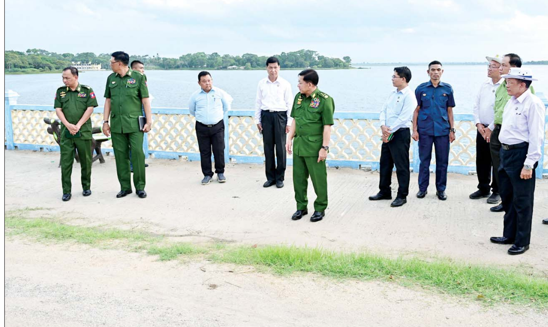
နိုင်ငံတော်စီမံအုပ်ချုပ်ရေးကောင်စီဥက္ကဋ္ဌ တပ်မတော်ကာကွယ်ရေးဦးစီးချုပ် ဗိုလ်ချုပ်မှူးကြီး မင်းအောင်လှိုင် မိတ္ထီလာကန် ထိန်းသိမ်းထားရှိမှု အခြေအနေများကို ကြည့်ရှုစစ်ဆေးစဉ်။