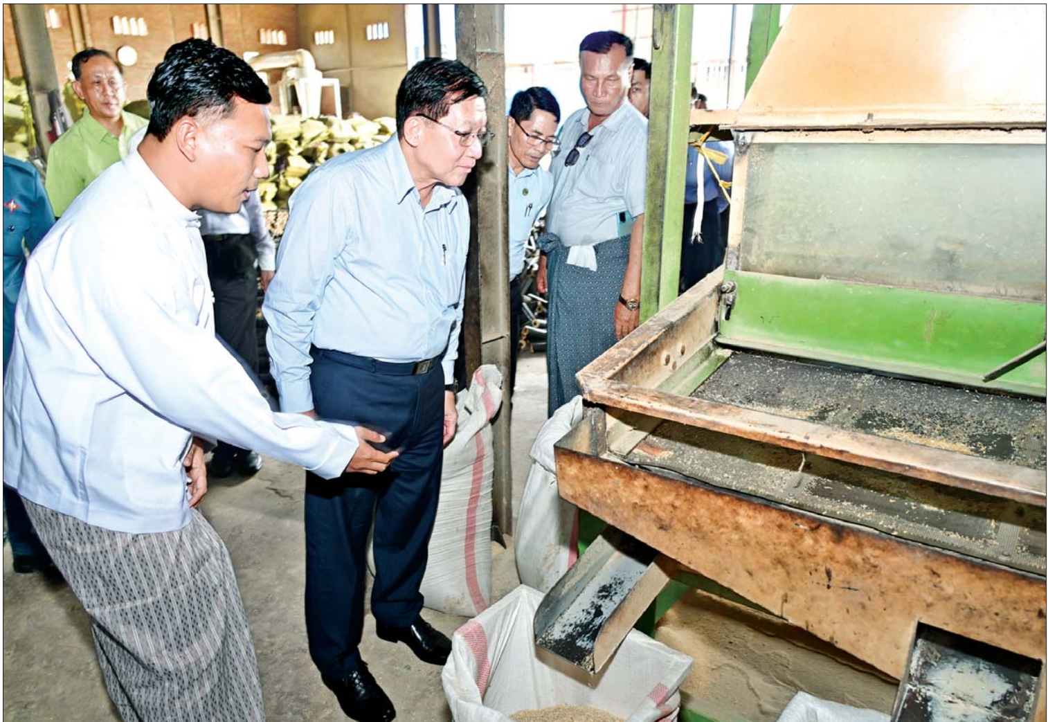
နိုင်ငံတော်စီမံအုပ်ချုပ်ရေးကောင်စီဥက္ကဋ္ဌ နိုင်ငံတော်ဝန်ကြီးချုပ် ဗိုလ်ချုပ်မှူးကြီးမင်းအောင်လှိုင် မိတ္ထီလာမြို့ မိဘမေတ္တာအဆင့်မြင့်ဆန်စက်လုပ်ငန်းတွင် ကြည့်ရှု စစ်ဆေးစဉ်။

ဆက်လက်၍ နိုင်ငံတော်စီမံအုပ်ချုပ်ရေး ကောင်စီဥက္ကဋ္ဌ နိုင်ငံတော်ဝန်ကြီးချုပ် က ဒေသဖွံ့ဖြိုးတိုးတက်ရေးဆိုင်ရာများ ဆွေးနွေးပြောကြားရာတွင် မိမိအနေဖြင့် မိတ္ထီလာဒေသ ဖွံ့ဖြိုးတိုးတက်ရေး အတွက် လိုအပ်သည်များ ဖြည့်ဆည်း ဆောင်ရွက်ပေးခြင်းနှင့် လမ်းညွှန်မှာကြား ခြင်းများကို ဆောင်ရွက်ပေးလျက်ရှိ ကြောင်း၊ မိတ္ထီလာဒေသ ဖွံ့ဖြိုးတိုးတက် ရေးအတွက် စီးပွားရေးအဖွဲ့ဖွံ့ဖြိုးတိုးတက် ခြင်းနှင့် လူမှုရေးအဖွဲ့ဖွံ့ဖြိုးတိုးတက်ခြင်း ဟူ၍ နှစ်ပိုင်းရှိကြောင်း၊ စီးပွားရေးနှင့် ပတ်သက်၍ မိတ္ထီလာဒေသတွင် ကြီးမား သည့် စက်ရုံအလုပ်ရုံများမရှိသော်လည်း အသေးစား၊ အငယ်စားနှင့် အလတ်စား စီးပွားရေး (MSME) လုပ်ငန်းများကို ဆောင်ရွက်လျက်ရှိကြောင်း၊ မိမိတို့နိုင်ငံ ၏ အဓိကစီးပွားရေးမှာ စိုက်ပျိုးမွေးမြူ ရေးလုပ်ငန်းပင်ဖြစ်ပြီး စီးပွားရေး