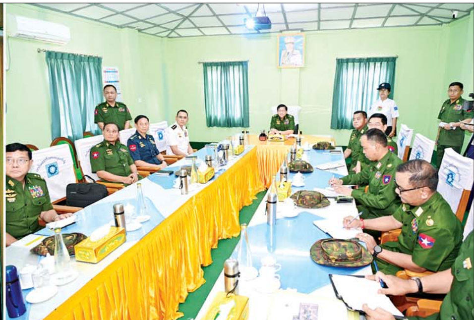
နိုင်ငံတော်စီမံအုပ်ချုပ်ရေးကောင်စီဥက္ကဋ္ဌ တပ်မတော်ကာကွယ်ရေးဦးစီးချုပ် ဗိုလ်ချုပ်မှူးကြီးမင်းအောင်လှိုင်အား တပ်မတော်သားရေးစက်ရုံ(မိတ္ထီလာ)၌ တာဝန်ရှိသူတစ်ဦးက ရှင်းလင်းတင်ပြစဉ်။

ရေဖုံးမှ စက်ရုံ၌ တပ်ဆင်အသုံးပြုလျက်ရှိသည့် စက်များ၏ စွမ်းဆောင်နိုင်ရည်၊ ကရုဏ်းသားရေး ဆိုးလ်သား ရေနှင့် ဆိတ်သားရေတို့အား တစ်နှစ်လျှင် သား ရေကုန်ကြမ်းထုတ်လုပ်ပေးနိုင်မှုနှင့် ထုတ်လုပ်မှု နည်းစဉ်အဆင့်ဆင့်၊ စက်ရုံဝန်ထမ်းများအတွက် သက်သာချောင်ချိရေးဆောင်ရွက်ပေးနိုင်မှုတို့နှင့် ပတ်သက်၍ ရှင်းလင်းတင်ပြသည်။