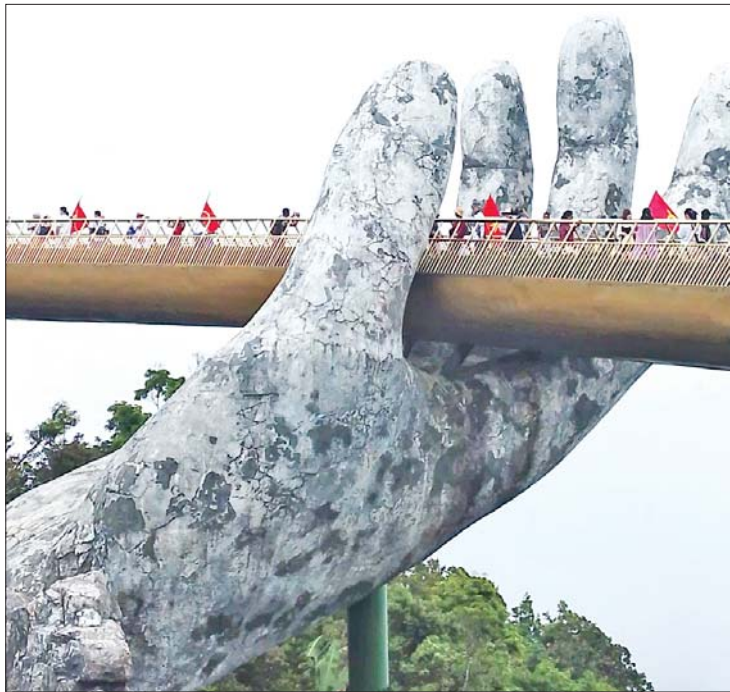
ဗီယက်နမ်နိုင်ငံ ဒါနန်းမြို့ရှိ ရွှေတံတား။

ကျွန်တော်တို့သည် ဗီယက်နမ်နိုင်ငံ ဒါနန်းမြို့ရှိ ပင်လယ်ကမ်းခြေသို့ အလည်