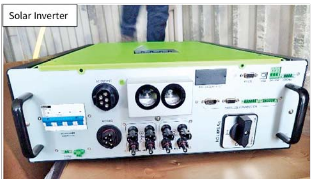
သီလဝါဆိပ်ကမ်း၌ သိမ်းဆည်းရမိမှု။

ထိုသို့ ဆောင်ရွက်လျက်ရှိရာ ဇူလိုင် ၈ ရက်တွင် အကောက်ခွန် ဦးစီးဌာန၏ စီမံခန့်ခွဲမှုဖြင့် တာဝန်ကျ ပူးပေါင်းအဖွဲ့များက စစ်ဆေးမှုများ ဆောင်ရွက်ခဲ့ရာ သီလဝါဆိပ်ကမ်း၌ ကုန်သွယ်ရေး လေးလုံးအတွင်းမှ တရားဝင်စာရွက်စာတမ်း အထောက်အထား တင်ပြနိုင်ခြင်းမရှိသည့် လုပ်ငန်းသုံးပစ္စည်း ၆၃ မျိုး (ခန့်မှန်းတန်ဖိုး ငွေ ၁၁၅၄၄၀၅၃၄ ကျပ်)ကို လည်းကောင်း၊ အေးရှားဝေါလ်ဆိပ်ကမ်း၌ ကုန်သွယ်ရေး အတွင်းမှ တရားဝင်စာရွက်စာတမ်း အထောက်အထား တင်ပြနိုင်ခြင်း မရှိသည့် လုပ်ငန်းသုံးပစ္စည်း လေးမျိုး (ခန့်မှန်းတန်ဖိုး ငွေကျပ် ၁၃၆၂၄၂၈၀၃၀)ကိုလည်းကောင်း စုစုပေါင်း (ခန့်မှန်းတန်ဖိုး ငွေ ၁၄၇၇၇၆၉၅၆၄ ကျပ်) ကို သိမ်းဆည်းရမိခဲ့ပြီး အကောက်ခွန်လုပ်ထုံးလုပ်နည်းများနှင့် အညီ