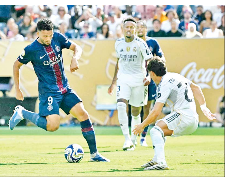
ပီအက်စ်ဂျီအသင်းနှင့် ရီးယဲလ်မက်ဒရစ်အသင်းတို့ ယှဉ်ပြိုင်ကစားကြစဉ်။

ကုလသမဂ္ဂလူ့အခွင့်အရေးကောင်စီ၏(၅၅)ကြိမ်မြောက် အစည်းအဝေးအတွင်း မြန်မာနိုင်ငံဆိုင်ရာ အစီရင်ခံစာများ၊ အပြန်အလှန် ဆွေးနွေးမှုနှင့် ပကတိမြေပြင်အခြေအနေမှန်များနှင့် လုံးဝကိုက်ညီခြင်း မရှိဘဲ နိုင်ငံရေးအရ လိုရာဆွဲပုံဖော်ထားသည့် ဆုံးဖြတ်ချက်အဆိုတို့ကို မြန်မာအစိုးရ၏ ကိုယ်စားလှယ်ပါဝင်ခြင်းမရှိဘဲ တစ်ဖက်သတ် ဆွေးနွေးအတည်ပြုခဲ့ကြောင်း တွေ့ရှိရသည်။ မြန်မာနိုင်ငံ၌ မတ်လ ၂၈ ရက်တွင် လှုပ်ခတ်ခဲ့သည့် မန္တလေး ငလျင်ကြီးအပြီး ပြန်လည်ထူထောင်ရေးလုပ်ငန်းများ အင်တိုက်အားတိုက် ဆောင်ရွက်နေချိန်တွင် တစ်ဖက်တွင်လည်း တည်ငြိမ်ရေး၊ ငြိမ်းချမ်းရေး၊ လုံခြုံရေး၊ ဖွံ့ဖြိုးတိုးတက်ရေးနှင့် ဒီမိုကရေစီလုပ်ငန်းစဉ်များကို အကောင်အထည်ဖော်ဆောင်ရွက်လျက်ရှိသည်။ ဒီမိုကရေစီလုပ်ငန်းစဉ်ဟုဆိုရာတွင် ရွေးကောက်ပွဲသည် မရှိမဖြစ်လုပ်ငန်းစဉ် တစ်ခုဖြစ်၍ လွတ်လပ်၍ တရားမျှတ ပွင့်လင်းမြင်သာသော ရွေးကောက်ပွဲကို အလေးထားဆောင်ရွက်ရန် ကတိကဝတ်လည်း ထားရှိပြီးဖြစ်သည်။ နိုင်ငံတော်အစိုးရအနေဖြင့် လက်နက်ကိုင်အဖွဲ့များကို နိုင်ငံရေးလုပ်ငန်းစဉ်တွင် ပါဝင်နိုင်ရေးအတွက် ၎င်းတို့အား တရားဥပဒေဘောင်အတွင်းသို့ ဝင်ရောက်ရန် ကမ်းလှမ်းထားပြီးဖြစ်သည်။ စာမျက်နှာ ၉ ကော်လံ ၁ သို့ ✪