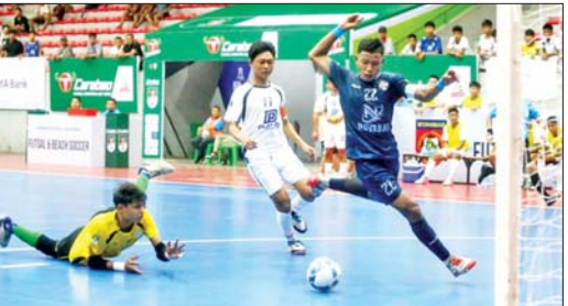
7 Brother အသင်းနှင့် Pacific Sun Far အသင်းတို့ ယှဉ်ပြိုင်နေစဉ်။

အုပ်စုပထမနေ့တွင် JZ Yangon အသင်းက 7 Dragon အသင်းကို သုံးဂိုး-နှစ်ဂိုး၊ MIU အသင်းက ULAD အသင်းကို လေးဂိုးပြတ်၊ 7 Brother အသင်းက Pacific Sun Far အသင်း ကို ငါးဂိုး-နှစ်ဂိုးဖြင့် အနိုင်ရပြီး VUC အသင်းနှင့် ပြည့်ကြီး အသင်းတို့ လေးဂိုးစီသာရေကျခဲ့သည်။ အုပ်စုပွဲများကို ဇူလိုင် ၁၇ ရက်အထိကျင်းပမည်ဖြစ်ပြီး အသင်းစုစုပေါင်း ၂၈ သင်း ဝင်ရောက်ယှဉ်ပြိုင်နေကာ လေးသင်း ခုနစ်အုပ်စုခွဲ၍ ပြုလုပ် လျက်ရှိသည်။ အုပ်စုခွဲဝေထားမှုအရ အုပ်စု (A) တွင် VUC အသင်း၊ JZ Yangon အသင်း၊ 7 Dragon အသင်း၊ ပြည့်ကြီး အသင်း၊ အုပ်စု(B)တွင် MIU အသင်း၊ Pacific Sun Far အသင်း၊ 7 Brother အသင်း၊ ULAD အသင်း၊ အုပ်စု (C) တွင် YRG အသင်း၊ United City အသင်း၊ ပြည့်စုံအသင်း၊ ဟံသာဝတီအသင်း၊ အုပ်စု(D)တွင် YCDC MH Dream Team အသင်း၊ SGF အသင်း၊ KKY အသင်း၊ Water King အသင်း၊ အုပ်စု (E) တွင် Winner Generations အသင်း၊ Gold Dream အသင်း၊ Ruby Volcanose အသင်း၊ Kyaung Sayar Tharhtwe အသင်း၊ အုပ်စု (F) တွင် G-UPT အသင်း၊ TG United အသင်း၊ ရွှေပြည်သာယူနိုက်တက် အသင်း၊ တော်ဝင်နန်းအသင်း၊ အုပ်စု (G)တွင် M2K အသင်း၊ ဖူဆယ်ချစ်သူအသင်း၊ Maryar Noka အသင်းနှင့် မလိ ကြယ်စင်အသင်းတို့ ပါဝင်နေသည်။ သတင်း- ကိုညီလေး၊ ဓာတ်ပုံ-MFF