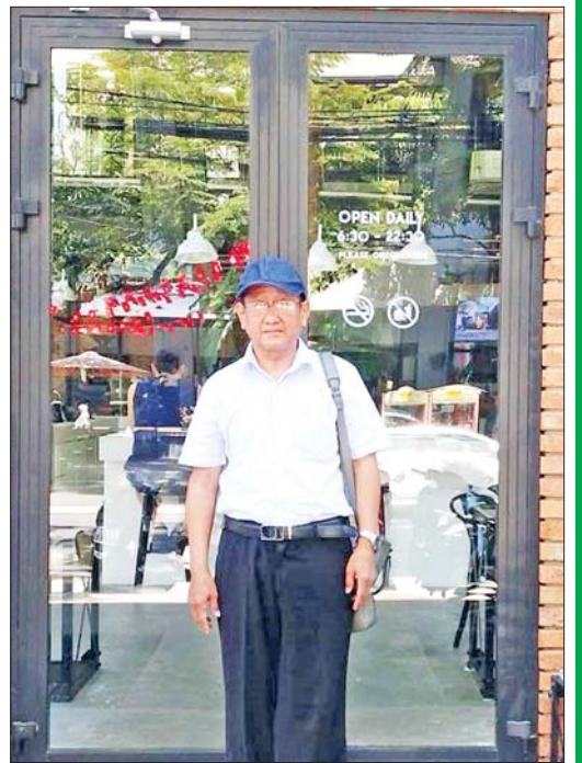
စာရေးသူ 43 Coffee Factory ဆိုင်သို့ ရောက်ခဲ့စဉ်။