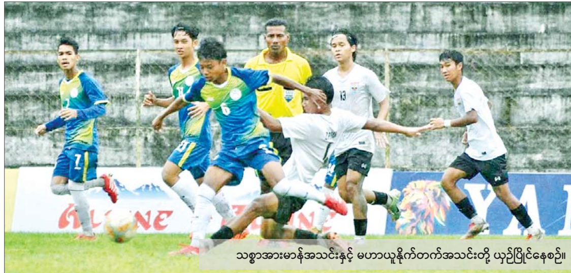
သစ္စာအားမာန်အသင်းနှင့် မဟာယူနိုက်တက်အသင်းတို့ ယှဉ်ပြိုင်နေစဉ်။

MNL ယူ-၂၁ တွင် သစ္စာအားမာန်နှင့် ရောဝတီယူနိုက်တက်အသင်း အမှတ်ပြည့်ရရှိ ရန်ကုန် ဇူလိုင် ၁၀ MNL ယူ-၂၁ လူငယ်လိဂ်ပြိုင်ပွဲ ပွဲစဉ်(၁၃) ပထမနေ့ကို ဇူလိုင် ၁၀ ရက်က ကျင်းပရာ သစ္စာအားမာန်နှင့် ရောဝတီယူနိုက်တက်အသင်း အမှတ်ပြည့်ရရှိခဲ့သည်။ စာမျက်နှာ ၂၀ ကော်လံ ၁ သို့ ✪