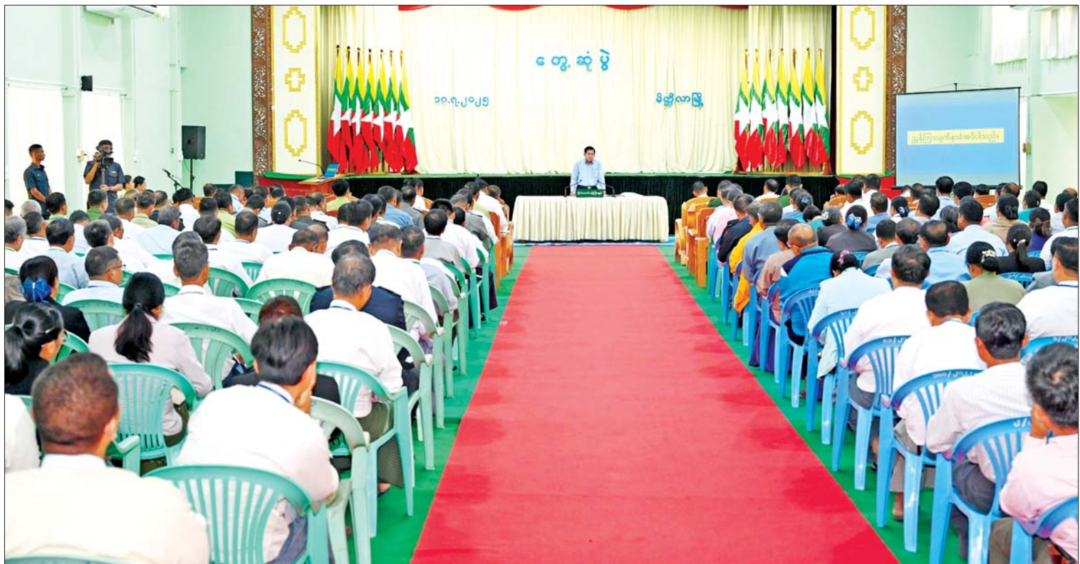
နိုင်ငံတော်စီမံအုပ်ချုပ်ရေးကောင်စီဥက္ကဋ္ဌ နိုင်ငံတော်ဝန်ကြီးချုပ် ဗိုလ်ချုပ်မှူးကြီးမင်းအောင်လှိုင် မန္တလေးတိုင်းဒေသကြီး မိတ္ထီလာခရိုင်အတွင်းရှိ ခရိုင်၊ မြို့နယ်အဆင့်ဌာနဆိုင်ရာ တာဝန်ရှိသူများ၊ မြို့မိမြို့ဖများနှင့် MSME လုပ်ငန်းရှင်များအား တွေ့ဆုံ၍ ဒေသဖွံ့ဖြိုးတိုးတက်ရေးဆိုင်ရာများ ဆွေးနွေးပြောကြားစဉ်။

ဒေသဆိုင်ရာအချက်အလက်များနှင့် ဖွံ့ဖြိုးတိုးတက်ရေးဆောင်ရွက်လျက်ရှိမှုအခြေအနေများအား ရှင်းလင်းတင်ပြဦးစွာ မိတ္ထီလာခရိုင်စီမံအုပ်ချုပ်ရေးအဖွဲ့ဥက္ကဋ္ဌ ဦးအောင်မြင့်ဦးက နိုင်ငံတော်စီမံအုပ်ချုပ်ရေးကောင်စီဥက္ကဋ္ဌ နိုင်ငံတော်ဝန်ကြီးချုပ် မိတ္ထီလာခရိုင်အတွင်းသို့ ရောက်ရှိစဉ် လမ်းညွှန်မှာကြားချက်များအား အကောင်အထည်ဖော်ဆောင်ရွက်လျက်ရှိမှု၊ မန္တလေးလျှင်ကြီးကြောင့် နိုင်ငံပိုင်နှင့် ပြည်သူပိုင်အဆောက်အအုံများ ထိခိုက်ပျက်စီးဆုံးရှုံးခဲ့မှုများ အပေါ် ပြန်လည်ထူထောင်ရေးနှင့် ပြန်လည်တည်ဆောက်ရေးလုပ်ငန်းများ ဆောင်ရွက်လျက်ရှိမှု၊ ပညာရေးကဏ္ဍမြှင့်တင်ဆောင်ရွက်နိုင်မှု၊ မိတ္ထီလာမြို့ဖွံ့ဖြိုးတိုးတက်ရေးစီမံကိန်း ရေးဆွဲဆောင်ရွက်လျက်ရှိမှု၊ ခရိုင်အတွင်း ဆိုလာဓာတ်အားပေးစက်ရုံများ တည်ဆောက်လည်ပတ်