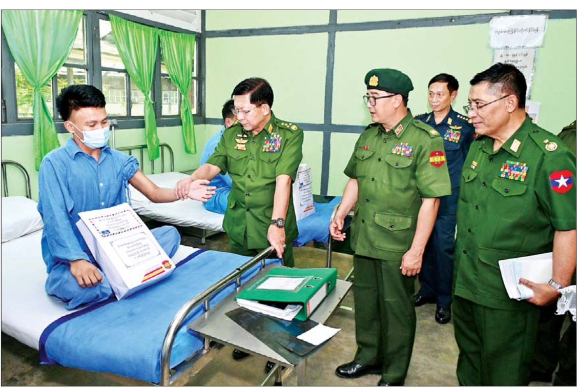
နိုင်ငံတော်စီမံအုပ်ချုပ်ရေးကောင်စီဥက္ကဋ္ဌ တပ်မတော်ကာကွယ်ရေးဦးစီးချုပ် ဗိုလ်ချုပ်မှူးကြီး မင်းအောင်လှိုင် မိတ္ထီလာမြို့ရှိ တပ်မတော်ဆေးရုံတွင် ဆေးရုံတက်ရောက်ကုသမှုခံယူလျက်ရှိသည့် အရာရှိ၊ စစ်သည်များ၏ ကျန်းမာရေးအခြေအနေများအား ကြည့်ရှုအားပေးစဉ်။

ဆေးရုံတက်ရောက်ကုသမှုခံယူလျက်ရှိ သည့် အရာရှိ၊ စစ်သည်များအား ဂုဏ်ပြု ချီးမြှင့်ငွေနှင့် လက်ဆောင်ပစ္စည်းများ ပေးအပ်သည်။ ထို့နောက် အစည်းအဝေးခန်းမတွင် ဆေးရုံတပ်မှူးက ဆေးရုံသမိုင်းအကျဉ်း၊ တပ်မတော်သားများနှင့် ဒေသခံပြည်သူ များအား ဆေးအကာအကွယ်ပေးရေး လုပ်ငန်းများနှင့် ကျန်းမာရေးစောင့်ရှောက် မှုလုပ်ငန်းများ ဆောင်ရွက်ပေးလျက်ရှိမှု၊ အထူးကုသမှုများ၊ ရောဂါရှာဖွေရေး လုပ်ငန်းများ၊ အစားထိုးခွဲစိတ်ကုသရေး လုပ်ငန်းများနှင့် နယ်လှည့်ကျန်းမာရေး စောင့်ရှောက်မှုလုပ်ငန်းများ ဆောင်ရွက် ပေးလျက်ရှိမှုနှင့် စစ်ဦးစီး၊ စစ်ရေး၊ စစ်ထောက်နှင့် သက်သာချောင်ချိရေး လုပ်ငန်းများ ဆောင်ရွက်ပေးလျက်ရှိမှု အခြေအနေများကို ရှင်းလင်းတင်ပြသည်။ ရှင်းလင်းတင်ပြမှုများနှင့်စပ်လျဉ်း၍ နိုင်ငံတော်စီမံအုပ်ချုပ်ရေးကောင်စီဥက္ကဋ္ဌ တပ်မတော် ကာကွယ်ရေးဦးစီးချုပ်က တပ်မတော်သားများနှင့် မိသားစုဝင်များ အား ကျန်းမာရေး စောင့်ရှောက်မှုလုပ်ငန်း များ ဆောင်ရွက်ပေးသကဲ့သို့ ဒေသခံ ပြည်သူများ၏ ကျန်းမာရေးစောင့်ရှောက် မှုလုပ်ငန်းများကိုလည်း ဆောင်ရွက်ပေး ရန်လိုကြောင်း၊ နယ်လှည့်ကျန်းမာရေး စောင့်ရှောက်မှု လုပ်ငန်းများဆောင်ရွက် ချိန်တွင် ပြည်သူ့ကျန်းမာရေး ဟောပြော မှုများကိုလည်း ဆောင်ရွက်ပေးရန်လို