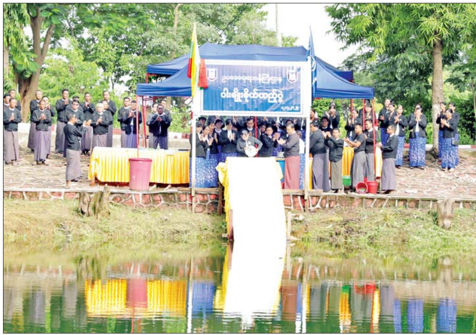
ဥပဒေရေးရာဝန်ကြီးဌာန ၂၀၂၅ ခုနှစ် မိုးရာသီ ငါးမျိုးစိုက်ထည့်ပွဲ အခမ်းအနား ကျင်းပစဉ်။