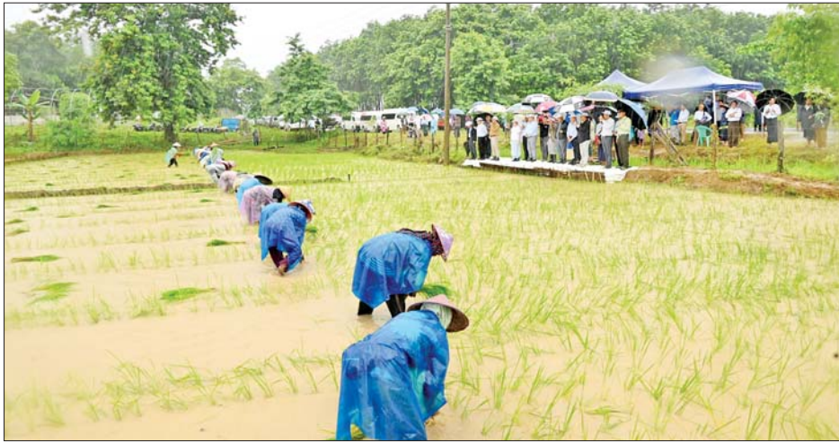
ရရှိရေး စုပေါင်းပျိုးထောင်စိုက်ပျိုးခြင်းအခမ်းအနားသို့ တက်ရောက်ပြီး ဦးစွာ ကွင်းအတွင်းရှိ မိုးစပါးစိုက်တောင်သူများနှင့် တွေ့ဆုံသည်။ ထိုသို့တွေ့ဆုံစဉ် ပြည်နယ်ဝန်ကြီးချုပ်က

ကချင်ပြည်နယ်အစိုးရအဖွဲ့အနေဖြင့် ဒေသတွင်း စားရေရိက္ခာဖူလုံရေးအတွက် စိုက်ပျိုးမွေးမြူရေးလုပ်ငန်းများကို အရှိန်အဟုန်ဖြင့် တိုးမြှင့်ဆောင်ရွက်နိုင်ရေး ကြိုးပမ်းဆောင်ရွက်လျက်ရှိရာ ပြည်နယ်ဝန်ကြီးချုပ် ဦးခက်ထိန်နန်သည် တာဝန်ရှိသူများနှင့်အတူ ဇူလိုင် ၁၂ ရက် နံနက် ၈ နာရီခွဲက မြစ်ကြီးနားမြို့နယ်အတွင်း မိုးစပါးပန်းတိုင်အထွက်နှုန်းရရှိရေး၊ ကောက်ကွက်ပြည့်မီရေး တောင်သူအသိပညာပေးစုပေါင်းပျိုးထောင်စိုက်ပျိုးခြင်း ကွင်းသရုပ်ပြပွဲနှင့် ကြက်မွေးမြူရေးလုပ်ငန်းများကို ကွင်းဆင်းစစ်ဆေးဆောင်ရွက်ခဲ့ကြသည်။