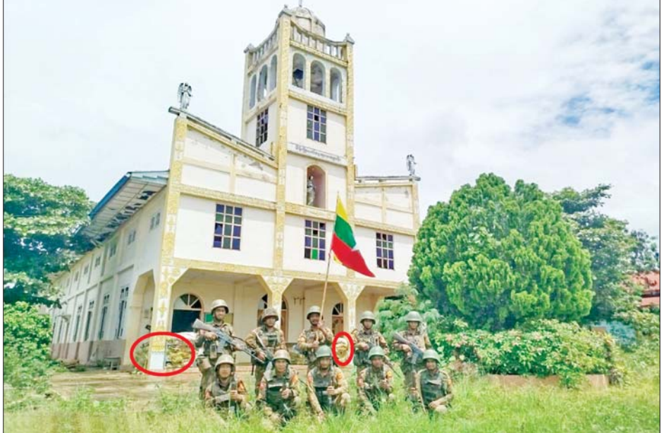
အကြမ်းဖက်သမားများ ခံစစ်စခန်းပြုလုပ်ခဲ့သည့် ဝါရီကော့ဘုရားကျောင်းအား တပ်မတော်က ပြန်လည်သိမ်းပိုက်ရရှိမှုမှတ်တမ်းဓာတ်ပုံ။

ဆက်သွယ်ရေးလမ်းကြောင်းများမှတစ်ဆင့် သွားလာနိုင်ကြပြီဖြစ်ကာ လှိုင်ကော်မြို့သို့ ကုန်စည်စီးဝင်၊ စီးထွက်မှုများမှာလည်း ပိုမို လွယ်ကူလျင်မြန်ခြင်းမှတစ်ဆင့် လှိုင်ကော်မြို့နှင့် လက်ရှိပဋိပက္ခဒဏ်သင့်မြို့ရွာများရှိ ဒေသခံ ပြည်သူလူထုများ၏ အခြေခံစားကုန်၊ လူသုံးကုန်ပစ္စည်းများ ခက်ခဲ၊ ရှားပါးမှု၊ ကုန်ဈေးနှုန်း ကြီးမြင့်မှုတို့မှလည်း အထိုက်အလျောက် သက်သာစေမည်ဖြစ်သည့်အတွက် ဒေသခံပြည်သူများ၏ ဝမ်းသာပီတိဖြစ်မှုတို့ကိုလည်း ကြားသိရပါသည်- အမျိုးသမီး ကားလမ်းတွေ ပိတ်သွားတော့