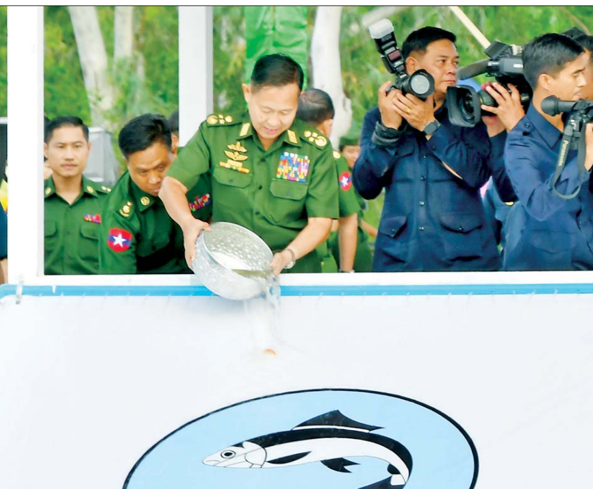
နိုင်ငံတော်စီမံအုပ်ချုပ်ရေးကောင်စီ ဒုတိယဥက္ကဋ္ဌ ဒုတိယ တပ်မတော်ကာကွယ်ရေးဦးစီးချုပ် ကာကွယ်ရေးဦးစီးချုပ်(ကြည်း) ဒုတိယဗိုလ်ချုပ်မှူးကြီးစိုးဝင်း ရေဆင်းဆည်အတွင်း ငါးမျိုးများ စိုက်ထည့်ပေးစဉ်။

☆ ရှေးဦးစွာ ညှိနှိုင်းကွပ်ကဲရေးမှူး(ကြည်း၊ ရေ၊ လေ) ဗိုလ်ချုပ်ကြီး ကျော်စွာလင်းနှင့် ဇနီး၊ ကာကွယ်ရေးဦးစီးချုပ်(ရေ)နှင့် ဇနီး၊ ကာကွယ်ရေးဦးစီးချုပ်(လေ)နှင့် ဇနီး၊ ကာကွယ်ရေးဦးစီးချုပ်မှူးမှ တပ်မတော် အရာရှိကြီးများနှင့် ဇနီးများ၊ ပြည်ထောင်စု အဆင့်ပုဂ္ဂိုလ်များနှင့် ဇနီးများ၊ နိုင်ငံတော် ကာကွယ်ရေးတက္ကသိုလ်မှ သင်တန်းသား အရာရှိကြီးများ၊ ကာကွယ်ရေးဦးစီးချုပ်ရုံး (ကြည်း)ရှိ ရုံးဌာနအသီးသီးမှ အရာရှိ၊ စစ်သည်များနှင့် မိသားစုဝင်များ တက်ရောက်ကြသည်။