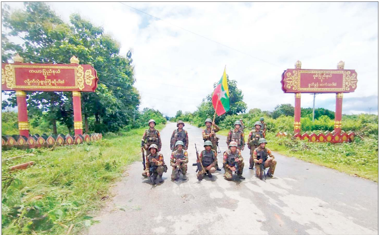
အကြမ်းဖက်သမားများ ယာယီထိန်းချုပ်ထားသည့် မိုးမြဲ-လွိုင်ကော်သွား ကားလမ်းအား တပ်မတော်က ပြန်လည်ထိန်းချုပ်ရရှိမှုမှတ်တမ်းဓာတ်ပုံ။