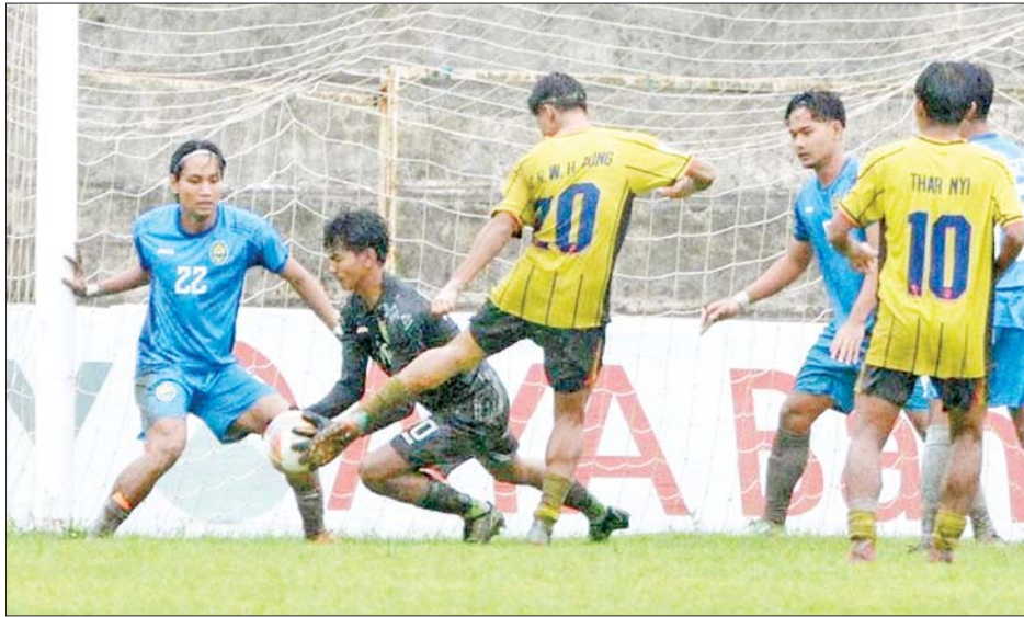
ဒဂုံစတားယူနိုက်တက်အသင်းနှင့် ရာမညယူနိုက်တက်အသင်းတို့ ယှဉ်ပြိုင်ကစားစဉ်။

ပဒုမ္မာကွင်း၌ ကျင်းပသည့်ပွဲတွင် လက်ရှိ ချန်ပီယံရှမ်းယူနိုက်တက်အသင်းက Junior Lions အသင်းကို နှစ်ဂိုး-တစ်ဂိုးဖြင့် အနိုင်ရရှိသည်။ လက်ရှိ ချန်ပီယံ ရှမ်းယူနိုက်တက်အသင်း နိုင်ပွဲပြန်ရပြီး