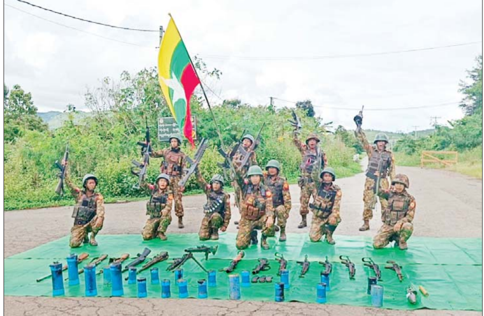
အကြမ်းဖက်သမားများထံမှ သိမ်းဆည်းရမိလက်နက်၊ ခဲယမ်းများနှင့် ဆက်စပ်ပစ္စည်းများကို တွေ့ရစဉ်။