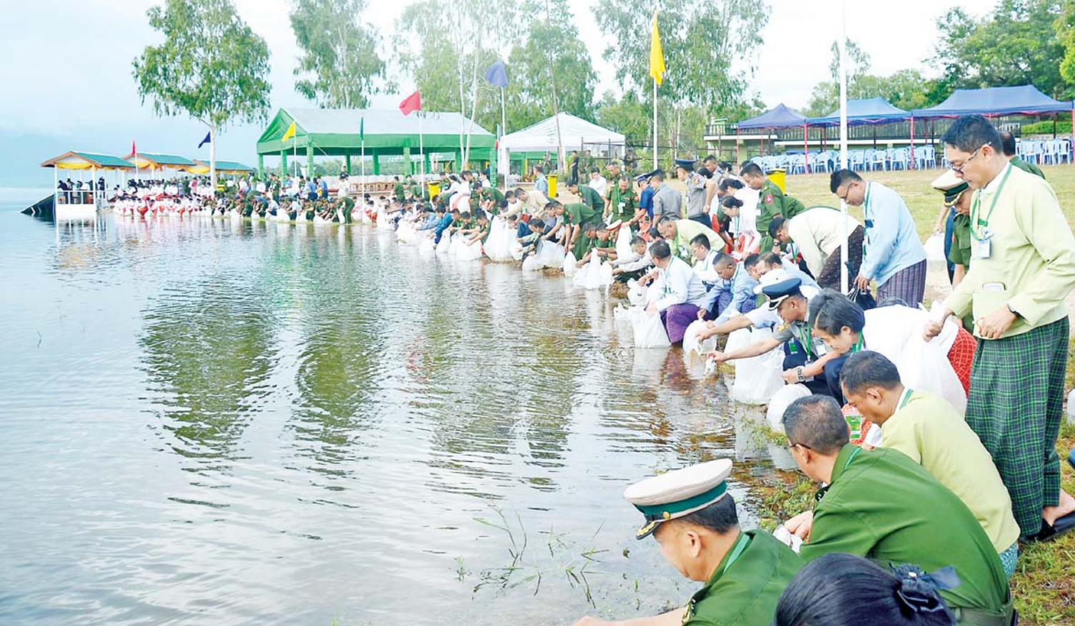
ကာကွယ်ရေးဦးစီးချုပ်ရုံး(ကြည်း၊ ရေ၊ လေ)မိသားစုများ၏ ၂၀၂၅ ခုနှစ် မိုးရာသီ ငါးမျိုးစိုက်ထည့်ခြင်းအခမ်းအနားသို့ တက်ရောက်လာကြသည့် အရာရှိ၊ စစ်သည် မိသားစုများက ငါးမျိုးများကို ရေဆင်းဆည်အတွင်း စိုက်ထည့်ပေးကြစဉ်။

ဦးစွာ နိုင်ငံတော်စီမံအုပ်ချုပ်ရေး ကောင်စီဥက္ကဋ္ဌ တပ်မတော်ကာကွယ်ရေး ဦးစီးချုပ်နှင့် ဇနီးတို့က ရေဆင်းဆည် အတွင်းသို့ ငါးမျိုးများအား ဦးဆောင် စိုက်ထည့်ပေးကြသည်။ ဆက်လက်ပြီး နိုင်ငံတော်စီမံအုပ်ချုပ်ရေးကောင်စီ ဒုတိယ ဥက္ကဋ္ဌ ဒုတိယတပ်မတော်ကာကွယ်ရေး ဦးစီးချုပ် ကာကွယ်ရေးဦးစီးချုပ်(ကြည်း)၊ ညှိနှိုင်းကွပ်ကဲရေးမှူး(ကြည်း၊ ရေ၊ လေ) နှင့်ဇနီး၊ ကာကွယ်ရေးဦးစီးချုပ်(ရေ)နှင့် ဇနီး၊ ကာကွယ်ရေးဦးစီးချုပ်(လေ)နှင့်ဇနီး၊ ကာကွယ်ရေးဦးစီးချုပ်မှူးမှ တပ်မတော် အရာရှိကြီးများနှင့် ဇနီးများ၊ အခမ်းအနား တက်ရောက်လာကြသည့် အရာရှိ၊ စစ်သည် မိသားစုများက ငါးမျိုးများကို ရေဆင်းဆည်အတွင်း စိုက်ထည့်ပေးကြ သည်။ ထို့နောက် နိုင်ငံတော်စီမံအုပ်ချုပ် ရေးကောင်စီဥက္ကဋ္ဌ တပ်မတော်ကာကွယ် ရေးဦးစီးချုပ်နှင့် ဇနီး၊ အဖွဲ့ဝင်များသည် အရာရှိ၊ စစ်သည် မိသားစုများ၏ ငါးမျိုး စိုက်ထည့်ပေးနေမှုအား လိုက်လံကြည့်ရှု အားပေးကြသည်။