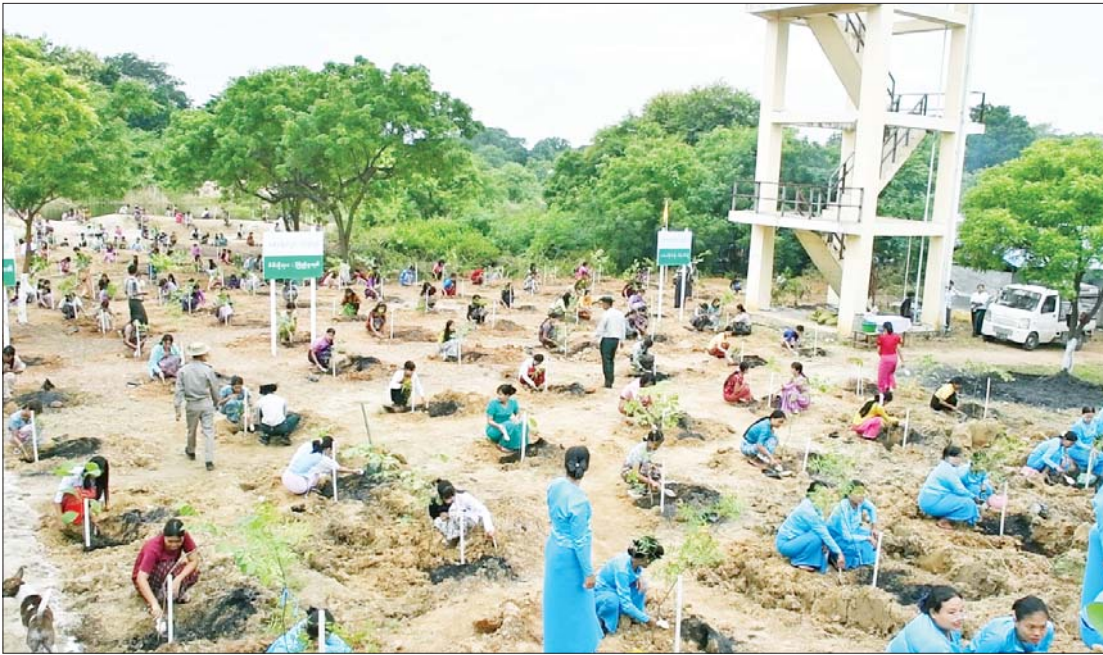
စစ်ကိုင်းမြို့၊ စစ်ကိုင်းပညာရေးတက္ကသိုလ်ဝင်းအတွင်း၌ ၂၀၂၅ ခုနှစ် မိုးရာသီသစ်ပင်စိုက်ပျိုးပွဲ ကျင်းပစဉ်။

သစ်ပင်များကို မြတ်နိုးတန်ဖိုးထား၍ စိုက်ပျိုးခြင်းသည် လောကကို အလှ ဆင်ခြင်းဖြစ်ပြီး သစ်ပင်၊ ဝါးပင်၊ ပန်းအလှပင်ဟူသမျှ မျက်စိပသာဒ လှပသည်သာမက စိတ်ကြည်နူးမှုကိုပါ ဖြစ်စေသည်။ ခြံဝင်းထဲတွင် သီးပင်၊ စားပင်များ စိုက်ပျိုးခြင်းခေလေ့သည် ကျေးလက်သာမက မြေဧရိယာကျယ်ဝန်း သူတိုင်း တစ်ပိုင်တစ်နိုင်စိုက်ပျိုးနိုင်သည်။