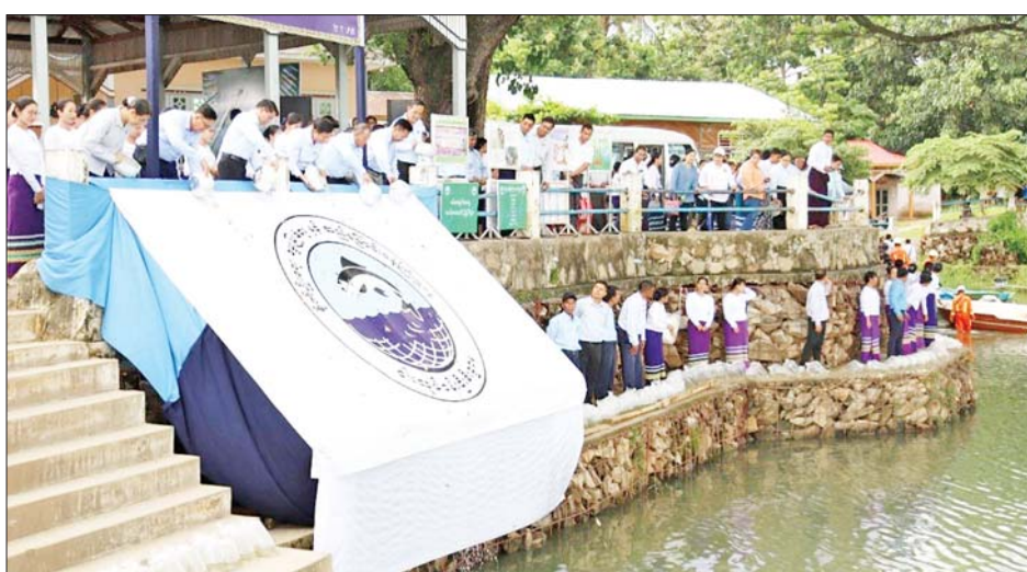
စိုက်ပျိုးရေး၊ မွေးမြူရေးနှင့် ဆည်မြောင်းဝန်ကြီးဌာန ၂၀၂၅ ခုနှစ် မိုးရာသီ ငါးမျိုးစိုက်ထည့်ပွဲအခမ်းအနား ကျင်းပစဉ်။

လောင်းချောင်းတွင် ကျင်းပခဲ့ပြီး နှစ်လက်မအရွယ် ငါးသားပေါက် ကောင်ရေ ၂၀၀၀၀ ကို လည်းကောင်း၊ သမဝါယမနှင့်ကျေး လက်ဖွံ့ဖြိုးရေးဝန်ကြီးဌာန၏ ငါးမျိုးစိုက်ထည့်ပွဲကို ဝန်ကြီး ဌာနရှိ လျှို့ဝှက်ဆည်တွင် ကျင်းပ ခဲ့ပြီး ငါးမြစ်ချင်းကောင်ရေ ၃၀၀၀ ကို လည်းကောင်း၊ သယံဇာတ နှင့် သဘာဝပတ်ဝန်းကျင် ထိန်းသိမ်းရေး ဝန်ကြီးဌာန၏ ငါးမျိုး စိုက်ထည့်ပွဲကို နေပြည်တော် စည်ပင်သာယာရေး ကော်မတီရုံး အနောက်ဘက်ရှိ ငလိုက် ရာဘာရေလွှဲဆည်တွင် ကျင်းပခဲ့ပြီး ငါးခုံးမနှင့်ငါးမြစ်ချင်း ငါးသားပေါက် ကောင်ရေ ၂၀၀၀ ကိုလည်းကောင်း၊ ပညာရေး