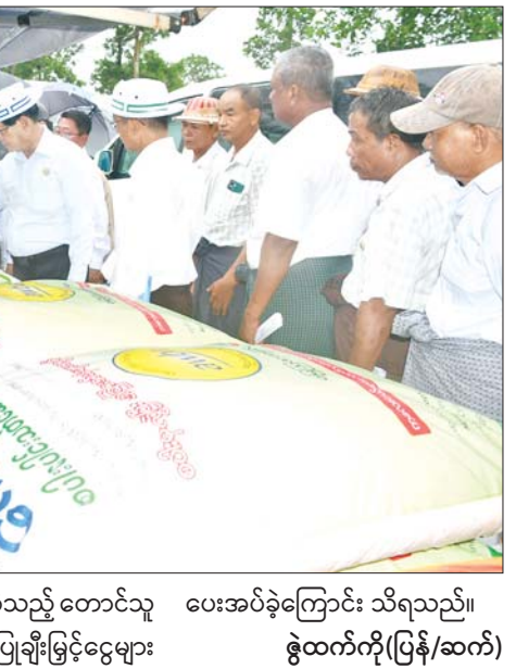
လှည့်လည်ကြည့်ရှု အားပေးပြီး သရုပ်ပြစိုက်ပျိုးခဲ့သည့် တောင်သူ ပေးအပ်ခဲ့ကြောင်း သိရသည်။ တိုက်ရိုက်မျိုးစေ့ချ ကိရိယာဖြင့် များအား ဂုဏ်ပြုချီးမြှင့်ငွေများ ဇွဲထက်ကို(ပြန်/ဆက်)

ယက်နေမှုများ၊ တိုက်ရိုက်အစေ့ချကိရိယာဖြင့် သရုပ်ပြစိုက်ပျိုးနေမှု၊ ကောက်စိုက်စက်ဖြင့် စိုက်ပျိုးခြင်း သရုပ်ပြနေမှု၊ လက်ဆွဲကောက်စိုက်စက်ဖြင့် စိုက်ပျိုးခြင်းသရုပ်ပြနေမှု၊ စက်မှုလယ်ယာဦးစီးဌာနနှင့် သမဝါယမဦးစီးဌာနတို့မှ ခင်းကျင်းပြသထားသည့် လယ်မြေပြုပြင်ရန် မြေဆွေးမြေဩဇာဆောင်ရွက်ထားရှိမှု၊ အပင်အားဆေးဆောင်ရွက်ထားရှိမှုနှင့် EM ဘိုကာရီမြေဆွေးများ ဆောင်ရွက်ထားရှိမှုတို့ကို