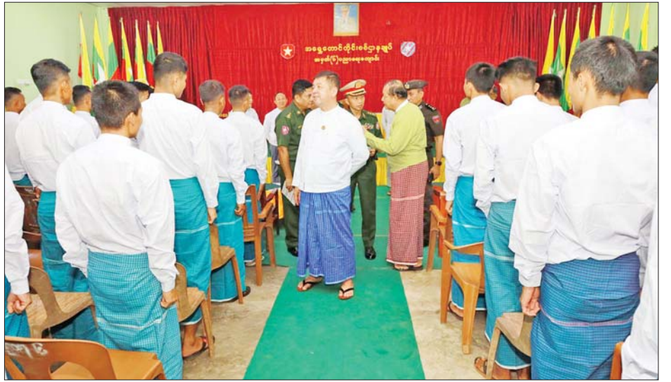
ချီးမြှင့်ငွေနှင့်အဝတ်အထည်များ ပေးအပ်ပြီး အားပေး ရှိသူများနှင့် ပေါင်းစပ်ညှိနှိုင်းဖြည့်ဆည်းဆောင်ရွက် စကားများပြောကြားကာ လိုအပ်သည်များကို တာဝန် ပေးခဲ့ကြောင်း သိရသည်။ စည်သူ(ပြန်/ဆက်)

ထို့နောက် ပြည်နယ်ဝန်ကြီးချုပ်က ပြည်သူ့ စစ်မှုထမ်းသင်တန်းအမှတ်စဉ်(၁၅) သို့ တက်ရောက် ကြမည့် နိုင်ငံသားကောင်းရတနာများအတွက် ဂုဏ်ပြု