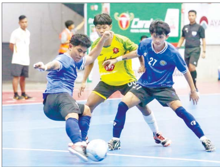
G-UPT အသင်းနှင့် တော်ဝင်နန်းအသင်းတို့ ယှဉ်ပြိုင်နေစဉ်။

ဇူလိုင် ၁၁ ရက်က ကျင်းပသည့် ဒုတိယနေ့တွင် YCMD MHD အသင်းက Water King အသင်းကို ၁၇ ဂိုး-နှစ်ဂိုး၊ KKY အသင်းက SGF အသင်းကို နှစ်ဂိုး-ဂိုးမရှိ၊ United City အသင်းက ပြည့်စုံအသင်းကို ခုနစ်ဂိုး-နှစ်ဂိုး၊ YRG အသင်းက ဟံသာဝတီအသင်းကို ခုနစ်ဂိုး-တစ်ဂိုးဖြင့် အနိုင်ရရှိသည်။ ဇူလိုင် ၁၂ ရက်က ကျင်းပသည့် တတိယ နေ့တွင် Winner Generations အသင်း က Kyaung Sayar Tharhtwe အသင်းကို ငါးဂိုးပြတ်၊ Gold Dream အသင်းက Ruby Vocabnose အသင်းကို ခြောက်ဂိုး- တစ်ဂိုး၊ G-UPT အသင်းက တော်ဝင်နန်း အသင်းကို ခြောက်ဂိုးပြတ်၊ TG United