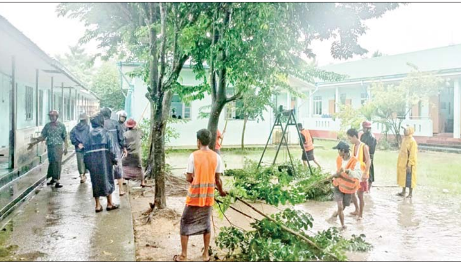
ရှင်းလင်းခြင်း၊ အမှိုက်များရှင်းလင်းခြင်း၊ ရေစီး ရေလာကောင်းမွန်စေရေး ရေနုတ်မြောင်းများ တူးဖော်ပေးခြင်း၊ ရေကန်များတွင် အဘိတ်ဆေးများ

နေပြည်တော် ဇူလိုင် ၁၂ ၂၀၂၅-၂၀၂၆ ပညာသင်နှစ်တွင် ကျောင်းသား ကျောင်းသူများ အဆင်ပြေချောမွေ့စွာ ပညာသင်ကြား နိုင်ရေးနှင့် စာသင်ကျောင်းများ ဥပမာရပ်ကောင်းမွန် စေရေးအတွက် တိုင်းဒေသကြီးနှင့် ပြည်နယ်များရှိ အခြေခံပညာကျောင်းများ၌ ကျောင်းပတ်ဝန်းကျင် သန့်ရှင်းသာယာလှပရေးအတွက် နယ်မြေခံ တပ်မတော်သားများ၊ ဌာနဆိုင်ရာဝန်ထမ်းများ၊ လူမှုရေးအသင်းအဖွဲ့များနှင့် ဒေသခံပြည်သူများက စုပေါင်းသန့်ရှင်းရေးလုပ်ငန်းများ ဆောင်ရွက်ပေး လျက်ရှိသည်။ ထိုသို့ ဆောင်ရွက်ပေးလျက်ရှိရာ ယနေ့တွင် ရန်ကုန်တိုင်းဒေသကြီး မင်္ဂလာဒုံမြို့နယ်အပါအဝင် မြို့နယ် ၁၄ မြို့နယ်၌ နယ်မြေခံတပ်မတော်သားများ၊ ဌာနဆိုင်ရာဝန်ထမ်းများ၊ လူမှုရေးအသင်းအဖွဲ့များနှင့် ဒေသခံပြည်သူများက အခြေခံပညာကျောင်းများ အတွင်း၊ အပြင်ရှိ ချုံနွယ်ပေါင်းမြက်များ ခုတ်ထွင်