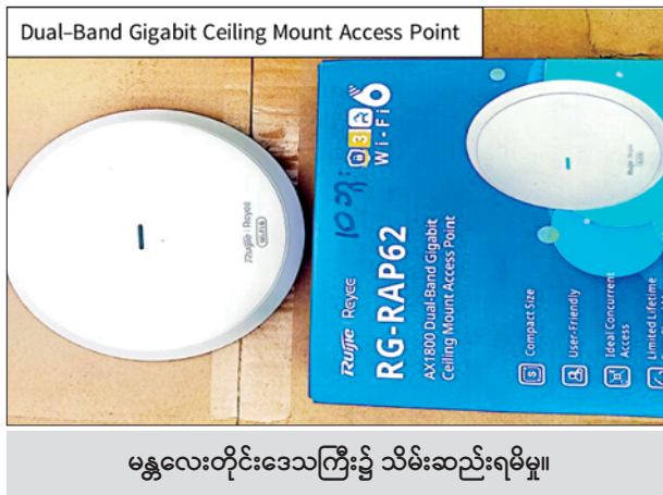
မန္တလေးတိုင်းဒေသကြီး၌ သိမ်းဆည်းရမိမှု။

အလားတူ ရှမ်းပြည်နယ် တရားမဝင်ကုန်သွယ်မှုတိုက်ဖျက်ရေး အထူးအဖွဲ့၏ စီမံခန့်ခွဲမှုဖြင့် တာဝန်ကျပူးပေါင်းအဖွဲ့က စစ်ဆေးမှုများ ဆောင်ရွက်ခဲ့ရာ မူဆယ်မြို့ ဆင်ဖြူဂိတ်အကျော်လမ်းဘေး တစ်နေရာ၌ စုပုံထားသော အကောက်ခွန်မဲ့ လူသုံးကုန်ပစ္စည်း ၆၅ မျိုး စုစုပေါင်း ခန့်မှန်းတန်ဖိုးငွေကျပ် ၄၅၇၀၀၀၀ ကို သိမ်းဆည်းရမိခဲ့ပြီး အကောက်ခွန်လုပ်ထုံးလုပ်နည်းများနှင့်အညီ အရေးယူဆောင်ရွက်လျက် ရှိသည်။