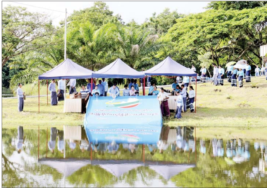
ရင်းနှီးမြှုပ်နှံမှုနှင့် နိုင်ငံခြားစီးပွားဆက်သွယ်ရေးဝန်ကြီးဌာန ၂၀၂၅ ခုနှစ် မိုးရာသီ ငါးမျိုးစိုက်ထည့်ပွဲ အခမ်းအနား ကျင်းပစဉ်။