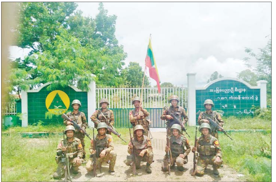
အကြမ်းဖက်သမားများ ခံစစ်စခန်းပြုလုပ်ခဲ့သည့် ဝါရီကော့ အထက်တန်းကျောင်း(ခွဲ)အား တပ်မတော်က ပြန်လည်သိမ်းပိုက်ရရှိမှုမှတ်တမ်းဓာတ်ပုံ။

ကျန်းမာရေးဖြစ်ပါတယ်။ နေမကောင်းတဲ့သူ ဆိုလည်း ဆေးရုံ အမြန်ဆုံးသွားရမယ်ဆိုရင် အချိန်မီပို့လို့ရတယ်။ ပညာရေးဆိုလည်း ကျောင်းပြန်ဖွင့်မယ်ဆိုရင် ကလေးတွေလည်း ပြန်ပြီးတော့ ကျောင်းနေလို့ရတာပေါ့။ စီးပွားရေး၊ လူမှုရေး၊ ပညာရေး၊ ကျန်းမာရေးကအစ အဘက်ဘက်က အကုန်လုံးအဆင်ပြေသွားတာပေါ့။ အခုလို လမ်းပွင့်သွားတဲ့အတွက် အတိုင်းမသိ ဝမ်းသာပါတယ်။ ဘာလို့ဆို ဒေသခံပြည်သူတွေ အကုန်လုံး အားလုံးက ကိုယ့်ရဲ့ ဒေသမှာ စည်စည်ကားကားနဲ့ ပြန်လာနေချင်ကြတာ ဆိုတော့ အဲဒီလိုမျိုး အဆင်ပြေသွားရင်တော့ အကောင်းဆုံးပါပဲ။