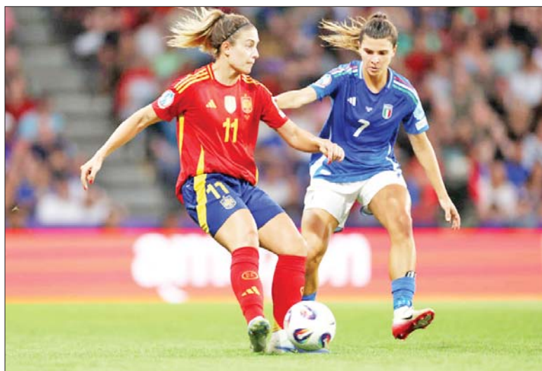
အီတလီအမျိုးသမီးအသင်းနှင့် စပိန်အမျိုးသမီးအသင်းတို့ ယှဉ်ပြိုင်ကစားကြစဉ်။

အမျိုးသမီးယူရို ၂၀၂၅ ပြိုင်ပွဲ အုပ်စု(B)ရဲ့ အုပ်စုအဆင့် နောက်ဆုံးပွဲတစ်ပွဲဖြစ်တဲ့ အီတလီအမျိုးသမီးအသင်းနဲ့ စပိန်အမျိုးသမီးအသင်းတို့ ပွဲစဉ်မှာ စပိန်အမျိုးသမီးအသင်းက အီတလီအမျိုးသမီးအသင်းကိုအနိုင်ရပြီး အုပ်စုပထမနေရာဖြင့် ကွာတားဖိုင်နယ်အဆင့်ကို တက်လှမ်းခွင့်ရရှိခဲ့ပါတယ်။