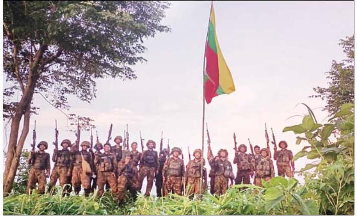
နောင်ချိုမြို့အနီးရှိ ရန်သူ့စခန်းကုန်းအား သိမ်းပိုက်ရရှိခဲ့သည့် မှတ်တမ်းဓာတ်ပုံ။