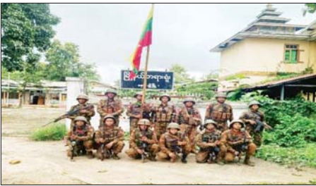
နောင်ချိုမြို့နယ် တရားရုံးအား သိမ်းပိုက်ရရှိမှုမှတ်တမ်းဓာတ်ပုံ။