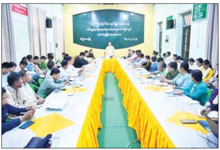
မြင့်ဦးက အမှာစကားပြောကြား သည့် သိန်းမင်းအမှတ်တံဆိပ် ပြီး ဒေသထွက်တန်ဖိုးဖြင့် ငရုတ်သီးမှုန့်လုပ်ငန်းရှင်နှင့် မိဘ ထုတ်ကုန်များ ထုတ်လုပ်လျက်ရှိ မေတ္တာဆန်စက် လုပ်ငန်းရှင်တို့ ချမ်းသာ (မိတ္ထီလာ)

မိတ္ထီလာ ဇူလိုင် ၁၆ နိုင်ငံတော် စီမံအုပ်ချုပ်ရေး ကောင်စီဥက္ကဋ္ဌ နိုင်ငံတော် ဝန်ကြီးချုပ် ဗိုလ်ချုပ်မှူးကြီး မင်းအောင်လှိုင် မိတ္ထီလာမြို့သို့ လာရောက်သည့် ခရီးစဉ်အတွင်း လမ်းညွှန် မှာကြားချက်များ ထပ်ဆင့်ရှင်းပွဲနှင့် လုပ်ငန်းညှိနှိုင်း အစည်းအဝေးကို ယမန်နေ့ နံနက်ပိုင်းက မိတ္ထီလာခရိုင်စီမံ အုပ်ချုပ်ရေးအဖွဲ့ အစည်းအဝေး ခန်းမ၌ ကျင်းပသည်။ အခမ်းအနားတွင် ခရိုင်စီမံ အုပ်ချုပ်ရေးအဖွဲ့ဥက္ကဋ္ဌ ဦးအောင်