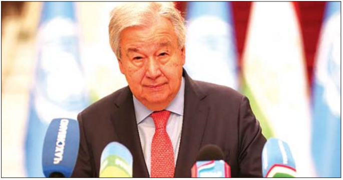
ကုလသမဂ္ဂအတွင်းရေးမှူးချုပ် အန်တိုနီယို ဂုတာရက်စ်။