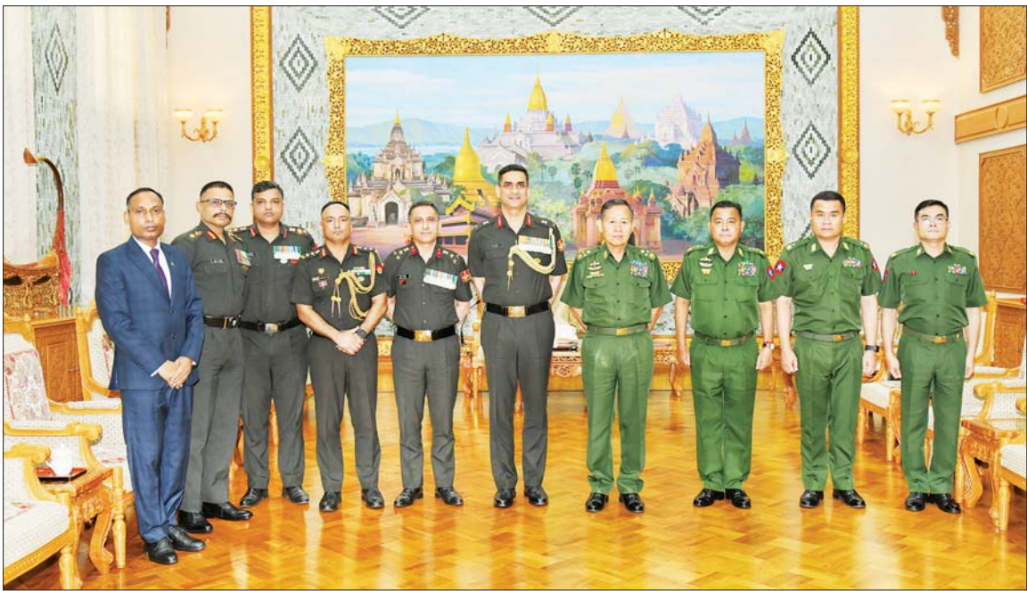
နိုင်ငံတော်စီမံအုပ်ချုပ်ရေးကောင်စီ ဒုတိယဥက္ကဋ္ဌ ဒုတိယတပ်မတော်ကာကွယ်ရေးဦးစီးချုပ် ကာကွယ်ရေးဦးစီးချုပ်(ကြည်း) ဒုတိယဗိုလ်ချုပ်မှူးကြီး စိုးဝင်း နှင့် အဖွဲ့ဝင်များ အိန္ဒိယတပ်မတော်ကာကွယ်ရေးဆိုင်ရာ ထောက်လှမ်းရေး ညွှန်ကြားရေးမှူးချုပ် ဒုတိယစစ်ဦးစီးချုပ်(ထောက်လှမ်းရေး) Lieutenant General Shrinjay Pratap Singh, AVSM, YSM ဦးဆောင်သော ကိုယ်စားလှယ်အဖွဲ့နှင့်အတူ စုပေါင်းမှတ်တမ်းတင် ဓာတ်ပုံရိုက်စဉ်။

ရင်းနှီးပွင့်လင်းစွာဆွေးနွေး ထိုသို့တွေ့ဆုံရာတွင် နှစ်နိုင်ငံ နှင့် နှစ်နိုင်ငံ တပ်မတော်နှစ်ရပ် အကြား ချစ်ကြည်ရင်းနှီးမှုနှင့် ပူးပေါင်း ဆောင်ရွက်မှုများကို ဆက်လက်တိုးမြှင့်ဆောင်ရွက်နိုင် မည့်ကိစ္စရပ်များ၊ မြန်မာနိုင်ငံတွင် မန္တလေးလူကြီးဖြစ်ပေါ်ကြတော့ ခဲ့ချိန်၌ အိန္ဒိယနိုင်ငံမှ ကူညီ ကယ်ဆယ်ရေးအဖွဲ့များ၊ လူသား ချင်း စာနာထောက်ထားမှုဆိုင်ရာ အကူအညီများအချိန်နှင့်တစ်ပြေးညီ ကူညီပေးအပ်ခဲ့မှုနှင့် ပြန်လည် ထူထောင်ရေးဆိုင်ရာ များတွင် လည်း ဆက်လက်ကူညီပေးသွား မည့်ကိစ္စရပ်များ၊ နှစ်နိုင်ငံနယ်စပ် ဒေသ တည်ငြိမ်အေးချမ်းရေး၊ တရားဥပဒေစိုးမိုးရေး၊ လုံခြုံရေး နှင့် ဖွံ့ဖြိုးတိုးတက်ရေးအတွက် ပူးပေါင်း ဆောင်ရွက်သွားမည့် ကိစ္စရပ်များ၊ မြန်မာနိုင်ငံတွင် လွတ်လပ်၍ တရားမျှတသည့်