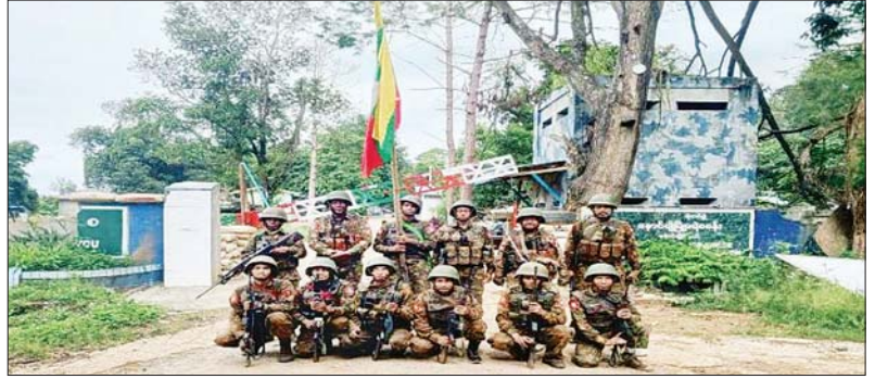
နောင်ချိုမြို့ရစခန်းအား သိမ်းပိုက်ရရှိမှုမှတ်တမ်းဓာတ်ပုံ။