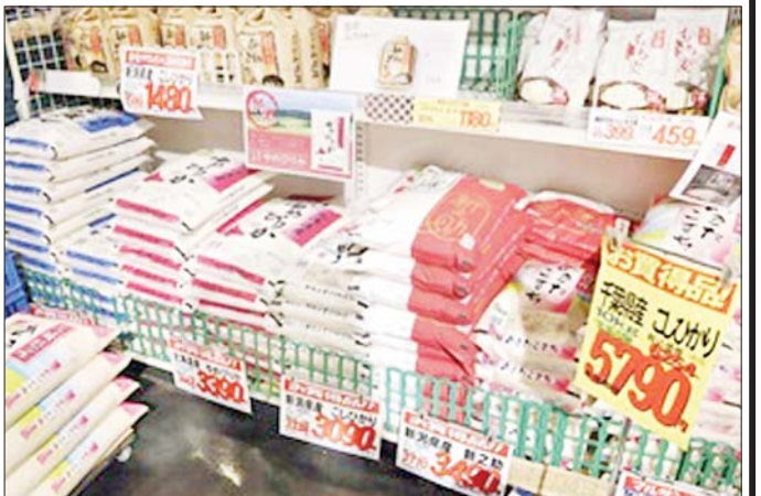
ဂျပန်နိုင်ငံတွင် ဆန်ဈေးနှုန်းများ မြင့်တက်မှုကြောင့် ပြည်သူလူထု၏ အယ်လီဒီပီပါတီအပေါ် ထောက်ခံမှု နှုန်းထား ကျဆင်းခဲ့ရသည်။

ပယ်ဖျက်ပေးသွားမှာဖြစ်သလို ဓာတ်ဆီ၊ ဒီဇယ်ဆီတွေအပေါ်မှာ ကောက်ခံနေတဲ့ အခွန်တွေကိုလည်း လျှော့ချပေးသွားမယ်လို့ ပြောကြားထားပါတယ်။ ဝန်ကြီးချုပ် ရိုဂဲရအိုရီဘာတော့ နိုင်ငံရဲ့ စီးပွားရေး ပြန်လည်အားကောင်းလာစေရေးဟာ သူ့အဓိက အလေးပေးဆောင်ရွက်သွားမယ့်ကိစ္စလို့ ပြောကြားထားပေမယ့် စားသုံးခွန်တွေ ပယ်ဖျက်ပေးရေးကိုတော့ လုံးဝငြင်းဆိုထားပါတယ်။ သူက တော့လူတစ်ဦးချင်းစီတိုင်းကို ငွေသားထောက်ပံ့ပေးသွားရေးဟာ ပိုမိုထိရောက်ပြီး အချိန်တိုအတွင်းမှာ ဆောင်ရွက်ပေးသွားနိုင်တဲ့ကိစ္စဖြစ်တယ်လို့ ပြောကြားထားပါတယ်။ ရွေးကောက်ပွဲနှင့် အဓိကနိုင်ငံရေးပါတီများ အထက်လွှတ်တော်အမတ်တစ်ဦးရဲ့ သက်တမ်းဟာ ခြောက်နှစ်ဖြစ်ပါတယ်။ အောက်လွှတ်တော်ကိုတော့ ဝန်ကြီးချုပ်ဟာ အချိန်မရွေးဖျက်သိမ်းနိုင်ပေမယ့် အထက်လွှတ်တော်ကိုတော့ ဖျက်သိမ်းနိုင်ခြင်း မရှိပါဘူး။ အမတ်ဦးရေ ၂၄၈ ဦးရဲ့ ထက်ဝက်ဖြစ်တဲ့ ၁၂၄ ဦးအတွက် သုံးနှစ်တစ်ကြိမ်ရွေးကောက်ပွဲတွေ ကျင်းပပြုလုပ်ပါတယ်။ အခုလအထိ ရွေးကောက်ပွဲမှာ လစ်လပ်ကိုယ်စားလှယ်တစ်ဦး