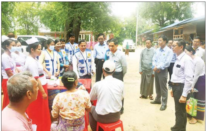
ပြည်ထောင်စုဝန်ကြီး ဦးကိုကိုလှိုင်နှင့် အဖွဲ့ဝင်များ ညောင်ပင်သာကျေးရွာအတွင်း တပ်ကုန်းမြို့ ခုတင် (၁၀၀)ဆံ့ ပြည်သူ့ဆေးရုံမှ အထူးကုဆရာဝန်များက ကျန်းမာရေးစောင့်ရှောက်မှုလုပ်ငန်းများ ကွင်းဆင်း ဆောင်ရွက်ပေးနေမှုအခြေအနေကို ကြည့်ရှုစစ်ဆေးစဉ်။

ထိုနောက် ပြည်ထောင်စုဝန်ကြီးက ညောင်ပင်သာ ကျေးရွာမှ ရပ်မိရပ်ဖတစ်ဦးအား MRTV DTH