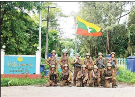
နောင်ချိုမြို့၊ ပြည်သူ့ဆေးရုံအား သိမ်းပိုက်ရရှိမှုမှတ်တမ်းဓာတ်ပုံ။