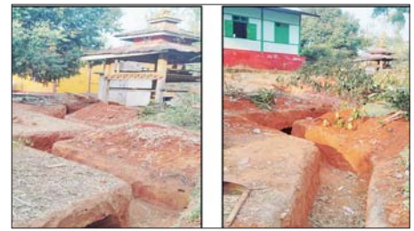
နောင်ချိုမြို့နယ် မန်မော်ဘုရားကုန်းတွင် အကြမ်းဖက်သောင်းကျန်းသူများက ခဲစစ်ပြုလုပ်ထားရှိမှု မှတ်တမ်းဓာတ်ပုံ။

စာမျက်နှာ ၁၂ မှ သောင်းကျန်းသူများ ယာယီခံစစ်စခန်း တည်ဆောက်ထားသည့်နေရာများကို အဆင့်ဆင့်လိုက်လံတိုက်ခိုက်ချေမှုန်းခဲ့ပြီး နောင်ချိုမြို့အား ပြန်လည်သိမ်းပိုက်ရရှိရေး စစ်ကြောင်းများခွဲ၍ 'ရဲရဲတက်၊ ရဲရဲတိုက်၊ ရဲရဲချေမှုန်း' တိုက်ခိုက်ခဲ့ရာ တောင်ခမ်း-ကံကြီး-နောင်ချိုလမ်းကြောင်းရှိ နမ့်ဆောင်ဟူးတစ်ဝိုက်အား ၂၀၂၅ ခုနှစ် ဇူလိုင် ၈ ရက်တွင် လည်းကောင်း၊ တောင်ခမ်း - ရွှေသွန်း - ဂုတ်ထိပ် - နောင်ချိုလမ်းကြောင်းရှိ ဂုတ်ထိပ်အနီးတစ်ဝိုက်အား ဇူလိုင် ၁၂ ရက်တွင် လည်းကောင်း၊ ပြင်ဦးလွင် - နောင်ချိုပြည်ထောင်စုလမ်းမကြီးတစ်လျှောက်ရှိ အမွှေးသီးလမ်းခွဲမှ အမွှေးခါး ကျေးရွာအထိအား ဇူလိုင် ၂၅ ရက်တွင်လည်းကောင်း၊ ကျောက်ကြမ်းနေရာတစ်ဝိုက်အား ဇူလိုင် ၁၅ ရက်တွင် လည်းကောင်း တိုက်ပွဲများပြင်းထန်စွာ ဖြစ်ပွားခဲ့ပြီး အောင်မြင်စွာပြန်လည်ထိန်းချုပ်နိုင်ခဲ့သည်။