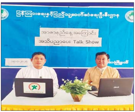
စာရေးဆရာအသင်းမှ ဥက္ကဋ္ဌ စာရေးဆရာ ငွေစိုး(ရှေ့ကြည့်နေခြင်း) က "၁၉၄၇ ခုနှစ် ဇူလိုင် ၁၉ ရက်၊ စနေနေ့ဆိုရင် အကြမ်းဖက်သမား များရဲ့ လက်ချက်နဲ့ အမျိုးသား ခေါင်းဆောင်ကြီး ဝိလ်ချပ် အောင်ဆန်းနဲ့တကွ တိုင်းပြည် ခေါင်းဆောင်တွေ နိုင်ငံအတွက် အသက်စွန့်လွှတ်ခဲ့ရတဲ့ ဝမ်းနည်း ဖွယ်နေ့တစ်နေ့ ဖြစ်ပါတယ်။ တိုင်းပြည်အတွက် ပြန်လည် မရနိုင်တော့တဲ့ အစားထိုးမရတဲ့

ရန်ကုန် ဇူလိုင် ၁၆ ရန်ကုန်တိုင်းဒေသကြီး မင်္ဂလာဒုံ မြို့နယ် လူထုအခြေပြုဗဟိုဌာန တွင် မြို့နယ်ပြန်ကြားရေးနှင့် ပြည်သူ့ဆက်ဆံရေး ဦးစီးဌာနနှင့် မြို့နယ် စာရေးဆရာအသင်းတို့ ပူးပေါင်း၍ အာဇာနည်နေ့ အကြောင်း အသိပညာပေး Talk Show ဆွေးနွေးပွဲကို ယမန်နေ့က ပြုလုပ်သည်။