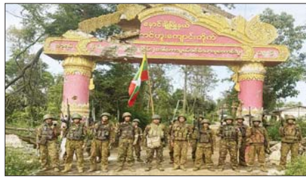
နမ့်ဆောင်ဟူးကျောင်းတိုက်အား သိမ်းပိုက်ရရှိခဲ့သည့် မှတ်တမ်းဓာတ်ပုံ။