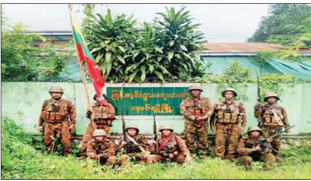
နောင်ချိုမြို့ မြန်မာ့စီးပွားရေးဘဏ်အား သိမ်းပိုက်ရရှိမှု မှတ်တမ်းဓာတ်ပုံ။