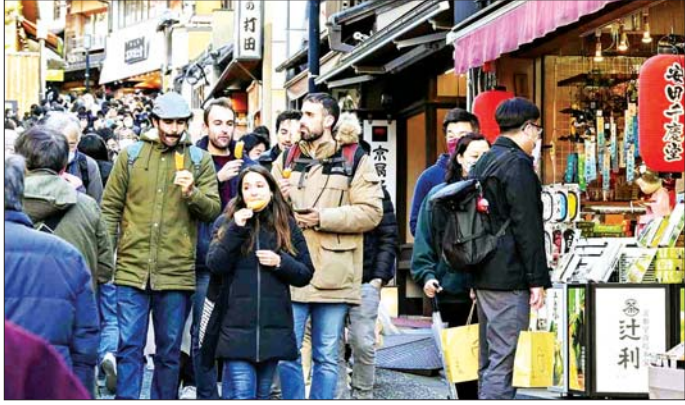
ကျိုတိုမြို့၌ လာရောက်လည်ပတ်သည့်နိုင်ငံခြားသားခရီးသွားများကို တွေ့ရစဉ်။