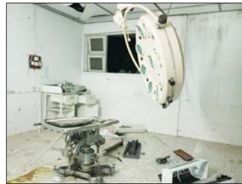
အကြမ်းဖက်သောင်းကျန်းသူများက နောင်ချိုမြို့၊ ပြည်သူ့ဆေးရုံခွဲစိတ်ခန်းအတွင်းရှိ ပစ္စည်းများအား ဖျက်ဆီးထားရှိမှု။