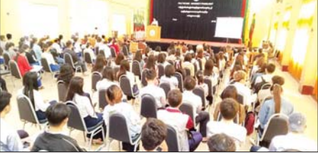
လွိုင်လင်မြို့၌ ယာဉ်စဉ်ကမ်း၊ လမ်းစဉ်ကမ်းဆိုင်ရာ အသိပညာပေးဟောပြော လွိုင်လင် ဇူလိုင် ၁၆ ရှမ်းပြည်နယ်(တောင်ပိုင်း) လွိုင်လင်မြို့ရှိ Polytechnic University (Pang Long ) ဘွဲ့နှင်းသဘင်ခန်းမ၌ ယနေ့နံနက်ပိုင်းက ယာဉ် စဉ်ကမ်း၊ လမ်းစဉ်ကမ်း၊ လူကုန်ကူးမှု တားဆီးကာကွယ်ရေးနှင့် လူကုန်ကူးခံရသူများအား အကာအကွယ်ပေးရေးဆိုင်ရာ အသိပညာပေး ဟောပြောပွဲကျင်းပသည်။

ဆုံးရှုံးမှုကြီးဖြစ်တယ်။ မြန်မာ နိုင်ငံသမိုင်းမှာ သင်ခန်းစာ ယူစရာတွေ ဖြစ်ပါတယ်။ ဝိလ်ချပ် အောင်ဆန်းဟာ အာရှမှာ ထင်ရှား တဲ့ ခေါင်းဆောင်ကြီးတစ်ဦးဖြစ် တယ်။ ခေတ်ပြိုင် အိန္ဒိယမှာ ဂန္တီ နေရူး၊ ဗီယက်နမ်မှာ ဟိုချီမင်း၊ စင်ကာပူမှာဆို လီကွမ်ယု စတဲ့ ခေါင်းဆောင်တွေ ရှိခဲ့ကြတယ်။ အဲဒီ နိုင်ငံခေါင်းဆောင်တွေဟာ သူတို့နိုင်ငံအတွက် ကောင်းကျိုး တွေပြုခဲ့သလို ဝိလ်ချပ် အောင်ဆန်းဟာ မြန်မာနိုင်ငံရဲ့ လွတ်လပ်ရေးအတွက်ကောင်းကျိုး တွေ အများဆုံးပြုခဲ့ပါတယ်။ အာဇာနည်တွေကို ရုတ်ပြုတဲ့ နေရာမှာ ရုတ်ပြုတတ်ဖို့သလို နိုင်ငံအတွက် ချမှတ်ခဲ့တဲ့ လမ်းစဉ် တွေအတိုင်း လိုက်နာကြဖို့ လိုပါ တယ်" ဟု ထည့်သွင်းဆွေးနွေးခဲ့ သည်။