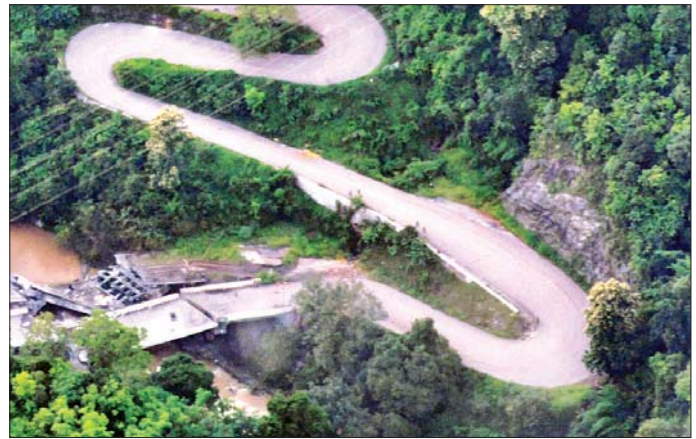
ဂုတ်တွင်းတံတားအား အကြမ်းဖက်သောင်းကျန်းသူများက မိုင်းထောင်ဖောက်ခွဲဖျက်ဆီးခဲ့သည့် မှတ်တမ်းဓာတ်ပုံ။

တိုက်ပွဲကာလများမတိုင်မီ နိုင်ငံရေးခံလူချက်မတူညီမှုကြောင့် တပ်မတော်အား မထောက်ခံသူလူနည်းစုဖြစ်သော အရပ်သားပြည်သူအချို့နှင့် နေအိမ်၊ ဥစ္စာပစ္စည်းများကို စွန့်ခွာတိမ်းရှောင်နေရသည့် ဒေသခံပြည်သူများသည် ၎င်းတို့ TNLA အဖွဲ့နှင့် PDF အမည်ခံအကြမ်းဖက်အဖွဲ့များ၏ လက်အောက်သို့ ရောက်ရှိလျားပါက အခြေခံလူ့အခွင့်အရေး ဆုံးရှုံးမှုများ၊ စီးပွားရေး၊ လူမှုရေး၊ ကျန်းမာရေး၊ ပညာရေး စသည့်အဘက်ဘက်မှ နိမ့်ကျသွားနိုင်သည်ကို လက်တွေ့သဘောပေါက်နားလည်လာသည့်အတွက် တပ်မတော်အား စိတ်အားထက်သန်စွာ အားပေးထောက်ခံလာ ကြပြီး မြေပြင်သတင်းရရှိမှုများအား နီးစပ်ရာတပ်မတော်စစ်ကြောင်းများထံသို့ သတင်းပေးပို့ခြင်း၊ တပ်မတော်နှင့်အတူ ပူးပေါင်းဆောင်ရွက်ခြင်းများ ပြုလုပ်လာခဲ့သည်။ TNLA အဖွဲ့နှင့် PDF အမည်ခံအကြမ်းဖက်အဖွဲ့များအနေဖြင့် နောင်ချိုမြို့နှင့် ၎င်းဒေသအား ယာယီသိမ်းပိုက်ထိန်းချုပ်ထားစဉ် မြို့/ရွာများအတွင်းရှိ ဘာသာရေးဆိုင်ရာအဆောက်အအုံများ၊ စာသင်ကျောင်းများ၊ ဌာနဆိုင်ရာအဆောက်အအုံများ၊ ဆေးရုံများနှင့် လူနေအိမ်များတွင် ဘန်ကာများဆောက်လုပ်ပြီး တပ်မတော်စစ်ကြောင်းများအား ဝစ်ခတ်တိုက်ခိုက်ခြင်း၊ ဒေသခံပြည်သူများ၏ အိုးအိမ်များကို ခံစစ်တံတိုင်းအဖြစ် အကာအကွယ်ရယူ၍ ပစ်ခတ်တိုက်ခိုက်ခြင်းများကို လုပ်ဆောင်ခဲ့သည့်အပြင် ဒေသခံပြည်သူများ နေအိမ်များနှင့် ဈေးဆိုင်ခန်းများအား ဖောက်ထွင်း၍ တန်ဖိုးကြီးပစ္စည်းများ၊ စားသောက်ကုန်နှင့် အသုံးအဆောင်ပစ္စည်းများကို အဓမ္မ