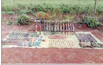
ရန်သူထံမှ သိမ်းဆည်းရရှိသည့် လက်နက်ခဲယမ်းများနှင့်ဆက်စပ်ပစ္စည်းများ။