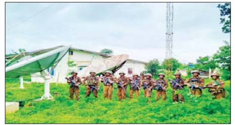
နောင်ချိုမြို့ရှိ ရုပ်/သံ ထပ်ဆင့်လွှင့်စက်ရုံအား သိမ်းပိုက်ရရှိမှုမှတ်တမ်းဓာတ်ပုံ။