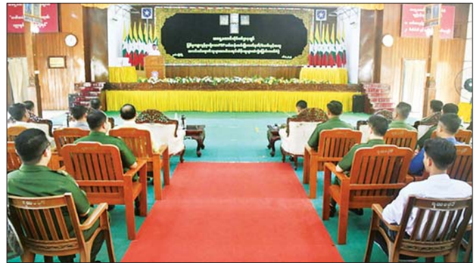
အတွင်း ပြန်လည်ဝင်ရောက်လျက်ရှိကြသဖြင့် အုပ်ထိန်းသူများထံသို့ လွှဲပြောင်းအပ်နှံပေးလျက် သက်ဆိုင်ရာတာဝန်ရှိသူများက ၎င်းတို့၏ မိဘ ရှိကြောင်း သတင်းရရှိသည်။ သတင်းစဉ်

ပတ်သက်သည့်များကို အသိပညာပေးပြောကြား သည်။ ထို့နောက် ဥပဒေဘောင်အတွင်း ပြန်လည် ဝင်ရောက်ခဲ့သည့် PDF အမည်ခံအဖွဲ့ဝင် အမျိုးသား ငါးဦးတို့ကို တာဝန်ရှိသူများက ဝန်ခံကတိလက်မှတ် ရေးထိုးစေပြီး ၎င်းတို့၏ မိဘအုပ်ထိန်းသူများထံသို့ လွှဲပြောင်းအပ်နှံကာ ထောက်ပံ့ငွေများနှင့်စားသောက် ဖွယ်ရာများ ပေးအပ်သည်။