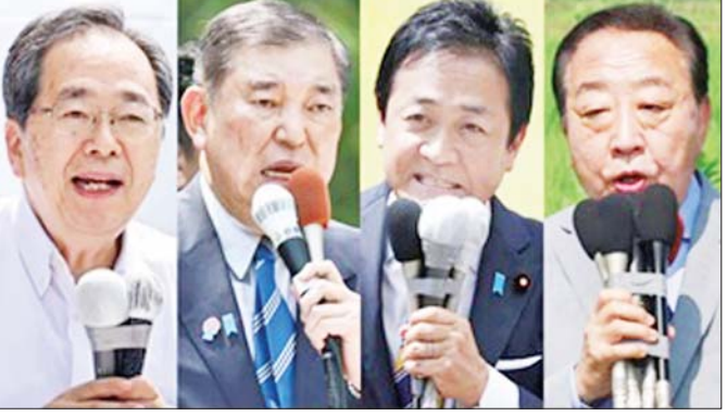
ကိုမေးတိုးပါတီဥက္ကဋ္ဌ Tetsuo Saito၊ အယ်လီဒီပီပါတီဥက္ကဋ္ဌ Shigeru Ishiba၊ DPP ပါတီခေါင်းဆောင် Yuichiro Tamaki၊ CDP ပါတီခေါင်းဆောင် Yoshihiko Noda။