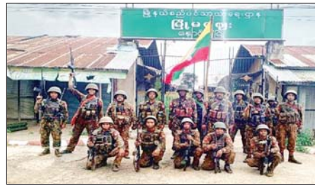
နောင်ချိုမြို့မဈေးအား သိမ်းပိုက်ရရှိမှုမှတ်တမ်းဓာတ်ပုံ။