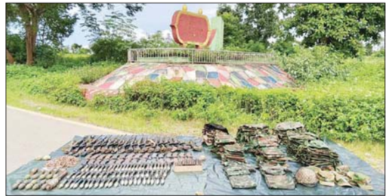
အကြမ်းဖက်သောင်းကျန်းသူများထံမှ သိမ်းဆည်းရရှိသည့် လက်နက်၊ ခဲယမ်းများနှင့် ဆက်စပ်ပစ္စည်းများ မှတ်တမ်းဓာတ်ပုံ။

ကျောပိုးမှ လမ်းပန်းဆက်သွယ်ရေး ကောင်းမွန်သည့် မြို့တစ်မြို့ ဖြစ်သည်။ ထို့ပြင် တရုတ်-မြန်မာ နယ်စပ်စီးပွားရေး ၏ အဓိကလမ်းမကြီးဖြစ်သော မန္တလေး - မူဆယ် လမ်းမကြီး (အမှတ် ၁၄ အာရှ လမ်းမကြီး) သည် နောင်ချိုမြို့နယ်အတွင်း အနောက်မှ အရှေ့သို့ ဖြတ်သန်းပြီး ပြင်ဦးလွင်-မန္တလေးမှတစ်ဆင့် မြန်မာ နိုင်ငံတစ်ဝန်းရှိ အခြားမြို့ရွာများနှင့် ကျောက်မဲမြို့ မှတစ်ဆင့် ရှမ်းပြည်နယ်(မြောက်ပိုင်း)ရှိ မြို့ရွာများသို့ လည်း ဆက်သွယ်သွားလာနိုင်သည့်မြို့ဖြစ်သည်။ ရှမ်း၊ ဓနုနှင့် ဗမာလူမျိုးများ အများဆုံးနေထိုင်ကြ ကာ ဗုဒ္ဓဘာသာကို အဓိက ကိုးကွယ်ကြပြီး ဘာသာ တရားအဆုံးအမနှင့်အညီ အေးချမ်းပျော်ရွှင်စွာ နေထိုင်လျက်ရှိကြသည်။ စိုက်ပျိုးရေးလုပ်ငန်းသည် နောင်ချိုမြို့၏ အဓိက စီးပွားရေးလုပ်ငန်းဖြစ်ပြီး မွေးမြူရေး၊ ဓာတ်သတ္တု၊ ကုန်ထုတ်လုပ်ငန်း၊ ဝန်ဆောင် မှုလုပ်ငန်း၊ ခရီးသွားလုပ်ငန်း၊ သယ်ယူပို့ဆောင်ရေးနှင့် ကုန်သွယ်ရေးလုပ်ငန်းများကိုလည်း လုပ်ကိုင်ကြ သည်။ ရေတံခွန်များ၊ ထုံးကျောက်ဂူများ၊ တောင်တောင် ရွာခင်းအလှများ၊ မတူကွဲပြားသော လူမျိုးစုများ၊ သမိုင်းဝင်နေရာများစွာရှိနေသော နောင်ချိုမြို့နယ် သည် လမ်းပန်းဆက်သွယ်ရေးကောင်းမွန်မှု၊ ခရီးသွား များ စွာဝင်ရောက်မှုနှင့်အတူ ခရီးသွားလုပ်ငန်း ကဏ္ဍဖွံ့ဖြိုးတိုးတက်လာပြီး ဒေသခံများ၏ လူမှု စီးပွားလည်း တိုးတက်စည်ပင်သာယာသည့် အေးချမ်း သည့် မြို့တစ်မြို့ ဖြစ်သည်။ ထိုသို့ အေးချမ်းသာယာပြီး တိုးတက်မှုအဟုန် မြင့်မားနေသည့် နောင်ချိုမြို့သို့ TNLA အဖွဲ့နှင့် PDF အမည်ခံ အကြမ်းဖက်သောင်းကျန်းသူများသည်