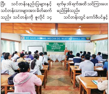
ရက်မှ ၁၆ ရက်အထိ သင်ကြားပေး မည်ဖြစ်သည်။ သင်တန်းတွင် ကော်ဖီပင်နှင့်