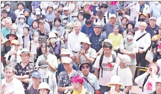
အထက်လွှတ်တော်ရွေးကောက်ပွဲတွင် ပါဝင်ယှဉ်ပြိုင်ကြမည့် ကိုယ်စားလှယ်လောင်းများ၏ မဲဆွယ်စည်းရုံးဟောပြောမှုအား ပြည်သူများ နားထောင်နေစဉ်။

ဂျပန်ကနေ အမေရိကန်ကို တင်ပို့နေတဲ့ ကုန်ပစ္စည်းတွေရဲ့ ၃၀ ရာခိုင်နှုန်းဟာ မော်တော်ကား