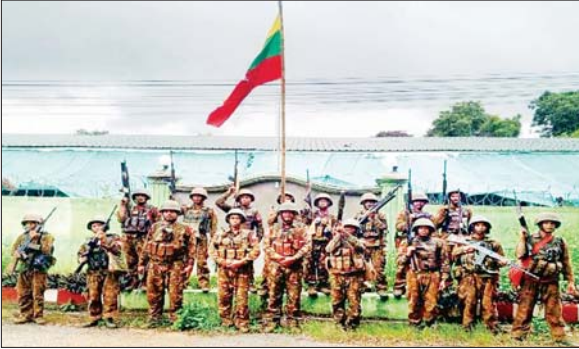
နောင်ချိုမြို့နယ် စီမံအုပ်ချုပ်ရေးအဖွဲ့ရုံးအား သိမ်းပိုက်ရရှိမှုမှတ်တမ်းဓာတ်ပုံ။