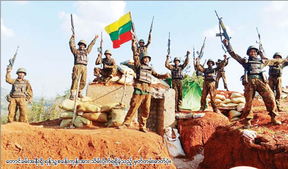
တောင်ခမ်းအနီးရှိ ရန်သူ့စခန်းကုန်းအား သိမ်းပိုက်ရရှိခဲ့သည့် မှတ်တမ်းဓာတ်ပုံ။