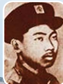
ရဲဘော်ကိုထွေး

အာဇာနည်ခေါင်းဆောင်ကြီးများကို ဦးညွှတ်အလေးပြုပါ၏။