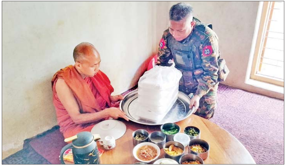
သံဃာတော်များအား စားသောက်ဖွယ်ရာများ ဆက်ကပ်လှူဒါန်းစဉ်။