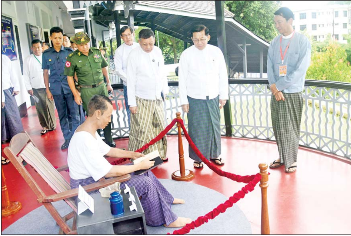
နိုင်ငံတော်စီမံအုပ်ချုပ်ရေးကောင်စီဥက္ကဋ္ဌ နိုင်ငံတော်ဝန်ကြီးချုပ် ဗိုလ်ချုပ်မှူးကြီးမင်းအောင်လှိုင် ဗိုလ်ချုပ်အောင်ဆန်းပြတိုက်(ရန်ကုန်)တွင် ပြင်ဆင်ခင်းကျင်းပြသထားရှိမှုများကို ကြည့်ရှုစစ်ဆေးစဉ်။

ဦးစွာ နိုင်ငံတော်စီမံအုပ်ချုပ်ရေးကောင်စီဥက္ကဋ္ဌ နိုင်ငံတော်ဝန်ကြီးချုပ်သည် ဗဟန်းမြို့နယ်ရှိဗိုလ်ချုပ်အောင်ဆန်းပြတိုက်(ရန်ကုန်)သို့ရောက်ရှိပြီး ဗိုလ်ချုပ်အောင်ဆန်းစီးနင်းခဲ့သည့် မော်တော်ယာဉ်နှင့် မှတ်တမ်းဓာတ်ပုံများပြခန်း၊ ပန်းခြံ၊ ဗိုလ်ချုပ်အောင်ဆန်း၏ ပုံတူ၊ ဗိုလ်ချုပ်၏ ငယ်ဘဝ၊ တက္ကသိုလ်ကျောင်းသားဘဝ၊ နိုင်ငံရေး လောကဘဝ၊ တပ်မတော်ခေါင်းဆောင်ဘဝ၊ နိုင်ငံခေါင်းဆောင်ဘဝ၊ မိသားစုဘဝမှတ်တမ်းများနှင့် မှတ်တမ်းဓာတ်ပုံများ၊ အသုံးပြုခဲ့သည့် အသုံးအဆောင်ပစ္စည်းများ၊ ဗိုလ်ချုပ်အောင်ဆန်းပြတိုက်၏ နောက်ခံသမိုင်းအကျဉ်း၊ ဧည့်ခန်း၊ အိပ်ခန်း၊ ဘုရားခန်း၊ စာကြည့်တိုက်နှင့် အထူးအစည်းအဝေးခန်းများအတွင်း ခင်းကျင်းပြသထားသည့် ဗိုလ်ချုပ်အောင်ဆန်းအသုံးပြုခဲ့သော အဝတ်အထည်များနှင့် အသုံးအဆောင်ပစ္စည်းများ၊ ပန်းချီကားများ၊ ဓာတ်ပုံများနှင့် ပရိဘောဂပစ္စည်းများ၊ ဗိုလ်ချုပ်အောင်ဆန်း ဖတ်ရှုလေ့လာခဲ့သည့် စာအုပ်များနှင့် ဗိုလ်ချုပ်၏သမိုင်းမှတ်တမ်းများအား ရေးသားထားသော