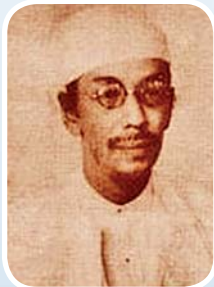
ဒီးဒုတ်ဦးဘချို