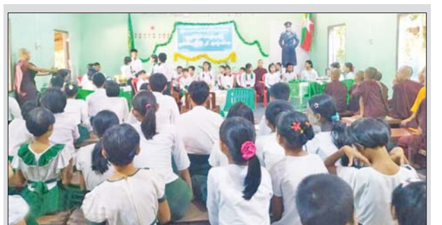
ပဲခူးမြို့ ရွှေဂူကြီးတောရဟန်းတော်ကြီးသင်မူလွန်ကျောင်း အလင်းစစ်ခန်းမ၌ ဇူလိုင် ၁၈ ရက်တွင် (၇၈)နှစ်မြောက် အာဇာနည်နေ့ အထိမ်းအမှတ် ဉာဏ်စမ်းပဟေဠိပြိုင်ပွဲကျင်းပစဉ်။