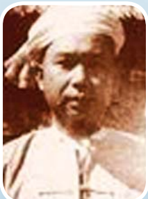
စဝ်စံထွန်း