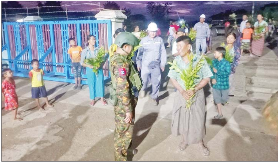
တပ်မတော်သားများနှင့် ဌာနဆိုင်ရာဝန်ထမ်းများအား ပြည်သူများက ကြိုဆိုနှုတ်ဆက်ကြစဉ်။