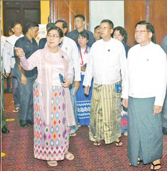
နိုင်ငံတော်စီမံအုပ်ချုပ်ရေးကောင်စီဥက္ကဋ္ဌ နိုင်ငံတော်ဝန်ကြီးချုပ် ဗိုလ်ချုပ်မှူးကြီးမင်းအောင်လှိုင် ဝန်ကြီးများရုံး(အတွင်းဝန်ရုံး)တွင် ပြင်ဆင်ခင်းကျင်းပြသထားရှိမှုများကို ကြည့်ရှုစစ်ဆေးစဉ်။