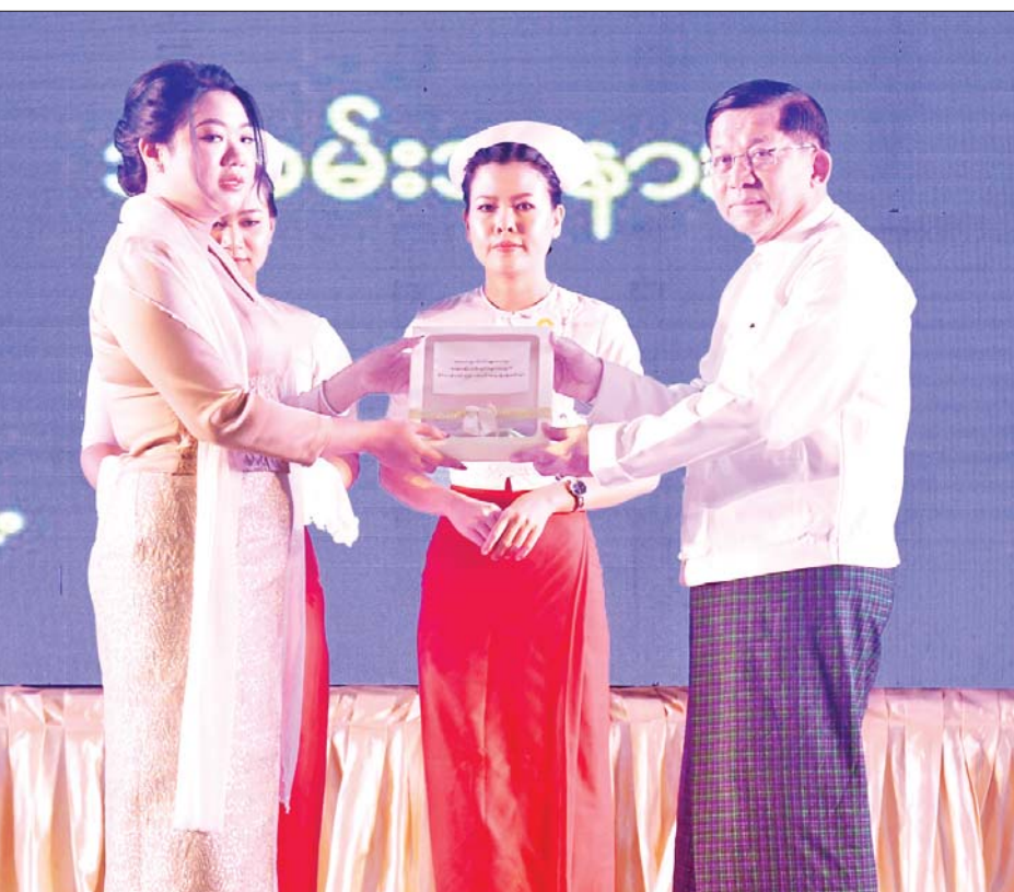
နိုင်ငံတော်စီမံအုပ်ချုပ်ရေးကောင်စီဥက္ကဋ္ဌ နိုင်ငံတော်ဝန်ကြီးချုပ် ဗိုလ်ချုပ်မှူးကြီးမင်းအောင်လှိုင် ဆေးတက္ကသိုလ်(မန္တလေး)မှ ဆရာဝန်(သစ်လွင်)များအတွက် နိုင်ငံ့ဝန်ထမ်းပြန်တမ်းဝင်အရာရှိ ခန့်အပ်လွှာများကို ကိုယ်စားလှယ်တစ်ဦးအား ပေးအပ်စဉ်။

ထို့နောက် နိုင်ငံတော်စီမံအုပ်ချုပ်ရေးကောင်စီဥက္ကဋ္ဌ နိုင်ငံတော်ဝန်ကြီးချုပ်က အမှာစကားပြောကြားရာတွင် နိုင်ငံတော်အနေဖြင့် တိုင်းရင်းသားပြည်သူများ၏ ကျန်းမာရေးအဆင့်အတန်း တိုးတက်မြှင့်တင်ရေးအတွက် စဉ်ဆက်မပြတ်အားပေးလျက်ရှိပြီး ကျန်းမာမှုအလုပ်လုပ်နိုင်မည်၊ ကျန်းမာမှုပညာသင်ကြားနိုင်မည်ကို အားလုံးနားလည်ကြမည်ဖြစ်ကြောင်း၊ ကျန်းမာရေးအတွက် အဓိကလိုအပ်သည်မှာ ကာယကံရှင်လူသားများ၏ နေထိုင်စားသောက်မှုနှင့် ကျန်းမာရေးအသိရှိမှုပေါ်တွင် မူတည်သကဲ့သို့ လူသားတို့သည် သွေးနှင့်သားနှင့် ပတ်ဝန်းကျင်နှင့် နေထိုင်ကြရမည်ဖြစ်သည့်အတွက် ကျန်းမာရေး