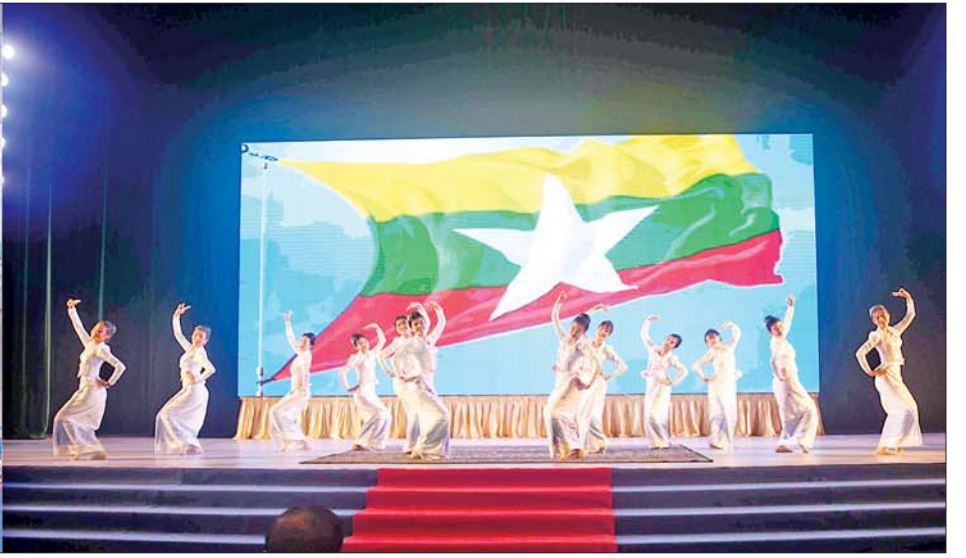
နိုင်ငံတော်စီမံအုပ်ချုပ်ရေးကောင်စီဥက္ကဋ္ဌ နိုင်ငံတော်ဝန်ကြီးချုပ် ဗိုလ်ချုပ်မှူးကြီးမင်းအောင်လှိုင်နှင့် အခမ်းအနားတက်ရောက်လာကြသူများ ဆေးတက္ကသိုလ်-၁(ရန်ကုန်) ကျောင်းသူများက “မင်္ဂလာပါ” တေးသရုပ်ဖော်သီချင်းဖြင့် ဖျော်ဖြေတင်ဆက်မှုကို ကြည့်ရှုအားပေးစဉ်။