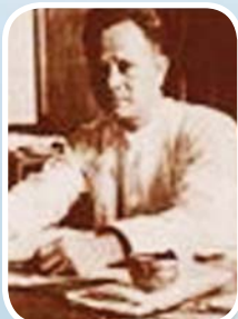
မန်းဘိုင်