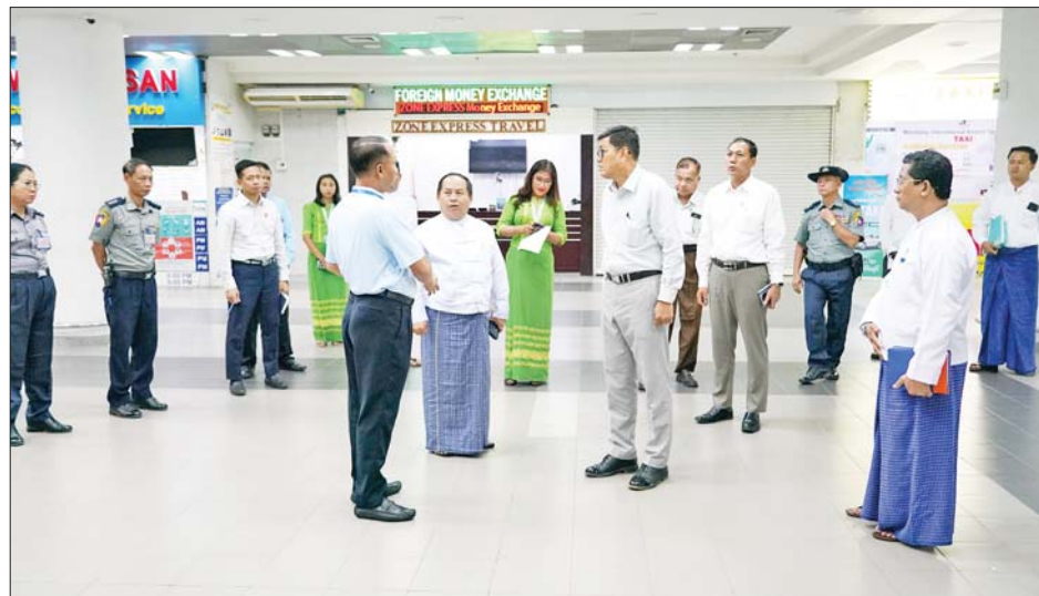
ညွှန်ကြားမှုဦးစီးဌာန Information Center သို့ သွားရောက်၍ မန္တလေးဟိုတယ်ဆိုင်ရာလုပ်ငန်းရှင်များအသင်းနှင့် တွေ့ဆုံသည်။ တွေ့ဆုံစဉ် ပြည်ထောင်စုဝန်ကြီးက ငလျင်ကြောင့် ထိခိုက်ပျက်စီးခဲ့မှုများအနက် အပြာရောင်အဆင့်ရှိ အဆောက်အအုံများ၊ အခန်းများအား အမြန်ဆုံးပြုပြင်မွမ်းမံပြီး ခရီးသွားဧည့်သည်များ

နေပြည်တော် ဇူလိုင် ၁၈ ဟိုတယ်နှင့် ခရီးသွားလာရေးဝန်ကြီးဌာန ပြည်ထောင်စုဝန်ကြီး ဦးကျော်စိုးဝင်းသည် ယနေ့ နံနက်ပိုင်းတွင် တာဝန်ရှိသူများနှင့်အတူ မန္တလေး အပြည်ပြည်ဆိုင်ရာလေဆိပ်ရှိ ဝန်ကြီးဌာန၏ သတင်းပြန်ကြားရေးကောင်တာသို့ သွားရောက်ပြီး ပြည်တွင်းပြည်ပ ခရီးသွားဧည့်သည်များ ခရီးစဉ်ဒေသများသို့ အဆင်ပြေချောမွေ့စွာ သွားရောက်လည်ပတ်နိုင်ရေးအတွက် ဝန်ဆောင်မှုပေးနိုင်ရေး ပြင်ဆင်ဆောင်ရွက်ထားရှိမှု အခြေအနေကို ကြည့်ရှုစစ်ဆေးသည်။ ဦးစွာ ပြည်ထောင်စုဝန်ကြီးသည် ခရီးသွားဆိုင်ရာ သတင်းအချက်အလက်များ ပြည့်စုံစွာ ပြင်ဆင်ထားရှိရေး၊ ကောင်တာသို့ လာရောက်သော ခရီးသွားများကို စနစ်တကျ စစ်တမ်းကောက်ယူထားရှိရေး၊ ခရီးစဉ်ဒေသများ၊ လမ်းကြောင်းများနှင့်စပ်လျဉ်းသော အချက်အလက်များထားရှိရေး၊ ခရီးသွားများ သွားလာလည်ပတ်ရာတွင် အဆင်ပြေမှုရှိစေရန် ကူညီဆောင်ရွက်ပေးကြရေးတို့ကို တာဝန်ရှိသူများအား မှာကြားပြီး လေဆိပ်အတွင်း ပြည်တွင်း ပြည်ပ ခရီးသွားများ ဝင်/ထွက် သွားလာနေမှုကို လှည့်လည်ကြည့်ရှုသည်။ ထို့နောက် မရမ်းခြံ၊ ဟိုတယ်နှင့်ခရီးသွား