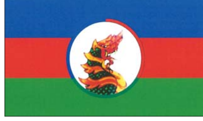
ပအိုဝ်းအမျိုးသားညီညွတ်ရေးပါတီ၏ တံဆိပ်ပုံစံ

၁။ ကရင်ပြည်နယ်၊ ဘားအံမြို့၊ ရတနာဒီပရပ်ကွက်၊ ကြာအင်းတောင်ပေါ်လမ်း၊ အိမ်အမှတ် [၉/၃၄(A)] တွင် ပါတီရုံးချုပ်တည်ရှိသော ပအိုဝ်းအမျိုးသားညီညွတ်ရေးပါတီက နိုင်ငံရေးပါတီများ မှတ်ပုံတင်ခြင်းဥပဒေ ပုဒ်မ ၅ အရ နိုင်ငံရေးပါတီအဖြစ် မှတ်ပုံတင်ခွင့်ပြုရန် ၁၅-၇-၂၀၂၅ ရက်နေ့တွင် လျှောက်ထားလာပါသည်။ ယင်းသို့ လျှောက်ထားရာတွင် ပါတီအမည်၊ အလံနှင့် တံဆိပ်တို့ကို ဖော်ပြပါအတိုင်း အသုံးပြုမည်ဖြစ်ကြောင်း တင်ပြလာပါသည်။ ၂။ ယင်းအဖွဲ့အစည်းက အသုံးပြုမည့် ပါတီအမည်၊ အလံနှင့် တံဆိပ်တို့ကို ကန့်ကွက်လိုက် ယခု ကြေညာသည့်နေ့မှစ၍ (၇) ရက်အတွင်း ခိုင်လုံသော အထောက်အထားများဖြင့် ပြည်ထောင်စုရွေးကောက်ပွဲကော်မရှင်သို့ ကန့်ကွက်နိုင်ပါကြောင်း နိုင်ငံရေးပါတီများမှတ်ပုံတင်ခြင်း နည်းဥပဒေ ၁၄ (ဃ) အရ အများသိစေရန် ကြေညာအပ်ပါသည်။ ပအိုဝ်းအမျိုးသားညီညွတ်ရေးပါတီ၏ အလံပုံစံ