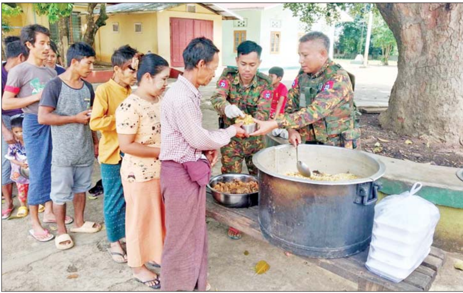
ပြည်သူများအား စားသောက်ဖွယ်ရာများ လှူဒါန်းနေမှုကို တွေ့ရစဉ်။

တပ်မတော်စစ်ကြောင်းများ အနေဖြင့် နောင်ချိုမြို့နယ်နှင့် ပတ်ဝန်းကျင်တစ်ဝိုက်ရှိ ယာယီ နေရပ်စွန့်ခွာ ဒေသခံတိုင်းရင်း သားပြည်သူများ ၎င်းတို့၏ မြို့/ ရွာများရှိ နေအိမ်များတွင် ပြန်လည် နေထိုင်နိုင်ရေး၊ အေးချမ်းပျော်ရွှင်စွာ လူမှုစီးပွား ဘဝအတွက် ရှာဖွေလုပ်ကိုင်စား သောက်နိုင်ရေးနှင့် အစိုးရအုပ်ချုပ် မှုယန္တရား ပြန်လည်လည်ပတ်နိုင် ရေးအတွက် အကြမ်းဖက်သောင်း ကျန်းသူများ ယာယီထိန်းချုပ် ထားစဉ် ဖျက်ဆီးသွားခဲ့သည့် ရုံး/ ဌာန အဆောက်အအုံများ၊ လူနေ အဆောက်အအုံများ၊ ဘာသာရေး၊ ပညာရေး၊ ကျန်းမာရေးဆိုင်ရာ အဆောက်အအုံများအား ပြန်လည် ပြုပြင်နိုင်ရေးအတွက် အကြမ်း ဖက်သမားများ ရက်စက်ယုတ်မာ စွာလုပ်ဆောင်ခဲ့သည့် မြေမြှုပ်မိုင်း အန္တရာယ်မှ ကင်းရှင်းစေရန် မြို့/ ရွာများအတွင်း မိုင်းရှင်းလင်းရေး လုပ်ငန်းများနှင့် လိုအပ်သော လုံခြုံရေးလုပ်ငန်းများကို ဆက် လက် ဆောင်ရွက်ပေးလျက်ရှိ သည်။ ထို့ပြင် ယနေ့တွင်လည်း ခရိုင် အုပ်ချုပ်ရေးမှူး ဦးကျော်ဆွေဝင်း ဦးဆောင်သည့် ဌာနဆိုင်ရာအဖွဲ့ ဝင် ၁၁၈ ဦးတို့သည် ဒေသခံ