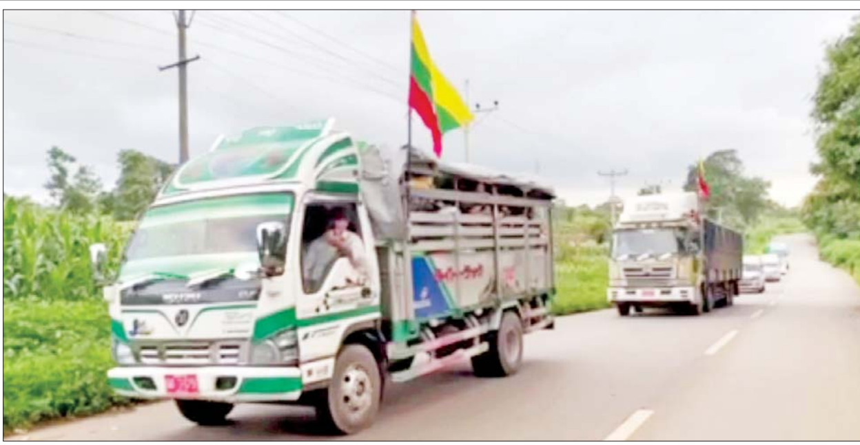
လူမှုဝန်ထမ်း၊ ကယ်ဆယ်ရေးနှင့်ပြန်လည်နေရာချထားရေးဝန်ကြီးဌာန၊ ရှမ်းပြည်နယ် အစိုးရအဖွဲ့၊ မန္တလေးတိုင်းဒေသကြီး အစိုးရအဖွဲ့နှင့် စေတနာရှင်ပြည်သူများက ထောက်ပံ့လှူဒါန်းသည့် စားသောက်ဖွယ်ရာများနှင့် အသုံးအဆောင်ပစ္စည်းများ တင်ဆောင်လာသည့်ယာဉ်များ နောင်ချိုမြို့သို့ ရောက်ရှိလာစဉ်။