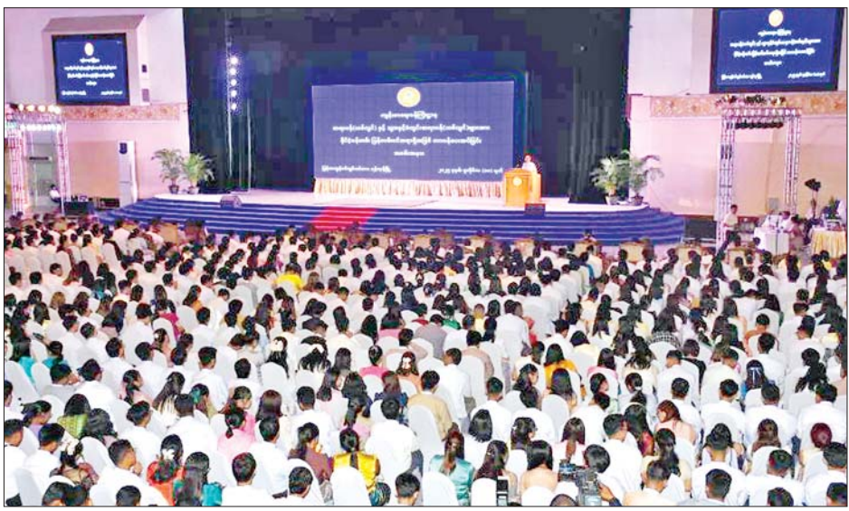
ခြင်း အခမ်းအနားတွင် (သစ်လွင်) ၁၂၅၉ ဦးနှင့် သွားနှင့် ပြန်တမ်းဝင် အရာရှိအဖြစ် ဆေးတက္ကသိုလ်များမှ သင်တန်း ခံတွင်း ဆရာဝန်(သစ်လွင်) ၂၁ တာဝန်ပေးအပ်ခဲ့ကြောင်း သိရအောင်မြင်ပြီးဖြစ်သော ဆရာဝန် ဦးတို့အား နိုင်ငံ့ဝန်ထမ်း သည်။ သတင်းစဉ်

မည်ဖြစ်ကြောင်း ပြောကြားသည်။ ထို့နောက် မြန်မာနိုင်ငံဆေးကောင်စီဥက္ကဋ္ဌ ဒေါက်တာမျိုးခင်နှင့် မြန်မာနိုင်ငံ သွားနှင့်ခံတွင်းကောင်စီဥက္ကဋ္ဌပါမောက္ခဒေါက်တာပိုင်စိုးတို့က ဆောင်ရွက်နေသည့် လုပ်ငန်းများနှင့် ဆရာဝန် (သစ်လွင်) များ၊ သွားနှင့်ခံတွင်းဆရာဝန်(သစ်လွင်)များ လိုက်နာကြရမည့် ကျင့်ဝတ်စည်းကမ်းများကို ရှင်းလင်းပြောကြားကြသည်။ ယနေ့ ကျင်းပပြုလုပ်သည့် ဆရာဝန်(သစ်လွင်)နှင့် သွားနှင့်ခံတွင်းဆရာဝန်(သစ်လွင်) များအား နိုင်ငံ့ဝန်ထမ်းပြန်တမ်းဝင်အရာရှိအဖြစ် တာဝန်ပေးအပ်