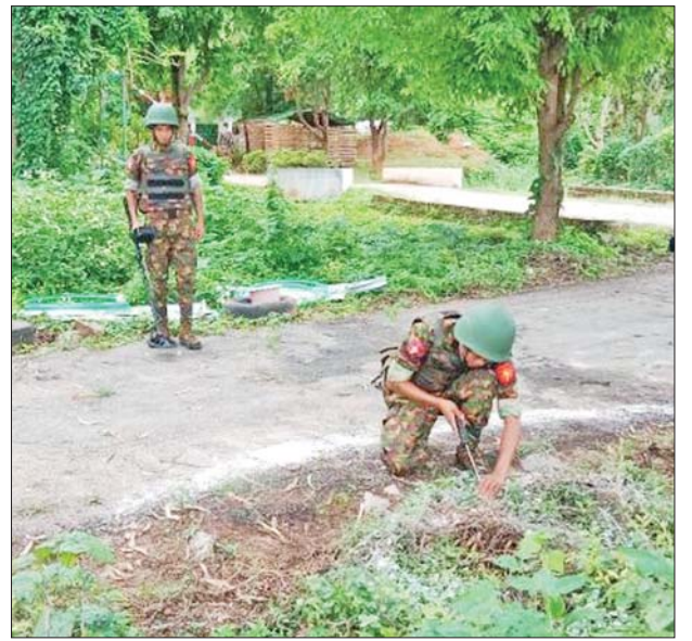
နောင်ချိုမြို့အတွင်း မိုင်းရှင်းလင်းရေးဆောင်ရွက်နေမှုကို တွေ့ရစဉ်။

ပြည်သူလူထုအား လိုအပ်သည့် ကူညီထောက်ပံ့မှုများ ဆောင်ရွက် ပေးသွားရန်နှင့် အစိုးရ၏ အုပ်ချုပ် မှုယန္တရားများဖြစ်သည့် ရုံးများ ပြန်လည်ဖွင့်လှစ်နိုင်ရေး၊ ကလေး သူငယ်များ ပညာသင်ကြားနိုင်ရေး အတွက် စာသင်ကျောင်းများ ပြန်လည်ဖွင့်လှစ်ပေးနိုင်ရေး၊ ပြည်သူလူထု၏ ကျန်းမာရေး စောင့်ရှောက်မှု လုပ်ငန်းများ ဆောင်ရွက်ပေးနိုင်ရန်အတွက် ဆေးရုံများပြန်လည်ဖွင့်လှစ်နိုင် ရေး လိုအပ်သည့် ကူညီထောက်ပံ့ ရေးပစ္စည်းများ၊ စားသောက်ဖွယ် ရာများနှင့်အတူ မော်တော်ယာဉ် များဖြင့် နောင်ချိုမြို့သို့ ရောက်ရှိ လာကြောင်း သိရသည်။ အဆိုပါ မော်တော်ယာဉ်များနှင့် အတူ