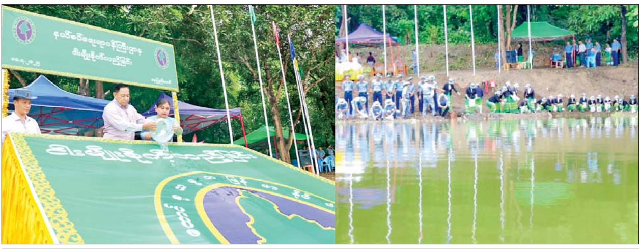
နိုင်ငံတော်စီမံအုပ်ချုပ်ရေးကောင်စီအဖွဲ့ဝင် နယ်စပ်ရေးရာဝန်ကြီးဌာန ပြည်ထောင်စုဝန်ကြီး ဒုတိယဗိုလ်ချုပ်ကြီးရာပြည့်နှင့်ဇနီး တစ်ဖက်ပိတ် ဆည်အတွင်းသို့ ငါးမျိုးများစိုက်ထည့်စဉ်။

နေပြည်တော် ဇူလိုင် ၁၈ ငါးသယ်ဇာတများ တိုးပွားလာ စေရေးနှင့် ငါးမျိုးများ ရေရှည် တည်တံ့ခိုင်မြဲစေရေးတို့အတွက် နယ်စပ်ရေးရာ ဝန်ကြီးဌာန၏ ၂၀၂၅ ခုနှစ် မိုးရာသီ ငါးမျိုးစိုက် ထည့်ပွဲကို ယနေ့နံနက်ပိုင်းတွင် နယ်စပ်ရေးရာ ဝန်ကြီးဌာန ရုံးဧရိယာအတွင်းရှိ တစ်ဖက်ပိတ် ဆည်၌ ကျင်းပသည်။