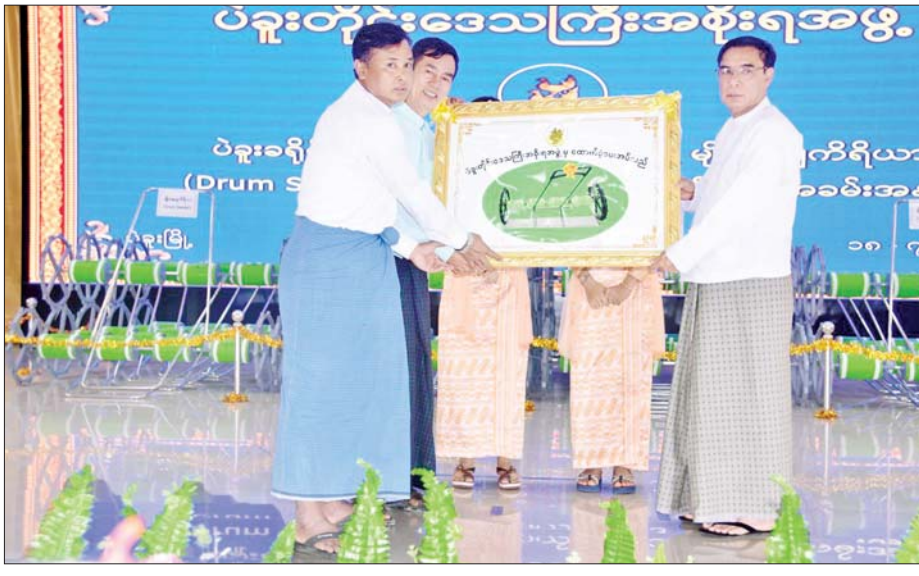
ပန်းတိုင်အထွက်နှုန်းရရှိရေး ကြိုးပမ်းဆောင်ရွက် သွားမည်ဖြစ်ကြောင်း ကျေးဇူးတင်ကတိပြုစကား ပြောကြားသည်။ ဆက်လက်၍ တိုင်းဒေသကြီးဝန်ကြီးချုပ်နှင့် တာဝန်ရှိသူများ၊ တက်ရောက်လာသည့် တောင်သူ တိုင်းဒေသကြီး(ပြန်/ဆက်)

ထို့နောက် တိုင်းဒေသကြီး ဝန်ကြီးချုပ် ဦးမျိုးဆွေဝင်းနှင့် စီးပွားရေးရာဝန်ကြီးဦးတင်ဦး တို့က ပဲခူးခရိုင်အတွင်းရှိ ပဲခူးမြို့နယ်၊ ဝေါမြို့နယ်၊ သနပ်ပင်မြို့နယ်နှင့် ကဝမြို့နယ်တို့မှ ဒေသခံတောင်သူ များအား တိုင်းဒေသကြီးအစိုးရအဖွဲ့ အစီအစဉ်ဖြင့် ထုတ်လုပ်ခဲ့သော မျိုးစေ့ချက်ရိယာ ၁၅၀ ကို ပေးအပ် ချီးမြှင့်သည်။ ယင်းနောက် ပဲခူးတိုင်းဒေသကြီးအတွင်း မှ ထုတ်လုပ်ထားသည့် လက်ဆွဲကောက်စိုက်စက်၊ မျိုးစေ့ချက်ရိယာနှင့် လူလိုက်ပါစီးနင်းနိုင်သည့် ကောက်စိုက်စက်တို့ဖြင့် စိုက်ပျိုးခြင်း၊ အသိပညာ ပေးခြင်း Video Clip ကို ပြသပြီး ဒေသခံတောင်သူ တစ်ဦးက တိုင်းဒေသကြီးအစိုးရအဖွဲ့၏ မျိုးစေ့ချ က်ရိယာပေးအပ်မှုပေါ် စိုက်ပျိုးသီးနှံအလိုက်