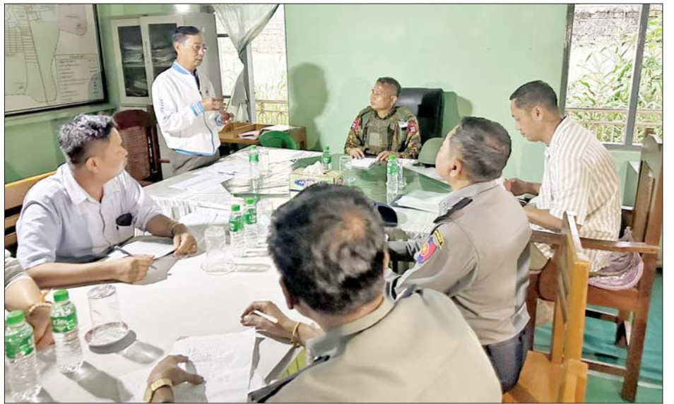
အစိုးရအုပ်ချုပ်မှုယန္တရားများ ပြန်လည်လည်ပတ်ရေး ညှိနှိုင်းအစည်းအဝေးပြုလုပ်စဉ်။

တပ်မတော်စစ်ကြောင်းများ အနေဖြင့် နောင်ချိုမြို့နယ်နှင့် ပတ်ဝန်းကျင်တစ်ဝိုက်ရှိ ယာယီ နေရပ်စွန့်ခွာ ဒေသခံတိုင်းရင်း သားပြည်သူများ ၎င်းတို့၏ မြို့/ ရွာများရှိ နေအိမ်များတွင် ပြန်လည် နေထိုင်နိုင်ရေး၊ အေးချမ်းပျော်ရွှင်စွာ လူမှုစီးပွား ဘဝအတွက် ရှာဖွေလုပ်ကိုင်စား သောက်နိုင်ရေးနှင့် အစိုးရအုပ်ချုပ် မှုယန္တရား ပြန်လည်လည်ပတ်နိုင် ရေးအတွက် အကြမ်းဖက်သောင်း ကျန်းသူများ ယာယီထိန်းချုပ် ထားစဉ် ဖျက်ဆီးသွားခဲ့သည့် ရုံး/ ဌာန အဆောက်အအုံများ၊ လူနေ အဆောက်အအုံများ၊ ဘာသာရေး၊ ပညာရေး၊ ကျန်းမာရေးဆိုင်ရာ အဆောက်အအုံများအား ပြန်လည် ပြုပြင်နိုင်ရေးအတွက် အကြမ်း ဖက်သမားများ ရက်စက်ယုတ်မာ စွာလုပ်ဆောင်ခဲ့သည့် မြေမြှုပ်မိုင်း အန္တရာယ်မှ ကင်းရှင်းစေရန် မြို့/ ရွာများအတွင်း မိုင်းရှင်းလင်းရေး လုပ်ငန်းများနှင့် လိုအပ်သော လုံခြုံရေးလုပ်ငန်းများကို ဆက် လက် ဆောင်ရွက်ပေးလျက်ရှိ သည်။ ထို့ပြင် ယနေ့တွင်လည်း ခရိုင် အုပ်ချုပ်ရေးမှူး ဦးကျော်ဆွေဝင်း ဦးဆောင်သည့် ဌာနဆိုင်ရာအဖွဲ့ ဝင် ၁၁၈ ဦးတို့သည် ဒေသခံ