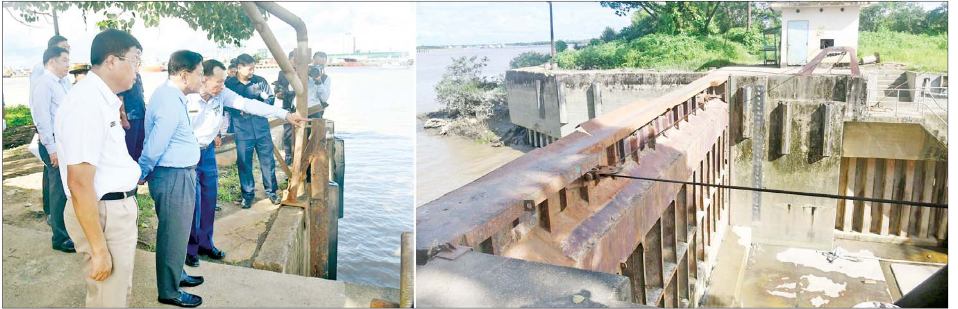
နိုင်ငံတော်စီမံအုပ်ချုပ်ရေးကောင်စီဥက္ကဋ္ဌ နိုင်ငံတော်ဝန်ကြီးချုပ် ဗိုလ်ချုပ်မှူးကြီးမင်းအောင်လှိုင် ဂျောင်ဝိုင်းလွန်းကျင်းလုပ်ငန်းပြန်လည်ဆောင်ရွက်နေသည့်အခြေအနေများကို ကြည့်ရှုစစ်ဆေးစဉ်။