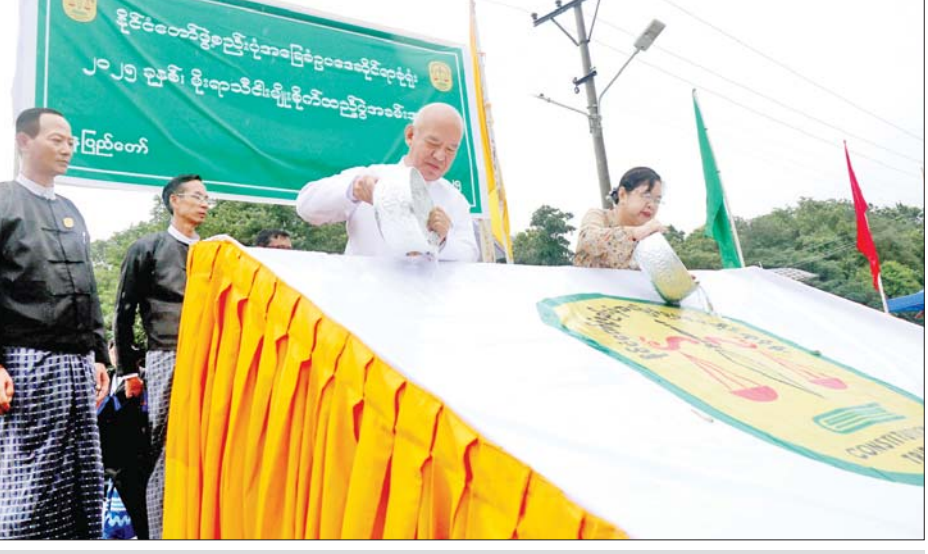
နိုင်ငံတော်ဖွဲ့စည်းပုံအခြေခံဥပဒေဆိုင်ရာခုံရုံးဥက္ကဋ္ဌ ဦးအောင်ဇော်သိန်းနှင့်ဇနီး မင်္ဂလာကန်အတွင်း ငါးမျိုးစိုက်ထည့်စဉ်။

အလားတူ အင်္ဂတီလိုက်စားမှု တိုက်ဖျက်ရေး ကော်မရှင်၏ မိုးရာသီ ငါးမျိုးစိုက် ထည့်ပွဲ အခမ်းအနားကို နံနက်ပိုင်းတွင် နေပြည်တော်ရှိ မင်္ဂလာကန်၌ ကျင်းပရာ အင်္ဂတီလိုက်စားမှု တိုက်ဖျက်ရေးကော်မရှင် ဥက္ကဋ္ဌ ဦးစစ်အေး၊ ကော်မရှင်အတွင်း ရေးမှူး၊ ကော်မရှင်အဖွဲ့ဝင်များ၊ အမြဲတမ်းအတွင်းဝန်၊ ညွှန်ကြား ရေးမျိုးချုပ်များနှင့် အရာထမ်း၊ အမှုထမ်းများ တက်ရောက်၍ ငါးမြစ်ချင်းနှင့် ငါးခုံးမ ငါးသား ပေါက်ကောင်ရေ ၁၀၀၀၀ ကို မင်္ဂလာ ကန်တော်အတွင်းသို့ ငါးမျိုးစိုက်ထည့်ပေး ခဲ့ကြောင်း သိရသည်။