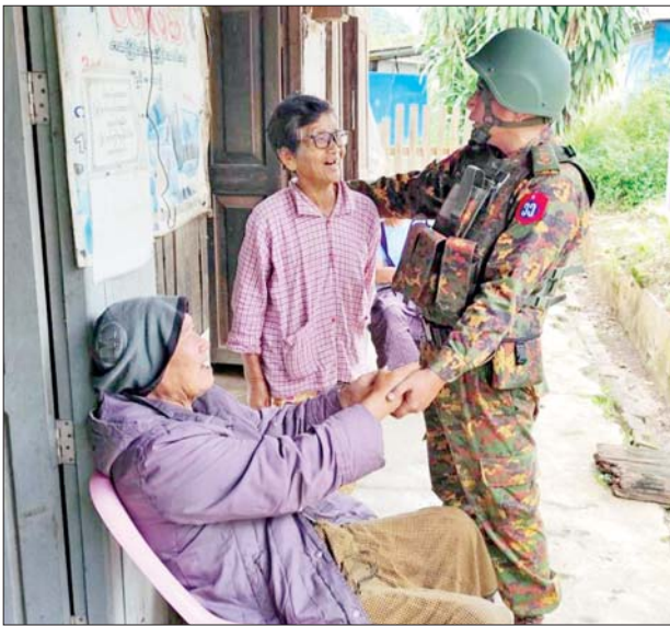
တပ်မတော်သားများက ပြည်သူများအား ရင်းနှီးစွာနှုတ်ဆက် နေမှုကို တွေ့ရစဉ်။

နောင်ချိုမြို့နယ် တစ်ဝိုက်အား အကြမ်းဖက်သောင်းကျန်းသူများ ယာယီထိန်းချုပ်ထားစဉ် ဒေသခံ တိုင်းရင်းသားပြည်သူများအနေ ဖြင့် အိုးအိမ်တိုက်တာ စည်းစိမ် များကို စွန့်ခွာတိမ်းရှောင်နေကြ ရပြီး ၎င်းတို့၏ လူ့အခွင့်အရေး ဆုံးရှုံးမှုများ၊ စီးပွားရေး၊ လူမှုရေး၊ ကျန်းမာရေး၊ ပညာရေးစသည့် အဘက်ဘက်မှ နိမ့်ကျမှုများ၊ စစ်၏ အနိမ့်ရုံများကို ရင်ဆိုင်ကြုံတွေ့ ခဲ့ရပြီး တပ်မတော်က နောင်ချို ဒေသတစ်ဝိုက်အား အပြီးတိုင် ပြန်လည်ထိန်းချုပ်နိုင်ခဲ့သော ကြောင့် ဒေသခံတိုင်းရင်းသား ပြည်သူများအနေဖြင့် တပ်မတော် အပေါ် ယခုကဲ့သို့ စိတ်အားထက် သန်စွာ အားပေးထောက်ခံမှုများ၊ ယုံကြည်အားကိုးမှု များဖြင့် တပ်မတော်နှင့်အတူ ပူးပေါင်း ပါဝင်ဆောင်ရွက်လာခဲ့ခြင်း ဖြစ် သည်။