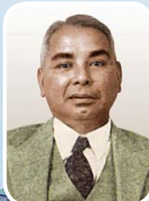
ဦးရာဇော်