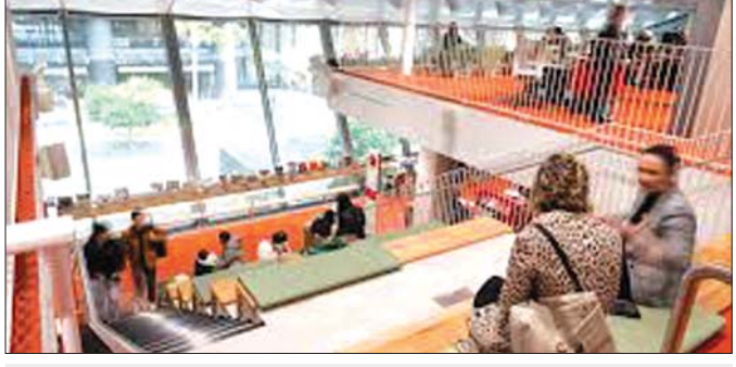
ဆစ်ဒနီမြို့မှ စာကြည့်တိုက်မြင်ကွင်း။

(င) စာဖတ်မှုချစ်ခြင်းလေ့ (Book reading lovers/habits) တိုးတက်စေရန်၊ မူလတန်းအရွယ်မှ စပြီး လူကြီးများအထိ စာဖတ်အလေ့အထများ ဖွံ့ဖြိုးစေပါသည်။ စာဖတ်စာကြည့်နိုင်သော အစီအစဉ် များ၊ စာအုပ်ဝယ်ယူရန် မတတ်နိုင်သူများအတွက် စာဖတ်နိုင်ရေး၊ စာတတ်နိုင်ရေး အားပေးပါသည်။ (ည) နိုင်ငံခြားတက္ကသိုလ်များတွင် စာရေးသူတို့ လက်တွေ့ဆောင်ရွက်ခဲ့ရသလို စာကြည့်တိုက်နှင့် ပတ်သက်၍ စာရေး/စာဖတ် လုပ်ငန်းတာဝန်/ လေ့ကျင့်ခန်း (Reading/Writing Assignments/