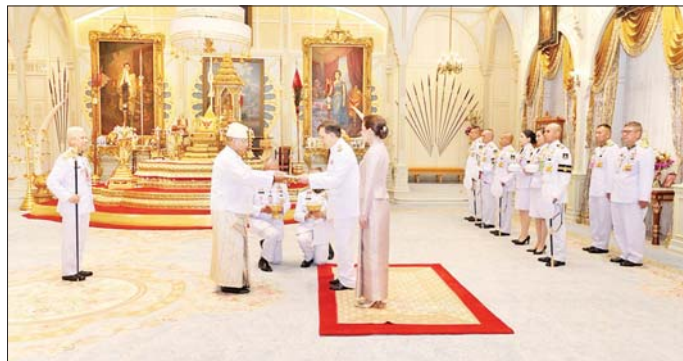
နေပြည်တော် ဇူလိုင် ၂၁ ထိုင်းနိုင်ငံဆိုင်ရာ အထူးအာဏာ ကုန် လွှဲအပ်ခြင်းခံရသော ပြည်ထောင်စု သမ္မတမြန်မာ နိုင်ငံတော် သံအမတ်ကြီး ဦးဇော်ဇော်စိုးသည် ထိုင်းနိုင်ငံ၊ ဗန်ကောက်မြို့ရှိ ထိုင်းဘုရင် နန်းတော်၌ ထိုင်းနိုင်ငံ ဘုရင် မင်းမြတ် မဟာ ဗာဂျီယာလောင် ကွန်း ဗရာ ဗာဂျီယာ ကလောင် ကျောင့်ယုဟူဝါထံသို့ ပေးအပ်ခဲ့ ပြီးဖြစ်သည်။ သတင်းစဉ်