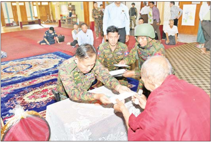
နိုင်ငံတော်စီမံအုပ်ချုပ်ရေးကောင်စီ ဒုတိယဥက္ကဋ္ဌ ဒုတိယဝန်ကြီးချုပ် ဒုတိယတပ်မတော်ကာကွယ်ရေးဦးစီးချုပ် ကာကွယ်ရေးဦးစီးချုပ် (ကြည်း) ဒုတိယဗိုလ်ချုပ်မှူးကြီး စိုးဝင်း နောင်ချိုမြို့ ဟော်တော်ကျောင်းတိုက် ဆရာတော် ဘဒ္ဒန္တ အင်္ဂုသထံ နဝကမ္မအလှူငွေများ ဆက်ကပ်လှူဒါန်းစဉ်။

ထို့နောက် နိုင်ငံတော်စီမံအုပ်ချုပ်ရေးကောင်စီ ဒုတိယဥက္ကဋ္ဌ ဒုတိယဝန်ကြီးချုပ် ဒုတိယတပ်မတော် ကာကွယ်ရေးဦးစီးချုပ် ကာကွယ်ရေးဦးစီးချုပ် (ကြည်း) ဒုတိယဗိုလ်ချုပ်မှူးကြီးစိုးဝင်းနှင့် ကာကွယ်