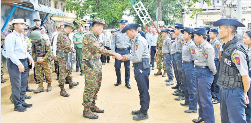
နိုင်ငံတော်စီမံအုပ်ချုပ်ရေးကောင်စီ ဒုတိယဥက္ကဋ္ဌ ဒုတိယဝန်ကြီးချုပ် ဒုတိယတပ်မတော်ကာကွယ်ရေးဦးစီးချုပ် ကာကွယ်ရေးဦးစီးချုပ် (ကြည်း) ဒုတိယဗိုလ်ချုပ် များကြီး စိုးဝင်း နောင်ချိမြို့မရဲစခန်း၌ ရဲတပ်ဖွဲ့ဝင်များအား ချီးမြှင့်ငွေများ ပေးအပ်စဉ်။

ယင်းနောက် နိုင်ငံတော်စီမံအုပ်ချုပ်ရေးကောင်စီ ဒုတိယဥက္ကဋ္ဌ ဒုတိယဝန်ကြီးချုပ် ဒုတိယတပ်မတော် ကာကွယ်ရေးဦးစီးချုပ် ဒုတိယတပ်မတော် ကာကွယ်ရေးဦးစီးချုပ် (ကြည်း) နှင့် အဖွဲ့ဝင်များသည် နောင်ချိမြို့ပြည်သူ့ ဆေးရုံသို့ ရောက်ရှိကြပြီး အကြမ်းဖက်သောင်းကျန်း သူများ ဖျက်ဆီးခဲ့သည့်အရေးပုံစံစိစစ်ဆန်းစစ်ချက် အပေါ် အခြေခံအတွင်း ဖျက်ဆီးမှုအခြေအနေများကို လိုက်လံ ကြည့်ရှုပြီး ဆေးရုံအတွင်းနှင့် အပြင် ဖျက်ဆီးမှုများကို အမြန်ဆုံးဖယ်ရှားရှင်းလင်းရေး၊ ဖယ်ရှားရှင်းလင်းစဉ် ဆယ်တင်အသုံးပြုရသည့် ပစ္စည်းများကို ပြန်လည် စမ်းစစ်မှုများ ပြုလုပ်ကာ အသုံးပြုနိုင်ရေး၊ ဆေးရုံ အတွင်း/အပြင်သန့်ရှင်းသာယာလှပရေး၊ ရေ၊ မီး၊ မိလ္လာစနစ်ကောင်းမွန်စေရေးတို့ကို အမြန်ဆုံးပြန်လည် ဆောင်ရွက်သွားကြရန် တာဝန်ရှိသူများကို မှာကြားသည်။