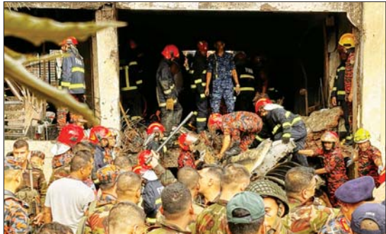
ကောလိပ်ဝင်းအတွင်း ပျက်ကျခဲ့သော စစ်ဘက်သုံးလေ့ကျင့်ရေးလေယာဉ် အပျက်အစီးများကို သက်ဆိုင်ရာတာဝန်ရှိသူများ ဇူလိုင် ၂၁ ရက်က စစ်ဆေးစဉ်။