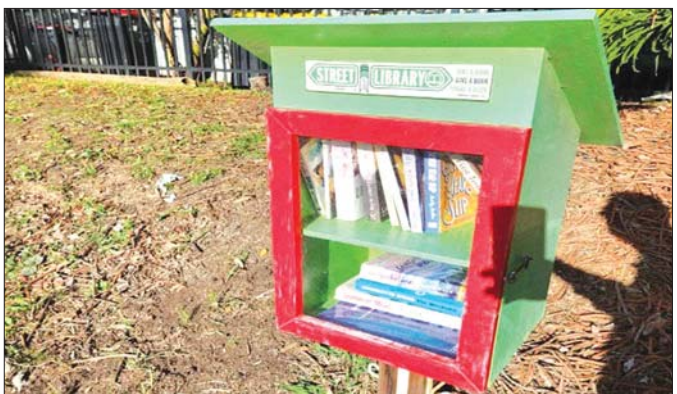
ဆစ်ဒနီမြို့လမ်းခေါင်းရှိ စာကြည့်တိုက်ကလေးတစ်ခု။