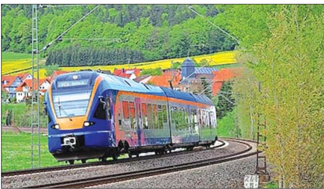
ဂျာမနီနိုင်ငံ၌ စာရေးသူတို့ ကျောင်းသားဘဝက စီးခဲ့ရသောရထားလေး။

နောက်တစ်ခါ အချိန်တိုကျမှုက စာရေးသူ ပါမောက္ခချုပ်ဘဝ ၂၀၁၆ ခုနှစ် ဂျပန်နိုင်ငံ တိုကျို စိုက်ပျိုးရေးတက္ကသိုလ် (TUA - Tokyo University of Agriculture/Tokyo Nodai) မှ မောင်မယ်သစ်လွင် ကြိုဆိုပွဲအခမ်းအနား (Fresher Welcome) ဖိတ်ပွဲ မှာပါ။ ဤတိုကျိုပုဂ္ဂလိကစိုက်ပျိုးရေးတက္ကသိုလ် (Tokyo Nodai - TUA Tokyo University of Agriculture) က ရေဆင်းစိုက်ပျိုးရေးတက္ကသိုလ်နှင့် ဆရာ၊ ကျောင်းသားအချင်းချင်း လေ့လာရေး၊ သုတေသနပူးတွဲလုပ်ဆောင်ရေး စသည့် နားလည်မှု စာချွန်လွှာ (MoU) လက်မှတ်ရေးထိုးထားသဖြင့် နှစ်စဉ်နိုင်ငံတကာ စိုက်ပျိုးမွေးမြူရေးတက္ကသိုလ် များမှ ပါမောက္ခချုပ်/အကြီးအကဲများကို ဖိတ်ကြား ပြီး မိတ်ဆက်စကားပြောကြားခိုင်းပါသည်။ သူတို့ အချိန်တိုကျပုံမှာ စာရေးသူအပါအဝင် ကျောင်း အုပ်ချုပ်ရေးအဖွဲ့က နံနက် ၉ နာရီမထိုးခင် ၁၀