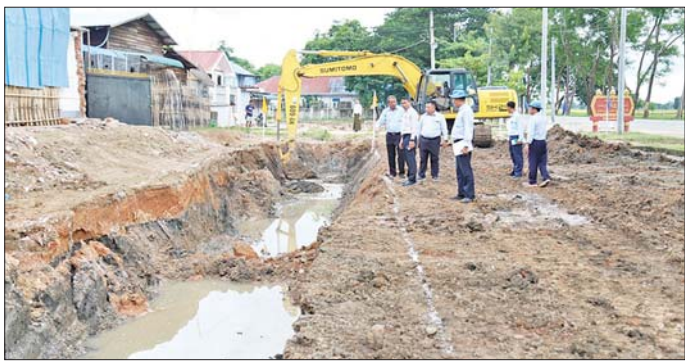
ထို့နောက် ပြည်ထောင်စုဝန်ကြီးနှင့်အဖွဲ့သည် လမ်းဖောက်လုပ်ရေးလုပ်ငန်းများကို ကြည့်ရှုစစ်ဆေး ရေဆင်းတက္ကသိုလ်များနယ်မြေရှိ စိုက်ပျိုးရေး ပြီး လိုအပ်သည်များ ပေါင်းစပ်ညှိနှိုင်း ဆောင်ရွက် တက္ကသိုလ် ဘောလုံးကွင်းအဆင့်မြှင့်တင်ရေး ဆောင်ရွက်မည့် ပွဲကြည့်စင်တည်ဆောက်ရေးနှင့် သတင်းစဉ်

ရေယာများ၊ ချို၊ ဗေဒါပင်များကြောင့် ရေစီးဆင်းမှု နည်းနေသည့်နေရာများကို ရေစီးရေလွှာကောင်းမွန် ရေးဦးစားပေးဆောင်ရွက်ရန်ဆွေးနွေးမှာကြားသည်။ ရေဆင်းစိုက်ပျိုးရေး မပိုင်ကယ်ရိုး ရေနုတ်မြောင်းသည် ကျောက်ဆိုး ချောင်း၊ ဆတ်သွားချောင်းများမှ ရေပိုရေလျှံများ၊ စိုက်ခင်းများမှ စွန့်ထုတ်ရေများ စီးဆင်းသော ရိုးတစ်ခု ဖြစ်ပြီး ကျွန်းရောင်း-အိုင်စောက်- ပေါင်းလောင်း ရေနုတ်မြောင်းမှတစ်ဆင့် ပေါင်းလောင်းမြစ်အတွင်း သို့ ပုံမှန်စီးဝင်လျက်ရှိသော်လည်း ထူးကဲစွာရွာသူနဲ့ သည့် ကာလများတွင် ရေကြီးရေလျှံမှုများ ဖြစ်ပေါ် လျက်ရှိသဖြင့် ရန်ကုန်- မန္တလေးလမ်းဟောင်း၏ အရှေ့ဘက်ခြမ်းတွင်ပါ ရေထုတ်မြောင်းတူးဖော် ဖောက်လုပ်နေခြင်းဖြစ်ကာ မြေသားရေနုတ်မြောင်း တူးဖော်ခြင်းလုပ်ငန်း အလျားပေ ၃၅၀၀ ၊ မြေကြီး လုပ်ငန်း ၃၄၅၂ ကျင်းကို မိုးရာသီအတွင်း အပြီး ဆောင်ရွက်မည်ဖြစ်ကြောင်း သိရသည်။