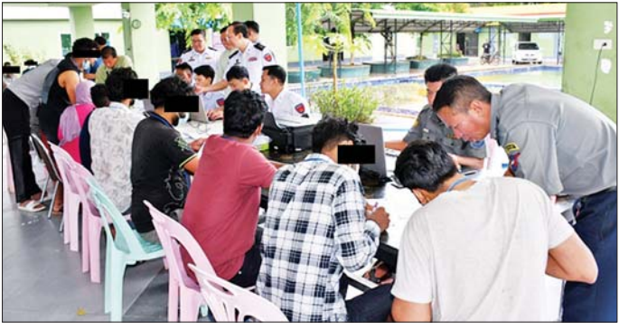
ဆိုင်ရာ ပူးပေါင်းအဖွဲ့များက လိုအပ်သည့် ကိုယ်ရေး အချက်အလက်များနှင့် မှတ်တမ်းများစာရင်း ကောက်ယူခြင်းလုပ်ငန်း နေ့ချင်းပြီးဆောင်ရွက်နေမှု ကို ကရင်ပြည်နယ် လူဝင်မှုကြီးကြပ်ရေးနှင့် ပြည်သူ့ အင်အားဝန်ကြီးဌာန ဒုတိယဌာနကြားရေးမှူးနှင့် တာဝန်ရှိသူများက လိုက်လံကြည့်ရှုစစ်ဆေးပြီး လိုအပ်သည့်များ ပြည့်စုံကမ္ဘာမှားသည်။ ၂၀၂၅ ခုနှစ် ဇန်နဝါရီ ၃၀ ရက်မှ ဇူလိုင် ၂၀ ရက်

နေပြည်တော် ဇူလိုင် ၂၀ ထိုင်းနိုင်ငံအပါအဝင် အိမ်နီးချင်းနိုင်ငံအချို့ကို တစ်ဆင့်ခံပြုတံဆိပ်ရရှိ မြန်မာနိုင်ငံအတွင်းသို့ နယ်စပ် လမ်းကြောင်းများမှတစ်ဆင့် တရားမဝင် ဝင်ရောက် လာပြီး ကရင်ပြည်နယ် မြဝတီမြို့-ရွှေကုက္ကိုလ်၊ မွဲထော်ဘလင်း (KK Park) နှင့် ကျောက်ခတ်နယ်မြေ များတွင် အွန်လိုင်းလောင်းကစားမှုများ၊ အွန်လိုင်း လိမ်လည်မှုများ၊ ဒုစရိုက်မှုများကျူးလွန်ခဲ့ကြသည့် အိန္ဒိယနိုင်ငံသား ၃၆ ဦး၊ တရုတ်နိုင်ငံသား ၁၁ ဦး၊ ဖိလစ်ပိုင်နိုင်ငံသား တစ်ဦး၊ နီပေါနိုင်ငံသား တစ်ဦး၊ မလေးရှားနိုင်ငံသားတစ်ဦး၊ သီရိလင်္ကာနိုင်ငံသား တစ်ဦးနှင့် ကင်ညာနိုင်ငံသားတစ်ဦး စုစုပေါင်း ၅၂ ဦး ကို ယနေ့တွင် ထပ်မံစစ်ဆေးဖော်ထုတ်ထိန်းသိမ်း နိုင်ခဲ့သည်။ အဆိုပါ စစ်ဆေးဖော်ထုတ်ထိန်းသိမ်းနိုင်ခဲ့သည့် ပြည်ပနိုင်ငံသားများအား သက်ဆိုင်ရာနိုင်ငံများသို့ အမြန်ဆုံးပြန်လည်လွှဲပြောင်းပေးအပ်နိုင်ရေး ဌာန