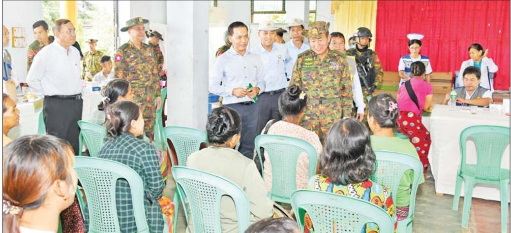
နိုင်ငံတော်စီမံအုပ်ချုပ်ရေးကောင်စီ ဒုတိယဥက္ကဋ္ဌ ဒုတိယဝန်ကြီးချုပ် ဒုတိယတပ်မတော်ကာကွယ်ရေးဦးစီးချုပ် ကာကွယ်ရေးဦးစီးချုပ် (ကြည်း) ဒုတိယဗိုလ်ချုပ်မှူးကြီး စိုးဝင်း နောင်ချိုမြို့ မြန်မာ့တော်ဝင်မင်္ဂလာခန်းမ၌ တပ်မတော်နှင့် ကျန်းမာရေးဝန်ကြီးဌာနမှ ပူးပေါင်းဖွင့်လှစ်ထားသည့် ယာယီဆေးရုံအတွင်း လာရောက်ဆေးကုသမှုခံယူလျက်ရှိသည့် ဒေသခံပြည်သူများအား အားပေးစကားပြောကြားစဉ်။

ရေးဦးစီးချုပ်မှူး (ကြည်း)မှ ဒုတိယဗိုလ်ချုပ်ကြီး နိုင်နိုင်ဦးတို့က စစ်မြေပြင်တွင် စွမ်းစွမ်းတစ်ထမ်းဆောင်ခဲ့မှုကြောင့် စစ်မြေပြင် တစ်ဆင့်မြင့်ရာထူး တိုးမြှင့်ခြင်းခံရသည့် စစ်သည်များကို အဆင့်တစ်ဆင့် များ တပ်ဆင်ပေးသည်။ ထို့နောက် ဒုတိယဝန်ကြီးချုပ် က အရာရှိ၊ စစ်သည်များအတွက် စားသောက်ဖွယ်ရာများကို ပေးအပ်ရာ တာဝန်ရှိသူများ လက်ခံရယူကြသည်။