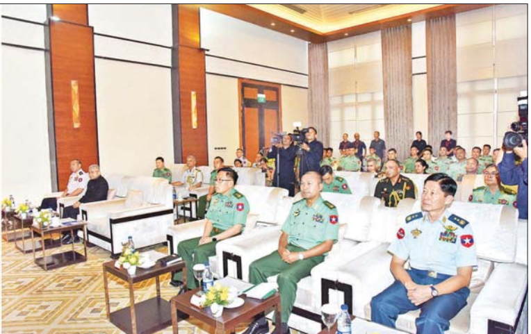
နိုင်ငံတော်စီမံအုပ်ချုပ်ရေးကောင်စီ ဒုတိယဥက္ကဋ္ဌ ဒုတိယဝန်ကြီးချုပ် ဒုတိယတပ်မတော်ကာကွယ်ရေးဦးစီးချုပ် ကာကွယ်ရေးဦးစီးချုပ်(ကြည်း)ဒုတိယဗိုလ်ချုပ်မှူးကြီး စိုးဝင်း (၈)ကြိမ်မြောက် UN Peacekeeping Officer Course ဆိုင်ရာသင်တန်းဖွင့်ပွဲအခမ်းအနားတွင် အမှာစကားပြောကြားစဉ်။