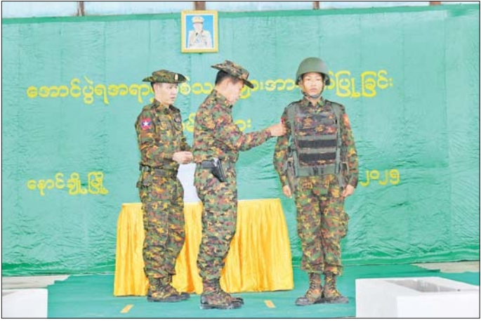
နိုင်ငံတော်စီမံအုပ်ချုပ်ရေးကောင်စီ ဒုတိယဥက္ကဋ္ဌ ဒုတိယဝန်ကြီးချုပ် ဒုတိယတပ်မတော်ကာကွယ်ရေးဦးစီးချုပ် ကာကွယ်ရေးဦးစီးချုပ် (ကြည်း) ဒုတိယဗိုလ်ချုပ်မှူးကြီးစိုးဝင်း စစ်မြေပြင် တစ်ဆင့်ဖြင့်ရာထူးတိုးမြှင့်ခြင်းခံရသည့် စစ်သည်အား အဆင့်တံဆိပ် တပ်ဆင်ပေးစဉ်။

ဦးစွာ နိုင်ငံတော်စီမံအုပ်ချုပ်ရေးကောင်စီ ဒုတိယဥက္ကဋ္ဌ ဒုတိယဝန်ကြီးချုပ် ဒုတိယတပ်မတော် ကာကွယ်ရေးဦးစီးချုပ် ကာကွယ်ရေးဦးစီးချုပ် (ကြည်း) ဒုတိယဗိုလ်ချုပ်မှူးကြီး စိုးဝင်းနှင့် အဖွဲ့ဝင်