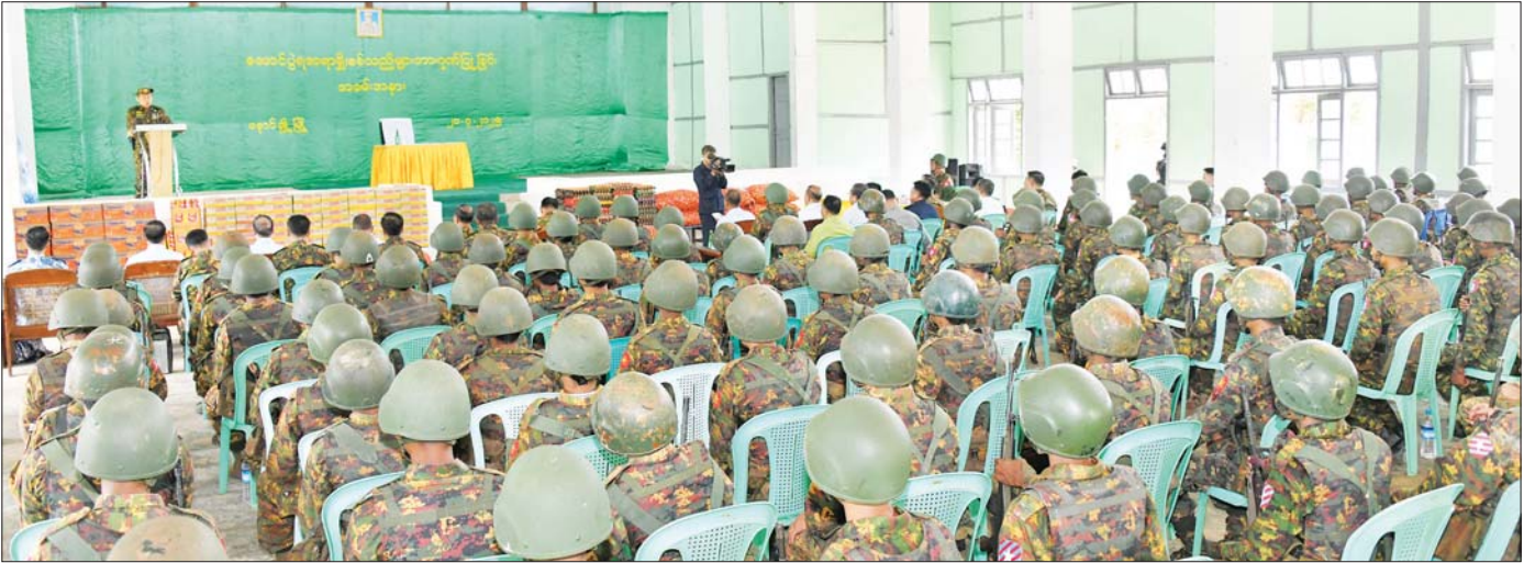
နိုင်ငံတော်စီမံအုပ်ချုပ်ရေးကောင်စီ ဒုတိယဥက္ကဋ္ဌ ဒုတိယဝန်ကြီးချုပ် ဒုတိယတပ်မတော်ကာကွယ်ရေးဦးစီးချုပ် ကာကွယ်ရေးဦးစီးချုပ် (ကြည်း) ဒုတိယဗိုလ်ချုပ်မှူးကြီးစိုးဝင်း အောင်ပွဲရ အရာရှိ၊ စစ်သည်များအား ဂုဏ်ပြုခြင်းအခမ်းအနားတွင် ဂုဏ်ပြုအမှာစကားပြောကြားစဉ်။