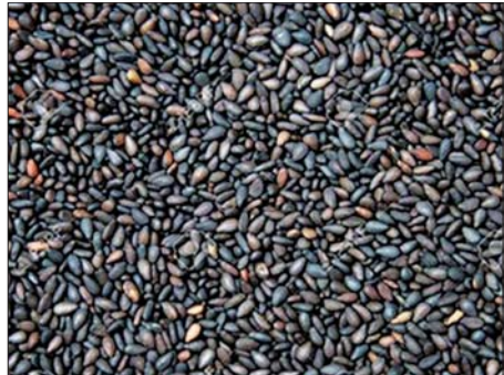
၂၀-၇-၂၀၂၅ ရက်နေ့ တိုင်းဒေသကြီးနှင့် ပြည်နယ် မြို့နယ်အလိုက် ဆန်၊ ဆီ၊ မီးဖိုချောင်သုံးပစ္စည်းများ၊ သားငါးဈေးနှုန်းများ