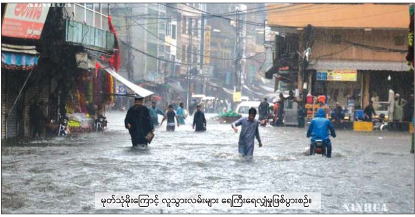
မုတ်သုံမိုးကြောင့် လူသွားလမ်းများ ရေကြီးရေလျှံမှုဖြစ်ပွားစဉ်။

ပါကစ္စတန်အရှေ့ပိုင်း ပန်ဂျပ် ပြည်နယ်သည် ဘာဘာဝေးအန္တရာယ်ကို အဆိုးဆုံးဆုံးခံစားရသည့်ဒေသဖြစ်ကာ သေဆုံးသူ ၁၄၄ ဦးနှင့် ဒဏ်ရာရရှိသူ ၄၄၇ ဦးရှိသည်။ ပန်ဂျပ်ပြည်နယ်မြို့တော် လာဟိုရ်မြို့လည်း ပြီးခဲ့သည့် သီတင်းပတ်က မိုးသည်ထန်စွာရွာသွန်းခဲ့ပြီး မြို့အတွင်း မြေခိုခိုပိုင်းဒေသ အများအပြားတွင် လျှပ်စစ်စီးခြင်းတောက်ကာ မြို့၏ လမ်းကျဉ်းများတွင်လည်း ပြင်းထန်သည့် ရေခဲနှစ်မြုပ်မှုများ ဖြစ်ပေါ်ခဲ့သည်။