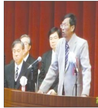
ပျာန်နိုင်ငံ၌ စာရေးသူဧည့်သည်တော်အနေဖြင့် ဂဟာပြောစဉ်။

(ခ) သတင်းအချက်အလက် စုဆောင်းမှု၊ ကျေးလက်ဒေသ၊ နည်းပညာအားနည်းသည့် ဒေသများတွင် သတင်းအချက်အလက်ရယူနိုင်စွမ်း တိုးတက်စေသည်။ ကွန်ပျူတာ၊ အင်တာနက်၊ ဒေတာဘေ့စ်/အချက်အလက်များ (Data-base) ကို အခမဲ့အသုံးပြုခွင့်ပေးသည်။ (ဂ) ယဉ်ကျေးမှုထိန်းသိမ်းမှု၊ စာပေ၊ သမိုင်း မှတ်တမ်း၊ ရိုးရာဗဟုသုတများကို ထိန်းသိမ်းပေး ပါသည်။ တိုင်းရင်းသားဘာသာစကားများ၊ မိမိ ဒေသတွင်း နည်းပညာများကို မြှင့်တင်ပါသည်။ (ဃ) အဖွဲ့အစည်းဖွံ့ဖြိုးရေး၊ အများပြည်သူအတွက် သင်တန်းများ၊ ဆွေးနွေးပွဲများ ပြုလုပ်နိုင်ပါသည်။ မည်သူမဆို ဝင်ရောက်သုံးစွဲနိုင်သည့် နေရာများ ဖြစ်ပါသည်။