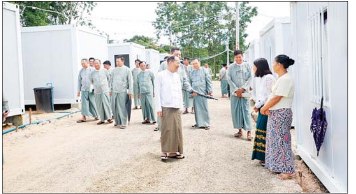
ဘေးအန္တရာယ်ကင်းစွာ နေထိုင်နိုင်ရေး စီစဉ် လိုအပ်သည်များ ဖြည့်ဆည်း ဆောင်ရွက်ပေးခဲ့ ဆောင်ရွက်ထားရှိမှုတို့ကို ကြည့်ရှုစစ်ဆေးပြီး ကြောင်း သိရသည်။ သတင်းစဉ်

စည်းကမ်းချက်များနှင့်အညီ စနစ်တကျ နေထိုင် သွားရန်၊ ရေ၊ မီး၊ မိလ္လာစနစ်များကို စနစ်တကျ သုံးစွဲကြရန်နှင့် ယာယီနေထိုင်စဉ် ဧရိယာအတွင်း သန့်ရှင်းသောယာယီလှေအတွက် ဝိုင်းဝန်းပူးပေါင်း ဆောင်ရွက်ကြရန်တို့ကို မှာကြားကာ မိသားစုဝင်များ အား ရင်းရင်းနှီးနှီး တွေ့ဆုံအားပေးသည်။ (ယာပုံ) ဖြည့်ဆည်းဆောင်ရွက်ပေး ယင်းနောက် ဥက္ကဋ္ဌသည် ဝန်ထမ်းများနှင့် ဝန်ထမ်းမိသားစုဝင်များ ချက်ပြုတ်စားသောက်နိုင် ရေး စီစဉ်ဆောင်ရွက်ထားရှိမှု၊ လျှပ်စစ်မီး တပ်ဆင် ထားရှိမှု၊ ရေချိုးခန်း၊ အိမ်သာများ စနစ်တကျ ဆောင်ရွက်ထားရှိမှု၊ စွန့်ပစ်ပစ္စည်းများအား အမျိုး အစား လေးမျိုးခွဲ၍ စနစ်တကျ စွန့်ပစ်နိုင်ရေး ဆောင်ရွက်ထားရှိမှု၊ ရေစီးရေလာ ကောင်းမွန်စေရေး ရေနုတ်မြောင်းများ ဖောက်လုပ်ထားရှိမှု၊ Container House ပတ်လမ်းများ ဖောက်လုပ်ထားရှိမှုနှင့်