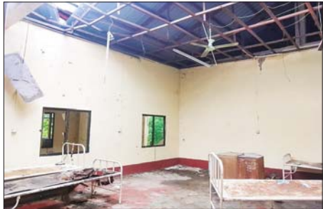
အကြမ်းဖက်သောင်းကျန်းသူများက မြို့နယ်ပြည်သူ့ဆေးရုံအတွင်း ဖျက်ဆီးခဲ့သည့် မှတ်တမ်းဓာတ်ပုံ။