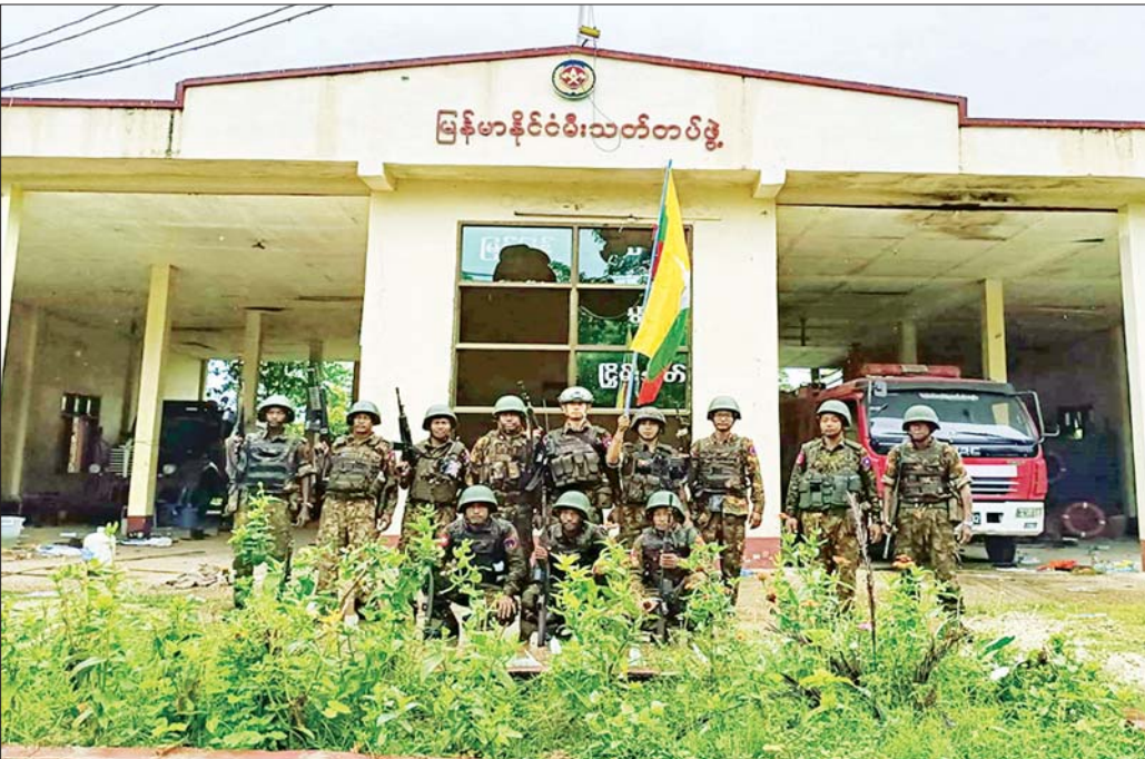
အကြမ်းဖက်သောင်းကျန်းသူများ ထိန်းချုပ်ထားသည့် သပိတ်ကျင်းမြို့အား တပ်မတော်က ပြန်လည်ထိန်းချုပ်စဉ်။