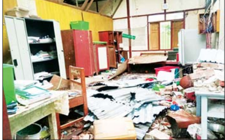
အကြမ်းဖက်သောင်းကျန်းသူများက စာသင်ကျောင်းအတွင်း ပရိဘောဂပစ္စည်းများအား ဖျက်ဆီးခဲ့သည့် မှတ်တမ်းဓာတ်ပုံ။