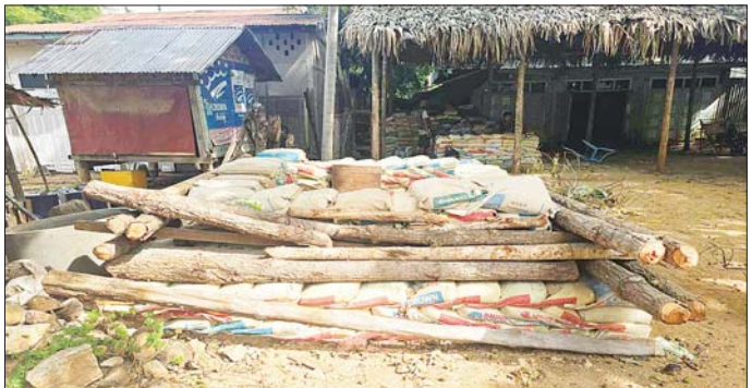
အကြမ်းဖက်သောင်းကျန်းသူများက လူနေအိမ်များအတွင်း ဘန်ကာများ ပြုလုပ်ထားသည့် မှတ်တမ်းဓာတ်ပုံ။