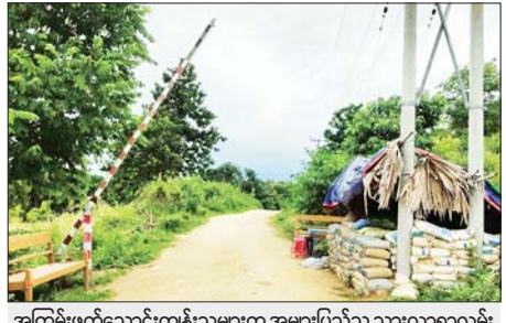
အကြမ်းဖက်သောင်းကျန်းသူများက အများပြည်သူ သွားလာရာလမ်းများ၌ ဂိတ်များဖွင့်လှစ်ကာ အတင်းအဓမ္မငွေကြေးကောက်ခံခဲ့သည့် မှတ်တမ်းဓာတ်ပုံ။