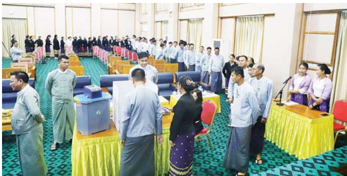
လက်တွေ့စမ်းသပ်ပေးခြင်း ပြသမှုများအပေါ် သိရှိလိုသည့် သိရသည်။ ပြီး တာဝန်ရှိသူများ၏ ရှင်းလင်း များ မေးမြန်းခဲ့ကြကြောင်း သတင်းစဉ်

ပြည်ထောင်စု ရွေးကောက်ပွဲ ကော်မရှင်အဖွဲ့ ဒုတိယညွှန်ကြား ရေးမှူးချုပ်က မြန်မာအိလက် ထရောနစ်မိပေးစက် (MEVM) ဖြင့် မိပေးခြင်းလုပ်ငန်းစဉ်များနှင့် စပ်လျဉ်း၍ ရှင်းလင်းတင်ပြသည်။ ယင်းနောက် အခွန်အယူခံ ခုံအဖွဲ့ဥက္ကဋ္ဌ၊ အခွန်အယူခံခုံအဖွဲ့ ဝင်များနှင့် ဝန်ထမ်းများက မြန်မာအိလက်ထရောနစ် မိပေး စက် (MEVM) နှင့် ပတ်သက်၍