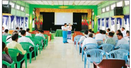
Nations Security Council Resolution) 1325 တို့အား ရပ်ကွက်၊ ကျေးရွာအတွင်းရှိ ပြည်သူများ ကျယ်ကျယ်ပြန့်ပြန့် သိရှိနိုင်ရန် တင့်တင့်

တပ်ကုန်း ဇူလိုင် ၂၃ နေပြည်တော် တပ်ကုန်းမြို့နယ် အထွေထွေအုပ်ချုပ်ရေး အစည်း အဝေးခန်းမ၌ သက်ကြီးပင်စင် (လူမှုရေးပင်စင် ထုတ်ပေးမှု အစီအစဉ်) နှင့် ကျားမရေးရာ အလေးပေးသော လုပ်ငန်းစဉ်များ မြှင့်တင်ရန် Gender, CEDAW, NSPAW, UNSCR, 1325 အသိပညာ ပေးသင်တန်းများကို ယမန်နေ့ က ဖွင့်လှစ်ခဲ့သည်။ အဆိုပါသင်တန်းတွင် နေပြည် တော် လူမှုဝန်ထမ်းမှူးမှလက်ထောက်