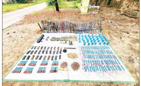
အကြမ်းဖက်သောင်းကျန်းသူများထံမှ သိမ်းပိုက်ရရှိခဲ့သည့် လက်နက်/ခဲယမ်းနှင့် ဆက်စပ်ပစ္စည်း မှတ်တမ်းဓာတ်ပုံများ။

စာမျက်နှာ ၁၂ မှ မခံနိုင်တဲ့အခါမှာ တပ်မတော်ဘက်ကို အလင်းဝင်ရောက်ကြို တိုးစားခဲ့ပါတယ်။ သူတို့က ပြောပါတယ် နှင့် အဲဒီဘက်ကိုရောက်ရင် သူတို့က သတိပေးမှာလို့ ပြောတဲ့အခါမှာ ကျွန်တော် တွေဝေခဲ့ပါတယ်။