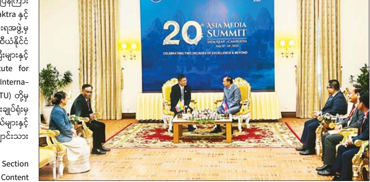
ရုပ်မြင်သံကြားမှ ညွှန်ကြားရေးမှူးချုပ်(ရုပ်မြင်) ဒေါ်မိုးသူဇာအောင်နှင့် မြန်မာကိုယ်စားလှယ်အဖွဲ့ဝင်များနှင့်အတူ တက်ရောက်သည်။ ဖွင့်ပွဲအခမ်းအနားတွင် ကမ္ဘောဒီးယားနိုင်ငံ ပြန်ကြားရေးဝန်ကြီး၊ အာဆီယံအတွင်းရေးမှူးချုပ်နှင့် AIBD မှ တာဝန်ရှိသူတို့က အဖွင့်အမှာစကားပြောကြားသည်။ ထို့နောက် ဒုတိယဝန်ကြီးသည် ကမ္ဘောဒီးယားနိုင်ငံ ပြန်ကြားရေးဝန်ကြီးဌာန ဝန်ကြီး H.E. Neth Pheaktra အား တွေ့ဆုံနှုတ်ဆက်ပြီး အမှတ်တရလက်ဆောင်ပေးအပ်သည်။ မွန်းလွဲပိုင်းတွင် ဒုတိယဝန်ကြီးနှင့် ကိုယ်စားလှယ်အဖွဲ့သည် Disinformation: The Role of Media & the Government, Enabling Accessibility

ဆွေးနွေးပွဲတွင် ကမ္ဘောဒီးယားနိုင်ငံ ပြန်ကြားရေးဝန်ကြီးဌာန ဝန်ကြီး H.E. Neth Pheaktra နှင့် တာဝန်ရှိသူများ၊ ဆီယမ်ရီပြည်နယ်အစိုးရအဖွဲ့မှ ပုဂ္ဂိုလ်များ၊ အာရှပစိဖိတ်နိုင်ငံများနှင့် အာဆီယံနိုင်ငံများမှ ပြန်ကြားရေးဆိုင်ရာ ဒုတိယဝန်ကြီးများနှင့် အဆင့်မြင့်အရာရှိကြီးများ၊ Asia Institute for Broadcasting Development (AIBD) နှင့် International Telecommunication Union (ITU) တို့မှ တာဝန်ရှိသူများ၊ အာဆီယံအတွင်းရေးမှူးချုပ်ရုံးမှ တာဝန်ရှိသူများ၊ မီဒီယာကိုယ်စားလှယ်များနှင့် ကမ္ဘောဒီးယားနိုင်ငံ တက္ကသိုလ်များမှ ကျောင်းသားကျောင်းသူများ တက်ရောက်ကြသည်။