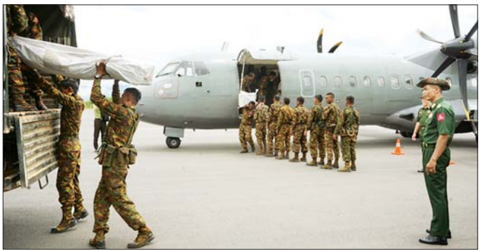
ဦးစီးဌာနမှ တာဝန်ရှိသူများ၊ ကျိုင်းတုံခရိုင်၊ မိုင်းယန်း ခရိုင်မှ ဌာနဆိုင်ရာ တာဝန်ရှိသူများနှင့်အတူ မိုင်းပေါက်မြို့သို့ ဆက်လက်ထွက်ခွာကြသည်။ ထိုသို့ ဆောင်ရွက်နေမှုများကို တိုင်းမှူးနှင့် သတင်းစဉ်

များအား ယနေ့နံနက်ပိုင်းတွင် ကျိုင်းတုံမြို့သို့ တပ်မတော်လေယာဉ်ဖြင့် ရောက်ရှိလာရာ ကြိမ်ဒေသ တိုင်းစစ်ဌာနချုပ် တိုင်းစစ်မှူးနှင့် တာဝန်ရှိသူများက သွားရောက်ကြိုဆို၍ ကျိုင်းတုံတပ်နယ်မှ တပ်မတော် သားများက ထောက်ပံ့ရေးပစ္စည်းများ ဆက်လက် ပို့ဆောင်မည့် မော်တော်ယာဉ်များပေါ်သို့ လွှဲပြောင်း တင်ဆောင်ပေးကြသည်။ ထို့နောက် ထောက်ပံ့ရေးပစ္စည်းများ သွားရောက် ပို့ဆောင်မည့်ယာဉ်များ၌ အန္တရာယ်ဆိုင်ရာ စီမံခန့်ခွဲမှုဦးစီးဌာနမှ အိပ်ရာလိပ်နှင့် တစ်ကိုယ်ရေသုံး ပစ္စည်းများအပါအဝင် ထောက်ပံ့ရေးပစ္စည်း ၁၆ ချို့၊ ရှမ်းပြည်နယ်အစိုးရအဖွဲ့မှ ဆန်အိတ် ၁၀၀ အပါအဝင် ထောက်ပံ့ရေးပစ္စည်းလေးချို့၊ ကြိမ်ဒေသတိုင်းစစ်ဌာန ချုပ်မှ ဆန်အိတ် ၁၀၀ အပါအဝင် ထောက်ပံ့ရေးပစ္စည်း နှစ်ချို့ စုစုပေါင်း ၂၂ ချို့ပေါင်းပြီး ပြည်နယ်အစိုးရ အုပ်ချုပ်ရေးအဖွဲ့ခွဲ(ရှမ်းအရှေ့ဥက္ကဋ္ဌ၊ နယ်မြေခံ တပ်မတော်သားများ၊ ခရိုင်ဘေးအန္တရာယ်စီမံခန့်ခွဲမှု