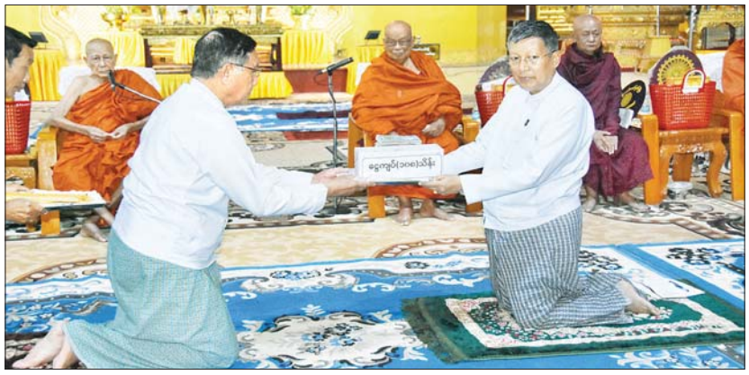
လှူဒါန်းရာ ဥပုတသန္တိစေတီတော်မြတ်ကြီးဂေါပကအဖွဲ့ဝင်ကလက်ခံရယူသည်။ ယင်းနေ့က လယ်ဝေးမြို့ အင်းသာအရှေ့ကျောင်းတိုက် ဆရာတော်ထံမှ

ယင်းနေ့ကပြည်ထောင်စုဝန်ကြီးနှင့် နေပြည်တော် ကောင်စီဥက္ကဋ္ဌတို့သည် သာသနာရေးဆိုင်ရာများ လျှောက်ထားသည်။ ထို့နောက် လယ်ဝေးမြို့ ပေါက်မြိုင်ကျောင်းတိုက်ဆရာတော် အမျိုးပြုသော ဩဝါဒခံရယူ ဆရာတော်ကြီးများက ဩဝါဒကထာများ မိန့်ကြားတော်မူသည်။ ဆက်လက်၍ ပြည်ထောင်စုဝန်ကြီးအမျိုးပြုသော တာဝန်ရှိသူများက ဆရာတော်ကြီးများအား လှူဖွယ်ဝတ္ထုပစ္စည်းများ ဆက်ကပ်လှူဒါန်းသည်။ ထို့နောက် ပြည်ထောင်စုဝန်ကြီးက သာသနာရေးနှင့်ယဉ်ကျေးမှုဝန်ကြီးဌာနနှင့် ခုနစ်ရက်သားသမီးများ၏အလှူငွေကူပံ့ ၁၀၈ သိန်းကိုလည်းကောင်း (အပေါ်ယာပုံ) နေပြည်တော်ကောင်စီဥက္ကဋ္ဌက နေပြည်တော်ကောင်စီမှလှူဒါန်းသော အလှူငွေကူပံ့ ၁၀၈ သိန်းကိုလည်းကောင်း အေးအပ်