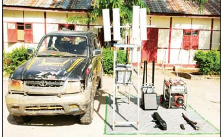
အကြမ်းဖက်သောင်းကျန်းသူများထံမှ သိမ်းပိုက်ရရှိခဲ့သည့် မော်တော်ယာဉ်၊ လက်နက်/ခဲယမ်းနှင့် ဆက်စပ်ပစ္စည်း မှတ်တမ်းဓာတ်ပုံများ။