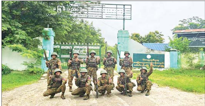
အကြမ်းဖက်သောင်းကျန်းသူများ ထိန်းချုပ်ထားသည့် သပိတ်ကျင်းမြို့အား တပ်မတော်က ပြန်လည်ထိန်းချုပ်။

တပ်မတော်စစ်ကြောင်းများအနေဖြင့် သပိတ်ကျင်းမြို့အတွင်းသို့ ယာယီနေရပ်စွန့်ခွာနေကြရသည့် ဒေသခံပြည်သူများအား အန္တရာယ်ကင်းရှင်းစွာ ပြန်လည်ဝင်ရောက်နေထိုင်နိုင်ရေး မြို့တွင်းမိုင်းရှင်းလင်းခြင်းလုပ်ငန်းများ စတင်ရှင်းလင်းခြင်းနှင့် မိမိတို့၏ အိုးအိမ်နေရာများသို့ ပြန်လည်နေထိုင်လိုပြီး ရိုးသားစွာ မိမိတို့၏ လူမှုစီးပွားဘဝ လုပ်ကိုင်စားသောက်လိုသည့် ယာယီနေရပ်စွန့်ခွာပြည်သူများအနေဖြင့်လည်း သက်ဆိုင်ရာလုံခြုံရေးအဖွဲ့များထံ စနစ်တကျသတင်းပို့၍ နေထိုင်နိုင်ရေး သက်ဆိုင်ရာမှန်ဆော်ထားကြောင်း၊ သက်ဆိုင်ရာတိုင်းဒေသကြီးအစိုးရအဖွဲ့မှလည်း ဌာနဆိုင်ရာဝန်ထမ်းများဖြင့် အစိုးရအုပ်ချုပ်မှုယန္တရားများ၊ စာသင်ကျောင်းများ၊ ဆေးရုံများ အမြန်ဆုံးလည်ပတ်နိုင်ရေး စီမံဆောင်ရွက်လျက်ရှိကြောင်း၊ အောင်ပွဲရတိုက်ပွဲဝင် မြန်မာ့တပ်မတော်သားများအား ဂုဏ်ယူစွာဖြင့် ရရှိသတင်းများကို ဖော်ပြအပ်ပါသည်။ သတင်းစဉ်