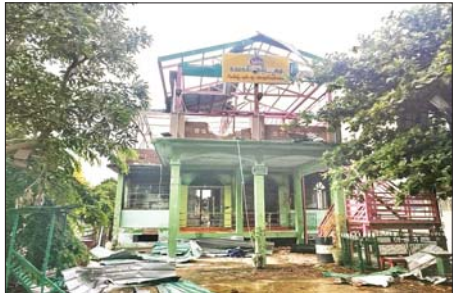
အကြမ်းဖက်သောင်းကျန်းသူများက အများပြည်သူပိုင် နေအိမ်၊ အဆောက်အအုံများအား ဖျက်ဆီးထားသည့်မှတ်တမ်းဓာတ်ပုံ။