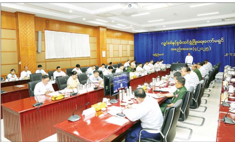
လျှပ်စစ်နှင့်စွမ်းအင်ဖွံ့ဖြိုးရေးကော်မရှင်ဥက္ကဋ္ဌ နိုင်ငံတော်စီမံအုပ်ချုပ်ရေးကောင်စီအဖွဲ့ဝင် ဒုတိယဝန်ကြီးချုပ်နှင့် ပြည်ထောင်စုဝန်ကြီး ဗိုလ်ချုပ်ကြီးတင်အောင်စန်း လျှပ်စစ်နှင့်စွမ်းအင်ဖွံ့ဖြိုးရေးကော်မရှင်အစည်းအဝေးတွင် အမှာစကားပြောကြားစဉ်။

နေပြည်တော် ဇူလိုင် ၂၃ လျှပ်စစ်နှင့်စွမ်းအင်ဖွံ့ဖြိုးရေးကော်မရှင်၏ (၄/၂၀၂၅) အစည်းအဝေးကို ယနေ့ မွန်းလွဲပိုင်းတွင် နေပြည်တော်ရှိ နိုင်ငံတော်စီမံအုပ်ချုပ်ရေးကောင်စီအဖွဲ့ဝင် ဒုတိယဝန်ကြီးချုပ်နှင့် နိုင်ငံတော်ဝန်ကြီးချုပ်ရုံး ပြည်ထောင်စုဝန်ကြီး ဗိုလ်ချုပ်ကြီးတင်အောင်စန်း၊ ကော်မရှင်ဒုတိယဥက္ကဋ္ဌများနှင့် ကော်မရှင်အဖွဲ့ဝင်ပြည်ထောင်စုဝန်ကြီးများ၊ နေပြည်တော်ကောင်စီဥက္ကဋ္ဌနှင့် တာဝန်ရှိသူများ တက်ရောက်ကြပြီး တိုင်းဒေသကြီး၊ ပြည်နယ်ဝန်ကြီးချုပ်များက အွန်လိုင်းမှ တက်ရောက်ကြသည်။