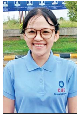
မနန်းအိန္ဒြာ