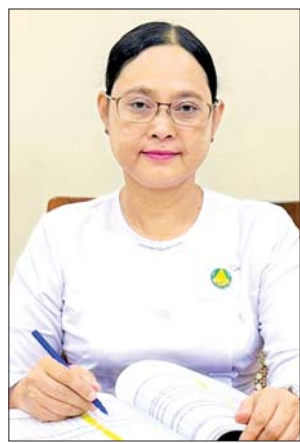
ပညာရေးမှူး ဒေါက်တာ ချိုချိုမြတ်အောင်

“ဗိုလ်တထောင် မြို့နယ်မှာ တက္ကသိုလ်ဝင်စာမေးပွဲ ၄၆၂ ဦး ဖြေဆိုရာမှာ ၂၈၅ ဦး အောင်မြင် ပြီး ဂုဏ်ထူးရှင် ၆၀ ထွက်ပေါ်ခဲ့ ပါတယ်။ ခြောက်ဘာသာဂုဏ်ထူး ရှင် လေးဦး ထွက်ပေါ်ခဲ့ပြီး ၆၁ ဒသမ ၆၉ ရာခိုင်နှုန်းအောင်မြင်ခဲ့တာ