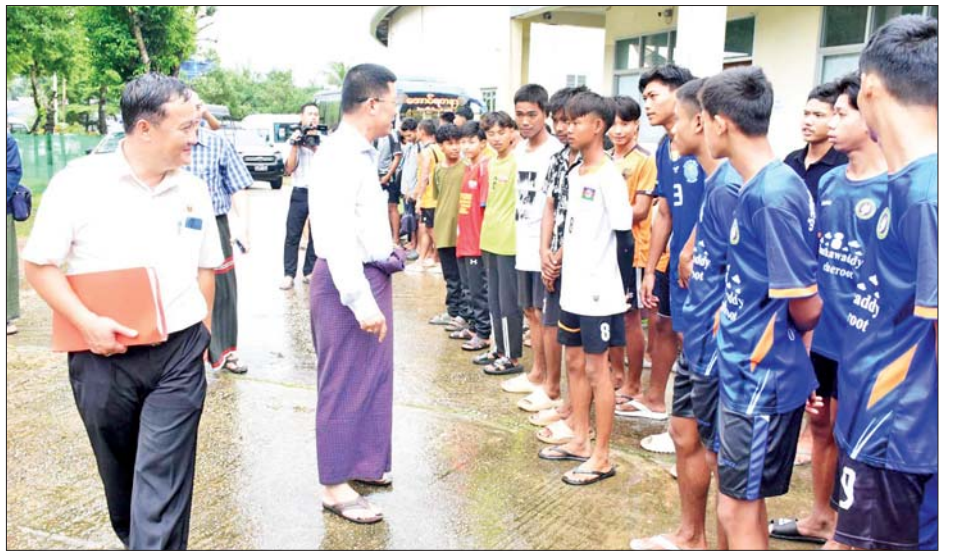
နှစ်အောက် အမျိုးသား၊ အမျိုးသမီးပိုက်ကျော်ခြင်း ကျင်းပသွားမည်ဖြစ်ကြောင်း သိရသည်။ ပြိုင်ပွဲကို ဇူလိုင် ၃၀ ရက်မှ ဩဂုတ် ၇ ရက်အထိ တိုင်းဒေသကြီး(ပြန်/ဆက်)

ဧရာဝတီတိုင်းဒေသကြီး ပုသိမ်မြို့တွင် ၂၀၂၅ ခုနှစ်၊ တိုင်းဒေသကြီးနှင့်ပြည်နယ် အသက်(၂၃)