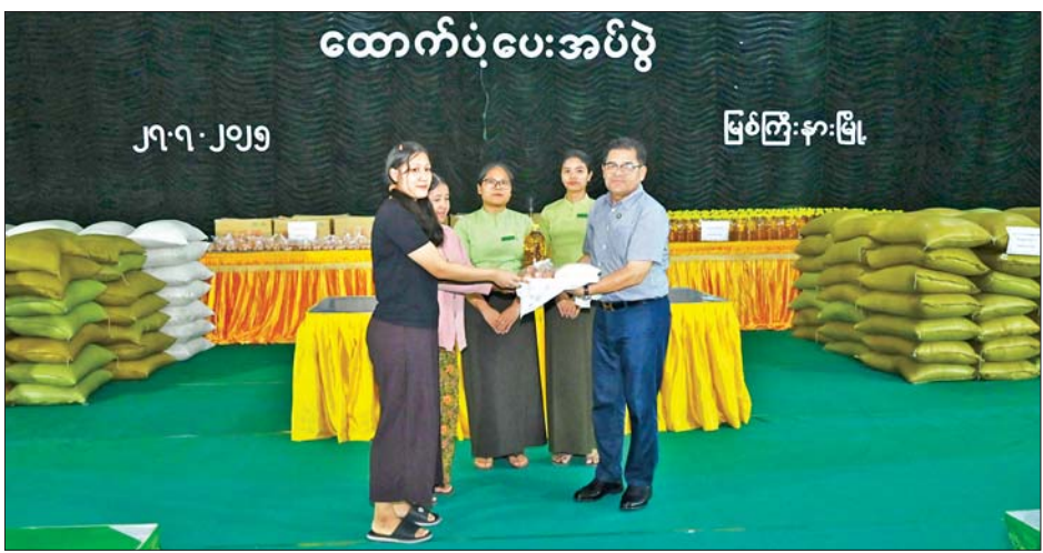
ညှိနှိုင်းဆောင်ရွက်ပေးခဲ့ပြီး ကျောင်းသူတစ်ဦး၏ ဆိုင်ကယ်လိုအပ်ချက်အပေါ် ပြည်နယ်လူမှုရေးရာဝန်ကြီးက ငွေကျပ် ၁၀ သိန်းထောက်ပံ့ပေးအပ်ခဲ့သည်။ ထို့နောက် တက်ရောက်လာကြသည့် အိမ်ထောင်စုများအား ပြည်နယ်အမျိုးသမီးရေးရာအဖွဲ့ နာယကနှင့်အဖွဲ့ဝင်များ၊ ဥက္ကဋ္ဌနှင့်အဖွဲ့ဝင်များက မုန့်နှင့် ရေသန့်ဘူးများကို လိုက်လံဝေငှကျွေးမွေးခဲ့ကြကြောင်း သိရသည်။ (ပြည်နယ်(ပြန်/ဆက်))

လူမျိုး ရိုးရာယဉ်ကျေးမှုအသင်းဥက္ကဋ္ဌတို့က ဗန်းမော်ခရိုင်အတွင်းမှ မြစ်ကြီးနားမြို့နယ်အတွင်းရှိ ဆွေမျိုးများနေအိမ်တွင် နေထိုင်လျက်ရှိသော အိမ်ထောင်စု ၄၁၃ စုနှင့် ရပ်ပူရပ်ကွက် အိမ်ထောင်စုအတွင်း နေထိုင်သော ယာယီနေရပ်စွန့်ခွာ အိမ်ထောင်စုများအနက်မှ ထပ်တိုးအိမ်ထောင်စု ၁၃၆ စုတို့အတွက် စုစုပေါင်း ငွေကျပ် ၅၁၈၄၉၃၀၀ တန်ဖိုးရှိ ဆန် ၂၄ ပြည်ပါ၊ ၅၄၉ အိတ်နှင့် စားဆီ ၅၄၉ ပိဿာနှင့် ကြက်ဥဖာများကို ထောက်ပံ့ပေးအပ်ကြသည်။ ယင်းနောက် ပြည်နယ်ဝန်ကြီးချုပ်က ယာယီနေရပ်စွန့်ခွာ အိမ်ထောင်စုများအား လိုအပ်ချက်များ မေးမြန်းဆွေးနွေးကြရာ အိမ်ထောင်စုများက သက်ဆိုင်ရာ ယာယီစခန်းများနှင့် ဆွေမျိုးများနေအိမ်တို့၌ နေထိုင်စားသောက်ရာတွင် လိုအပ်ချက်များ၊ ပညာရေး၊ ကျန်းမာရေးဆိုင်ရာကိစ္စရပ်များ တင်ပြမှုများနှင့်စပ်လျဉ်း၍ ပြည်နယ်ဝန်ကြီးချုပ်က လိုအပ်သည်များကို ဌာနဆိုင်ရာတာဝန်ရှိသူများနှင့် ပေါင်းစပ်