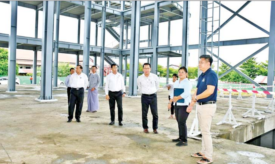
ပြည်ထောင်စုဝန်ကြီး ဦးမောင်မောင်အုန်း ချမ်းမြသာစည်မြို့နယ်ရှိ အနုပညာဗဟိုဌာန တည်ဆောက် ရေးလုပ်ငန်းခွင်တွင် ကြည့်ရှုစစ်ဆေးစဉ်။

မန္တလေး ဇူလိုင် ၂၇ တိုးတက်ခိုင်မာအားကောင်းသည့် လူမှုအသိုက် အဝန်းဖော်ဆောင်ရေး ဆွေးနွေးပွဲတစ်ရပ်ကို ယနေ့ နံနက်ပိုင်းတွင် မန္တလေးမြို့ မဟာအောင်မြေမြို့နယ်ရှိ Y - Mandalay Hotel ၌ကျင်းပရာ တိုးတက်ခိုင်မာ အားကောင်းသည့်လူမှုအသိုက်အဝန်းဖော်ဆောင်ရေး လုပ်ငန်းကော်မတီဒုတိယဥက္ကဋ္ဌ ပြန်ကြားရေးဝန်ကြီး ဌာန ပြည်ထောင်စုဝန်ကြီး ဦးမောင်မောင်အုန်း တက်ရောက်ဆွေးနွေးပြောကြားသည်။ အဆိုပါဆွေးနွေးပွဲသို့ မန္တလေးတိုင်းဒေသကြီး လုံခြုံရေးနှင့် နယ်စပ်ရေးရာဝန်ကြီးနှင့် တိုင်းဒေသ ကြီးဝန်ကြီးများ၊ ပြန်ကြားရေးဝန်ကြီးဌာနမှ တာဝန် ရှိသူများ၊ ခရိုင်နှင့် မြို့နယ်များမှ တာဝန်ရှိသူများ၊ မီးသတ်ဦးစီးဌာနမှ ဝန်ထမ်းများနှင့် အရန်မီးသတ် တပ်ဖွဲ့ဝင်များ၊ ကြက်ခြေနီအသင်းနှင့် လူမှုရေး အသင်းအဖွဲ့များမှ လူငယ်များ၊ မန္တလေးမြို့ရှိ တက္ကသိုလ်၊ ကောလိပ်နှင့် အခြေခံပညာကျောင်းများမှ ပါမောက္ခချုပ်/ ကျောင်းအုပ်ကြီးများနှင့် ကျောင်းသား ကျောင်းသူများ စုစုပေါင်းအင်အား ၄၀၀ ခန့် တက်ရောက်ကြသည်။ ဦးစွာ မန္တလေးမြို့ အမှတ်(၁၄) အခြေခံပညာ အထက်တန်းကျောင်းမှ ကျောင်းသူလေးများက “မင်္ဂလာပါ” သီချင်းဖြင့် သီဆိုကပြပျော်မြေကြသည်။ ဆက်လက်၍ မြန်မာ့အသံနှင့် ရုပ်မြင်သံကြားမှ ထုတ်လုပ်သည့် “ပြင်းထန်တဲ့ မြေလျင်ဒဏ်ကို ကျော်ဖြတ်ကာ ပြန်လည်တည်ဆောက်ကြမယ့် ပိုမိုကောင်းမွန်တဲ့အနာဂတ်” နှင့် “အနာဂတ်ကို ပိုင်စိုးသူ လူငယ်များ” ဗီဒီယိုကလစ်နှစ်ခုကို ဖွင့်လှစ် ပြသသည်။ ထို့နောက် ပြည်ထောင်စုဝန်ကြီး ဦးမောင်မောင် အုန်းက ဆွေးနွေးရာတွင် တိုးတက်ခိုင်မာအားကောင်း သည့် လူမှုအသိုက်အဝန်းဖော်ဆောင်ရေးအတွက်