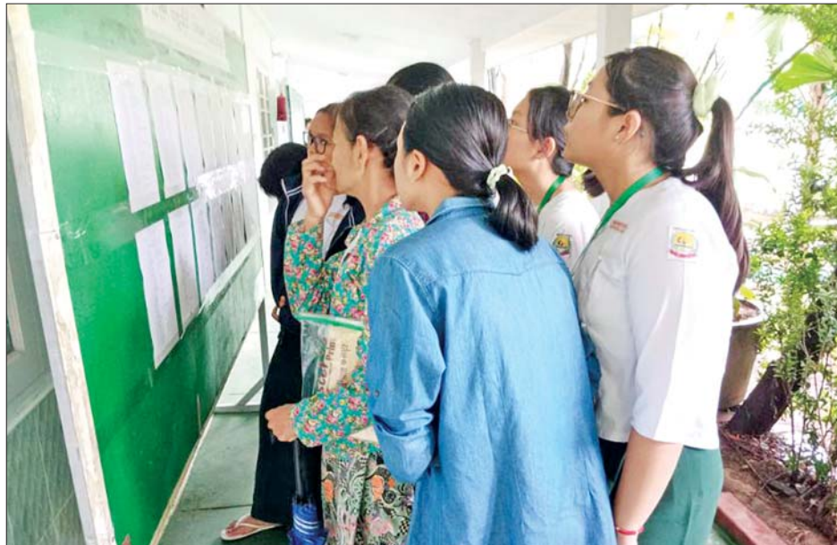
မန္တလေးမြို့ အမှတ်(၁၆) အခြေခံပညာအထက်တန်းကျောင်းတွင် တက္ကသိုလ်ဝင်စာမေးပွဲအောင်စာရင်း လာရောက်ကြည့်ရှုကြသူများအား တွေ့ရစဉ်။

ကိုယ်ပိုင်အထက်တန်းကျောင်းက ဆရာ ဆရာမတွေ ရဲ့ သင်ပြလမ်းညွှန်မှုအောက်မှာ သေချာလေ့လာ မှတ်သားခဲ့ပါတယ်။ ဒါကြောင့် အခုလိုအောင်မြင်မှု ရရှိခဲ့တာဖြစ်ပါတယ်။ ပထမအကြိမ် စာမေးပွဲဖြေဆို တုန်းက အခက်အခဲတချို့ရှိခဲ့ပါတယ်။ ပြီးတော့ သဘာဝဘေးကြောင့် ဒုတိယတစ်ကြိမ် ထပ်ဖြေရမယ် ဆိုတော့ စိတ်ဓာတ်ကျချင်ပေမယ့် ကြိုးစားမှ ဖြစ်မယ် ဆိုတဲ့စိတ်နဲ့ ထပ်ပြီး ကြိုးစားဖြေဆိုခဲ့တာဖြစ်ပါတယ်။ အခုလို ခြောက်ဘာသာဂုဏ်ထူးရရှိတဲ့အတွက် သမီး ငယ်ငယ်ကတည်းက ရည်မှန်းခဲ့တဲ့ ဆရာဝန် တစ်ယောက်ဖြစ်အောင် ကြိုးစားသွားမှာပါ။ သမီး အခုလိုအောင်မြင်မှုရအောင် သမီးရဲ့နောက်ကွယ် ကနေ ပံ့ပိုးပေးတဲ့ မိဘတွေနဲ့ သင်ကြားပြသပေးတဲ့ ဆရာကြီး ဆရာမကြီးတွေကို ကျေးဇူးအများကြီး တင်ရှိပါတယ်” ဟု ပြောသည်။