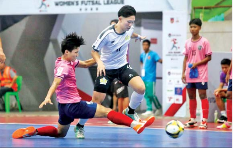
ယူ-၁၉ လိဂ်တွင် Winner Soccer အသင်းနှင့် VUC ULAD အသင်းတို့ ယှဉ်ပြိုင်ကစားကြစဉ်။

ယူ-၁၉ ဖူဆယ်လိဂ်ပြိုင်ပွဲ ပွဲစဉ်(၁၅) တွင် YCDC MHD အသင်းက Pacific Sun Far အသင်းကို ခြောက်ဂိုး-ငါးဂိုး၊ YRG အသင်းက ဖူဆယ်ချစ်သူအသင်းကို ၁၁ ဂိုး-ငါးဂိုး၊ JV အသင်းက ရွှေပြည်သာ ယူနိုက်တက်အသင်းကို တစ်ဂိုး-ဂိုးမရှိ၊ စာမျက်နှာ ၂၄ ကော်လံ ၁ သို့ ○