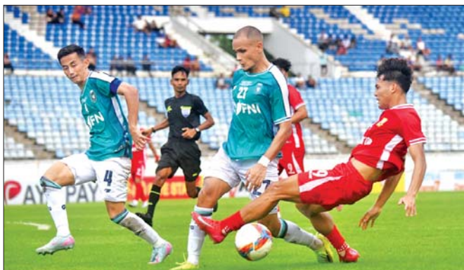
AFC Challenge League ခြေစစ်ပွဲ ယှဉ်ပြိုင်ရမည့် ရန်ကုန်ယူနိုက်တက် အသင်းနှင့် အာဆီယံကလပ် ခြေစစ်ပွဲယှဉ်ပြိုင်ရမည့် ရှမ်းယူနိုက်တက် အသင်းတို့ MNL League Cup ဗိုလ်လုပွဲတွင် တွေ့ဆုံခဲ့စဉ်။

ရန်ကုန် ဇူလိုင် ၂၇ မြန်မာ့လက်ရွေးစင်နှင့် သက်တမ်း အလိုက် လက်ရွေးစင်အသင်းများ၊ ကလပ်အသင်းများသည် ဩဂုတ်လတွင် နိုင်ငံတကာပြိုင်ပွဲနှင့် ခြေစစ်ပွဲများစွာ ဝင်ရောက်ယှဉ်ပြိုင်ရမည် ဖြစ်ပြီး ယင်းပြိုင်ပွဲများထဲမှ နိုင်ငံတကာခြေစစ်ပွဲလေးခုကို မြန်မာနိုင်ငံက အိမ်ရှင်အဖြစ် လက်ခံကျင်းပမည်ဖြစ်သည်။