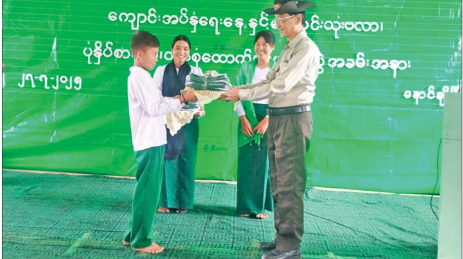
နောင်ချိုမြို့မှ ကျောင်းသား ကျောင်းသူများသည် နိုင်ငံရေးအတွက် တပ်မတော်၊ ဌာနဆိုင်ရာဝန်ထမ်းများနှင့် ပြည်သူ့လူထုတို့ ပူးပေါင်း၍ အလေးထားဆောင်ရွက်ပေးလျက်ရှိကြောင်း သိရသည်။ သတင်းစဉ်

နေပြည်တော် ဇူလိုင် ၂၇ ရှမ်းပြည်နယ်(မြောက်ပိုင်း) နောင်ချိုမြို့၌ ကျောင်း ပြန်လည်တက်ရောက်ကြမည့် ကျောင်းသားကျောင်းသူများအား နိုင်ငံတော်အစိုးရနှင့် တပ်မတော်က ပုံနှိပ်စာအုပ်၊ ကျောင်းဝတ်စုံနှင့် ကျောင်းသုံးစာရေးကိရိယာများ ပေးအပ်ချီးမြှင့်ခြင်းကို ယနေ့နံနက်ပိုင်းတွင် နောင်ချိုမြို့ရှိ အခြေခံပညာအလယ်တန်းကျောင်း(လောက်ဖန်း)၌ ပြုလုပ်ရာ တပ်မတော်မှ တာဝန်ရှိသူများ၊ ကျောက်မဲခရိုင်အုပ်ချုပ်ရေးမှူး၊ ဌာနဆိုင်ရာမှ တာဝန်ရှိသူများ၊ ဆရာ ဆရာမများ၊ ကျောင်းသား ကျောင်းသူများနှင့် ကျောင်းသား မိဘများ တက်ရောက်ကြသည်။ ဦးစွာ ဗိုလ်မှူးကြီး မြင့်ဟိန်းက အမှာစကားပြောကြားသည်။ ထို့နောက် တာဝန်ရှိသူများက ကျောင်းသား ကျောင်းသူများအတွက် နိုင်ငံတော်အစိုးရနှင့် တပ်မတော်က ချီးမြှင့်ပေးအပ်သည့် ကျောင်းသုံးပုံနှိပ်စာအုပ်အစုံ ၁၅၀၊ ခဲတံဒါဇင် ၅၀၊ ဘောပင်အချောင်း ၃၀၀ နှင့် ကျောင်းဝတ်စုံ ၁၅၀ တို့ကို ပေးအပ်ချီးမြှင့်ကြရာ ကျောင်းသားကျောင်းသူများက လက်ခံရယူကြသည်။ အလေးထားဆောင်ရွက် ကျောင်းသား ကျောင်းသူများ အေးချမ်းပျော်ရွှင်စွာ ပညာသင်ကြားနိုင်ရန်နှင့် ကျောင်းနေအရွယ် ကလေးအားလုံး ကျောင်းနေနိုင်ရေးအတွက် နိုင်ငံတော်အစိုးရက စီစဉ်ဆောင်ရွက်ပေးလျက်ရှိရာ အကြမ်းဖက်သောင်းကျန်းမှုများ ယာယီထိန်းချုပ်ခဲ့သည့်