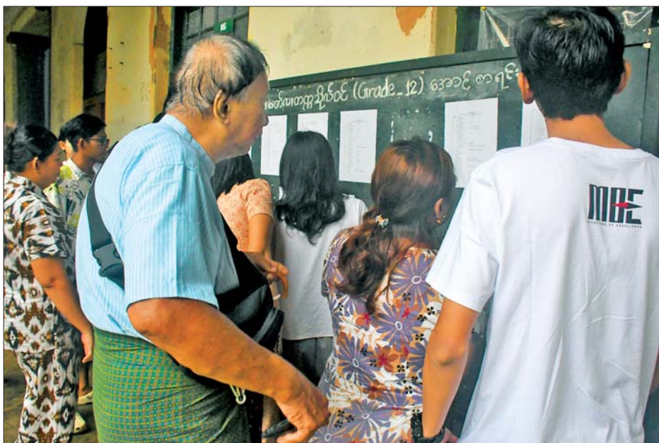
ကျောင်းသား ကျောင်းသူများနှင့် ကျောင်းသားမိဘများ ၂၀၂၅ ခုနှစ် တက္ကသိုလ်ဝင်စာမေးပွဲ အောင်စာရင်း ကြည့်ရှုနေကြစဉ်။

“ဒီနှစ်မှာ ရန်ကုန်တိုင်းဒေသ ကြီးအနေနဲ့ တက္ကသိုလ်ဝင် စာမေးပွဲအောင်ချက် ၅၁ ဒသမ ၆၉ ရာခိုင်နှုန်း ရရှိထားတာကြောင့် တစ်နိုင်လုံးအနေနဲ့ ဒုတိယနေရာ မှာ ရပ်တည်နေပါတယ်။ မွန်ပြည် နယ်က ၅၇ ဒသမ ၁၆ ရာခိုင်နှုန်းနဲ့ တစ်နိုင်လုံးမှာ အောင်ချက်ပထမ ဖြစ်ပါတယ်။ အခုလိုအောင်မြင်မှု ရရှိအောင် အဘက်ဘက်က ဝိုင်းဝန်း ကူညီ ဆောင်ရွက်ပေးခဲ့သူတွေ