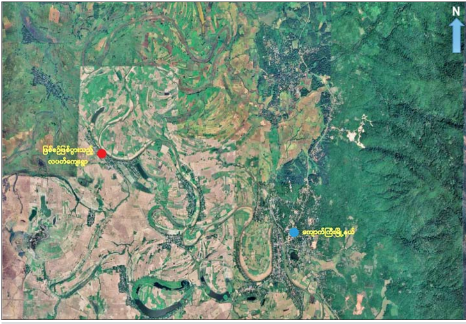
KNLA နှင့် PDF အမည်ခံအကြမ်းဖက်သမားများက ကျောက်ကြီးမြို့နယ်၊ လပတ်ကျေးရွာရှိ အပြစ်မဲ့ ပြည်သူများအား ယုတ်မာရက်စက်လူမဆန်စွာ လာရောက်ပစ်ခတ်သတ်ဖြတ်ခဲ့သည့် ဖြစ်စဉ်နေရာပြပုံ။

နေပြည်တော် ဇူလိုင် ၂၇ ပဲခူးတိုင်း ဒေသကြီး ကျောက်ကြီးမြို့နယ်ကျောက်ကြီး မြို့၏အနောက်ဘက် မီတာ ၄၀၀၀ ခန့်အကွာ လပတ်ကျေးရွာရှိ အပြစ်မဲ့ပြည်သူများအား KNLA နှင့် PDF အမည်ခံအကြမ်းဖက် သမားများက လက်နက်ငယ်များ၊ တုတ်၊ စားများဖြင့် အကြောင်းမဲ့ ပစ်ခတ် ခတ်ဖြတ်ခဲ့မှုကြောင့် လူမမည် ကလေးငယ်များနှင့် သက်ကြီးဘိုးဘွားများ အပါအဝင် အပြစ်မဲ့ပြည်သူ ၁၃ ဦး သေဆုံး ခဲ့ပြီး ၁၅ ဦး ထိခိုက်ဒဏ်ရာရရှိခဲ့ ကြောင်း သိရသည်။