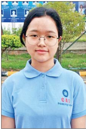
မနန်းရတီထွန်း