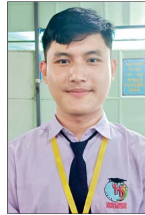
မောင်ဟိန်းမင်းကို