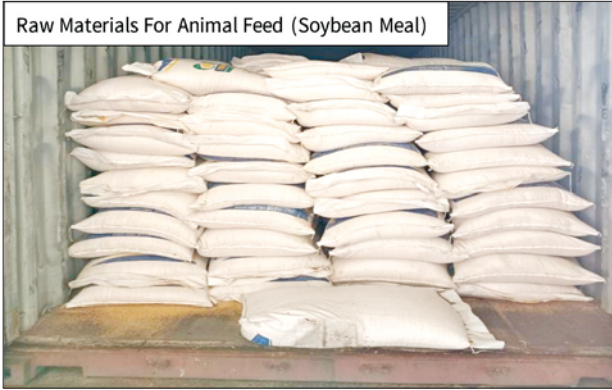
အေးရှားဝေါလ်ဆိပ်ကမ်း၌ ဖမ်းဆီးရမိမှု။

နေပြည်တော် ဇူလိုင် ၂၇ တရားမဝင် ကုန်သွယ်မှု တိုက်ဖျက်ရေးဦးဆောင်ကော်မတီ ၏ ကြီးကြပ်ကွပ်ကဲမှုဖြင့် တရားမဝင်ကုန်သွယ်မှုများကို ဥပဒေနှင့်အညီ ထိရောက်စွာ တားဆီးအရေးယူနိုင်ရေး ဆောင်ရွက်လျက်ရှိသည်။