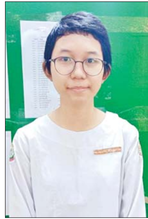
မအေးချမ်းပြည့်