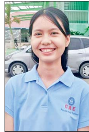
မကြည်နူးမေ