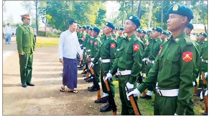
ဧရာဝတီတိုင်းဒေသကြီးဝန်ကြီးချုပ် ဦးတင်မောင်ဝင်း နယ်မြေခံသင်တန်းကျောင်းတွင် ဖွင့်လှစ်သည့် ပြည်သူ့စစ်မှုထမ်းသင်တန်းအမှတ်စဉ်(၁၃)မှ သင်တန်းသားများအား ရင်းရင်းနှီးနှီး လိုက်လံနဲ့တံဆက်စဉ်။