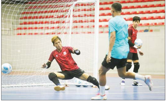
မြန်မာ့လက်ရွေးစင် ဖူဆယ်အသင်း ယခုနှစ်ဆန်းပိုင်းက လေ့ကျင့်နေစဉ်။

မြန်မာ့လက်ရွေးစင် ဖူဆယ်အမျိုးသားအသင်း နည်းပြချုပ်ဖြစ်သူ ထိုင်းနိုင်ငံသား ပတ္တရာပီခွန်သည် ၂၀၂၆ အာရှဖလား ဖူဆယ်ခြေစစ်ပွဲအတွက် ပဏာမကစားသမား ၂၄ ဦး ရွေးချယ်လိုက်ပြီဖြစ်သည်။