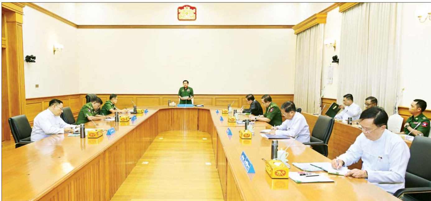
ယာယီသမ္မတ(တာဝန်) တပ်မတော်ကာကွယ်ရေးဦးစီးချုပ် ဗိုလ်ချုပ်မှူးကြီး မင်းအောင်လှိုင် ပြည်ထောင်စုသမ္မတမြန်မာနိုင်ငံတော် အမျိုးသားကာကွယ်ရေးနှင့်လုံခြုံရေးကောင်စီအစည်းအဝေး(၃/၂၀၂၅) တွင် ရှင်းလင်းပြောကြားစဉ်။