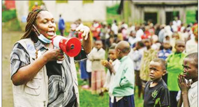
ကွန်ဂိုဒီမိုကရက်တစ်သမ္မတနိုင်ငံရှိ ကျောင်းသားများကို ကာလဝမ်းရောဂါကာကွယ်ရေးဆိုင်ရာ သတိပေးချက်များ ရှင်းပြနေစဉ်။