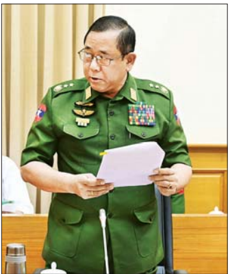
ပြည်ထောင်စုဝန်ကြီးဌာန ပြည်ထောင်စုဝန်ကြီး ဒုတိယဗိုလ်ချုပ်ကြီး ထွန်းထွန်းနောင်။

ကာကွယ်ရေးဝန်ကြီးဌာန ပြည်ထောင်စုဝန်ကြီးဗိုလ်ချုပ်ကြီး မောင်မောင်အေးက ယာယီသမ္မတ(တာဝန်) တပ်မတော်ကာကွယ်ရေးဦးစီးချုပ်၏ ရှင်းလင်းတင်ပြချက်များအရ နိုင်ငံတော်စီမံအုပ်ချုပ်ရေးကောင်စီအနေဖြင့် တာဝန်ယူသည့် ၄ နှစ်ကာကွယ်ကာလအတွင်း ရှေ့လုပ်ငန်းစဉ်များနှင့် ဦးတည်ချက်များကို အောင်မြင်စွာ အကောင်အထည်ဖော်ဆောင်ရွက်နိုင်ခဲ့ပြီး ဖြစ်ပါကြောင်း၊ လွတ်လပ်၍ တရားမျှတသော ပါတီစုံဒီမိုကရေစီအထွေထွေရွေးကောက်ပွဲကိုလည်း စည်းစနစ်ကျနစွာဖြင့်