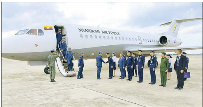
ကြိုဆိုနှုတ်ဆက်ခဲ့ကြပြီး တာဝန် ရှိသူတစ်ဦးက သင်တန်းကျောင်း ၏ သမိုင်းကြောင်း၊ ဖွဲ့စည်းပုံ၊ ရည်မှန်းချက် တာဝန်၊ သင်ရိုး ညွှန်းတမ်း၊ သင်ကြားမှုနည်းစနစ် များ၊ သင်တန်းသား အရည်အချင်း သတ်မှတ်ချက်များနှင့်ပတ်သက် ၍ ရှင်းလင်းတင်ပြသည်။ လေ့လာခဲ့ကြကြောင်း သတင်းရရှိ သည်။

ဆက်လက်၍ နှစ်နိုင်ငံ လေတပ်များအကြား ချစ်ကြည် ရင်းနှီးမှု ပိုမိုရရှိစေရန်အတွက် Bilateral Engagement Activi- ties ဆိုင်ရာ လှုပ်ရှားမှုများကို ဆောင်ရွက်ခဲ့ကြသည်။ ညပိုင်း တွင် ထိုင်းဘုရင့်လေတပ်ဦးစီး ချုပ်က တည်ခင်းမည့်ခံသော ဂုဏ်ပြုဥပဒေစာစားပွဲ အခမ်းအနား သို့ တက်ရောက်ခဲ့ပြီး အမှတ်တရ လက်ဆောင်များ အပြန်အလှန် ပေးအပ်ခဲ့ကြသည်။