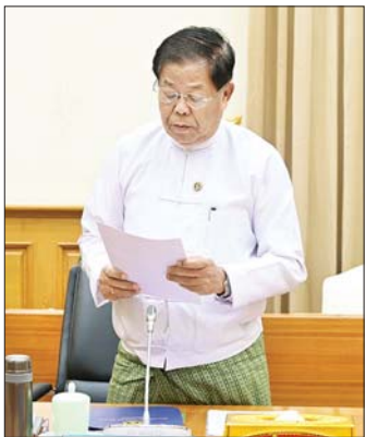
နိုင်ငံခြားရေးဝန်ကြီးဌာန ပြည်ထောင်စုဝန်ကြီး ဦးသန်းဆွေ။

နိုင်ငံခြားရေးဝန်ကြီးဌာန ပြည်ထောင်စုဝန်ကြီးဦးသန်းဆွေက နိုင်ငံတော်စီမံအုပ်ချုပ်ရေးကောင်စီတာဝန်ယူထားသည့်ကာလအတွင်း နိုင်ငံတကာဆက်ဆံရေးနှင့်ပူးပေါင်းဆောင်ရွက်မှုများကို တိုးမြှင့်ဆောင်ရွက်နိုင်ခဲ့ကြောင်း၊ ၂၀၂၄-၂၀၂၅ ခုနှစ်အတွင်း ဌာန GMS | MLC | ACMECS | CLMV | BIMSTESCS