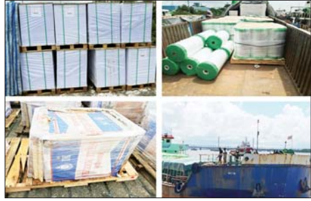
သာကောတဆိပ်ကမ်း၌ ဖမ်းဆီးရမိမှု။

အကောက်ခွန်လုပ်ထုံးလုပ်နည်းများနှင့်အညီ အရေးယူဆောင်ရွက် လျက်ရှိသည်။ ဇူလိုင် ၃၀ ရက်တွင် ပြည်ထဲရေးဝန်ကြီးဌာန၊ မြန်မာနိုင်ငံရတပ်မှူး၏ ဖမ်းဆီးရမိမှု စာရင်းများအရ လိုင်စင်မဲ့မော်တော်ယာဉ်ခြောက်စီးနှင့် လိုင်စင်မဲ့မော်တော်ယာဉ်ဆိုင်ကယ် ၃၅ စီး ဖမ်းဆီးရမိခဲ့ပြီး သက်ဆိုင်ရာ လုပ်ထုံးလုပ်နည်း၊ ဥပဒေများနှင့်အညီ အရေးယူဆောင်ရွက်လျက်ရှိ သည်။ ဇူလိုင် ၂၉ ရက်နှင့် ၃၀ ရက်တို့တွင် ဖမ်းဆီးရမိမှုစုစုပေါင်းမှာ အမှုတွဲ ၁၅ မှု (ခန့်မှန်းတန်ဖိုးငွေကျပ် ၄၀၀၀၀၀၀)ကို ဖမ်းဆီးရမိခဲ့သည်။ နိုင်ငံတော်၏ စီးပွားရေးဦးတည်ချက်များနှင့်အညီ ကုန်သွယ်မှုကဏ္ဍ ဖွံ့ဖြိုးတိုးတက်အောင် ဆောင်ရွက်ရာတွင် တရားမဝင်ကုန်သွယ်မှုများ သည် အဓိကအဟန့်အတားဖြစ်ပေါ်စေပြီး လူမှုစီးပွားရေးကဏ္ဍအပေါ် များစွာ ဆိုးကျိုးသက်ရောက်ခြင်းများကြောင့် ၎င်းတရားမဝင်တို့သွင်း မှုများအား သက်ဆိုင်ရာ တာဝန်ရှိသူများက ယခုထက်ပိုမို၍ တားဆီး စစ်ဆေးကြပ်မတ်ဆောင်ရွက်သွားမည်ဖြစ်ကြောင်း တရားမဝင် ကုန်သွယ်မှုတိုက်ဖျက်ရေးဦးဆောင်ကော်မတီ မှ သိရသည်။ သတင်းစဉ်