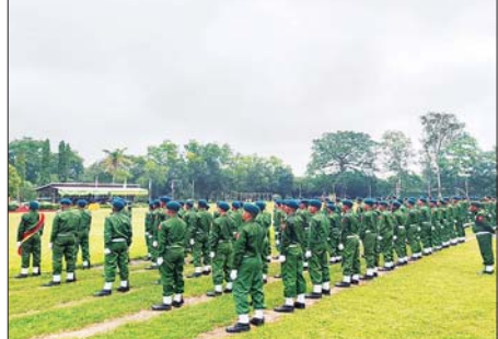
တိုင်းစစ်ဌာနချုပ်များရှိ နယ်မြေခံသင်တန်းကျောင်းအသီးသီး၌ ပြည်သူ့စစ်မှုထမ်းသင်တန်းအမှတ်စဉ်(၁၃)သင်တန်းဆင်းပွဲများ ကျင်းပပြုလုပ်စဉ်။