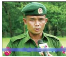
သင်တန်းသားတစ်ဦး။

အကျင့်ကောင်းများ၊ ယုံကြည်ချက်၊ ခံယူချက်များနှင့် သင်တန်းဆင်းပြီးနောက် မိမိတို့တာဝန်ကျရာ တပ်ရင်း၊ တပ်ဖွဲ့များ၌ ဆက်လက် တာဝန်ထမ်းဆောင်သွားမည့် အခြေအနေများနှင့် ပတ်သက်၍ သင်တန်းဆင်း နိုင်ငံသားကောင်းစစ်သည်များ၏ စကားသံများကိုလည်း ယခုလို ကြားသိရပါသည်။ “ပြည်သူ့စစ်မှုထမ်းသင်တန်းအမှတ်စဉ်(၁၃)မှာ ကျွန်တော်ရရှိခဲ့တဲ့ဆုကတော့ စံပြတပ်သားဆုပဲ ဖြစ်ပါတယ်။ ကျွန်တော်အနေနဲ့ နည်းပြတွေ သင်ကြားပေးတဲ့ ပညာရပ်တွေကို သေချာလိုက်မှတ်တယ်။ ကြိုးစားအားထုတ်ပြီး လိုက်ပါလုပ်ဆောင်လို့ အခုလို ဆုရရှိခဲ့တယ်လို့ ထင်ပါတယ်။ နိုင်ငံတော်နဲ့ တပ်မတော်ကို ကာကွယ်ချင်တဲ့စိတ်နဲ့ ဝင်လာခဲ့ခြင်းဖြစ်ပါတယ်။ ကျွန်တော်ကတော့ ပြည်သူ့စစ်မှုထမ်းသင်တန်းအမှတ်စဉ်(၁၃)သင်တန်းကျောင်းဆင်းသွားပြီးနောက် ကျွန်တော်ရောက်ရှိမယ့် မိခင်တပ်ရင်းကို ရောက်ရင် ပေးအပ်တဲ့တာဝန်နဲ့ အမိန့်တွေကို ကျေပွန်စွာ ထမ်းဆောင်သွားမယ်လို့ ခံယူထားပါတယ်။ ကျွန်တော်တို့လို