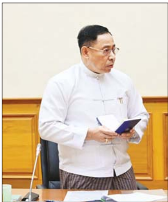
နယ်စပ်ရေးရာဝန်ကြီးဌာန ပြည်ထောင်စုဝန်ကြီး ဒုတိယဗိုလ်ချုပ်ကြီး ရာပြည့်။

ဆွေးနွေးတင်ပြချက်များနှင့် ပတ်သက်၍ ယာယီသမ္မတ(တာဝန်) တပ်မတော် ကာကွယ်ရေးဦးစီးချုပ်က ရွေးကောက်ပွဲပြုလုပ်နိုင်ရန်အတွက် အမျိုးသားကာကွယ်ရေးနှင့် လုံခြုံရေးကောင်စီအဖွဲ့ဝင်များ အနေဖြင့် ထောက်ခံတင်ပြခဲ့ပါကြောင်း၊ ရွေးကောက်