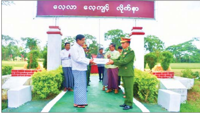
ရန်ကုန်တိုင်းဒေသကြီးဝန်ကြီးချုပ် ဦးစိုးသိန်း ပြည်သူ့စစ်မှုထမ်းသင်တန်းအမှတ်စဉ်(၁၃)မှ သင်တန်းသားများအတွက် ချီးမြှင့်ငွေပေးအပ်စဉ်။