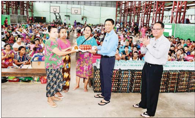
ကယ်ဆယ်ရေး စခန်း ၅၉ ခုဖွင့်လှစ်၍ အိမ်ထောင်စု ၇၂၃၈ စု၊ လူဦးရေ ၃၂၂၇၇ ဦးတို့အား ယာယီ ပြောင်းရွှေ့နေရာချထားပေးခဲ့ကာ လူမှုဝန်ထမ်း၊ ကယ်ဆယ်ရေးနှင့် ပြန်လည်နေရာချထားရေးဝန်ကြီး ဌာနအနေဖြင့် အိမ်ထောင်စု ၂၇၄၈ စု၊ လူဦးရေ ၁၁၅၇၅ ဦးအတွက် ဆန်ရိက္ခာနှင့် ခေါက်ဆွဲခြောက် ဖိုးငွေ ၅၈၆၅၅၅၀ ကို ချီးမြှင့်ပေးအပ်ခဲ့ပြီး ကျန်ရှိ သည့် အိမ်ထောင်စုများကိုလည်း ဆက်လက် ပေးအပ်သွားမည်ဖြစ်ကြောင်း သိရသည်။ စောမျိုးမင်းသိန်း(ပြန်/ဆက်)

ကယ်ဆယ်ရေးစခန်းရှိ ရေဘေးရှောင်ပြည်သူများနှင့် ဘားအံမြို့ အမှတ်(၃) အခြေခံပညာအထက်တန်း ကျောင်း ယာယီရေဘေးကယ်ဆယ်ရေးစခန်းရှိ ရေဘေးရှောင်ပြည်သူများအား သွားရောက်တွေ့ဆုံ အားပေးပြီး ဆန်ရိက္ခာဖိုးငွေနှင့် စားသောက်ကုန် ပစ္စည်းများ ပေးအပ်ကြသည်။ ယင်းနောက် လှိုင်းဘွဲ့မြို့(ဃ)ရပ်ကွက် အနိမ့်ပိုင်း ရှိ လူနေအိမ်များအတွင်း ရေများဝင်ရောက်နေမှုနှင့် သက်ဆိုင်ရာ တာဝန်ရှိသူများက ဘေးလွတ်ရာ ကယ်ဆယ်ရေးစခန်းများသို့ ယာယီပြောင်းရွှေ့ နေရာချထားပေးနေမှု၊ ဘားအံမြို့၏ အနိမ့်ပိုင်း အမှတ်(၅)ရပ်ကွက် အောင်နန်း၊ အမှတ်(၁) ရပ်ကွက် အုပ်ဖို၊ အမှတ်(၂)ရပ်ကွက် ဆယ်အိမ်စုတို့တွင် ရေကြီး ရေလျှံနေမှု၊ လူနေအိမ်များအတွင်း ရေဝင်ရောက်မှု၊ နေအိမ်များအားစွန့်ခွာ၍ ယာယီရေဘေးကယ်ဆယ် ရေးစခန်းများသို့ သွားရောက်နေထိုင်မှုအခြေအနေများ ကို စက်တင်ဘာလလေ့လာမှုအဖွဲ့ဖြင့် လှည့်လည်ကြည့်ရှုကာ တာဝန်ရှိသူများအား လိုအပ်သည်များမှာကြားသည်။ ကရင်ပြည်နယ်အတွင်း ရေဘေးစတင်ဖြစ်ပွား သည့်အချိန်မှစ၍ ယနေ့အချိန်ထိ ယာယီရေဘေး