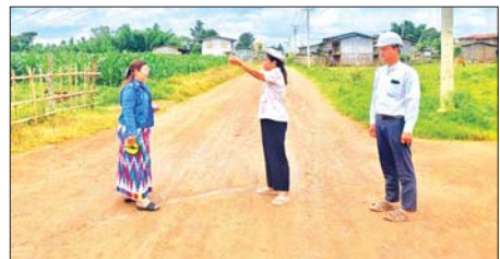
ဆောင်ရွက်မည်ဖြစ်ကြောင်း တာဝန်ရှိသူများက မြေပြင်ကွင်းဆင်း ကြည့်ရှုစစ်ဆေးခဲ့ပြီးဖြစ်ကြောင်း သိရသည်။ မြို့နယ်(ပြန်/ဆက်)

ပင်လောင်း ဩဂုတ် ၁ ပင်လောင်းမြို့နယ်အတွင်း ကျေးလက်လမ်းဖွံ့ဖြိုးရေးဦးစီးဌာနက ၂၀၂၅-၂၀၂၆ ဘဏ္ဍာနှစ် ပြည်ထောင်စု/ပြည်နယ် ငွေလုံးငွေရင်း ရန်ပုံငွေဖြင့် ကျေးလက်ဒေသဖွံ့ဖြိုးရေးလုပ်ငန်းများ ဆောင်ရွက် မည်ဖြစ်ရာ ယင်းလုပ်ငန်းများမှာ နောင်တရား-စီးလောင်ကုန်း- နန်းပါလင်း ကတ္တရာလမ်းခင်းခြင်းလုပ်ငန်း၊ နောင်ကောက် -ခေါ်ပင် လမ်းပေါ်ရှိ ပေ ၃၀ တံတားတစ်စင်းနှင့် ပြည်နယ်ငွေလုံးငွေရင်းရန်ပုံငွေဖြင့် ဆောင် ရွက်မည့် ဆည်ခေါင်း-နောင်မွန်-နောင်လင်-ဘန်ပြင် -လုံးပိုး ကတ္တရာ လမ်းခင်းခြင်းလုပ်ငန်းအပါအဝင် ယင်းလမ်းပေါ်ရှိ ပေ ၄၀ တံတား တစ်စင်း၊ သတ်-ဘုရားပေါ်-မြေကုန်းလမ်းပေါ်ရှိ ပေ ၄၀ တံတားတစ်စင်း