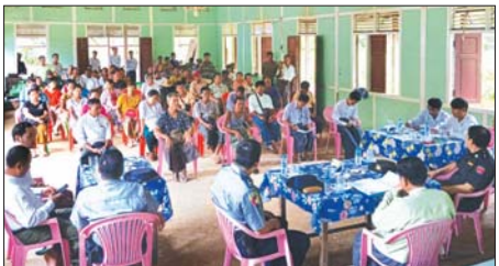
အတွင်းရှိ နယ်မြေဒေသအခြေ အနေများ၊ ပညာရေး၊ ကျန်းမာရေး နှင့် ပြည်သူ့လူထု၏ စားဝတ်နေ ရေးအထိ သက်ရောက်လာနိုင်သည့်