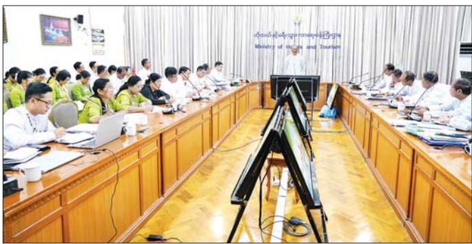
နှင့် စည်းစနစ်တကျ နေထိုင်ကြ ဝန်ထမ်းမိသားစုများ၏ အခြေခံ ဆောင်ရွက်ပေးရေး မှာကြား ရေး၊ ဌာနတာဝန်ရှိသူများအနေဖြင့် လိုအပ်ချက်များကို ဖြည့်ဆည်း သတင်းစဉ်

လုပ်ငန်း ဖြစ်ပေါ်လာစေရေး မျှော်မှန်းပြီး ပူးပေါင်းကြိုးပမ်း ဆောင်ရွက်ပေးကြရန် မှာကြား သည်။ ထို့နောက် ပြည်ထောင်စု ဝန်ကြီးသည် ငလျင်ဒဏ်ခံစားခဲ့ရ သည့် ဝန်ထမ်းများနှင့်မိသားစုဝင် များ ယာယီနေထိုင်နိုင်ရန် ဝန်ကြီး ဌာနရုံးအနီးတွင် ဆောက်လုပ် ထားရှိသည့် နှစ်ခန်းတွဲ ဘာရှာ အဆောက်အအုံများ၌ နေထိုင် နေမှု အခြေအနေများကို ကြည့်ရှု စစ်ဆေးကာ ဝန်ထမ်းများနှင့် မိသားစုဝင်များ လိုင်းစည်းကမ်း