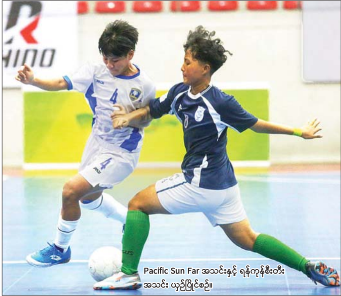
Pacific Sun Far အသင်းနှင့် ရန်ကုန်စီးတီး အသင်း ယှဉ်ပြိုင်စဉ်။

ရန်ကုန် ဩဂုတ် ၁ အမျိုးသမီး ဖူဆယ်လိဂ်ပြိုင်ပွဲ ပွဲစဉ် (၁၀) ကို ဩဂုတ် ၁ ရက်က ရန်ကုန်မြို့ သုဝဏ္ဏဘောလုံးကွင်းရှိ MFF ဖူဆယ်အားကစားရုံ၌ ကျင်းပရာ YRG အသင်း ဆက်လက် ဦးဆောင်နေပြီး Pacific Sun Far အသင်း အဆင့်တက်လာသည်။ ယခုတစ်ပတ်တွင် ရန်ကုန်စီးတီးအသင်းနှင့် အား/ကာသိပွဲ အသင်းတို့၏ ရှုံးပွဲကြောင့် Pacific Sun Far အသင်း အဆင့် ၄ နေရာ ရောက်လာပြီး YRG အသင်းမှာမူ နိုင်ပွဲနှင့်အတူ ဆက်လက် ဦးဆောင်လျက်ရှိသည်။ Thunder Tigresses အသင်းနှင့် Divine အသင်းတို့ နိုင်ပွဲပြန်ရသော်လည်း ထိပ်ဆုံးမှ YRG အသင်းနှင့် ခုနစ်မှတ်အထိ ကွာဟနေဆဲဖြစ်သည်။ စာမျက်နှာ ၁၃ ကော်လံ ၁ ☹