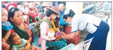
ပန်းမောက်မြို့ ပြည်သူ့ဆေးရုံကြီး၌ ပုံမှန်ကာကွယ်ဆေးထိုးနှံ