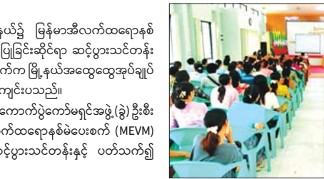
ဆရာ ဆရာမ ၄၁၉ ဦးအား သင်တန်းနည်းပြများက ခေတ်စီနည်းပညာဖြင့် စာတွေ့ လက်တွေ့ စနစ်တကျ ပို့ချသင်ကြားပေးခဲ့ကြောင်း သိရသည်။