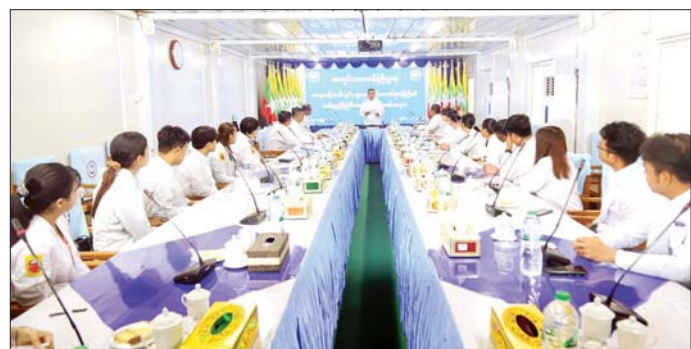
ထိုနေ့က ပြည်ထောင်စုဝန်ကြီးနှင့် တာဝန်ရှိသူ မည့် ဆရာဝန်များအား ရင်းရင်းနှီးနှီးနှုတ်ဆက်ခဲ့ကြပြီး (ရန်ကုန်၊ မန္တလေး) တို့တွင် တာဝန်ထမ်းဆောင်

ခန့်အပ်ခဲ့ခြင်းဖြစ်ကြောင်း၊ ကျန်းမာရေးစောင့်ရှောက်မှုများကို လူမှုဖူလုံရေးအဖွဲ့ပိုင် ရန်ကုန်နှင့် မန္တလေးတို့ရှိ အလုပ်သမားဆေးရုံကြီး၊ မြို့နယ်လူမှုဖူလုံရေးဆေးခန်း၊ ဌာနကြီးဆေးခန်း၊ တိုင်းရင်းဆေးကုခန်း၊ ပုဂ္ဂလိကနှင့် ပူးပေါင်းဆောင်ရွက်သည့်စာချုပ်ဆေးခန်း၊ သားဖွားခန်းနှင့် ရွှေလျားဆေးကုသယာဉ်များအပြင် အလုပ်သမားဆေးရုံကြီး (ရန်ကုန်)၊ (မန္တလေး)တို့၌ ကျောက်ကပ်သန့်စင်ခြင်းလုပ်ငန်းများ ဆောင်ရွက်ပေးလျက်ရှိကြောင်း၊ ဆရာဝန်(သစ်လွင်)များအနေဖြင့် အလုပ်သမားဆေးရုံကြီးများတွင် တာဝန်ထမ်းဆောင်လျက်ရှိသည့် ဆရာဝန်ကြီးများ၊ ဆရာဝန်များနှင့်လက်တွဲ၍ ဆေးကုသမှုဆိုင်ရာ အတွေ့အကြုံများအား လုပ်ငန်းခွင်လက်တွေ့လေ့လာသင်ယူကြရန်နှင့် ဆေးကုသမှုလုပ်ငန်းများ ဆောင်ရွက်ရာ၌ နွေးထွေးပျူငှာစွာ စေတနာထား ဆောင်ရွက်ကြရန် မှာကြားသည်။