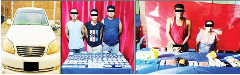
ဖြစ်မှုကျူးလွန်သူများကို ဖမ်းဆီးရမိသည့် စိတ်ပြောင်းဆေးဝါးများနှင့်အတူ တွေ့ရစဉ်။