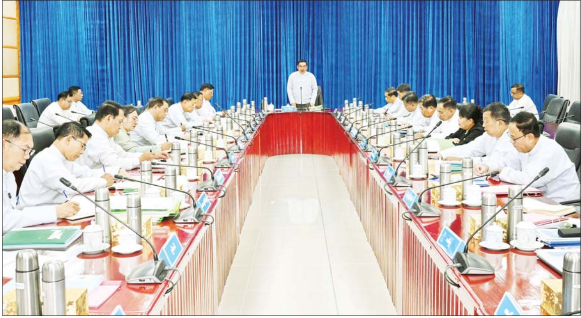
နိုင်ငံတော်ဝန်ကြီးချုပ် ဦးညိုစော ပြည်ထောင်စုသမ္မတမြန်မာနိုင်ငံတော် ပြည်ထောင်စုအစိုးရအဖွဲ့အစည်းအဝေးတွင် အမှာစကား ပြောကြားစဉ်။

နေပြည်တော်၊ ဩဂုတ် ၁ ပြည်ထောင်စုသမ္မတ မြန်မာ နိုင်ငံတော် ပြည်ထောင်စုအစိုးရ အဖွဲ့ အစည်းအဝေးကို ယနေ့ မွန်းလွဲပိုင်းတွင် နိုင်ငံတော်ဝန်ကြီး ချုပ်ရုံး အစည်းအဝေးခန်းမ၌ ကျင်းပပြုလုပ်ရာ နိုင်ငံတော် ဝန်ကြီးချုပ် ဦးညိုစော တက် ရောက် အမှာစကား ပြောကြား သည်။ အစည်းအဝေးသို့ ပြည်ထောင်စု အစိုးရအဖွဲ့ဝင် ဝန်ကြီးများ၊ ဒုတိယဝန်ကြီးများနှင့် တာဝန်ရှိ သူများ တက်ရောက်ကြသည်။ ဦးစွာ နိုင်ငံတော်ဝန်ကြီးချုပ် က အဖွင့်အမှာစကား ပြောကြား ရာတွင် ယခုအစိုးရအဖွဲ့သည် အမျိုးသားကာကွယ်ရေးနှင့်လုံခြုံ ရေးကောင်စီက ဖွဲ့စည်းထားသည့် ပြည်ထောင်စုအစိုးရအဖွဲ့ ဖြစ် ကြောင်း၊ မိမိတို့အစိုးရအနေဖြင့် ဒို့တာဝန်အရ(၃)ပါး ဖြစ်သည့် စာမျက်နှာ ၄ ကော်လံ ၁၂