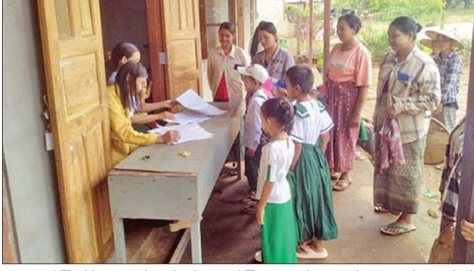
ပညာ သင်ကြားနိုင်ရေးအတွက် ဖွင့်လှစ်ပညာသင်ကြားပေးလျက် ရှိရာ ယနေ့တွင်လည်း ကျောင်းသား ကျောင်းသူ ၇၄၈ ဦး ထပ်မံ၍ လာရောက်အပ်နှံသဖြင့် စုစုပေါင်း

နေပြည်တော် ဩဂုတ် ၁ ရှမ်းပြည်နယ် (မြောက်ပိုင်း) နောင်ချိုမြို့၌ အကြမ်းဖက် သောင်းကျန်းမှုများကြောင့်အခြေခံ ပညာကျောင်းများအား တစ်နှစ် နီးပါး ပိတ်ထားခဲ့ရပြီး ဇူလိုင် ၂၅ ရက်မှစ၍ အခြေခံပညာကျောင်း များကို ပြန်လည်ဖွင့်လှစ်ပြီး ကျောင်းသား ကျောင်းသူများအား စာပေပညာရပ်များကို သင်ကြား ပေးလျက်ရှိသည့်အပြင် ကျောင်း အပ် လက်ခံခြင်းကိုလည်း ဆက်လက်ဆောင်ရွက်ပေးလျက် ရှိသည်။