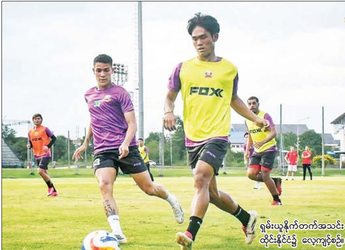
ရှမ်းယူနိုက်တက်အသင်း ထိုင်းနိုင်ငံ၌ လေ့ကျင့်စဉ်။

ရန်ကုန် ဩဂုတ် ၁ မြန်မာနေရှင်နယ်လိဂ် ထိပ်သီးကလပ် ရှမ်းယူနိုက်တက်အသင်းသည် ၂၀၂၅-၂၀၂၆ ရာသီ အာဆီယံကလပ်ချန်ပီယံရှစ်ပြိုင်ပွဲ ခြေစစ်ပွဲ ပထမအကျော့ အဝေးကွင်းပွဲ ယှဉ်ပြိုင်ကစားရန် ထိုင်းနိုင်ငံသို့ရောက်ရှိနေပြီး ခြေစစ်ပွဲအတွက် ပြင်ဆင်မှုအဖြစ် ထိုင်းထိပ်သီးကလပ် ဘူရီရမ်ယူနိုက်တက်အသင်းနှင့် ခြေစမ်းကစားမည်ဖြစ်သည်။ ရှမ်းယူနိုက်တက်အသင်းနှင့် ဘူရီရမ် ယူနိုက်တက်အသင်းသည် ဩဂုတ် ၂ ရက် မြန်မာစံတော်ချိန် ညနေ ၅ နာရီခွဲတွင် စာမျက်နှာ ၁၃ ကော်လံ ၁ ■