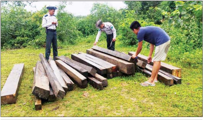
ပဲခူးတိုင်းဒေသကြီး၌ ဖမ်းဆီးရမိမှု။

နေပြည်တော် ဩဂုတ် ၁ တရားမဝင်ကုန်သွယ်မှု တိုက်ဖျက်ရေးဦးဆောင် ကော်မတီ၏ ကြီးကြပ်ကွပ်ကဲမှုဖြင့် တရားမဝင် ကုန်သွယ်မှုများကို ဥပဒေနဲ့အညီ ထိရောက်စွာ တားဆီးအရေးယူနိုင်ရေး ဆောင်ရွက်လျက်ရှိသည်။ ထိုသို့ဆောင်ရွက်လျက်ရှိရာ ဇူလိုင် ၃၀ ရက်တွင် မကွေးတိုင်းဒေသကြီး တရားမဝင် ကုန်သွယ်မှု တိုက်ဖျက်ရေးအဖွဲ့၏ စီမံခန့်ခွဲမှုဖြင့် တာဝန်ကျ ပူးပေါင်းအဖွဲ့က စစ်ဆေးမှုများ ဆောင်ရွက်ခဲ့ရာ သရက်ခရိုင် မင်းတန်းမြို့နယ်၌ တရားမဝင် အခြား သစ် ၀ ဒသမ ၈၅၅ တန် (ခန့်မှန်းတန်ဖိုးငွေကျပ် ၁၆၆၅၅၀) ကို ဖမ်းဆီးရမိခဲ့ပြီး သစ်တောဥပဒေနှင့် အညီ အရေးယူဆောင်ရွက်လျက်ရှိသည်။