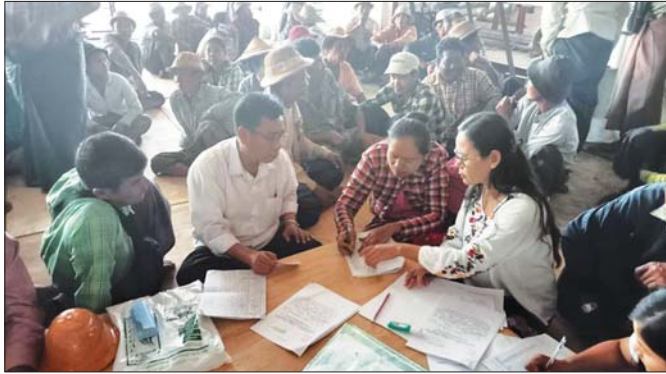
ပဲခူးတိုင်းဒေသကြီး နိုင်ငံစီးပွားမြှင့်တင်ရေးရန်ပုံငွေဖြင့် ဆောင်ရွက်သည့် နွေစပါးနှင့် ပဲတီစိမ်း စီမံကိန်းမှ တောင်သူများနှင့် စာချုပ် ချုပ်ဆိုစဉ်။