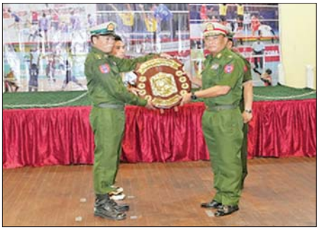
ရိုသူများက တစ်ဦးချင်းအကောင်း ဆုံးဆုရရှိကြသူများ၊ အသင်းလိုက် ဆုများနှင့် ဒိုင်ဆုရရှိသော အသင်း တို့အား ဒိုင်းဆုနှင့် ဂုဏ်ပြုဆုငွေ များ ပေးအပ်ချီးမြှင့်ကြသည်။ အလားတူ အနောက်မြောက် တိုင်းစစ်ဌာနချုပ်၏ ၂၀၂၅ ခုနှစ် တိုင်းမှူးခိုင်း ဘော်လီဘောပြိုင်ပွဲ ဗိုလ်လုပွဲနှင့် ဆုချီးမြှင့်ပွဲကို တိုင်းစစ်ဌာနချုပ် တိုင်းအားကစား ခန်းမ၌ပြုလုပ်ရာ တိုင်းမှူးနှင့် တာဝန်ရှိသူများ၊ အရာရှိ၊ စစ်သည်

နေပြည်တော် ဩဂုတ် ၁ နေပြည်တော်တိုင်းစစ်ဌာနချုပ်၏ ၂၀၂၅ ခုနှစ် တိုင်းမှူးခိုင်း ဘော်လီ ဘောပြိုင်ပွဲ ဗိုလ်လုပွဲနှင့် ဆုချီးမြှင့် ပွဲကို ယနေ့တွင် တိုင်းစစ်ဌာနချုပ် ပုဗ္ဗသိရိအားကစားခန်းမ၌ ကျင်းပ ရာ တိုင်းမှူးနှင့် တာဝန်ရှိသူများ၊ အရာရှိ၊ စစ်သည်များ၊ မိသားစုဝင် များ၊ ဒိုင်အဖွဲ့ဝင်များ၊ ပြိုင်ပွဲ ဝင် အားကစားသမားများနှင့် အားကစားဝါသနာရှင်များ တက် ရောက်ကြသည်။ ဦးစွာ တိုင်းမှူးနှင့် တက်ရောက် လာကြသူများက ဗိုလ်လုပွဲစဉ် များ ယှဉ်ပြိုင်ကစားမှုများ ကို ကြည့်ရှုအားပေးကြသည်။ ထို့နောက် ဆုချီးမြှင့်ပွဲကို ဆက်လက် ကျင်းပရာ တိုင်းမှူးနှင့် တာဝန်