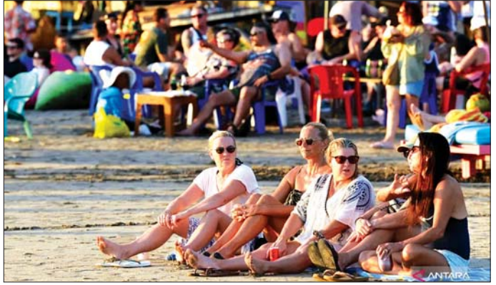
ဘာလီရှိ ဒါဘယ်ဆစ်စ်ကမ်းခြေတွင် အပန်းဖြေနေသည့် နိုင်ငံခြားခရီးသွားများကို တွေ့ရစဉ်။