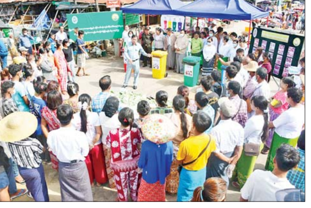
အရောင်ခွဲခြားသတ်မှတ်ထားသည့် အမှိုက်ပုံးများတွင် လက်တွေ့ပါဝင် စွန့်ပစ်ခြင်းကို ပြုလုပ်ကြရာ ခရိုင်၊ မြို့နယ်အဆင့် တာဝန်ရှိသူများက ကြည့်ရှုအားပေးခဲ့ကြောင်း သိရသည်။ အဆိုပါသရုပ်ပြပွဲသို့ တက်ရောက်လာကြသူများအား မြို့နယ် စည်ပင်သာယာရေးအဖွဲ့နှင့် ခရိုင်ပတ်ဝန်းကျင်ထိန်းသိမ်းရေးဦးစီးဌာန ဝန်ထမ်းများက အသိပညာပေး လက်ကမ်းစာစောင်များ ပေးဝေခဲ့ ကြောင်း သိရသည်။ ချမ်းသာ(မိတ္ထီလာ)

အိန္ဒိယအသင်း၊ ည ၇ နာရီတွင် အင်ဒိုနီးရှားအသင်းနှင့် တာ့ခမ်နစွတန်အသင်းတို့ ကစားမည်ဖြစ်သည်။ ခြေစစ်ပွဲကို အုပ်စုရစ်ပွဲစဉ် ကျင်းပမည်ဖြစ်ပြီး အုပ်စု တစ်ခုစီမှ ထိပ်ဆုံးတစ်သင်းစီနှင့် ဒုတိယနေရာရ အသင်းများအနက် အကောင်းဆုံးသုံးသင်း စုစုပေါင်း