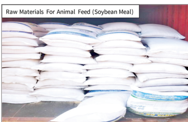
အေးရှားဝေါလ်ဆိပ်ကမ်း၌ သိမ်းဆည်းရမိမှု။

နေပြည်တော် ဩဂုတ် ၂ တရားမဝင် ကုန်သွယ်မှု တိုက်ဖျက်ရေး ဦးဆောင်ကော်မတီ ၏ ကြီးကြပ်ကွပ်ကဲမှုဖြင့် တရားမဝင် ကုန်သွယ်မှုများကို ဥပဒေနှင့်အညီ ထိရောက်စွာ တားဆီး အရေးယူနိုင်ရေး ဆောင်ရွက်လျက်ရှိသည်။ ထိုသို့ ဆောင်ရွက်လျက်ရှိရာ ဩဂုတ် ၁ ရက်တွင် အကောက်ခွန် ဦးစီးဌာန၏ စီမံခန့်ခွဲမှုဖြင့် တာဝန်ကျ ပူးပေါင်းအဖွဲ့က စစ်ဆေးမှုများ ဆောင်ရွက်ခဲ့ရာ အေးရှားဝေါလ် ဆိပ်ကမ်း၌ ကုန်သေတ္တာ ၇၂ လုံးအတွင်းမှ တရားဝင် စာရွက်စာတမ်း အထောက်အထားတင်ပြနိုင်ခြင်း မရှိသည့် လုပ်ငန်းသုံးပစ္စည်း တစ်မျိုး (ခန့်မှန်းတန်ဖိုးငွေ ၂၅၇၅၇၀၇၉၃၂ ကျပ်) ကို သိမ်းဆည်းရမိခဲ့ပြီး အကောက်ခွန် လုပ်ထုံးလုပ်နည်းများနှင့် အညီ အရေးယူ ဆောင်ရွက်လျက်ရှိ