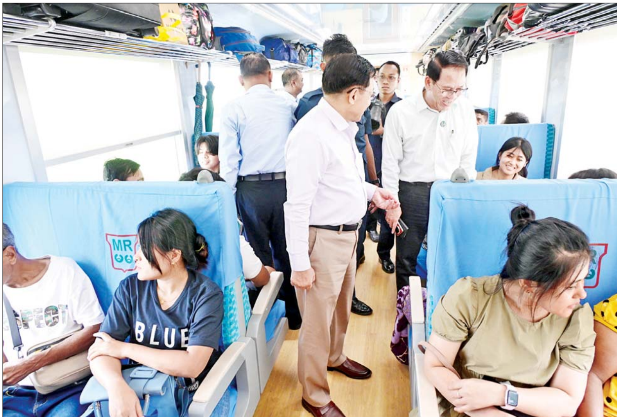
နိုင်ငံတော်လုံခြုံရေးနှင့် အေးချမ်းသာယာရေးကော်မရှင်ဥက္ကဋ္ဌ ဗိုလ်ချုပ်မှူးကြီးမင်းအောင်လှိုင် ရထားခရီးစဉ်တွင် အတူစီးနင်းလိုက်ပါလာသည့် ခရီးသွားပြည်သူများအား ရင်းရင်းနှီးနှီးနှုတ်ဆက်စဉ်။