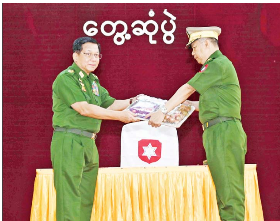
နိုင်ငံတော်လုံခြုံရေးနှင့် အေးချမ်းသာယာရေးကော်မရှင်ဥက္ကဋ္ဌ တပ်မတော်ကာကွယ်ရေးဦးစီးချုပ် ဗိုလ်ချုပ်မှူးကြီးမင်းအောင်လှိုင် တပ်နယ်မှ အရာရှိ၊ စစ်သည်မိသားစုများအတွက် စားသောက်ဖွယ်ရာပစ္စည်းများ ပေးအပ်စဉ်။

ထုတ်ယူမှုမရှိစေရေး စနစ်တကျ ကြီးကြပ် ဆောင်ရွက်သွားရန်၊ မိသားစုဝင်များ၏ သက်သာချောင်ချိရေးအတွက် တပ်ပိုင်စိုက်ပျိုး မွေးမြူရေးလုပ်ငန်းများ ဆောင်ရွက်ရာတွင်လည်း စနစ်တကျ ဆောင်ရွက်သွားရန်၊ လုပ်ငန်းများ ဆောင်ရွက်ရာတွင် ထိထိရောက်ရောက်နှင့် အကျိုးရှိအောင် ဆောင်ရွက်သွားရန်နှင့် အခြားလိုအပ်သည်များကို လမ်းညွှန်မှာကြားသည်။ ထို့နောက် နိုင်ငံတော်လုံခြုံရေးနှင့် အေးချမ်းသာယာရေးကော်မရှင်ဥက္ကဋ္ဌ တပ်မတော်ကာကွယ်ရေး ဦးစီးချုပ်သည် အေးချမ်းဖွံ့ဖြိုးခန်းမ၌ တပ်နယ်မှ အရာရှိ၊ စစ်သည်မိသားစုများအား တွေ့ဆုံအမှာစကား ပြောကြားသည်။ အဆိုပါ တွေ့ဆုံပွဲအခမ်းအနားသို့ နိုင်ငံတော်လုံခြုံရေးနှင့် အေးချမ်းသာယာရေး ကော်မရှင်ဥက္ကဋ္ဌ တပ်မတော်ကာကွယ်ရေး ဦးစီးချုပ်၏ဇနီး ဒေါ်ကြူကြူလှ၊ ကာကွယ်ရေးဦးစီးချုပ် (ရေ) ဗိုလ်ချုပ်ကြီးထိန်ဝင်းနှင့် ဇနီး၊ ကာကွယ်ရေးဦးစီးချုပ် (လေ) ဗိုလ်ချုပ်ကြီးထွန်းအောင်နှင့် ဇနီး၊ ကာကွယ်ရေးဦးစီးချုပ်ရုံးမှ အဆင့်မြင့်တပ်မတော် အရာရှိကြီးများနှင့်ဇနီးများ၊ တပ်နယ်မှအရာရှိ၊ စစ်သည်မိသားစုများ တက်ရောက်ကြသည်။ ထိုသို့တွေ့ဆုံအမှာစကား ပြောကြားရာတွင် တပ်/ဌာနချုပ်များ အနေဖြင့် အချိန်အခါအလိုက် လုပ်သင့်လုပ်ထိုက်သည့် လုပ်ငန်းများကို စဉ်ဆက်မပြတ်ဆောင်ရွက် နေရန်လိုကြောင်း၊ တပ်မတော်သားများသည် မိမိတို့သဘောဆန္ဒအလျောက် တပ်မတော်သို့ ဝင်ရောက်တာဝန်ထမ်းဆောင်ကြခြင်း ဖြစ်ကြောင်း၊ တပ်မတော်သားများ