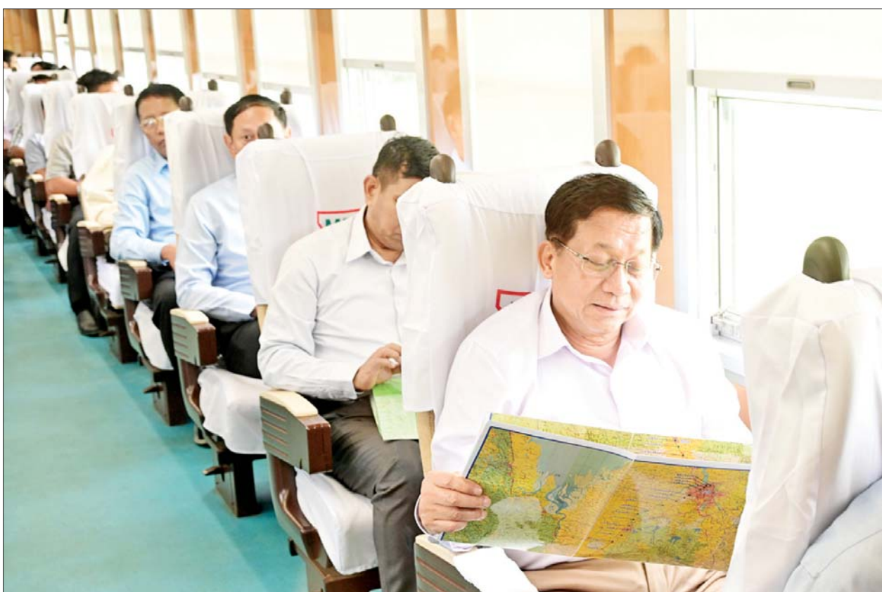
နိုင်ငံတော်လုံခြုံရေးနှင့် အေးချမ်းသာယာရေးကော်မရှင်ဥက္ကဋ္ဌ ဗိုလ်ချုပ်မှူးကြီးမင်းအောင်လှိုင် နေပြည်တော်-ရန်ကုန် အမှတ်(၈)အစုန် DEMU လူစီးအမြန်ရထားဖြင့် ခရီးသွားပြည်သူများနှင့်အတူ တောင်ငူဘူတာမှ ရန်ကုန်ဘူတာကြီးအထိ လိုက်ပါစီးနင်းစဉ်။

ရှိမှုအခြေအနေများ၊ ရထားဖြင့် သွားလာလျက်ရှိသည့် ခရီးသွားပြည်သူများ ရထားစီးနင်းရာတွင် စိတ်လက်ချမ်းသာစွာဖြင့် စီးနင်းလိုက်ပါနိုင်ရေး မြန်မာ့မီးရထားမှ ဝန်ဆောင်မှုလုပ်ငန်းများ ဆောင်ရွက်ပေးထားမှု အခြေအနေများနှင့် ထပ်မံဖြည့်ဆည်းဆောင်ရွက်ပေးရန်လိုအပ်မည့် အခြေအနေများ၊ ရထားလမ်းဘေး ဝဲ/ယာရှိ စိုက်ပျိုးရေးလုပ်ငန်းများ ဆောင်ရွက်ထားရှိမှု အခြေအနေများနှင့် မြို့ပြနှင့် ကျေးလက်ဒေသများ ဖွံ့ဖြိုးတိုးတက်ရေး ဆောင်ရွက်ထားရှိမှု အခြေအနေများကို ကြည့်ရှုစစ်ဆေးရာ တာဝန်ရှိသူများက ရှင်းလင်းတင်ပြကြသည်။ ရှင်းလင်းတင်ပြမှုများ အပေါ် နိုင်ငံတော်လုံခြုံရေးနှင့် အေးချမ်းသာယာရေးကော်မရှင် ဥက္ကဋ္ဌက ရထားလမ်းများ ကြိုခိုင်းမှုရှိစေရေးနှင့် စနစ်တကျဖြစ်စေရေး စဉ်ဆက်မပြတ် ဆောင်ရွက်သွားရန်လိုကြောင်း၊ ရထားလမ်းဘေး စာမျက်နှာ ၅ သို့ ။