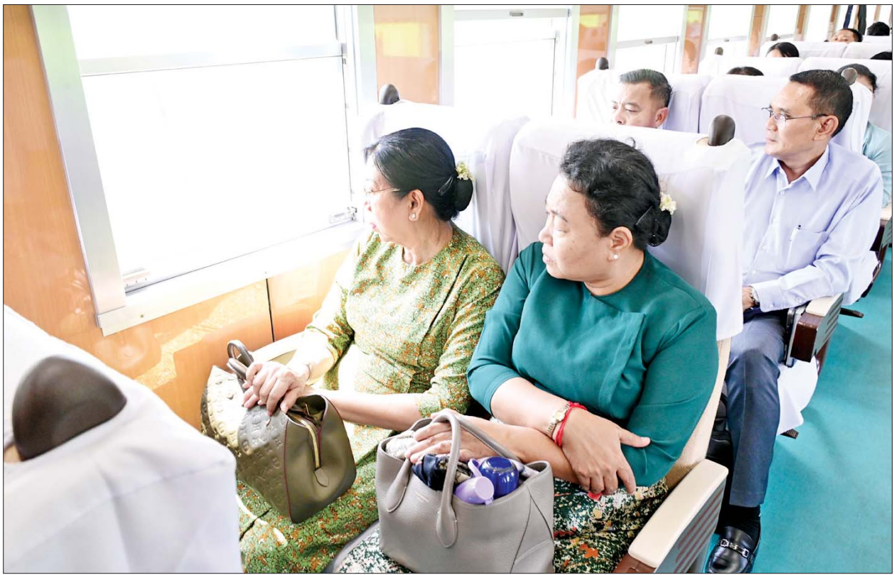
နိုင်ငံတော်လုံခြုံရေးနှင့် အေးချမ်းသာယာရေးကော်မရှင်ဥက္ကဋ္ဌ ဗိုလ်ချုပ်မှူးကြီးမင်းအောင်လှိုင်၏ဇနီး ဒေါ်ကြူကြူလှနှင့် အဖွဲ့ဝင်များ ခရီးသွားပြည်သူများနှင့်အတူ တောင်ငူဘူတာမှ ရန်ကုန်ဘူတာကြီးအထိ လိုက်ပါစီးနင်းစဉ်။

ပေးအပ်ချီးမြှင့် အလားတူ ပြည်ထောင်စုဝန်ကြီး၊ ပြည်နယ်ဝန်ကြီးချုပ်နှင့် တာဝန်ရှိသူများသည် ဘားအံမြို့၊ အမှတ်(၄) အခြေခံပညာအထက်တန်းကျောင်း ယာယီနေရပ်စွန့်ခွာမှုအတွက် ယာယီနေရပ်စွန့်ခွာမှုအဖွဲ့အစည်းများကို သိရှိနိုင်စေရန်အတွက် ပြည်ဝင်ခရီးသွား စစ်တမ်း (Inbound Tourism Survey) များ ကောက်ယူခြင်း လုပ်ငန်းကို ဆောင်ရွက်ခဲ့ကြသည်။