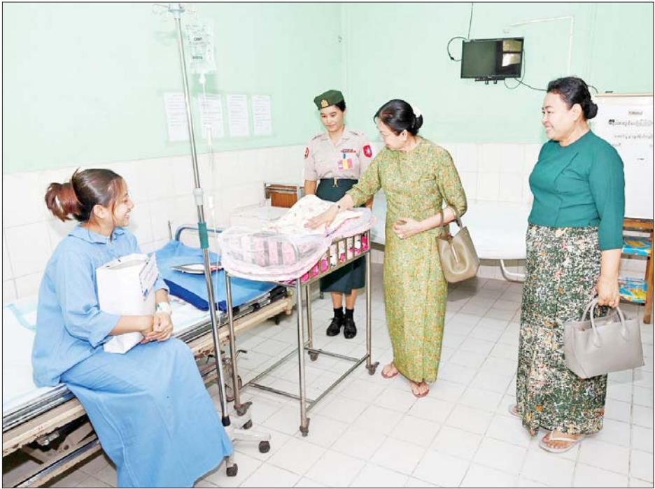
နိုင်ငံတော်လုံခြုံရေးနှင့် အေးချမ်းသာယာရေးကော်မရှင်ဥက္ကဋ္ဌ တပ်မတော်ကာကွယ်ရေးဦးစီးချုပ် ဗိုလ်ချုပ်မှူးကြီးမင်းအောင်လှိုင်၏ ဇနီး ဒေါ်ကြူကြူလှ နယ်မြေခံတပ်မတော်ဆေးရုံ၌ တက်ရောက်ဆေးကုသမှုခံယူနေသူတစ်ဦးအား ရင်းနှီးနှေးနှေးထွေးထွေး မေးမြန်းအားပေးစကားပြောကြားစဉ်။

ဆက်လက်၍ နိုင်ငံတော်လုံခြုံရေးနှင့် အေးချမ်းသာယာရေးကော်မရှင်ဥက္ကဋ္ဌ တပ်မတော်ကာကွယ်ရေး ဦးစီးချုပ်သည် တပ်နယ်ရှိ နယ်မြေခံတပ်မတော်ဆေးရုံတွင် တက်ရောက်ကုသလျက်ရှိသည့် နိုင်ငံတော်ကာကွယ်ရေးနှင့် လုံခြုံရေးတာဝန်များ ထမ်းဆောင်စဉ် ထိခိုက်ဒဏ်ရာ ရရှိခဲ့သော အရာရှိ၊ စစ်သည်များအား ထိခိုက်ဒဏ်ရာရရှိခဲ့မှု အခြေအနေများ၊ ရောဂါကုသပျောက်ကင်းမှု အခြေအနေများကို တစ်ဦးချင်း လိုက်လံတွေ့ဆုံ၍ ရင်းနှီးနှေးနှေးထွေးထွေး မေးမြန်းပြီး အားပေးစကား ပြောကြားကာ အရာရှိ၊ စစ်သည်များ၏ တင်ပြချက်များအပေါ် လိုအပ်သည်များ ဖြည့်ဆည်း ဆောင်ရွက်ပေးသည်။ ထို့နောက် နိုင်ငံတော်လုံခြုံရေးနှင့် အေးချမ်းသာယာရေးကော်မရှင်ဥက္ကဋ္ဌ တပ်မတော်ကာကွယ်ရေး ဦးစီးချုပ်သည် ဆေးရုံလိုအပ်ချက်များကို မေးမြန်း၍ လိုအပ်သည်များ ဖြည့်ဆည်းဆောင်ရွက်ပေးသည်။ အလားတူ နိုင်ငံတော်လုံခြုံရေး