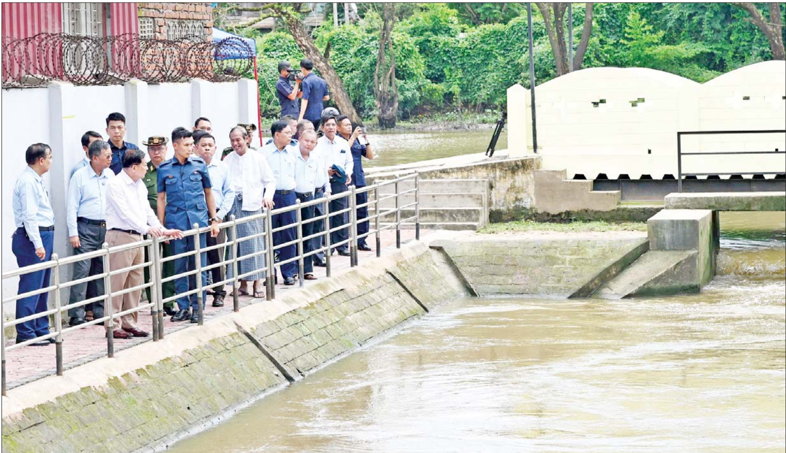
နိုင်ငံတော်လုံခြုံရေးနှင့် အေးချမ်းသာယာရေးကော်မရှင်ဥက္ကဋ္ဌ ဗိုလ်ချုပ်မှူးကြီးမင်းအောင်လှိုင် တောင်ငူမြို့၊ ကေတုမတီမြို့ဟောင်း အရှေ့ဘက်ကျုံးနေရာရှိ ယိုးဒယားပေါက် နေရာအား ကြည့်ရှုစစ်ဆေးစဉ်။

နေပြည်တော် ဩဂုတ် ၂ နိုင်ငံတော်လုံခြုံရေးနှင့် အေးချမ်းသာယာရေးကော်မရှင် ဥက္ကဋ္ဌ ဗိုလ်ချုပ်မှူးကြီးမင်းအောင်လှိုင်သည် ယနေ့တွင် အမျိုးသားကာကွယ်ရေးနှင့် လုံခြုံရေးကောင်စီ တွဲဖက်အမှုဆောင်ချုပ် ဗိုလ်ချုပ်ကြီး ရဲဝင်းဦးနှင့် ခရီးစဉ်တွင်လိုက်ပါလာသည့် အဖွဲ့ဝင်များ လိုက်ပါ၍ ပဲခူးတိုင်းဒေသကြီး တောင်ငူမြို့၊ ကေတုမတီမြို့ဟောင်း ရှေးဟောင်းယဉ်ကျေးမှုဆိုင်ရာ အမွေအနှစ်နေရာများ ပြုပြင်ထိန်းသိမ်းရေး ဆောင်ရွက်နေမှု အခြေအနေများကို သွားရောက်ကြည့်ရှုစစ်ဆေးသည်။ ဦးစွာ နိုင်ငံတော်လုံခြုံရေးနှင့် အေးချမ်းသာယာရေးကော်မရှင် ဥက္ကဋ္ဌနှင့် အဖွဲ့ဝင်များသည် ရန်ကုန်-မန္တလေး လမ်းဟောင်းအတိုင်း နေပြည်တော်မှ တောင်ငူမြို့သို့ ထွက်ခွာခဲ့ကြပြီး လမ်းဘေး ဝဲ/ယာတစ်လျှောက် စိုက်ပျိုးရေး လုပ်ငန်းများ ဆောင်ရွက်ထားရှိမှုနှင့် လူနေမှုအခြေအနေများကို ကြည့်ရှုစစ်ဆေးသည်။ စာမျက်နှာ ၃ ကော်လံ ၁ သို့ ၀