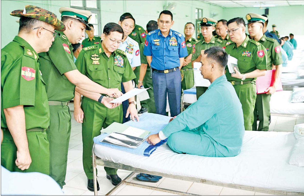
နိုင်ငံတော်လုံခြုံရေးနှင့် အေးချမ်းသာယာရေးကော်မရှင်ဥက္ကဋ္ဌ တပ်မတော်ကာကွယ်ရေးဦးစီးချုပ် ဗိုလ်ချုပ်မှူးကြီးမင်းအောင်လှိုင် နယ်မြေခံတပ်မတော်ဆေးရုံ၌ တက်ရောက်ဆေးကုသမှုခံယူနေသူများအား ကြည့်ရှုအားပေးစဉ်။

ဒီမိုကရေစီ ဒုတိယအစိုးရ NLD အစိုးရ သက်တမ်းကာလတွင် တပ်မတော်ကို မုန်းတီးစေသည့် ရေးသားပြောဆိုမှုများ လှုံ့ဆော်မှုများကို တိုက်ရိုက်(သို့မဟုတ်) သွယ်ဝိုက်၍ လုပ်ဆောင်ခဲ့ကြောင်း၊ အလားတူစီးပွားရေး၊ အုပ်ချုပ်ရေးနှင့် ကဏ္ဍအသီးသီးတွင် လုပ်ငန်း