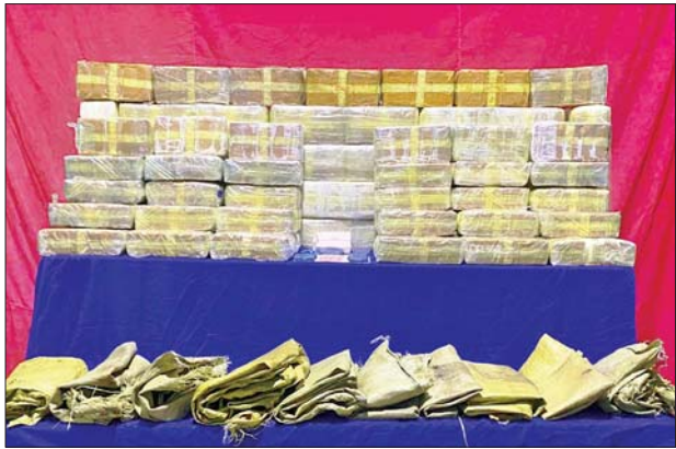
သိမ်းဆည်းရမိသည့် စိတ်ကြွေးသွပ်ဆေးပြားများကိုတွေ့ရစဉ်။