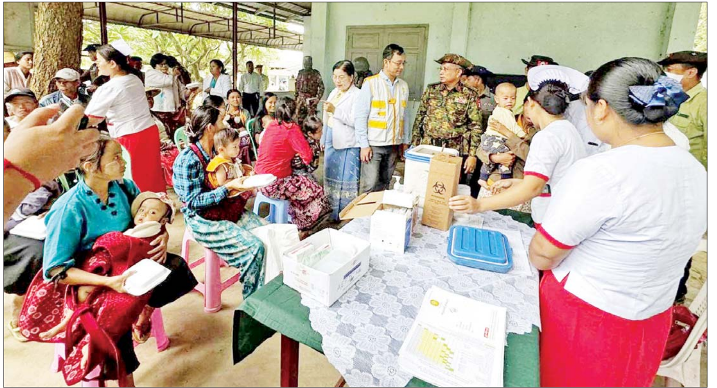
နောင်ချိုမြို့ ပြည်သူ့ဆေးရုံ၌ ကျန်းမာရေးစောင့်ရှောက်မှုလုပ်ငန်းများဆောင်ရွက်ပေးလျက်ရှိသည်ကို တွေ့ရစဉ်။

နေပြည်တော် ဩဂုတ် ၂ ရှမ်းပြည်နယ်(မြောက်ပိုင်း) နောင်ချိုမြို့နှင့် အဆိုပါဒေသတစ်ဝိုက်ရှိဒေသခံတိုင်းရင်းသားပြည်သူများ၏ ကျန်းမာရေးစောင့်ရှောက်မှုလုပ်ငန်းများ အဆင်ပြေချောမွေ့စေရန်အတွက် အကြမ်းဖက်သမားများဖျက်ဆီးခဲ့သည့် နောင်ချိုမြို့နယ်ပြည်သူ့ဆေးရုံအား အမြန်ဆုံးပြန်လည်ဖွင့်လှစ်နိုင်ရေးအတွက် ဌာနဆိုင်ရာဝန်ထမ်းများ၊ တပ်မတော်သားများ၊ ဒေသခံတိုင်းရင်းသားပြည်သူများနှင့် စေတနာရှင် ပြည်သူများပူးပေါင်း၍ လိုအပ်သည့်ပြုပြင်၊ ပြင်ဆင်တည်ဆောက်မှုများကို အချိန်နှင့်တစ်ပြေးညီ ဆောင်ရွက်ခဲ့ကြရာ ယနေ့တွင် ပြည်သူ့ဆေးရုံကို ပြန်လည်ဖွင့်လှစ်နိုင်ခဲ့ကြောင်း သိရသည်။