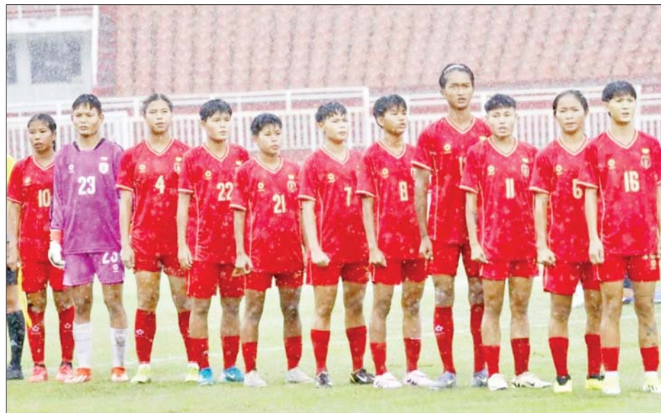
အာရှဖလား ယူ-၂၀ အမျိုးသမီးခြေစစ်ပွဲ ယှဉ်ပြိုင်မည့် မြန်မာ ယူ-၂၀ အမျိုးသမီးအသင်း။