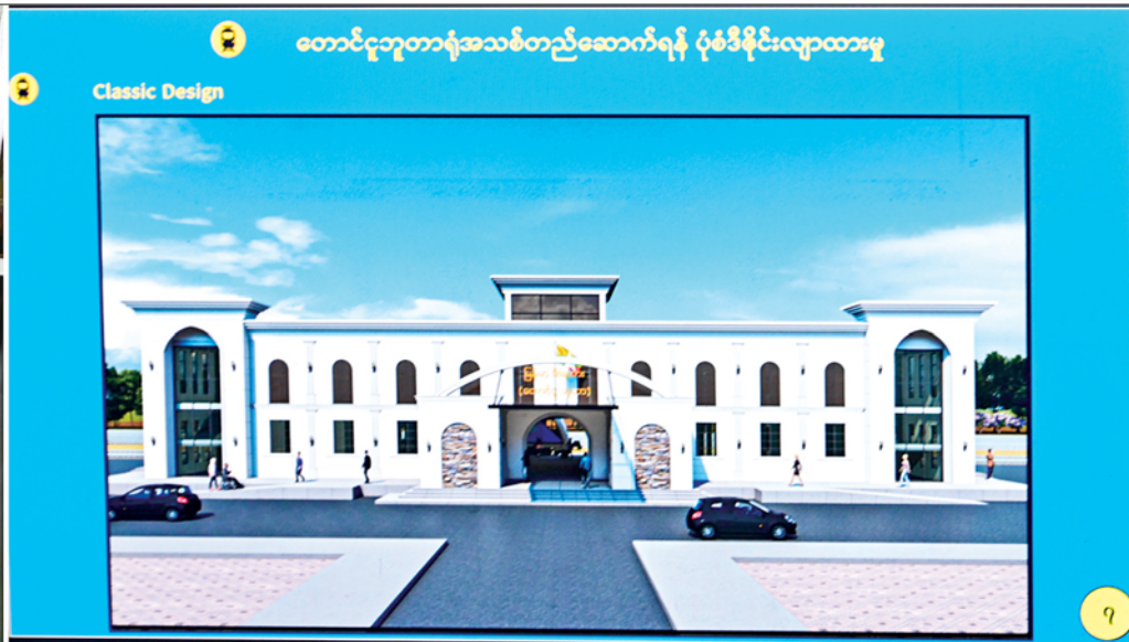
နိုင်ငံတော်လုံခြုံရေးနှင့် အေးချမ်းသာယာရေးကော်မရှင်ဥက္ကဋ္ဌ ဗိုလ်ချုပ်မှူးကြီးမင်းအောင်လှိုင်အား ပြည်ထောင်စုဝန်ကြီး ဦးမြထွန်းဦးက တောင်ငူဘူတာရုံအသစ်တည်ဆောက်ရန် လျာထားဆောင်ရွက်ထားရှိမှု အခြေအနေများကို ရှင်းလင်းတင်ပြစဉ်။

»» စာမျက်နှာ ၃ မှ နေပြည်တော်-ရန်ကုန် အမှတ်(၈)အစုန် DEMU လူစီးအမြန်ရထားခရီးစဉ်အတိုင်း ခရီးသွားပြည်သူများနှင့်အတူ လိုက်ပါစီးနင်း ဆက်လက်၍ နိုင်ငံတော်လုံခြုံရေးနှင့် အေးချမ်းသာယာရေးကော်မရှင်ဥက္ကဋ္ဌနှင့် ဇနီးဒေါ်ကြူကြူလှ၊ ခရီးစဉ်တွင် လိုက်ပါလာကြသည့် အဖွဲ့ဝင်များသည် နေပြည်တော်မှ ထွက်ခွာလာသည့် နေပြည်တော်-ရန်ကုန် အမှတ်(၈)အစုန် DEMU လူစီးအမြန်ရထားပေါ်တွင် စီးနင်းလိုက်ပါလာသည့် ခရီးသွားပြည်သူများနှင့်အတူ တောင်ငူဘူတာမှ ရန်ကုန်ဘူတာကြီးအထိ ရထားလမ်းပိုင်းတစ်လျှောက် လိုက်ပါစီးနင်းသည်။ ထိုသို့ လိုက်ပါစီးနင်းစဉ် ရထားလမ်းပိုင်းကြိုခိုင်းရေးဆောင်ရွက်ထားရှိမှု အခြေအနေများ၊ ရထားတွဲဆိုင်းများ အတွင်း ခရီးသွားများ လိုက်ပါစီးနင်းလျက်