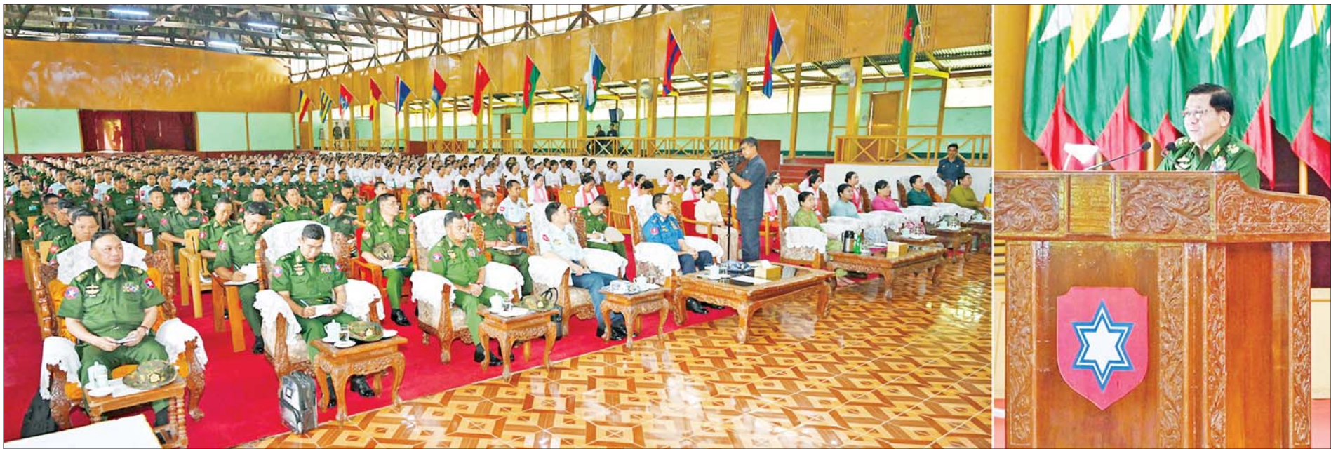
နိုင်ငံတော်လုံခြုံရေးနှင့် အေးချမ်းသာယာရေးကော်မရှင် ဥက္ကဋ္ဌ တပ်မတော်ကာကွယ်ရေးဦးစီးချုပ် ဗိုလ်ချုပ်မှူးကြီးမင်းအောင်လှိုင် တောင်ပိုင်းတိုင်းစစ်ဌာနချုပ်ရှိ တပ်နယ်မှ အရာရှိ၊ စစ်သည်မိသားစုများအား တွေ့ဆုံအမှာစကားပြောကြားစဉ်။