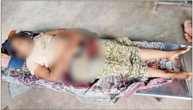
မန္တလေးတိုင်းဒေသကြီး ညောင်ဦးမြို့နယ်၌ PDF အမည်ခံ အကြမ်းဖက်အဖွဲ့က သေနတ်ဖြင့် ပစ်ခတ်သတ်ဖြတ်ခဲ့မှုကြောင့် မူလတန်းပြဆရာမတစ်ဦး သေဆုံးမှုမှတ်တမ်းဓာတ်ပုံ။

နေပြည်တော် ဩဂုတ် ၂ PDF အမည်ခံအဖွဲ့ရောက် အကြမ်းဖက်သမားများ အနေဖြင့် ပညာရေးဆိုင်ရာ ရုံး၊ ဌာနများနှင့် စာသင်ကျောင်းများကို မိုင်းတောင် ဖောက်ခွဲခြင်းများ၊ လက်ပစ်ဗုံး၊ လက်လုပ်မိုင်းများ၊ လက်နက်ငယ် များဖြင့် ပစ်ခတ်ဖောက်ခွဲခြင်းများ ပြုလုပ်လျက်ရှိသည့်အပြင် လူငယ်၊ လူရွယ်များအား စာပေသင်ကြား ပြသပေးလျက်ရှိသည့် ဆရာ ဆရာမများအား အကြမ်းဖက် ခြိမ်းခြောက်၊ သတ်ဖြတ်ခြင်းများ ပြုလုပ်လျက်ရှိသည်။