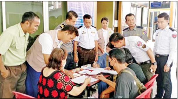
ဟိုတယ်များတွင် တည်းခိုသော မြဝတီမြို့နယ်၌ ပြည်ဝင်ခရီးသွားစစ်တမ်းများကောက်ယူရေးလုပ်ငန်းများ ပူးပေါင်း ပြည်ဝင်ခရီးသွားများထံမှ QR Code ဖြင့် Online Survey ကောက်ယူခြင်းလုပ်ငန်းများကို ဆောင်ရွက်ခဲ့ကြကြောင်း သိရသည်။