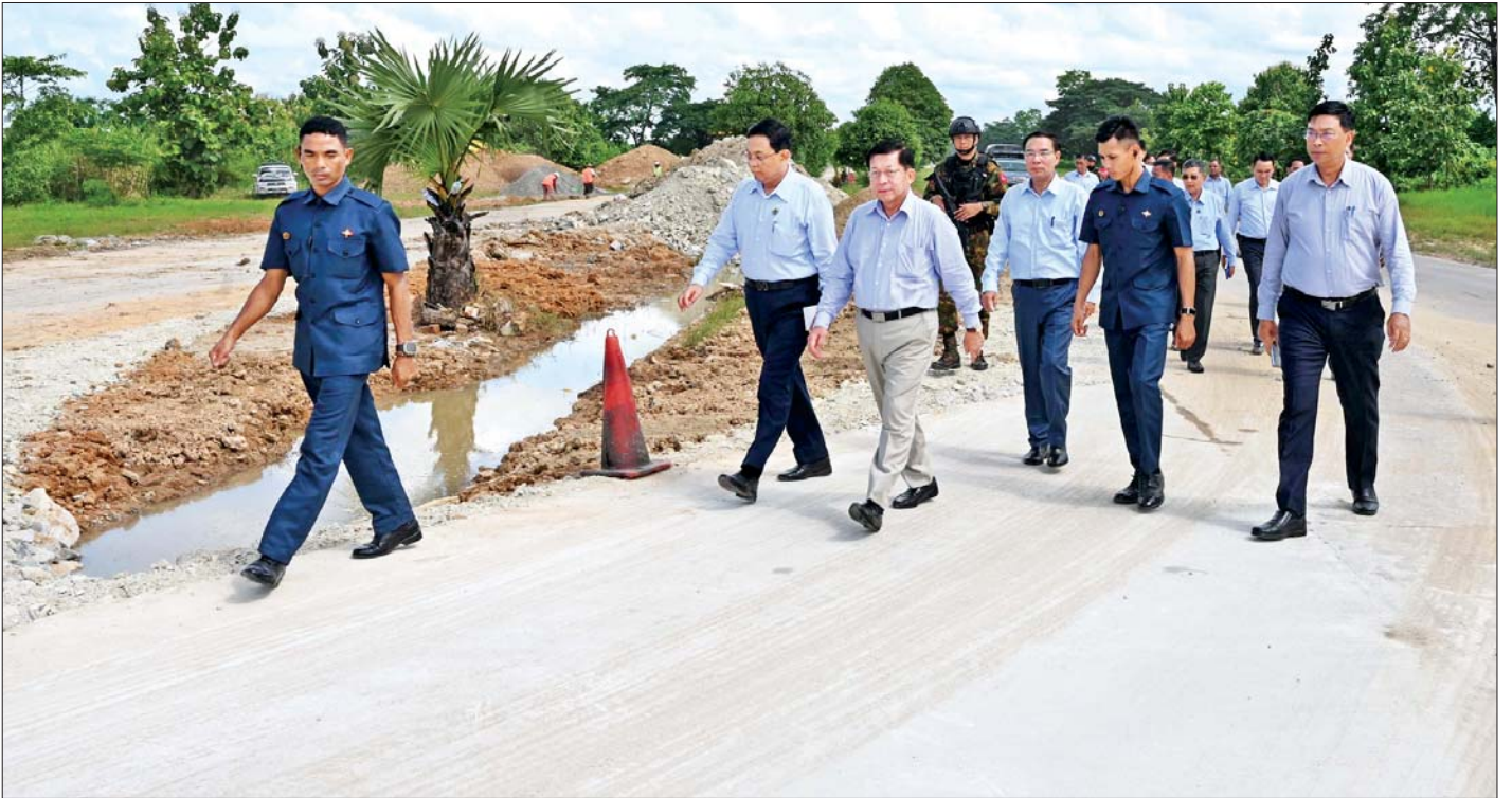
နိုင်ငံတော်လုံခြုံရေးနှင့် အေးချမ်းသာယာရေးကော်မရှင်ဥက္ကဋ္ဌ ဗိုလ်ချုပ်မှူးကြီးမင်းအောင်လှိုင် ရန်ကုန် - မန္တလေး အမြန်လမ်းမကြီးတစ်လျှောက် ပြုပြင်ထိန်းသိမ်းရေးလုပ်ငန်းများ ဆောင်ရွက်နေမှုကို ကြည့်ရှုစစ်ဆေးစဉ်။

သာယာရေးကော်မရှင်ဥက္ကဋ္ဌနှင့် အဖွဲ့ဝင်များသည် ရန်ကုန်-မန္တလေး အမြန်လမ်းမကြီးတစ်လျှောက် ဆက်လက်ထွက်ခွာလာကြပြီး ဆွာချောင်းတံတား ပြန်လည်တည်ဆောက်နေမှု အခြေအနေများကို ကြည့်ရှုစစ်ဆေး၍ တံတားတည်ဆောက်ရေးလုပ်ငန်း များကို စနစ်တကျဆောင်ရွက်ရန်၊ ဆွာချောင်း ကမ်းထိန်းလုပ်ငန်းများနှင့် ရေလမ်းကြောင်း ကောင်းမွန်ရေးဆောင်ရွက်ရန်နှင့် အခြားလိုအပ်သည် များကို လမ်းညွှန်မှာကြားသည်။ နိုင်ငံတော်လုံခြုံရေးနှင့် အေးချမ်းသာယာရေး ကော်မရှင်ဥက္ကဋ္ဌနှင့် အဖွဲ့ဝင်များသည် ညနေပိုင်းတွင် နေပြည်တော်သို့ ပြန်လည်ရောက်ရှိခဲ့ကြောင်း သိရသည်။ သတင်းစဉ်