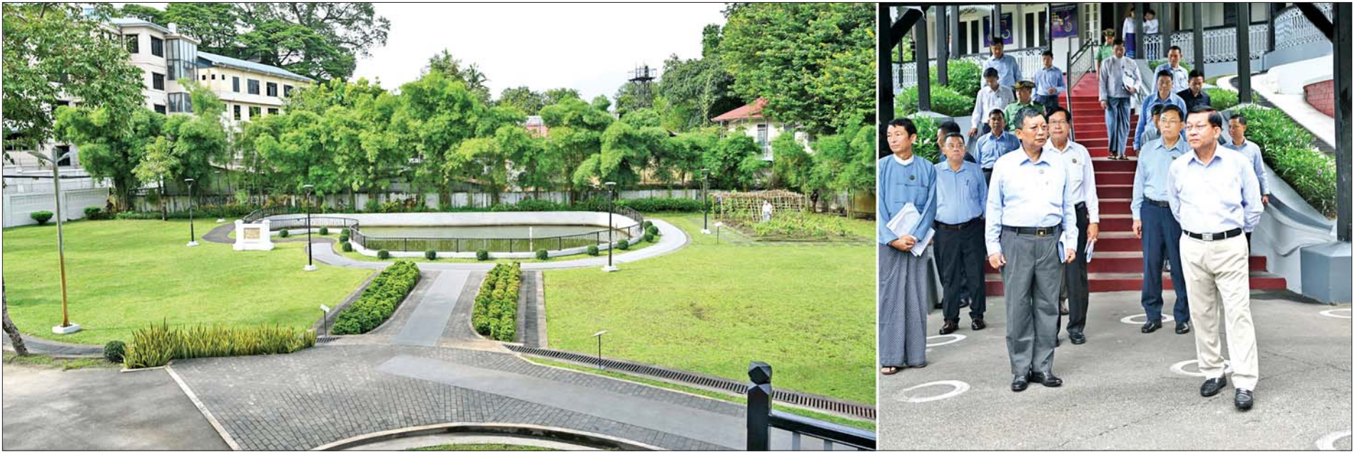
နိုင်ငံတော်လုံခြုံရေးနှင့် အေးချမ်းသာယာရေးကော်မရှင်ဥက္ကဋ္ဌ ဗိုလ်ချုပ်မှူးကြီးမင်းအောင်လှိုင် ဗိုလ်ချုပ်အောင်ဆန်းပြတိုက်(ရန်ကုန်)ဝင်းအတွင်းရှိ ရေကန်နှင့် ဗိုလ်ချုပ်ကိုယ်တိုင်စိုက်ပျိုးခဲ့သည့် သီးပင်စားပင်စိုက်ခင်း နေရာပြကွက်တို့ကို ကြည့်ရှုစစ်ဆေးစဉ်။