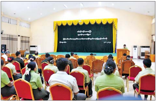
ရွေးကောက်ပွဲတစ်ရပ် ဖော်ဆောင် ကြိုးပမ်း ဆောင်ရွက်လျက်ရှိရာ ပေးနိုင်ရေးအတွက် အဘက်ဘက် သင်တန်းသား သင်တန်းသူများ အထူးအလေးထား အနေဖြင့် မဲပေးစက်နှင့်

မုံရွာ ဩဂုတ် ၄ စစ်ကိုင်းတိုင်း ဒေသကြီး ဘုတလင်မြို့နယ်တွင် မြန်မာအိလက်ထရောနစ် မဲပေးစက် (MEVM) ကိုင်တွယ်အသုံးပြုနည်းဆိုင်ရာ သင်တန်းဖွင့်ပွဲကို ယနေ့နံနက်ပိုင်းတွင် မုံရွာခရိုင် စီမံခန့်ခွဲရေးနှင့် အုပ်ချုပ်ရေးကော်မတီ ရုံးဝင်းအတွင်းရှိ မြသလွှာခန်းမ၌ ပြုလုပ်သည်။ ဦးစွာ ခရိုင်စီမံခန့်ခွဲရေးနှင့် အုပ်ချုပ်ရေးကော်မတီ ဥက္ကဋ္ဌက နိုင်ငံတော်အနေဖြင့် လွတ်လပ်၍ တရားမျှတပြီး သိက္ခာရှိသည့်