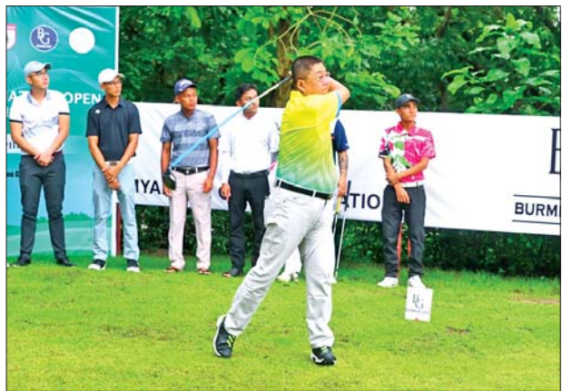
မြန်မာနိုင်ငံဂေါက်သီးအားကစားအဖွဲ့ချုပ်ဥက္ကဋ္ဌ ဦးကိုကိုအေး ဂေါက်သီးရိုက်၍ ပြိုင်ပွဲအားဖွင့်လှစ်ပေးစဉ်။