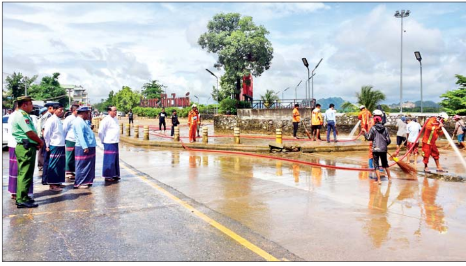
မီးသတ်ပိုက်များဖြင့် ဆေးကြောသန့်စင်ခြင်း၊ ရေကြီးနစ်မြုပ်ခဲ့သည့် ရေတွင်းရေကန်များ စုပုံထုတ်သန့်စင်ပေးခြင်း၊ ဆေးခတ်ခြင်း၊ ရေမြောင်းများရေစီးရေလာကောင်းမွန်စေရေးဆောင်ရွက်ခြင်း စသည့် စုပေါင်းသန့်ရှင်းရေးလုပ်ငန်း ဆောင်ရွက်မှုများကို လိုက်လံကြည့်ရှုအားပေးပြီး လိုအပ်သည်များ ပေါင်းစပ်ညှိနှိုင်းဖြည့်ဆည်းဆောင်ရွက်ပေးခဲ့ကြောင်း သိရသည်။ စောမျိုးမင်းသိန်း(ပြန်/ဆက်)

ဘားအံ ဩဂုတ် ၄ ရက်ပြည်နယ် ဘားအံမြို့တွင် ဧရာဝတီတိုင်းဒေသကြီး နောက်ဆုံးပတ်မှစ၍ မိုးသည်းထန်စွာရွာသွန်းပြီး မြစ်ရေချောင်းရေများ မြင့်တက်လာသည့်အတွက် သံလွင်မြစ်ရေသည် ဘားအံမြို့၏စီးရီးရေအမှတ် ၇၅၀ စင်တီမီတာအထက် ၉၃၅ စင်တီမီတာအထိ မြင့်တက်၍ ရေကြီးရေလျှံမှုများဖြစ်ပွားခဲ့ပြီး ယခုအခါ ၈၃၄ စင်တီမီတာအောက်သို့ ပြန်လည် ကျဆင်းနေပြီဖြစ်သည့်အတွက် ရေကြီးနစ်မြုပ်ခဲ့သော ကမ်းနားလမ်းတစ်လျှောက်နှင့် ဘုန်းတော်ကြီးကျောင်းများ၊ စာသင်ကျောင်းများ၊ အများပြည်သူဆိုင်ရာနေရာများတွင် ပြည်နယ်စည်ပင်သာယာရေးအဖွဲ့၏ ဦးဆောင်မှုဖြင့် စုပေါင်းသန့်ရှင်းရေးလုပ်ငန်းများ ဆောင်ရွက်ကြရာ ပြည်နယ်ဝန်ကြီးချုပ် ဦးစောမြင့်ဦးနှင့်တာဝန်ရှိသူများ လိုက်လံကြည့်ရှုအားပေးသည်။ ပြည်နယ်ဝန်ကြီးချုပ်၊ ပြည်နယ်ဝန်ကြီးများနှင့် တာဝန်ရှိသူများသည် စည်ပင်သာယာရေးအဖွဲ့၊ မီးသတ်တပ်ဖွဲ့၊ မြို့မိမြို့ဖ၊ ရပ်ကွက်နေပြည်သူများ၊ ကျောင်းအကျိုးတော်ဆောင်အဖွဲ့၊ ကျောင်းသားမိဘနှင့် ဆရာ ဆရာမများ ပူးပေါင်း၍ ဘားအံမြို့ ကမ်းနားလမ်းရှုခင်းသာနှင့် ကမ်းနားလမ်းတစ်လျှောက်၊ အမှတ်(၁၅) အခြေခံပညာမူလတန်းကျောင်း၊ အမှတ်(၁၈) အခြေခံပညာမူလတန်းကျောင်း၊ အမှတ်(၂) အခြေခံပညာအထက်တန်းကျောင်း(ခွဲ) တို့တွင် ယာဉ်၊ ယန္တရားများအသုံးပြု၍ ရေကြီးရေလျှံမှု ဖြစ်ပွားပြီးချိန်၊ ရေများပြန်လည်ကျဆင်းချိန်တွင် တင်ကျန်ရစ်ခဲ့သည့်သန့်ရှင်းရေးပစ္စည်းများ ဖယ်ရှားရှင်းလင်းခြင်း၊