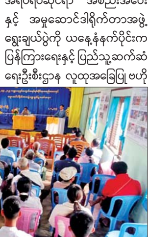
အရပ်ရပ်ဆိုင်ရာ အစည်းအဝေး နှင့် အမှုဆောင်ဒါရိုက်တာအဖွဲ့ ရွေးချယ်ပွဲကို ယနေ့နံနက်ပိုင်းက ပြန်ကြားရေးနှင့် ပြည်သူ့ဆက်ဆံ ရေးဦးစီးဌာန လူထုအခြေပြု ဗဟို

လွိုင်လင် ဩဂုတ် ၄ ရှမ်းပြည်နယ် (တောင်ပိုင်း) လွိုင်လင်မြို့နယ် သမဝါယမ အသင်းစုလီမိတက်၏ ၂၀၂၄-၂၀၂၅ ဘဏ္ဍာနှစ်အတွက်