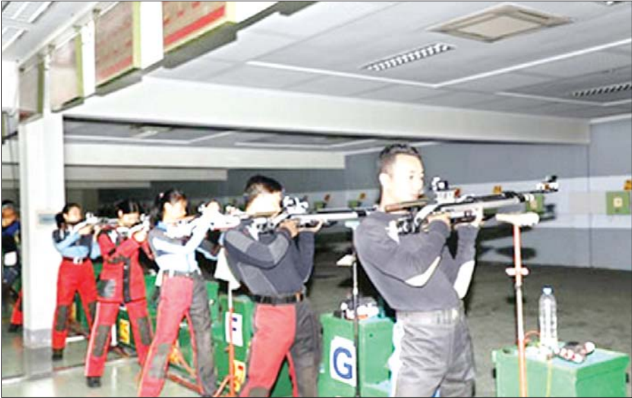
(၃၃)ကြိမ်မြောက် အရှေ့တောင်အာရှအားကစားပြိုင်ပွဲ၌ ပါဝင်ယှဉ်ပြိုင်ကြမည့် မြန်မာအမျိုးသား အမျိုးသမီး သေနတ်ပစ်အဖွဲ့ ကြိုတင်လေ့ကျင့်နေစဉ်။

စိတ်ဓာတ်အင်အား၊ ရုပ်ပိုင်းအင်အားတွေကို အကောင်းဆုံးဖြစ်အောင် တည်ဆောက်ထားရမယ် လို့ဆိုခဲ့ပါတယ်။ စိတ်ပိုင်း၊ ရုပ်ပိုင်းကြံ့ခိုင်အောင် အတွက် စီမံမှုကောင်းတွေရှိပြီးဖြစ်ပေမယ့် မိမိကိုယ် မိမိ တည်ဆောက်ရမယ့်အပိုင်းက ပိုပြီးအဓိကကျပါ လိမ့်မယ်။ အခြေခံအားဖြင့်တော့ နိုင်ငံအတွက်၊ တစ်မျိုးသားလုံးအတွက် မြန်မာဆိုတဲ့စိတ်နဲ့ ပြိုင်နိုင်ရမယ်၊ အနိုင်ယူနိုင်ရမယ်။ ဆုတံဆိပ်တွေ ရခဲ့ရင် ပြည်သူနဲ့ နိုင်ငံတော်က ချီးမြှင့်မယ့်ဆုလာဘ်