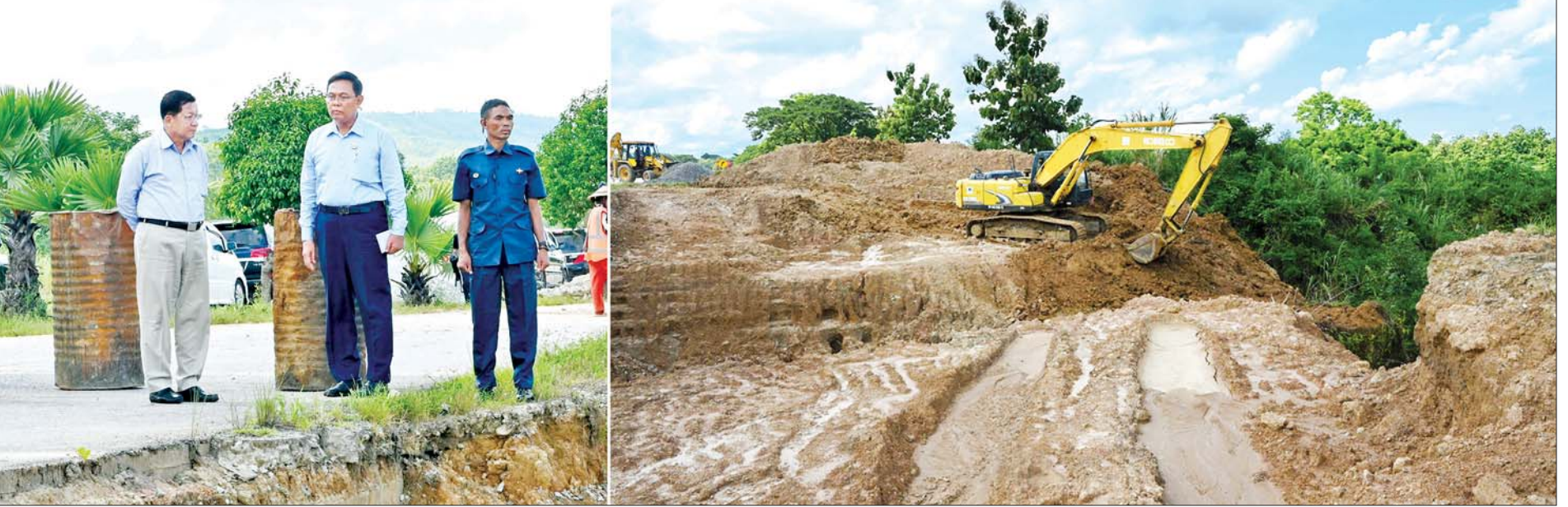
နိုင်ငံတော်လုံခြုံရေးနှင့် အေးချမ်းသာယာရေးကော်မရှင်ဥက္ကဋ္ဌ ဗိုလ်ချုပ်မှူးကြီးမင်းအောင်လှိုင် ရန်ကုန်-မန္တလေး အမြန်လမ်းမကြီး မိုင်တိုင်အမှတ်(၉၄) နေရာရှိ ရေထွက်ပေါက်နေရာ ပြန်လည်ပြုပြင် ဆောင်ရွက်နေမှုကို ကြည့်ရှုစစ်ဆေးစဉ်။

လက်နက်ကိုင်အကြမ်းဖက်သောင်းကျန်းသူများအနေဖြင့် ၎င်းတို့ အဓမ္မဝင်ရောက် နေထိုင်နေသည့် မြို့၊ ရွာများ၌ တပ်မတော်၏ တန်ပြန်ထိုးစစ်ဆင်မှုများကို ကာကွယ်ရန် အတွက် ပြည်သူတို့၏ နေအိမ်အဆောက်အအုံများ၊ အရပ်ဘက်အုပ်ချုပ်မှုဆိုင်ရာ အဆောက်အအုံများကို အသုံးပြုခြင်း၊ အပြစ်မဲ့ပြည်သူလူထုကို လူသားတံတိုင်းအဖြစ် အသုံးပြုနိုင်ရေး ယာယီနေရပ်စွန့်ခွာနေရသူများကို ပြန်လည်နေထိုင်ရန် ဆွဲဆောင် စည်းရုံးခြင်း၊ အတင်းအဓမ္မလူသစ်စုဆောင်းခြင်းများကို လုပ်ဆောင်လျက်ရှိကြောင်း၊ တပ်မတော်အနေဖြင့် နိုင်ငံတော်၏ အချုပ်အခြာအာဏာကို မဖြစ်မနေကာကွယ် စောင့်ရှောက်သွားမည်ဖြစ်ပြီး အဆိုပါ လက်နက်ကိုင် အကြမ်းဖက်သောင်းကျန်းသူများ ၏ သတင်းရရှိမှုနှင့် အခြေအနေအရပ်ရပ်အပေါ် မူတည်၍ လိုအပ်သလို တုံ့ပြန် ဆောင်ရွက်သွားမည်ဖြစ်သဖြင့် ၎င်းတို့ အဓမ္မဝင်ရောက်နေထိုင်လျက်ရှိသည့် မြို့၊ ရွာများရှိ ပြည်သူများအနေဖြင့် ၎င်းတို့၏အသုံးချမှုမခံရစေရေးနှင့် ဘေးကင်းလုံခြုံမှု ရှိစေရေးတို့အတွက် သတိပြုကြရန် လိုအပ်ကြောင်း။ ( ၃-၉-၂၀၂၄ ရက်နေ့တွင် နိုင်ငံတော်စီမံအုပ်ချုပ်ရေးကောင်စီဥက္ကဋ္ဌ နိုင်ငံတော် ဝန်ကြီးချုပ် ဗိုလ်ချုပ်မှူးကြီး မင်းအောင်လှိုင် ရှမ်းပြည်နယ် အစိုးရအဖွဲ့ဝင်များ၊ ပြည်နယ်နှင့် ခရိုင်အဆင့် ဌာနဆိုင်ရာတာဝန်ရှိသူများအား ပြောကြားသည့် အမှာ စကားမှ ကောက်နုတ်ချက် )