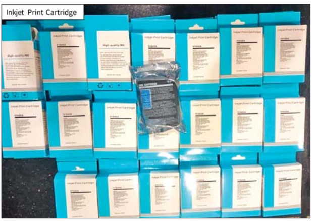
ရန်ကုန်အပြည်ပြည်ဆိုင်ရာလေဆိပ်၌ သိမ်းဆည်းရမိမှု။

နေပြည်တော် ဩဂုတ် ၄ တရားမဝင်ကုန်သွယ်မှု တိုက်ဖျက်ရေး ဦးဆောင်ကော်မတီ၏ ကြီးကြပ်ကွပ်ကဲမှုဖြင့် တရားမဝင်ကုန်သွယ်မှုများကို ဥပဒေနှင့်အညီ ထိရောက်စွာ တားဆီးအရေးယူနိုင်ရေး ဆောင်ရွက်လျက်ရှိသည်။ ဩဂုတ် ၂ ရက်တွင် အကောက်ခွန်ဦးစီးဌာန၏ စီမံခန့်ခွဲမှုဖြင့် တာဝန်ကျပူးပေါင်းအဖွဲ့က စစ်ဆေးမှုများ ဆောင်ရွက်ခဲ့ရာ ရန်ကုန်အပြည်ပြည်ဆိုင်ရာ လေဆိပ်၌ MAI Airlines လေယာဉ်ခရီးစဉ်အမှတ် 8M-363/SF-7251 ဖြင့် ထိုင်းနိုင်ငံမှ မြန်မာနိုင်ငံသို့ လိုက်ပါလာသည့် တရုတ်နိုင်ငံသား ခရီးသည်တစ်ဦး၏ ဝန်စည်အတွင်းမှ တရားဝင် စာရွက်စာတမ်းအထောက်အထား တင်ပြနိုင်ခြင်း မရှိသည့် လုပ်ငန်းသုံးပစ္စည်းတစ်မျိုး (ခန့်မှန်းတန်ဖိုးငွေကျပ် ၄၀၀၀၀၀)ကို သိမ်းဆည်းရမိခဲ့ပြီး အကောက်ခွန် လုပ်ထုံးလုပ်နည်းများနှင့်အညီ အရေးယူဆောင်ရွက်လျက်ရှိသည်။ ယင်းအပြင် ဩဂုတ် ၃ ရက်တွင် ရှမ်းပြည်နယ်တရားမဝင်ကုန်သွယ်မှုတိုက်ဖျက်ရေး အထူးအဖွဲ့၏ စီမံခန့်ခွဲမှုဖြင့် တာဝန်ကျပူးပေါင်းအဖွဲ့များက စစ်ဆေးမှု