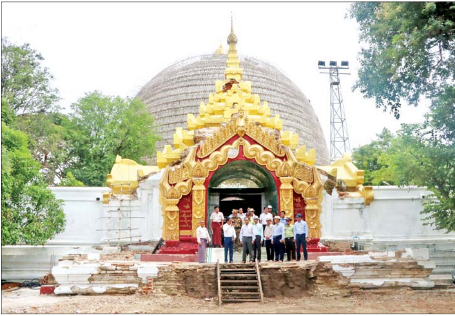
ယင်းနောက် စစ်ကိုင်းမြို့ပေါ်ရှိ မဟာစေတီလှ စေတီတော်မြတ်ကြီး အသစ်ပြန်လည်တည်ထားရေးမှုနှင့် မရှိခဏ စေတီတော်မြတ်ကြီးများ ပြန်လည်ပြုပြင်မွမ်းမံ တည်ဆောက်နေမှု၊ စေတီတော်မြတ်ကြီးရှိ ရေဂါလန် ၆၀၀၀၀ ဆုံ အာရုံစီရေကန် ပြန်လည်တည်ဆောက်ပြီးစီးမှုတို့ကို ကြည့်ရှု

မုံရွာ ဩဂုတ် ၄ စစ်ကိုင်းတိုင်းဒေသကြီး ဝန်ကြီးချုပ် ဦးမြတ်ကျော်သည် တိုင်းဒေသကြီးဝန်ကြီးများနှင့် တာဝန်ရှိသူများနှင့်အတူ ယနေ့နံနက်ပိုင်းတွင် ငလျင်လှုပ်ခတ်မှုကြောင့် ထိခိုက်ပျက်စီးခဲ့သည့် စစ်ကိုင်းမြို့ ရာဇမဏိစတုရန်း ကောင်းမှုတော်စေတီတော်မြတ်ကြီး အာရုံခံတန်ဆောင်းများနှင့် သာသနိကအဆောက်အအုံများ ပြုပြင်မွမ်းမံဆောင်ရွက်နေမှု၊ ပြိုကျပျက်စီးခဲ့သည့် သာသနိကအဆောက်အအုံများကို မြန်မာနိုင်ငံရဲတပ်ဖွဲ့ဝင်များက ရှင်းလင်းဖယ်ရှားနေမှုနှင့် မေတ္တာရေကန်ပြုပြင်နေမှုတို့ကို ကြည့်ရှုစစ်ဆေးသည်။ ထို့နောက် စစ်ကိုင်းတောင်ရိုးရှိ ဆွမ်းဦးပုညရှင်စေတီတော်မြတ်ကြီး အာရုံခံတန်ဆောင်းများနှင့် သာသနိကအဆောက်အအုံများ ပြုပြင်မွမ်းမံဆောင်ရွက်နေမှု၊ ပုညရှင်သာသနာဗိမာန်တော်ကြီး ပြန်လည်ပြုပြင်နေမှုနှင့် တပ်မတော်သားများက ပြိုကျပျက်စီးခဲ့သည့် သာသနိကအဆောက်အအုံများ ရှင်းလင်းဖယ်ရှားနေမှုများကို ကြည့်ရှုစစ်ဆေးသည်။