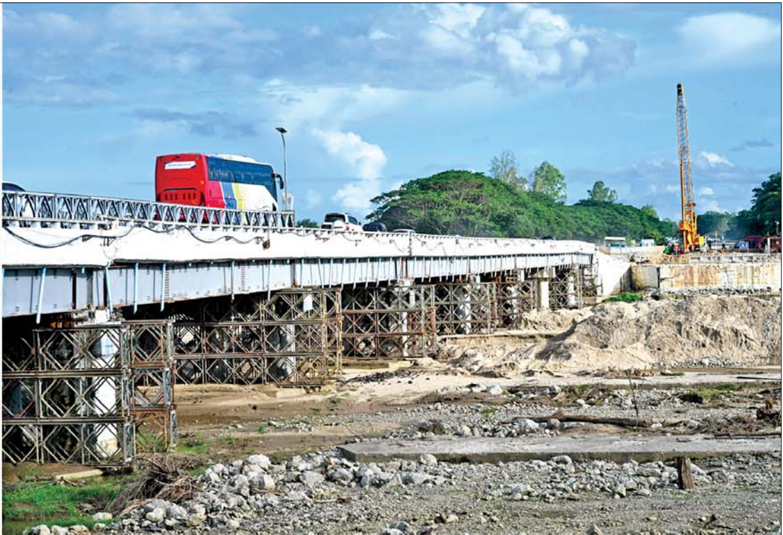
နိုင်ငံတော်လုံခြုံရေးနှင့် အေးချမ်းသာယာရေးကော်မရှင်ဥက္ကဋ္ဌ ဗိုလ်ချုပ်မှူးကြီးမင်းအောင်လှိုင် ရန်ကုန်-မန္တလေး အမြန်လမ်းမကြီးပေါ်ရှိ ဆွာချောင်းတံတား ပြန်လည်တည်ဆောက်နေမှုကို ကြည့်ရှုစစ်ဆေးစဉ်။