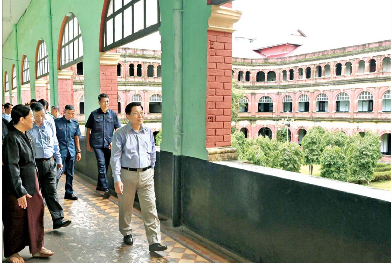
နိုင်ငံတော်လုံခြုံရေးနှင့် အေးချမ်းသာယာရေးကော်မရှင်ဥက္ကဋ္ဌ ဗိုလ်ချုပ်မှူးကြီးမင်းအောင်လှိုင် ရန်ကုန်တိုင်းဒေသကြီး တရားလွှတ်တော်တွင် ကြည့်ရှုစစ်ဆေးစဉ်။

ရန်ကုန်တိုင်းဒေသကြီး တရားလွှတ်တော် ထို့နောက် နိုင်ငံတော်လုံခြုံရေး သတင်းစဉ်