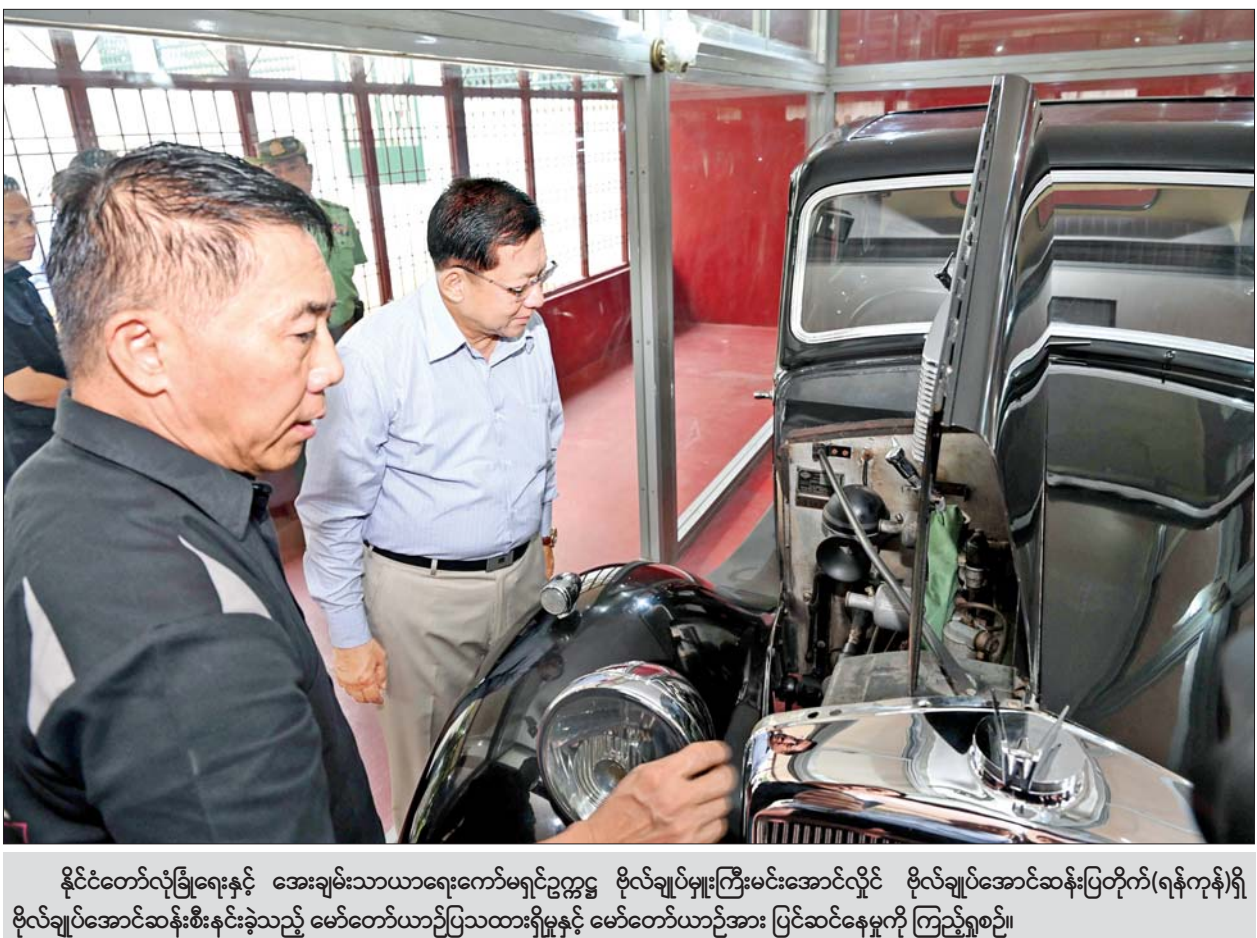
နိုင်ငံတော်လုံခြုံရေးနှင့် အေးချမ်းသာယာရေးကော်မရှင်ဥက္ကဋ္ဌ ဗိုလ်ချုပ်မှူးကြီးမင်းအောင်လှိုင် ဗိုလ်ချုပ်အောင်ဆန်းပြတိုက်(ရန်ကုန်)ရှိ ဗိုလ်ချုပ်အောင်ဆန်းစီးနင်းခဲ့သည့် မော်တော်ယာဉ်ပြသထားရှိမှုနှင့် မော်တော်ယာဉ်အား ပြင်ဆင်နေမှုကို ကြည့်ရှုစဉ်။

နေပြည်တော် ဩဂုတ် ၄ နိုင်ငံတော်လုံခြုံရေးနှင့် အေးချမ်းသာယာရေးကော်မရှင် ဥက္ကဋ္ဌ ဗိုလ်ချုပ်မှူးကြီး မင်းအောင်လှိုင်သည် အမျိုးသားကာကွယ်ရေးနှင့် လုံခြုံရေးကောင်စီ တွဲဖက်အမှုဆောင်ချုပ် ဗိုလ်ချုပ်ကြီး ရဲဝင်းဦးနှင့် ခရီးစဉ်တွင် လိုက်ပါလာသည့် အဖွဲ့ဝင်များ၊ ရန်ကုန်တိုင်းဒေသကြီးဝန်ကြီးချုပ်နှင့် တာဝန်ရှိသူများလိုက်ပါ၍ ယနေ့နံနက်ပိုင်းတွင် ရန်ကုန်တိုင်းဒေသကြီး ဗဟန်းမြို့နယ်ရှိ ဗိုလ်ချုပ်အောင်ဆန်းပြတိုက်(ရန်ကုန်)၊ ဗိုလ်တထောင်မြို့နယ်ရှိ ဝန်ကြီးများရုံး(အတွင်းဝန်ရုံး)နှင့် ကျောက်တံတားမြို့နယ်ရှိ ရန်ကုန်တိုင်းဒေသကြီး တရားလွှတ်တော်တို့သို့ သွားရောက်၍ ခင်းကျင်းပြသထားရှိမှုများနှင့် ပြုပြင်ထိန်းသိမ်းဆောင်ရွက်ထားရှိမှုများကို သွားရောက်ကြည့်ရှုစစ်ဆေးသည်။