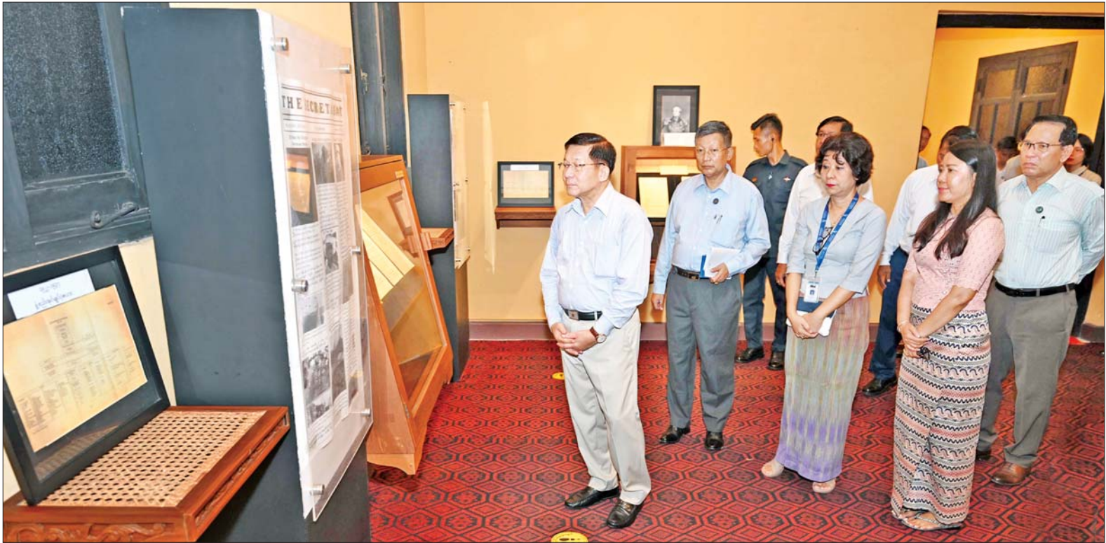
နိုင်ငံတော်လုံခြုံရေးနှင့် အေးချမ်းသာယာရေးကော်မရှင်ဥက္ကဋ္ဌ ဗိုလ်ချုပ်မှူးကြီးမင်းအောင်လှိုင် ဗိုလ်တထောင်မြို့နယ်ရှိ ဝန်ကြီးများရုံး (အတွင်းဝန်ရုံး) အဆောက်အအုံအတွင်း ခင်းကျင်းပြသထားသည့် သမိုင်းမှတ်တမ်းအထောက်အထား စာရွက်စာတမ်းများနှင့် ဓာတ်ပုံများ ထိန်းသိမ်းထားရှိမှုကို ကြည့်ရှုစစ်ဆေးစဉ်။

ဝန်ကြီးများရုံး(အတွင်းဝန်ရုံး) ယင်းနောက် နိုင်ငံတော်လုံခြုံ ရေးနှင့် အေးချမ်းသာယာရေး ကော်မရှင်ဥက္ကဋ္ဌသည် အဖွဲ့ဝင်များ