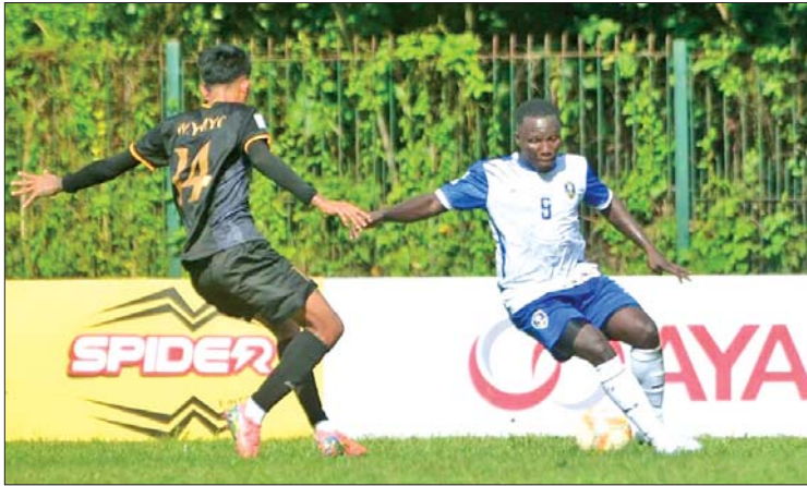
ရန်ကုန်စီးတီးအသင်းနှင့် Glory Goal အသင်းတို့ ယှဉ်ပြိုင်ကစားကြစဉ်။