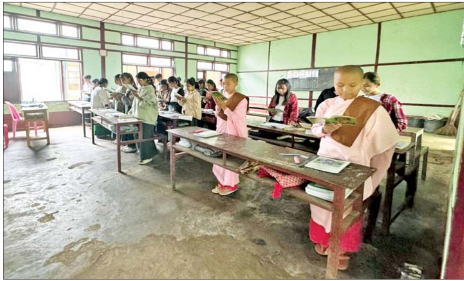
အေးချမ်းပျော်ရွှင်စွာ ပညာသင်ကြားနိုင်ရေးအတွက် ဌာနဆိုင်ရာဝန်ထမ်းများက ဆင်လျှော့ရွာ၊ အခြေခံ ပညာမူလတန်းကျောင်း၌ ကျောင်းပတ်ဝန်းကျင်ရှိ

နေပြည်တော် ဩဂုတ် ၄ ရှမ်းပြည်နယ်(မြောက်ပိုင်း) နောင်ချိုမြို့၌ အကြမ်းဖက်သောင်းကျန်းမှုများ၏ အကြမ်းဖက် လုပ်ရပ်များကြောင့် တစ်နှစ်နီးပါး ပိတ်ထားခဲ့ရသည့် အခြေခံပညာကျောင်းများအား ၂၀၂၅ ခုနှစ် ဇူလိုင် ၂၅ ရက်မှစ၍ ပြန်လည်ဖွင့်လှစ်ပြီး ကျောင်းသား ကျောင်းသူများအား စာပေပညာရပ်များကို သင်ကြား ပေးလျက်ရှိသည့်အပြင် ကျောင်းအပ်လက်ခံခြင်း ကိုလည်း ဆက်လက်ဆောင်ရွက်ပေးလျက်ရှိသည်။ ထိုသို့ ကျောင်းနေအရွယ်ကလေးများအား တန်းစဉ်အလိုက်ပညာသင်ကြားနိုင်ရေး ဆောင်ရွက် ပေးလျက်ရှိရာ နောင်ချိုမြို့နယ်အတွင်း အခြေခံ ပညာကျောင်း ၂၃ ကျောင်း ပြန်လည်ဖွင့်လှစ်နိုင်ခဲ့ပြီး ယနေ့တွင်လည်း ကျောင်းသား ကျောင်းသူ ၁၉၈ ဦး ထပ်မံ၍ ကျောင်းအပ်နှံသဖြင့် စုစုပေါင်း ကျောင်းသား ကျောင်းသူ ၃၆၄၅ ဦး အေးချမ်းပျော်ရွှင်စွာ တက်ရောက်ပညာသင်ကြားလျက်ရှိသည်။ ထို့အပြင် ကျောင်းသား ကျောင်းသူများ