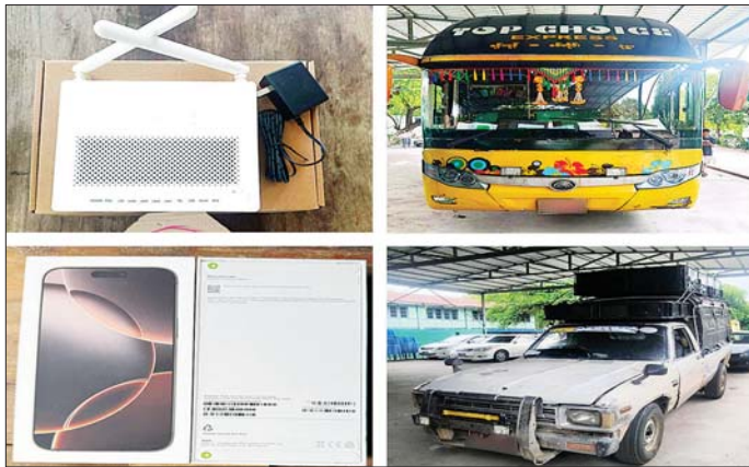
မန္တလေးတိုင်းဒေသကြီး၌ ဖမ်းဆီးရမိမှု။

ထို့ပြင် ပဲခူးတိုင်းဒေသကြီး တရားမဝင်ကုန်သွယ်မှုတိုက်ဖျက်ရေးအဖွဲ့၏ စီမံခန့်ခွဲမှုဖြင့် တာဝန်ကျပူးပေါင်းအဖွဲ့က စစ်ဆေးမှုများဆောင်ရွက်ခဲ့ရာ ညောင်အမြဲတမ်းစစ်ဆေးရေးစခန်း၌ မော်လမြိုင်မြို့မှ မန္တလေးမြို့သို့ မောင်းနှင်လာသည့် မော်တော်ယာဉ်တစ်စီးပေါ်မှ တရားဝင်စာရွက်စာတမ်း အထောက်အထား တင်ပြနိုင်ခြင်း မရှိသည့် လုပ်ငန်းသုံးပစ္စည်းနှစ်မျိုး (ခန့်မှန်းတန်ဖိုးငွေကျပ် ၈၈၀၀၀၀) နှင့် အဆိုပါပစ္စည်းများ တင်ဆောင်လာသည့် Hion Profia Truck တစ်စီး (ခန့်မှန်းတန်ဖိုးငွေကျပ် ၇၀၀၀၀၀၀) စုစုပေါင်း ခန့်မှန်းတန်ဖိုးငွေကျပ် ၇၈၈၀၀၀၀ ကို ဖမ်းဆီးရမိ