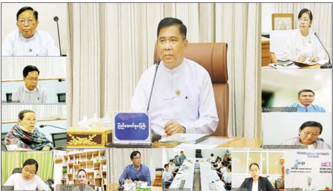
အင်ဂျင်နီယာကောင်စီဥက္ကဋ္ဌနှင့် တာဝန်ရှိသူများ ပညာရေးကဏ္ဍကို အလေးထားမြှင့်တင်ဆောင်ရွက် လျက်ရှိပြီး မွေးထုတ်ပေးလိုက်သည့် အင်ဂျင်နီယာ များသည် နိုင်ငံတကာအဆင့်မီ ပညာရှင်များ ဖြစ်ရန်နှင့် နိုင်ငံတော်ဖွံ့ဖြိုးတိုးတက်ရေးအတွက်

နေပြည်တော် ဩဂုတ် ၅ မြန်မာနိုင်ငံအင်ဂျင်နီယာကောင်စီ၊ မြန်မာနိုင်ငံ အင်ဂျင်နီယာအထူးပြုပညာရပ်ဆိုင်ရာ အရည်အသွေးစိစစ်အသိအမှတ်ပြုရေးလုပ်ငန်းကော်မတီ (Engineering Education Accreditation Committee -EEAC) မှကြီးမှူး၍ သိပ္ပံနှင့်နည်းပညာဝန်ကြီးဌာနအောက်ရှိ နည်းပညာတက္ကသိုလ်နှင့် Polytechnic University များတွင် နိုင်ငံတကာအဆင့်မီ အင်ဂျင်နီယာပညာရေးစနစ် အကောင်အထည်ဖော်ဆောင်ရွက်နေမှုများအား လေ့လာဆန်းစစ်ဖြည့်ဆည်းဆောင်ရွက်ရေး အစည်းအဝေးကို ယနေ့နံနက်ပိုင်းက သိပ္ပံနှင့်နည်းပညာဝန်ကြီးဌာန၌ Hybrid စနစ်ဖြင့် ကျင်းပသည်။ (ယာပုံ) အခမ်းအနားသို့ သိပ္ပံနှင့်နည်းပညာဝန်ကြီးဌာန ပြည်ထောင်စုဝန်ကြီး ဒေါက်တာ မျိုးသိန်းကျော်၊ အဆင့်မြင့်သိပ္ပံနှင့်နည်းပညာဦးစီးဌာနမှ ညွှန်ကြားရေးမှူးချုပ် နည်းပညာတက္ကသိုလ်များနှင့် Polytechnic University များမှ ပါမောက္ခချုပ်များ၊ မြန်မာနိုင်ငံ