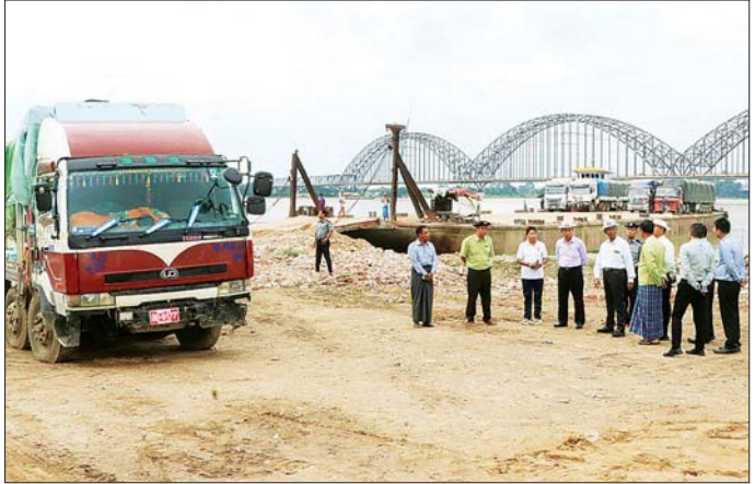
တန် ၂၀ အထက် ကုန်တင်ကား ဖြတ်သန်းသွားလာမှု အဆင်ပြေစေ နေမှု(အပေါ်ပုံ)တို့ကိုကြည့်ရှုစစ်ဆေး ကြီးကြားမှုနှင့် တွဲကားကြီးများ ရန် ဇက်ဆိပ်ဖြင့် သယ်ယူပို့ဆောင် ခဲ့သည်။ တိုင်းဒေသကြီး(ပြန်/ဆက်)

ကုန်သွယ်မှုတိုက်ဖျက်ပေးပေါင်း စစ်ဆေးရေးအဖွဲ့များနှင့် တွေ့ဆုံ ဤ ခရီးသွားပြည်သူများ လုံခြုံ အေးချမ်းစွာ သွားလာနိုင်ရေးနှင့် ကုန်စည်စီးဆင်းမှု မြန်ဆန်ရေး ပူးပေါင်း ဆောင်ရွက်ကြရန် မှာကြားပြီး တက်ရောက်လာသူများ ၏ တင်ပြချက်များအပေါ် ပေါင်းစပ် ညှိနှိုင်း ဆောင်ရွက်ပေးသည်။ ဆက်လက်၍ စစ်ကိုင်းမြို့ဝင် ဧရာဝတီတံတား (ရတနာပုံ) ရှိ တရားမဝင်ကုန်သွယ်မှု တိုက်ဖျက် ရေးပူးပေါင်းစစ်ဆေးရေးအဖွဲ့ဂိတ် များနှင့် ငလျင်လှုပ်ခတ်မှုကြောင့် ပျက်စီးခဲ့သည့် လမ်းနှင့်မုခ်ဦး ပြုပြင်ဆောင်ရွက်နေမှု၊ စစ်ကိုင်း မြို့သစ်ဆိပ်မြစ်ကမ်းမှ မန္တလေး မြို့ ရွှေကြက်ကျဖြစ်ကမ်းသို့