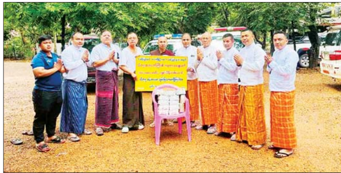
သိန်းတစ်ထောင်ကို စိတ္တဝိဝေကတောရကျောင်း ကြီး၏ ကပ္ပိယဆရာငြိမ်း ဦးဆောင်သည့်အဖွဲ့က ဆရာတော်နှင့် တာဝန်ရှိသူများထံ သီတဂူဆရာတော် ပေးအပ်လှူဒါန်းခဲ့ကြောင်း သိရသည်။ သတင်းစဉ်

ပေးအပ်လှူဒါန်းပွဲသို့ စိတ္တဝိဝေက တောရ ကျောင်းဆရာတော် ဘဒ္ဒန္တဏှာဏိသရ အမျိုးပြုသည့် ဆရာတော်သံဃာတော်များကြွရောက်တော်မူကြပြီး ကရင်ပြည်နယ်မှ တာဝန်ရှိသူများ၊ သီတဂူဆရာတော် ကြီး၏ ကပ္ပိယဆရာငြိမ်း၊ ဦးဆောင်သည့်အဖွဲ့ တက်ရောက်ကြသည်။ ထို့နောက် ကရင်ပြည်နယ်အတွင်းရှိ ရေဘေးသင့် ပြည်သူများအတွက် ကရုဏာအလှူတော်ငွေကျပ်