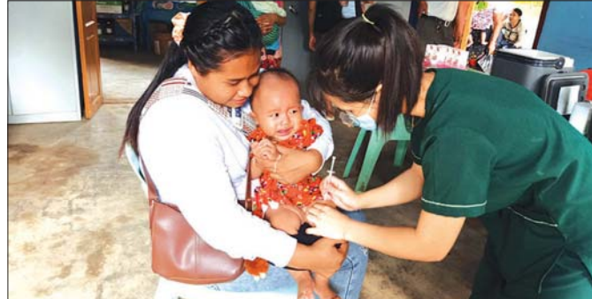
ရမ်းပြည်နယ်(အရှေ့ပိုင်း) မိုင်းယုဉ်းမြို့နယ်တွင် ဩဂုတ် ၅ ရက်က ကလေးငယ်အား ပုံမှန်ကာကွယ် ဆေးထိုးပေးစဉ်။

အာဟာရဖွံ့ဖြိုးရေးရက်သတ္တပတ်များ ထို့ကြောင့် ၂၀၂၅ ခုနှစ် ဩဂုတ်လ ပထမ သီတင်းပတ်ကို မိခင်နို့ စနစ်တကျတိုက်ကျွေးရေး ရက်သတ္တပတ်အဖြစ်လည်းကောင်း၊ ဒုတိယ သီတင်းပတ်ကို ငါးနှစ်အောက် ကလေးများနှင့် ကျောင်းသားလူငယ်များ အာဟာရဖွံ့ဖြိုးရေး ရက်သတ္တပတ်အဖြစ်လည်းကောင်း၊ တတိယ သီတင်းပတ်ကို ကိုယ်ဝန်ဆောင်နှင့် နို့တိုက်မိခင်များ အာဟာရဖွံ့ဖြိုးရေး ရက်သတ္တပတ်အဖြစ်လည်းကောင်း၊ စတုတ္ထသီတင်းပတ်ကို အိုင်အိုဒိုင်းဗိုလ် တိုက်ကျွေးရေး ရက်သတ္တပတ်အဖြစ်လည်းကောင်း၊ ရက်သတ္တပတ်အဖြစ် လည်းကောင်း သတ်မှတ်ကာ အာဟာရဖွံ့ဖြိုးရေး ရက်သတ္တပတ်များကို လူထုလှုပ်ရှားမှုများအဖြစ် ဆောင်ရွက်လျက်ရှိပါသည်။