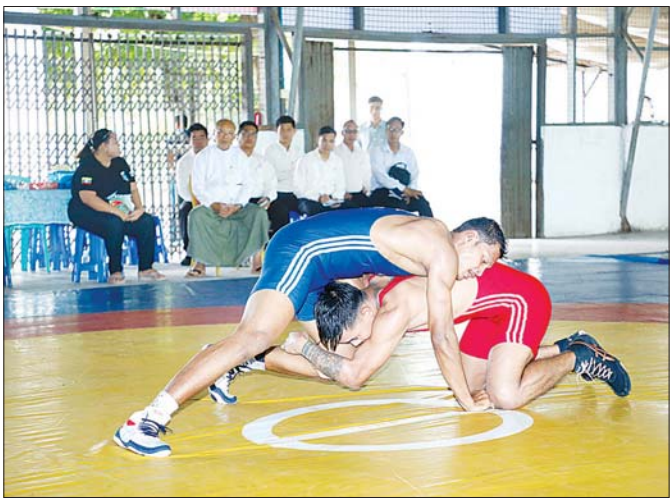
(၃၃)ကြိမ်မြောက် အရှေ့တောင်အာရှ အားကစားပြိုင်ပွဲသို့ ဝင်ရောက်ယှဉ်ပြိုင်ရန် ပဏာမ လက်ရွေးစင် နပန်းအားကစားသမားများ လေ့ကျင့်ကစားနေမှုကို တွေ့ရရုံပဲ။ (၁၆-၆-၂၀၂၅)

အကောင်းဆုံးပြိုင်ပြီး အများဆုံးဆုတွေယူခဲ့ဖူး အားလုံးသိတဲ့အတိုင်း ထိုင်းနိုင်ငံမှာ ကျင်းပ မယ့် (၃၃) ကြိမ်မြောက် အရှေ့တောင်အာရှ အားကစားပြိုင်ပွဲကြီးက သုံးလသာလို့ပါတော့တယ်။ နေရာသုံးနေရာခွဲပြီး ဆင်နွှဲကြမယ့်ပွဲမှာ အားကစား နည်း ၅၃ မျိုး ထည့်သွင်းထားပြီး မြန်မာနိုင်ငံက အားကစားနည်း ၄၀ မှာ ဝင်ရောက်ယှဉ်ပြိုင်မှာ ဖြစ်ပါတယ်။ အခုအချိန်မှာ ပြိုင်ပွဲဝင်ကစားသမား အားလုံး ကြိုတင်လေ့ကျင့်ပြင်ဆင်နေကြပြီလည်း ဖြစ်ပါတယ်။ အောင်ပွဲဆိုင်တဲ့လမ်းဆုံးမရောက်မီ လေ့ကျင့်ပြင်ဆင်ခြင်းဆိုတဲ့ခရီးလမ်းမှာ လျှောက်လှမ်း နေကြတဲ့ကာလတစ်ခုပါ။ ပြင်းပြင်းထန်ထန် လေ့ကျင့်ကြရင်းဖြင့် နိုင်ငံနဲ့ ပြည်သူ့တစ်ရပ်လုံးရဲ့ အားပေးမှုနဲ့အတူ ကိုယ့်ကိုယ်ကိုယ်လည်း ပြန်ပြီး တွန်းအားပေးနေရတဲ့ အရေးကြီးဆုံးကာလအတွင်း မှာပါ။