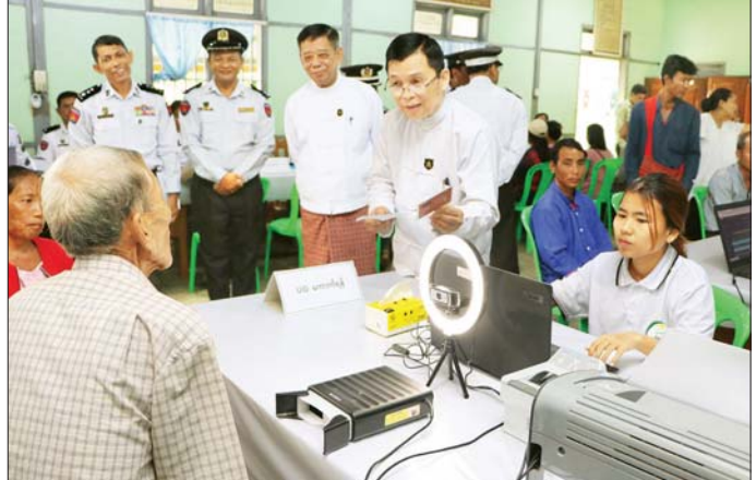
သွားသူများနှင့် အသက်ပြည့်စီသူ အလေးထား ဆောင်ရွက်ရန် ထောက်ပံ့ပေးအပ်ခဲ့ကြောင်း သိရ များကို ကိုင်ဆောင်ကတ်ပြား မှာကြားကာ မြို့နယ်ရုံးဝန်ထမ်း သည်။ တစ်မျိုးမျိုး ရရှိကိုင်ဆောင်နိုင်ရေး များအတွက် ဆန်အိတ်များ သတင်းစဉ်

ဦးစွာ ပြည်ထောင်စုဝန်ကြီး ကောက်ယူကာ Unique ID နံပါတ် ဆက်လက်၍ ပြည်ထောင်စုသည် အိမ်ထောင်စုလူဦးရေစာရင်း တစ်ပါတည်း ဆောင်ရွက်ထုတ်ပေး နေမှုကိုလည်းကောင်း လှည့်လည် ဝန်ကြီးသည် မြို့နယ်ရုံး၊ ရုံးခန်းများအတွင်း ရုံးစာရွက်စာတမ်း ရရှိရေးအတွက် လာရောက်ဆောင် ကြည့်ရှုအားပေးကာ တာဝန်ရှိသူများနှင့် ရုံးသုံးပစ္စည်းများထိန်းသိမ်း ရွက်ကြည့်သည့် ဒေသခံပြည်သူများ များအား လုပ်ငန်းလိုအပ်ချက် ထားရှိမှု၊ ငလျင်ဒဏ်ကြောင့် ကို ရှင်းရင်းနှီးနှီး နှုတ်ဆက်ကာ များ မှာကြားဖြည့်ဆည်းဆောင် ထိခိုက်ပျက်စီးခဲ့သည့် မှတ်တမ်း လုပ်ငန်းဆိုင်ရာအခက်အခဲများကို ရွက်ပေးသည်။ ခန်း ပြန်လည်ပြုပြင်ထားရှိမှုနှင့် မေးမြန်းဆွေးနွေး၍(ယာပုံ) လိုအပ် ယင်းနောက် မြို့နယ် ကိုယ်စားလှယ်များနှင့် အထွေထွေ သည်နှိုင်းဆောင်ရွက်ပေးသည်။ အုပ်ချုပ်ရေးဦးစီးဌာန၊ ရွေးကောက်ပွဲကော်မရှင်အဖွဲ့ခွဲတို့မှ တာဝန်ရှိ ပြီး ဝန်ထမ်းများကို စာရွက် အိမ်ထောင်စု လူဦးရေစာရင်းနှင့် နိုင်ငံသားစိစစ်ရေးကတ်ပြား မှန်ကန်ရေးအတွက် မြေပြင် စာတမ်းများနှင့် ရုံးပစ္စည်းများ၊ ထုတ်ပေးနိုင်ရေးအတွက် One e-ID ဆိုင်ရာ စက်ပစ္စည်းကိရိယာ Stop Service ဖြင့် လုပ်ငန်းစဉ် ကွင်းဆင်း ကောက်ယူခဲ့သည့် အမြဲမပြတ် စစ်ဆေးကြပ်မတ် စာရင်း အချက်အလက်များ ထိန်းသိမ်းဆောင်ရွက်ရေး၊ ငလျင် တိုက်ဆိုင် စိစစ်ဆောင်ရွက်နေမှုကို ကြည့်ရှုအားပေးပြီး လုပ်ငန်း အိမ်ထောင်စု လိုအပ်ချက်များကို ညှိနှိုင်း လူဦးရေစာရင်းနှင့် နိုင်ငံသား စနစ်ဖြင့် Biographic/ Biometric ဆောင်ရွက်ပေးသည်။ စိစစ်ရေးကတ် ပျောက်ဆုံး/ပျက်စီး