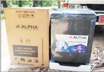
ကရင်ပြည်နယ်၌ ဖမ်းဆီးရမိမှု။

စစ်ကိုင်းမြို့ ရတနာပုံတံတား ပူးပေါင်းစစ်ဆေးရေး ဂိတ်၌ တရားမဝင်ရွှေသတ္တုတူးဖော်ရာတွင် အသုံးပြုသည့် သံပိုက်လုံး ၁၉ လုံး အပါအဝင် ဆက်စပ်ပစ္စည်း ၇၃ မျိုး (ခန့်မှန်းတန်ဖိုးငွေကျပ် ၆၀၈၅၂၀၀) ကို မြန်မာ့သတ္တုတွင်း ဥပဒေအရလည်းကောင်း၊ တရားဝင်စာရွက်စာတမ်း အထောက်အထားတင်ပြနိုင်ခြင်းမရှိသည့် တရားဝင်ထုတ်လုပ်သည့် လူသုံးကုန်ပစ္စည်း ၅၈၅ မျိုး (ခန့်မှန်းတန်ဖိုးငွေကျပ် ၄၁၁၉၀၀၀) ကို ပို့ကုန်သွင်းကုန်ဥပဒေအရလည်းကောင်း၊ မုံရွာမြို့ အလုံစစ်ပင်ရပ်ကွက်၌ တရားမဝင်သစ်ခတ်ရာတွင် အသုံးပြုသည့် လှပိုင်းခုံတစ်ခု (ခန့်မှန်းတန်ဖိုးငွေကျပ် ၂၀၀၀၀၀) ကို သစ်တောဥပဒေအရလည်းကောင်း စုစုပေါင်း ခန့်မှန်းတန်ဖိုးငွေကျပ် ၆၁၄၉၁၀၀၀ ကို ဖမ်းဆီးအရေးယူ ဆောင်ရွက်လျက်ရှိပါသည်။