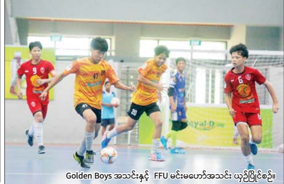
Golden Boys အသင်းနှင့် FFU မင်းမဟော်အသင်း ယှဉ်ပြိုင်စဉ်။

က FFU မင်းမဟော်အသင်းကို လေးဂိုးပြတ်၊ Pacific Sun Far အသင်းက TKA Star အသင်းကို ခြောက်ဂိုး - တစ်ဂိုး၊ Kyaung Sayar Tharhtwe အသင်းက မလိခအသင်းကို ကိုးဂိုး-ငါးဂိုးဖြင့် အနိုင်ရပြီး စာမျက်နှာ ၁၃ ကော်လံ ၁၀