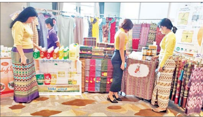
၁၀ နာရီမှ ညနေ ၆ နာရီခွဲအထိ ပြသခဲ့ပြီး ဩဂုတ် ၁၁ ရက်တွင် စီးပွားရေးလုပ်ငန်းရှင်များ တွေ့ဆုံဆွေးနွေးပွဲကို ဆက်လက်ကျင်းပ မှုမင်းသွရ

ကျောက်မျက်များ၊ ကြိမ်ထည်များ၊ ပရိဘောဂများ၊ သစ်သားပန်းပုရုပ်တုများ၊ ယွန်းထည်ပစ္စည်းများ၊ မြန်မာ့ရိုးရာသင်္ကန်းများ၊ မြန်မာ့စားသောက်ကုန်များကို ခင်းကျင်းပြသရာ ပြပွဲလာပရိသတ်များက စိတ်ဝင်စားစွာ ကြည့်ရှုလေ့လာ ဝယ်ယူကြသည်။