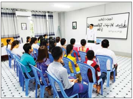
နည်းပညာနှင့် ပတ်သက်သည့် မူသင်တန်းများကိုလည်း ဆက် ကွန်ပျူတာသင်တန်းများ၊ အိမ်တွင်း လက်ဖွင့်လှစ် သင်ကြားပေးသွား

ဘားအံ ဩဂုတ် ၁၀ ကရင်ပြည်နယ် ဘားအံမြို့နယ် လူငယ်စင်တာ၌ ကရင်ပြည်နယ် အစိုးရအဖွဲ့မှ ကြီးမှူးဖွင့်လှစ်သည့် အဆင့်မြင့် ပန်းချီရေးဆွဲခြင်း သင်တန်းဆင်းပွဲကို အဆိုပါလူငယ် စင်တာရှိ ပန်းချီသင်တန်းခန်းမ တွင် ယနေ့ပြုလုပ်ရာ ကရင် ပြည်နယ် လူမှုရေးရာဝန်ကြီး ဦးစောထွန်းအောင်က လူငယ်များ အနေဖြင့် ဗလငါးတန်နှင့်ပြည့်စုံ ရန် လိုအပ်ပါကြောင်း၊ နောင်တွင် လည်း ယခုကဲ့သို့ လူငယ်များ အတွက် ပန်းချီသင်တန်းအပြင်