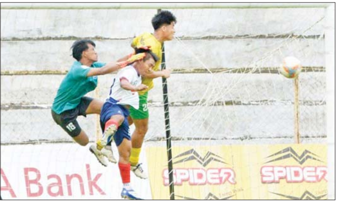
ကချင်ယူနိုက်တက်နှင့် YB United အသင်း ယှဉ်ပြိုင်စဉ်။

MNL-2 (ပထမတန်း) ပြိုင်ပွဲတွင် ကချင်ယူနိုက်တက်အသင်း နိုင်ပွဲစတင်ရရှိပြီး လက်ရှိချန်ပီယံ Chinland အသင်း နိုင်ပွဲဆက် ရန်ကုန် ဩဂုတ် ၁၀ ၂၀၂၅-၂၀၂၆ ရာသီ MNL-2 (ပထမတန်း) အမှတ်ပေးပြိုင်ပွဲ ပွဲစဉ် (၂) ဒုတိယနေ့ကို ဩဂုတ် ၁၀ ရက်က ဆက်လက်ကျင်းပရာ Chinland အသင်းနှင့် ကချင်ယူနိုက်တက် နိုင်ပွဲရယူခဲ့သည်။ ပဗ္ဗာကွင်း၌ ကျင်းပသည့်ပွဲတွင် ကချင်ယူနိုက်တက်အသင်းက YB United အသင်းကို လေးဂိုးပြတ် အနိုင်ရခဲ့သည်။ ကချင်ယူနိုက်တက်အသင်းသည် တန်းတက်အသင်းကို ဂိုးပြတ်သွင်းယူကာ ပထမဆုံး နိုင်ပွဲစတင်ရရှိခဲ့သည်။