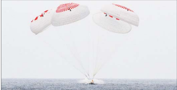
SpaceX Crew-10 အာကာသယာဉ်များ လေထီးအကူအညီဖြင့် ဆန်ဒီယေဂိုကမ်းလွန်ပင်လယ်ပြင် သို့ ဆင်းသက်စဉ်။

အာကာသယာဉ်များ ခန့်မှန်းချိန်နှင့် ရုရှားအာကာသ ယာဉ်များ ပတ်စ်ကော့စ်တို့ဖြစ် သည်။ အဆိုပါ အာကာသယာဉ်များ များသည် အာကာသစခန်းတွင် ရှိနေစဉ်အတွင်း လက်တွေ့စမ်း သပ်မှုများနှင့် နည်းပညာသရုပ်ပြ မှုများကို ဒါဇင်နှင့်ချီ ပြုလုပ်ခဲ့ကြ ကြောင်း သိရသည်။ ဆင်ဟွာ