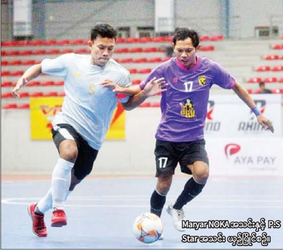
MaryarNOKAအသင်းနှင့် P.S Starအသင်း ယှဉ်ပြိုင်စဉ်။

ရန်ကုန် ဩဂုတ် ၁၀ လာမည့်ရာသီ MFF ဖူဆယ်လီဂ်-၂ ပြိုင်ပွဲဝင်ခွင့်အတွက် ကျင်းပသည့် ခြေစစ်ပွဲအတွက်ဆုံးနေ့ကို ဩဂုတ် ၁၀ ရက်က ရန်ကုန်မြို့ သုဝဏ္ဏဘောလုံးကွင်းရှိ MFF ဖူဆယ်အားကစားရုံ၌ ကျင်းပရာ Maryar NOKA အသင်းက အုပ်စုပထမ၊ P.S Star အသင်းက အုပ်စုဒုတိယဖြင့် ခြေစစ်ပွဲအောင်မြင်ခဲ့သည်။ နောက်ဆုံးပွဲတွင် Maryar NOKA အသင်းက P.S Star အသင်းကို လေးဂိုး-သုံးဂိုးဖြင့် အနိုင်ရခဲ့သည်။ ယင်းနှစ်သင်းစလုံးသည် ယခုပွဲမတိုင်မီကတည်းက ခြေစစ်ပွဲအောင်မြင်ထားပြီး အုပ်စု ပထမနေရာအတွက်သာ စာမျက်နှာ ၁၃ ကော်လံ ၅