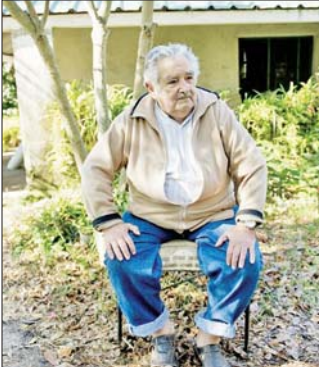
ဥရောပသမ္မတဟောင်း ဟိုဆေးမူဂျီကာ။ ကမ္ဘာ့အဆင်းရဲဆုံးသမ္မတလို့ လူသိများတဲ့ ဥရောပသမ္မတဟောင်း ဟိုဆေးမူဂျီကာကွယ်လွန်

ကမ္ဘာ့အဆင်းရဲဆုံးသမ္မတလို့ လူသိများတဲ့ ဥရောပသမ္မတဟောင်း ဟိုဆေးမူဂျီကာကွယ်လွန်