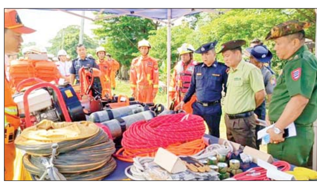
သရုပ်ပြခြင်းများကို ဌာနဆိုင်ရာ အားပေးခဲ့သည်။ တာဝန်ရှိသူများနှင့် အခမ်းအနား ဆက်လက်၍ ခရိုင်/မြို့နယ် တက်ရောက်လာသူများက ကြည့်ရှု စီမံခန့်ခွဲရေးနှင့် အုပ်ချုပ်ရေး

မြန်အောင် ဩဂုတ် ၉ ဧရာဝတီတိုင်း ဒေသကြီး မြန်အောင်မြို့နယ် အမှတ်(၁) ရပ်ကွက် မကျီးစုရေကင်းစခန်း အနီး မြစ်ရေပြင်တွင် ပြည်သူလူထု ပူးပေါင်းပါဝင်သော ရေဘေး သဏ္ဍာန်တူသရုပ်ပြ ဇာတ်တိုက် လေ့ကျင့်ပွဲအခမ်းအနားကို ယနေ့ နံနက်ပိုင်းက ကျင်းပသည်။ အခမ်းအနားတွင် ခရိုင်စီမံခန့်ခွဲ ရေးနှင့် အုပ်ချုပ်ရေးကော်မတီ ဥက္ကဋ္ဌ ဦးမျိုးလှိုင်က အဖွင့်အမှာ စကားပြောကြားပြီး ရေဘေး တုံ့ပြန်ရေးသဏ္ဍာန်တူဇာတ်တိုက် သရုပ်ပြခြင်း ဆောင်ရွက်ရာတွင် သန္ဓေ/အရန် မီးသတ်တပ်ဖွဲ့ဝင် ၇၀ က မြစ်ရေပြင်၌ စက်လှေ မှောက်မှုဖြစ်စဉ်တွင် ရှာဖွေကယ် ဆယ်ရေးဆောင်ရွက်မှု သရုပ်ပြ ခြင်း၊ ဦးခေါင်းနှင့် ခြေထောက် ဒဏ်ရာရရှိပြီး ရေနစ်နေသူအား ရှာဖွေကယ်ဆယ်ရေး ဆောင်ရွက် ခြင်း၊ ရေသန့်ဘူးအသုံးပြုပြီး ရေဘေးအန္တရာယ် ကာကွယ်မှု