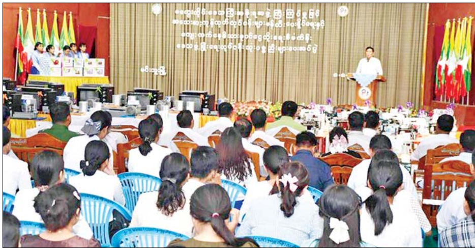
ကိုယ်ပိုင်လုပ်ငန်းထူထောင်မည့် သင်တန်းသူ ၂၅ ဦး အား ဒေသဖွံ့ဖြိုးရေးလုပ်ငန်းသုံးပစ္စည်းများ ပေးအပ် ကာ သင်တန်းများ ဖွင့်လှစ်ဆောင်ရွက်ပေးမှုအပေါ် သင်တန်းသူတစ်ဦးက ကျေးဇူးတင်စကား ပြန်လည် ပြောကြားသည်။ မကွေးတိုင်းဒေသကြီးအစိုးရအဖွဲ့၏ စီစဉ် ကြီးကြပ်မှုဖြင့် မင်းဘူးခရိုင် အသေးစားစက်မှုလက်မှု လုပ်ငန်းဦးစီးဌာနက ကြီးမှူး၍ စီမံကိန်းကျေးရွာ

မင်းဘူး ဩဂုတ် ၉ မကွေးတိုင်းဒေသကြီး မင်းဘူး(စကျ)မြို့နယ်၌ ဒေသတွင်း အသေးစားကုန်ထုတ်လုပ်ငန်းများ ဖန်တီးပေးနိုင်ရေးနှင့် ကျေးလက်နေထိုင်ရေးစီမံကိန်းဖြင့် ဖွင့်လှစ်ဆောင်ရွက်ခဲ့သည့် သင်တန်းများမှ လုပ်ငန်းထူထောင်မည့် သင်တန်းသူ ၂၅ ဦးအား ဒေသဖွံ့ဖြိုးရေးလုပ်ငန်းသုံးပစ္စည်းများ ပေးအပ်ပို့ဆောင်ပေးအပ်ခဲ့ကြောင်း ဩဂုတ် ၈ ရက် နံနက်ပိုင်း က မင်းဘူးမြို့ရှိ မင်းပူဦးဩဘာသာမြို့နယ်ခန်းမ၌ ကျင်းပရာ မကွေးတိုင်းဒေသကြီးဝန်ကြီးချုပ် ဦးတင့်လွင်နှင့် တိုင်းဒေသကြီးဝန်ကြီးများ တက်ရောက် ကြသည်။