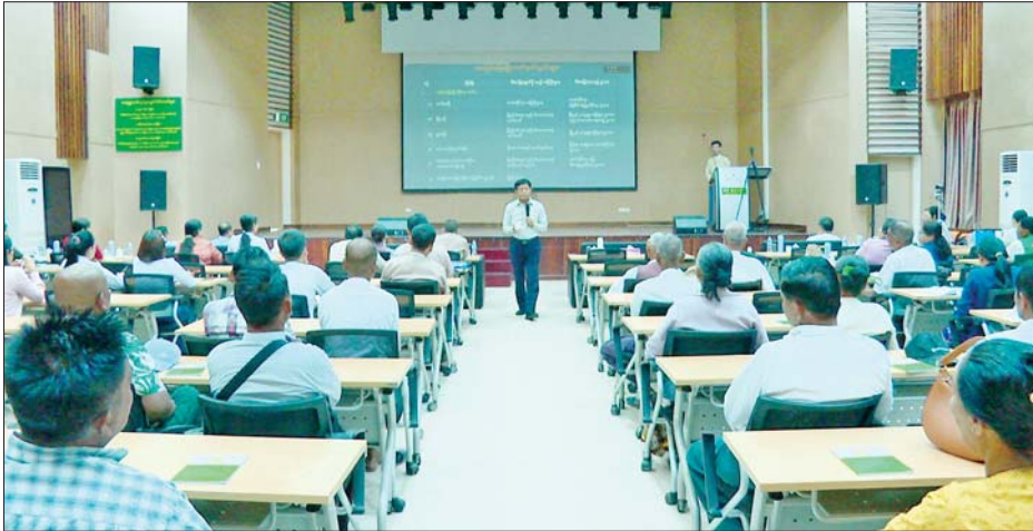
သည် တောင်သူများ လက်တွေ့ အသုံးပြုနိုင်သော အချက်များကို ရရှိစေရန်နှင့် ဥပဒေနှင့်အညီ စိုက်ပျိုးရေးလုပ်ငန်းများ ရေရှည် တည်တံ့ပြီး အကာအကွယ်ရှိစေ ရန် အထောက်အကူပြုစေမည် ဖြစ်ကြောင်း၊ လယ်ယာကဏ္ဍ ဆိုင်ရာ ဥပဒေများနှင့် အသိပညာ ဗဟုသုတများကို ပြန်လည်မျှဝေ

(၇၈)ကြိမ်မြောက် တောင်သူ နည်းပညာပေး ဆွေးနွေးပွဲကို ယနေ့နံနက်ပိုင်းက နေပြည်တော် ဇေယျာသီရိမြို့နယ် ရေဆင်း ရှိ စိုက်ပျိုးပညာပေးရေးနှင့် ကျေးလက်ဒေသ ဖွံ့ဖြိုးရေး သင်တန်းကျောင်း AERDTC ခန်းမ ၌ လယ်ယာမြေဥပဒေဆိုင်ရာ သိကောင်းစရာများ ခေါင်းစဉ်ဖြင့် ကျင်းပသည်။