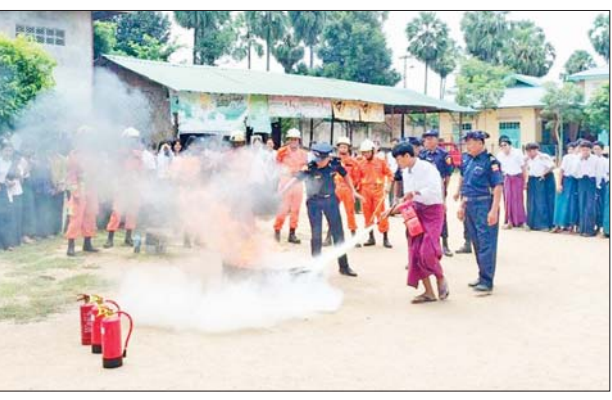
ရဲ့ IDEA ကိုယ်ပိုင်အထက်တန်း ကျောင်း၌ ပြုလုပ်သည်။ IDEA ကိုယ်ပိုင်အထက်တန်း ကျောင်းမှ ကျောင်းသား ကျောင်း သူများအား မြို့နယ်ဦးစီးမှူး