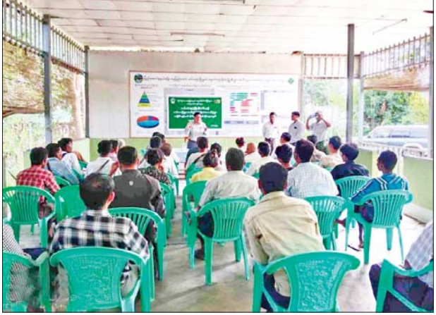
က ကာလပေါက်ဈေးအတိုင်း ခံနိုင်လျှင် စက်မှုလယ်ယာဦးစီး ဌာနက ပူးပေါင်းအကောင်အထည် ကူညီ ဆောင်ရွက်ပေးကြောင်း၊ လယ်ယာသုံး စက်ကိရိယာ အတွက် စက်မောင်း၊ စက်ပြင် သင်တန်းများ လိုအပ်ပါက သင်တန်းများ ဖွင့်လှစ်သင်ကြား ပေးကြောင်း၊ စနစ်တကျ ပေါင်းစည်း လယ်ယာများ ဖော်ဆောင်လိုပါကလည်း ငွေကြေး ကုန်ကျမှု၏ ထက်ဝက်အကုန်ကျ

ပြည်ထောင်စုနယ်မြေ နေပြည် တော် တပ်ကုန်းမြို့နယ်အတွင်း လယ်ယာကဏ္ဍဖွံ့ဖြိုးရေးအတွက် ဒေသခံပြည်သူများနှင့် တွေ့ဆုံ ခြင်းအခမ်းအနားကို ဩဂုတ် ၉ ရက် နံနက်ပိုင်းက ကျားသေအိုင် ကျေးရွာစိုက်ပျိုးစီးပွားအသိပညာ ပေးစင်တာ(KC)ခန်းမ၌ ကျင်းပ သည်။