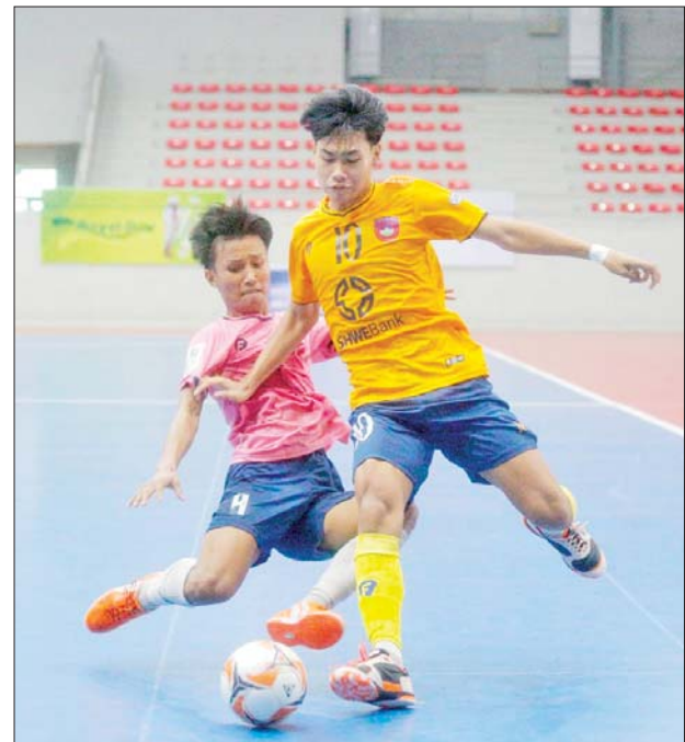
Winner Soccer အသင်းနှင့် YCDC MHDT အသင်းတို့ ယှဉ်ပြိုင်နေစဉ်။

ပွဲစဉ် (၁၆) အပြီး ထိပ်ဆုံးနှစ်သင်းဖြစ်သည့် Winner Soccer အသင်းနှင့် YCDC MHDT အသင်းတို့ ထိပ်တိုက်တွေ့ဆုံခဲ့ပြီး Winner Soccer အသင်း အနိုင်ရခဲ့သဖြင့် ထိပ်ဆုံးတွင် သုံးမှတ်အသာဖြင့် ဦးဆောင်နိုင်ခဲ့ကာ YRG အသင်း ဒုတိယနေရာသို့ တက်လှမ်းနိုင်ခဲ့သည်။ ပွဲစဉ် (၁၇) တွင် Winner Soccer အသင်းက YCDC MHDT အသင်းကို လေးဂိုး-နှစ်ဂိုး၊ YRG အသင်းက Generations အသင်းကို ရှစ်ဂိုးပြတ်၊ FFU မင်းမဟော်အသင်းက ရွှေပြည်သာယူနိုက်တက်အသင်းကို လေးဂိုး- သုံးဂိုး၊ စာမျက်နှာ ၉ ကော်လံ ၁ သို့ ❁