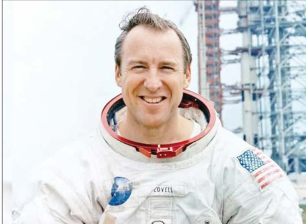
ကြိုးပမ်းခဲ့သည်။ အဆိုပါဖြစ်စဉ်နှင့်ပတ်သက်ပြီး ၁၉၉၅ ခုနှစ်ကရိုက်ကူးခဲ့သည့် “Apollo 13” ရုပ်ရှင်ကားတွင် မင်းသား တွမ်ဟန့်က ဂျိမ်းစ်လိုဗီလ် နေရာတွင် ပါဝင်သရုပ်ဆောင်ထားကြောင်း သိရသည်။ ကိုးကား - အင်န်အိတ်ချီကေ ဘာသာပြန် - အောင်ကျော်ကျော်

ဝါရှင်တန် ဩဂုတ် ၉ ၁၉၇၀ ပြည့်နှစ် လကမ္ဘာသို့သွားရောက်သည့် Apollo 13 ခရီးစဉ်တွင် လိုက်ပါခဲ့သော အာကာသယာဉ်မှူး ဂျိမ်းစ်လိုဗီလ် အသက် ၉၇ နှစ်တွင် ကွယ်လွန်ခဲ့ကြောင်း အမေရိကန် အာကာသအေဂျင်စီ နာဆာက ယမန်နေ့တွင် ပြောကြားသည်။ အိုဟိုင်းယိုးပြည်နယ်မှူး အာကာသယာဉ်မှူး ဂျိမ်းစ်လိုဗီလ်သည် ၁၉၆၈ ခုနှစ်တွင် လကမ္ဘာသို့ ပထမဆုံး အခြေချနိုင်ခဲ့သည့် လူသား ခရီးစဉ် Apollo 8 မှစ၍ တွင် ပါဝင်ခဲ့သည်။ Apollo 8 သည် လကမ္ဘာပတ်လမ်းကြောင်းသို့ရောက်ရှိခဲ့သည့် ပထမဆုံးသော အာကာသယာဉ်ဖြစ်သည်။ လကမ္ဘာသို့သွားရောက်သည့် Apollo 13 ခရီးစဉ်တွင် လျှပ်စစ်စနစ် ချို့ယွင်းမှုကြောင့် အာကာသယာဉ်ပေါ်ရှိ အောက်ဆီဂျင်တိုင်ကို ပေါက်ကွဲသွားသည့်အချိန်တွင် အာကာသယာဉ်မှူးများ ဘေးကင်းရေး အတွက် ဂျိမ်းစ်လိုဗီလ်က ကြီးကြပ်ကွပ်ကဲခဲ့ကြောင်း သိရသည်။ အာကာသယာဉ်သည် လျှပ်စစ်ထောက်ပံ့မှုရပ်တန့်သွားသည့် အချိန်တွင် ဂျိမ်းစ်လိုဗီလ်က ရေနံစွမ်းအင်ကို ဆက်လက်ထိန်းသိမ်း ထားနိုင်ရန်အတွက် ၎င်း၏အဖွဲ့အား လကမ္ဘာစူးစမ်းလေ့လာရေး ယာဉ်ပေါ် သို့ ပြောင်းရွှေ့ကာ ကမ္ဘာမြေသို့ ဘေးကင်းစွာ ပြန်လာနိုင်ရန်