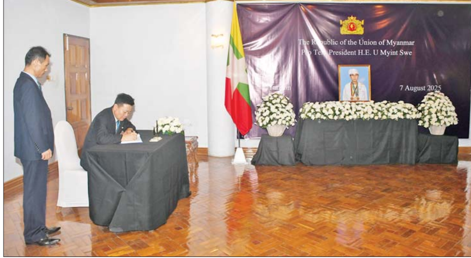
ပြည်ထောင်စုသမ္မတမြန်မာနိုင်ငံတော်၊ ယာယီသမ္မတဦးမြင့်ဆွေ ကွယ်လွန်ခြင်းအတွက် ဝမ်းနည်း ကြောင်း မှတ်တမ်းစာအုပ်တွင် ကိုရီးယား ဒီမိုကရက်တစ်ပြည်သူ့သမ္မတနိုင်ငံ သံအမတ်ကြီး H.E. Mr. Jong Ho Bom လက်မှတ်ရေးထိုးစဉ်။

သံအမတ်ကြီးများနှင့်သံရုံးအကြီးအကဲများက ယာယီသမ္မတ ဦးမြင့်ဆွေ ကွယ်လွန်ခြင်းအပေါ် ပြည်ထောင်စုသမ္မတမြန်မာ နိုင်ငံတော်အစိုးရနှင့် ပြည်သူများ၊ ကျန်ရစ်သူမိသားစုသို့ ဝမ်းနည်း ကြောင်းနှင့် စာနာထောက်ထားပါကြောင်းသတင်းစကားများပြောကြား ခဲ့ပြီး ဝမ်းနည်းကြောင်းမှတ်တမ်းစာအုပ်၌ လက်မှတ်ရေးထိုးခဲ့ကြ ကြောင်း သိရသည်။ သတင်းစဉ်