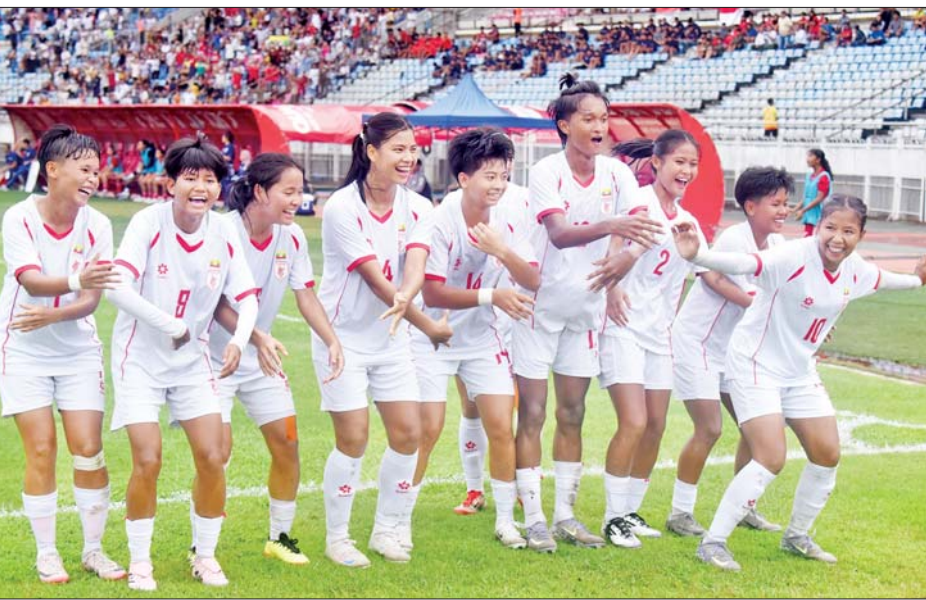
ခြေစစ်ပွဲအောင်မြင်ရေး အိန္ဒိယအသင်းနှင့် အဆုံးအဖြတ်ပွဲကစားရမည့် မြန်မာ ယူ-၂၀ အမျိုးသမီးအသင်း။

ရန်ကုန် ဩဂုတ် ၉ ဗီယက်နမ်နိုင်ငံ၌ ကျင်းပနေသည့် ၂၀၂၅ အာဆီယံ အမျိုးသမီးချန်ပီယံရှစ်ပြိုင်ပွဲ ယှဉ်ပြိုင်နေသည့် မြန်မာ့လက်ရွေးစင် အမျိုးသမီးအသင်းနှင့် မြန်မာနိုင်ငံက အိမ်ရှင်အဖြစ် လက်ခံကျင်းပနေသည့် ၂၀၂၆ အာရှဖလား ယူ-၂၀ အမျိုးသမီးခြေစစ်ပွဲ အုပ်စု(D)တွင် ပါဝင်နေသည့် မြန်မာ ယူ-၂၀ အမျိုးသမီးလူငယ်လက်ရွေးစင် အသင်းတို့သည် အုပ်စုပွဲများကို ဩဂုတ် ၁၀ ရက် ညနေ ၄ နာရီတွင် တစ်ချိန်တည်း ယှဉ်ပြိုင်ကစားရမည်ဖြစ်သည်။ စာမျက်နှာ ၁၇ ကော်လံ ၁ သို့ ❁