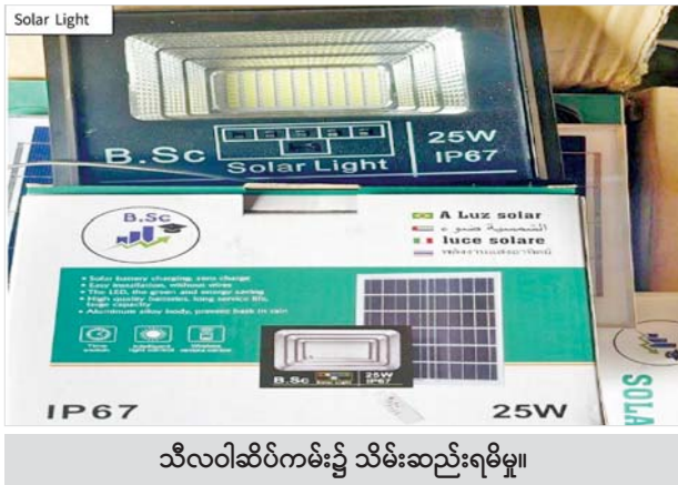
သီလဝါဆိပ်ကမ်း၌ သိမ်းဆည်းရမိမှု။

ယင်းအပြင် ဩဂုတ် ၈ ရက်တွင် မွန်ပြည်နယ် တရားမဝင် ကုန်သွယ်မှုတိုက်ဖျက်ရေးအဖွဲ့၏ စီမံခန့်ခွဲမှုဖြင့် တာဝန်ကျပူးပေါင်းအဖွဲ့က စစ်ဆေးမှုများဆောင်ရွက်ခဲ့ရာ မော်လမြိုင်မြို့ ဟင်္သာအပိုင်အနီး၌ ယာဉ်တစ်စီးပေါ်မှ တရားဝင်စာရွက်စာတမ်း အထောက်အထားတင်ပြနိုင်ခြင်းမရှိသည့် လူသုံးကုန်ပစ္စည်းနှစ်မျိုး၊ စားသောက်ကုန်ပစ္စည်းတစ်မျိုး (ခန့်မှန်းတန်ဖိုးငွေကျပ် ၃၀၅၄၄၀၀)နှင့် အဆိုပါပစ္စည်းများ တင်ဆောင်လာသည့် Hino Truck တစ်စီး (ခန့်မှန်းတန်ဖိုးငွေကျပ် ၁၅၀၀၀၀) စုစုပေါင်းခန့်မှန်းတန်ဖိုးငွေကျပ် ၄၅၅၄၄၀၀ ကို သိမ်းဆည်းရမိခဲ့ပြီး အကောက်ခွန် လုပ်ထုံးလုပ်နည်းများနှင့်အညီ အရေးယူဆောင်ရွက်လျက်ရှိသည်။