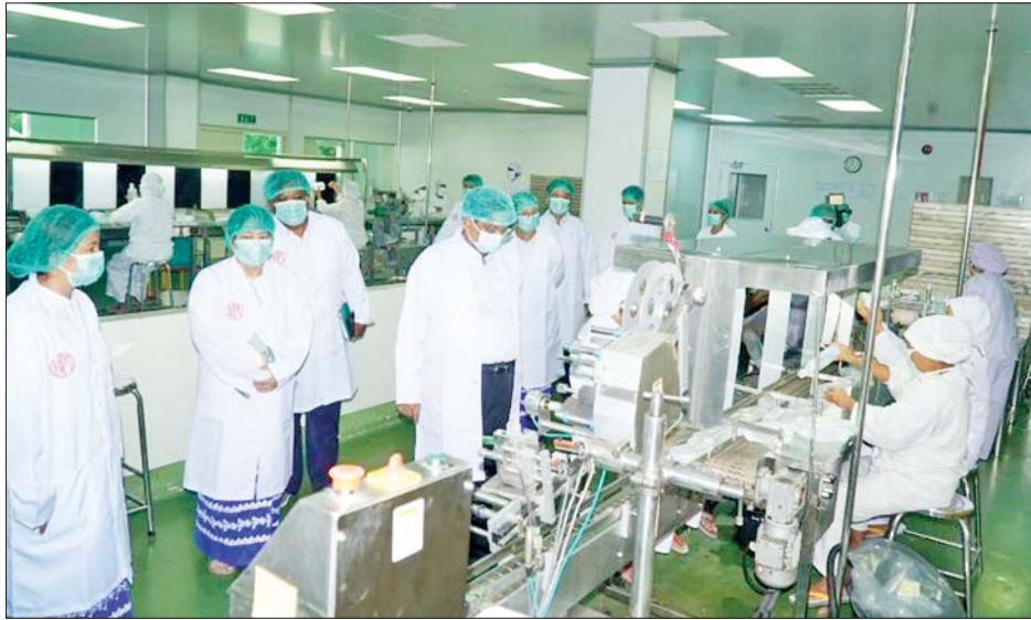
စက်ပစ္စည်းကိရိယာများ တပ်ဆင်မည်ဆိုပါက FEMA ဆောင်ရွက်လျှင် လိုက်နာဆောင်ရွက်ရမည့် လုပ်ငန်း စဉ်အဆင့်ဆင့်တို့ကို သတ်မှတ်ရေးဆွဲထားရမည်ဖြစ် ကြောင်း၊ ပြည်တွင်း၌ ဆေးဝါးစက်ရုံများ အသစ် ကြောင်း၊ အခြေခံဆေးဝါး အခြေခံဆေးဝါး များ တိုးမြှင့်ထုတ်လုပ်နိုင်ရေးအတွက် စီမံချက်များ

စက်မှုဝန်ကြီးဌာန ပြည်ထောင်စုဝန်ကြီး ဒေါက်တာချာလီသန်းသည် ယနေ့နံနက်ပိုင်းတွင် မန္တလေးတိုင်းဒေသကြီး ကျောက်ဆည်မြို့နယ်ရှိ ဆေးဝါးစက်ရုံ(အင်ရောင်း)သို့ ရောက်ရှိပြီး မန္တလေး ငလျင်ကြီးလုပ်ငန်းကြောင့် သွေးကြောသွင်း ဆေးရည်ထုတ်လုပ်ရေးဌာနရှိ အဆောက်အအုံနှင့် စက်ပစ္စည်းကိရိယာများ ပျက်စီးခဲ့၍ ပြန်လည်ပြုပြင် ရေးလုပ်ငန်းများ ဆောင်ရွက်ပြီးစီးမှု၊ သွေးကြောသွင်း ဆေးရည်များ ပြန်လည်ထုတ်လုပ်နေမှု အခြေအနေ တို့ကို လှည့်လည်ကြည့်ရှုစစ်ဆေးသည်။