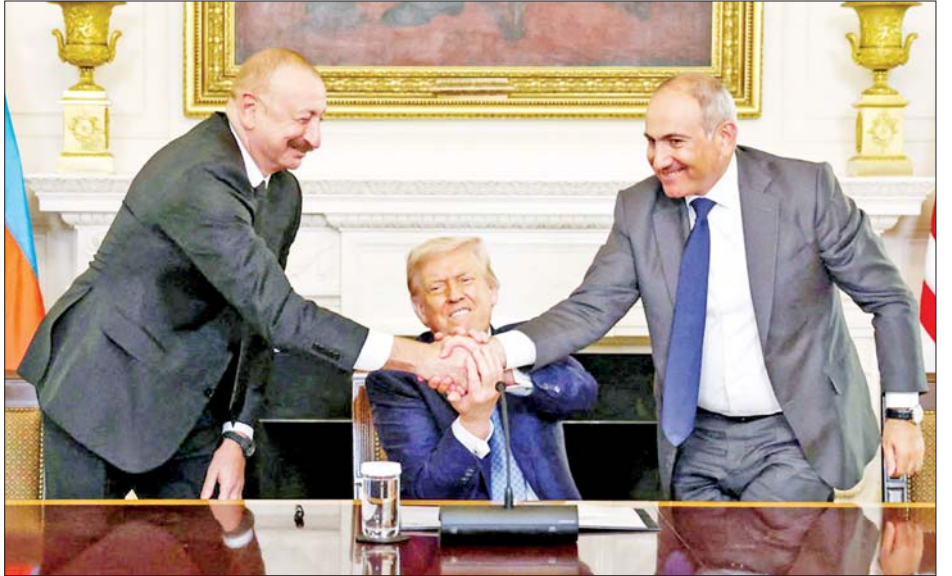
အမေရိကန် သမ္မတ ဒေါ်နယ် ထရမ် က ဆောင်ရွက်လျက်ရှိကြောင်း သိရသည်။ ကမ္ဘာတစ်ဝန်းရှိ ပဋိပက္ခများကိုအဆုံးသတ်ရန် ကိုးကား - အင်န်အိတ်ချီကေ အတွက် ငြိမ်းချမ်းရေးဖော်ဆောင်သူအဖြစ် ကြိုးပမ်း ဘာသာပြန် - အောင်ကျော်ကျော်

ထားသည့် လမ်းကြောင်းတစ်ခုထူထောင်ရန် ပါရှိကြောင်း သိရသည်။ တိုက်ရိုက်သွားလာ သမ္မတ ထရမ်အဆိုပြုခဲ့သည့် အဆိုပါလမ်းကြောင်းသည် ပြည်သူများနှင့် ကုန်ပစ္စည်းများကို အခြားနိုင်ငံသို့မဖြတ်ဘဲ အဇာဘိုင်ဂျန်နှင့် အာမေးနီးယားပိုင်နက်အတွင်းရှိ နက်ခီချီဗင်နယ်မြေအကြား တိုက်ရိုက်သွားလာနိုင်စေမည့် စင်္ကြံတစ်ခုဖြစ်သည်။ အဇာဘိုင်ဂျန် သမ္မတ အီဟမ်အာလီယက်စ်က ဒေါ်နယ်ထရမ်အား ကျေးဇူးတင်စကားပြောကြားပြီး အဆိုပါနေ့ရက်ကို သမိုင်းဝင်နေ့ရက်အဖြစ် ဖော်ပြခဲ့သည်။ အလားတူ အာမေးနီးယားဝန်ကြီးချုပ် နီကိုလ်ပါရင်ယန်ကလည်း လက်ရှိသဘောတူညီချက်သည် အပြီးတိုင်ငြိမ်းချမ်းရေးရရှိရေးအတွက် ထောက်ပံ့ပေးမည်ဟု ယုံကြည်ပါကြောင်း ပြောကြားသည်။