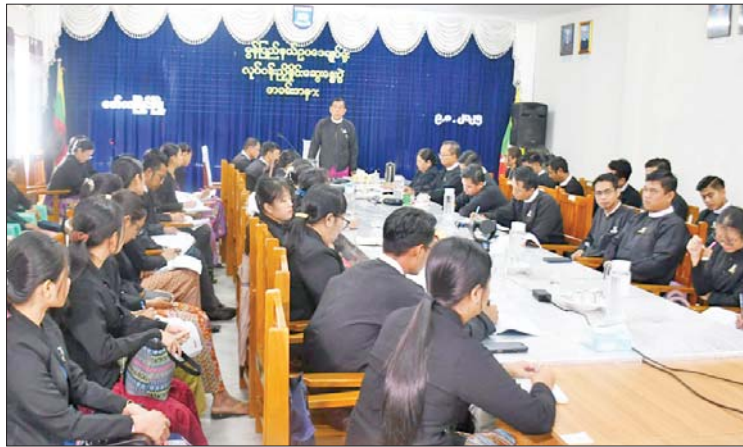
ပေးအပ်သောတာဝန်များကို ထမ်းဆောင်ကြရာတွင် နိုင်ငံတော်၏ တည်ဆဲဥပဒေ၊ များနှင့်အညီ တိတိကျကျ လိုက်နာဆောင်ရွက်သွားကြရန် လိုကြောင်း၊ အမျိုးသားကာကွယ်ရေးနှင့် လုံခြုံရေး

မော်လမြိုင် ဩဂုတ် ၉ မွန်ပြည်နယ် မော်လမြိုင်မြို့၌ ပြည်နယ်ဥပဒေချုပ်နှင့် ပြည်နယ်၊ ခရိုင်၊ မြို့နယ်ဥပဒေရုံးများ၏ လုပ်ငန်းညှိနှိုင်းအစည်းအဝေးကို ယနေ့နံနက်ပိုင်းက ပြည်နယ်ဥပဒေချုပ်ရုံး အစည်းအဝေးခန်းမ၌ ကျင်းပသည်။ လိုက်နာဆောင်ရွက် ဦးစွာ မွန်ပြည်နယ်ဥပဒေချုပ် ဦးမြင့်အောင်က မိမိတို့၏ ဥပဒေအရာရှိများသည် နိုင်ငံ့ဝန်ထမ်းများဖြစ်ကြသည့် အားလျော်စွာ နိုင်ငံတော်က ပေးအပ်ထားသောရာထူး၊ လစာတို့ကို ရရှိခံစားနေကြသည့် ဝန်ထမ်းများဖြစ်သည်နှင့်အညီ နိုင်ငံတော်က