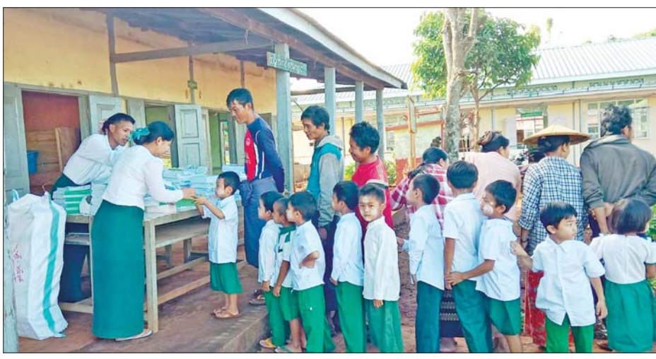
နောင်ချိုမြို့နယ်အတွင်းရှိ အခြေခံပညာကျောင်းများ၌ ကျောင်းသား ကျောင်းသူများအား ကျောင်းအပ်လက်ခံခြင်းများ ဆက်လက်ဆောင်ရွက်ပေးနေမှုကို တွေ့ရစဉ်။

လုပ်ငန်းများ ဆောင်ရွက်ကာ ဩဂုတ် ၂ ရက်တွင် ပြန်လည်ဖွင့်လှစ်ပေးခဲ့ပြီး ဒေသခံတိုင်းရင်းသား ပြည်သူများအား လိုအပ်သည့် ကျန်းမာရေး စောင့်ရှောက်မှုလုပ်ငန်းများ ဆောင်ရွက်ပေးလျက်ရှိသည်။ ထိုသို့ ဆောင်ရွက်ပေးလျက်ရှိရာ ယနေ့တွင် ပြည်သူ့ဆေးရုံကြီး၌ ပြင်ပလူနာ ၆၇ ဦးကို ငှက်ဖျားရောဂါ၊ တုပ်ကွေးရောဂါ၊ အထွေထွေရောဂါတို့နှင့် ပတ်သက်၍ လိုအပ်သည့် ကျန်းမာရေး စစ်ဆေးကုသပေးခြင်းများ ဆောင်ရွက်ပေးခြင်း၊ သွေးအမျိုးအစားစစ်ဆေးပေးခြင်း ၁၆ ဦးနှင့် ငှက်ဖျားပိုးစစ်ဆေးပေးခြင်း ၁၇ ဦးတို့အား စစ်ဆေးပေးခဲ့ပြီး ပြည်သူ့ဆေးရုံကြီးရှိ OPD လူနာများအား ဆေးစိမ်ခြင်းထောင်