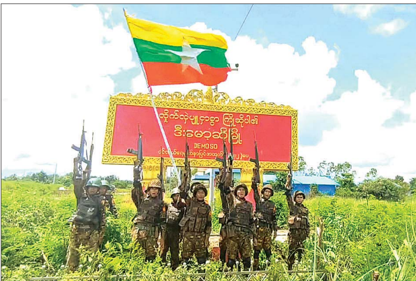
အကြမ်းဖက်သောင်းကျန်းသူများ ယာယီထိန်းချုပ်ထားသည့် ဒီးမော့ဆိုမြို့အား တပ်မတော်က ပြန်လည်ထိန်းချုပ်စဉ်။

နေပြည်တော် ဩဂုတ် ၁၉ KNPP၊ KNDF အဖွဲ့များနှင့် PDF အမည်ခံ အကြမ်းဖက်သမားများ ယာယီထိန်းချုပ် ထားသည့် ကယားပြည်နယ် ဒီးမော့ဆိုမြို့ အား တပ်မတော်က ယနေ့တွင် အပြည့် အဝပြန်လည်ထိန်းချုပ်ပြီး လိုအပ်သည့် နယ်မြေလုံခြုံရေးနှင့် နယ်မြေရှင်းလင်း ရေးလုပ်ငန်းများ ဆက်လက်ဆောင်ရွက် လျက်ရှိကြောင်း သိရှိရသည်။