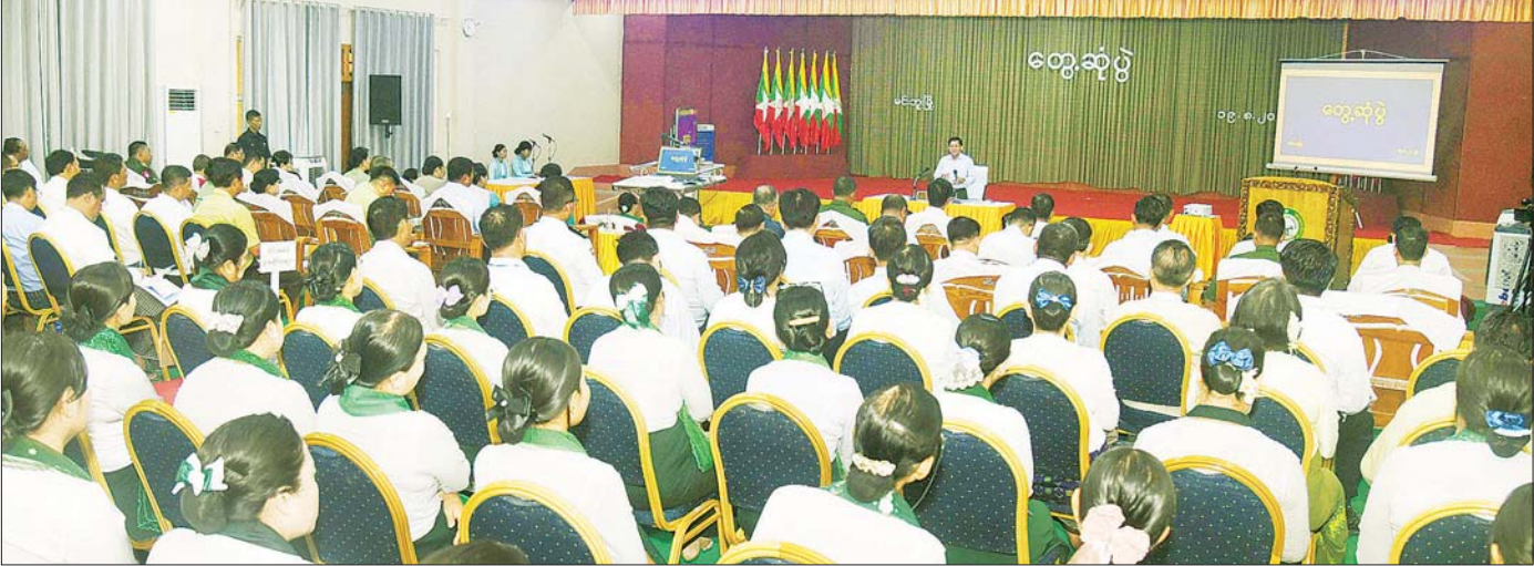
နိုင်ငံတော်လုံခြုံရေးနှင့် အေးချမ်းသာယာရေးကော်မရှင်ဥက္ကဋ္ဌ ဗိုလ်ချုပ်မှူးကြီး မင်းအောင်လှိုင် မင်းဘူးမြို့ရှိ ဌာနဆိုင်ရာတာဝန်ရှိသူများ၊ မြို့မိ မြို့ဖများနှင့်တွေ့ဆုံ၍ ဒေသဖွံ့ဖြိုးတိုးတက်ရေးဆွေးနွေးစဉ်။