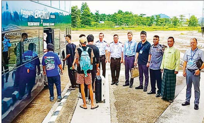
ဆောင်ရွက်နေမှု စာရင်းဇယား၊ အချက်အလက်များ ပြည့်စုံမှန်ကန်မှုရှိရေး ဆောင်ရွက်နေမှုတို့ကို ကြည့်ရှု စစ်ဆေးပြီး လိုအပ်သည်များ ပြည့်စုံစွာကုသကြားသည်။ ထို့နောက် ပြည်နှင့်လွှဲပြောင်းပေးအပ်ပုံကို ဆက်လက်ကျင်းပခဲ့ရာ လူဝင်မှုကြီးကြပ်ရေးနှင့် ပြည်သူ့အင်အားဝန်ကြီးဌာန ကရင်ပြည်နယ် ဒုတိယ

နေပြည်တော် ဩဂုတ် ၁၉ ထိုင်းနိုင်ငံအပါအဝင် အိမ်နီးချင်းနိုင်ငံအချို့ကို တစ်ဆင့်ခံဖြတ်သန်း၍ မြန်မာနိုင်ငံအတွင်းသို့ နယ်စပ်လမ်းကြောင်းများမှ တရားမဝင် ဝင်ရောက် လာပြီး ကရင်ပြည်နယ် မြဝတီမြို့-ရွှေကုက္ကိုလ်၊ မွဲထေယလေး(KK Park)နှင့် ကျောက်ခတ်နယ်မြေ များတွင် အွန်လိုင်းလောင်းကစားမှုများ၊ အွန်လိုင်း လိမ်လည်မှုများ၊ ဒုစရိုက်မှုများ ကျူးလွန်ခဲ့ကြသည့် ဝီယက်နမ်နိုင်ငံသား ၁၃ ဦးအား မြန်မာ-ထိုင်း အမှတ်(၂)ရခိုင်ကြည့်ရှုရေးတံတားမှတစ်ဆင့် သက်ဆိုင် ရာနိုင်ငံသို့ လူသားချင်းစာနာထောက်ထားမှုနှင့် နိုင်ငံအချင်းချင်း ချစ်ကြည်ရင်းနှီးမှုတို့ကို ရှေးရှု၍ ဥပဒေလုပ်ထုံးလုပ်နည်းများနှင့်အညီ ထပ်မံ လွှဲပြောင်းပေးသည်။