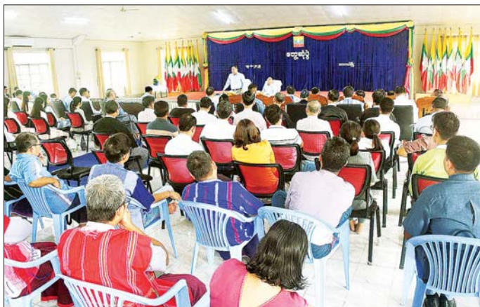
တိုင်းရင်းသားစာပေနှင့် ယဉ်ကျေးမှုကော်မတီများက ဒေသဖွံ့ဖြိုးရေးအတွက် လိုအပ်ချက်များနှင့် တိုင်းရင်းသားဘာသာသင် TA/ LT ဆရာ ဆရာမများအား ထောက်ပံ့ပေးနိုင်ရေးတို့ကို တင်ပြကြသည်။

ဦးစွာ တနင်္သာရီတိုင်းဒေသကြီး တိုင်းရင်းသားရေးရာဝန်ကြီး ဦးစော်အေးမောင်၊ တနင်္သာရီတိုင်းဒေသကြီးအတွင်း တိုင်းရင်းသားဒေသများတွင် ကျန်းမာရေး၊ ပညာရေး၊ လမ်းပန်းဆက်သွယ်ရေး အခက်အခဲများနှင့် ယာယီနေရပ်စွန့်ခွာ တိုင်းရင်းသားပြည်သူများကို ပန်းခင်းစီမံချက်နှင့်အညီ နိုင်ငံသားစီစစ်ရေးကော်မတီ၊ အိမ်ထောင်စုလူဦးရေစာရင်းများအား သက်ဆိုင်ရာဌာနဆိုင်ရာများနှင့် ညှိနှိုင်းဆောင်ရွက်ခြင်း၊ အခြေခံစားသောက်ကုန်များ ထောက်ပံ့ပေးအပ်ခြင်း၊ တနင်္သာရီတိုင်းဒေသကြီးအတွင်း တိုင်းရင်းသားရိုးရာပွဲတော် အခမ်းအနားများ ကျင်းပဆောင်ရွက်မှုအခြေအနေများနှင့် တိုင်းရင်းသားများ၏ လူမှုစီးပွားဘဝ ဖွံ့ဖြိုးတိုးတက်ရေးလုပ်ငန်းဆောင်ရွက်မှုများကို ရှင်းလင်းတင်ပြသည်။