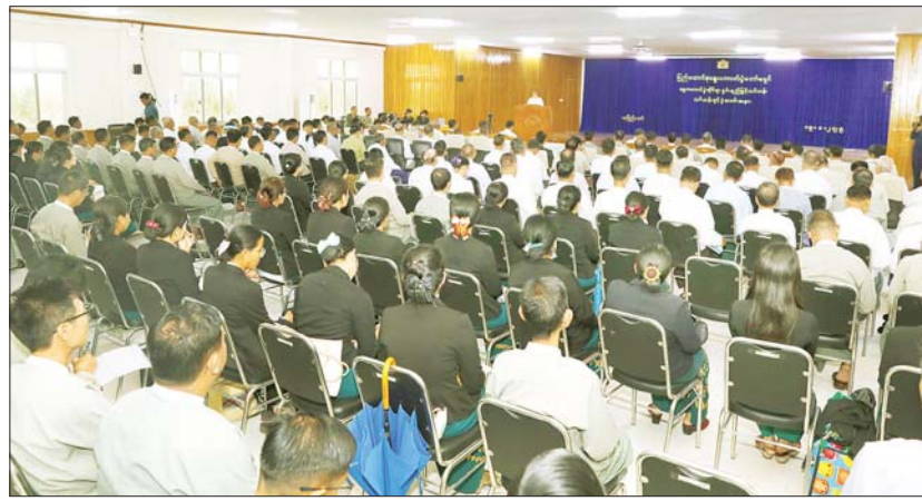
အထိ ဖွင့်လှစ်မည်ဖြစ်ပြီး မီဒီယံကွန်ပရင်း စုစုပေါင်း ၂၀၀ တက်ရောက်လျက်ရှိ ရွေးကောက်ပွဲဆိုင်ရာ စွမ်းရည်မြှင့် မှတစ်ဆင့် တက်ရောက်သည့် သင်တန်း ကြောင်း သိရသည်။ သတင်းစဉ်

အခမ်းအနားတွင် ပြည်ထောင်စု အိလက်ထရောနစ် မဲပေးစက်များဖြင့် ရွေးကောက်ပွဲကော်မရှင် ဥက္ကဋ္ဌက ခလုတ်နှိပ်မဲပေးရမည် ဖြစ်ကြောင်း၊ ရွေးကောက်ပွဲကို ၂၀၂၅ ခုနှစ် ဒီဇင်ဘာ ၂၈ ရက်တွင် စတင်ကျင်းပမည်ဖြစ်ပြီး ရွေးကောက်ပွဲကို ယခုကျင်းပမည့်ရွေးကောက်ပွဲတွင် ယခင် ရွေးကောက်ပွဲများနှင့်မတူသည့် အချက် သုံးချက်ရှိကြောင်း၊ ပထမဆုံးအချက်မှာ ရွေးကောက်ပွဲစနစ်ဖြစ်ကြောင်း၊ လာမည့် ရွေးကောက်ပွဲတွင် ယခင်ကျင့်သုံးခဲ့သည့် FPTP စနစ်အပြင် FPTP နှင့် PR စနစ် ပေါင်းစပ်ထားသည့် ရောနှောထားသော ကိုယ်စားလှယ်အချိုးကျစနစ် (Mixed Member Proportional - MMP)ကို အသုံးပြုဆောင်ရွက်မည်ဖြစ်ပြီး ယခု သင်တန်းတွင် အသေးစိတ်ဆွေးနွေး ပို့ချ ပေးမည်ဖြစ်ကြောင်း၊ ဒုတိယအချက်အနေ ဖြင့် မဲပေးသည့်စနစ်ဖြစ်ပြီး ကြိုတင် မဲများမှလွဲ၍ ရွေးကောက်ပွဲကျင်းပသည့် နေ့ မဲရများတွင် မဲပေးရာ၌ မြန်မာ