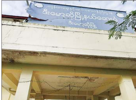
အကြမ်းဖက်သောင်းကျန်းသူများက ဒီးမော့ဆိုမြို့ရှိ မြို့နယ်ပြည်သူ့ဆေးရုံအား ဖျက်ဆီးခဲ့မှုကို တွေ့ရစဉ်။

လုပ်ဆောင်ခဲ့သဖြင့် လုံခြုံရေး တပ်ဖွဲ့ဝင်များနှင့် ထိတွေ့တိုက်ပွဲ များ ဖြစ်ပွားခဲ့ပြီး ရိုးသားစွာ အသက်မွေးဝမ်းကျောင်း လုပ်ကိုင် ဆောင်ရွက်နေကြသည့် ဒေသခံ တိုင်းရင်းသား ပြည်သူများ၊ ကျောင်းသား ကျောင်းသူများ၊ ကလေးသူငယ်များနှင့် သက်ကြီး ရွယ်အိုများသည် ၎င်းတို့ပိုင်ဆိုင် သည့် နေအိမ်အဆောက်အအုံများ နှင့် ဥစ္စာပစ္စည်းများကို စွန့်ခွာ၍ ဘေးလွတ်ကင်းရာ မြို့ ရွာများသို့ ယာယီနေရပ်စွန့်ခွာ သွားရောက် နေထိုင်ခဲ့ကြရသဖြင့် လူ့အခွင့် အရေးများ၊ လူမှုစီးပွားဘဝများ များစွာနိမ့်ကျခဲ့ရသည်။