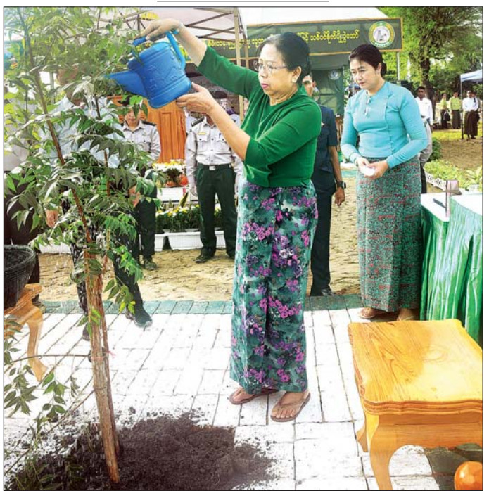
နိုင်ငံတော်လုံခြုံရေးနှင့် အေးချမ်းသာယာရေးကော်မရှင်ဥက္ကဋ္ဌ ဗိုလ်ချုပ်မှူးကြီး မင်းအောင်လှိုင်၏စီနီ ဒေါ်ကြူကြူလှ တမာပင်ကို ဦးဆောင်စိုက်ပျိုးစေစဉ်။

ယခုဒေသတွင် လျှပ်စစ်ဓာတ်အားရရှိမှုနည်းပါး ခြင်းကြောင့် ချက်ပြုတ်ခြင်းများ အတွက်လိုအပ်သည့် ထင်းများကို ခုတ်ယူသုံးစွဲကြကြောင်း၊ မိမိတာဝန်ယူ ဆောင်ရွက်ချိန်တွင် ရွာတစ်ရွာတွင် ထင်းစိုက်ခင်း ၂ ဧကစီ စိုက်ပျိုးရန်အတွက် တိုက်တွန်းပြောကြား တားကြောင်း၊ မင်းဘူးခရိုင်အတွင်း ၅ မြို့နယ်၌ ကျေးရွာပေါင်း ၉၆၃ ရွာရှိကြောင်း၊ တစ်ရွာကို ၂ ဧက နှုန်းဖြင့် စိုက်ပျိုးသွားမည်ဆိုပါက ၈၅၀၀ နီးပါး စိုက်ပျိုးနိုင်မည်ဖြစ်ကြောင်း၊ တစ်နှစ်လျှင်တစ်ခါ ထပ်မံစိုက်ပျိုးသွားမည်ဆိုပါက သစ်တောသစ်ပင် များ များစွာပေါက်ရောက်နိုင်မည်ဖြစ်ပြီး ပတ်ဝန်းကျင် စိမ်းလန်းစိုပြည်ရေးကို များစွာအထောက်အကူပြုနိုင်