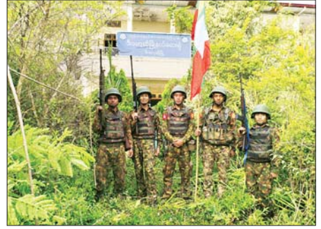
အကြမ်းဖက်သောင်းကျန်းသူများ ယာယီထိန်းချုပ်ထားသည့် ဒီးမော့ဆိုမြို့အား တပ်မတော်က အပြည့်အဝ ပြန်လည်ထိန်းချုပ်ရရှိစဉ်။

◆ ကျောမိုးမှ အဖျက်အမှောင် လုပ်ငန်းများ လုပ်ဆောင်ခဲ့ပြီး ၂၀၂၃ ခုနှစ် နိုဝင်ဘာလတွင်လည်း စစ်ရေး ပစ်မှတ်မဟုတ်သည့် လှိုင်ကော် တက္ကသိုလ်အား လက်နက်ကြီး များ အကူအညီဖြင့် တပ်မတော် စစ်ကြောင်းများ၏ အလစ်အငိုက် ရယူ၍ ဝင်ရောက်ပစ်ခတ်ခြင်း၊ ဆရာ ဆရာမများအား ဖမ်းဆီး ခေါ်ဆောင်ခြင်းများ ဆောင်ရွက် ခဲ့ပြီး တစ်ဆင့်ပြီးတစ်ဆင့် လှိုင်ကော်မြို့သိမ်းတိုက်ပွဲအား စတင်ဆောင်ရွက်ခဲ့သဖြင့် မြို့ လုံခြုံရေးတပ်ဖွဲ့ဝင်များ၊ နယ်မြေခံ တပ်မတော် စစ်ကြောင်းများက လှိုင်ကော်မြို့ အကြမ်းဖက် သောင်းကျန်းသူများလက်အောက် မကျရောက်စေရေး ဒေသခံ ပြည်သူများနှင့်အတူ ပူးပေါင်း၍ အပြင်းအထန် ခုခံတိုက်ခိုက်ခဲ့ သဖြင့် အကြမ်းဖက်သောင်းကျန်း သူများသည် လှိုင်ကော်မြို့အား သိမ်းပိုက်နိုင်ခြင်းမရှိဘဲ ထိခိုက် ကျဆုံးကျားစွာဖြင့် ဖမ်းဆီးရခက်ခဲစွာ ထွက်ပြေးသွားခဲ့သည်။