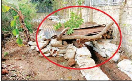
အကြမ်းဖက်သောင်းကျန်းသူများက လူနေအဆောက်အအုံများအတွင်း ဘန်ကာများ၊ ဗုံးခိုကြွင်းများ ပြုလုပ်ထားမှုကို တွေ့ရစဉ်။

ထို့ကြောင့် တပ်မတော် စစ်ကြောင်းများအနေဖြင့် အဆိုပါ မြို့နယ်အတွင်း ယာယီနေရပ် စွန့်ခွာ ဒေသခံတိုင်းရင်းသား ပြည်သူများအား ၎င်းတို့၏ မြို့/ ရွာများရှိ နေအိမ်များတွင် ပြန်လည်နေထိုင်နိုင်ရေး၊ အေးချမ်း ဖျော်ရွှင်စွာ လူမှုစီးပွားဘဝ ရှာဖွေ လုပ်ကိုင် စားသောက်နိုင်ရေး၊ အစိုးရအုပ်ချုပ်မှုယန္တရား ပြန်လည် လည်ပတ်နိုင်ရေးအတွက် အဆိုပါ အကြမ်းဖက်သမားများ ထိန်းချုပ် ထားသည့် ဒီးမော့ဆိုဒေသ တစ်ဝိုက်နှင့် ဒီးမော့ဆိုမြို့အား ပြန်လည်ထိန်းချုပ်နိုင်ရေးအတွက် တပ်မတော်စစ်ကြောင်းများက ၂၀၂၅ ခုနှစ် ဩဂုတ် ၄ ရက်မှစ၍ ဒီးမော့ဆိုမြို့၏ မြောက်ဘက် ခြမ်းရွှေယောက်ရပ်ကွက်အတွင်း ရှိ တောင်ငူလမ်းဆုံနှင့် အရှေ့ တောင်ဘက် ပါဒေါ့ကျေးရွာ တို့မှစ၍ လက်နက်ကြီး ပစ်ကူများ ဖြင့် စနစ်တကျ အဆင့်ဆင့် မြေကုတ်ယူခဲ့ပြီး ၎င်းမှတစ်ဆင့် အကြမ်းဖက်သမားများ ခံစစ် ပြုလုပ်ထားသည့် မြို့တွင်းရှိ မြေပေါ် မြေအောက်ဘန်ကာများ၊ အထပ်မြင့် အဆောက်အအုံများ အပါအဝင် စာသင်ကျောင်း၊ မြို့နယ်အထွေထွေ အုပ်ချုပ်ရေး များရုံး၊ မြန်မာ့နိုင်ငံမီးသတ်တပ်ဖွဲ့ နေရာ၊ ချက်ကျောင်းနှင့် ဆေးရုံ နေရာတို့အား ခက်ခက်ခဲခဲဖြင့် စွန့်လွှတ်စွန့်စားစွာ အချိန်ယူ ရှင်းလင်းတိုက်ခိုက်ခဲ့ရာ ဩဂုတ် ၇ ရက်တွင် ဒီးမော့ဆိုမြို့၏ အရှေ့ တောင်ဘက်ရှိ ပါဒေါ့ကျေးရွာနှင့် ရှုဖယ်ရပ်ကွက်အား လည်း ကောင်း၊ ဩဂုတ် ၁၂ ရက်တွင်