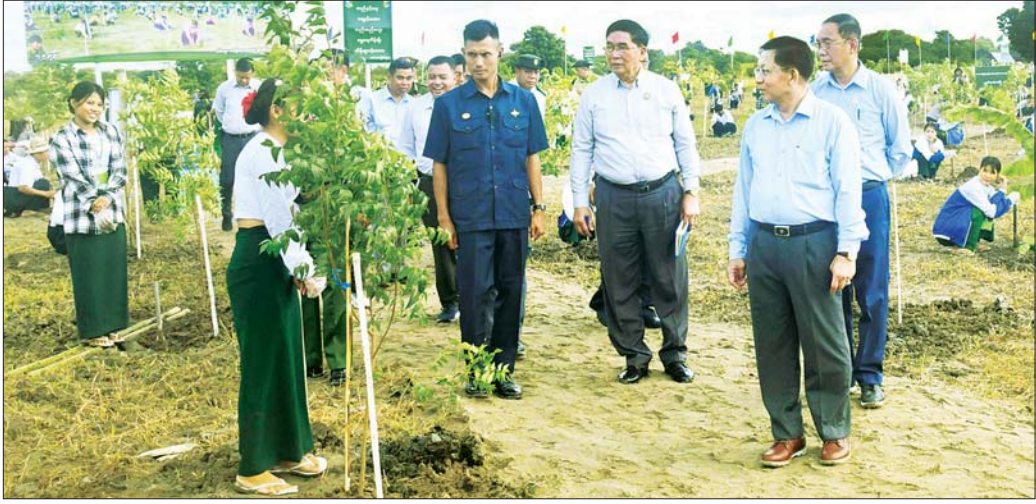
နိုင်ငံတော်လုံခြုံရေးနှင့် အေးချမ်းသာယာရေးကော်မရှင်ဥက္ကဋ္ဌ ဗိုလ်ချုပ်မှူးကြီး မင်းအောင်လှိုင် ၂၀၂၅ ခုနှစ် မိုးရာသီလူထုလုပ်ငန်းအသွင်ဖြင့် ပြုလုပ်သည့် ဒုတိယအကြိမ် သစ်ပင်စိုက်ပျိုးပွဲ တက်ရောက်လာကြသူများအား ရင်းရင်းနှီးနှီးနှုတ်ဆက်စဉ်။

စာမျက်နှာ ၃ မှ သစ်ပင်များစိုက်ပျိုးရာတွင် တစ်ပင်စိုက် တစ်ပင်ရှင် ဖြစ်အောင် ဆောင်ရွက်သွားကြရန် လိုကြောင်း၊ မိုးရာသီကာလအတွင်း ရှင်သန်ဖြစ်ထွန်းစေရေး စတင်စိုက်ပျိုးစဉ်ကာလ စနစ်တကျစိုက်ပျိုးရန်နှင့် သစ်တောသစ်ပင်များ ထိန်းသိမ်းကြည့်ရှုမှုများအနေ ဖြင့်လည်း သစ်ပင်များအဖြစ်တွယ် ရှင်သန်စေရန် အတွက် စနစ်တကျ ဆောင်ရွက်ပေးကြစေလိုကြောင်း၊ ယခုစိုက်ပျိုးခဲ့သည့်အကျိုးကို နောင်အနာဂတ် မျိုးဆက်သစ်များက ခံစားကြရမည်ဖြစ်ကြောင်း၊ မိမိတို့၏ အနာဂတ်မျိုးဆက်သစ်များအတွက် အမွေ ကောင်းများ ပေးအပ်ခဲ့ခြင်းပင်ဖြစ်ကြောင်း၊ ယနေ့ သစ်ပင်စိုက်ပျိုးပွဲ ကျင်းပခြင်းသည် မိမိတို့ဒေသ အတွက် ကောင်းမွန်သည့်မင်္ဂလာရှိသည့် အခမ်း အနားတစ်ခုဖြစ်သည့်အတွက် တက်ရောက်စိုက်ပျိုး ကြသူများအားလုံးကို ကျေးဇူးတင်ရှိကြောင်း ပြောကြားသည်။