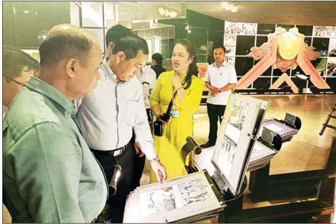
Tam Quang နှင့်လည်းကောင်း တွေ့ဆုံ၍ နှစ်နိုင်ငံနှင့် ဒေသတွင်း လုံခြုံရေးနှင့် တရားဥပဒေစိုးမိုးရေးဆိုင်ရာ ကိစ္စရပ်များကို ဆွေးနွေးခဲ့ကြသည်။ ညပိုင်းတွင် ဗီယက်နမ်နိုင်ငံ ပြည်သူ့လုံခြုံရေးဝန်ကြီးဌာန ဝန်ကြီး

နေပြည်တော် ဩဂုတ် ၁၉ ပြည်ထောင်စုဝန်ကြီးဌာန ပြည်ထောင်စုဝန်ကြီး ဒုတိယဗိုလ်ချုပ်ကြီး ထွန်းထွန်းနောင် ဦးဆောင်သော မြန်မာကိုယ်စားလှယ်အဖွဲ့သည် ဗီယက်နမ်နိုင်ငံ ပြည်သူ့လုံခြုံရေးဝန်ကြီးဌာန ဝန်ကြီး H.E. Gen. Luong Tam Quang ၏ ဖိတ်ကြားချက်အရ ဗီယက်နမ်နိုင်ငံ ဟနွိုင်းမြို့၌ ဩဂုတ် ၁၇ ရက်တွင် ကျင်းပသည့် နှစ်(၈၀) ပြည့် ပြည်သူ့လုံခြုံရေးတပ်ဖွဲ့နေ့ (The 80 th Anniversary of the Traditional Day of the Viet Nam People's Public Security) အခမ်းအနားသို့ တက်ရောက်ရန် ဩဂုတ် ၁၅ ရက်မှ ၁၈ ရက်အထိ ဗီယက်နမ်နိုင်ငံသို့ သွားရောက်ခဲ့သည်။