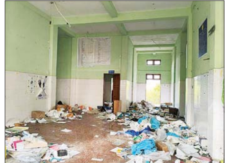
အကြမ်းဖက်သောင်းကျန်းသူများက ဒီးမော့ဆိုမြို့ရှိ မြို့နယ်ပြည်သူ့ဆေးရုံအား ဖျက်ဆီးခဲ့မှုကို တွေ့ရစဉ်။