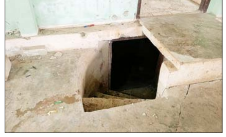
အကြမ်းဖက်သောင်းကျန်းသူများက လူနေအဆောက်အအုံများအတွင်း ဘန်ကာများ၊ ဗုံးခိုကြွင်းများ ပြုလုပ်ထားမှုကို တွေ့ရစဉ်။

ရွှေယောက်ရပ်ကွက် အတွင်းရှိ ဆီဆိုင်နေရာအားလည်းကောင်း၊ ဩဂုတ်၁၄ရက်တွင်အောင်မင်္ဂလာ ရပ်ကွက်အတွင်းရှိ မြို့နယ်ရဲစခန်း၊ မီးသတ်ဦးစီးဌာန၊ မြို့နယ်ပြည်သူ့ ဆေးရုံနှင့် မြို့နယ်အထွေထွေ အုပ်ချုပ်ရေးများရုံးအား လည်း ကောင်း၊ ဩဂုတ် ၁၅ ရက်တွင် ရွှေယောက်ရပ်ကွက် တစ်ခုလုံး နှင့် စည်ပင်သာယာရပ်ကွက်ရှိ မြို့နယ်ခန်းမ၊ မြို့မရပ်ကွက် အတွင်းရှိ ချက်ကျောင်းနေရာများ အားလည်းကောင်း၊ ယနေ့တွင် ဒီးမော့ဆိုမြို့ တစ်ခုလုံးအားလည်း ကောင်း တပ်မတော်စစ်ကြောင်း များက ပြန်လည်ထိန်းချုပ်နိုင်ခဲ့ သည်။ စစ်ဆင်ရေးကာလ ၁၆ ရက်အတွင်း အကြမ်းဖက်