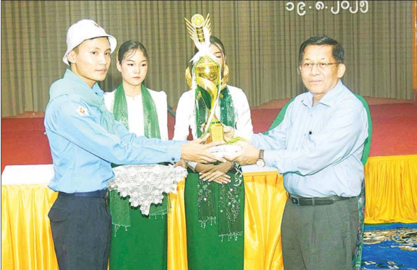
နိုင်ငံတော်လုံခြုံရေးနှင့် အေးချမ်းသာယာရေးကော်မရှင်ဥက္ကဋ္ဌ ဗိုလ်ချုပ်မှူးကြီး မင်းအောင်လှိုင် တက္ကသိုလ်ဝင်စာမေးပွဲတွင် သိပ္ပံဘာသာတွဲဖြင့် ဇာဘာသာဂုဏ်ထူးရရှိ မြန်မာတစ်နိုင်ငံလုံး ပထမ (The Whole Myanmar First) ရရှိခဲ့သည့် မောင်ကျေးသက်ကိုအား ဂုဏ်ပြုဆုနှင့် ဂုဏ်ပြုချီးမြှင့်ငွေ ပေးအပ်ချီးမြှင့်စဉ်။

ထို့နောက် နိုင်ငံတော်လုံခြုံရေးနှင့် အေးချမ်းသာယာရေးကော်မရှင်ဥက္ကဋ္ဌက တင်ပြချက်များတွင် မင်းဘူးကားသားတိုးချဲ့ပေးရေး၊ တက္ကသိုလ်ကောလိပ်များ