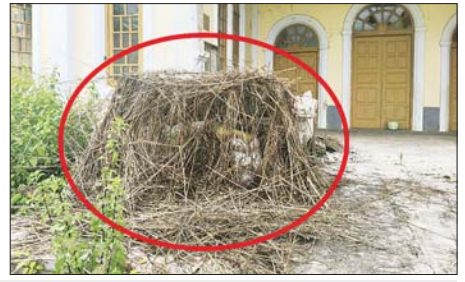
အကြမ်းဖက်သောင်းကျန်းသူများက ဒီးမော့ဆိုမြို့ရှိ ဘာသာရေးဆိုင်ရာ အဆောက်အအုံများအတွင်း ဘန်ကာများ ပြုလုပ်ထားမှုကို တွေ့ရစဉ်။

အဆိုပါ ဆုတ်ခွာထွက်ပြေး သွားခဲ့သည့် KNPI၊ KNDF အဖွဲ့ များနှင့် PDF အမည်ခံအကြမ်းဖက် သမားများသည် ဒီးမော့ဆိုမြို့နယ် အတွင်း ၂၀၂၃ ခုနှစ် နိုဝင်ဘာ လမှစ၍ ကျေးရွာသူ၊ ကျေးရွာသား များအသွင်ဖြင့် စိမ့်ဝင်ပုံဖျက် ဝင်ရောက်နေရာယူ၍ အစိုးရ၏ အုပ်ချုပ်မှုယန္တရား ပျက်ပြားစေ ရန်၊ ဒေသတည်ငြိမ်အေးချမ်း မှု ပျက်ပြားစေရန်အတွက် တပ်မတော်တပ်စခန်းများ၊ လုံခြုံ ရေးတပ်ဖွဲ့များ၏ တပ်ဌာနချုပ် များအား ဝင်ရောက်တိုက်ခိုက် ခြင်း၊ ကျေးရွာများအတွင်းရှိ နေအိမ်များအား မီးရှို့ဖျက်ဆီး ခြင်း၊ ပြည်သူများအား လက်နက် အားကိုးဖြင့် အနိုင်ကျင့်သတ်ဖြတ် ခြင်း၊ ဒေသခံတိုင်းရင်းသားများ ရိုင်းဆိုင်သည့် ပစ္စည်းများအား အတင်းအဓမ္မ လုယက်ယူဆောင် ခြင်း စသည့်အဖျက်အမှောင် လုပ်ငန်းများ လုပ်ဆောင်ခဲ့ပြီး ဒီးမော့ဆိုမြို့အတွင်းရှိ နေအိမ်များ၊ ဘာသာရေးအဆောက်အအုံများ တွင် အဆိုင်အစာ ခံစစ်ပြုလုပ်ကာ လှိုင်ကော်-ဒီးမော့ဆို-ဘောလခဲ ဆက်သွယ်ရေး လမ်းကြောင်း အား ဖြတ်တောက်ပိတ်ဆို့မှုများ