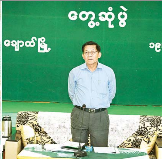
နိုင်ငံတော်လုံခြုံရေးနှင့်အေးချမ်းသာယာရေးကော်မရှင်ဥက္ကဋ္ဌ ဗိုလ်ချုပ်မှူးကြီး မင်းအောင်လှိုင် ချောက်မြို့ရှိ ဌာနဆိုင်ရာတာဝန်ရှိသူများ၊ မြို့မိမြို့ဖများနှင့်တွေ့ဆုံ၍ ဒေသဖွံ့ဖြိုးတိုးတက်ရေးဆိုင်ရာများ ဆွေးနွေးပြောကြားစဉ်။