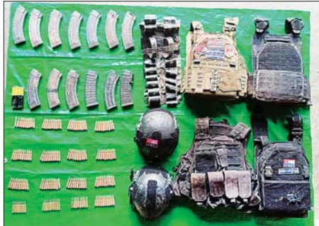
အကြမ်းဖက်သောင်းကျန်းသူများထံမှ သိမ်းဆည်းရရှိခဲ့သည့် လက်နက်/ခဲယမ်းနှင့် ဆက်စပ်ပစ္စည်းကို တွေ့ရစဉ်။

စာမျက်နှာ ၁၂ မှ ရက်တွင် မိုးမြို့အား ပြန်လည်ရမ်းပြည်နယ်(တောင်ပိုင်း)နှင့် ကယားပြည်နယ်အတွင်း အကြမ်းဖက် သောင်းကျန်းသူများ ထိန်းချုပ်/ပိတ်ဆို့ထားသည့် မြို့ရွာများ၊ ဆက်သွယ်ရေးလမ်းကြောင်းများအား တပ်မတော်က "ရန်နိုင်မင်း" စစ်ဆင်ရေးဖြင့် အကြမ်းဖက် ချေမှုန်းရေး စစ်ဆင်ရေးကို ဆောင်ရွက်ခဲ့ရာ ၂၀၂၄ ခုနှစ် မေ ၁၅ ရက်တွင် ဆီဆိုင်မြို့အား ပြန်လည်ထိန်းချုပ်နိုင်ခဲ့ပြီး ဟိုပုံး-ဆီဆိုင်-လွိုင်ကော် လမ်းကြောင်းအား မေ ၂၉ ရက်တွင်လည်းကောင်း၊ ၂၀၂၅ ခုနှစ် ဇူလိုင် ၆