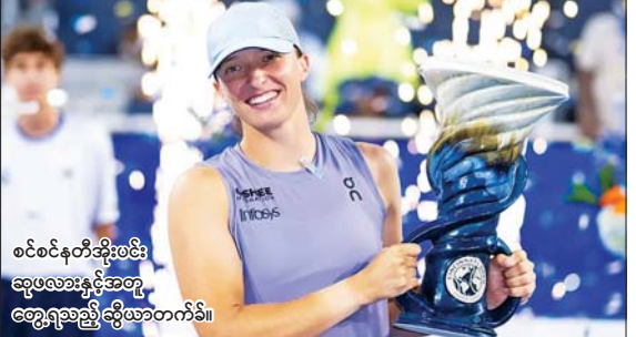
စင်စင်နတ်အိုးပင်း ချွေပလားနှင့်အတူ တွေ့ရသည့် ဆွီယာတက်ခိ။

(၁၃) ရှိ အမေရိကန်နာမည်ကျော်တင်းနစ် မယ် အမန်ဒါ အနီဆိုဗီဇာကို ၆-၀၊ ၆-၀ ရလဒ် ဖြင့် အနိုင်ယူကာ ဗိုလ်စွဲထားခဲ့ဖြစ်သည်။ ၎င်းသည် ယခုပြိုင်ပွဲတွင်လည်း နာမည် ကြီး တင်းနစ်မယ်များဖြစ်သည့် ကော့ စတစ်ခါ၊ ကာလင်းစ်ကာယာ၊ ရွှင်ဘာကီနာ၊ ပါအိုလီနိုတို့ကို အဆင့်ဆင့်ကျော်ဖြတ်ထား ပြီး စင်စင်နတ်အိုးပင်းဖလားကို ထိုက်ထိုက် တန်တန် ဆွတ်ခူးနိုင်ခဲ့ခြင်းဖြစ်သည်။ အောင်စော်