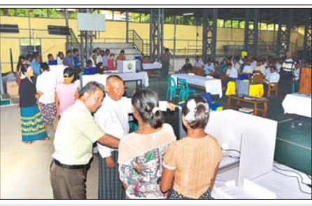
ရော့ဝတီတိုင်းဒေသကြီး မြန်အောင်မြို့နယ်၌ မဲပေးစက်ဆိုင်ရာ အသိပညာပေးခြင်းနှင့် လက်တွေ့စမ်းသပ်မဲပေးခြင်း အခမ်းအနားကို ဩဂုတ် ၁၈ ရက်တွင် ကျင်းပရာ မဲဆန္ဒရှင် ပြည်သူ ၁၀၇၅ ဦး လက်တွေ့စမ်းသပ်မဲပေးစဉ်။ ဝင်းဗိုလ်(ပြန်/ဆက်)

ဆက်လက်၍ လူငယ်စကားပိုင်းကို ကျင်းပရာ ကျောင်းသား ကျောင်းသူများက လူငယ်နှင့်အားကစား၊ လူငယ်နှင့်နည်းပညာ၊ လူငယ်နှင့်စာပေ၊ လူငယ်နှင့် ကျန်းမာရေး၊ လူငယ်နှင့် သဘာဝပတ်ဝန်းကျင် ခေါင်းစဉ်များဖြင့် ဆွေးနွေးခဲ့ကြသည်။ လူငယ်စကားပိုင်းသို့တက်ရောက်ခဲ့ကြသည့် ဆရာ ဆရာမများ၊ ကျောင်းသား ကျောင်းသူများက ပြန်ကြားရေးနှင့် ပြည်သူ့ဆက်ဆံရေး ဦးစီးဌာနက ပြုစုထားသော အသိပညာပေးနံရံကပ်၊ စာအုပ်စာစောင်များ အား လေ့လာကြည့်ရှုခဲ့ကြောင်း သိရသည်။ ဆောင်းနှင့်ဖြူ(ပြန်/ဆက်)