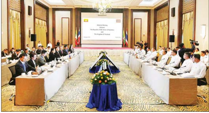
မြန်မာ-ထိုင်း နှစ်နိုင်ငံပူးတွဲ၍ ရေအရည်အသွေးစီမံခန့်ခွဲရေးဆိုင်ရာ ဆွေးနွေးပွဲကျင်းပစဉ်။