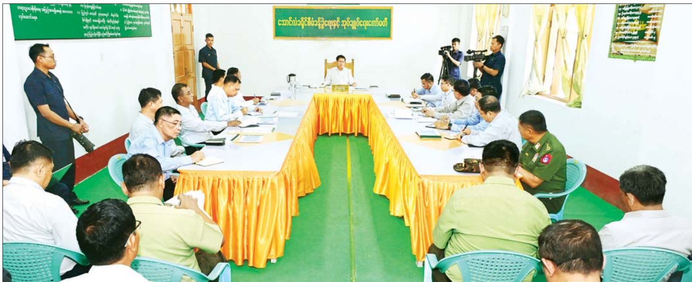
နိုင်ငံတော်လုံခြုံရေးနှင့် အေးချမ်းသာယာရေးကော်မရှင်ဥက္ကဋ္ဌ ဗိုလ်ချုပ်မှူးကြီး မင်းအောင်လှိုင် အောင်လံမြို့ရှိ ဌာနဆိုင်ရာတာဝန်ရှိသူများနှင့်တွေ့ဆုံ၍ ဒေသဖွံ့ဖြိုးတိုးတက်ရေးဆိုင်ရာများ ဆွေးနွေးမှာကြားစဉ်။

မြှင့်တင်ရေး။ ၃။ နိုင်ငံတော်စဉ်ဆက်မပြတ် ဖွံ့ဖြိုးတိုးတက်ခိုင်မာစေရေးအတွက် အမျိုးသားပညာရေးကဏ္ဍ၊ ကျန်းမာရေးကဏ္ဍတို့ကို အလေးထားမြှင့်တင်ရေး။ ၄။ ပါတီစုံဒီမိုကရေစီအထွေထွေရွေးကောက်ပွဲလုပ်ငန်းစဉ်များ အောင်မြင်ပြီး ပြည်သူလူထု တစ်ရပ်လုံး လိုလားတောင့်တသည့် ပါတီစုံဒီမိုကရေစီစနစ်ကို အောင်မြင်စွာလျှောက်လှမ်းနိုင်ရေး ပြည်သူလူထု၏ ပူးပေါင်းပါဝင်မှုဖြင့် အကောင်အထည်ဖော်ဆောင်ရွက်ရေး။