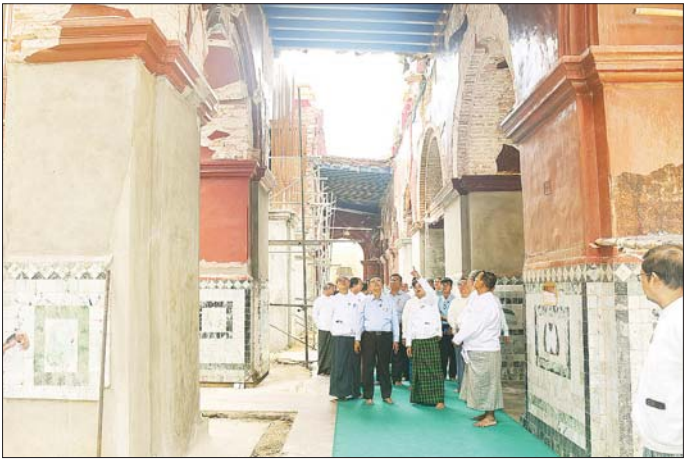
တော်များ အပူဇော်ခံထားရုံအခြေအနေကို ကြည့်ရှုဖူးမြော်သည်။ ယင်းနောက် မဟာမုနိဘုရားကြီး ပရိဝုဏ်အတွင်းရှိ အစည်းအဝေးခန်းမ၌ ဘုရားကြီးပရိဝုဏ်အတွင်းရှိ သာသနိကအဆောက်အအုံများ ပြန်လည်ပြုပြင်ထိန်းသိမ်းမှု ဆိုင်ရာကိစ္စရပ်များကို ဩဝါဒဆရာတော်များထံမှ

မန္တလေး၊ ဩဂုတ် ၂၀ သာသနာရေးနှင့်ယဉ်ကျေးမှုဝန်ကြီးဌာန ပြည်ထောင်စုဝန်ကြီး ဦးတင်ဦးလွင်သည် မန္တလေးတိုင်းဒေသကြီးဝန်ကြီးများ၊ အမြဲတမ်းအတွင်းဝန်နှင့်အတူ ယမန်နေ့ နံနက်ပိုင်းက ချမ်းမြသာစည်မြို့နယ် မဟာမုနိရုပ်ရှင်တော်မြတ်ကြီးသို့ ရောက်ရှိပြီး သောက်တော်ရေချမ်းနှင့်ပန်းများ ဆက်ကပ်၍ မဟာမုနိဘုရားကြီး ဘက်စုံပြုပြင် ဖွဲ့စည်းရေးအတွက် ပြည်ထောင်စုဝန်ကြီးနှင့် ခုနစ်ရက်သားသမီးများက လှူဒါန်းထားသော အလှူတော်ငွေနှင့် မဟာမုနိဘုရားကြီး ဌာပနာတော်အတွက် ဓာတ်တော်မွေတော်ကြပ်များ၊ ဆင်းတုတော်နှင့် ဓမ္မစေတီများကို ဂေါပကအဖွဲ့ထံ လှူဒါန်းသည်။