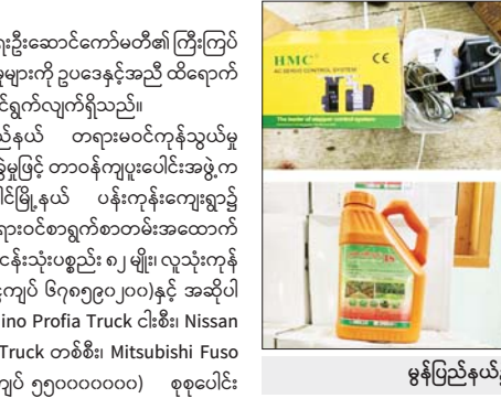
မွန်ပြည်နယ်၌ ဖမ်းဆီးရမိမှု။

နေပြည်တော် ဩဂုတ် ၂၀ တရားမဝင်ကုန်သွယ်မှုတိုက်ဖျက်ရေးဦးဆောင်ကော်မတီ၏ ကြီးကြပ်ကွပ်ကဲမှုဖြင့် တရားမဝင် ကုန်သွယ်မှုများကို ဥပဒေနှင့်အညီ ထိရောက်စွာ တားဆီးအရေးယူနိုင်ရေး ဆောင်ရွက်လျက်ရှိသည်။