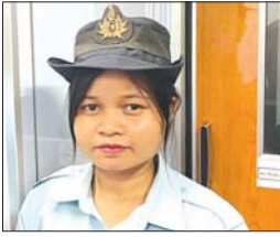
မအိန်သဲဝေ