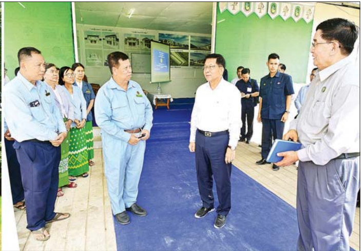
နိုင်ငံတော်လုံခြုံရေးနှင့် အေးချမ်းသာယာရေးကော်မရှင်ဥက္ကဋ္ဌ ဗိုလ်ချုပ်မှူးကြီး မင်းအောင်လှိုင်နှင့် အဖွဲ့ဝင်များ အောင်လံမြို့ အဝေးပြေးယာဉ်ရပ်နားစခန်း အဆင့်မြှင့်တင်တည်ဆောက်ထားရှိမှု အခြေအနေများကို ကြည့်ရှုစစ်ဆေးစဉ်။