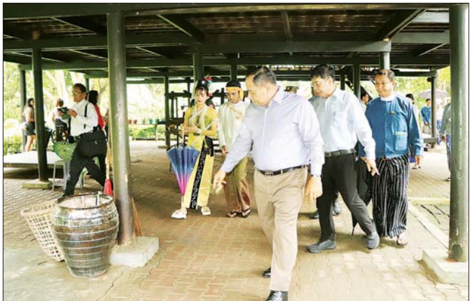
ရိုးရာအိမ်များ၊ နန်းမြင့်မျှော်စင်၊ ဆလုံပြခန်းနှင့် ထို့နောက် ပြည်ထောင်စုတိုင်းရင်းသားကျေးရွာ ဝန်ထမ်းအိမ်ရာများအတွင်း အသုံးပြုနိုင်ရန် Solar Panel ၅၈ လုံး ပေးအပ်ရာ ဒုတိယဗိုလ်ချုပ်ကြီးနှင့် တာဝန် ရှိသူများက လက်ခံရယူကြသည်။

ယင်းနောက် ဝန်ထမ်းများ၏ တင်ပြချက်များအပေါ် ပြည်ထောင်စုဝန်ကြီးက ပေါင်းစပ်ညှိနှိုင်းဆောင်ရွက်ပေးသည်။ ဆက်လက်၍ ပြည်ထောင်စုဝန်ကြီးသည် ပြည်ထောင်စုတိုင်းရင်းသားကျေးရွာ (ရန်ကုန်) ၏