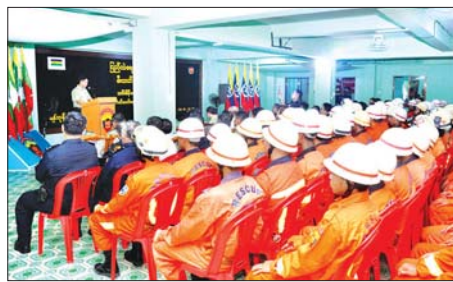
သင်တန်းကာလမှာ ၁၄ ရက် ကြာ သင်ကြားပို့ချမည်ဖြစ် ကြောင်း သိရသည်။