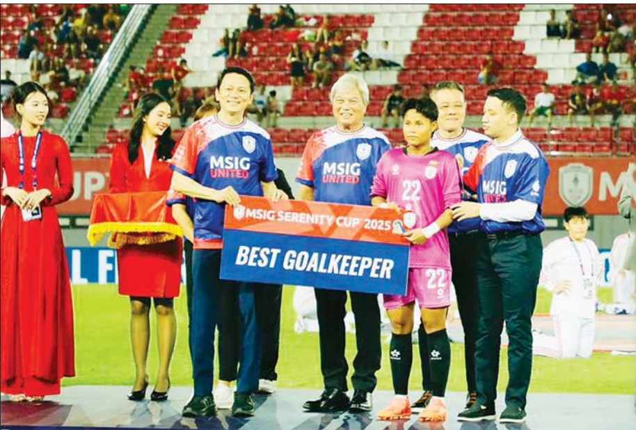
အကောင်းဆုံးဂိုးသမားဆုရ မျိုးမြမြခြမ်း ဆုလက်ခံရယူစဉ်။