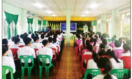
စိမ်းလှ(ပြန်/ဆက်)

နစ်နာကြေးတောင်းရမှုများ/ တရားစွဲဆိုဆောင်ရွက်ရသည့် အခြေအနေများ၊ လျှပ်စစ်ဓာတ်အားကို ချွေတာသုံးစွဲရမည့် နည်းလမ်းများနှင့် လျှပ်စစ်အန္တရာယ်ကင်းရေးစေရေး ဆောင်ရွက်/ ရှောင်ရန်များ ရှင်းလင်း ဆွေးနွေးသည်။ အဆိုပါဟောပြောပွဲသို့ မြို့နယ်စီမံခန့်ခွဲရေးနှင့် အုပ်ချုပ်ရေး ကော်မတီဝင်များနှင့် အဖွဲ့ဝင်များ၊ ဌာနဆိုင်ရာများ၊ ကျောင်းအုပ်ကြီးနှင့် ဆရာ ဆရာမများ၊ ကျောင်းသား ကျောင်းသူများ စုစုပေါင်း ၂၀၀ နှင့် တက်ရောက်ကြသည်။