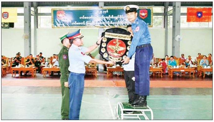
တံခွန်စိုက်ခိုင်းဆုနှင့် ဂုဏ်ပြု အဆိုပါ ပိုက်ကျော်ခြင်းပြိုင်ပွဲ အဆိုပါ ပိုက်ကျော်ခြင်းပြိုင်ပွဲ ကို တပ်မတော်(ကြည်း၊ ရေ၊ လေ) ယှဉ်ပြိုင်ကစားခဲ့ခြင်းဖြစ်ကြောင်း မှ ပြုလုပ်ပေးအပ်ခြင်း ၁၇ သင်းဖြင့် သတင်းရရှိသည်။ သတင်းစဉ်

နေပြည်တော် ဩဂုတ် ၂၀ များ၊ အရပ်ရှိ စစ်သည်၊ မိသားစုဝင် ၂၀၂၅ ခုနှစ် တပ်မတော်ကာကွယ်ရေးဦးစီးချုပ် တံခွန်စိုက်ခိုင်း တပ်မတော် (ကြည်း၊ ရေ၊ လေ) ကိုယ်စားပြုအသင်းက တံခွန်စိုက်ခိုင်းဆုရရှိကြောင်း သိရသည်။ ဦးစွာ တက်ရောက်လာကြသူ များက ကာကွယ်ရေးဦးစီးချုပ်ရုံး (ရေ) ကိုယ်စားပြုအသင်းနှင့် ကာကွယ်ရေးဦးစီးချုပ်ရုံး(ကြည်း) စခန်းမှူးရုံး ကိုယ်စားပြုအသင်း တို့၏ ဗိုလ်လုပွဲ ယှဉ်ပြိုင်ကစား မိတ္တီလာတပ်နယ်မှ တာဝန်ရှိသူ မှတို့ ကြည့်ရှုအားပေးကြသည်။ ထို့နောက် ဆုပေးပွဲကို ဆက်လက် ကျင်းပရာ ဖြိုင်ပွဲအမျိုးအစား အလိုက် တစ်ဦးချင်းဆုရရှိကြသူ များ၊ အသင်းလိုက်ဆုရရှိကြသူ များ၊ ခိုင်အဖွဲ့ဝင်များနှင့် တံခွန်စိုက်ခိုင်းဆုရရှိသော ကာကွယ်ရေးဦးစီးချုပ်ရုံး(ရေ) ကိုယ်စားပြု အသင်းအား တပ်မတော်ကာကွယ်ရေးဦးစီးချုပ်ကိုယ်စား အလယ်ပိုင်းတိုင်းစစ်ဌာနချုပ် မိတ္တီလာ တပ်နယ်မှ တာဝန်ရှိသူများက