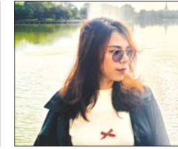
မဘာရင်ဇော်ဝင်း

DEMU စပိန်တွဲဆိုင်တွေကို ရန်ကုန်မြို့ပတ်လမ်းပိုင်းမှာဆိုရင် ၁၁ ဆိုင်မှာယူထားပါတယ်။ ရန်ကုန်-မန္တလေးလမ်းပိုင်းမှာ YM-1 CMC ကို ပထမအသုတ်အနေနဲ့ လေးဆိုင်မှာယူထားပါတယ်။ အဲဒီလေးဆိုင်ကတော့ ဂျပန်တွဲဆိုင်ဖြစ်ပါတယ်။ YM-2 ၁၅ ဆိုင်ကတော့ စပိန်တွဲဆိုင်ဖြစ်ပါတယ်။ ရန်ကုန်မြို့ပတ်မှာ ပြေးဆွဲနေတဲ့ ၁၁ ဆိုင်က ၂၀၂၃ ခုနှစ် ဖေဖော်ဝါရီ ၇ ရက်မှာ ရောက်ရှိပြီး ဖြစ်ပါတယ်။ ဂျပန်တွဲဆိုင် လေးဆိုင်က ၂၀၂၀ ပြည့်နှစ် စက်တင်ဘာ ၅ ရက်မှာ စတင်ရောက်ရှိပြီး ၂၀၂၂ ခုနှစ် စက်တင်ဘာ ၂၉ ရက်မှာ ငွေလုံးရန်ကုန်ဘူတာကို ရောက်ရှိခဲ့ပါတယ်။ ရန်ကုန်-မန္တလေးလမ်းပိုင်းမှာ ပြေးဆွဲယူ စပိန်တွဲဆိုင် YM-2 ၁၅ ဆိုင်မှာယူထားတဲ့အနက် ၁၄ ဆိုင် ရောက်ရှိနေပြီဖြစ်ပါတယ်။ မြန်မာ့မီးရထားအနေနဲ့ ၁၃ ဆိုင် လက်ခံထားပြီး တစ်ဆိုင်ကိုတော့ အရည်အသွေးစစ်ဆေးနေဆဲဖြစ်ပါတယ်။ DEMU ရထားတွဲဆိုင်ကို စက်မှုဌာနမှ စက်ခေါင်းမောင်းတွေက မောင်းနှင်ပါတယ်။ ဒီရထားတွေ မောင်းနှင်နိုင်ဖို့အတွက် စက်ခေါင်းမောင်းတွေကို JICA က စာတွေ့ လက်တွေ့ သင်တန်းပို့ချပေးပါတယ်။ DEMU ရထားတွဲဆိုင်တွေရဲ့ မောင်းနှင်စနစ်၊ ပြုပြင်ရေးတို့အတွက် စက်ခေါင်းမောင်းတွေအပြင် မြန်မာ့မီးရထားရဲ့ စက်ခေါင်းပြင်အဖွဲ့တွေကိုပါ သင်တန်းပို့ချပေးတာ ဖြစ်ပါတယ်။ တွဲထိန်း၊ ဂတ်ပိုလ်၊ သွားလာပို့ဆောင်ရေးက ဝန်ထမ်းတွေကိုပါ ပူးတွဲသင်တန်းပို့ချပါတယ်။ ရည်ရွယ်ချက်ကတော့ စက်ခေါင်းမောင်းနှင်မှု တစ်ခုတည်းမဟုတ်ဘဲ တံခါးအလိုအလျောက်ပိတ်တဲ့စနစ်၊ ဝန်ဆောင်မှုပေးတဲ့စနစ်တွေကိုပါ သင်တန်းပို့ချပေးပါတယ်။ မြန်မာ့မီးရထားရဲ့ ဝန်ထမ်းတိုင်းကို မွမ်းမံသင်တန်းတွေ ဆက်လက်ပို့ချ