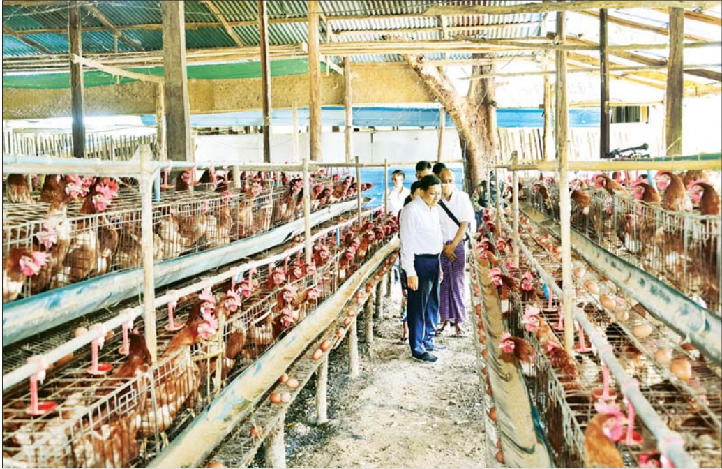
နိုင်ငံတော်လုံခြုံရေးနှင့် အေးချမ်းသာယာရေးကော်မရှင်ဥက္ကဋ္ဌ မိုလ်ချုပ်မျိုးကြီး မင်းအောင်လှိုင် အောင်လံမြို့ရှိ ရွှေတင်ဝမ်းမွေးမြူရေးဇုန်အတွင်း ဥစားကြက် များ မွေးမြူထားရှိမှုကို ကြည့်ရှုစစ်ဆေးစဉ်။

ဒေသတစ်ခုတိုးတက်ရေးအတွက် ဒေသတွင်း နေထိုင်ကြသူများတွင် တာဝန်ရှိပြီး ဒေသကို ဦးဆောင် အုပ်ချုပ်နေသူများတွင်လည်း တာဝန်ရှိကြောင်း၊ ထို့ကြောင့် မိမိတို့တာဝန်ထမ်းဆောင်နေသည့် ဒေသ အတွင်းခရိုင်၊ မြို့နယ်များအလိုက် ဖွံ့ဖြိုးတိုးတက်ရေး လုပ်ငန်းများကို တတ်နိုင်သမျှ အကောင်အထည်ဖော် ဆောင်ရွက်ပေးရမည်ဖြစ်ကြောင်း၊ နိုင်ငံတော်မှ ချမှတ်ပေးထားသည့် မူဝါဒများနှင့်အညီ ဒေသဖွံ့ဖြိုး တိုးတက်ရေးကို ဒေသအတွင်း တာဝန်ရှိသူများက