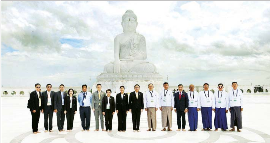
ထိုင်းနိုင်ငံဒုတိယဝန်ကြီးချုပ်၊ ဒစ်ဂျစ်တယ်စီးပွားရေးနှင့် လူမှုရေးဝန်ကြီးဌာနဝန်ကြီး Mr. Prasert Jantararungtong နှင့်အဖွဲ့၊ မာရဝိဇယ ဗုဒ္ဓရုပ်ပွားတော်မြတ်ကြီးအား ဖူးမြော်ကြည့်ညှိပြီး မှတ်တမ်းတင်ဓာတ်ပုံရိုက်စဉ်။

နေပြည်တော် ဩဂုတ် ၂၀ မြန်မာ-ထိုင်း နှစ်နိုင်ငံပူးတွဲ၍ ရေအရည်အသွေး စီမံခန့်ခွဲရေး နှင့် လေ့လာစောင့်ကြည့်နိုင်ရေး၊ နှစ်နိုင်ငံကြား ရေအရည်အသွေး ညစ်ညမ်းမှု ကာကွယ်ထိန်းချုပ် ရေးနှင့် ပူးပေါင်းဆောင်ရွက်မှုကို မြှင့်တင်ရန် ရည်ရွယ်၍ မြန်မာ- ထိုင်း နှစ်နိုင်ငံပူးတွဲ၍ ရေအရည် အသွေး စီမံခန့်ခွဲရေးဆိုင်ရာ ဆွေးနွေးပွဲကို ယနေ့နံနက်ပိုင်း တွင် နေပြည်တော်ရှိ Jasmine Hotel ၌ ကျင်းပသည်။