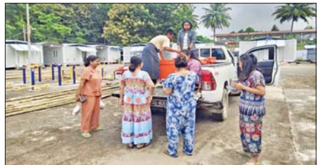
၅၀၀ အား သက်သာသောဈေးနှုန်းဖြင့် ရောင်းချပေးခဲ့ကြောင်း သိရသည်။

နေပြည်တော် ဩဂုတ် ၂၂ စိုက်ပျိုးရေး၊ မွေးမြူရေးနှင့် ဆည်မြောင်းဝန်ကြီးဌာန ငါးလုပ်ငန်းဦးစီးဌာနက ကမ်းဝေးငါးဖမ်းလုပ်ငန်းရှင်များအသင်းနှင့်ပူးပေါင်း၍ တိုင်းရင်းသား လူမျိုးများရေးရာဝန်ကြီးဌာန၊ စက်မှုဝန်ကြီးဌာန၊ သမဝါယမနှင့် ကျေးလက်ဖွံ့ဖြိုးရေးဝန်ကြီးဌာန၊ ပြည်ထောင်စုရာထူးဝန်အဖွဲ့၊ အားကစားနှင့်လူငယ်ရေးရာဝန်ကြီးဌာန၊ ပြန်ကြားရေးဝန်ကြီးဌာန၊ စိုက်ပျိုးရေး၊ မွေးမြူရေးနှင့် ဆည်မြောင်းဝန်ကြီးဌာနနှင့် နေပြည်တော် လေတပ်စခန်းဌာနချုပ်ရှိ ဝန်ထမ်းများနှင့် မိသားစုဝင်များ၊ ဝန်ထမ်းအိမ်ရာများနှင့် ပြည်သူများသို့ ရေငန်ငါး (ကဗျက်ခေါင်းကြီးငါး) များကို တစ်ဝိသာလျှင် ၆၀၀၀ ကျပ်နှုန်းဖြင့် ဩဂုတ် ၂၂ ရက်တွင် ငါးလုပ်ငန်းဦးစီးဌာနမှ အရာထမ်း၊ အမှုထမ်းများဖြင့် စုစုပေါင်းငါးပိသိန်းချိန်