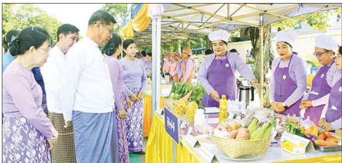
အထူးဆုရရှိသည့် အသင်းများကို ဂုဏ်ပြုဆုငွေများ ဆိုင်းဆိုခင်းဆားနှင့် အာဟာရဖြည့်စွက်စာများ ပေးအပ်နှင့် ကိုယ်ဝန်ဆောင်မိခင်များအတွက် ကြက်ဥ၊ ကြာသည်။ သတင်းစဉ်

စောင့်ရှောက်ရေးအသင်းများမှ ဥက္ကဋ္ဌများနှင့်အဖွဲ့ဝင်များ၊ ပြိုင်ပွဲဝင်အသင်းများ၊ အက်ပြတ်အမှတ်ပေးဆိုင်များနှင့် ဖိတ်ကြားထားသူများ တက်ရောက်ကြည့်ရှုအားပေးကြသည်။ အခမ်းအနားတွင် တိုင်းဒေသကြီးမိခင်နှင့်ကလေးစောင့်ရှောက်မှုကြီးကြပ်ရေးအဖွဲ့ ဥက္ကဋ္ဌနှင့် တိုင်းဒေသကြီးပြည်သူ့ကျန်းမာရေးနှင့် ကုသရေးဦးစီးဌာနမှ တာဝန်ရှိသူများက အာဟာရဖွံ့ဖြိုးရေးရက်သတ္တပတ်လှုပ်ရှားမှု တန်ဖိုးသင့်အာဟာရချက်ပြုတ်ပြိုင်ပွဲကျင်းပရခြင်းရည်ရွယ်ချက်နှင့် ပြိုင်ပွဲစည်းမျဉ်းစည်းကမ်းများကို ရှင်းလင်းပြောကြားကြသည်။ ထို့နောက် ဆုချီးမြှင့်ပွဲကျင်းပ၍ တိုင်းဒေသကြီးဝန်ကြီးချုပ်၏ ဇနီးနှင့်တာဝန်ရှိသူများက ပထမ၊ ဒုတိယနှင့် တတိယဆုရရှိသည့် အသင်းများနှင့်