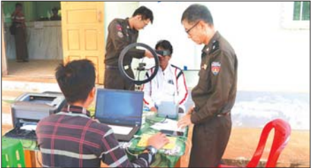
ကိုယ်ရေး အချက်အလက်များ ထည့်သွင်းခြင်းတို့ ပြုလုပ်ကာ UID နံပါတ်များ ထုတ်ပေးသွားမည် ဖြစ်သည်။ စိုင်းဝင်း(ပြန်/ဆက်)

ထိုသို့ဆောင်ရွက်ပေးရာတွင် လူဝင်မှုကြီးကြပ်ရေးနှင့် ပြည်သူ့အင်အားဝန်ကြီးဌာနက ထုတ်ပေးသော အငြိမ်းစားများ၏ အချက်အလက်များအား မြန်မာစီးပွားရေးဘဏ်၏ Program တွင် ထည့်သွင်းနိုင်မည်ဖြစ်သည့်အတွက် UID နံပါတ်ရရှိခြင်း မရှိသေးသူများကို ဆက်သွယ်ဆောင်ရွက်ပေးလျက် ရှိပြီး Biometric အချက်အလက်များ ကောက်ယူခြင်းနှင့် လိုအပ်သည့်