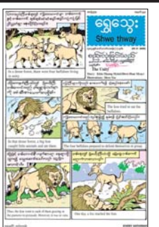
ခေါ်ခွဲမိသော သူငယ်ချင်းဖြစ်သူ အကြောင်းကို သရုပ်ဖော်ထားသည့် “ရိုးလွန်းတော့ အ” နှစ်မျက်နှာကာတွန်း၊ စိတ်ကောင်း

ရွှေသွေးဂျာနယ် ထွက်ရှိ နေပြည်တော် ဩဂုတ် ၂၂ ပြန်ကြားရေးဝန်ကြီးဌာန ပုံနှိပ်ရေးနှင့် ထုတ်ဝေရေးဦးစီးဌာန စာပေဗိမာန်ရုံးက အပတ်စဉ် စနေနေ့တိုင်း ရွှေသွေးဂျာနယ်ကို ထုတ်ဝေဖြန့်ချိလျက်ရှိသည်။ ၂၃-၈-၂၀၂၅ ရက်(စနေနေ့) တွင် ထွက်ရှိမည့် ရွှေသွေးဂျာနယ်အတွဲ (၅၅)၊ အမှတ် (၃၄) တွင် တစ်ကောင်နှင့်တစ်ကောင် သွေးစည်းညီညွတ်စွာ နေထိုင်လျက်ရှိ ရာမု မြေခွေး၏ သွေးခွဲမှုကြောင့်