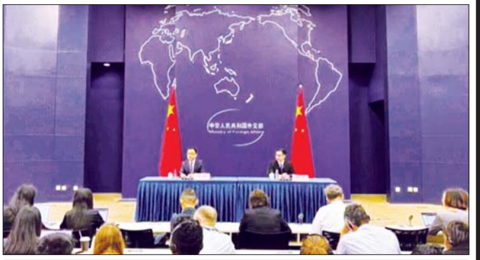
ပေကျင်းမြို့ နိုင်ငံခြားရေးဝန်ကြီးဌာနရုံး၌ နိုင်ငံတကာမီဒီယာတွေ့ဆုံပွဲ ကျင်းပစဉ်။ အကျင်းတွင် ဩစထရီးယားနိုင်ငံရောက်ရှိသည့် အဖွဲ့၊ မြန်မာနိုင်ငံသည် ၂၀၂၃ ခုနှစ်ကတည်းက SCO အစည်းအဝေး တာဝန်ထိပ်သီးအစည်းအဝေးကို နှင့်ဆွေးနွေးဖက်နိုင်အဖြစ် ပူးပေါင်းပါဝင်လျက်ရှိ တရုတ်ပြည်သူ့သမ္မတနိုင်ငံက အိမ်ရှင်အဖြစ် သည်။ လက်ခံကျင်းပခြင်းဖြစ်သည်။ ခင်ရတနာ

အဆိုပါအခမ်းအနားသို့တက်ရောက်ရန် ရုရှား၊ ယခုအခါ အဖွဲ့ဝင်ပေါင်း ၁၀ နိုင်ငံ၊ လေ့လာသူ ဘယ်လာရစ်၊ အိန္ဒိယ၊ အီရန်၊ မွန်ဂိုလီးယား၊ အစာ နှစ်နိုင်ငံနှင့် ဆွေးနွေးဖက် ၁၄ နိုင်ငံရှိလာခဲ့သည်။ တိုင်ဂျန်၊ ပါကစ္စတန်၊ တူဂိုက် အစရှိသည့်နိုင်ငံ အင်အားကြီးမားသည့် နိုင်ငံတကာ ပူးပေါင်း ပေါင်း ၂၀ ကျော်မှ နိုင်ငံခေါင်းဆောင်များအား ဆောင်ရွက်မှုအဖွဲ့အစည်းအဖြစ် ဒေသတွင်းနိုင်ငံ ဖိတ်ကြားထားသည့်အပြင် ကုလသမဂ္ဂ၊ အာဆီယံ များ၏ ကုန်သွယ်ရေး၊ စီးပွားရေး၊ သိပ္ပံနှင့် နည်းပညာ၊ နှင့် အခြားနိုင်ငံတကာအဖွဲ့အစည်းများမှ အကြီးအကဲ ယဉ်ကျေးမှုနှင့် ပညာရေး၊ စွမ်းအင်၊ လမ်းပန်း များကိုလည်း ဖိတ်ကြားထားပြီးဖြစ်သည်။ ဆက်သွယ်ရေးနှင့် ခရီးသွားလာရေး၊ ဘာသာ ဂုဏ်ထူးကျင့်ထိန်းသိမ်းရေးတို့အပြင် ဒေသတွင်း ပတ်ဝန်းကျင်ထိန်းသိမ်းရေးတို့အပြင် ဒေသတွင်း လုံခြုံရေးနှင့် တည်ငြိမ်အေးချမ်းရေးတို့ကိုပါ ဦးစား ပေးဆောင်ရွက်လျက်ရှိသည်။ ဝေဆောင်ရွက်လျက်ရှိသည်။ ဥပမာအားဖြင့် အိမ်ရှင်အဖြစ် သည့်သွင်းပြောကြားသည်။ ပူးပေါင်းပါဝင်မှုများကြောင့် ကမ္ဘာ့အခင်း