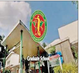
ဘွဲ့လွန်သင်တန်းကျောင်း၊ ဖိလစ်ပိုင်တက္ကသိုလ် (UPLB)။