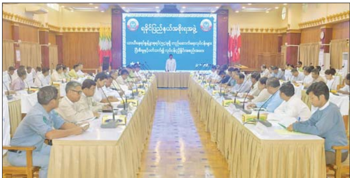
ကိုလည်းကောင်း၊ ပြည်နယ် ကိုလည်းကောင်း ဆွေးနွေးတင်ပြ များကို မှာကြားခဲ့ကြောင်း သိရ ဝန်ကြီးများနှင့် တာဝန်ရှိသူများက ကြရာ ပြည်နယ်ဝန်ကြီးချုပ်က သည်။ တင်ထွန်း(ပြန်/ဆက်) လုပ်ငန်းဆိုင်ရာ လိုအပ်ချက်များ လုပ်ငန်းပိုင်းဆိုင်ရာ လိုအပ်ချက်

ဝန်ကြီးချုပ်က မိမိတို့ပြည်နယ် အစိုးရအဖွဲ့အနေဖြင့် ယာယီနေရပ် စွန့်ခွာစုရပ်ရှိ တိုင်းရင်းသားများ၏ လိုအပ်ချက်များကို အစဉ်တစိုက် ပံ့ပိုးဆောင်ရွက်ပေးလျက်ရှိကြောင်း၊ လူမှုစီးပွားဖွံ့ဖြိုးတိုးတက်စေရန် အသက်မွေးဝမ်းကျောင်း ပညာ လိုအပ်ချက်စစ်တမ်းကောက်ယူ၍ အခြေခံစက်ချုပ်သင်တန်း၊ အဆင့် မြင့်တက်ချုပ်သင်တန်း၊ ရက်ကန်း သင်တန်းနှင့် ပန်းရန်သင်တန်းများ ဖွင့်လှစ်သင်ကြားပေးခဲ့ကြောင်း၊ ဒေသခံတိုင်းရင်းသားများအတွက် ခေတ္တနားခိုရာ၊ နေထိုင်ရာ အရိပ် တစ်ခုဆောင်ရွက်ပေးလိုက်ခြင်း