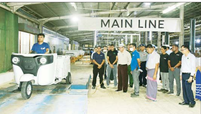
အမျိုးမျိုး ထုတ်လုပ်ဖြန့်ဖြူးရောင်းချနေသော KYAW-3 အလုပ်ရုံကို ကြည့်ရှုစစ်ဆေးပြီး ဒေသတွင်းစွန့်ပစ်ပလတ်စတစ်နှင့် ကော်ပစ္စည်းများကို ကုန်ကြမ်းအဖြစ် ပြန်လည်သန့်စင်အသုံးပြုနိုင်ရေး မှာကြားသည်။ ဘားအံစက်မှုဇုန်တွင် တည်ဆောက်ဆဲစက်ရုံအလုပ်ရုံ ၂၆ ရုံရှိပြီး စက်ရုံအလုပ်ရုံပေါင်း ၄၆ ရုံလုပ်ငန်း လည်ပတ်လျက်ရှိကာ ဒေသခံ တိုင်းရင်းသားပြည်သူ

ထုတ်လုပ်နိုင်ရေး မှာကြားသည်။ ထို့နောက် Precision Auto Engineering Co.,Ltd ၏ Bajaj အမှတ်တံဆိပ် သုံးဘီး လူစီးမော်တော်ယာဉ် တပ်ဆင်ထုတ်လုပ်သည့်စက်ရုံကို ကြည့်ရှုစစ်ဆေးရာ(ယာပုံ) တာဝန်ရှိသူများက အရည်အသွေး၊ ကုန်ကြမ်းရရှိမှု၊ လျှပ်စစ်မီးရရှိမှုနှင့် ထုတ်လုပ်မှု၊ After Sale Service ဆောင်ရွက်ထားရှိမှု၊ ဒေသတွင်းအလုပ်အကိုင်အခွင့်အလမ်း တိုးတက်ဖော်ဆောင်နိုင်ရေး EV SKD အကောင်အထည်ဖော် ဆောင်ရွက်နေမှု၊ အခမဲ့စက်ပြင်သင်တန်းများ ဖွင့်လှစ်နိုင်ရေး ဆောင်ရွက်နေမှုများကို ရှင်းလင်းတင်ပြကြပြီး ပြည်နယ်