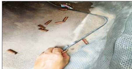
PDF အမည်ခံအကြမ်းဖက်သမားများ အသုံးပြုခဲ့သည့် ကျည်ခွဲများ တွေ့မြင်ရစဉ်။