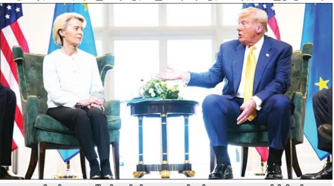
အမေရိကန်သမ္မတ ဒေါ်နယ်ထရပ်နှင့် ဥရောပ ကော်မရှင်ဥက္ကဋ္ဌ အာဆူလာ ဗွန်ဒါလီယန်။

နယူးယောက်၊ ဩဂုတ် ၂၂ ကုန်သွယ်ရေး သဘောတူညီမှု ဆိုင်ရာ သဘောတူညီမှုကိုရရှိပြီး အသစ် အကောင်အထည်ဖော်ရန် နောက် ယခုလိုမြင်လျှင်ထွက်ပေါ် ဥရောပနှင့် အမေရိကတို့ ခြေလှမ်း လှမ်းနေကြပြီ ဖြစ်ကြောင်း၊ အမေရိကန်သမ္မတ ဒေါ်နယ်ထရပ် နှင့် ဥရောပကော်မရှင်ဥက္ကဋ္ဌ အာဆူလာ ဗွန်ဒါလီယန် တို့သည် ဩဂုတ် ၂၁ ရက်တွင် နှစ်ဖက် စလုံးမှ ပူးတွဲကြေညာချက် ထုတ်ပြန်ခဲ့သည်။ အဆိုပါထုတ်ပြန်