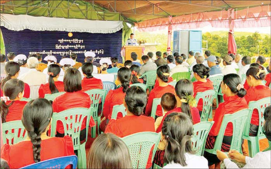
နောင်ချိုမြို့နယ် ညဏ်တောကျေးလက်ကျန်းမာရေးဌာနခွဲ စံကိုက်အဆောက်အအုံသစ် ဖွင့်ပွဲအခမ်းအနား ကျင်းပစဉ်။

နေပြည်တော်၊ ဩဂုတ် ၂၂ ၂၀၂၅ ခုနှစ် တက္ကသိုလ်ဝင်စာမေးပွဲအောင်မြင်သူများသည် တက္ကသိုလ်ဝင်ခွင့် လျှောက်ထားနိုင်ရန်အတွက် မိမိတို့စာမေးပွဲဖြေဆိုခဲ့သော စာစစ်ဌာနကြီးကြပ်ရေးမှူးများ (အခြေခံပညာအထက်တန်းကျောင်းအုပ်ကြီးများ)ထံတွင် အမှတ်စာရင်း၊ အရည်အချင်းမှတ်တမ်းချုပ် ရမှတ်အဆင့်၊ တက္ကသိုလ်ဝင်ခွင့် လမ်းညွှန်စာအုပ်နှင့် တက္ကသိုလ်ဝင်ခွင့်လျှောက်ထားရမည့်ပုံစံစာအိတ်ကို စက်တင်ဘာ ၂ ရက် (အင်္ဂါနေ့) မှစ၍ ကိုယ်တိုင်ထုတ်ယူကြရန်ဖြစ်သည်။ အဆိုပါတက္ကသိုလ်ဝင်ခွင့်လျှောက်လွှာအိတ်ကို စက်တင်ဘာ ၁၉ ရက် အထိ စနေနေ့၊ တနင်္ဂနွေနေ့နှင့် ရုံးပိတ်ရက်များ အပါအဝင် (ပိတ်ရက်မရှိ) စာမျက်နှာ ၃ ကော်လံ ၁ ၀