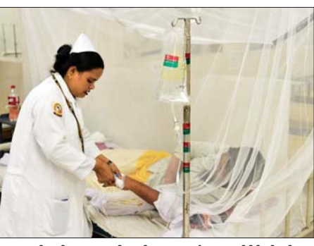
သွေးလွန်တုပ်ကွေးရောဂါသည် ဘင်္ဂလားဒေ့ရှ်နိုင်ငံ၌ ဇွန်လမှ အေဒီဒီဖြစ် ကိုက်ခံရခြင်းမှ စက်တင်ဘာလအတွင်း မှတ်သုံ တစ်ဆင့် ကူးစက်သည့် ဝိုင်းရပ်စ် ရောဂါတစ်ခုဖြစ်ကြောင်း သိရ ရောဂါဖြစ်ပွားသည့် ရာသီဖြစ် ကြောင်း သိရသည်။ ဆင်ဟွာ

ဒါကာ၊ ဩဂုတ် ၂၂ ဘင်္ဂလားဒေ့ရှ်နိုင်ငံ၌ ဩဂုတ် ၂၁ ရက်က သွေးလွန်တုပ်ကွေးရောဂါ ကြောင့် သေဆုံးသူ ငါးဦးရှိရာ ယခုနှစ်အတွင်း တစ်ရက်တည်း တွင် သေဆုံးသူ အမြင့်ဆုံးစံချိန်တင် ခဲ့ကြောင်း၊ ယင်းရောဂါကြောင့် သေဆုံးသူပေါင်း ၁၁၀ ရှိလာ ကြောင်း နိုင်ငံ၏ ကျန်းမာရေး ဝန်ဆောင်မှုဆိုင်ရာ ညွှန်ကြားရေး မှူးချုပ်ရုံး(ဒီဂျစ်အိတ်ချ် အက်စ်)က ပြောကြားသည်။ ဩဂုတ် ၂၁ ရက် ဒေသစံတော် ချိန် နံနက် ၈ နာရီအထိ လွန်ခဲ့ သည့် ၂၄ နာရီအတွင်း သွေးလွန် တုပ်ကွေးရောဂါ ကူးစက်ဖြစ်ပွား သူသည် ၃၁၀ ဦးရှိပြီး ယခုနှစ်