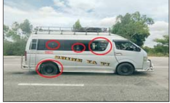
PDF အမည်ခံအကြမ်းဖက်သမားများ အကြောင်းမိုင်းဝန်းပစ်ခတ်တိုက်ခိုက်မှုကြောင့် လက်နက်ငယ်ကျည်ထိမှန်ခဲ့သည့် ခရီးသည်တင်မော်တော်ယာဉ်အား တွေ့ရစဉ်။