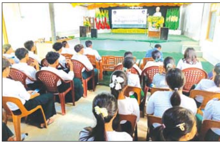
ဒဂုံမြို့သစ်(အရှေ့ပိုင်း)မြို့နယ်၌ လျှပ်စစ်အန္တရာယ်ကင်းရှင်းရေး အသိပညာပေး

ထို့နောက် အားကစားနှင့် ကာယပညာဦးစီးဌာနနှင့်စနစ်မျိုး ဦးတင်ထွဋ်က ကျန်းမာကြံ့ခိုင်မှ စာကြိုးစား၍ ရမည်ဖြစ်ကြောင်း၊ အားကစားတစ်ခုခု ပြုလုပ်ကြရန် တိုက်တွန်းပြောကြားပြီး စားသုံး သူရေးရာဦးစီးဌာန မြို့နယ်တာဝန်ခံ ဦးတင်ကိုက ကုန်စည်များနှင့် စပ်လျဉ်း၍ ရှေးဦးစွာ အသုံးပြုရာတွင် သတိပြုရမည့် ကုန်ညွှန်း အမှတ်အသား ဖော်ပြခြင်းကို ရှင်းလင်းပြောကြားခဲ့သည်။