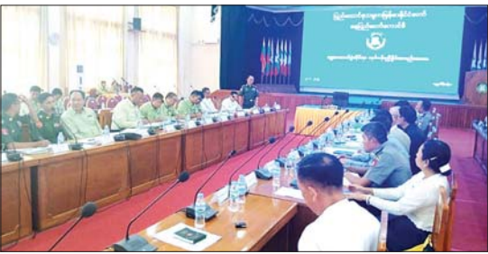
ပါဝင်ဆောင်ရွက်မည့် အစီအမံများကို ဆွေးနွေးချက်များအပေါ် ပြန်လည် ရှင်းလင်းဆွေးနွေးတင်ပြကြရာ နေပြည် ဆွေးနွေးပြောကြားခဲ့သည်။ မြို့နယ်(ပြန်/ဆက်)

နေပြည်တော် ။ ရွေးကောက်ပွဲဆိုင်ရာ အသိပညာပေး ဆွေးနွေးခြင်းကို ယနေ့ ဖွဲ့စည်းလှုပ်ရှားက ဖွဲ့စည်းလှုပ်ရှားက ပြည်ထောင်စုနယ်မြေ နေပြည်တော် နေပြည်တော်ကောင်စီရုံး၊ ဧပြီလဆန်းမင်း နေပြည်တော်ကောင်စီဝင် ဝင်များ၊ နေပြည်တော်ရွေးကောက်ပွဲ ကော်မရှင်အဖွဲ့ခွဲဥက္ကဋ္ဌနှင့် တာဝန်ရှိသူများ၊ ခရိုင်/မြို့နယ် ရွေးကောက်ပွဲကော်မရှင် အဖွဲ့ခွဲဥက္ကဋ္ဌများ တက်ရောက်ကြသည်။ ဆွေးနွေးပွဲတွင် နေပြည်တော် ကောင်စီဝင်က ရွေးကောက်ပွဲအောင်မြင် စွာ ကျင်းပနိုင်ရေး ပြည်ထောင်စု ရွေးကောက်ပွဲကော်မရှင်ဥပဒေ၊ နိုင်ငံရေး ဝါတ်များ ဖုတ်ပုံတင်ခြင်းဥပဒေ၊ နည်းဥပဒေ နှင့်အညီ ဆောင်ရွက်ကြစေလိုကြောင်း ဆွေးနွေးပြောကြားသည်။ ထို့နောက် နေပြည်တော်ကောင်စီဝင် က ရွေးကောက်ပွဲဆိုင်ရာကိစ္စများ ဆောင် ရွက်ထားရှိမှုနှင့် တက်ရောက်လာကြသူ များက ရွေးကောက်ပွဲ အောင်မြင်စွာ ကျင်းပနိုင်ရေး ဆောင်ရွက်ထားရှိမှုနှင့် ဆက်လက်ဆောင်ရွက်မည့် အစီအမံ များကို ရှင်းလင်းဆွေးနွေးကြသည်။ ယင်းနောက် ခရိုင်/ မြို့နယ် ရွေးကောက်ပွဲကော်မရှင်အဖွဲ့ ဥက္ကဋ္ဌ၊ စီမံခန့်ခွဲရေးနှင့် အုပ်ချုပ်ရေးကော်မတီ ဥက္ကဋ္ဌများ၊ တာဝန်ရှိသူများက ရွေးကောက် ပွဲ အောင်မြင်စွာကျင်းပနိုင်ရေး ဆောင် ရွက်ထားရှိမှု၊ ယခင် ရွေးကောက်ပွဲဆိုင်ရာ အတွေ့အကြုံများ၊ လုံခြုံရေးဆိုင်ရာနှင့် လာမည့် ရွေးကောက်ပွဲတွင် ပူးပေါင်း