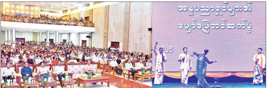
ပြန်ကြားရေးဝန်ကြီးဌာန ပြည်ထောင်စုဝန်ကြီး ဦးမောင်မောင်အုန်းနှင့် တာဝန်ရှိသူများ၊ ဒေသပြည်သူများ၊ အနုပညာရှင်များနှင့် ဒေသတိုင်းရင်းသားများ၏ ဖျော်ဖြေတင်ဆက်မှုများကို ကြည့်ရှုအားပေးစဉ်။

ယင်းနောက် ပြည်ထောင်စုဝန်ကြီးက ကယားပြည်နယ် အစိုးရအဖွဲ့အတွက် MRTV DTH စလောင်းစက်အစုံ ၃၀ နှင့် MRTV, T-2 Set Top Box ၈၀ အား ပြည်နယ်ဝန်ကြီးချုပ်ထံသို့လည်းကောင်း၊ တပ်နယ်အတွက် MRTV DTH စလောင်းစက်အစုံ ၂၀ နှင့် MRTV, T-2 Set Top