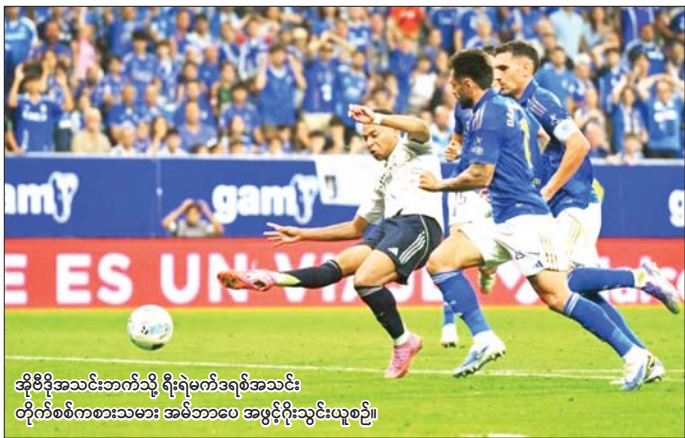
အိုဗီဒိုအသင်းဘက်သို့ ရိုးရဲမက်ဒရစ်အသင်း တိုက်စစ်ကစားသမား အမ်ဘာပေ အဖွင့်ဂိုးသွင်းယူစဉ်။

အိုဗီဒိုအသင်းသည် ပုံမှန်ခြေစွမ်းပြသနိုင်ခြင်း မရှိဘဲ နာမည်ကြီး ရိုးရဲမက်ဒရစ်အသင်း၏ ထိုးဖောက် တိုက်စစ်ဆင်မှုများကိုသာ ပွဲချိန်တစ်လျှောက် ခုခံကာကွယ်ခဲ့ရသည်။ အိုဗီဒိုအသင်းသည် လာလီဂါ အဖွင့်ပွဲစဉ်တွင်လည်း ပြိုင်ဘက်ဗီလာရီးယွစ်အသင်းကို နှစ်ဂိုးပြတ် ရှုံးနိမ့်ထားသောကြောင့် လာလီဂါနစ်ပွဲ ကစားပြီးချိန်တွင် နှစ်ပွဲစလုံး ရှုံးနိမ့်ထားသည့်အတွက် ရမှတ်ရရှိထားခြင်း မရှိသေးပေ။ အိုဗီဒိုအသင်း၏ တုံ့ပြန်ကစားပုံကောင်းမွန်မှု ကြောင့် ရိုးရဲမက်ဒရစ်အသင်းသည် မိနစ် ၃၀ ကျော် အထိ စာမျက်နှာ ၂၀ ကော်လံ ၁ ၂