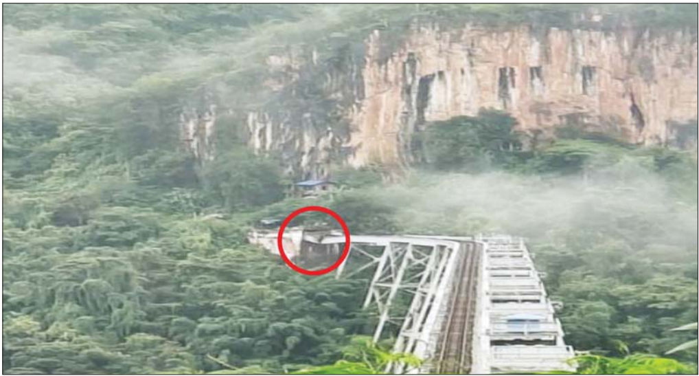
TNLA အကြမ်းဖက်သောင်းကျန်းသူများ မိုင်းထောင်ဖောက်ခွဲဖျက်ဆီးမှုကြောင့် ဂုတ်ထိပ်တံတား ထိခိုက်ပျက်စီးမှုအား တွေ့ရစဉ်။

အဲဒီအချိန် မြန်မာ့တပ်မတော်ရဲ့ အနေအထားကို ကြည့်ရင် နိုင်ငံတစ်ဝန်းနိုင်ငံရေးအရ အရေးပေါ်ကာလနိုင်ငံတာဝန်များစွာကိုခေါင်းတစ်လုံးနဲ့အိုးဆယ်လုံးရွက်နေရတဲ့ အနေအထားမျိုး ဖြစ်ပါတယ်။ ဒါကြောင့်မို့ မြေပြန့်မှာ လုံခြုံရေး၊ စစ်ရေးတာဝန်တွေ ထမ်းဆောင်နေကြရတဲ့ အဆင့်ဆင့်သော အရာရှိတွေ၊ အကြပ်စစ်သည်တွေ၊ တပ်ရင်းတပ်ဖွဲ့တွေ၊ ဌာနချုပ်တွေမှာ အကန့်အသတ်အမျိုးမျိုးနဲ့ ရင်ဆိုင်နေခဲ့ကြရပြီး တစ်ဖက်ရန်သူက အနှစ်နှစ်အလလ ဆင်ကြဲကြဲပြီး ကြိုတင်ပြင်ဆင်ပြောင်းလဲလာမှုအပေါ် နည်းပညာအရ အင်အားအရ အလျင်အမြန်တုံ့ပြန်နိုင်မှု အားနည်းခဲ့တာကို တွေ့ရပါတယ်။ ဒါကြောင့် အချို့ တပ်စခန်းတွေမှာ နယ်မြေတွေ၊ မြို့ရွာတွေကို ယာယီအားဖြင့် လက်လွှတ်ဆုတ်ခွာခဲ့ရပြီး ရန်သူက ဝင်ရောက်နေရာယူတာ၊ ထိန်းချုပ်တာတွေ ဖြစ်ပေါ်ခဲ့ပါတယ်။ ဒီနေရာမှာ ပြောချင်တာက တအာင်းတပ်လို့ဆိုတဲ့ TNLA ပါ။ သူ့ရဲ့ ပကတိအရိုအင်အားအရဆိုရင် အိမ်မက်တောင်မကိဖို့ ခဲသွင်းတဲ့အကျိုးအမြတ်တွေကို ၁၀၂၇ စစ်ဆင်ရေးအတွင်းမှာ TNLA တို့ ရခဲ့တာဖြစ်ပါတယ်။ ၁၀၂၇ စစ်ဆင်ရေး ဒုတိယလှိုင်းမှာ TNLA အကြမ်းဖက် သောင်းကျန်းသူအဖွဲ့ဟာ မန္တလေး PDF အပါအဝင် မြေပြန့်ကလေး