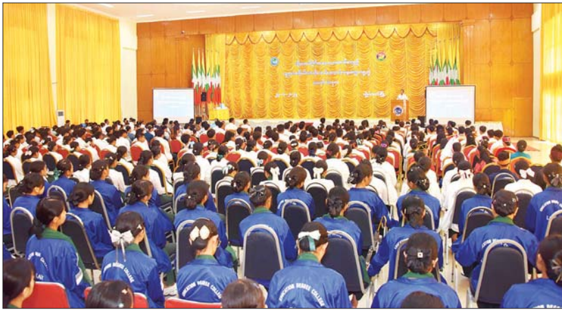
ပြည်ထောင်စုဝန်ကြီး ဦးမောင်မောင်အုန်း ကွန်ပျူတာတက္ကသိုလ်(လွိုင်ကော်)၌ ကျင်းပသည့် တိုးတက်ခိုင်မာအားကောင်းသည့် လူမှုအသိုက်အဝန်းဖော်ဆောင်ရေးဆွေးနွေးပွဲအခမ်းအနားတွင် အမှာစကားပြောကြားစဉ်။

လွိုင်ကော် ဩဂုတ် ၂၅ ပြန်ကြားရေးဝန်ကြီးဌာန ပြည်ထောင်စုဝန်ကြီး ဦးမောင်မောင်အုန်းသည် ကယားပြည်နယ်ဝန်ကြီးချုပ် ဦးဇော်မျိုးတင်နှင့်အတူ ယနေ့တွင် ကယားပြည်နယ် လွိုင်ကော်မြို့၌ တိုးတက်ခိုင်မာအားကောင်းသည့် လူမှုအသိုက်အဝန်းဖော်ဆောင်ရေးဆွေးနွေးပွဲနှင့် ပြည်သူများ အပန်းဖြေစေရန်၊ စိတ်ခွန်အားရရှိနိုင်ရန် အနုပညာရှင်များ၏ ဖျော်ဖြေပွဲများသို့ တက်ရောက်အားပေးပြီး လွိုင်ကော်မြို့ ပြန်လည်တည်ဆောက်ရေးနှင့် ဖွံ့ဖြိုးတိုးတက်ရေးဆောင်ရွက်ရေးများကို ကြည့်ရှုအားပေးသည်။ နံနက်ပိုင်းတွင် ပြည်ထောင်စုဝန်ကြီး၊ ပြည်နယ်ဝန်ကြီးချုပ်နှင့် တာဝန်ရှိသူများ လာရောက်ဖော်ပြကြသည့် အနုပညာရှင်များက လွိုင်ကော်မြို့ရှိ ကျောင်းထိုင်ဘုန်းကြီးသင်တန်းကျောင်း၌ ပြုလုပ်သော လွိုင်ကော်မြို့ပေါ်ရှိ ဘုန်းတော်ကြီးကျောင်းများမှ သံဃာတော်များအတွက် ဆွမ်း၊ ဆီနှင့် လှူဖွယ်ဝတ္ထုများလှူဒါန်းပွဲသို့ တက်ရောက်၍ ဆက်ကပ်လှူဒါန်းကြသည်။