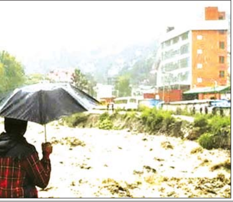
အိန္ဒိယနိုင်ငံ၌ သဘာဝဘေးအန္တရာယ်ကြောင့် စုစုပေါင်း ပျက်စီးဆုံးရှုံးမှုပမာဏမှာ အိန္ဒိယရူပီး ၂၇ ဒသမငှာ ၃၀၇ ဘီလီယံခန့်ကျော် (အမေရိကန်ဒေါ်လာ ၃၁၄ သန်းနီးပါး) ရှိကြောင်း သဘာဝဘေးအန္တရာယ် စီမံခန့်ခွဲမှုအာဏာပိုင်အဖွဲ့က ခန့်မှန်းထားသည်။ ဆင်ယွာ

ခြင်းနှင့် အခြားမိုးရွာသွန်းမှုနှင့် ဆက်စပ်သည့် မတော်တဆမှုများကြောင့် လူပေါင်း ၃၀၃ ဦးထက် မနည်းသေဆုံးကြောင်း နိုင်ငံ၏ သဘာဝဘေးအန္တရာယ်စီမံခန့်ခွဲမှု အာဏာပိုင်အဖွဲ့က ဩဂုတ် ၂၄ ရက် ထုတ်ပြန်ချက်တွင် ပြောကြားသည်။ ထုတ်ပြန်ချက်အရ ၅၀ ရက်မှစကာ မိုးသည်းထန်စွာရွာသွန်းမှုဖြစ်ပွားနေချိန် ယာဉ်မတော်တဆမှုများ ဖြစ်ပွားသဖြင့် လူ