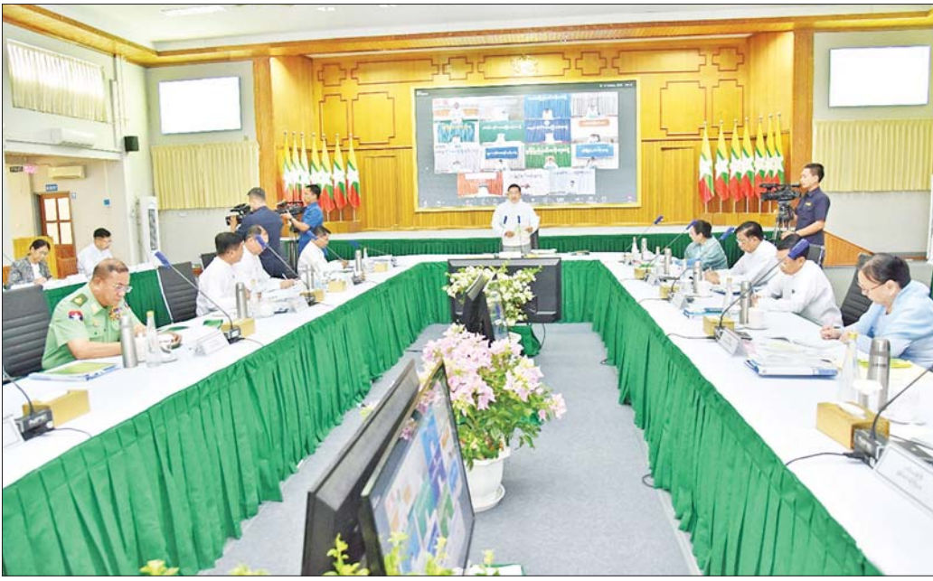
စိုက်ပျိုးရေးနှင့် မွေးမြူရေးဖွံ့ဖြိုးရေးကော်မရှင် ဥက္ကဋ္ဌ၊ နိုင်ငံတော်ဝန်ကြီးချုပ် ဦးညိုစော စိုက်ပျိုးရေးနှင့်မွေးမြူရေးဖွံ့ဖြိုးရေးကော်မရှင် (၄/၂၀၂၅) အစည်းအဝေးတွင် အမှာစကားပြောကြားစဉ်။

နေပြည်တော် ဩဂုတ် ၂၅ စိုက်ပျိုးရေးနှင့်မွေးမြူရေးဖွံ့ဖြိုးရေးကော်မရှင်၏ (၄/၂၀၂၅) အစည်းအဝေးကို ယနေ့နံနက်ပိုင်းတွင် နေပြည်တော်ရှိ စိုက်ပျိုးရေး၊ မွေးမြူရေးနှင့် ဆည်မြောင်းဝန်ကြီးဌာနရုံး အစည်းအဝေးခန်းမ၌ ကျင်းပရာ စိုက်ပျိုးရေးနှင့် မွေးမြူရေးဖွံ့ဖြိုးရေးကော်မရှင် ဥက္ကဋ္ဌ၊ နိုင်ငံတော်ဝန်ကြီးချုပ် ဦးညိုစော တက်ရောက် အမှာစကားပြောကြားသည်။ အစည်းအဝေးသို့ ပြည်ထောင်စုဝန်ကြီးများ၊ နေပြည်တော်ကောင်စီဥက္ကဋ္ဌ၊ ဒုတိယဝန်ကြီးများ၊ မြန်မာနိုင်ငံကုန်သည်များနှင့် စက်မှုလက်မှုလုပ်ငန်းရှင်များအသင်းချုပ် (UMFCCI) ဥက္ကဋ္ဌ၊ ဌာနဆိုင်ရာ တာဝန်ရှိသူများ တက်ရောက်ကြပြီး တိုင်းဒေသကြီးနှင့် ပြည်နယ်အစိုးရအဖွဲ့ဝန်ကြီးချုပ်များက ဗီဒီယိုကွန်ဖရင့်စနစ်ဖြင့် တက်ရောက်ကြသည်။ ဦးစွာ စိုက်ပျိုးရေးနှင့် မွေးမြူရေးဖွံ့ဖြိုးရေးကော်မရှင်ဥက္ကဋ္ဌ၊ နိုင်ငံတော်ဝန်ကြီးချုပ် ဦးညိုစောက အမှာစကားပြောကြားရာတွင် ယနေ့အစည်းအဝေးသည် စိုက်ပျိုးရေးနှင့် မွေးမြူရေးဖွံ့ဖြိုးရေးကော်မရှင်ကို ပြန်လည်ဖွဲ့စည်းပြီးနောက် ပထမဆုံး ခေါ်ယူသည့် အစည်းအဝေးဖြစ်ပြီး စိုက်ပျိုးရေးနှင့် မွေးမြူရေးကဏ္ဍသည် နိုင်ငံတော်၏ ဦးစားပေးကဏ္ဍ ဖြစ်သည့်အတွက် အရေးကြီးသည်ကို ပြောကြားလိုကြောင်း။ စာမျက်နှာ ၃ ကော်လံ ၁ နေ့