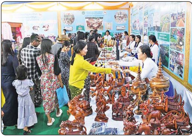
အသေးစား၊ အငယ်စားနှင့် အလတ်စားစီးပွားရေးလုပ်ငန်းများဖွင့်ပွားအခမ်းအနားကို နေပြည်တော်ကောင်စီ နယ်မြေ ခက်ထာသီရိမြို့နယ်၌ ၂၀၂၄ ခုနှစ် မေ ၁ ရက်မှ ၅ ရက်အထိ ကျင်းပစဉ်။

အသေးစိတ်လုပ်ဆောင်နိုင်သည့် နည်းလမ်းများမှာ- ၁။ စိုက်ပျိုးရေးဆိုင်ရာ MSME (Agri-based SMEs)များကို ဦးစားပေးဖွံ့ဖြိုးအောင် လုပ်ဆောင်ခြင်းကို ဆောင်ရွက်ရမည်ဖြစ်ပါသည်။ ဥပမာ- ခရမ်းချဉ်၊ ငရုတ်၊ ကြက်သွန်နီ၊ သစ်သီးဝလံများကို သီးနှံအခြောက်ခံခြင်း၊ ငါးပိ၊ ငါးခြောက်၊ သစ်သီးယိုများ၊ ရှမ်းခေါက်ဆွဲ၊ မြန်မာဆန်မှုန့်နှင့် ပြုလုပ်သော မုန့်မျိုးစုံကို ကျွန်းမာရေးနှင့်ညီညွတ်