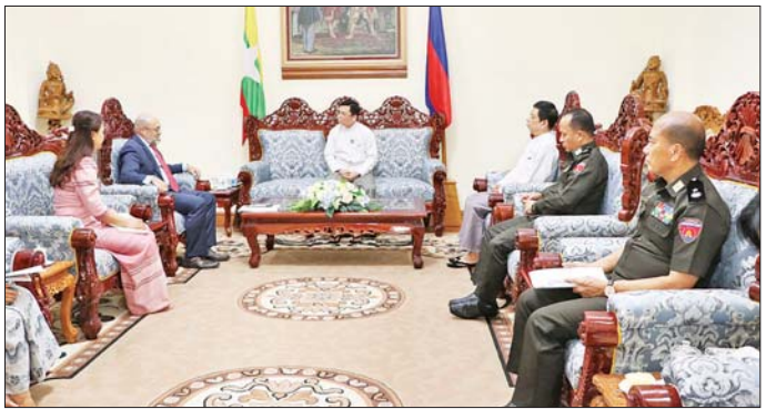
ကာလများအတွင်း ဝန်ကြီးဌာနနှင့် ဆက်လက် နှင့်စပ်လျဉ်း၍ ရင်းနှီးပွဲလင်းစွာ အမြင်ချင်းဖလှယ် ဆွေးနွေးခဲ့ကြကြောင်း သိရသည်။ သတင်းစဉ်

စာရင်းထုတ်ပြန်ပြီးစီးမှုနှင့် မကြာမီ ပြည်ထောင်စု အဆင့် ပင်မအစီရင်ခံစာထုတ်ပြန်နိုင်ရေး စီစဉ် ဆောင်ရွက်နေမှု၊ ဝန်ကြီးဌာနနှင့် UNFPA တို့အကြား ၂၀၁၄ ခုနှစ် ပြည်လုံးကျွတ်သန်းခေါင်စာရင်း ကောက်ယူခြင်းလုပ်ငန်းအပါအဝင် လူဦးရေဖွံ့ဖြိုး တိုးတက်မှုဆိုင်ရာလုပ်ငန်းများ ပူးပေါင်းဆောင်ရွက်ခဲ့ မှုနှင့် လက်ရှိအခြေအနေတွင် UNFPA အနေဖြင့် ဝန်ကြီးဌာနနှင့်ပူးပေါင်းဆောင်ရွက်ရန် လိုအပ်ချက် များ၊ ထပ်မံပူးပေါင်းဆောင်ရွက်နိုင်ရေးအခြေအနေ၊ UNFPA ၏ နိုင်ငံခြားသားဝန်ထမ်းများ ပြည်ဝင်စီစေ နှင့် နေ့ခွင့်ဆိုင်ရာကိစ္စရပ်များ အဆင်ပြေစေရေး အတွက် လုပ်ထုံးလုပ်နည်းနှင့်အညီ ခွင့်ပြုဆောင်ရွက် ပေးမှု၊ မြန်မာနိုင်ငံ၏ လက်ရှိဖြစ်ပေါ်တိုးတက်မှု အခြေအနေအား UNFPA ရုံးချုပ်သို့ အသိပေး ပြောကြားနိုင်ရေးနှင့် UNFPA အနေဖြင့် လာမည့်