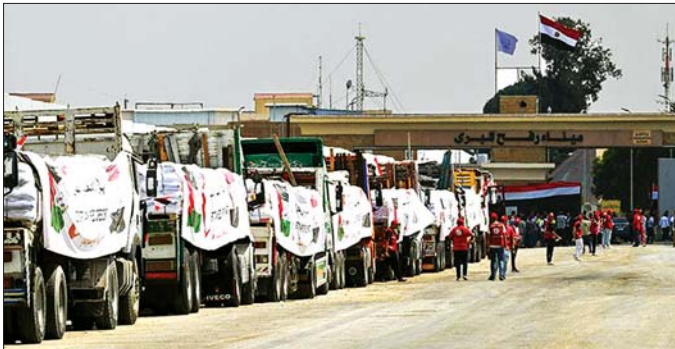
ဂါဇာဒေသတွင် စားရေးရိက္ခာစီမံခန့်ခွဲရေးအဖွဲ့က အီဂျစ်နိုင်ငံသည် ဂါဇာသို့ ကူညီထောက်ပံ့ရေးပစ္စည်း ၇၀ ရာခိုင်နှုန်းကျော် ထောက်ပံ့ခဲ့ပြီးဖြစ်ကြောင်း အီဂျစ်နိုင်ငံခြားရေးဝန်ကြီးဌာနက လွန်ခဲ့သောသီတင်းပတ်က ပြောကြားခဲ့သည်။ ထောက်ပံ့ကူညီရေးပစ္စည်း တန်ချိန် ၅၅၀၀၀၀ ကျော်ကို ပေးပို့ခဲ့ပြီးဖြစ်ပြီး ကျန်ရှိနေသေးသည့် ကူညီထောက်ပံ့ရေးယာဉ် ၅၀၀၀ ကျော်သည် အီဂျစ်ဘက်ခြမ်း ရာဖွာဘက်တွင် ပိတ်မိနေဆဲရှိသေးသည်။ ဂါဇာဒေသတွင် ငတ်မွတ်ခေါင်းပါးမှုများ ကြုံတွေ့နေရပြီး အာဟာရချို့တဲ့မှုကြောင့် သေဆုံးသူ ၂၅၀ ဦးရှိပြီး ၎င်းအရေအတွက်တွင် ကလေးငယ် ၁၅၅ ဦးပါဝင်ကြောင်း သိရသည်။ ဆင်ယွာ

ကိုးရို ဩဂုတ် ၂၅ ဂါဇာသို့ ကူညီထောက်ပံ့ရေးပစ္စည်းများ ပြန်လည်ပေးနိုင်ရန် အီဂျစ်နိုင်ငံအနေဖြင့် လူသားချင်းစာနာထောက်ထားမှုဆိုင်ရာ အကူအညီပေးရေး ယာဉ်တန်းကို ဩဂုတ် ၂၅ ရက်က ဂါဇာသို့စေလွှတ်လိုက်ကြောင်း နိုင်ငံပိုင် မီဒီယာတင်အေဂျင်စီက ပြောသည်။ အီဂျစ်လခြမ်းနီ အသင်းက ဆောင်ရွက်သော အီဂျစ်ဂါဇာသို့ ကူညီထောက်ပံ့ရေးပစ္စည်းများ ဂုဏ်ပြုပေးပို့သော ယာဉ်တန်းသည် ရာဖွာမှ ကိုရစ်ရှာလွန်ကို ဖြတ်ကျော်လာပြီဖြစ်သည်။ အဆိုပါ ယာဉ်တန်းသည် ဂျီဗုန်များပေါင်းမုန်များ၊ လောင်စာဆီ၊ ဆေးဝါးများနှင့် တခြားအရေးကြီးလိုအပ်သော ကူညီထောက်ပံ့ရေးပစ္စည်းများကို သယ်ဆောင်လာပြီဖြစ်သည်။ ကုလသမဂ္ဂ ကျောထောက်နောက်ခံ အဖွဲ့အစည်းတစ်ခုဖြစ်သည့် အစားအစာလုံခြုံရေးအဖွဲ့က