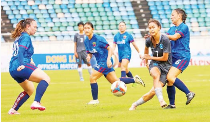
အား/ကာသိပ္ပံအသင်းတိုက်စစ်မှူး မေထက်လူ ဂူအမ်ကလပ် Strykers အသင်းဘက်သို့ ထိုးဖောက်စဉ်။

ရန်ကုန် ဩဂုတ် ၂၅ ၂၀၂၅-၂၀၂၆ ရာသီ အာရှအမျိုးသမီး ချန်ပီယံလိဂ်ခြေစစ်ပွဲ အုပ်စု (က) ပထမနေ့ကို ရန်ကုန်မြို့ရှိ သုဝဏ္ဏကွင်း၌ ယနေ့ ကျင်းပရာ မြန်မာအမျိုးသမီးကလပ် အား/ကာသိပ္ပံအသင်းက ဂူအမ်အမျိုးသမီးကလပ် Strykers အသင်းကို ဂိုးပြတ်အနိုင်ရရှိခဲ့သည်။ လက်ရွေးစင် ကစားသမား အများစုဖြင့် ဖွဲ့စည်းထားသည့် အား/ကာ သိပ္ပံအသင်းသည် ဂူအမ်ကလပ်အသင်းထက် အစစ အရာရာသာလွန်ကာ ခြေပြတ် ဂိုးပြတ်အနိုင်ရခဲ့သည်။ စာမျက်နှာ ၂၀ ကော်လံ ၁ ၀