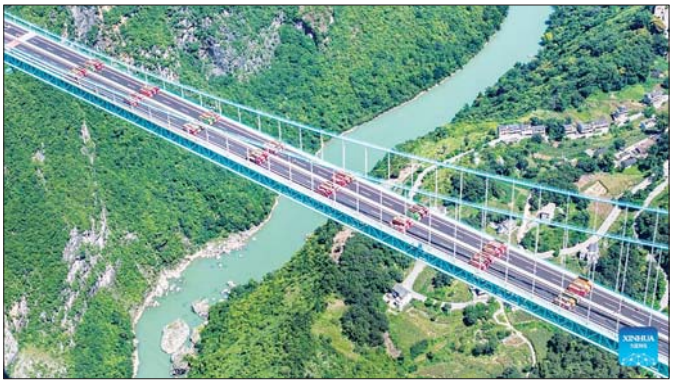
ကိုက်ညီမှုရှိကြောင်း ငါးရက်ကြာ စမ်းသပ်စစ်ဆေးမှုအတွင်း စမ်းသပ်စစ်ဆေးရေးအဖွဲ့က အတည်ပြုခဲ့သည်။ စမ်းသပ်စစ်ဆေးရေး အဖွဲ့သည် တန်ချိန်စုစုပေါင်း ၃၃၀၀ ခန့်ရှိသည့် ကုန်တင်ကား ၉၆ စီး မောင်းနှင်စမ်းသပ်ခဲ့ကြောင်း သိရသည်။ အဆိုပါတံတားသည် မီတာ ၂၅၀၀ ရှည်လျားပြီး မြစ်ရေမျက်နှာပြင်ထက် ၆၂၅ မီတာ မြင့်ကြောင်း သိရသည်။ ဆင်ယွာ

ကွေကျိုပြည်နယ်တွင် အနောက်တောင်ပိုင်း ကွေကျိုပြည်နယ်ရှိ Huajiang Grand Canyon တံတားသည် ဩဂုတ် ၂၅ ရက်တွင် ခံနိုင်ဝန် စမ်းသပ်လုပ်ဆောင်မှုများ ဆောင်ရွက်ပြီးစီးပြီးဖြစ်ကြောင်း သိရသည်။ လာမည့်စက်တင်ဘာလ နှောင်းပိုင်းတွင် ဖွင့်လှစ်ရန်စီစဉ်ထားသော အဆိုပါတံတားသည် ကမ္ဘာ့အမြင့်ဆုံးတံတားဖြစ်လာဖွယ်ရှိနေသည်။ တံတား၏ တည်ဆောက်ပုံ ဝိုင်ခံ့မှု၊ မာကျောမှု၊ တံတား၏ လှုပ်ရှားမှုနှင့် တုန်ခါမှုဆိုင်ရာ စွမ်းဆောင်ရည်များသည် ဘေးအန္တရာယ်ကင်းရေး သတ်မှတ်ထားသည့် စံချိန်စံညွှန်းများနှင့်