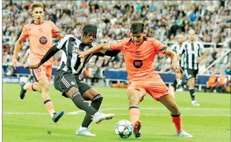
ဘာစီလိုနာအသင်းနှင့် မန်စီးတီးအသင်းတို့ ယှဉ်ပြိုင်နေစဉ်။