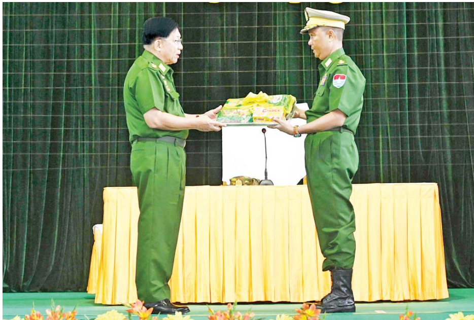
နိုင်ငံတော်လုံခြုံရေးနှင့်အေးချမ်းသာယာရေးကော်မရှင်ဥက္ကဋ္ဌ တပ်မတော်ကာကွယ်ရေးဦးစီးချုပ် ဗိုလ်ချုပ်မှူးကြီးမင်းအောင်လှိုင် ကမ်းရိုးတန်းဒေသ တိုင်းစစ်ဌာနချုပ် မြိတ်တပ်နယ်မှ အရာရှိ၊ စစ်သည်၊ မိသားစုများအတွက် စားသောက်ဖွယ်ရာပစ္စည်းများ ပေးအပ်စဉ်။