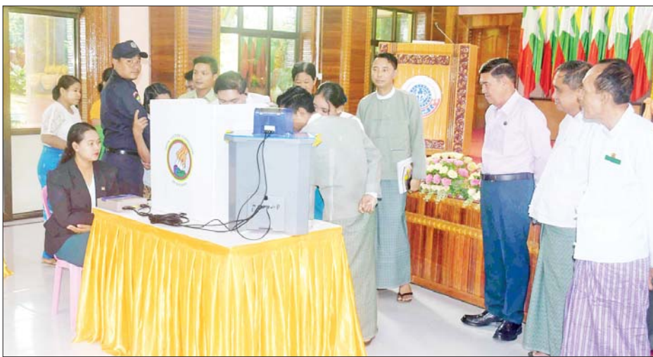
ဦးစွာ စစ်တွေမြို့နယ် ရုံးမှ တာဝန်ရှိသူတစ်ဦးက စက် (MEVM)ဆိုင်ရာ အချက် အလက်များနှင့် အသုံးပြုပုံ မြန်မာအီလက်ထရောနစ် မဲပေး

စစ်တွေ စက်တင်ဘာ ၁၉ မြန်မာ အီလက်ထရောနစ် မဲပေးစက် (MEVM)နှင့် စပ်လျဉ်း၍ ရှင်းလင်းပြသခြင်းနှင့် လက်တွေ့ သရုပ်ပြမဲပေးပွဲကို ယနေ့နံနက် ပိုင်းတွင် စစ်တွေမြို့ ခိုင်သဇင် ခန်းမ၌ ကျင်းပရာ ရခိုင်ပြည်နယ် ဝန်ကြီးချုပ် ဦးထိန်လင်း၊ ပြည်ထောင်စု ရွေးကော်မရှင် ကော်မရှင်အဖွဲ့ဝင် ဦးအောင်မိုး မြင့်၊ ပြည်နယ်တရားလွှတ်တော် တရားသူကြီးချုပ် ပြည်နယ်ဝန်ကြီး များ၊ ဌာနဆိုင်ရာများ၊ သက်ကြီး မဲဆန္ဒရှင်များနှင့် မသန်စွမ်းမဲဆန္ဒ ရှင်များ တက်ရောက်ကြသည်။