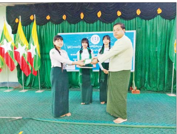
မင်္ဂလာဒုံမြို့နယ် အထက(၅)၌ စာဖတ်ရိုက်မြှင့်တင်ရေး လှုပ်ရှားမှုဟောပြောပွဲနှင့် ပြပွဲ၊ ပြိုင်ပွဲများ ကျင်းပ

ကျမ်းစာများ ပြုပြင်ပုံများတွင် ဆုရရှိသူများ၊ စကားပိုင်းတွင်ပါဝင် ဆွေးနွေးကြသူများနှင့် ဖျော်ဖြေပေးကြသော ကျောင်းသား ကျောင်းသူများအား မြို့နယ်စီမံခန့်ခွဲရေးနှင့် အုပ်ချုပ်ရေး ကော်မတီဥက္ကဋ္ဌ ဦးကျော်ငြိမ်း ထွန်းနှင့် တာဝန်ရှိသူများက ဂုဏ်ပြုဆုငွေနှင့် မှတ်တမ်းလွှာများ ပေးအပ်ချီးမြှင့်သည်။ လှည့်လည်ကြည့်ရှု ယင်းနောက် တက်ရောက်လာ ကြသူများက ပြန်ကြားရေးနှင့် ပြည်သူ့ဆက်ဆံရေး ဦးစီးဌာနက ပြသထားရှိသော လှပသာယာ ပြည်မြန်မာ ရောင်စုံဓာတ်ပုံများ၊ နံရံကပ်စာစောင်များ၊ စာအုပ်ပြပွဲများကို လှည့်လည်ကြည့်ရှု အားပေးခဲ့ကြကြောင်း သိရသည်။ ခန့်ဝင်း (ဆင်ပေါင်ဝဲ)