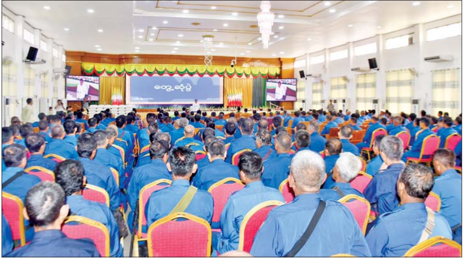
နိုင်ငံရေးအဖွဲ့ဝင်များအား ဆန်း၊ ဆီများ ချီးမြှင့်ပေးအပ်သည်။ ယင်းနောက်တက်ရောက်လာကြသည့် ပြည်သူ့လုံခြုံရေးနှင့် အကြမ်းဖက်နှိမ်နင်းရေးအဖွဲ့ဝင်များအား ရင်းရင်းနှီးနှီး နှုတ်ဆက်အားပေးစကား ပြောကြားခဲ့ကြောင်း သိရသည်။ တိုင်းဒေသကြီး(ပြန်/ဆက်)

ယင်းတို့၏ လက်အောက်ခံ PDF အမည်ခံ အကြမ်းဖက်သမားများက အထွေထွေရွေးကောက်ပွဲပျက်ပြားစေရေး နည်းလမ်းပေါင်းစုံမှ အဖျက်အမှောင့် လုပ်ငန်းများ ဆောင်ရွက်လာနိုင်သဖြင့် သက်ဆိုင်ရာ လုံခြုံရေးတပ်ဖွဲ့ဝင်များ ပိုင်းဝန်းပူးပေါင်းဆောင်ရွက် သွားကြရမည်ဖြစ်ကြောင်း၊ တည်ငြိမ်အေးချမ်းမှုရှိမှသာ ဒေသဖွံ့ဖြိုးရေးလုပ်ငန်းများ ဆောင်ရွက်နိုင်ပြီး ပြည်သူများ၏ လူမှုစီးပွားဘဝများ ပိုမိုဖွံ့ဖြိုး တိုးတက်လာမည်ဖြစ်ကြောင်း ပြောကြားသည်။ ထို့နောက် ပဲခူးတိုင်းဒေသကြီး ဝန်ကြီးချုပ် ဦးမျိုးဆွေဝင်းနှင့် လုံခြုံရေးနှင့် နယ်စပ်ရေးရာ ဝန်ကြီး ဗိုလ်မှူးကြီး ညီလန်းချိုတို့က ပဲခူးမြို့နယ် အတွင်းရှိ ပြည်သူ့လုံခြုံရေးနှင့် အကြမ်းဖက်