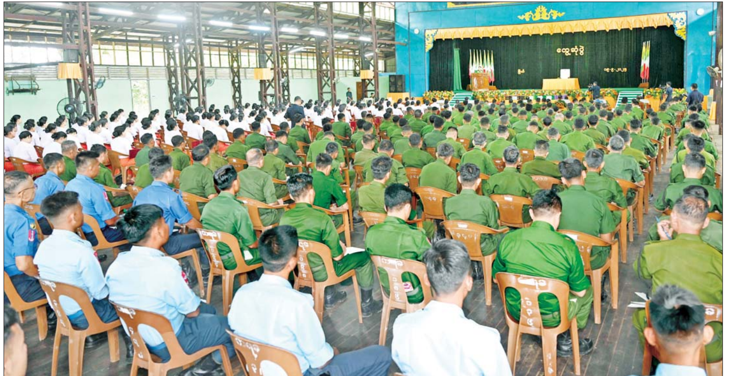
နိုင်ငံတော်လုံခြုံရေးနှင့်အေးချမ်းသာယာရေးကော်မရှင်ဥက္ကဋ္ဌ တပ်မတော်ကာကွယ်ရေးဦးစီးချုပ် ဗိုလ်ချုပ်မှူးကြီးမင်းအောင်လှိုင် ကမ်းရိုးတန်းဒေသတိုင်းစစ်ဌာနချုပ် မြိတ်တပ်နယ်မိသားစုများအား တွေ့ဆုံအမှာစကားပြောကြားစဉ်။

ရှင်းလင်းတင်ပြမှုများအပေါ် နိုင်ငံတော်လုံခြုံရေးနှင့် အေးချမ်းသာယာရေးကော်မရှင်ဥက္ကဋ္ဌ တပ်မတော်ကာကွယ်ရေးဦးစီးချုပ်က တိုင်းစစ်ဌာနချုပ်နယ်မြေအတွင်း နယ်မြေလုံခြုံရေးနှင့် တည်ငြိမ်