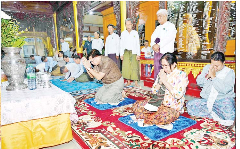
ပြည်ထောင်စုသမ္မတမြန်မာနိုင်ငံတော် ယာယီသမ္မတ နိုင်ငံတော်လုံခြုံရေးနှင့် အေးချမ်းသာယာရေးကော်မရှင်ဥက္ကဋ္ဌ ဗိုလ်ချုပ်မှူးကြီးမင်းအောင်လှိုင်နှင့် ဇနီး ဒေါ်ကြူကြူလှ လေးကျွန်းဆီမီးစေတီတော်ကြီးအား ဖူးမြော်ကြည်ညိုကြစဉ်။