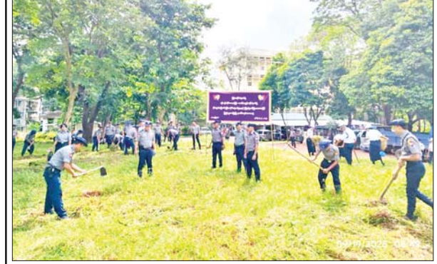
နေရောင်အောက်က သက်ရှိတွေကို စောင့်ရှောက်ဖို့ အိုဇုန်းလွှာကို ထိန်းသိမ်းစို့