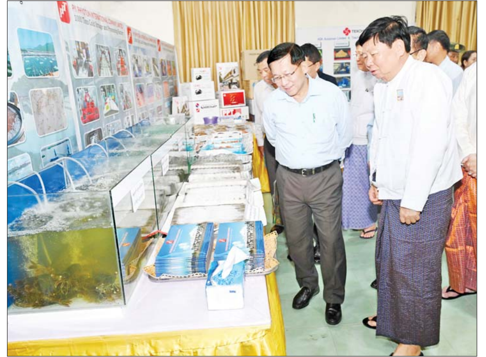
ပြည်ထောင်စုသမ္မတမြန်မာနိုင်ငံတော် ယာယီသမ္မတ နိုင်ငံတော်လုံခြုံရေးနှင့် အေးချမ်းသာယာရေးကော်မရှင်ဥက္ကဋ္ဌ ဗိုလ်ချုပ်မှူးကြီးမင်းအောင်လှိုင်နှင့်အဖွဲ့ဝင်များ မြိတ်ခရိုင်အတွင်းမှ MSME ထုတ်ကုန် ပြခန်းများအား လေ့လာကြည့်ရှုစဉ်။

တင်ပြချက်များအပေါ် ပြည်ထောင်စုဝန်ကြီးများနှင့် တာဝန်ရှိသူများက ပြန်လည်ရှင်းလင်းဆွေးနွေး ၎င်းနောက် ပြည်ထောင်စုဝန်ကြီးများနှင့် ဒုတိယဝန်ကြီးများက တနင်္သာရီတိုင်းဒေသကြီးမှထွက်ရှိသည့် မွေးမြူရေး ရေထွက်ကုန်ပစ္စည်းများအား ပြည်ပသို့တင်ပို့ရာတွင် လုပ်ထုံးလုပ်နည်းများနှင့် အညီ စစ်ဆေးခွင့်ပြုပေးလျက်ရှိမှုနှင့် အချိန်ကြန့်ကြာမှု အနည်းဆုံးဖြစ်စေရေး ဆောင်ရွက်ပေးသွားမည့် အခြေအနေများ၊ ပုစွန်မွေးမြူရေးလုပ်ငန်းများကို စည်းကမ်းသတ်မှတ်ချက်များနှင့်အညီ ခွင့်ပြုဆောင်ရွက်ပေးလျက်ရှိမှု၊ ငါးဖမ်းလှေများအနေဖြင့် ချမှတ်ထားသည့် ဥပဒေစည်းကမ်းသတ်မှတ်ချက်များနှင့်အညီ လိုက်နာဆောင်ရွက်သွားရန်လိုအပ်မှု၊ MSME လုပ်ငန်းများနှင့် စိုက်ပျိုးမွေးမြူရေးလုပ်ငန်းများ အောင်မြင်စွာဆောင်ရွက်နိုင်ရေးအတွက် လိုအပ်