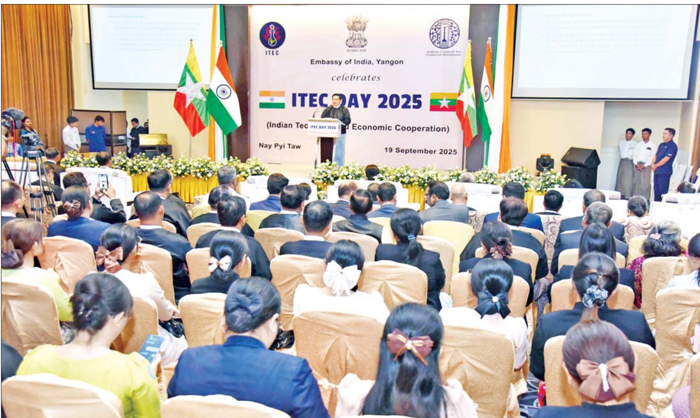
နိုင်ငံတော်ဝန်ကြီးချုပ် ဦးညိုစော ၂၀၂၅ ခုနှစ် အိန္ဒိယနည်းပညာနှင့် စီးပွားရေးပူးပေါင်းဆောင်ရွက်မှုအစီအစဉ်၏ (၆၂) နှစ်မြောက် အထိမ်းအမှတ်အခမ်းအနား တွင် အမှာစကားပြောကြားစဉ်။