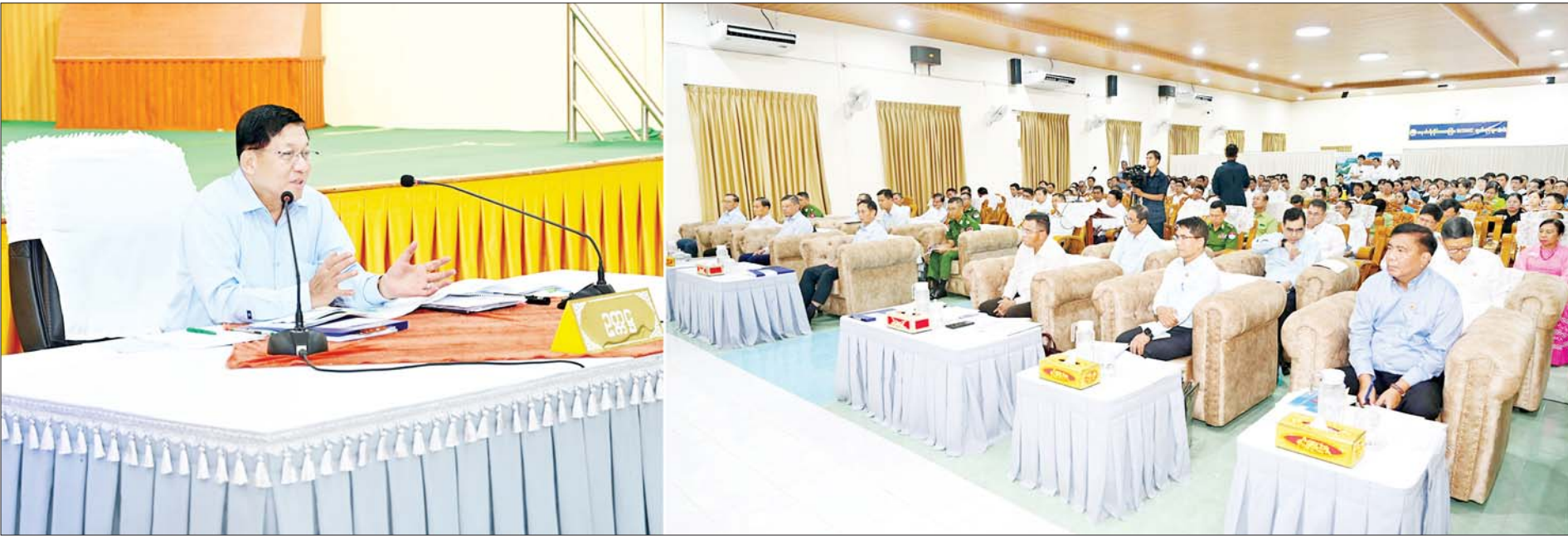
ပြည်ထောင်စုသမ္မတမြန်မာနိုင်ငံတော် ယာယီသမ္မတ နိုင်ငံတော်လုံခြုံရေးနှင့် အေးချမ်းသာယာရေးကော်မရှင်ဥက္ကဋ္ဌ ဗိုလ်ချုပ်မှူးကြီး မင်းအောင်လှိုင် တနင်္သာရီတိုင်းဒေသကြီး မြိတ်မြို့ရှိ ဌာနဆိုင်ရာတာဝန်ရှိသူများ၊ မြို့မိမြို့ဖများနှင့် တွေ့ဆုံ၍ ဒေသဖွံ့ဖြိုးတိုးတက်ရေးဆိုင်ရာများ ဆွေးနွေးပြောကြားစဉ်။