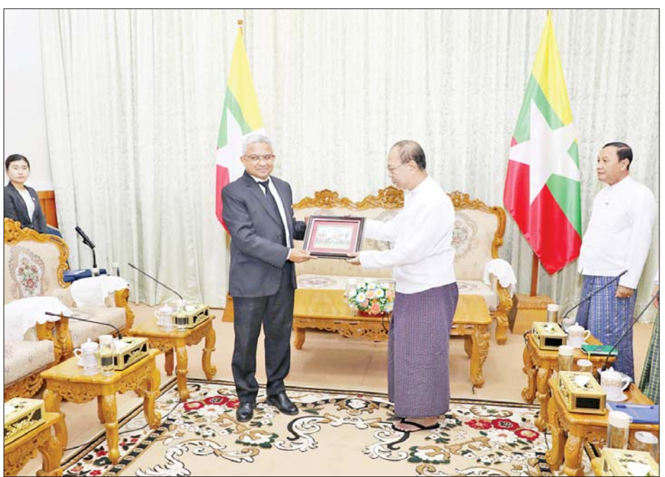
ဆောင်ရွက်နေမှုများကို ရင်းနှီးပွင့်လင်းစွာ ဆွေးနွေး ကော်မရှင်အဖွဲ့ဝင်များနှင့် ကော်မရှင်ရုံးမှ တာဝန်ရှိသူ များ တက်ရောက်ခဲ့ကြကြောင်း သိရသည်။ တွေ့ဆုံပွဲသို့ ပြည်ထောင်စုရွေးကော်မရှင် ဘတင်းစဉ်

ရွေးကောက်ပွဲတွင် ပြောင်းလဲကျင့်သုံးမည့် ရွေးကောက်ပွဲစနစ်၊ လွှတ်တော်ကိုယ်စားလှယ် လောင်း တင်သွင်းမှုအခြေအနေ၊ ရွေးကောက်ပွဲကို အပိုင်းလိုက်ဆောင်ရွက်မည့်အခြေအနေ၊ မဲဆန္ဒရှင် စာရင်းပြုစုဆောင်ရွက်မှုအခြေအနေ၊ မြန်မာအီလက် ထရောနစ်မဲပေးစက်ကို တစ်နိုင်ငံလုံးအတိုင်းအတာ ဖြင့် အသုံးပြုသွားမည့်အခြေအနေနှင့် အသိပညာ ပေးလုပ်ငန်းများဆောင်ရွက်နေမှု၊ ပွင့်လင်းမြင်သာမှု နှင့် တရားမျှတမှုရှိသည့် ရွေးကောက်ပွဲအဖြစ် ဖော်ဆောင်နိုင်ရေး ရွေးကောက်ပွဲစောင့်ကြည့်လေ့လာ ခွင့်ပြုသွားမည့်အခြေအနေ၊ သတင်းမီဒီယာဆိုင်ရာ ကိစ္စရပ်များ၊ ရွေးကောက်ပွဲဆိုင်ရာ စွမ်းရည်မြှင့် သင်တန်းများအပါအဝင် နည်းပညာဆိုင်ရာသင်တန်း များကို အိန္ဒိယနိုင်ငံ၏ကူညီမှုဖြင့် ရွေးကောက်ပွဲလွန် ကာလတွင် ဆောင်ရွက်သွားလိုသည့် အခြေအနေ နှင့် ရွေးကောက်ပွဲအောင်မြင်စွာ ကျင်းပနိုင်ရေး