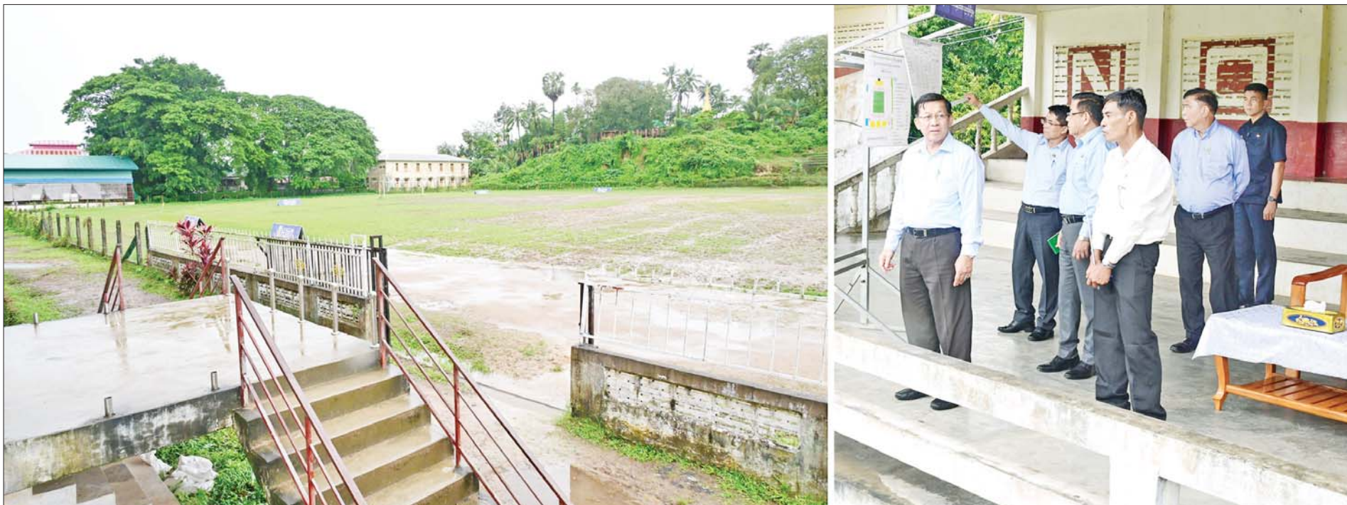
ပြည်ထောင်စုသမ္မတမြန်မာနိုင်ငံတော် ယာယီသမ္မတ နိုင်ငံတော်လုံခြုံရေးနှင့် အေးချမ်းသာယာရေးကော်မရှင်ဥက္ကဋ္ဌ ဗိုလ်ချုပ်မှူးကြီး မင်းအောင်လှိုင် မြတ်မြို့ မြို့မအားကစားကွင်းအား ကြည့်ရှုစစ်ဆေးစဉ်။

စာမျက်နှာ ၃ မှ မြတ်ခရိုင်အတွင်း ဆန်ဖူလုံမှုနှင့်ပတ်သက်၍ တိုးတက်မှုရှိလာသည်ကို တွေ့ရှိရသော်လည်း ပန်းတိုင်ရည်မှန်းချက်ပြည့်မီအောင် ဆက်လက် ကြိုးပမ်းဆောင်ရွက်သွားကြရန် လိုကြောင်း၊ စိုက်ပျိုး ရေးအတွက်ခွင့်ပြုပေးထားသည့် မြေနေရာများ၌ အခြားနည်းများဖြင့် သုံးစွဲမှုမရှိစေရေး၊ သတ်မှတ် စည်းမျဉ်းများနှင့်အညီဖြစ်စေရေး ဆောင်ရွက်သွား ရန်လိုကြောင်း၊ မြိတ်ဒေသတွင် အထပ်မြင့်အဆောက် အအုံများ ဆောက်လုပ်နေထိုင်ကြမည်ဆိုပါက လူနေ ထိုင်မှုအတွက် ပိုမိုအဆင်ပြေနိုင်မည်ဖြစ်ပြီး စိုက်ပျိုး မြေများ၌ အခြားနည်းများဖြင့် အသုံးပြုမှုများသည် လည်း လျော့နည်းသွားမည်ဖြစ်ကြောင်း၊ ရေထွက် ကုန်ပစ္စည်းများတင်ပို့ရာတွင် မှန်မှန်ကန်ကန်ဖြင့် ဆောင်ရွက်သွားရန်လိုပြီး ချမှတ်ထားသည့် စည်းမျဉ်း စည်းကမ်းများအတိုင်းဖြစ်ရန်လိုကြောင်း၊ ပြည်ပသို့ တင်ပို့ရာတွင် အအေးခန်း ကုန်တိုက်နံရံများဖြင့် သယ်ယူဆောင်ရွက်သွားမည်ဆိုပါက လုပ်ငန်းပိုမို အဆင်ပြေနိုင်မည်ဖြစ်ကြောင်း၊ ပုစွန်သားပေါက် တင်သွင်းခွင့်ရရှိရေး၊ ပုစွန်အစာ တင်သွင်းခွင့်ရရှိရေး တို့နှင့်ပတ်သက်၍ အဆင်ပြေအောင်ဆောင်ရွက် ပေးသွားမည်ဖြစ်ကြောင်း၊ မိမိတို့နိုင်ငံမှ ထွက်ရှိသည့် ရေထွက်ကုန်ပစ္စည်းများသည် အိမ်နီးချင်းနိုင်ငံများ၌ ဈေးကွက်လိုအပ်ချက်ပမာဏ ကြီးမားစွာရှိသည့် အတွက် လေကြောင်းလိုင်းများမှတစ်ဆင့် တင်ပို့ နိုင်ရေး မြိတ်လေယာဉ်ကွင်း အဆင့်မြှင့်တင်ခြင်း လုပ်ငန်းများကို ဆောင်ရွက်ပေးသွားမည်ဖြစ်ကြောင်း၊ ပုစွန်မွေးမြူရေးအတွက်လိုအပ်သည့် ပုစွန်အစာနှင့် ပတ်သက်၍ ပြည်တွင်း၌ ထုတ်လုပ်နိုင်ရေး ကြိုးပမ်း ဆောင်ရွက်လျက်ရှိကြောင်း၊ ပုစွန်မွေးမြူရေးတွင် ပုစွန်ကန်များပြုလုပ်၍ မွေးမြူသကဲ့သို့ သဘာဝ