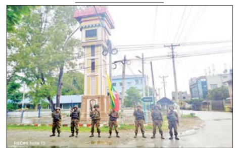
တပ်မတော်စစ်ကြောင်းများက သီပေါမြို့အား ပြန်လည်သိမ်းပိုက်ရရှိခဲ့သည့် မှတ်တမ်းဓာတ်ပုံ။

လွင်-နောင်ချို-ကျောက်မဲ-သီပေါ ပြည်ထောင်စု လမ်းမကြီး လုပ်ဆောင်နိုင်တော့မည်ဖြစ်သည့် တစ်လျှောက် ကုန်စည်ကူးသန်းအတွက် ပြည်သူများက ဝမ်းမြောက်ရေးနှင့် လမ်းပန်းဆက်သွယ်ရေးလျက်ရှိကြောင်း သိရသည်။ များ ပြန်လည်ကောင်းမွန်၍ ဒေသ သတင်းစဉ်