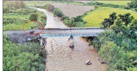
အကြမ်းဖက်သောင်းကျန်းသူများ ဖောက်ခွဲဖျက်ဆီးခဲ့သည့် ကျင်သီတံတား မှတ်တမ်းဓာတ်ပုံ။