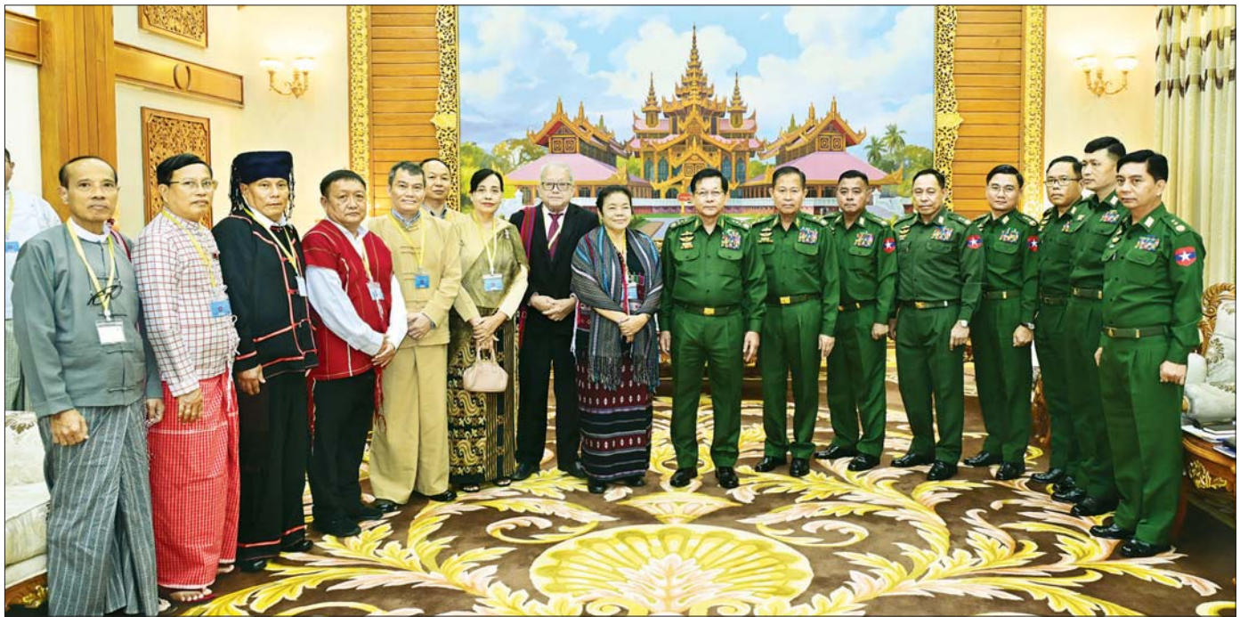
နိုင်ငံတော်လုံခြုံရေးနှင့်အေးချမ်းသာယာရေးကော်မရှင်ဥက္ကဋ္ဌ တပ်မတော်ကာကွယ်ရေးဦးစီးချုပ် ဗိုလ်ချုပ်မှူးကြီး မင်းအောင်လှိုင်နှင့် တိုင်းရင်းသားလက်နက်ကိုင်ကိုယ်စားလှယ်အဖွဲ့များ စုပေါင်းမှတ်တမ်းတင် ဝတ်ပုံရိုက်စဉ်။