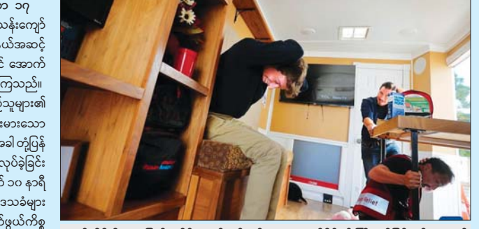
ကယ်လီဖိုးနီးယားပြည်နယ်၌ ငလျင်လှုပ်ခတ်မှုမှ ကာကွယ်နိုင်ရန် ကြိုတင်ပြင်ဆင်လေ့ကျင့်နေမှုကို အောက်တိုဘာ ၁၆ ရက်က တွေ့ရစဉ်။ ဝက်ဘိုဆိုင်းတွင် ဖော်ပြထားသည်။ အဆိုပါလေ့ကျင့်မှုသည် လူတစ်ဦးချင်း၊ ကျောင်းများနှင့် ရပ်ရွာလူထုအား ငလျင်ဒဏ်ခံနိုင်ရေးဆောင်ရွက်ချက်များ လေ့ကျင့်ကျေးဇူးများ ရရှိမည်ဖြစ်သည်။

ကယ်လီဖိုးနီးယားဒေသ ၁၀ သန်းကျော်သည် နှစ်စဉ်ပြုလုပ်သည့် ပြည်နယ်အဆင့် ငလျင်ကာကွယ်ရေးလေ့ကျင့်မှုတွင် အောက်တိုဘာ ၁၆ ရက်က ပါဝင်ဆင်နွှဲခဲ့ကြသည်။ အဆိုပါလေ့ကျင့်မှုသည် ပြည်သူများ၏ အသိအမြင် မြှင့်တင်ရန်နှင့် ကြီးမားသော ငလျင်ကြီးများနှင့် ကြုံတွေ့သည့်အခါ တုံ့ပြန်နိုင်စွမ်းမြှင့်တင်ရန် ရည်ရွယ်၍ ပြုလုပ်ခဲ့ခြင်းဖြစ်သည်။ ဒေသစတော်ချိန် နံနက် ၁၀ နာရီ ၁၆ မိနစ်က ပြည်နယ်တစ်ဝန်းဒေသခံများသည် ၎င်းတို့၏ နေ့စဉ်ဆောင်ရွက်ဖွယ်ကိစ္စများကို ရပ်နားကာ ငလျင်လေ့ကျင့်ခန်းတွင် ပါဝင်ခဲ့ကြသည်။ ယခုနှစ်အတွင်းပြုလုပ်သည့် ငလျင်လေ့ကျင့်ခန်းတွင်ပါဝင်ရန် ကယ်လီဖိုးနီးယားဒေသ ၁၀ ဒသမ ၄ သန်း စာရင်းပေးသွင်းခဲ့ကြသည်ဟု ကျင်းပရေးကော်မတီ၏