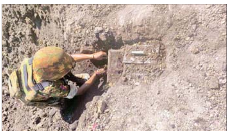
လုံခြုံရေးတပ်ဖွဲ့ဝင်များက မိုင်းရှင်းလင်းရေးလုပ်ငန်းများ ဆောင်ရွက်နေမှု မှတ်တမ်းဓာတ်ပုံ။