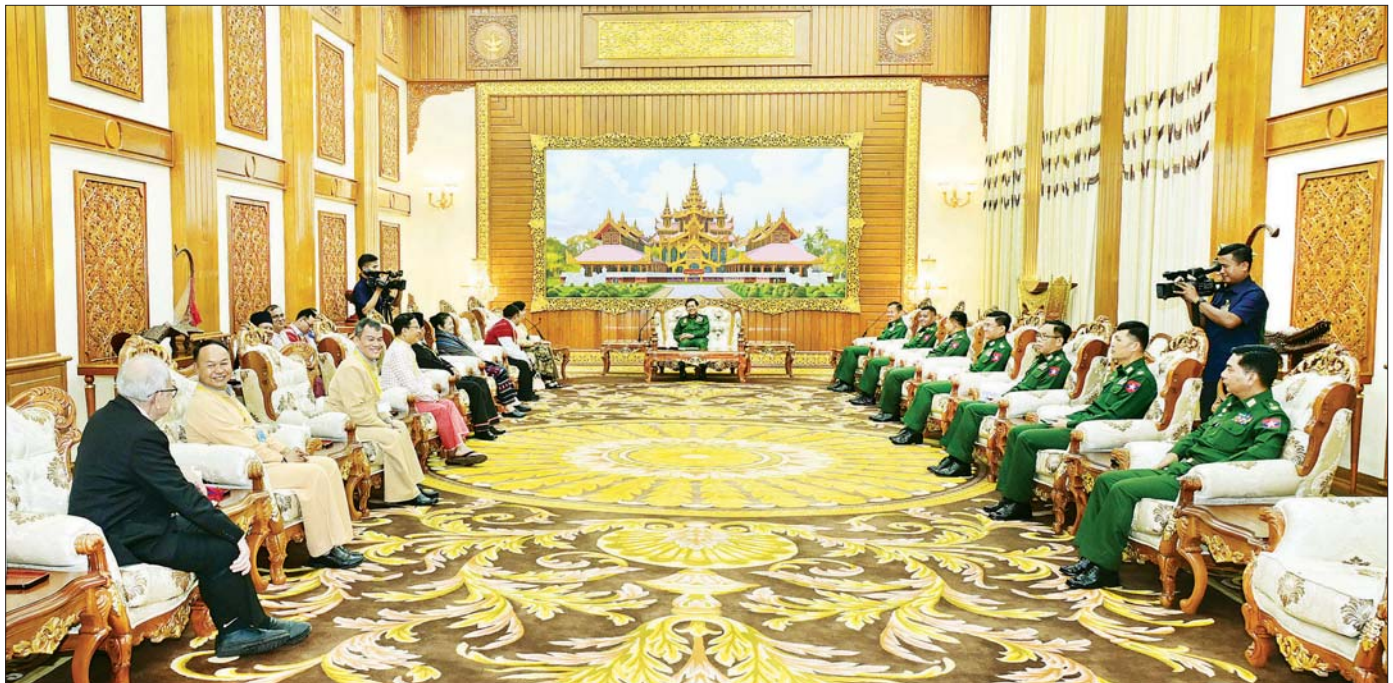
နိုင်ငံတော်လုံခြုံရေးနှင့်အေးချမ်းသာယာရေးကော်မရှင်ဥက္ကဋ္ဌ တပ်မတော်ကာကွယ်ရေးဦးစီးချုပ် ဗိုလ်ချုပ်မှူးကြီး မင်းအောင်လှိုင် ထံ ငြိမ်းချမ်းရေးဆွေးနွေးပွဲသို့ တက်ရောက်ခဲ့သည့် တိုင်းရင်းသားလက်နက်ကိုင် ကိုယ်စားလှယ်အဖွဲ့များက လာရောက်ဂါရဝပြုတွေ့ဆုံစဉ်။