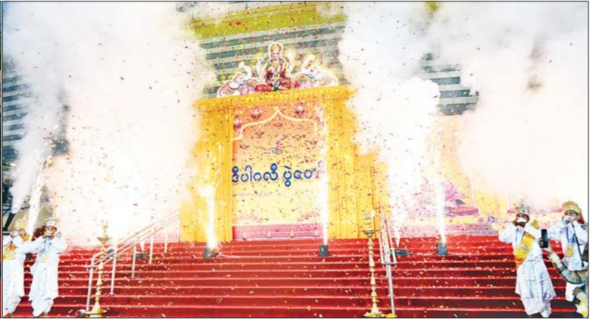
ပြည်ထောင်စုသမ္မတမြန်မာနိုင်ငံတော် ယာယီသမ္မတ နိုင်ငံတော်လုံခြုံရေးနှင့် အေးချမ်းသာယာရေးကော်မရှင်ဥက္ကဋ္ဌ ဗိုလ်ချုပ်မှူးကြီး မင်းအောင်လှိုင် ဒီပဲလီအထိမ်းအမှတ်အခမ်းအနားကို စက်ခလုတ်နှိပ် ဖွင့်လှစ်ပေးစဉ်။