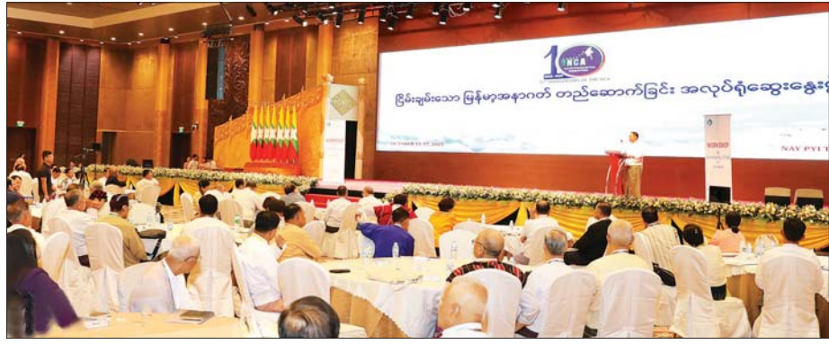
နိုင်ငံတော်လုံခြုံရေးနှင့် အေးချမ်းသာယာရေးကော်မရှင်အဖွဲ့ဝင်၊ အမျိုးသားစည်းလုံးညီညွတ်ရေးနှင့် ငြိမ်းချမ်းရေးဖော်ဆောင်မှုညှိနှိုင်းရေးကော်မတီဥက္ကဋ္ဌ ဒုတိယဗိုလ်ချုပ်ကြီး ရာပြည့် နိဂုံးချုပ်စကား ပြောကြားစဉ်။

အဆိုပါ အလုပ်ရုံဆွေးနွေးပွဲသို့ နိုင်ငံတော်လုံခြုံရေးနှင့် အေးချမ်းသာယာရေးကော်မရှင် အဖွဲ့ဝင်၊ အမျိုးသား စည်းလုံးညီညွတ်ရေးနှင့် ငြိမ်းချမ်းရေးဖော်ဆောင်မှု ညှိနှိုင်းရေးကော်မတီဥက္ကဋ္ဌ ဒုတိယဗိုလ်ချုပ်ကြီး ရာပြည့်၊ အမျိုးသား စည်းလုံးညီညွတ်ရေးနှင့် ငြိမ်းချမ်းရေးဖော်ဆောင်မှု ညှိနှိုင်းရေးကော်မတီအတွင်းရေးမှူး ဒုတိယဗိုလ်ချုပ်ကြီး မင်းနိုင်နှင့် ညှိနှိုင်းရေးကော်မတီဝင်များ တပ်မတော် အငြိမ်းစား အရာရှိကြီးများ၊ ပစ်ခတ်တိုက်ခိုက်မှု ရပ်စဲရေးဆိုင်ရာ ပူးတွဲစောင့်ကြည့်ရေးကော်မတီ (JMC) မှ ကိုယ်စားလှယ်များ၊ နိုင်ငံရေးပါတီများမှ ကိုယ်စားလှယ်များ၊ NCA လက်မှတ်ရေးထိုးထားသည့် တိုင်းရင်းသား လက်နက်ကိုင် အဖွဲ့အစည်းများမှ ကိုယ်စားလှယ်များ၊ ငြိမ်းချမ်းရေး လုပ်ငန်းစဉ်တွင် ပါဝင်ဆောင်ရွက်သူများ၊ မိဒီယာများနှင့် လူလူသူများ တက်ရောက်ကြသည်။ ထို့နောက် “NCA ၁၀ နှစ်တာ ကာလအတွင်း ငြိမ်းချမ်းရေး လုပ်ငန်းစဉ် အကောင်အထည်ဖော်နိုင်မှုများ၊ အောင်မြင်မှုများနှင့် သင်ခန်းစာများကို သုံးသပ်ခြင်း၊ တိုင်းရင်းသားလက်နက်ကိုင် အဖွဲ့အစည်းများ ပြန်လည်စုံလင်စွာ