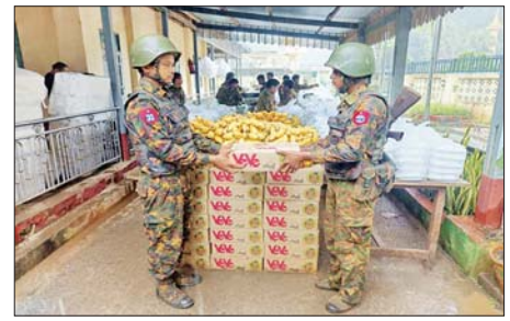
နိုင်ငံတစ်ဝန်းရှိ စေတနာ့ရင် အလှူရှင်များက ဂုဏ်ပြုချီးမြှင့်ငွေများ၊ စားသောက်ဖွယ်ရာများနှင့် အသုံးအဆောင်ပစ္စည်းများအား ပေးပို့လှူဒါန်းစဉ်။

လျက်ရှိသကဲ့သို့ပင် မြန်မာတစ်ပြည်လုံးရှိ ပြည်သူများကလည်း ယခုကဲ့သို့ တပ်မတော်၏ အောင်မြင်မှုများအတွက် ထပ်တူဂုဏ်ယူဝမ်းမြောက်လျက်ရှိပြီး ရှေ့တန်းရောက် တပ်မတော်သားများအတွက် နိုင်ငံတစ်ဝန်းရှိ စေတနာ့ရင်အလှူရှင်များက ဂုဏ်ပြုချီးမြှင့်ငွေများ၊ စားသောက်ဖွယ်ရာများနှင့် အသုံးအဆောင်ပစ္စည်းများအား ပေးပို့လှူဒါန်းလျက်ရှိရာ သက်ဆိုင်ရာတာဝန်ရှိသူများကလည်း ရှေ့တန်းရောက် တပ်မတော်သားများ၏ လက်ဝယ်အရောက် ပို့ဆောင်ပေးလျက်ရှိသည်။ ထို့ပြင် တပ်မတော်စစ်ကြောင်းများက သီပေါမြို့အား ပြန်လည်သိမ်းပိုက်နိုင်ခဲ့သည့်အတွက် ပြင်ဦး