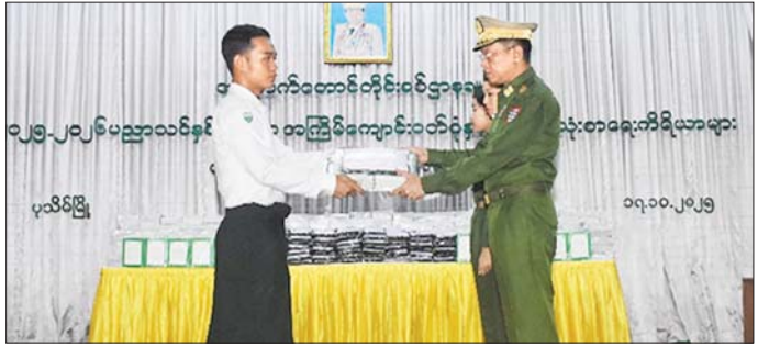
၂၀၂၅-၂၀၂၆ ပညာသင်နှစ် အတွက် ကျောင်းဝတ်စုံနှင့် ကျောင်းသုံးစာရေးကိရိယာများ ပေးအပ်ခြင်း

နေပြည်တော် အောက်တိုဘာ ၁၇ ၂၀၂၅ ခုနှစ် တိုင်းဒေသကြီးနှင့်ပြည်နယ် အသက်(၂၅) နှစ်အောက် (အမျိုးသမီး) ဘောလုံးပြိုင်ပွဲ အုပ်စု ပတ်လည်ပွဲစဉ်များကို ယနေ့မွန်းလွဲပိုင်းတွင် ဧရာဝတီ တိုင်းဒေသကြီးဇုန်နှင့် ရှမ်းပြည်နယ်ဇုန်တို့ရှိ အားကစားကွင်း၌ ဆက်လက်ကျင်းပရာ အားကစား နှင့်လူငယ်ရေးရာဝန်ကြီးဌာနမှ ပြိုင်ပွဲကျင်းပရေး ဆိုင်ရာ တာဝန်ရှိပုဂ္ဂိုလ်များ၊ အားကစားဝါသနာရှင် ပရိသတ်များ တစ်ခနက်လာရောက်ကြည့်ရှုအားပေး ကြသည်။ ယနေ့ ဘောလုံးပြိုင်ပွဲ ပွဲစဉ်များအဖြစ် ဧရာဝတီ တိုင်းဒေသကြီး ပုသိမ်မြို့ ကိုးသိန်းအားကစားကွင်း ၌ ဧရာဝတီတိုင်းဒေသကြီးအသင်းနှင့် ကချင် ပြည်နယ်အသင်းတို့ ယှဉ်ပြိုင်ကစားခဲ့ရာ ဧရာဝတီ တိုင်းဒေသကြီးအသင်းက ရှစ်ဂိုး - တစ်ဂိုးဖြင့် လည်း ကောင်း၊ ရှမ်းပြည်နယ် တောင်ကြီးမြို့ ပြည်နယ် အားကစားကွင်း၌ ရခိုင်ပြည်နယ်အသင်းနှင့် တနင်္သာရီတိုင်းဒေသကြီးအသင်းတို့ ယှဉ်ပြိုင်ကစား ခဲ့ရာ တနင်္သာရီတိုင်းဒေသကြီးအသင်းက တစ်ဂိုး- ဂိုးမရှိဖြင့် ယှဉ်ပြိုင်အနိုင်ရရှိခဲ့သည်။