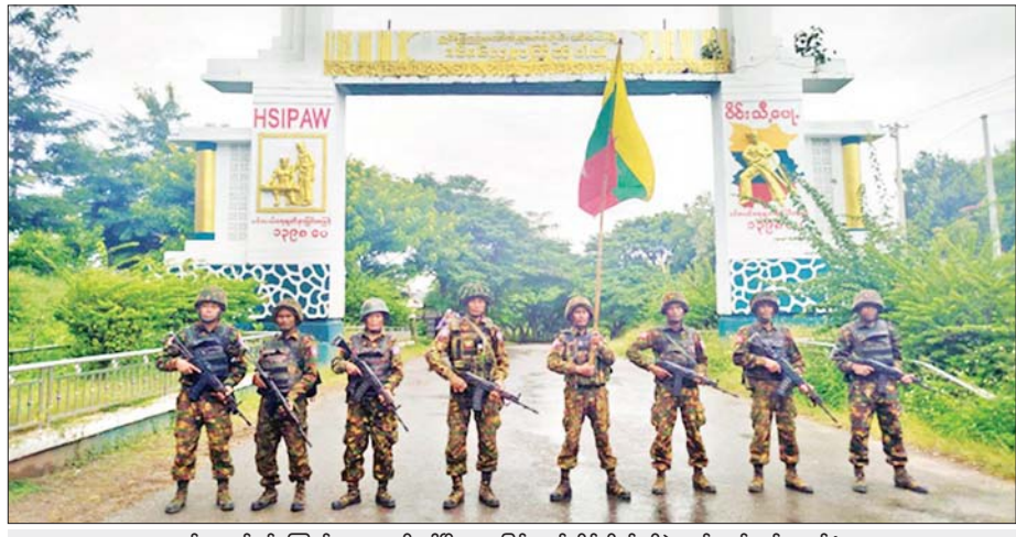
တပ်မတော်စစ်ကြောင်းများက သီပေါမြို့အား ပြန်လည်သိမ်းပိုက်ရရှိခဲ့သည့် မှတ်တမ်းဓာတ်ပုံ။

နေပြည်တော် အောက်တိုဘာ ၁၇ ၂၀၂၅ ခုနှစ် အောက်တိုဘာ ၁ ရက်တွင် ရှမ်းပြည်နယ်(မြောက်ပိုင်း) ခရိုင်မြို့ကြီးတစ်ခုဖြစ်သည့် ကျောက်မဲမြို့အား တပ်မတော်စစ်ကြောင်းများက ဒေသခံတိုင်းရင်းသား ပြည်သူလူထုတစ်ရပ်လုံး၏ နည်းမျိုးစုံဖြင့် ကူညီပံ့ပိုးမှုတို့ကို အပြည့်အဝရယူ၍ TNLA အကြမ်းဖက်လက်နက်ကိုင်အဖွဲ့အစည်းထံမှ ပြန်လည်သိမ်းပိုက် ထိန်းချုပ်နိုင်ခဲ့ပြီးနောက် ကျောက်မဲမြို့မှ ၂၈ ကီလိုမီတာအကွာရှိ ရှမ်းမြောက်ဒေသ၏ မြို့တစ်မြို့ဖြစ်သော သီပေါမြို့ကို ဆက်လက်ချိတ်ကပ်၍ အကြမ်းဖက်သောင်းကျန်းမှု နှိမ်နင်းမှုစစ်ဆင်ရေးဆောင်ရွက်ရန် လိုအပ်သည့်ပြင် ဆင်စုဖွဲ့မှုတို့ကို အချိန်တိုအတွင်း ဆက်လက်ဆောင်ရွက်ခဲ့သည်။ ထို့နောက် သားကောင်းဇာနည်အောင်စစ်သည် တပ်မတော်စစ်ကြောင်းများက ကျောက်မဲမြို့မှ သီပေါမြို့သို့ ဖရိုဖရဲ အလဲလဲ အကွဲကွဲ ဦးတည်ဆုတ်ခွာထွက်ပြေးခဲ့ကြသည့် TNLA အကြမ်းဖက်သောင်းကျန်းသူများကို အနားမပေးဘဲ ၂၀၂၅ ခုနှစ် အောက်တိုဘာ ၂ ရက်မှစ၍ စစ်ကြောင်းများဖြန့်ခွဲကာ အကြမ်းဖက်ချေမှုန်းမှုစစ်ဆင်ရေးကို ဆက်လက်ဆောင်ရွက်ပွဲဝင်ခဲ့ကြသည်။