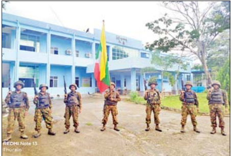
တပ်မတော်စစ်ကြောင်းများက သီပေါမြို့ရှိ ပြည်သူ့ဆေးရုံအား ပြန်လည်သိမ်းပိုက်ရရှိခဲ့သည့် မှတ်တမ်းဓာတ်ပုံ။