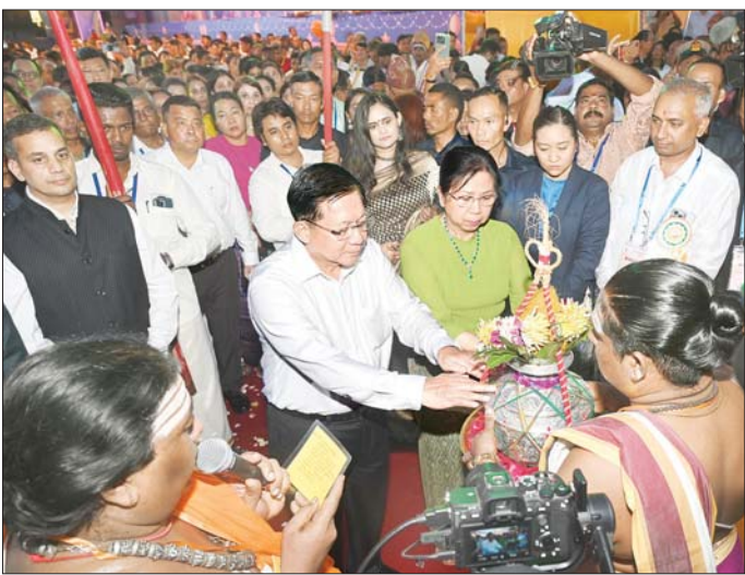
ပြည်ထောင်စုသမ္မတမြန်မာနိုင်ငံတော် ယာယီသမ္မတ နိုင်ငံတော်လုံခြုံရေးနှင့်အေးချမ်းသာယာရေးကော်မရှင် ဥက္ကဋ္ဌ ဗိုလ်ချုပ်မှူးကြီး မင်းအောင်လှိုင်နှင့် ဇနီး ဒေါ်ကြူကြူလှတို့အား ဟိန္ဒူရိုးရာတစ်ခုဖြစ်သည့် မွန်မြတ် ပြီးမင်္ဂလာရှိသော ဟိန္ဒူရိုးရာ Pur Kumbham (ပုရ်ဇာကမ္ဘမ်) ဖြင့် ဆုတောင်းကြိုဆိုကြစဉ်။

အဖွဲ့ဝင်များ၊ ပြည်ထောင်စုဝန်ကြီးများနှင့် ဇနီး များ၊ မြန်မာနိုင်ငံဆိုင်ရာ နိုင်ငံတကာ သံရုံးများမှ သံအမတ်ကြီးများနှင့် သံရုံးအကြီးအကဲများ၊ ကာကွယ် ရေးဦးစီးချုပ်ရုံးမှ အဆင့်မြင့် တပ်မတော် အရာရှိကြီးများနှင့် ဇနီးများ၊ ရန်ကုန်တိုင်းစစ်ဌာနချုပ် တိုင်းမှူး၊ အသင်းအဖွဲ့များမှ တာဝန်ရှိသူများ၊ ဟိန္ဒူမျိုးနွယ်စု များ၊ ဟိန္ဒူရိုးရာယဉ်ကျေးမှုအဖွဲ့ များနှင့် ဖိတ်ကြားထား သည့် ဧည့်သည်တော်ကြီးများ တက်ရောက်ကြသည်။