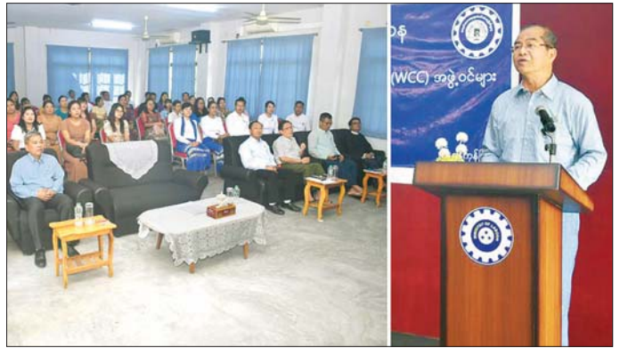
အလုပ်သမားဥပဒေပါ အကျိုးခံစားခွင့်များရရှိစေရေး၊ အလုပ်ရှင်၊ အလုပ်သမား အပြန်အလှန်စေတနာထားကာ ယုံကြည်မှုရှိရှိဆောင်ရွက်ရန် မှာကြားသည်။ ထို့နောက် လှိုင်သာယာ (အနောက်ပိုင်း)မြို့နယ်ရှိ Twinkle Light Fashion Co.,Ltd ၊ Harmony Myanmar Garment Co.,Ltd ၊ Unique HTT Co.,Ltd နှင့် Felghua Clothing Co.,Ltd အထည်ချုပ်စက်ရုံများသို့ သွားရောက်ကြည့်ရှုစစ်ဆေးပြီး လိုအပ်သည်များမှာကြား၍ စက်ရုံအတွင်း လှည့်လည်ကြည့်ရှုအားပေးခဲ့ကြောင်း သိရသည်။ သတင်းစဉ်

ယင်းနောက် ဒုတိယဝန်ကြီးနှင့် တာဝန်ရှိသူများသည် ရွှေလင်ပန်းစက်မှုဇုန်ခန်းမ၌ စက်မှုဇုန်ကော်မတီ တာဝန်ရှိသူများ၊ စက်ရုံ၊ အလုပ်ရုံများမှ အလုပ်ရှင်၊ အလုပ်သမား ကိုယ်စားလှယ်များနှင့် တွေ့ဆုံ၍ လုပ်ငန်းခွင် အေးချမ်းသာယာရေး၊ ကုန်ထုတ်လုပ်မှု တိုးတက်ရေး၊ အလုပ်ရှင်၊ အလုပ်သမားအငြင်းပွားမှု လျော့နည်းကျဆင်းစေရေး၊