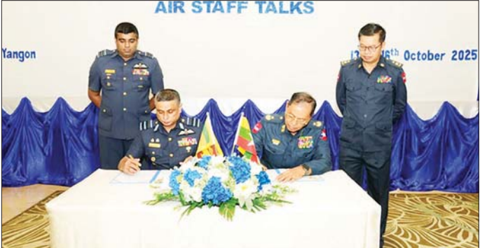
ပြီး အစည်းအဝေး ဆုံးဖြတ်ချက်များအား အတည်ပြု လက်မှတ်ရေးထိုးခဲ့ကြသည်။ (အပေါ်ပုံ) ဆက်လက်၍ နှစ်နိုင်ငံ လေတပ်မှ ကိုယ်စားလှယ်အဖွဲ့ခေါင်းဆောင် များက အထိမ်းအမှတ်လက်ဆောင်များ အပြန်

နေပြည်တော် အောက်တိုဘာ ၁၇ မြန်မာနိုင်ငံက အိမ်ရှင်အဖြစ်ကျင်းပပြုလုပ်သည့် ပထမအကြိမ် မြန်မာ-သီရိလင်္ကာ နှစ်နိုင်ငံ လေတပ် ချင်းတွေ့ဆုံဆွေးနွေးပွဲ (1st Myanmar Air Force-Sri Lanka Air Force Air Staff Talks) ကို အောက်တိုဘာ ၁၄ ရက် နံနက်ပိုင်းတွင် ရန်ကုန်မြို့ရှိ Chatrium Hotel ၌ပြုလုပ်ရာ တပ်မတော်(လေ)မှ ဒုတိယစစ်ဦးစီးအရာရှိချုပ်(လေ)(စက်မှုလက်မှု) ဗိုလ်ချုပ်မျိုးအောင်လတ် ဦးဆောင်သော ကိုယ်စားလှယ်အဖွဲ့ဝင်များ၊ သီရိလင်္ကာလေတပ်မှ Air Vice Marshal SDGM Silva ဦးဆောင်သော ကိုယ်စားလှယ်အဖွဲ့ဝင်များနှင့်တာဝန်ရှိသူများ တက်ရောက်ခဲ့ကြသည်။ ဆွေးနွေးပွဲတွင် နှစ်နိုင်ငံလေတပ်များအကြား ချစ်ကြည်ရင်းနှီးမှုနှင့် ပူးပေါင်းဆောင်ရွက်မှုများ ပိုမိုမြှင့်တင်နိုင်ရန်၊ လေ့ကျင့်ရေး၊ ပညာရေးနှင့် အားကစားကဏ္ဍများတွင် အပြန်အလှန် ထိတွေ့ဆက်ဆံရေးဆောင်ရွက်နိုင်ရန်တို့ကို ဆွေးနွေးခဲ့ကြ