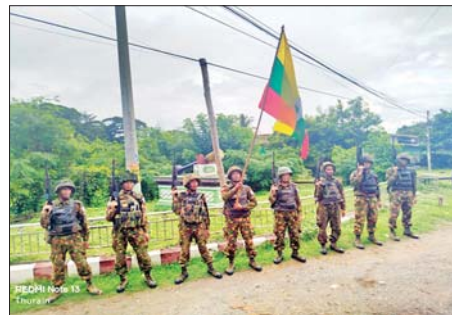
တပ်မတော်စစ်ကြောင်းများက သီပေါမြို့အား ပြန်လည်သိမ်းပိုက်ရရှိခဲ့သည့် မှတ်တမ်းဓာတ်ပုံ။

ခြင်းများ လုပ်ဆောင်ခဲ့သည်။ ထို့ပြင် အကြမ်းဖက်သောင်းကျန်းသူများသည် တပ်မတော်စစ်ကြောင်းများနှင့် တိုက်ပွဲများဖြစ်ပွားစဉ်ကာလအတွင်း ၎င်းတို့ ဆုတ်ခွာထွက်ပြေးရာလမ်းကြောင်း တစ်လျှောက်ရှိ မြန်မာနိုင်ငံ၏ အထင်ကရ အမှတ်အသားနှင့် ကမ္ဘာကျော် ရှေးဟောင်းမီးရထားလမ်းတံတား တစ်စင်းဖြစ်သည့် ဂုတ်ထိပ်တံတား၊ ဂုတ်တွင်းတံတားအပါအဝင် အများပြည်သူ အဓိကသွားလာ အသုံးပြုလျက်ရှိသည့် တံတားကြီး/ငယ်များအား ယုတ်မာ ရိုင်းစိုင်းစွာ မိုင်းထောင်ဖောက်ခွဲဖျက်ဆီးခြင်း၊ လမ်းများပိတ်ဆို့ထားဆီးခြင်းများ လုပ်ဆောင်ခဲ့သဖြင့် တပ်မတော်စစ်ကြောင်းများနှင့် ဌာနဆိုင်ရာတာဝန်ရှိသူများက လူအင်အား၊ စက်ယန္တရားများအသုံးပြု၍ ပြန်လည်ပြုပြင်ခြင်းနှင့် ဖယ်ရှားရင်းလင်းခြင်းလုပ်ငန်းများ ဆောင်ရွက်လျက်ရှိသည်။ ယခုကဲ့သို့ သီပေါမြို့အား တပ်မတော်က ပြန်လည်ထိန်းချုပ်နိုင်ခဲ့သည့်အတွက် ဒေသခံတိုင်းရင်းသားပြည်သူများကလည်း တပ်မတော် စစ်ကြောင်းများကို အောင်သပြေများ၊ ပန်းကုံးများဖြင့် ဝမ်းသာအားရ သောင်းသောင်းဖြူဖြူ ကြိုဆိုခဲ့ကြသည်။ တပ်မတော်စစ်ကြောင်းများ