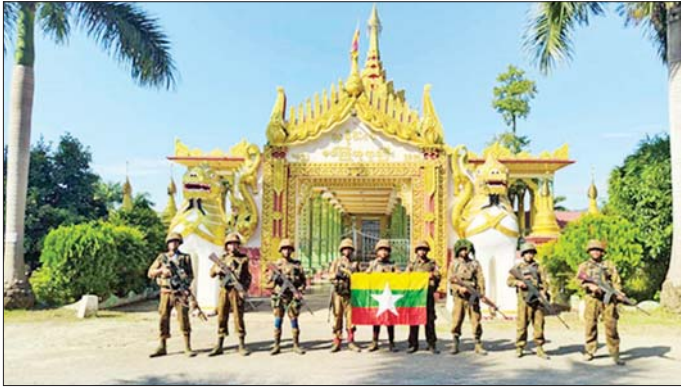
တပ်မတော်စစ်ကြောင်းများက ပေါ်ကြိုတုရားကြီးနေရာတစ်ဝိုက် ပြန်လည်ထိန်းချုပ်ခဲ့မှု မှတ်တမ်းဓာတ်ပုံ။

ကျောဖုံးမှ ထိုသို့ သီပေါမြို့နှင့် ၎င်းဒေသ တစ်ဝိုက်အား ပြန်လည်သိမ်းပိုက် ရရှိရေးအတွက် စစ်ကြောင်းများ ခွဲ၍ ဆောင်ရွက်ခဲ့ရာတွင် ၂၀၂၅ ခုနှစ် အောက်တိုဘာ ၂ ရက်တွင် အကြမ်းဖက်သောင်းကျန်းသူများ ခိုအောင်းလျက်ရှိသည့် ဆိုင်းခေါင်ကျေးရွာ၊ နောင်ပိန်လေးကျေးရွာ၊ ဇောတီကုန်းကျေးရွာ၊ နမ့်ဟူးတောင်(အောက်)၊ နမ့်ဟူးတောင်(အထက်) နှင့် ပန်ဟက်ကျေးရွာ၊ အောက်တိုဘာ ၃ ရက်တွင် ကျောက်မဲကြီးကျေးရွာ၊ အောက်တိုဘာ ၄ ရက်တွင် ခိုတင်ကျေးရွာ၊ ပွိုင့်-၉၄၇ တောင်ကုန်း