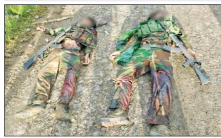
အကြမ်းဖက်သောင်းကျန်းသူများထံမှ သိမ်းပိုက်ရရှိသည့် အလောင်း၊ လက်နက်များ မှတ်တမ်းဓာတ်ပုံ။

ကျေးရွာ၊ အောက်တိုဘာ ၁၆ ရက်တွင် ခါလိမ်ခါလွေကျေးရွာမှ တစ်ဆင့် သီပေါတိုက်တိုအား ပြန်လည်သိမ်းပိုက်နိုင်ခဲ့သည်။ ထိုသို့ အဆင့်ဆင့် နေရာတစ်ခုပြီးတစ်ခု ချိတ်ဆက်ရှင်းလင်းသိမ်းပိုက်စဉ် တပ်မတော်စစ်ကြောင်းများ ကျင်သီကျေးရွာအနီးသို့အရောက်သွားသည့် ကျောက်မဲမြို့နှင့် သီပေါမြို့အကြားရှိ အလျားပေ ၂၀၀ နှင့် အနံ ၂၈ ပေရှိ ရေစီးသန်သည့် နမ့်ပန်စီချောင်းကူးတံတား ဖြစ်သည့် ကျင်သီတံတားအား ယုတ်မာရိုင်းစိုင်းစွာဖြင့် မိုင်းထောင်ဖောက်ခွဲဖျက်ဆီးရန် ပြင်ဆင်