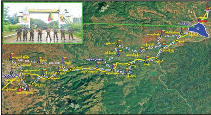
အကြမ်းဖက်သောင်းကျန်းသူများ ယာယီစိုးမိုးထားသည့် သီပေါမြို့အား တပ်မတော်စစ်ကြောင်းများက ပြန်လည်ထိန်းချုပ်ခဲ့မှု မှတ်တမ်းဓာတ်ပုံ။

လျက်ရှိစဉ် တပ်မတော်စစ်ကြောင်းများက အချိန်မီရောက်ရှိသွားသည့်အတွက် တံတားအား အလုံးစုံ မိုင်းခွဲဖျက်ဆီးနိုင်ခြင်းမရှိဘဲ ဖရိုဖရဲဖြင့် ဆုတ်ခွာထွက်ပြေးကာ အချို့အား မိုင်းခွဲဖျက်ဆီးခဲ့သည့် အပြင် လမ်းကြောင်းတစ်လျှောက်တွင်လည်း လမ်းပန်းဆက်သွယ်ရေး အခက်အခဲများ ဖြစ်စေရန်အတွက် မိုင်းများဖြင့် အတားအဆီးများ ပြုလုပ်ခဲ့သည်။ ထို့ကြောင့် တပ်မတော်စစ်ကြောင်းရှိ စစ်မြေပြင်အင်ဂျင်နီယာတပ်ဖွဲ့ဝင်များက အကြမ်းဖက်သောင်းကျန်းသူများ ထောင်ထားသည့် မိုင်းများအား ဒေသခံ တိုင်းရင်းသား ပြည်သူများ အန္တရာယ်မဖြစ်စေရန်အတွက် စနစ်တကျ ဖယ်ရှားရှင်းလင်းခြင်း၊ ပျက်စီးနေသည့် တံတားနေရာများအား သက်ဆိုင်ရာ တာဝန်ရှိသူများနှင့် ပူးပေါင်း၍ ညတွင်းချင်းပြုပြင်ခြင်းလုပ်ငန်းများကို ကြိုးပမ်းဆောင်ရွက်ခဲ့ပြီး ဆုတ်ခွာ ထွက်ပြေးသွားသည့် အကြမ်းဖက်သောင်းကျန်းသူများအား တပ်မတော်စစ်ကြောင်းများက ထပ်ကြပ်လိုက်လံချေမှုန်းခဲ့သည်။ ထို့ပြင် တပ်မတော်စစ်ကြောင်းများ သီပေါမြို့အဝင် Toll Gate သို့ရောက်ရှိစဉ် TNLA အကြမ်းဖက် သောင်းကျန်းသူများသည် သီပေါမြို့အတွင်းရှိ ဌာနဆိုင်ရာ အဆောက်အအုံများနှင့် ပြည်သူပိုင် အဆောက်အအုံများအား မီးရှို့ထွက်ပြေးသွားခဲ့သဖြင့် တပ်မတော်စစ်ကြောင်းက မြို့အတွင်းသို့ အလျင်အမြန် ဝင်ရောက်