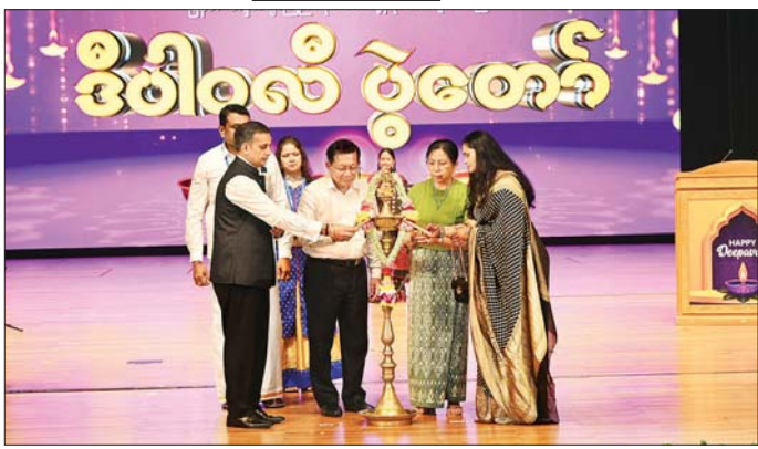
ပြည်ထောင်စုသမ္မတမြန်မာနိုင်ငံတော် ယာယီသမ္မတ နိုင်ငံတော်လုံခြုံရေးနှင့်အေးချမ်းသာယာရေးကော်မရှင် ဥက္ကဋ္ဌ ဗိုလ်ချုပ်မှူးကြီး မင်းအောင်လှိုင်နှင့်ဇနီး ဒေါ်ကြူကြူ၊ မြန်မာနိုင်ငံဆိုင်ရာ အိန္ဒိယနိုင်ငံသံရုံး သံရုံးယာယီ တာဝန်ခံနှင့်ဇနီးတို့က ဒီပဝါလီအထိမ်းအမှတ် ဆီမီးထွန်းညှိပေးကြစဉ်။

သည်ကိုလည်း သိရှိရကြောင်း၊ ယခုကျင်းပသည့် ဒီပဝါလီဓားထွန်းပွဲတော်ကြောင့် မိမိတို့နိုင်ငံတွင် ဖြစ်ပေါ်နေသည့် ပိုမိုကောင်းမွန် တိုးတက်သည့်အခြေအနေကောင်းများ ရရှိခံစားနိုင်မည်ဆိုသည်ကို ယုံကြည်ကြောင်း။ မိမိတို့ မြန်မာနိုင်ငံသည် တိုင်းရင်းသား လူမျိုးပေါင်းစုံနှင့် မတူကွဲပြားသည့် ဘာသာရေး ဆိုင်ရာ ယုံကြည်ကိုးကွယ်မှုမျိုးစုံ စုပေါင်းတည်ရှိသည့် နိုင်ငံဖြစ်ကြောင်း၊ နိုင်ငံတော်အတွင်း ဖွဲ့တင်းနေထိုင်ကြသူများ၏ ဘာသာရေး ဆိုင်ရာ ယုံကြည်ကိုးကွယ်မှုနှင့် ပတ်သက်ပြီး တူညီသည့်အခွင့်အရေးများနှင့် လွတ်လပ်စွာ ယုံကြည်ကိုးကွယ်ခွင့်ကို ဖွဲ့စည်းပုံ