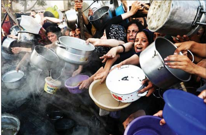
အကူအညီရရှိနေသည့် လူပေါင်း ၁၃ ဒသမ ၇ သန်းမှာ စားနပ်ရိက္ခာအစီအစဉ် (ဒေလျူအက်စ်ပီ) က အလွန် ဆိုးရွားသည့် ဆာလောင်မှုဘေးအန္တရာယ်သို့ အောက်တိုဘာ ၁၅ ရက် ထုတ်ပြန်ချက်၌ သတိရောက်ရှိ သွားနိုင်သည်ဟု ကုလသမဂ္ဂ ကမ္ဘာ့ပေးထားသည်။ ဆင်ဟွာ

လေ့ရှိသော ကမ္ဘာ့စားနပ်ရိက္ခာနေ့အတွက် ၎င်း၏ သဝဏ်လွှာတွင် ထည့်သွင်းပြောကြားခဲ့သည်။ အလွန်မြင့်မားသည့် စားရေရိက္ခာမလုံမှုကို မြှမ်းခြောက်နေသည့် ရာသီဥတုဖောက်ပြန်ခြင်းလဲလှဲမှုများအထိ ဆယ်စုနှစ်များစွာအတွင်း စိန်ခေါ်မှုအသစ်များ ပေါ်ပေါက်လာခဲ့ကြောင်း၊ ဆာလောင်မှုကို လက်နက်တစ်ခုအဖြစ် အသုံးပြုနေကြောင်း ဂူတာရက်စ်က ပြောသည်။ ပြည်သူများကို အာဟာရဖြည့်တင်းပြီး ကမ္ဘာပေါ်တွင် ကာကွယ်ပေးနိုင်မည့် စားရေရိက္ခာစနစ်များ တည်ဆောက်ရန် တစ်ဖန်ပြန်လည်စုစည်းညီညွတ်ကြရေးနှင့် ပတ်သက်ပြီး ဂူတာရက်စ်က နိုင်ငံတကာအသိုင်းအဝိုင်းကို တောင်းဆိုထားသည်။ ကမ္ဘာ့စားနပ်ရိက္ခာအဖွဲ့၏စားနပ်ရိက္ခာထောက်ပံ့ကူညီမှုများကို ဖြတ်တောက်မည်ဆိုပါက လက်ရှိ