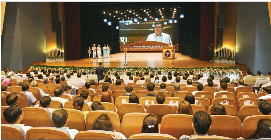
ပြည်ထောင်စုသမ္မတမြန်မာနိုင်ငံတော် ယာယီသမ္မတ နိုင်ငံတော်လုံခြုံရေးနှင့် အေးချမ်းသာယာရေးကော်မရှင်ဥက္ကဋ္ဌ ဗိုလ်ချုပ်မှူးကြီး မင်းအောင်လှိုင် ဒီပဝါလီအထိမ်းအမှတ် အခမ်းအနားတွင် ဆုမွန်တောင်းစကားပြောကြားစဉ်။

ထို့နောက် နိုင်ငံတော်ယာယီ သမ္မတ နိုင်ငံတော်လုံခြုံရေးနှင့် အေးချမ်းသာယာရေးကော်မရှင် ဥက္ကဋ္ဌက ဟိန္ဒူရိုးရာ ဒီပဝါလီ အထိမ်းအမှတ် အခမ်းအနားသို့ တက်ရောက် ချီးမြှင့်ခြင်းနှင့် ပတ်သက်၍ ပြောကြားရာတွင် ဒီပဝါလီပွဲတော်သည် ဟိန္ဒူ ဘာသာဝင်များ အထွတ်အမြတ် ထားသည့် ရိုးရာဓားထွန်းပွဲတော် ဖြစ်ကြောင်း၊ “ဒီပ” ဆိုသည့် စီး အလင်းရောင်နှင့် “အဝါလီ” ဆိုသည့် စိတန်းခြင်းဆိုသည့် အဓိပ္ပာယ်တို့ကို ပေါင်းစပ်ထားခြင်းဖြစ်သည့်အတွက် ဒီပဝါလီဆိုသည့်မှာ ဆီမီးအလင်းရောင်များဖြင့် စိတန်းထွန်းညှိပူဇော်ခြင်းဟု အဓိပ္ပာယ်ရသည်ဟု သိရှိရကြောင်း၊ ဒီပဝါလီပွဲတော်စတင် ဖြစ်ပေါ်ခဲ့သည့် နောက်ခံသမိုင်းကြောင်းအနေဖြင့် ရာမမင်းမြတ်သည် ရာဝဏဟုခေါ်သည့် ဒဿဂီရိမင်းကို နှိမ်နင်းပြီး စစ်ပွဲမှန်သမျှ ဘယ်သောအခါမှ အနီးမရှိသည့် အယုဒ္ဓဟု နေပြည်တော်ကို ပြန်လည်ဝင်ရောက်လာသည့် အချိန်သည် သီတင်းကျွတ်လကွယ် မှောင်မိုက်နေသည့် ညအချိန်အခါဖြစ်သဖြင့် ဆီမီးများထွန်းညှိပြီး ရာမမင်းမြတ်ကို ဆီမီးအလင်းရောင်ဖြင့် ကြိုဆိုပူဇော်ကြရာမှ ဒီပဝါလီပွဲတော် စတင်ခြင်းဖြစ်သည်ဟု လေ့လာသိရှိရကြောင်း။