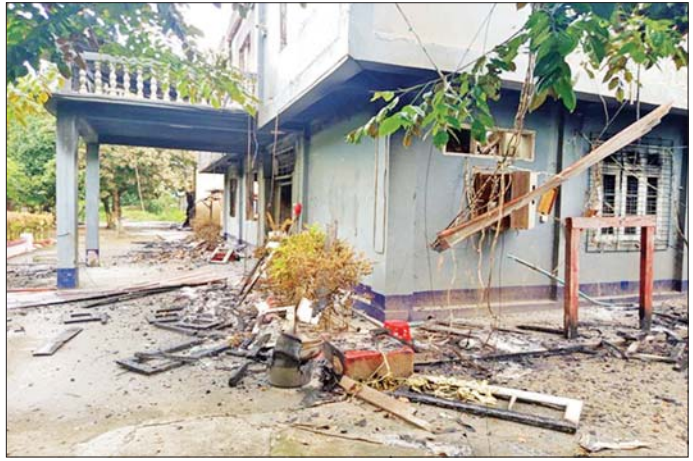
အကြမ်းဖက်သောင်းကျန်းသူများက သီပေါမြို့ရှိ ရုံး/ဌာနအဆောက်အအုံများအား စီးနှိုက်ဖျက်ဆီးခဲ့သည့် မှတ်တမ်းဓာတ်ပုံ။