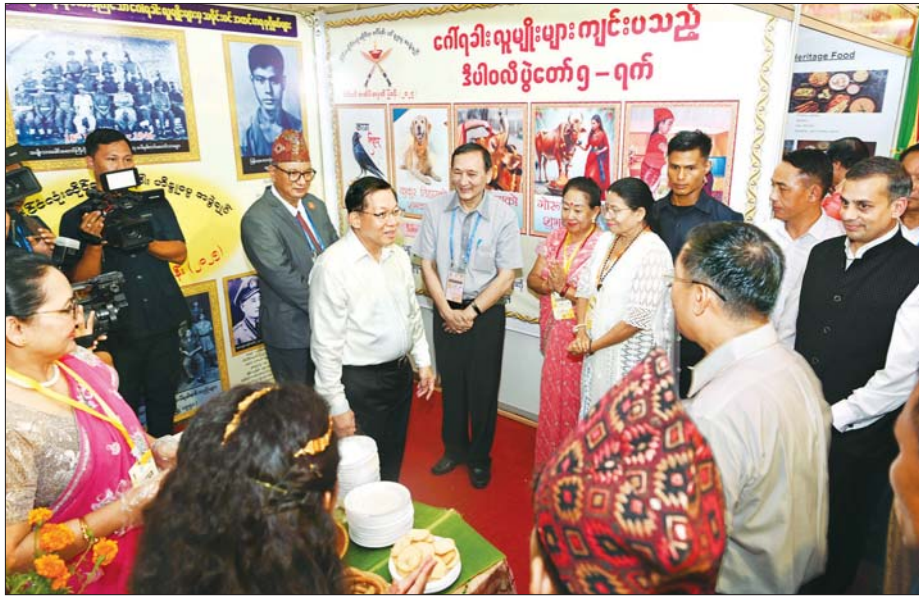
ပြည်ထောင်စုသမ္မတမြန်မာနိုင်ငံတော် ယာယီသမ္မတ နိုင်ငံတော်လုံခြုံရေးနှင့် အေးချမ်းသာယာရေးကော်မရှင်ဥက္ကဋ္ဌ ဗိုလ်ချုပ်မှူးကြီး မင်းအောင်လှိုင် မြန်မာ-အိန္ဒိယ နှစ်နိုင်ငံ ချစ်ကြည်ရေးပြခန်းများ၊ စီးပွားရေးလုပ်ငန်းပြခန်းများနှင့် မျိုးနွယ်စုများ၏ ပြခန်းများအား လှည့်လည်ကြည့်ရှုစဉ်။

အခြေခံဥပဒေနှင့်အညီ ဖွင့်ပြပေးထားပြီးဖြစ်ကြောင်း၊ ထို့ကြောင့် မိမိတို့ ကိုးကွယ်ယုံကြည်ရာ ဘာသာတရားအလျောက် ဘာသာရေးပွဲတော်များကိုလည်း အနှစ်သာရရှိရှိ ကျင်းပဆောင်ရွက်သွားကြရန် လွန်စွာအရေးကြီးကြောင်း။