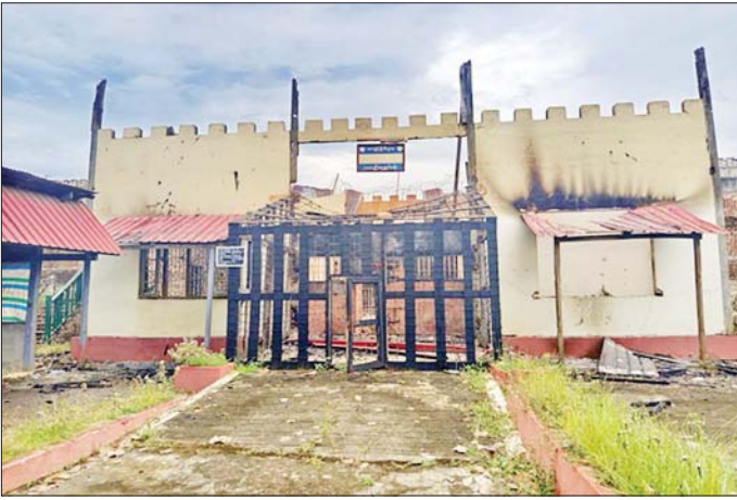
အကြမ်းဖက်သောင်းကျန်းသူများက သီပေါမြို့ရှိ အကျဉ်းထောင်အား စီးနှိုက်ဖျက်ဆီးခဲ့သည့် မှတ်တမ်းဓာတ်ပုံ။

လွင်-နောင်ချို-ကျောက်မဲ-သီပေါ ပြည်ထောင်စု လမ်းမကြီး လုပ်ဆောင်နိုင်တော့မည်ဖြစ်သည့် တစ်လျှောက် ကုန်စည်ကူးသန်းအတွက် ပြည်သူများက ဝမ်းမြောက်ရေးနှင့် လမ်းပန်းဆက်သွယ်ရေးလျက်ရှိကြောင်း သိရသည်။ များ ပြန်လည်ကောင်းမွန်၍ ဒေသ သတင်းစဉ်