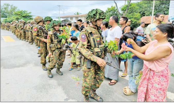
အောင်ပွဲရ တပ်မတော်သားများအား သီပေါမြို့ရှိ ဒေသခံတိုင်းရင်းသားပြည်သူများက သောင်းသောင်းဖြူဖြူဆိုနေသည့် မှတ်တမ်းဓာတ်ပုံ။