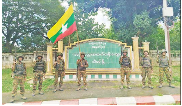
တပ်မတော်စစ်ကြောင်းများက သီပေါမြို့ရှိ အခြေခံပညာအထက်တန်းကျောင်းအား ပြန်လည်သိမ်းပိုက်ရရှိခဲ့သည့် မှတ်တမ်းဓာတ်ပုံ။