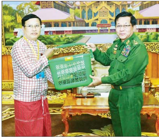
နိုင်ငံတော်လုံခြုံရေးနှင့်အေးချမ်းသာယာရေးကော်မရှင်ဥက္ကဋ္ဌ တပ်မတော်ကာကွယ်ရေးဦးစီးချုပ် ဗိုလ်ချုပ်မှူးကြီး မင်းအောင်လှိုင် တိုင်းရင်းသားလက်နက်ကိုင်ကိုယ်စားလှယ်များအား အမှတ်တရလက်ဆောင်ပစ္စည်းများပေးအပ်စဉ်။