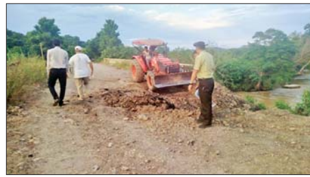
အကြမ်းဖက်သောင်းကျန်းသူများ ဖောက်ခွဲဖျက်ဆီးခဲ့သည့် ကျင်သီတံတားအား တာဝန်ရှိသူများက ပြန်လည်ပြုပြင်ခြင်းလုပ်ငန်းများ ဆောင်ရွက်နေမှု မှတ်တမ်းဓာတ်ပုံ။