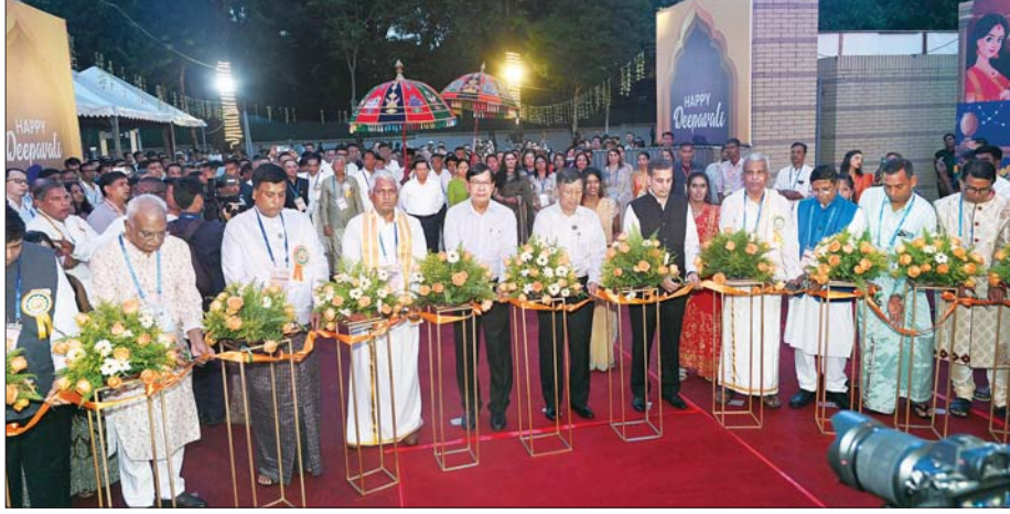
ရန်ကုန်တိုင်းဒေသကြီးဝန်ကြီးချုပ် ဦးစိုးသိန်း၊ မြန်မာနိုင်ငံဆိုင်ရာ အိန္ဒိယနိုင်ငံသံရုံးမှ သံရုံးယာယီတာဝန်ခံနှင့် တာဝန်ရှိသူများ၊ ဟိန္ဒူမျိုးနွယ် စုဝင်များက ဟိန္ဒူရိုးရာ ဒီပဲလီအထိမ်းအမှတ်အခမ်းအနား မင်္ဂလာမုန့်ဦးကို ဖဲကြိုဖြတ်ဖွင့်လှစ်ပေးကြစဉ်။

နှင့် အေးချမ်းသာယာရေးကော်မရှင် ဥက္ကဋ္ဌက ဒီပဲလီအထိမ်းအမှတ် အခမ်းအနားကို စက်ခလုတ်နှိပ် ဖွင့်လှစ်ပေးပြီး တက်ရောက်လာ ကြသူများနှင့်အတူ စုပေါင်းမှတ် တမ်းတင်ဓာတ်ပုံရိုက်သည်။ ယင်းနောက် နိုင်ငံတော် ယာယီသမ္မတ နိုင်ငံတော်လုံခြုံရေး နှင့် အေးချမ်းသာယာရေး ကော်မရှင်ဥက္ကဋ္ဌနှင့်ဇနီး၊ အဖွဲ့ဝင် များသည် မြန်မာ-အိန္ဒိယ နှစ်နိုင်ငံ ချစ်ကြည်ရေးပြခန်းများ၊ စီးပွားရေး လုပ်ငန်းပြခန်းများနှင့် မျိုးနွယ်စု များ၏ ပြခန်းများအား ပြခန်း တစ်ခုချင်းစီအလိုက် လှည့်လည် ကြည့်ရှုကြသည်။ ဒီပဲလီအထိမ်းအမှတ် ဆီမီးထွန်းညှိပေး ထိုနောက် အခမ်းအနားအစီ အစဉ်အတိုင်းကို ပြတော်ခန်းမ ၌ ကျင်းပပြုလုပ်ရာ နိုင်ငံတော် ယာယီသမ္မတ နိုင်ငံတော်လုံခြုံရေး နှင့် အေးချမ်းသာယာရေး ကော်မရှင်ဥက္ကဋ္ဌနှင့် ဇနီး၊ မြန်မာ နိုင်ငံဆိုင်ရာ အိန္ဒိယနိုင်ငံသံရုံး သံရုံး ယာယီတာဝန်ခံနှင့် ဇနီး၊ တာဝန်ရှိသူများက ဒီပဲလီအထိမ်း အမှတ်ဆီမီးထွန်းညှိပေးကြသည်။