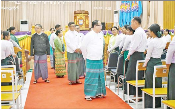
ကထိကများနှင့် ဆရာ ဆရာမများက ပြည်နယ် ရက်နှင့် ၁၉ ရက် နှစ်ရက်တာ ဆွေးနွေးပွဲချသွားမည် အတွင်းရှိ သိပ္ပံဘာသာတွဲ အထက်တန်းဆင့်သင် ဖြစ်ကြောင်း သိရသည်။ ဆရာ ဆရာမ ၄၉ ဦးတို့အား အောက်တိုဘာ ၁၈ စောမျိုးမင်းသိန်း(ပြန်/ဆက်)

သည့်အတွက် ယခုသင်တန်းတွင် ကြိုးစားလေ့လာကြ စေလိုကြောင်း တိုက်တွန်းပြောကြားသည်။ ထို့နောက် ဘားအံတက္ကသိုလ်ပါမောက္ခချုပ်က သင်တန်းပို့ချနိုင်ရေး စီစဉ်ဆောင်ရွက်ထားရှိမှုများကို ရှင်းလင်းတင်ပြပြီး ပြည်နယ်ပညာရေးမှူးရုံးမှ ညွှန်ကြားရေးမှူးချုပ်က ဆရာ ဆရာမများ ဆွေးနွေးပွဲ တက်ရောက်နိုင်ရေး စီစဉ်ဆောင်ရွက်ထားရှိမှုများကို ရှင်းလင်းတင်ပြသည်။ ယင်းနောက် ပြည်နယ်ဝန်ကြီးချုပ်နှင့် တာဝန်ရှိ သူများက တက်ရောက်လာသော ဆရာ ဆရာမများ အား ရင်းနှီးနှေးထွေးစွာ တွေ့ဆုံအားပေးစကား ပြောကြားသည်။ အဆိုပါသင်တန်းတွင် သက်ဆိုင်ရာ ဘာသာရပ် များအလိုက် ဘားအံတက္ကသိုလ်ပါမောက္ခဌာနမှူးများ