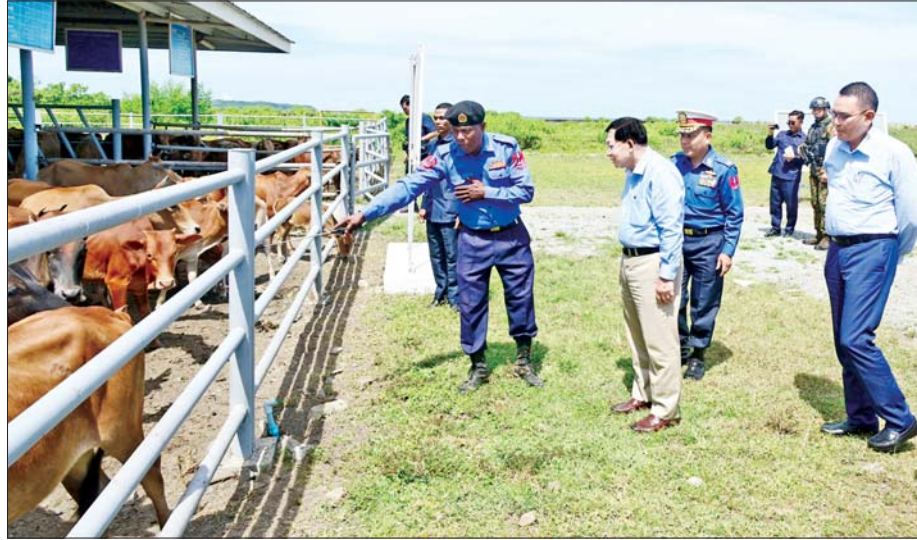
နိုင်ငံတော်လုံခြုံရေးနှင့် အေးချမ်းသာယာရေးကော်မရှင်ဥက္ကဋ္ဌ တပ်မတော်ကာကွယ်ရေးဦးစီးချုပ် ဗိုလ်ချုပ်မှူးကြီးမင်းအောင်လှိုင် ကိုကိုးကျွန်းတပ်နယ်ရှိ ရွာအေးမြေအတွင်း ဒေသနွားများ မွေးမြူထားရှိမှုများကို ကြည့်ရှုစစ်ဆေးစဉ်။

နှင့် အေးချမ်းသာယာရေးကော်မရှင်ဥက္ကဋ္ဌ တပ်မတော်ကာကွယ်ရေးဦးစီးချုပ်နှင့် အဖွဲ့ဝင်များသည် ကျွန်းပတ်လမ်းတစ်လျှောက် မော်တော်ယာဉ်များဖြင့် လှည့်လည်ကြည့်ရှုကြပြီး ဖျိုင်းကျွန်းနှင့် ဂျယ်ရီကျွန်းဆက်လမ်း ဆောင်ရွက်ထားမှုအခြေအနေများကို ကြည့်ရှုစစ်ဆေးပြီး တာဝန်ရှိသူများ၏ တင်ပြချက်များအပေါ် ကိုကိုးကျွန်းပေါ်ရှိ မြေလွတ်နေရာများ၌ မျိုးကောင်းသည့် အုန်းပင်များကို စနစ်တကျဖြင့် အကွက်ချစိုက်ပျိုးရန်၊ စိုက်ပျိုးရေးလုပ်ငန်းများ ဆောင်ရွက်နိုင်ရန်အတွက်ပင်လယ်ရေမှ စိုက်ပျိုးရေထုတ်ယူသုံးစွဲနိုင်ရေး သုတေသနပြုဆောင်ရွက်ရန်နှင့် အခြားလိုအပ်သည်များကို လမ်းညွှန်မှာကြားသည်။