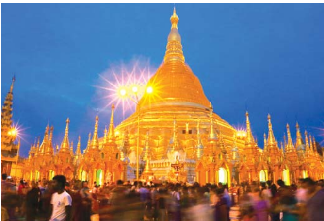
ရန်ကုန်မြို့ သီရိတ္ထရကုန်းတော်ပေါ်တွင် တည်ထားကိုးကွယ်ထားသည့် ရွှေတိဂုံစေတီတော်မြတ်ကြီးကို ဖူးတွေ့ရစဉ်။

ခရီးသွားကဏ္ဍကို စဉ်ဆက်မပြတ် ဖော်ဆောင်ရာတွင် အထောက်အကူပြုမည့် သဘာဝပတ်ဝန်းကျင်ထိန်းသိမ်းခြင်း၊ ဂေဟစနစ်နှင့် သဟဇာတဖြစ်သော ခရီးသွားလုပ်ငန်းများ သဘာဝအလှတရားများ၊ ပင်လယ်ကမ်းခြေတောတောင်များ၊ ဖျောက်စီးစေရန် ဂရုစိုက်ခြင်း၊ စွန့်ပစ်ပစ္စည်းများ လျှော့ချခြင်း၊ ပြန်လည်အသုံးပြုခြင်း၊ စွမ်းအင်သုံးစွဲမှုကို လျှော့ချစေရန် စွမ်းအင်ချွေတာသော ဟိုတယ်များ၊ လေ့လာရေးစင်တာများတည်ဆောက်ခြင်း၊ နေရောင်ခြည်၊ လေစွမ်းအင်ကဲ့သို့သော စွမ်းအင်များ အသုံးပြုခြင်း၊ အပြင် ဒေသခံများ၏ လူမှုစီးပွားဘဝမြှင့်တင်ခြင်း၊ ဒေသခံများနှင့် ပူးပေါင်းဆောင်ရွက်ခြင်း၊ ဒေသခံတို့၏လုပ်ငန်းများ (ဥပမာ-လက်မှုပစ္စည်း၊ ဒေသအစားအစာ) ကို ခရီးသွားလုပ်ငန်းနှင့် ချိတ်ဆက်ပေးခြင်း၊ ဒေသခံများအား အလုပ်အကိုင် အခွင့်အလမ်း ဖန်တီးပေးခြင်း၊ ယဉ်ကျေးမှုကိုထိန်းသိမ်းခြင်း၊ ဒေသရိုးရာဓလေ့၊ ရှေးဟောင်းအမွေအနှစ်များကိုသတ်မှတ်ခြင်း၊ ထိန်းသိမ်းခြင်းတို့ ပါဝင်ပါသည်။