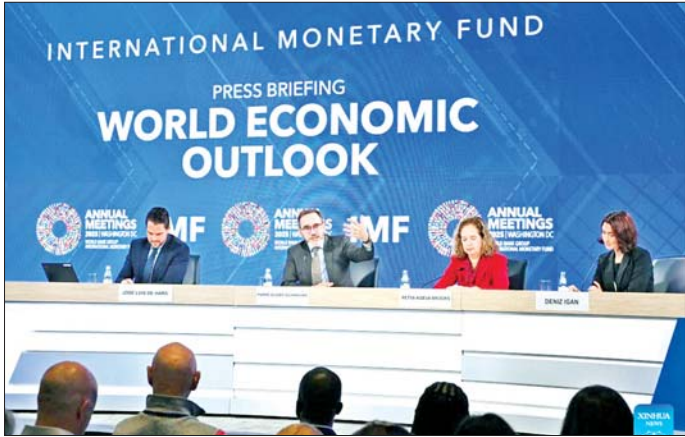
စီမံခန့်ခွဲမှုများကို ဖြည့်ဆည်းပေးမည်ဖြစ်ကြောင်း သည်။ ကိုးကား - ဆင်ဟွာ နိုင်ငံတကာငွေကြေးရန်ပုံငွေအဖွဲ့က အကြံပြုထား ကိုးကား - ဆင်ဟွာ ဘာသာပြန် - အောင်ကျော်ကျော်

အမေရိကန်၏ အခွန်စည်းကြပ်မှုနှင့် ပတ်သက်ပြီး ယခုအချိန်အထိ မျှော်လင့်ထားသည်ထက် အကျိုးသက်ရောက်မှု ပိုမိုနည်းပါးကြောင်း နိုင်ငံတကာ ငွေကြေးရန်ပုံငွေအဖွဲ့မှ စီးပွားရေးပညာရှင် ပီရီ-အိုလီဗီယာ ဂျီရန်ချာစ်က ပြောကြားခဲ့သည်။ လာမည့် ၂၀၂၆ ခုနှစ်တွင် ကမ္ဘာ့စီးပွားရေးတိုးတက်မှုနှုန်းသည် ၃ ဒသမ ၁ ရာခိုင်နှုန်းတိုးတက်မည်ဖြစ်ကြောင်း နိုင်ငံတကာငွေကြေးရန်ပုံငွေအဖွဲ့၏ စီးပွားရေးခန့်မှန်းသုံးသပ်ချက်အစီရင်ခံစာတွင် ခန့်မှန်းဖော်ပြထားသည်။ စီးပွားရေးဆိုင်ရာမူဝါဒမသေချာမရေရာမှုများကို ဖြေရှင်းခြင်း၊ ဉာဏ်ရည်တူနည်းပညာဖြင့် စုစည်းပေါင်း ထုတ်လုပ်မှုစွမ်းအားကို မြှင့်တင်ခြင်းနှင့် ပူးပေါင်းဆောင်ရွက်မှုကို မြှင့်တင်ပေးသည့် လက်တွေ့ကျပြီး လိုက်လျောညီထွေမှုရှိသော နိုင်ငံစုံစနစ်တစ်ခုကို ထူထောင်ခြင်းသည် ကမ္ဘာ့စီးပွားရေးဆိုင်ရာ