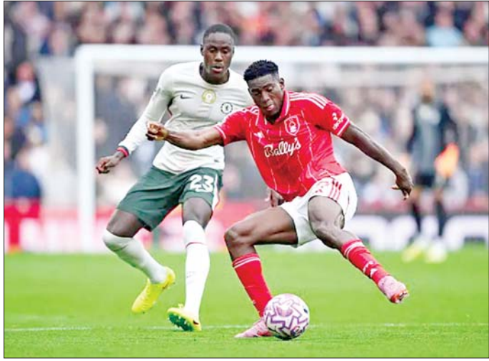
နော်တင်ဟမ်ဖော့ရက်စ်အသင်းနှင့် ချယ်လ်ဆီးအသင်းတို့ ယှဉ်ပြိုင်ကစားကြစဉ်။

အဲဒီပွဲစဉ်မှာ ချယ်လ်ဆီးအသင်းဟာ နော်တင်ဟမ်ဖော့ရက်စ်အသင်းကို သုံးဂိုးပြတ်ဖြင့် အနိုင်ရရှိခဲ့တာဖြစ်ပြီး ချယ်လ်ဆီးအသင်းအတွက် သွင်းဂိုးတွေကို ဒုတိယပိုင်းပွဲကစားချိန် ၄၉ မိနစ်မှာ အက်ချန်ပွန်းက တစ်ဂိုး၊ ၅၂ မိနစ်မှာ ပက်ဒရိုနီတိုးနဲ့ ၈၄ မိနစ်မှာ စာမျက်နှာ ၁၄ ကော်လံ ၁ သို့