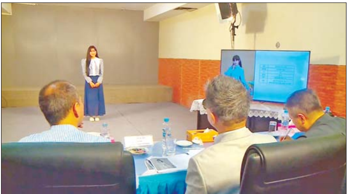
၂၀၂၅ ခုနှစ် နိုဝင်ဘာလနှင့် ဒီဇင်ဘာလတွင် အပြန်အလှန်သွားရောက်ကာ ပူးပေါင်းရိုက်ကူးကြမည်ဖြစ်သည်။ ထို့ပြင် Sports Game ရုပ်သံအစီအစဉ်တွင် ပါဝင်မည့် သရုပ်ဆောင်အဖွဲ့ကိုလည်း တစ်ပါးတည်း

ရန်ကုန် အောက်တိုဘာ ၁၈ ကိုရီးယား-မြန်မာ ပူးပေါင်းရိုက်ကူးထုတ်လုပ်မည့် လူငယ်ဒရာမာ ရုပ်သံဇာတ်လမ်းတွဲနှင့် အားကစားအစီအစဉ် (All PASS DRAMA & Sports Game) တို့အတွက် သရုပ်ဆောင်ရွေးချယ်ပွဲကို ရန်ကုန်မြို့၊ ပြည်လမ်းရှိ မြန်မာအသံနှင့်ရုပ်မြင်သံကြားတွင် ယနေ့နံနက်ပိုင်းနှင့် မွန်းလွဲပိုင်းတို့က နှစ်ကြိမ်ခွဲ၍ ကျင်းပရာ မြန်မာနိုင်ငံမှ အသက် ၁၈ နှစ်မှ ၃၀ နှစ် အကြား ရွှေကြေးအနုပညာရှင် သရုပ်ဆောင်များ၊ တက္ကသိုလ်ကျောင်းသား ကျောင်းသူများ၊ စိတ်ပါဝင်စားသူ လူငယ်များ ပါဝင်ယှဉ်ပြိုင်ကြသည်။ အဆိုပါ ဇာတ်လမ်းတွဲအား ကိုရီးယား-မြန်မာ နှစ်နိုင်ငံ ယှဉ်ကျေးမှုဖလှယ်နိုင်ရန် နှစ်နိုင်ငံတို့မှ လူငယ်ပရိသတ်များ အရည်အချင်း တိုးတက်လာစေရန်နှင့် စိတ်ခွန်အားပေးရန် ရည်ရွယ်ချက်တို့ဖြင့် ကိုရီးယားနှင့် မြန်မာနိုင်ငံတို့မှ လူငယ်သရုပ်ဆောင်များကို အဓိကသရုပ်ဆောင်နှင့် ဇာတ်ပို့/ဇာတ်ရန်များ ခွဲခြား၍ စိစစ်ရွေးချယ်ကြမည်ဖြစ်ပြီး ရုပ်သံဇာတ်လမ်းတွဲအား ကိုရီးယားနှင့် မြန်မာနိုင်ငံတို့တွင်