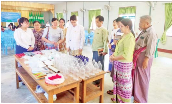
နည်းပြများ၊ ကျိုက်မရောမြို့နယ် အဆိုပါ သင်တန်းကို အောက်တိုဘာ ၁၈ ရက်မှ ၂၂ ရက် အထိ ငါးရက်ကြာ စာတွေ့ လက်တွေ့ သင်ကြားပို့ချပေးမည် ဖြစ်ပြီး သင်တန်းသား သင်တန်း သူ စုစုပေါင်း ၂၀ တက်ရောက် သင်ကြားမည်ဖြစ်ကြောင်း သိရ သည်။ ကျိုက်မရော(ပြန်/ဆက်)

မော်လမြိုင် အောက်တိုဘာ ၁၈ တိုင်းရင်းသားလူမျိုးများရေးရာ ဝန်ကြီးဌာန တိုင်းရင်းသားအခွင့် အရေးများ ကာကွယ်စောင့်ရှောက် ရေးဦးစီးဌာန မွန်ပြည်နယ် ညွှန်ကြားရေးမှူးရုံးမှ မွန်ပြည်နယ် အတွင်းရှိ တိုင်းရင်းသားလူမျိုးများ ၏ လူမှုစီးပွားဘဝဖွံ့ဖြိုးတိုးတက် စေရန် ရည်ရွယ်၍ လူသုံးကုန် ပစ္စည်းထုတ်လုပ်မှု နည်းပညာ သင်တန်းဖွင့်ပွဲ အခမ်းအနားကို ယနေ့နံနက်ပိုင်းက ကျိုက်မရော မြို့နယ် ပိန္နဲကုန်းကျေးရွာ ပိန္နဲကုန်း အထက်၌ ကျင်းပရာ မွန်ပြည်နယ် တိုင်းရင်းသားရေးရာ ဝန်ကြီး ဦးခင်မောင်ဦး၊ မွန်ပြည်နယ် တိုင်းရင်းသား အခွင့်အရေးများ ကာကွယ်စောင့်ရှောက်ရေး ဦးစီး ဌာနမှ ညွှန်ကြားရေးမှူးနှင့် ဝန်ထမ်းများ၊ တိုင်းရင်းသားစာပေ နှင့် ယဉ်ကျေးမှုဦးစီးဌာနမှ ဝန်ထမ်းများ၊ အသေးစားစက်မှု လက်မှုလုပ်ငန်း ဦးစီးဌာနမှ ညွှန်ကြားရေးမှူးနှင့် သင်တန်း