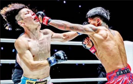
အောက်ချင်းလေးနှင့် တာနစ်ဆု ယှဉ်ပြိုင်ထိုးသတ်စဉ်။