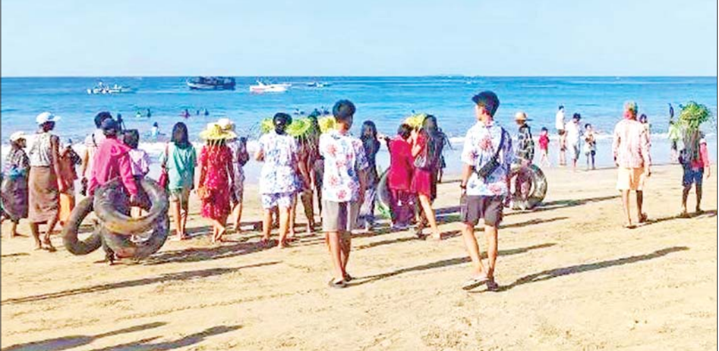
ငွေဆောင်ကမ်းခြေသို့ သီတင်းကျွတ်ပိတ်ရက်ကာလ၌ ခရီးသွားများ အပန်းဖြေဝင်ရောက်ခဲ့စဉ်။