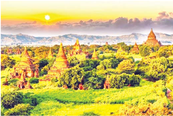
သမိုင်းဝင်ရှေးဟောင်းယဉ်ကျေးမှုအမွေအနှစ်များဖြင့် ပြည့်နှက်ကာ ခရီးသွားပြည်သူများ လည်ပတ် ချင်စရာ ပုဂံရှေးဟောင်းယဉ်ကျေးမှုနယ်မြေ။

မြန်မာနိုင်ငံသည် ခရီးသွားလုပ်ငန်းလုပ်ကိုင်ဆောင်ရွက်ရန်အတွက် အရင်းအမြစ်များစွာ ပိုင်ဆိုင်ထားပြီး မတူကွဲပြားခြားနားသည့် ယဉ်ကျေးမှုများနှင့် တိုင်းရင်းသားလူမျိုးစုပေါင်း ၁၀၀ ကျော် ပေါင်းစည်းနေထိုင်ကြသော နိုင်ငံဖြစ်ပါသည်။ အရှေ့တောင်အာရှဒေသတွင် မဟာဗျူဟာမြောက် တည်ရှိပြီး မပျက်စီးသေးသည့် ကမ်းခြေခရီးစဉ်ဒေသများရှိခြင်း၊ မြင့်မားသည့်တောင်တန်းများရှိခြင်း၊ ကျွန်းစုများနှင့် မြေဩဇာကောင်းသည့်လွင်ပြင်များ ကြွယ်ဝသည့်နိုင်ငံဖြစ်ခြင်း၊ ထို့ပြင် ထူးခြားသည့် သဘာဝအလှအပများ၊ သမိုင်းဝင်ရှေးဟောင်း ယဉ်ကျေးမှုအမွေအနှစ်များ၊ ချစ်ကြည်ရင်းနှီးစွာ နေထိုင်ကြသည့် တိုင်းရင်းသားလူမျိုးများ၏ ရိုးရာ ယဉ်ကျေးမှုစေလေ့များနှင့် လူနေမှုဘဝပုံစံများသည် ကမ္ဘာလှည့်ခရီးသွားစဉ်သည်များကို ပိုမိုလာရောက် လည်ပတ်ကြရန် ဆွဲဆောင်နိုင်သည့်ပုံရိပ်များ အများအပြားရှိပါသည်။