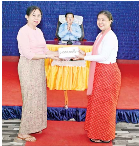
နိုင်ငံတော်လုံခြုံရေးနှင့် အေးချမ်းသာယာရေးကော်မရှင်ဥက္ကဋ္ဌ တပ်မတော်ကာကွယ်ရေးဦးစီးချုပ် ဗိုလ်ချုပ်မှူးကြီးမင်းအောင်လှိုင်၏ဇနီး ဒေါ်ကြာကြာလှက မိခင်နှင့်ကလေးစောင့်ရှောက်ရေးအသင်း ရန်ပုံငွေများကို ပေးအပ်ရာ ရေတပ်ဌာနချုပ်မှူး၏ ဇနီးက လက်ခံရယူစဉ်။

နှင့် အေးချမ်းသာယာရေးကော်မရှင်ဥက္ကဋ္ဌ တပ်မတော်ကာကွယ်ရေးဦးစီးချုပ်နှင့် အဖွဲ့ဝင်များသည် ကျွန်းပတ်လမ်းတစ်လျှောက် မော်တော်ယာဉ်များဖြင့် လှည့်လည်ကြည့်ရှုကြပြီး ဖျိုင်းကျွန်းနှင့် ဂျယ်ရီကျွန်းဆက်လမ်း ဆောင်ရွက်ထားမှုအခြေအနေများကို ကြည့်ရှုစစ်ဆေးပြီး တာဝန်ရှိသူများ၏ တင်ပြချက်များအပေါ် ကိုကိုးကျွန်းပေါ်ရှိ မြေလွတ်နေရာများ၌ မျိုးကောင်းသည့် အုန်းပင်များကို စနစ်တကျဖြင့် အကွက်ချစိုက်ပျိုးရန်၊ စိုက်ပျိုးရေးလုပ်ငန်းများ ဆောင်ရွက်နိုင်ရန်အတွက်ပင်လယ်ရေမှ စိုက်ပျိုးရေထုတ်ယူသုံးစွဲနိုင်ရေး သုတေသနပြုဆောင်ရွက်ရန်နှင့် အခြားလိုအပ်သည်များကို လမ်းညွှန်မှာကြားသည်။