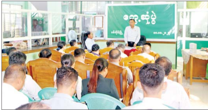
ဆိုင်ရာကိစ္စရပ်များနှင့်စပ်လျဉ်း၍ ပြည်သူ့ကို လုပ်ငန်းများကို ဆောင်ရွက်ပေးနေသည့်ဝန်ကြီးဌာန ဝန်ဆောင်မှုပေးနေသော ပြည်သူ့ဝန်ဆောင်မှု တစ်ခုဖြစ်ကြောင်း။

နေပြည်တော် အောက်တိုဘာ ၁၈ ငလျင်ဘေးဒဏ်ကြောင့် ပျက်စီးမှုဖြစ်ပေါ်ခဲ့သည့် စစ်ကိုင်းမြို့ရှိ ဘဏ္ဍာရေးနှင့် အခွန်ဝန်ကြီးဌာန အောက်ရှိ ရုံးအဆောက်အအုံများ ပြင်ဆင်ဆောင်ရွက်နေမှုနှင့် ရုံးလုပ်ငန်းများဆောင်ရွက်နေမှုကို ယနေ့ မွန်းလွဲပိုင်းတွင် ဘဏ္ဍာရေးနှင့် အခွန်ဝန်ကြီးဌာန ပြည်ထောင်စုဝန်ကြီး ဒေါက်တာကံဇော်သည် စစ်ကိုင်းတိုင်းဒေသကြီးဝန်ကြီးချုပ် ဦးမြတ်ကျော်နှင့် အတူ သွားရောက်ကြည့်ရှုစစ်ဆေးသည်။ ဦးဥက္ကဋ္ဌ စစ်ကိုင်းမြို့ရှိ မြန်မာ့စီးပွားရေးဘဏ်၊ ခရိုင်ဘဏ်နှင့် ဝန်ကြီးဌာနအောက်ရှိ မြန်မာ့စီးပွားရေးဘဏ်၊ ပြည်တွင်းအခွန်များဦးစီးဌာန၊ မြန်မာ့အာမခံလုပ်ငန်းနှင့် မြန်မာ့လယ်ယာဖွံ့ဖြိုးရေးဘဏ်တို့မှ ဝန်ထမ်းများနှင့်တွေ့ဆုံရာ ပြည်ထောင်စုဝန်ကြီးက မိမိတို့ဝန်ကြီးဌာနသည် ငွေရေးကြေးရေးနှင့် အခွန်