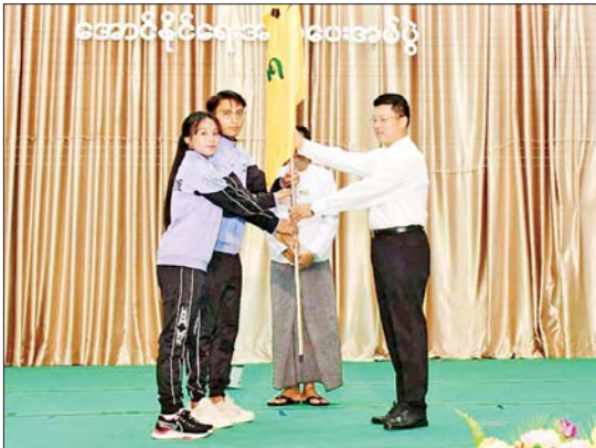
အစိုးရအဖွဲ့အနေဖြင့် တက်ရောက်အားပေး သင်နှစ် တက္ကသိုလ်ပေါင်းစုံဘောလုံး ချီးမြှင့်ပေးခြင်း၊ ၂၀၂၄-၂၀၂၅ ပညာ ပြိုင်ပွဲသို့ ဝင်ရောက်ယှဉ်ပြိုင်ရန်အတွက်