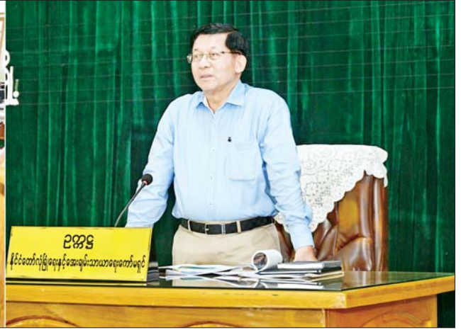
ပြည်ထောင်စုသမ္မတမြန်မာနိုင်ငံတော် ယာယီသမ္မတ နိုင်ငံတော်လုံခြုံရေးနှင့် အေးချမ်းသာယာရေးကော်မရှင်ဥက္ကဋ္ဌ ဗိုလ်ချုပ်မှူးကြီး မင်းအောင်လှိုင် ကိုကိုးကျွန်းမြို့ရှိ မြို့မိမြို့ဖများနှင့် တွေ့ဆုံပွဲတွင် အမှာစကားပြောကြားစဉ်။