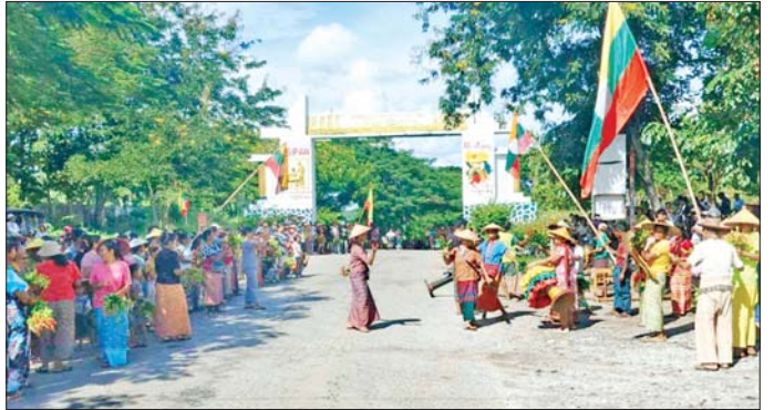
အစိုးရ၏ အုပ်ချုပ်ရေးယန္တရားများ ပြန်လည်ဖွင့်လှစ်နိုင်ရေးအတွက် ဌာနဆိုင်ရာအဖွဲ့အစည်းများက ကူညီထောက်ပံ့ရေးပစ္စည်းများနှင့်အတူ သီပေါမြို့သို့ ရောက်ရှိရာ ဒေသခံပြည်သူများက ကြိုဆိုကြစဉ်။

သီပေါမြို့နယ်တစ်ဝိုက်အား အကြမ်းဖက်သောင်းကျန်းသူများ ယာယီထိန်းချုပ်ထားစဉ် ဒေသခံတိုင်းရင်းသားပြည်သူများအနေဖြင့် အိုးအိမ်တိုက်တာစည်းစိမ်များကို စွန့်ခွာတိမ်းရှောင်နေကြရပြီး ၎င်းတို့၏ လူ့အခွင့်အရေးဆုံးရှုံးမှုများ၊ စီးပွားရေး၊ လူမှုရေး၊ ကျန်းမာရေး၊ ပညာရေးစသည့် အဘက်ဘက်မှ နိမ့်ကျမှုများ၊ တိုက်ပွဲ၏ အနိမ့်ဆုံးကျိုးရဒ်ကြောင့် တွေ့ခဲ့ရမှုများကြောင့် တပ်မတော်က သီပေါဒေသတစ်ဝိုက်အား အပြီးတိုင်ပြန်လည်ထိန်းချုပ်နိုင်ခဲ့သည့်အတွက် ယခုကဲ့သို့ ဝမ်းမြောက်စွာ ကြိုဆိုလက်ခံကြပြီး ယာယီနေရပ်စွန့်ခွာနေထိုင်ခဲ့ရသည့် ဒေသခံတိုင်းရင်းသား ပြည်သူအချို့မှာလည်း ၎င်းတို့၏နေရပ်ဒေသများသို့ ချက်ချင်းပြန်လည်ဝင်ရောက်လျက်ရှိကြကြောင်း သိရသည်။