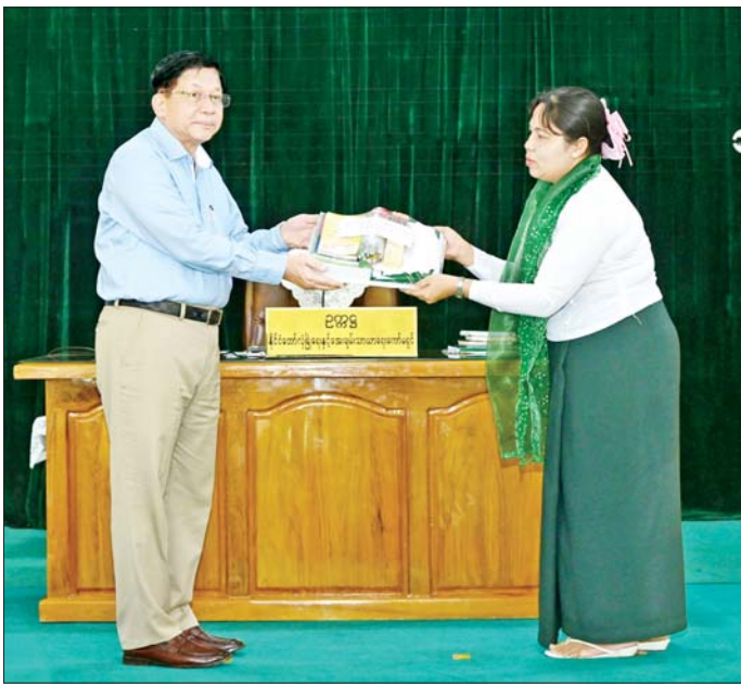
ပြည်ထောင်စုသမ္မတမြန်မာနိုင်ငံတော် ယာယီသမ္မတ နိုင်ငံတော်လုံခြုံရေးနှင့် အေးချမ်းသာယာရေး ကော်မရှင်ဥက္ကဋ္ဌ ဗိုလ်ချုပ်မှူးကြီး မင်းအောင်လှိုင် ကိုကိုးကျွန်းမြို့ အထက်တန်းကျောင်းအတွက် စာရေး ကိရိယာများ ပေးအပ်ရာ ကျောင်းအုပ်ဆရာမကြီးက လက်ခံရလျှစ်စဉ်။

နေပြည်တော် အောက်တိုဘာ ၁၈ ပြည်ထောင်စုသမ္မတ မြန်မာ နိုင်ငံတော် ယာယီသမ္မတ နိုင်ငံတော်လုံခြုံရေးနှင့် အေးချမ်း သာယာရေးကော်မရှင် ဥက္ကဋ္ဌ ဗိုလ်ချုပ်မှူးကြီး မင်းအောင်လှိုင် သည် ရန်ကုန်တိုင်းဒေသကြီး ကိုကိုးကျွန်းမြို့ရှိ ဌာနဆိုင်ရာ တာဝန်ရှိသူများနှင့် ရပ်မိရပ်ဖများ အား ယနေ့မနက်လှိုင်းတွင် တွေ့ဆုံ ပွဲအစပြုပြီး တိုးတက်ရေးဆိုင်ရာ များကို ဆွေးနွေးပြောကြားသည်။ ဦးစွာ နိုင်ငံတော်ယာယီသမ္မတ နိုင်ငံတော်လုံခြုံရေးနှင့် အေးချမ်း သာယာရေးကော်မရှင် ဥက္ကဋ္ဌ ဗိုလ်ချုပ်မှူးကြီး မင်းအောင်လှိုင် နှင့်ဇနီး ဒေါ်ကြူကြူတို့သည် ကိုကိုးကျွန်းလေဆိပ်သို့ ရောက်ရှိ ကြရာ ဌာနဆိုင်ရာတာဝန်ရှိသူ များ၊ ရပ်မိရပ်ဖများ၊ ကျောင်းသား များက ရင်းနှီးနှေးထွေးစွာ ကြိုဆို နှုတ်ဆက်ကြသည်။ ထို့နောက် နိုင်ငံတော် ယာယီ သမ္မတ နိုင်ငံတော်လုံခြုံရေးနှင့် အေးချမ်းသာယာရေးကော်မရှင် မရှင်