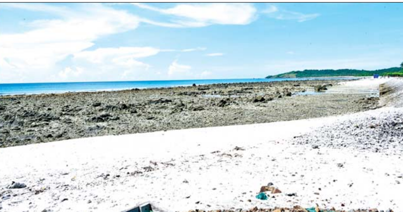
နိုင်ငံတော်လုံခြုံရေးနှင့် အေးချမ်းသာယာရေးကော်မရှင်ဥက္ကဋ္ဌ တပ်မတော်ကာကွယ်ရေးဦးစီးချုပ် ဗိုလ်ချုပ်မှူးကြီးမင်းအောင်လှိုင် ဖျိုင်းကျွန်းနှင့် ဂျယ်ရီကျွန်းဆက်လမ်း ဆောင်ရွက်ထားမှု အခြေအနေများကို ကြည့်ရှုစစ်ဆေးစဉ်။