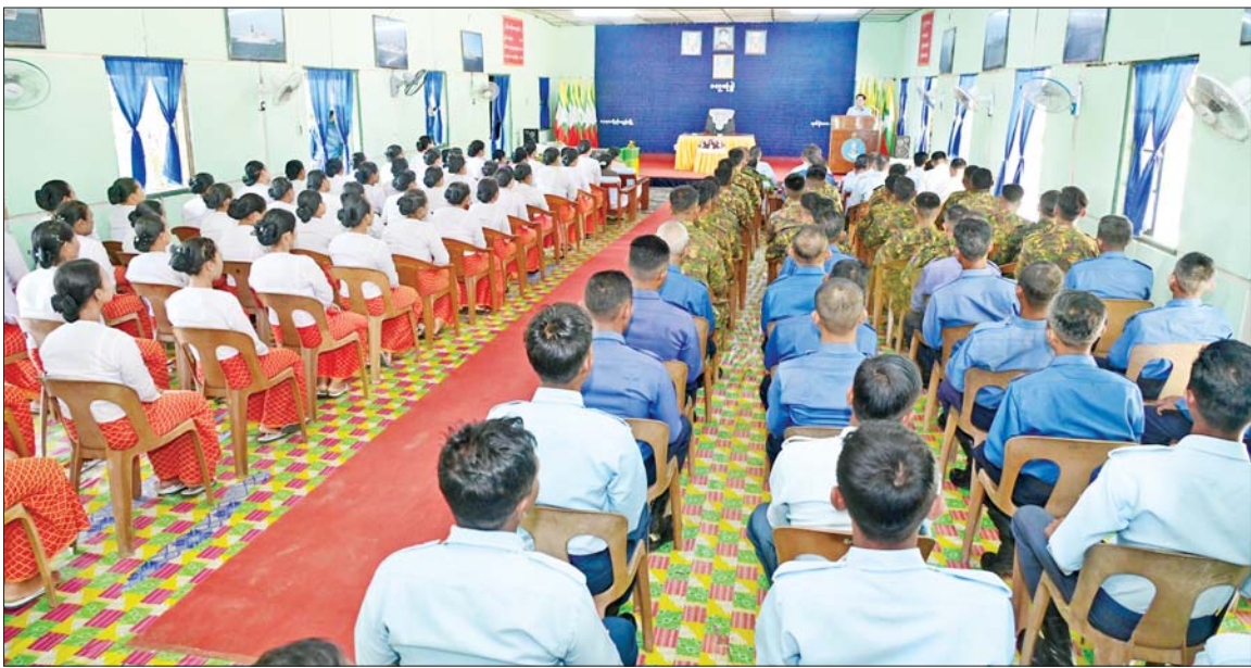
နိုင်ငံတော်လုံခြုံရေးနှင့် အေးချမ်းသာယာရေးကော်မရှင်ဥက္ကဋ္ဌ တပ်မတော်ကာကွယ်ရေးဦးစီးချုပ် ဗိုလ်ချုပ်မှူးကြီးမင်းအောင်လှိုင် ကိုကိုးကျွန်းတပ်နယ်ရှိ အရာရှိ၊ စစ်သည်၊ မိသားစုများအား တွေ့ဆုံအမှာစကားပြောကြားစဉ်။

★ ရှေ့မှ ဦးစွာ နိုင်ငံတော်လုံခြုံရေးနှင့် အေးချမ်းသာယာရေးကော်မရှင် ဥက္ကဋ္ဌ တပ်မတော်ကာကွယ်ရေး ဦးစီးချုပ်က အမှာစကားပြောကြား ရာတွင် ကိုကိုးကျွန်းမြို့နှင့် သွားလာဆက်သွယ်မှု အဆင်ပြေ စေရေးအတွက်လေယာဉ်ပြေးလမ်း တိုးချဲ့ခြင်းနှင့် သင်္ဘောကြီးများ ဆိုက်ကပ်ရပ်နားနိုင်သည့် ဆိပ်ခံ တံတားကို တည်ဆောက်ပေးခဲ့ပြီး ယခင်ကထက် များစွာတိုးတက် ကောင်းမွန်လာပြီဖြစ်ကြောင်း၊ ကိုကိုးကျွန်းသည် မိမိတို့နိုင်ငံ အတွက် ပထဝီအနေအထားအရ အရေးပါသည့်နေရာတွင် တည်ရှိ သောကြောင့် ကိုကိုးကျွန်း တပ်နယ်တွင် တာဝန်ထမ်းဆောင် လျက်ရှိသည့် အရာရှိ၊ စစ်သည်များ သာမက မိသားစုဝင်များအနေဖြင့် လည်း အမြဲလုံခြုံရေး အသိ၊ လုံခြုံရေးသတိဖြင့် နေထိုင်ကြ ရန်လိုကြောင်း။ တပ်မတော် ဆိုသည်မှာ နိုင်ငံတော်ကာကွယ်ရေး တာဝန် ထမ်းဆောင်သည့် အဖွဲ့အစည်း ဖြစ်ပြီး အဆင့်အလိုက် တာဝန် ထမ်းဆောင်နေကြသူများအားလုံး က ကာကွယ်ရေးအမြင်များရှိရန် လိုကြောင်း၊ တပ်မတော်သားများ ဖြစ်သည်နှင့်အညီ အမြဲတိုက်ပွဲဝင် အသင့်ဖြစ်စေရေးကြိုတင်လေ့ကျင့် ပြင်ဆင်ခြင်းများကို ဆောင်ရွက် နေရန်လိုပြီး ကျန်းမာကြံ့ခိုင်နေရန် ရှစ်စမ်းသတ္တိရှိရန်နှင့် ကျွမ်းကျင်မှု များရှိရန် ဆောင်ရွက်ပြီး အမြဲ Combat Ready ဖြစ်စေရေး ဆောင်ရွက်နေရန်လိုကြောင်း။ ကျန်းမာကြံ့ခိုင်မှု ရှိစေရေး