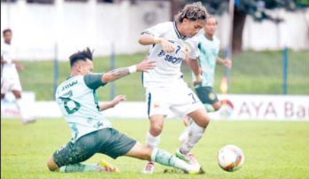
ရှမ်းယူနိုက်တက်အသင်းနှင့် ဒဂုံစတားယူနိုက်တက်အသင်း တို့ ယှဉ်ပြိုင်နေစဉ်။

သီဟဒီပကွင်း၌ ကျင်းပသည့်ပွဲတွင် အား/ကာသိပွဲအသင်းက မဟာယူနိုက်တက်အသင်းကို တစ်ဂိုး-ဂိုးမရှိဖြင့် အနိုင်ရခဲ့သည်။ အား/ကာသိပွဲအသင်းသည် ၇၄ မိနစ်တွင် ဇောဆဲကပေါ်ဆေးသွင်းယူ သည့် ဂိုးဖြင့် အနိုင်ရခဲ့ခြင်းဖြစ်သည်။ အား/ကာသိပွဲအသင်းက ခြောက်ပွဲ ကစား ရှစ်မှတ်၊ မဟာယူနိုက်တက်အသင်းက ငါးပွဲကစား လေးမှတ် ရရှိထားသည်။