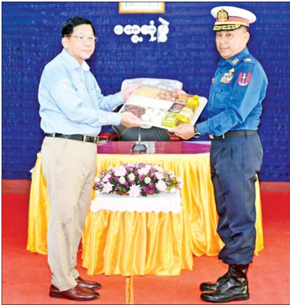
နိုင်ငံတော်လုံခြုံရေးနှင့် အေးချမ်းသာယာရေးကော်မရှင်ဥက္ကဋ္ဌ တပ်မတော်ကာကွယ်ရေးဦးစီးချုပ် ဗိုလ်ချုပ်မှူးကြီးမင်းအောင်လှိုင် ကိုကိုးကျွန်းတပ်နယ်မှ အရာရှိ၊ စစ်သည်၊ မိသားစုများအတွက် စားသောက်ဖွယ်ရာများကို ပေးအပ်ရာ ရေတပ်ဌာနချုပ်မှူးက လက်ခံရယူစဉ်။