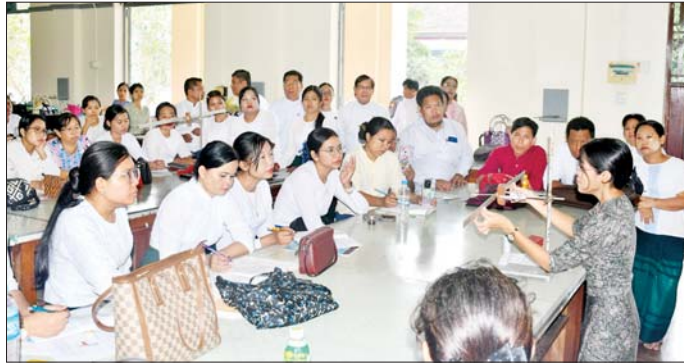
အသုံးပြုသင်ယူခြင်း (High-Tech Learning)၊ (Blended Learning) စသည့် နည်းလမ်းများဖြင့် သင်ကြားပို့ချသူ ဆရာအဖြစ်သင်ယူခြင်း (High-Touch Learning)၊ ပေါင်းစပ်သင်ကြားသင်ယူခြင်းများရရှိစေရန် ကြိုးစားဆောင်ရွက်ကြရန်၊ ၂၁ ရာစု

ဦးစွာ တိုင်းဒေသကြီးဝန်ကြီးချုပ်က နည်းပညာ