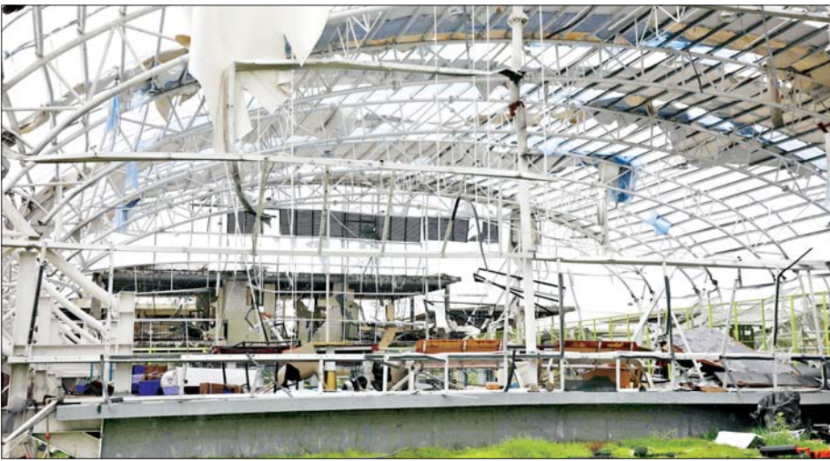
KK Park အတွင်းရှိ အဆောက်အအုံများ ပြုပြင်ဆေးရေးနေမှုကို တွေ့ရစဉ်။

နေပြည်တော် နိုဝင်ဘာ ၈ မြန်မာနိုင်ငံအတွင်းသို့ ထိုင်းနိုင်ငံအပါအဝင် အိမ်နီးချင်းနိုင်ငံအချို့ ကို တစ်ဆင့်ခံဖြတ်သန်း၍ နယ်စပ်လမ်းကြောင်းများမှ တရားမဝင် ဝင်ရောက်လာပြီး ကရင်ပြည်နယ် မြဝတီမြို့ ဓနုထောင်သလေး KK Park နယ်မြေများတွင် အုန်လှိုင်းလိမ်လည်မှုများ၊ အုန်လှိုင်းလောင်းကစားမှု များနှင့် ဒုစရိုက်မှုများကျူးလွန်ခဲ့ကြသည့် ပြည်ပနိုင်ငံသားများအား စစ်ဆေးဖော်ထုတ်ကာ သက်ဆိုင်ရာနိုင်ငံများသို့ပြုပေး လုပ်ထုံးလုပ်နည်း များနှင့်အညီ စနစ်တကျ လွှဲပြောင်းပေးအပ်လျက်ရှိသည့်အပြင် ယင်းတို့ စုဖွဲ့နေထိုင်ခဲ့ကြသည့် KK Park အတွင်းရှိ အဆောက်အအုံများကို ပျက်ဆီးရှင်းလင်းခြင်းလုပ်ငန်းများ ဆောင်ရွက်နေပြီဖြစ်သည်။ မြဝတီ-ဓနုထောင်သလေး (KK Park)နယ်မြေမှ အုန်လှိုင်း လောင်းကစားမှုများ၊ အုန်လှိုင်းလိမ်လည်မှုများနှင့် ဒုစရိုက်မှုများ ကျူးလွန်သည့်နေရာများတွင် တစ်ထပ်လူနေအဆောက်အအုံ တစ်လုံး၊ နှစ်ထပ်လူနေအဆောက်အအုံ အလုံး ၈၀၊ သုံးထပ်လူနေ အဆောက်အအုံ ၅၅လုံး၊ လေးထပ် လူနေအဆောက်အအုံ ၂၇ လုံး၊ ကိုးထပ် လူနေ အဆောက်အအုံ တစ်လုံး၊ ဈေးဆိုင်နှင့် လူနေ နှစ်ထပ်အဆောက်အအုံ လေးလုံး၊ ဈေးဆိုင်နှင့် လူနေ လေးထပ်အဆောက်အအုံ နှစ်လုံး၊ စားသောက်ဆိုင်နှင့် လူနေ နှစ်ထပ်အဆောက်အအုံ တစ်လုံး၊ ဂိုဒေါင် ၁၂ လုံး၊ ခြောက်ထပ် ဟိုတယ် တစ်လုံး၊ GYM အားကစားခန်းမ တစ်ခု စာမျက်နှာ ၈ ကော်လံ ၁ သို့