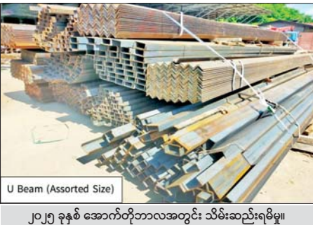
U Beam (Assorted Size) ၂၀၂၅ ခုနှစ် အောက်တိုဘာလအတွင်း သိမ်းဆည်းရမိမှု။