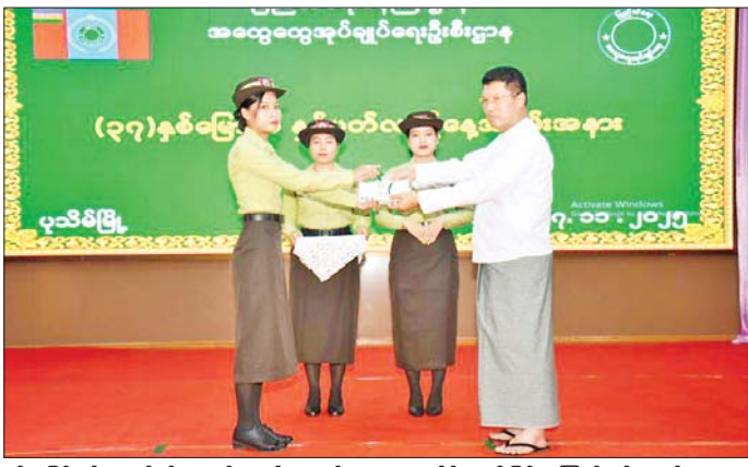
ခွင့်ယူခြင်းမရှိဘဲ လုပ်ငန်းတာဝန်များကို ကျေပွန်စွာ ဆုတံဆိပ်များချီးမြှင့်ခဲ့ကြောင်း သိရသည်။ တိုင်းဒေသကြီး(ပြန်/ဆက်)

ပါတီနိုင်ငံရေး ကင်းရှင်းစွာဖြင့် ကျရာအခန်းကဏ္ဍမှ ပါဝင်ကြိုးပမ်း ဆောင်ရွက်ကြရမည်ဖြစ်ကြောင်း၊ ဝန်ထမ်းအချင်းချင်း စည်းလုံးညီညွတ်စွာ နိုင်ငံတော်အကျိုးကို အောင်မြင်အောင်ဖော်ဆောင်၍ ပြည်သူများက လေးစားအားထားရသည့် အုပ်ချုပ်ရေး ဝန်ထမ်းကောင်းများဖြစ်အောင် ကြိုးပမ်းဆောင်ရွက် သွားကြရန်” တိုက်တွန်း အမှာစကားပြောကြား သည်။ ထို့နောက် တိုင်းဒေသကြီးဝန်ကြီးချုပ်သည် (၃၇) နှစ်မြောက် အထွေထွေအုပ်ချုပ်ရေးဦးစီးဌာန နှစ်ပတ်လည်နေ့အခမ်းအနားအတွက် ချီးမြှင့်ငွေများ နှင့် သင်တန်းတွင် ထူးချွန်ဆုရရှိသူများအား ဆုများ ချီးမြှင့်ခဲ့ပြီး အထွေထွေအုပ်ချုပ်ရေးဦးစီးဌာန သမိုင်း ကြောင်း ဝီဒီယိုကလစ်ပြသမှုကို ကြည့်ရှုအားပေးခဲ့ သည်။ ဆက်လက်၍ တိုင်းဒေသကြီး ဝန်ကြီးများနှင့် တာဝန်ရှိသူများက သင်တန်းတွင် ထူးချွန်ဆုရရှိခဲ့ သည့် အရာထမ်း၊ အမှုထမ်းများနှင့် တစ်နှစ်ပတ်လုံး