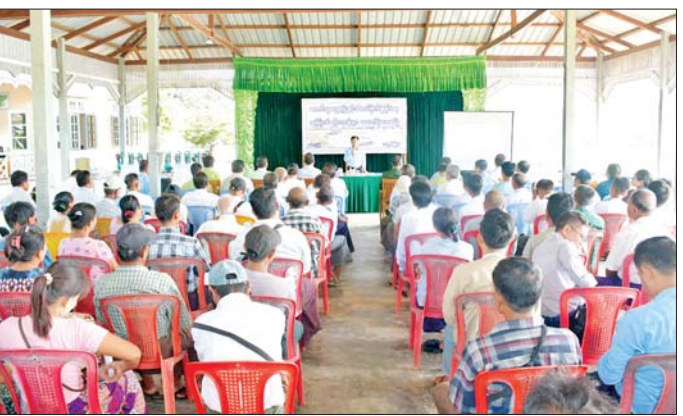
ရေစက်ရေတွင်းများ တူးဖော်ခြင်း၊ ဆိုလာစနစ် ပြောင်းလဲတပ်ဆင်ခြင်း၊ ယာယီချောင်းပိတ်ဆည်းများ တည်ဆောက်ခြင်း၊ ဆိုလာနှင့် လျှပ်စစ် ရေတင်စနစ်များ တည်ဆောက်ခြင်း၊ ကျေးလက်ထိန်းဆည်းများ ပြုပြင်ခြင်း၊ ယင်းနောက် နေပြည်တော်ဘာသာ ဘေးအန္တရာယ်မှ ကာကွယ်ရန်ရေ ရေနုတ်မြောင်း တူးဖော်ခြင်း လုပ်ငန်းများကို လည်း ဆောင်ရွက်သွားရန် လိုအပ်ကြောင်း ဆီထွက်သီးနှံများ တိုးချဲ့စိုက်ပျိုးသွားရန် လိုအပ်ကြောင်း ပြောကြားသည်။ ယင်းနောက် နေပြည်တော်ကောင်စီဥက္ကဋ္ဌနှင့် တာဝန်ရှိသူများက တောင်သူများအား အနိမ့်တင်ဆိလဟန့်များနှင့် ဆင်းရွှေကြာ-၂ နေကြာမျိုးစေ့များ ပေးအပ်ပြီး တောင်သူများ၏ တင်ပြဆွေးနွေးချက်များအပေါ် နေပြည်တော်ကောင်စီဥက္ကဋ္ဌက ပေါင်းစပ်ညှိနှိုင်းဆောင်ရွက်ပေးသည်။ ထို့နောက် ကျည်တောင်

နေပြည်တော် နိုဝင်ဘာ ၈ တောင်သူတွေ့ဆုံပွဲနှင့် သီးထပ်စိုက်ပျိုးနိုင်ရေး အနိမ့်တင်ဆိလဟန့်များ ထောက်ပံ့ပေးအပ်ပွဲကို ယနေ့တွင် ပြည်ထောင်စုရယ်မြေ နေပြည်တော်စေယျာသီရိမြို့နယ် ကျည်တောင်ကျေးရွာ အုပ်ချုပ်ရေးမှူးရုံး၌ ကျင်းပသည်။ တွေ့ဆုံပွဲသို့ နေပြည်တော်ကောင်စီဥက္ကဋ္ဌ ဦးသန်းထွန်းဦး၊ နေပြည်တော် ကောင်စီဝင်များ၊ နေပြည်တော်စည်ပင်သာယာရေးကော်မတီမှ တာဝန်ရှိသူများ၊ နေပြည်တော်ခရိုင်အဆင့်မြို့နယ်အဆင့်မှ တာဝန်ရှိသူများနှင့် ဒေသတောင်သူများ တက်ရောက်ကြသည်။ ဦးစွာ နေပြည်တော်ကောင်စီဥက္ကဋ္ဌက နေပြည်တော်အတွင်း သီးထပ်စိုက်ပျိုးနိုင်ရေး၊ မိုး၊ ဆောင်း၊ နွေ ရာသီပြည့် စိုက်ပျိုးနိုင်ရေးနှင့် ပန်းတိုင်အထွက်နှုန်း ရရှိရေးအတွက် မြေအောက်