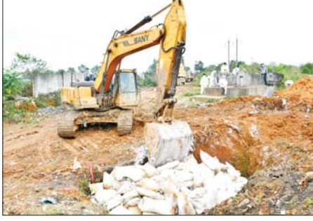
ဖြစ်ကာ ဘိန်းဖြူ ဘလောက်တုံး ၁ ဒသမ ၄၀ ကီလို၊ စိတ်ကြွေးသွပ် ဆေးပြား ၉၃၇၅ ပြား၊ ဘိန်းဆီခဲ သည် ၁၃၄၄၄ ကီလို၊

မူဆယ် နိုဝင်ဘာ ၈ ရမ်းပြည်နယ် (မြောက်ပိုင်း) မူဆယ်မြို့တွင် မူးယစ်ဆေးဝါးများ၊ ထိန်းချုပ်ဓာတုပစ္စည်းနှင့် ဓာတု ဆက်စပ်ပစ္စည်းများအား ဒေသ တွင်း မီးရှို့ဖျက်ဆီးခြင်း အခမ်း အနားကို ယနေ့နံနက်ပိုင်းက မူဆယ်မြို့ စွမ်းစော်ရပ်ကွက် ဘာသာပေါင်းစုံသင်တန်း အနီး၌ ဆောင်ရွက်သည်။ ဖျက်ဆီးခဲ့ အဆိုပါ အခမ်းအနားကို မူဆယ် ခရိုင် မူးယစ်ဆေးဝါးနှင့် စိတ်ကို ပြောင်းလဲစေသော ဆေးဝါးများ အန္တရာယ် တားဆီးကာကွယ်ရေး အဖွဲ့က ကြီးကြပ်ဆောင်ရွက်ခြင်း