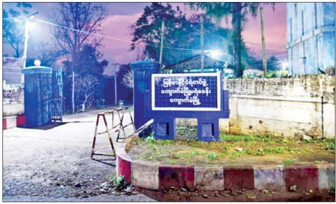
ကျောက်မဲမြို့ မရုံစခန်း လျှပ်စစ်မီး ပြန်လည်ရရှိမှု။