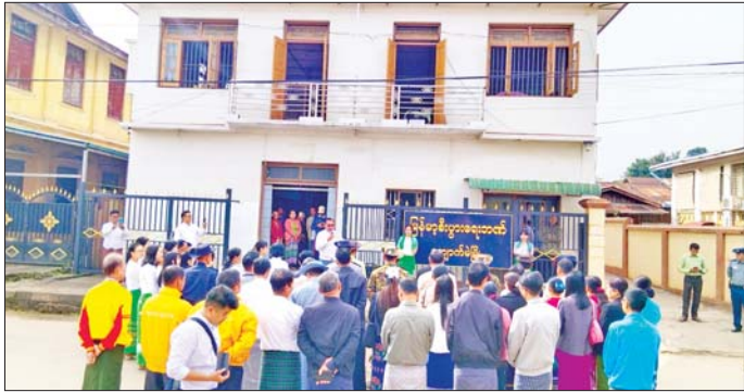
နေသည့်အခြေအနေများကိုကြည့်ရှု၍ သက်ကြီး အားပေးစကား ပြောကြားခဲ့ကြောင်း သိရသည်။ ရှယ်အိုင်(ပြန်/ဆက်) ခရိုင်(ပြန်/ဆက်) ဝန်ထမ်းများအား

နိုင်ငံတစ်ဝန်း ငွေလွှဲခြင်းလုပ်ငန်း၊ စာရင်းရှင်စာရင်း ဖွင့်သည့်လုပ်ငန်း၊ အငြိမ်းစားလစာထုတ်သည့် လုပ်ငန်း၊ ငွေစုဆောင်းအပ်နှံခြင်းလုပ်ငန်း အစရှိသည့် ဘဏ်လုပ်ငန်းများကို ဆောင်ရွက်ပေးနေပြီဖြစ် ကြောင်း ရှင်းလင်းပြောကြားသည်။ ဆက်လက်၍ စစ်ဆင်ရေးကွပ်ကဲမှုဌာနချုပ် ဒုတိယစစ်ဆင်ရေးကွပ်ကဲရေးမှူး၊ ကျောက်မဲခရိုင် စီမံခန့်ခွဲရေးနှင့် အုပ်ချုပ်ရေးကော်မတီဥက္ကဋ္ဌနှင့် တာဝန်ရှိသူများက ကျောက်မဲမြို့ မြန်မာ့စီးပွားရေး ဘဏ်ခွဲဆိုင်ခွဲဘုတ်ကို အမွှေးနှံသာရည်များ ပတ်ဖျန်း ၍ ဖွင့်လှစ်ပေးသည်။ ယင်းနောက် တာဝန်ရှိသူများသည် ဘဏ်မှ အငြိမ်းစားဝန်ထမ်းများအား ပင်စင်လစာထုတ်ပေး