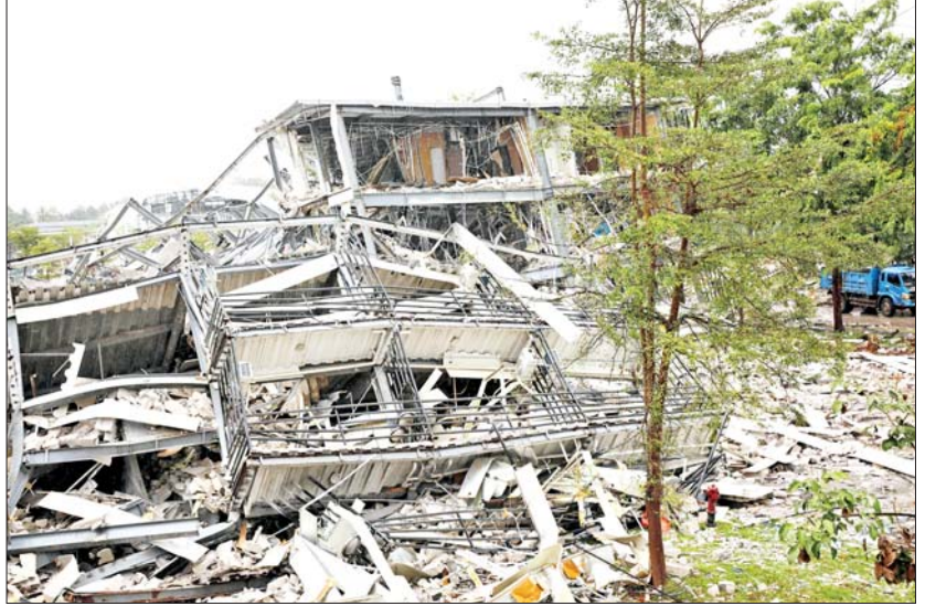
KK Park အတွင်းရှိ အဆောက်အအုံများ ဖြိုဖျက်ဆီးနေမှုကို တွေ့ရစဉ်။