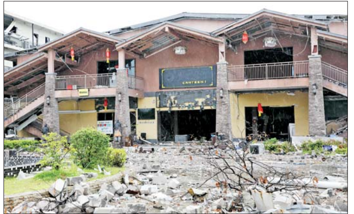
KK Park အတွင်းရှိ အဆောက်အအုံများ ဖြိုချဖျက်ဆီးနေမှုကို တွေ့ရစဉ်။