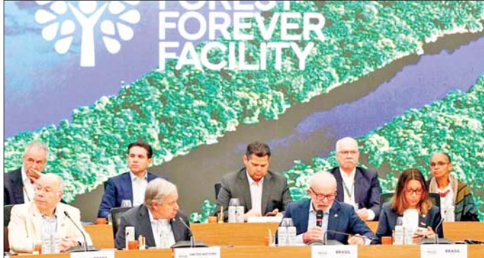
လာမည့်ရက်သတ္တပတ်အတွင်း စတင်မည့် ကုလသမဂ္ဂရာသီဥတုဆိုင်ရာညီလာခံ COP30 တွင် နိုင်ငံခေါင်းဆောင်များက ကာဗွန်ဒိုင်အောက်ဆိုက်ဓာတ်ငွေ ထုတ်လွှတ်မှု ယူဆချက်များနှင့်ပတ်သက်ပြီး နည်းလမ်းကောင်းများကို ရှာဖွေမည်ဖြစ်ကြောင်း သိရသည်။ ကိုးကား - အင်န်အိတ်ချ်ကော့ဘာသာပြန် - အောင်ကျော်ကျော်

နေရသော ပစ်ဖိတ်ကျွန်းနိုင်ငံများအနက် တစ်နိုင်ငံဖြစ်သည်။ ထို့ပြင် ဘရာဇီးအစိုးရက အဆိုပြုထားသည့် အပူပိုင်းသစ်တော Forest Forever Facility အကောင်အထည်ဖော်ဆောင်မည့် ပဏာမမြေလွှမ်းကို အစည်းအဝေးသို့ တက်ရောက်လာသည့် ခေါင်းဆောင်များက သဘောတူညီခဲ့ကြသည်။ ဂျပန်နိုင်ငံအပါအဝင် နိုင်ငံနှင့် ဒေသပေါင်း ၅၀ ကျော်က ထောက်ခံခဲ့သည်။ အဆိုပါရန်ပုံငွေအတွက် အစိုးရနှင့်ပုဂ္ဂလိကကဏ္ဍနှစ်ခုလုံးမှ စုစုပေါင်း အမေရိကန်ဒေါ်လာ ၁၂ ဘီလီယံ စုဆောင်းရန် ရည်မှန်းထားသည်။ ဖန်လုံအိမ်စာတိုင်း ထုတ်လွှတ်မှု ယူဆချက်များအရ အရေးပါသည့် ပဏာမမြေလွှမ်းဖြစ်ကြောင်းနှင့် သစ်တောပြုန်းတီးမှုသည် ယခုထက် ပိုမိုများပြားလာပါက ကမ္ဘာတစ်ဝန်း၌ ဆိုးကျိုးများကို ခံစားရမည်ဖြစ်ကြောင်း ဘရာဇီးသမ္မတ လူလာဒါ ဆေးဗားက သတိပေး ပြောကြားခဲ့သည်။