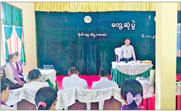
လူကောင်းများဖြစ်အောင် တစ်ပါတည်းလေ့ကျင့်သင်ကြားပေးရန်လိုအပ်ကြောင်း၊ ထို့ပြင် ဘွဲ့ကြို စိုက်ပျိုးရေးနှင့် မွေးမြူရေးပညာရပ်များ ဆက်လက်ဆည်းပူးလိုကြသည့် ကျောင်းသား ကျောင်းသူများအား တိုးချဲ့ဖွင့်လှစ်မည့် စိုက်ပျိုးရေးနှင့် မွေးမြူရေးတက္ကသိုလ်(မအူပင်)တွင် တက်ရောက်နိုင်ကြစေရန် တာဝန်ရှိသူများနှင့် ဆရာ ဆရာမများက လိုအပ်သည်များ ရိုင်းဝန်းကူညီဆောင်ရွက်ပေးကြစေလို

နေပြည်တော် နိုဝင်ဘာ ၈ စိုက်ပျိုးရေး၊ မွေးမြူရေးနှင့် ဆည်မြောင်းဝန်ကြီးဌာန ပြည်ထောင်စုဝန်ကြီး ဦးမင်းနောင်သည် နိုဝင်ဘာ ၆ ရက် မွန်းလွဲပိုင်းတွင် စိုက်ပျိုးရေးနှင့် မွေးမြူရေးသိပ္ပံ(ဘားအံ)ကို ကြည့်ရှုစစ်ဆေးသည်။ ဦးစွာ ပြည်ထောင်စုဝန်ကြီးသည် ကျောင်းအုပ်ကြီးနှင့် ဆရာ ဆရာမများအား တွေ့ဆုံ၍ နိုင်ငံ၏ လယ်ယာကုန်ထုတ်လုပ်ငန်းများ ဖွံ့ဖြိုးတိုးတက်လာစေရေး ကြိုးပမ်းရာတွင် လက်တွေ့စိုက်ပျိုးရေးမြှူရေးလုပ်ငန်းခွင်ကျွမ်းကျင်သူများ မွေးထုတ်ပေးလျက်ရှိသည့် စိုက်ပျိုးရေးနှင့် မွေးမြူရေးသိပ္ပံကျောင်းများ၏ အခန်းကဏ္ဍသည် များစွာအရေးပါကြောင်း၊ စိုက်ပျိုးရေးနှင့် မွေးမြူရေးသိပ္ပံကျောင်းသား ကျောင်းသူများ အနေဖြင့် ဆိုင်ရာဘာသာရပ်များအလိုက် ကျွမ်းကျင်မှု ရှိစေရေးအပြင် နိုင်ငံတော်၏ စားရေရိက္ခာဖူလုံရေး ကြိုးပမ်းချက်များနှင့် တောင်သူလယ်သမားများအား လက်တွေ့ဝန်ဆောင်မှုပေးသည့် လုပ်ငန်းများ၌ အားကိုးအားထားပြုရသူများအဖြစ် ကျရာကဏ္ဍက တာဝန်ကျပွန်စွာ စွမ်းဆောင်နိုင်ကြသည့် လူ့ရန်