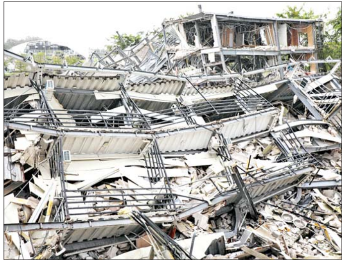
KK Park အတွင်းရှိ အဆောက်အအုံများ ဖြိုချဖျက်ဆီးနေမှုကို တွေ့ရစဉ်။