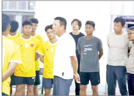
မြန်မာနိုင်ငံဘောလုံးအဖွဲ့ချုပ်ဥက္ကဋ္ဌ ဦးဇော်ဇော် လက်ရွေးစင် အသင်းများအား တွေ့ဆုံအားပေးပေးပုံ။

ဆက်လက်၍ သူ့ဥက္ကဋ္ဌလေ့ကျင့်ရေးကွင်း(၁)တွင် လေ့ကျင့်နေသည့် အား/ကာသိပွဲအမျိုးသမီးအသင်းအား တွေ့ဆုံ၍ မြန်မာလက်ရွေးစင် ကစားသမားအများစု ပါဝင်သည့်အတွက် ဆီးဂိမ်းပြိုင်ပွဲအကြို ကောင်းမွန်သည့်အခွင့်အရေးဖြစ်ကြောင်း၊ အာရှအမျိုးသမီးချန်ပီယံလိဂ် ပြိုင်ဘက်များဖြစ်သည့် ဂျပန်၊ တောင်ကိုရီးယား၊ မြောက်ကိုရီးယား ကလပ်အသင်းများကို မလျော့သောခွဲလွှဲလုပ်ဆောင်ခြင်း ရေကန်ရေခန်း ကြိုးပမ်းကစားရန်၊ အာရှအဆင့်၊ ကမ္ဘာ့အဆင့်ကလပ်များ၊ ကစားသမား များဖြစ်သော်လည်း စိတ်ဓာတ်အကောင်းဆုံးဖြင့် ရင်ဆိုင်သွားရန် တိုက်တွန်းအားပေးခဲ့သည်။ ထို့နောက် ဥက္ကဋ္ဌဦးဇော်ဇော်သည် စားရိပ်သာတွင် မြန်မာ ယူ-၂၂ အမျိုးသားအသင်းနှင့် မြန်မာ ယူ-၁၇