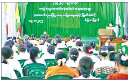
(ခွဲ)များနှင့် ကိုယ်ပိုင်ကျောင်းများ သင်တန်းသား ဆရာ ဆရာမ ၁၀၀ မှ အထက်တန်းဆင့်သင် တက်ရောက်ပြီး သင်တန်းနည်းပြ ချမ်းသာ(မိတ္ထီလာ)

မိတ္ထီလာ နိုဝင်ဘာ ၈ မန္တလေးတိုင်း ဒေသကြီး မိတ္ထီလာမြို့၌ ၂၀၂၅-၂၀၂၆ ပညာ သင်နှစ် အခြေခံပညာအထက် တန်းဆင့်သင်ဆရာ ဆရာမများ ဥပဒေအသိပညာ ပြန့်ပွားရေး ဆင့်ပွားဆွေးနွေး ပွဲ (မြို့နယ် အဆင့်) ကို ယနေ့နံနက်ပိုင်းက အထက(၁)ဝန်းမ၌ ကျင်းပသည်။ အဆိုပါ ဆွေးနွေးပွဲသို့ အခြေခံ ပညာအထက် တန်းကျောင်း၊ အခြေခံပညာအထက်တန်းကျောင်း