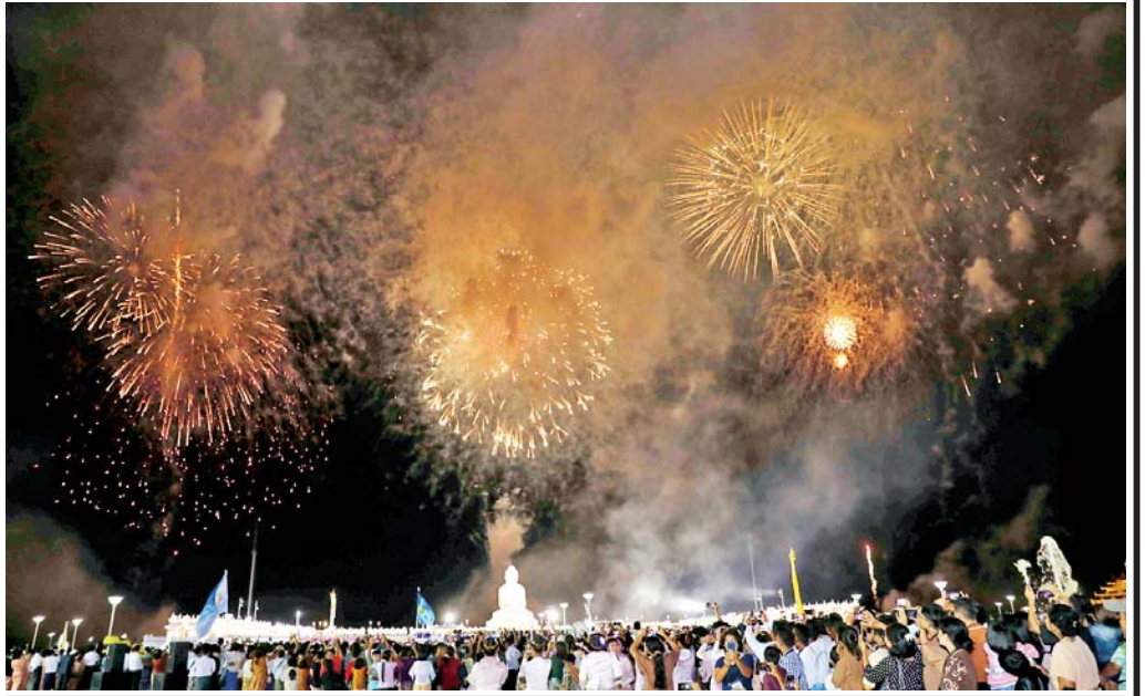
၂၀၂၅ ခုနှစ် မာရဝိဇယပုဒ္ဓရုပ်ပွားတော်မြတ်ကြီး၏ တန်ဆောင်တိုင်ပွဲတော် မီးပုံးပျံလွှတ်တင်ပူဇော်ပြိုင်ပွဲတွင် မီးရှူးမီးပန်းများပစ်ဖောက်ကာ လာရောက် အားပေးကြည့်ရှုကြသည့် ပြည်သူများဖြင့် စည်ကားလျက်ရှိသည်ကို တွေ့ရစဉ်။

တန်ဆောင်မုန်းလသည် တန်ဆောင်တိုင် မီးထွန်းပွဲတော်၊ ကထိန်သင်္ကန်းအလှူပွဲတော်၊ မသိုး သင်္ကန်းရက်လုပ်ပွဲတော်၊ ဆေးပေါင်းခ မဲဇလီဖူးသုပ် ဝေငှပွဲတော်၊ ပုံသကူအလှူပွဲတော်၊ နိဗ္ဗာန်ဈေးပွဲတော် များ၊ ကျီးမနိုးပွဲတော်၊ သာမညဇလအခါတော်နေ့ ပွဲတော်များဟူသော ပွဲတော်အလှူပွဲတော်များ ဖြင့် ထင်ရှားလေးနက်သည့် လတစ်လလည်း ဖြစ်ပါသည်။