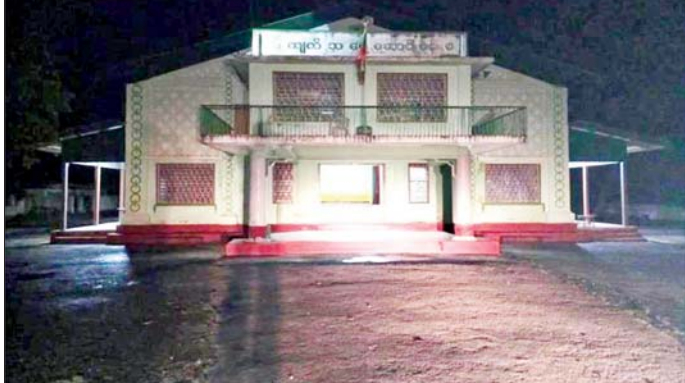
ကျောက်မဲမြို့ မြို့ကျက်သရေဆောင်ခန်းမ လျှပ်စစ်မီး ပြန်လည်ရရှိမှု။