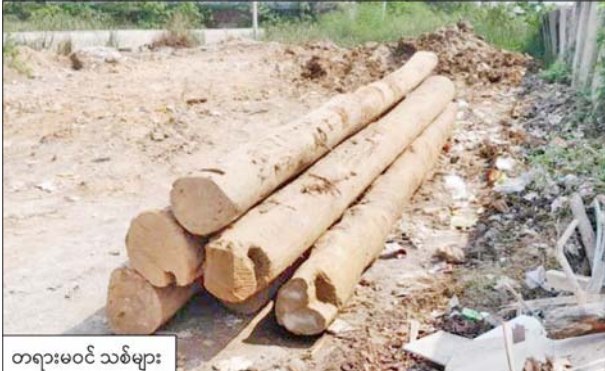
မန္တလေးတိုင်းဒေသကြီး သိမ်းဆည်းရမိမှု။

နေပြည်တော် နိုဝင်ဘာ ၈ တရားမဝင်ကုန်သွယ်မှု တိုက်ဖျက်ရေးဦးဆောင်ကော်မတီ၏ ကြီးကြပ်ကွပ်ကဲမှုဖြင့် တရားမဝင်ကုန်သွယ်မှုများကို ဥပဒေနှင့်အညီ ထိရောက်စွာ တားဆီးအရေးယူနိုင်ရေး ဆောင်ရွက်လျက်ရှိသည်။