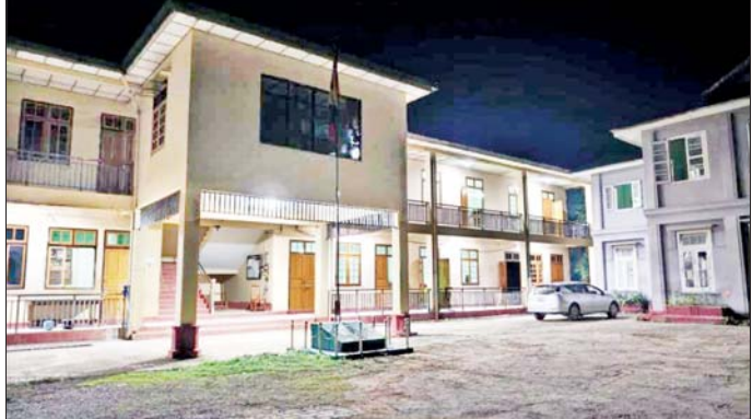
ကျောက်မဲမြို့ ခရိုင်အထွေထွေအုပ်ချုပ်ရေးဦးစီးဌာန လျှပ်စစ်မီး ပြန်လည်ရရှိမှု။