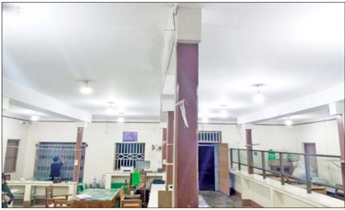
ကျောက်မဲမြို့ မြန်မာ့စီးပွားရေးဘဏ် လျှပ်စစ်မီး ပြန်လည်ရရှိမှု။

မိမိပိုင် နိုင်ငံသားစိစစ်ရေးကတ်၊ Mobile SIM Card၊ Mobile Payment Account၊ Bank Account များအား မသက်ဆိုင်သူထံသို့ အခကြေးငွေဖြင့် ရောင်းချခြင်း၊ ငှားရမ်းအသုံးပြုစေခြင်းများဆောင်ရွက်ပါက တည်ဆဲဥပဒေများနှင့်အညီ အရေးယူခံရနိုင်ပါသည်။