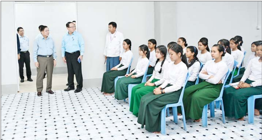
ပြည်ထောင်စုသမ္မတမြန်မာနိုင်ငံတော် ယာယီသမ္မတ နိုင်ငံတော်လုံခြုံရေးနှင့် အေးချမ်းသာယာရေးကော်မရှင်ဥက္ကဋ္ဌ ဗိုလ်ချုပ်မှူးကြီး မင်းအောင်လှိုင် ကရင်ပြည်နယ် လူငယ်စင်တာအတွင်း ကြည့်ရှုစစ်ဆေးစဉ်။

ကရင်ပြည်နယ် အတွင်း တစ်ဧကအထွက်နှုန်း ပန်းတိုင်ရည်မှန်းချက် ပြည့်မီရေးအတွက် လိုအပ်လျက်ရှိနေသေးကြောင်း၊