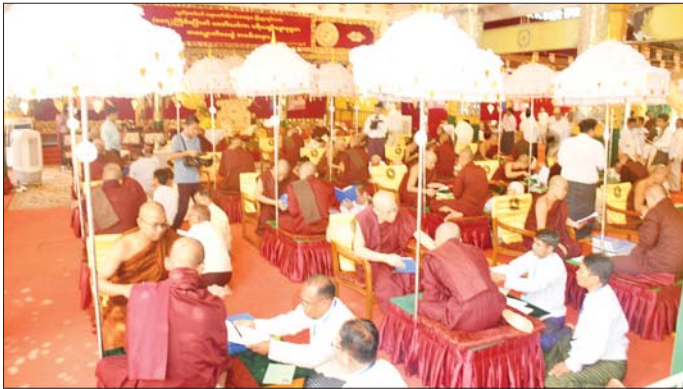
ရန်ကုန် နိုဝင်ဘာ ၁၅

ရွှေတိဂုံစေတီတော် ဘဏ္ဍာတော်ထိန်းဂေါပက အဖွဲ့က ကြီးမှူးကျင်းပသည့် (၁၀၇)ကြိမ်မြောက် စေတီယင်္ဂါဏပရိယတ္တိဓမ္မာနုဂ္ဂဟ စာလျှောက်မေးပွဲ ဖွင့်ပွဲအခမ်းအနားကို ယနေ့မနန်းလွဲပိုင်းက ရွှေတိဂုံစေတီတော်ရင်ပြင် မြောက်ဘက်ရှိ ချမ်းသာကြီးတန်းဆောင်း၌ ကျင်းပ သည်။