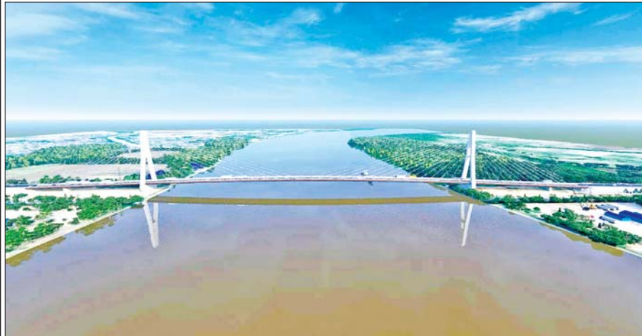
ဂျိုင်း (ဇာသပြင်) တံတား ပုံစံငယ်ကို တွေ့ရစဉ်။

အတ္တရံမြစ်ကူး ကျိုက်မရောမြို့နယ်ကို ဖြတ်သန်းစီးဆင်းနေသည့် အတွက် သွားလာရေးခက်ခဲမှုတည်ရှိခဲ့သည်။ ထို့ကြောင့် အတ္တရံမြစ်အရှေ့ဘက်ခြမ်းနှင့် အနောက်ဘက်ခြမ်း ကျေးရွာများရှိ ဒေသပြည်သူများ လမ်းပန်းဆက်သွယ်ရေး လွယ်ကူအဆင်ပြေစေရန် ကျိုက်မရောမြို့၏ အရှေ့ဘက် သုံးမိုင်ခန့်အကွာ ကျိုက်မရော-စံပယ်ဂျ-ကော့ပုခေ လမ်း အတ္တရံတံတား (စံပယ်ဂျ) ကို စာမျက်နှာ ၂၁ သို့