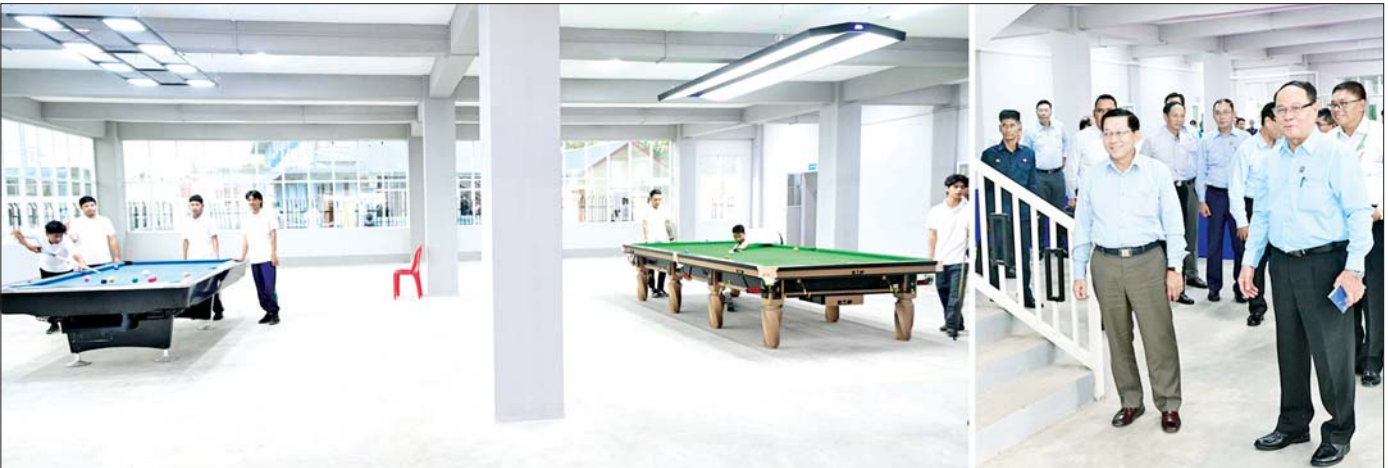
ပြည်ထောင်စုသမ္မတမြန်မာနိုင်ငံတော် ယာယီသမ္မတ နိုင်ငံတော်လုံခြုံရေးနှင့် အေးချမ်းသာယာရေးကော်မရှင်ဥက္ကဋ္ဌ ဗိုလ်ချုပ်မှူးကြီးမင်းအောင်လှိုင် ကရင်ပြည်နယ်လူငယ်စင်တာအတွင်း လူငယ်များ Indoor Game များ လေ့ကျင့်နေမှုကို ကြည့်ရှုစစ်ဆေးစဉ်။

နေပြည်တော် နိုဝင်ဘာ ၁၅ ပြည်ထောင်စုသမ္မတမြန်မာနိုင်ငံတော် ယာယီသမ္မတ နိုင်ငံတော်လုံခြုံရေးနှင့် အေးချမ်းသာယာရေးကော်မရှင်ဥက္ကဋ္ဌ ဗိုလ်ချုပ်မှူးကြီးမင်းအောင်လှိုင်သည် ကရင်ပြည်နယ် ဘားအံမြို့ရှိ ပြည်နယ်အဆင့်ဌာနဆိုင်ရာ တာဝန်ရှိသူများနှင့် ရပ်မိရပ်ဖများအား ယနေ့နံနက်ပိုင်းတွင် တွေ့ဆုံ၍ ဒေသဖွံ့ဖြိုးတိုးတက်ရေးဆိုင်ရာများအား ဆွေးနွေးပြောကြားသည်။ စာမျက်နှာ ၃ ကော်လံ ၁ သို့ ✕