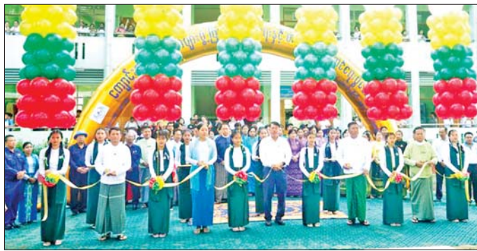
ဦးအောင်လွင်တို့က ဖဲကြီးဖြတ်ဖွင့်လှစ်ပေးကြသည်။ ဒေသကြီးလူမှုရေးရာဝန်ကြီး ဦးဌေးအောင်က အမှတ်(၂) အခြေခံပညာနှင့်စက်မှု၊ စက်မှု၊ စိုက်ပျိုး၊ မွေးမြူရေး အထက်တန်းကျောင်း၌ စည်ပင်သာယာရေးဝန်ကြီး ဦးဗိုလ်ဌေးက အမှတ်(၂) အခြေခံပညာနှင့်စက်မှု၊

ရန်ကုန် နိုဝင်ဘာ ၁၅ ရန်ကုန်တိုင်းဒေသကြီးအစိုးရအဖွဲ့၏ ကြီးကြပ်မှုဖြင့် ပြန်ကြားရေးနှင့် ပြည်သူ့ဆက်ဆံရေးဦးစီးဌာနနှင့် အခြေခံပညာဦးစီးဌာနတို့ ပူးပေါင်းကျင်းပသော ကျောင်းစာကြည့်တိုက်များ ဖွံ့ဖြိုးတိုးတက်ရေးနှင့် စာဖတ်ရိုက်မြှင့်တင်ရေးပွဲတော်ကို နိုဝင်ဘာ ၁၃ ရက်တွင် ဗိုလ်တထောင်ခရိုင် သာကေတမြို့နယ် အမှတ်(၂) အခြေခံပညာနှင့် စက်မှု၊ စိုက်ပျိုး၊ မွေးမြူရေး အထက်တန်းကျောင်း၌ ကျင်းပသည်။ အဆိုပါပွဲတော်ကို ရန်ကုန်တိုင်းဒေသကြီး စည်ပင်သာယာရေးဝန်ကြီး(မြို့တော်ဝန်) ဦးဗိုလ်ဌေး၊ လူမှုရေးရာဝန်ကြီး ဦးဌေးအောင်၊ ပြန်ကြားရေးနှင့် ပြည်သူ့ဆက်ဆံရေးဦးစီးဌာန ရန်ကုန်တိုင်းဒေသကြီး ညွှန်ကြားရေးမှူး ဒေါ်ခင်စောလင်း၊ ရန်ကုန်တိုင်းဒေသကြီး ပညာရေးမှူးချုပ် ဒုတိယညွှန်ကြားရေးမှူး (ပညာဦးမင်းဦး၊ ဗိုလ်တထောင်ခရိုင်အုပ်ချုပ်ရေးမှူး