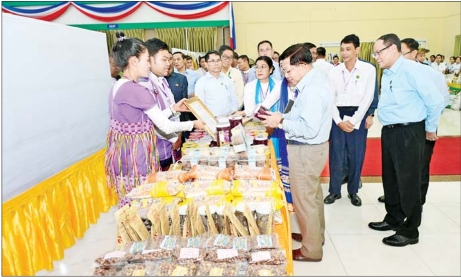
ပြည်ထောင်စုသမ္မတမြန်မာနိုင်ငံတော် ယာယီသမ္မတ နိုင်ငံတော်လုံခြုံရေးနှင့် အေးချမ်းသာယာရေးကော်မရှင်ဥက္ကဋ္ဌ ဗိုလ်ချုပ်မှူးကြီး မင်းအောင်လှိုင် ခင်းကျင်းပြသထားသည့် ကရင်ပြည်နယ်အတွင်းရှိ အသေးစား၊ အငယ်စားနှင့် အလတ်စားစီးပွားရေးလုပ်ငန်းများ (MSME) မှ ထွက်ရှိသည့် ထုတ်ကုန်ပစ္စည်းများအား ကြည့်ရှုစဉ်။

Polytechnic ကျောင်းများ ဖွင့်လှစ်သင်ကြားနိုင်ရေး စီစဉ်ဆောင်ရွက် မိမိတို့နိုင်ငံတွင် တက္ကသိုလ်ဝင်တန်း စာမေးပွဲဝင်ရောက်ဖြေဆိုခဲ့ပြီး အောင်မြင်မှုမရှိခဲ့သည့် ကျောင်းသား ကျောင်းသူများ များစွာရှိကြောင်း၊ ၎င်းတို့အား နိုင်ငံတော်အတွက် မည်ကဲ့သို့ အသုံးချနိုင်မည်ကို စဉ်းစားဆောင်ရွက်ရန် လိုကြောင်း၊ ထို့ကြောင့် မိမိတို့အနေဖြင့် တာဝန်ရှိသူများ၊ ပညာရှင်များနှင့် တိုင်ပင်၍ သက်ဆိုင်ရာ ပညာရပ်