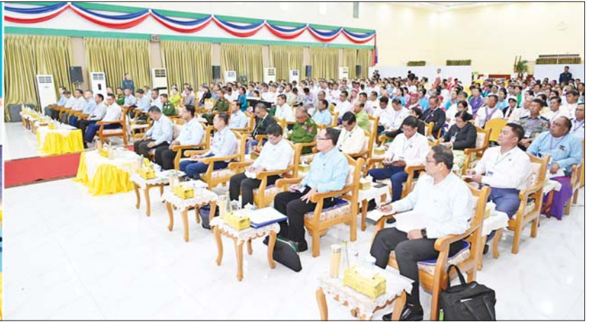
ပြည်ထောင်စုသမ္မတမြန်မာနိုင်ငံတော် ယာယီသမ္မတ နိုင်ငံတော်လုံခြုံရေးနှင့် အေးချမ်းသာယာရေးကော်မရှင်ဥက္ကဋ္ဌ ဗိုလ်ချုပ်မှူးကြီး မင်းအောင်လှိုင် တာဝန်ထမ်းဆောင်ရာတွင် ပါဝင်နေကြောင်း မြို့၊ မြို့များနှင့်တွေ့ဆုံဆွေးနွေးစဉ်။

၎င်းတို့အဖွဲ့မှ အဆိုပါ တွေ့ဆုံပွဲအခမ်းအနား သို့ ကော်မရှင်အဖွဲ့ဝင်များ၊ တွဲဖက်အမှုဆောင်ချုပ် ဗိုလ်ချုပ်ကြီး ရဲဝင်းဦး၊ ပြည်ထောင်စုဝန်ကြီးများ၊ ကာကွယ်ရေးဦးစီးချုပ်ရုံးမှ အဆင့်မြင့် တပ်မတော်အရာရှိကြီးများ၊ ကရင်ပြည်နယ်ဝန်ကြီးချုပ် ဦးစောမြင့်ဦး၊ အရှေ့တောင်တိုင်းစစ်ဌာနချုပ်တိုင်းမှူး၊ ဒုတိယဝန်ကြီးများ၊ ဘားအံမြို့ရှိပြည်နယ်အဆင့် ဌာနဆိုင်ရာတာဝန်ရှိသူများ၊ ရပ်မိရပ်ဖများ၊ MSME လုပ်ငန်းရှင်များနှင့် ဒေသခံတိုင်းရင်းသား ပြည်သူများ တက်ရောက်ကြသည်။ ရှင်းလင်းတင်ပြ ဦးစွာ ကရင်ပြည်နယ်ဝန်ကြီးချုပ်က ငွေကြေးကောက်ပွဲကွင်းပပြုလုပ်ရန်အတွက် ကြိုတင်ပြင်ဆင်မှုများ ဆောင်ရွက်လျက်ရှိမှု၊ ပြည်နယ်ဆိုင်ရာ အချက်အလက်များ၊ တရားမဝင်ကုန်ပစ္စည်းများ ဖမ်းဆီးရမ်းမိမှုနှင့် တရားမဝင်ကုန်သွယ်မှုတိုက်ဖျက်ရေး လုပ်ငန်းများ ဆောင်ရွက်လျက်ရှိမှု၊ စိုက်ပျိုးရေးလုပ်ငန်းများ ဆောင်ရွက်လျက်ရှိမှုနှင့် တစ်စတစ်စအထွက်နှုန်း တိုးတက်ရေး ဆောင်ရွက်လျက်ရှိမှု၊ မွေးမြူရေးလုပ်ငန်းများ ဆောင်ရွက်လျက်ရှိမှု၊ ငါး/ပစ္စန်းမွေးမြူရေး လုပ်ငန်းများ ဆောင်ရွက်လျက်ရှိမှုနှင့် ထုတ်လုပ်မှုများ တိုးတက်စေရေး သင်တန်းများပို့ချပေးခြင်းနှင့် အသိပညာပေးလုပ်ငန်းများ ဆောင်ရွက်လျက်ရှိမှု၊ ဒေသဝမ်းစာလုပ်ငန်း MSME လုပ်ငန်းများ ဖွံ့ဖြိုးတိုးတက်ရေး ဆောင်ရွက်လျက်ရှိမှု၊ ဒေသအတွင်းခရီးသွားလုပ်ငန်းများ ဆောင်ရွက်လျက်ရှိမှုနှင့် ပြည်တွင်း၊ ပြည်ပခရီးသွားများဝင်ရောက်မှု ပြည်နယ်အတွင်းပညာရေး၊ ကျန်းမာရေးနှင့် အားကစားကဏ္ဍ ဖွံ့ဖြိုးတိုးတက်ရေးဆောင်ရွက်လျက်ရှိမှု၊ ကရင်ပြည်နယ်အတွင်း တရားမဝင်ရောင်းချနေသည့် ပြည်ပနိုင်ငံများမှ များအား ပြည်နယ်အတွင်းပေး