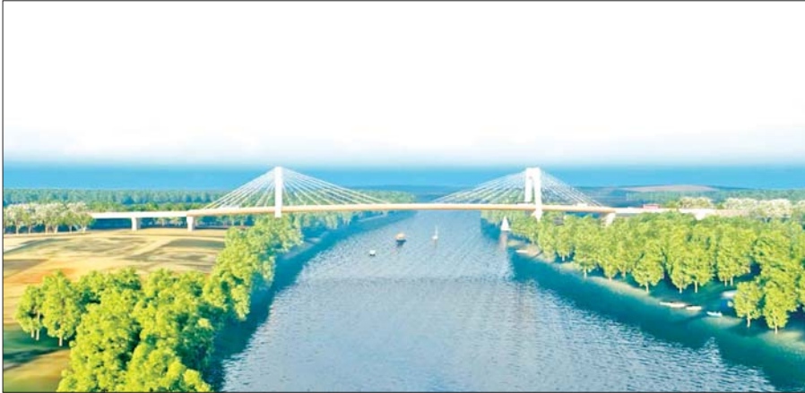
ဂျိုင်း (အတ္တရံ) တံတား ပုံစံငယ်ကို တွေ့ရစဉ်။

ယခုအခါ မွန်ပြည်နယ်နှင့် ကရင်ပြည်နယ်ကို ဆက်သွယ်တည်ဆောက်ပေးထားသည့် အတ္တရံတံတားသစ် တည်ဆောက်ရေးစီမံကိန်းကို တံတားဟောင်း၏ ရေဆန်ဘက် ၄၅ မီတာ အကွာတွင်