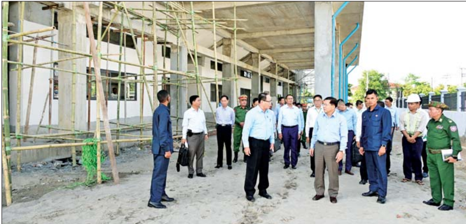
ပြည်ထောင်စုသမ္မတမြန်မာနိုင်ငံတော် ယာယီသမ္မတ နိုင်ငံတော်လုံခြုံရေးနှင့် အေးချမ်းသာယာရေးကော်မရှင်ဥက္ကဋ္ဌ စိုလ်ချုပ်မျိုးကြီး မင်းအောင်လှိုင် ဇွဲကပင် မိုးလုံလေလုံအားကစားရုံ တည်ဆောက်နေမှုလုပ်ငန်းခွင်ကို ကြည့်ရှုစစ်ဆေးစဉ်။

ကရင်ပြည်နယ်သည် နိုင်ငံလွတ်လပ်ရေး ရပြီးချိန်ကတည်းက လက်နက်ကိုင်သောင်းကျန်းမှုများကြောင့် တည်ငြိမ်အေးချမ်းမှုများပျက်ယွင်းပြီး ပြည်နယ်အတွင်းနေထိုင်သည့် ပြည်သူများထိခိုက်သကဲ့သို့ နိုင်ငံတော်အနေဖြင့်လည်း ထိခိုက်မှုများရှိကြောင်း၊ ကရင်ပြည်နယ် တည်ငြိမ်အေးချမ်းမှု ပျက်ယွင်းအောင်လုပ်ဆောင်နေသူများသည် ကရင်ပြည်နယ်အတွင်းရှိ လက်နက်ကိုင်အဖွဲ့အစည်းများပင်ဖြစ်ကြောင်း၊ တည်ငြိမ်အေးချမ်းမှုရှိ မှသာလျှင် ပညာသင်ကြားနိုင်မည်၊ ပြည်သူများ၏ ကျန်းမာရေးစောင့်ရှောက်မှု လုပ်ငန်းများကို ဆောင်ရွက်နိုင်မည်၊ ဒေသဖွံ့ဖြိုးတိုးတက်ရေး လုပ်ငန်းများကို ဆောင်ရွက်နိုင်မည် ဖြစ်ကြောင်း၊ ထို့ကြောင့် ပြည်နယ်၏ ဖွံ့ဖြိုးတိုးတက်မှုကို ဖျက်ဆီးနေသည့် တည်ငြိမ်အေးချမ်းမှု ပျက်ယွင်းအောင် ဆောင်ရွက်နေမှုများကို ပြည်နယ်အတွင်း နေထိုင်ကြသူများအနေဖြင့် နည်းလမ်းပေါင်းစုံဖြင့် ကာကွယ်ဆောင်ရွက်သွားကြရန်လိုကြောင်း၊ နိုင်ငံတော်အနေဖြင့် ကရင်ပြည်နယ်အတွင်း ဒေသ တည်ငြိမ်အေးချမ်းမှု ပျက်ယွင်းအောင် လုပ်ဆောင်နေမှုများကို ရှင်းလင်းဆောင်ရွက်လျက်ရှိကြောင်း၊ အွန်လိုင်းငွေကြေးလိမ်လည်မှုနှင့် အွန်လိုင်း