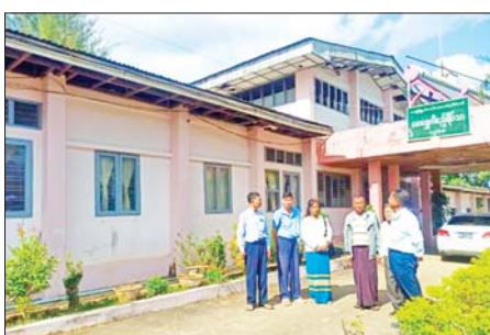
အသင်းအဆင့်ဆင့်မှ အမှုဆောင်များ၊ အသင်းသားများနှင့် တွေ့ဆုံ၍ သမဝါယမအသင်း ဥပဒေ၊ သည့် ကုန်ထုတ်လုပ်မှု၊ ကုန်သွယ်

တောင်ကြီး နိုဝင်ဘာ ၁၅ သမဝါယမလုပ်ငန်းများ ဖွံ့ဖြိုးတိုးတက်ရေးအတွက် ရှမ်းပြည်နယ်မြောက်ပိုင်းရှိ သမဝါယမလုပ်ငန်းများကို နိုဝင်ဘာ ၁၄ ရက်တွင် တာဝန်ရှိသူများက ကွင်းဆင်းဆောင်ရွက်သည်။ ထိုသို့ ကွင်းဆင်းဆောင်ရွက်ရာတွင် ရှမ်းပြည်နယ် သမဝါယမဦးစီးဌာန ပြည်နယ်ဦးစီးမှူးဦးကျော်မိုးတင့်နှင့် တာဝန်ရှိသူများသည် ရှမ်းပြည်နယ် (မြောက်ပိုင်း) မိုင်းရယ်မြို့နှင့် လားရှိုးမြို့နယ်တို့ရှိ မြို့နယ်သမဝါယမဦးစီးဌာန ဝန်ထမ်းများနှင့် သမဝါယမ