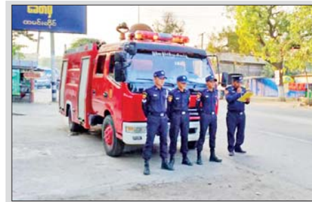
မန္တလေး တိုင်းဒေသကြီး သာစည်မြို့နယ်အတွင်း မီးဘေးအန္တရာယ် ကင်းဝေးစေရန် မြို့နယ် မီးသတ်ဦးစီးဌာနက နိုဝင်ဘာ ၁၄ ရက်တွင် မြို့ပေါ်ရပ်ကွက်များ၌ အသုံးပြုစက်ဖြင့် အသိပညာပေးနှိုးဆော်ခြင်းများ လှည့်လည်ဆောင်ရွက်စဉ်။ မြို့နယ်(ပြန်/ဆက်)

မှု၊ ဝန်ဆောင်မှုလုပ်ငန်းများအောင်မြင်အောင် ဆောင်ရွက်သွားကြရန်နှင့် စီမံကိန်းသီးနှံ (သက်တံ့ရောင်စီမံကိန်း) များကို လျာထားချက်အတိုင်း စိုက်ပျိုးဆောင်ရွက်ကြရန်၊ စီမံကိန်းသီးနှံစိုက်ပျိုးထုတ်လုပ်မှု ရောင်းဝယ်မှု၊ ကြိတ်ခွဲဖြန့်ဖြူးမှု လုပ်ငန်းစဉ်များအောင်မြင်အောင် အကောင်အထည်ဖော် ဆောင်ရွက်သွားကြရန် လမ်းညွှန်မှာကြားသည်။ ထို့နောက် လားရှိုးမြို့နယ်ရှိ မြို့နယ် သမဝါယမအသင်းစု လီမိတက်က ဖွင့်လှစ်ထားသည့် ဓောရွှေလီ တည်ဆဲခန်းအခြေအနေနှင့် လားရှိုးမြို့နယ်အတွင်းရှိ သမဝါယမ အသင်းများကို ကွင်းဆင်းကြည့်ရှု စစ်ဆေးခဲ့ကြောင်း သိရသည်။ ဝိုးတောင်း