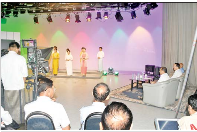
ပြည်ထောင်စုဝန်ကြီး ဦးမောင်မောင်အုန်း ရန်ကုန်မြို့၊ ပြည်လမ်းရှိ မြန်မာ့အသံနှင့် ရုပ်မြင်သံကြားဌာန ရွေးကောက်ပွဲလှုံ့ဆော်တေး ရိုက်ကူးနေမှုကို ကြည့်ရှုအားပေးစဉ်။

ရန်ကုန် နိုဝင်ဘာ ၁၅ အားပေးပြီး လိုအပ်သည်များ ပြန်ကြားရေး ဝန်ကြီးဌာန မှာကြားကာ ညှိနှိုင်းပေါင်းစပ် ပြည်ထောင်စု ဝန်ကြီး ဆောင်ရွက်ပေးသည်။ ဦးမောင်မောင်အုန်းသည် ယနေ့ အဆိုပါလှုံ့ဆော်တေးသီချင်းကို ညနေပိုင်းတွင် ရန်ကုန်မြို့၊ မြန်မာနိုင်ငံ ဂီတအစည်းအရုံး(ဗဟို) နှင့် အကော်ဒီယံ အောင်မင်းနိုင်တို့ ပြည်လမ်းရှိ မြန်မာ့အသံနှင့် ရုပ်မြင် သံကြားဌာန ၂၀၂၅ ခုနှစ် ပါတီစုံဒီမို ကရေစီ အထွေထွေရွေးကောက်ပွဲ က ရေးသားပြီး ဂီတဖျားအကယ်ဒမီ ဝင်းကိုနှင့်အဖွဲ့က တီးခတ် အသံသွင်းကာ ယနေ့တွင် ရိုက်ကူး ရေးဆောင်ရွက်ခြင်း ဖြစ်သည်။ ထို့နောက်ပြည်ထောင်စုဝန်ကြီး သည် မြန်မာနိုင်ငံ ဂီတအစည်း အရုံး (ဗဟို)ဥက္ကဋ္ဌ ဦးလွင်မြင့်နှင့် တာဝန်ရှိသူများ၊ ရွေးကောက်ပွဲ လှုံ့ဆော်တေးသီချင်း ဖျော်ဖြေကြ မည့် တေးသံရှင်များနှင့် တွေ့ဆုံ ပြီး ၂၀၂၅ ခုနှစ် ပါတီစုံဒီမိုကရေစီ အထွေထွေရွေးကောက်ပွဲကြီးတွင် ပြည်သူများ လွတ်လပ်မှုတရား ဆန္ဒမဲပေးနိုင်ရေးအတွက် မှန်ကန် စွာ အသိပညာပေးနိုင်ရေး၊ ဆန္ဒမဲ ပေးခွင့်ရှိသော ပြည်သူများအနေ ဖြင့် မဲပေးခွင့်မဆုံးရှုံးစေရေးနှင့် နိုင်ငံနှင့် ဒေသဖွံ့ဖြိုးတိုးတက်ရေး ဆောင်ရွက်နိုင်မည့် သူများအား မှန်ကန်စွာ ရွေးချယ်ပေးနိုင်ရေး တို့အတွက် အနုပညာရှင်များက ယခုကဲ့သို့ ဆန္ဒအလျောက် တက်ကြွစွာ ပါဝင်ဆောင်ရွက်မှု အပေါ် ဂုဏ်ယူအသိအမှတ်ပြုပါ ကြောင်း၊ အနုပညာရှင်များအနေ ဖြင့်လည်း ပြည်သူ့ချစ်သော အနု ပညာရှင်များအဖြစ် အစဉ်အမြဲ