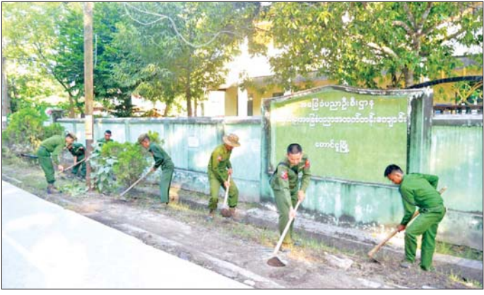
ထမ်းဟောင်းအဖွဲ့ဝင်များ၊ ဌာနဆိုင်ရာဝန်ထမ်းများ၊ လူမှုရေးအသင်းအဖွဲ့များနှင့် ဒေသခံပြည်သူများက အခြေခံပညာကျောင်းများ၊ အတွင်း/အပြင်ရှိ ချိုနယ် ပေါင်းမြက်များ ခုတ်ထွင်ရှင်းလင်းခြင်း၊ အမှိုက်များ ရှင်းလင်းခြင်း၊ ရေစီးရေလာကောင်းမွန်စေရေး ရေနုတ်မြောင်းများ တူးဖော်ပေးခြင်း၊ ရေကန်များတွင် အတိတ်ဆေးများခတ်ပေးခြင်း၊ ခြင်္သေ့အောင်းနိုင်သည့် နေရာများအား ခြင်ဆေးဖျန်းခြင်းနှင့် ကျန်းမာရေး သတင်းစဉ်

နေပြည်တော် နိုဝင်ဘာ ၁၅ ၂၀၂၅-၂၀၂၆ ပညာသင်နှစ်တွင် တက်ရောက် သင်ကြားလျက်ရှိသည့် ကျောင်းသား ကျောင်းသူများ အဆင်ပြေချောမွေ့စွာ ပညာသင်ကြားနိုင်ရေးနှင့် တက္ကသိုလ်များ၊ ပညာရေးကောလိပ်များနှင့် စာသင် ကျောင်းများ၊ ဥပဓိရုပ်ကောင်းမွန်စေရေးအတွက် တိုင်းဒေသကြီးနှင့် ပြည်နယ်အသီးသီးရှိ အခြေခံပညာ ကျောင်းများ၌ ကျောင်းပတ်ဝန်းကျင် သန့်ရှင်း သာယာလှပရေးကို နယ်မြေခံတပ်မတော်သားများ၊ ဌာနဆိုင်ရာဝန်ထမ်းများ၊ လူမှုရေးအသင်းအဖွဲ့များနှင့် ဒေသခံပြည်သူများက စုပေါင်းသန့်ရှင်းရေးလုပ်ငန်း များ ဆောင်ရွက်လျက်ရှိသည်။ စုပေါင်းဆောင်ရွက် ထိုသို့ ဆောင်ရွက်ပေးလျက်ရှိရာ ယနေ့တွင် ရှမ်းပြည်နယ်(မြောက်ပိုင်း) လားရှိုးမြို့နယ်၊ ရန်ကုန် တိုင်းဒေသကြီး စမ်းချောင်းမြို့နယ်အပါအဝင် မြို့နယ် ၁၆ မြို့နယ်နှင့် ပဲခူးတိုင်းဒေသကြီး တောင်ငူ မြို့နယ်တို့၌ နယ်မြေခံတပ်မတော်သားများ၊ မြန်မာ နိုင်ငံရဲတပ်ဖွဲ့ဝင်များ၊ မီးသတ်တပ်ဖွဲ့ဝင်များ၊ စစ်မှု