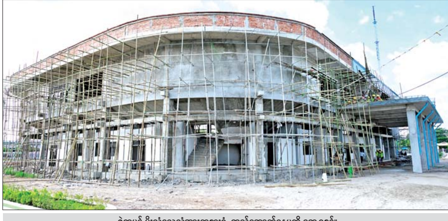
ဇွဲကပင် မိုးလုံလေလုံအားကစားရုံ တည်ဆောက်နေမှုကို တွေ့ရစဉ်။

ကြောင်း ပြောကြားသည်။ ထို့နောက် နိုင်ငံတော်ယာယီသမ္မတ နိုင်ငံတော်လုံခြုံရေးနှင့် အေးချမ်းသာယာရေး ကော်မရှင်ဥက္ကဋ္ဌသည် ခင်းကျင်းပြသထားသည့် ကရင်ပြည်နယ်အတွင်းရှိ အသေးစား၊ နယ်လမ်းစားနှင့် အလတ်စား စီးပွားရေးလုပ်ငန်းများ (MSME)မှ ထွက်ရှိသည့် ထုတ်ကုန် ပစ္စည်းများအား စိတ်ပါဝင်စားစွာဖြင့် လှည့်လည်ကြည့်ရှုပြီး တာဝန်ရှိသူများ၏ တင်ပြချက်များအပေါ် လိုအပ်သည်များလမ်းညွှန်မှာကြားသည်။ လူငယ်စင်တာ