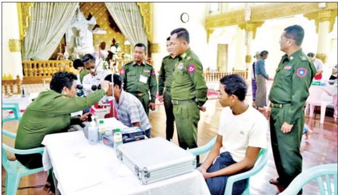
တက်ရောက်ကုသနိုင်ရေး စီစဉ် ကို မန္တလေးတပ်နယ်မှ တာဝန်ရှိ ညှိနှိုင်းဆောင်ရွက်ပေးခဲ့ကြောင်း ဆောင်ရွက်ပေးသည်။ သွားရောက်ကြည့်ရှု သိရသည်။ ဆေးပေးပြီး လိုအပ်သည်များ သတင်းစဉ်

နေပြည်တော် နိုဝင်ဘာ ၁၅ မန္တလေးတိုင်းဒေသကြီး မဟာ သည်။ အောင်မြေမြို့နယ် သံလျက်မှော် ထိုသို့ ဆောင်ရွက်ပေးရာတွင် အရှေ့ရပ်ကွက် အဝေရာရာမ ဆေးကုသရေးအဖွဲ့က သံယာ တော် ၇၂ ပါးနှင့် ဒေသခံပြည်သူ ၁၅၅ ဦးတို့အား သွေးတိုးရောဂါ၊ ယနေ့နံနက်ပိုင်းတွင် အဆစ်အမျက်ရောင်ရောဂါ၊ ဆီးချို အလယ်ပိုင်းတိုင်း စစ်ဌာနချုပ် ရောဂါ၊ သားဖွားမီးယပ်ရောဂါ၊ နယ်မြေခံ ဆေးကုသရေးအဖွဲ့က အသက်ရှူ လမ်းကြောင်းဆိုင်ရာ အဆို့ပါကျောင်းတိုက်ရှိ ဓမ္မာရုံ၌ ရောဂါ၊ မျက်စိရောဂါ၊ သွားနှင့် ကျန်းမာရေး စောင့်ရှောက်မှု ခံတွင်းရောဂါ၊ ခွဲစိတ်ကုသမှု ဆိုင်ရာရောဂါ၊ ကလေးရောဂါ၊ အထွေထွေရောဂါတို့နှင့် ပတ်သက် ရှိ လိုအပ်သည့် ကျန်းမာရေး စစ်ဆေးကုသပေးခြင်းများ ဆောင် ရွက်ပေးခြင်းနှင့် ကျန်းမာရေး အသိပညာပေး ဟောပြော ဆွေးနွေးခြင်းများ ဆောင်ရွက် ပေးပြီး ဆေးရုံတက်ရောက်ကုသ ရန် လိုအပ်သည့် သံယာတော်များ နှင့် ဒေသခံပြည်သူများအား နယ်မြေခံ တပ်မတော်ဆေးရုံသို့