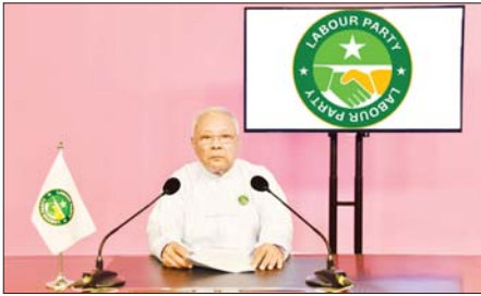
“လေးစားအပ်ပါသော ပြည်ထောင်စုသမ္မတမြန်မာနိုင်ငံတော် တစ်ဝန်းလုံးမှ အလုပ်သမား၊ လယ်သမား၊ ပြည်သူလူထုတစ်ရပ်လုံး ခင်ဗျား”

လောဘပါတီဥက္ကဋ္ဌ ဦးမြင့်သန်းက ၎င်းတို့၏ မူဝါဒ၊ သဘောထား၊ လုပ်ငန်းစဉ် စသည်တို့ကို နိုဝင်ဘာ ၁၅ ရက် ညပိုင်းတွင် ရေဒီယိုနှင့် ရုပ်မြင်သံကြားအစီအစဉ်များမှ ဟောပြောတင်ပြခဲ့ပါသည်။ အဆိုပါ ဟောပြောတင်ပြချက် အပြည့်အစုံမှာ အောက်ပါအတိုင်း ဖြစ်ပါသည်-