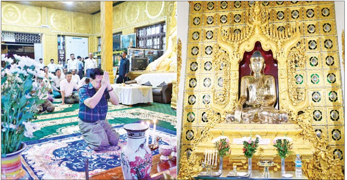
ပြည်ထောင်စုသမ္မတမြန်မာနိုင်ငံတော် ယာယီသမ္မတ နိုင်ငံတော်လုံခြုံရေးနှင့် အေးချမ်းသာယာရေးကော်မရှင်ဥက္ကဋ္ဌ ဗိုလ်ချုပ်မှူးကြီးမင်းအောင်လှိုင် မော်လမြိုင်မြို့ ကျက်သရေဆောင် ကျိုက်သလ္လံစေတီတော်မြတ်ကြီးရှိ ဗုဒ္ဓရုပ်ပွားတော်မြတ်အား ဖူးမြော်ကြည်ညိုစဉ်။

ဖူးမြော်ကြည်ညို ထို့နောက် စေတီတော်မြတ်ကြီးရှိ ဗုဒ္ဓရုပ်ပွားတော်မြတ်အား