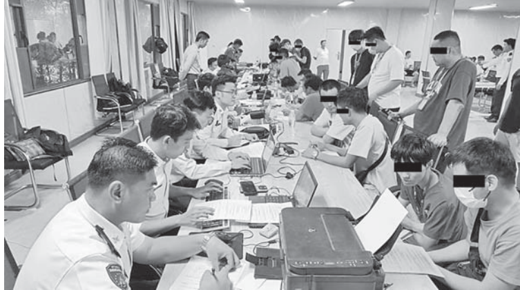
အွန်လိုင်းလိမ်လည်မှု (Telecom Fraud) နှင့် ဒုစရိုက်မူလုပ်ငန်းများတွင် ဆက်စပ်ပါဝင်ခဲ့ကြသည့် ပြည်ပနိုင်ငံသားများအား သက်ဆိုင်ရာနိုင်ငံသို့ လွှဲပြောင်းပေးအပ်နိုင်ရေးဆောင်ရွက်စဉ်။

ထိုသို့ ဖော်ထုတ်ထိန်းသိမ်းနိုင်ခဲ့သည့် ပြည်ပနိုင်ငံသား ၃၄၆ ဦးကို မြဝတီမြို့နယ်၊ ပူလှပူ ကျေးရွာအုပ်စု၊ ရွှေကုက္ကိုလ်မြိုင်ကျေးရွာအတွင်း လုံထင်းဝင်းရှိ အဆောက်အအုံ၌ ထိန်းသိမ်းထားရှိပြီး တရားမဝင် ပြည်ပနိုင်ငံသား စစ်ဆေးရေးအဖွဲ့မှ စစ်ဆေးခဲ့ရာ ပြည်ပနိုင်ငံသား ၂၀၀ ဦးကို စစ်ဆေးနိုင်ခဲ့ပြီး သက်ဆိုင်ရာနိုင်ငံများသို့ အမြန်ဆုံး ပြန်လည်လွှဲပြောင်းပေးနိုင်ရေးအတွက် ဌာနဆိုင်ရာပူးပေါင်းအဖွဲ့များ၏ လိုအပ်သည့် ကိုယ်ရေးအချက်အလက်များနှင့် မှတ်တမ်းများ စာရင်းကောက်ယူခြင်းလုပ်ငန်း ဆောင်ရွက်နေမှုတို့ကို ကရင်ပြည်နယ်အစိုးရအဖွဲ့