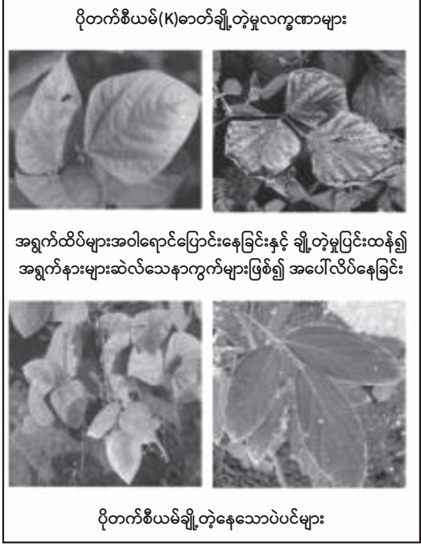
ပိုတက်စီယမ်(K)ဓာတ်ချို့တဲ့မှုလက္ခဏာများ

နိုက်ထရိုဂျင်(N)ဓာတ်ချို့တဲ့ခြင်း ပဲမျိုးစုံတွင် နိုက်ထရိုဂျင်ချို့တဲ့ပါက အရွက်ရင့်များ အစိမ်းဖျော့ အဝါ