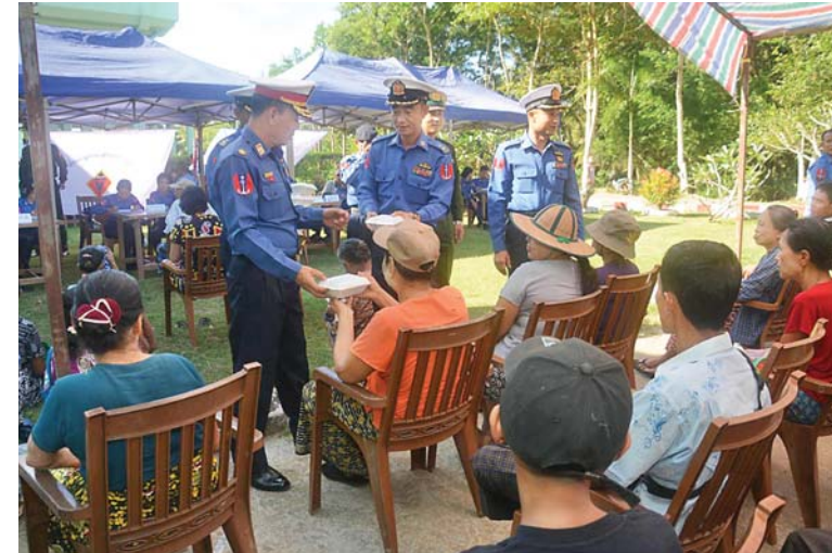
နယ်မြေခံတပ်မှတာဝန်ရှိသူများက ဆေးကုသမှုခံယူနေသော ဒေသခံပြည်သူများအား စားသောက်ဖွယ်ရာများပေးအပ်စဉ်။

သံလွင်သင်္ဘောကြီးရောက်နေတယ်ဆိုတာ သိရတယ်။ ဆေးဗိုလ်ကြီးတွေ၊ ပါရဂူကြီးတွေလည်း ပါတယ်ဆိုတော့ ခါးနာတာလာပြတာပါ။ သင်္ဘောကြီးနဲ့ပါလာတဲ့ ပါရဂူကြီးတွေ တပ်မတော်ဆေးရုံက ဆရာဝန်တွေပေါ့နော်။ ပြီးလို့ရှိရင် နိုင်ငံတော်အကြီးအကဲတွေ အခုလိုမျိုး စားစရာသောက်စရာတွေ အပြည့်အစုံနဲ့ ထမင်းဘူးတို့ရေတို့ကအစ ဘာမှကြည့်စရာမလိုအောင်လုပ်ပေးတဲ့အတွက် အားလုံးကိုလည်း ကျေးဇူးတင်ပါ