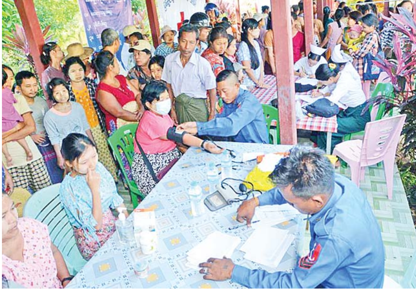
တပ်မတော်မြစ်တွင်းသွား ဆေးရုံရေယာဉ် (ရွှေပုဇွန်)နှင့် မြစ်ရေယာဉ်(စကု)နှင့်အတူ လိုက်ပါလာသည့် ပါရဂူများ၊ ဆေးမှူးများ၊ သူနာပြုများပါဝင်သော တပ်မတော်နယ်လှည့် အထူးကုဆေးအဖွဲ့က ဒေသခံပြည်သူများအား ကျန်းမာရေးစောင့်ရှောက်မှု လုပ်ငန်းများ ဆောင်ရွက်ပေးစဉ်။