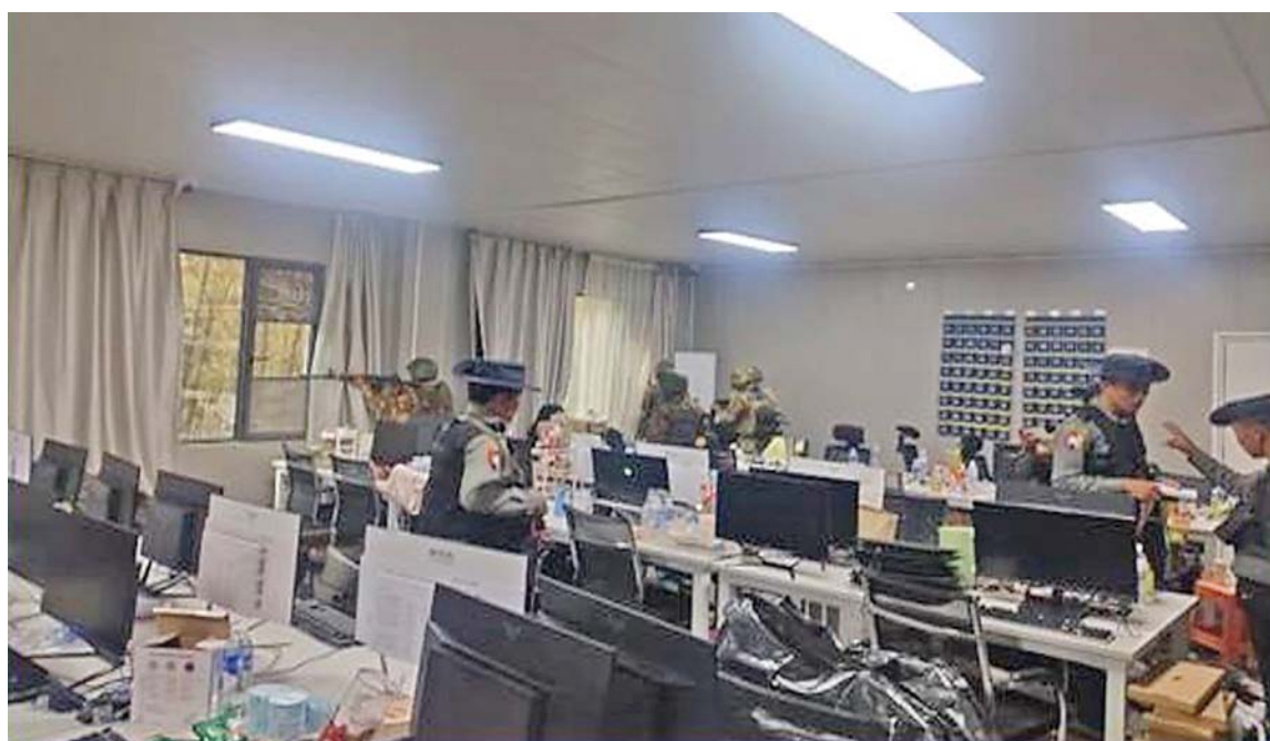
ရွှေကုက္ကိုလ်နယ်မြေအတွင်း၌ အွန်လိုင်းလိမ်လည်လောင်းကစားမှုများကျူးလွန်ရာတွင် အသုံးပြုလျက်ရှိသည့် ကွန်ပျူတာများအား သိမ်းဆည်းရမိမှုကိုတွေ့ရစဉ်။