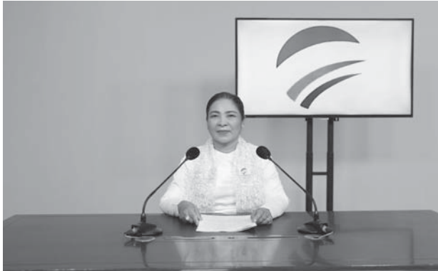
ဒေါ်စန္ဒာဦး (ဥက္ကဋ္ဌ မတူကွဲပြားခြင်းနှင့် ငြိမ်းချမ်းရေးပါတီ)

မတူကွဲပြားခြင်းနှင့်ငြိမ်းချမ်းရေးပါတီဥက္ကဋ္ဌဒေါ်စန္ဒာဦးက ၎င်းတို့၏ မူဝါဒ၊ သဘောထား၊ လုပ်ငန်းစဉ် စသည်တို့ကို နိုဝင်ဘာလ ၁၉ ရက် ညပိုင်းတွင် ရေဒီယိုနှင့်ရုပ်မြင်သံကြားအစီအစဉ်များမှ ဟောပြောတင်ပြခဲ့ပါသည်။ အဆိုပါဟောပြောတင်ပြချက်အပြည့်အစုံမှာ အောက်ပါအတိုင်းဖြစ်ပါသည်-