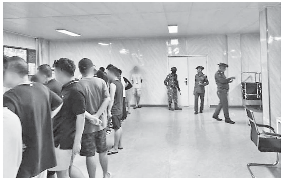
Arrests and investigations of foreigners who entered Shwe Kokko illegally.

being detained at the building in Lonhtinwun of Shwe Kokko Village, Pulwepu Village-tract in Myawady Township. The Illegal Foreigner Investigation Team verified 200 foreign nationals. Moreover, compilation of biography and records of those arrestees are being conducted by departmental teams so as to hand over those arrestees to relevant countries as quickly