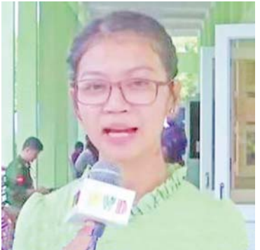
တယ်။ ကျွန်မတို့လိုမျိုး လာပြတဲ့လူနာတွေ အကုန်လုံးကို လိုလေသေးမရှိ အကုန်ပြီး

ပြည့်စုံအောင်လုပ်ပေးတဲ့အတွက် အားလုံး ကျန်းမာချမ်းသာပါစေလို့ဆုတောင်းမေတ္တာပို့သပါတယ်” ဟုပြောသည်။ “မျက်လုံးကြည့်ရတာအဆင်မပြေလို့ လာပြတာဖြစ်ပါတယ်။ အရင်တုန်းကဆိုရင် ညီမတို့ဆေးခန်းသွားပြရင် သွားရေးလားရေး