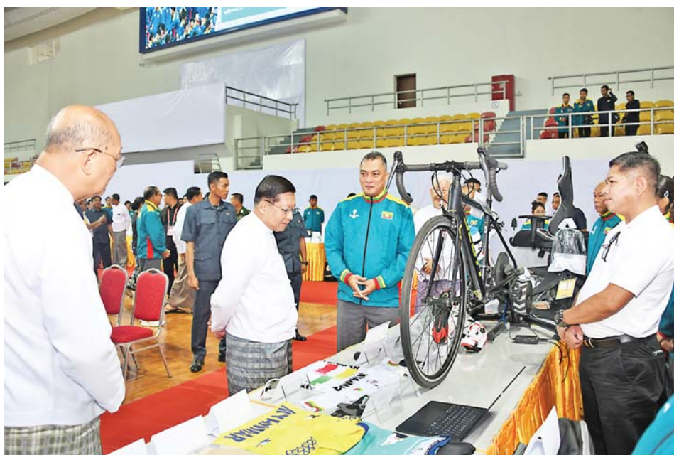
Acting President of the Republic of the Union of Myanmar, Chairman of the State Security and Peace Commission Senior General Min Aung Hlaing inspects sports gears to be used by athletes who will participate in the 33 rd SEA Games in Thailand.