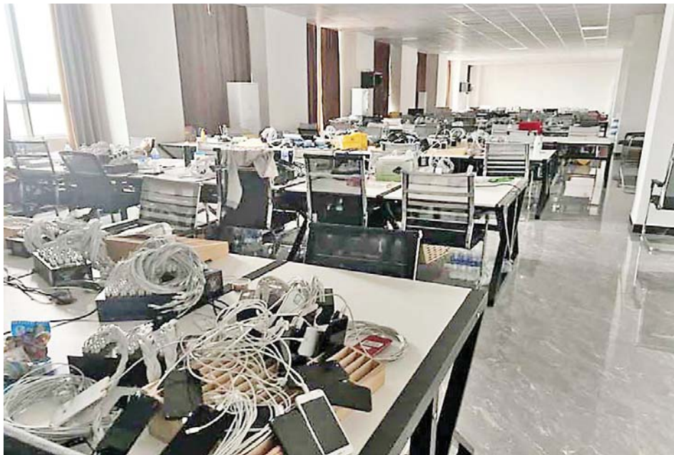
The seizure of mobile phones used in online gambling and scams in Shwe Kokko Area.