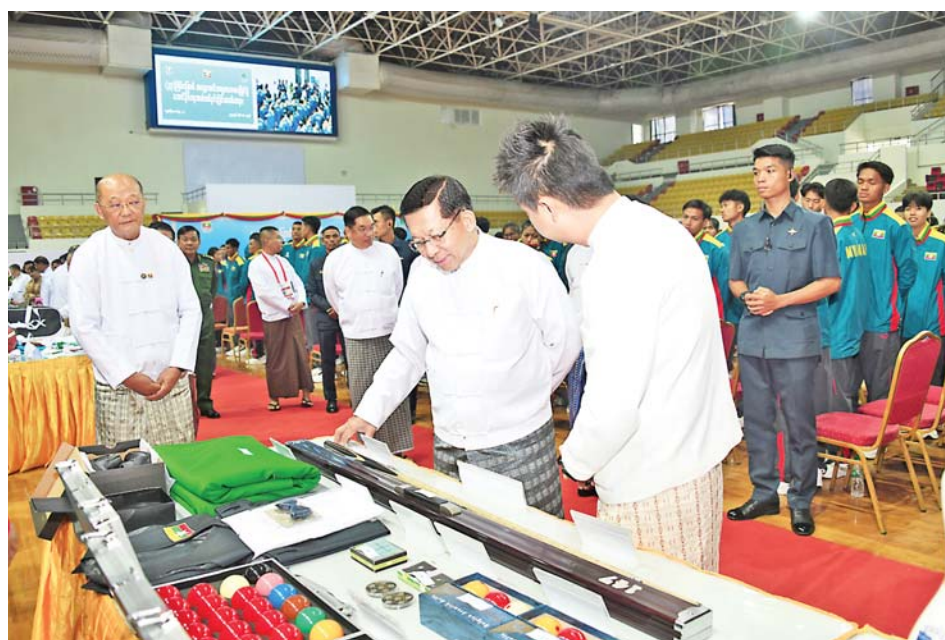
Acting President of the Republic of the Union of Myanmar, Chairman of the State Security and Peace Commission Senior General Min Aung Hlaing inspects sports gears to be used by athletes who will participate in the 33 rd SEA Games in Thailand.

sports federations, invited guests, athletes, managers, coaches of the contingent, and officials.