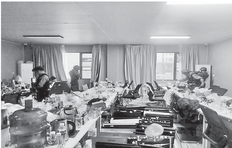
The seizure of computers used in online gambling and scam operations in Shwe Kokko Area.

nals under scrutiny living in Myanmar illegally were arrested together with 2,653 computers, 19,650 mobile phones and a large number of industrial materials used in the online