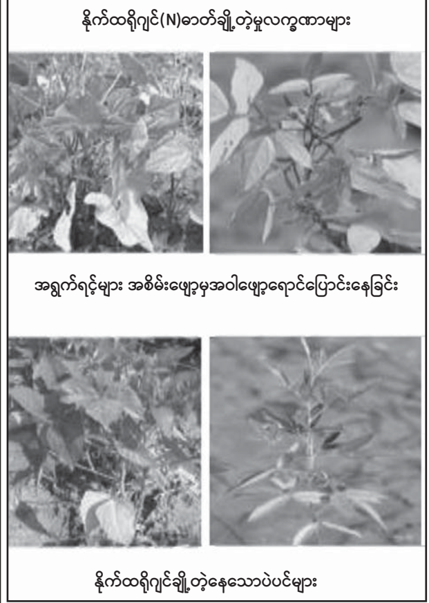
နိုက်ထရိုဂျင်(N)ဓာတ်ချို့တဲ့မှုလက္ခဏာများ

ကယ်စီယမ် (Ca) ဓာတ်ချို့တဲ့ခြင်း ပဲမျိုးစုံတွင် ကယ်စီယမ်ချို့တဲ့ပါက အရွက်နုများ အစိမ်းဖျော့ရောင် ပြောင်းပြီး အရွက်မြွှာများ၏ ရွက်ကြောကြားတွင် နီညိုရောင်ဆဲလ် သေနာကွက်များဖြစ်လာသည်။ ရွက်ကြောကြားများတွင် အဖုအထစ် ပုံစံများ တွေ့ရနိုင်သည်။ ထိပ်ဖူးများညှိုး၍ သေသွားနိုင်သည်။ ကယ်စီယမ် ချို့တဲ့ပါက ရွက်ဖျန်းမြေဩဇာအဖြစ် ရေတစ်လီတာလျှင် ကယ်စီယမ် ဆာလဖိတ် ၁၀ ဂရမ် ၁ ရာခိုင်နှုန်းအား နှစ်ပတ်တစ်ကြိမ်ဖျန်းပေးသင့်သည်။