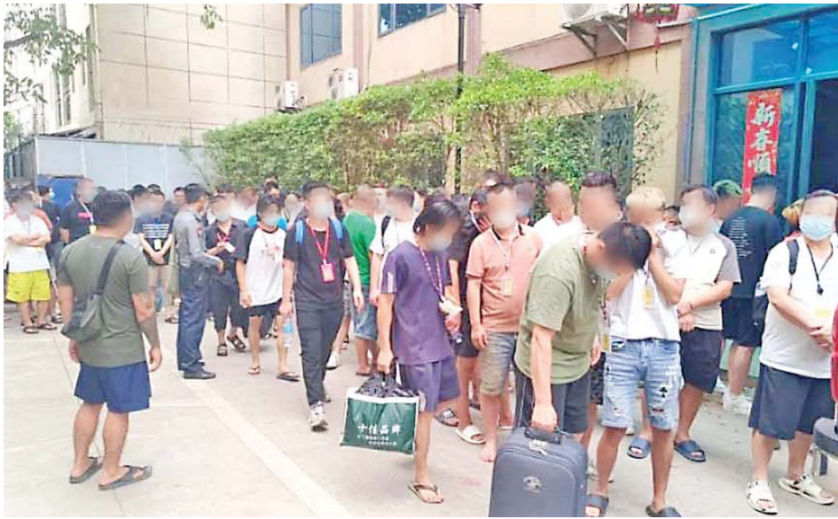
Arrests and investigations of foreigners who entered Shwe Kokko illegally.