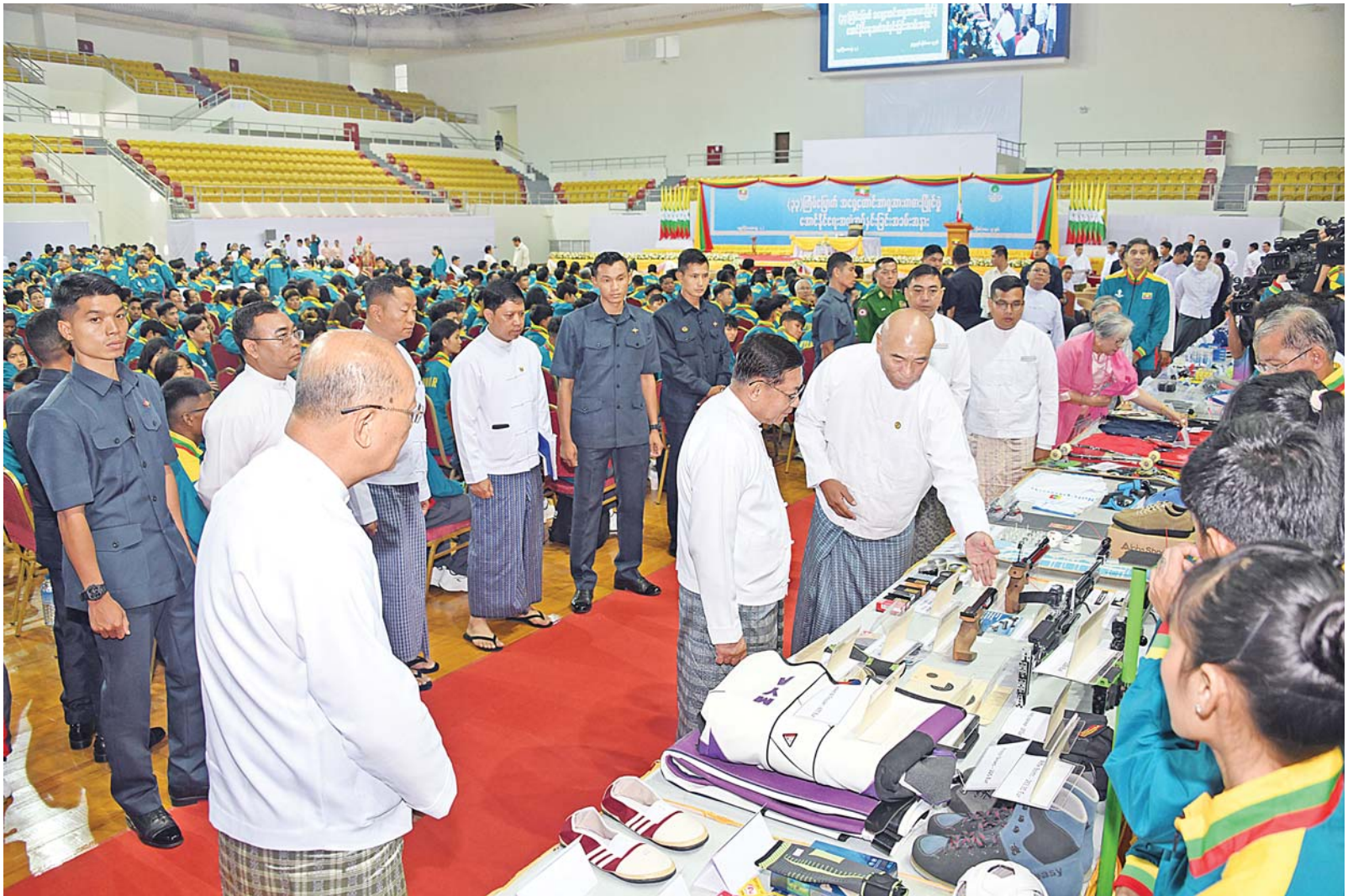
ပြည်ထောင်စုသမ္မတမြန်မာနိုင်ငံတော် ယာယီသမ္မတ နိုင်ငံတော်လုံခြုံရေးနှင့် အေးချမ်းသာယာရေးကော်မရှင်ဥက္ကဋ္ဌ ဗိုလ်ချုပ်မှူးကြီးမင်းအောင်လှိုင် အားကစားအဖွဲ့များ အသုံးပြုမည့် အားကစားနည်းများအလိုက် အသုံးအဆောင်ပစ္စည်းများအား ပြခန်းတစ်ခုချင်းစီအလိုက် လိုက်လံကြည့်ရှုစစ်ဆေးစဉ်။

ထို့ကြောင့် မိမိတို့တာဝန်ယူနေစဉ်ကာလ တွင် ကျန်းမာရေးနှင့်အားကစားဝန်ကြီး