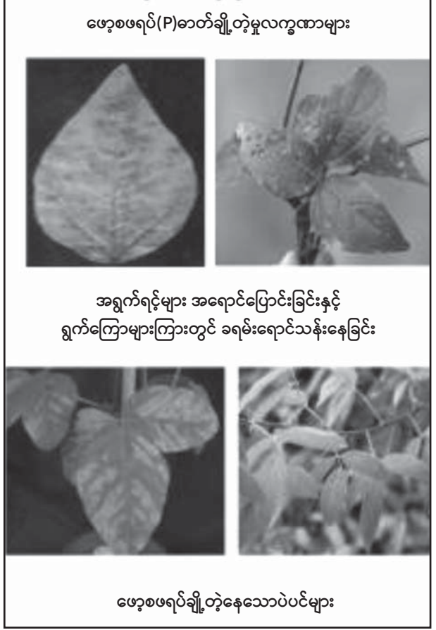
ဖော့စဖရပ်(P)ဓာတ်ချို့တဲ့မှုလက္ခဏာများ