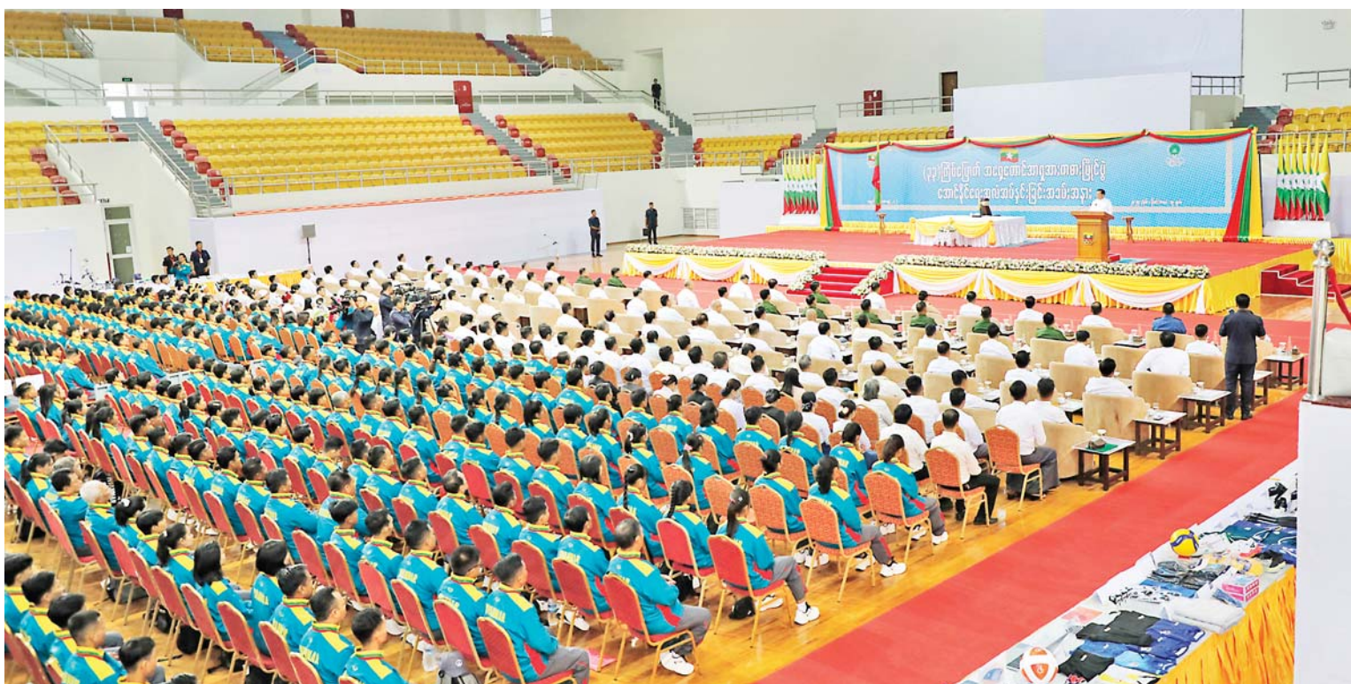
Acting President of the Republic of the Union of Myanmar, Chairman of the State Security and Peace Commission Senior General Min Aung Hlaing delivers an address to athletes who will participate in the 33 rd SEA Games in Thailand.

Also present were SSPC member Prime Minister U Nyo Saw, SSPC Secretary Joint Executive Chief General Ye Win Oo, SSPC members, union ministers, union level dignitaries, senior military officers from the Office of the Commander-in-Chief, the Nay Pyi Taw Command commander, deputy ministers, members of Myanmar Olympic Council, presidents and vice presidents of Myanmar