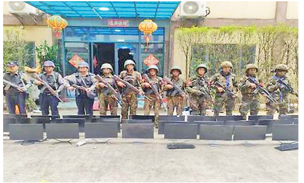
The seizure of computers used in online gambling and scam operations in Shwe Kokko Area.