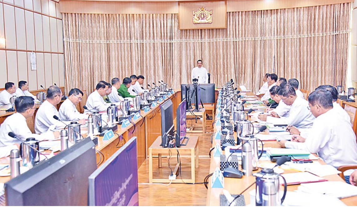
နိုင်ငံတော်ဝန်ကြီးချုပ် ဦးညိုစော ပြည်ထောင်စုသမ္မတမြန်မာနိုင်ငံတော် ပြည်ထောင်စုအစိုးရအဖွဲ့အစည်းအဝေး (၅/၂၀၂၅)တွင် အမှာစကားပြောကြားစဉ်။

ဦးစွာ ပြည်ထောင်စုအစိုးရအဖွဲ့အစည်းအဝေးအမှတ်စဉ်(၄/၂၀၂၅)မှတ်တမ်းကို အတည်ပြုခြင်းဆောင်ရွက်သည်။ ထို့နောက် နိုင်ငံတော်ဝန်ကြီးချုပ်က အဖွင့်အမှာစကားပြောကြားရာတွင် မိမိတို့အနေဖြင့် နိုင်ငံ၏ နိုင်ငံရေး၊ စီးပွားရေး၊ လူမှုရေးနှင့်