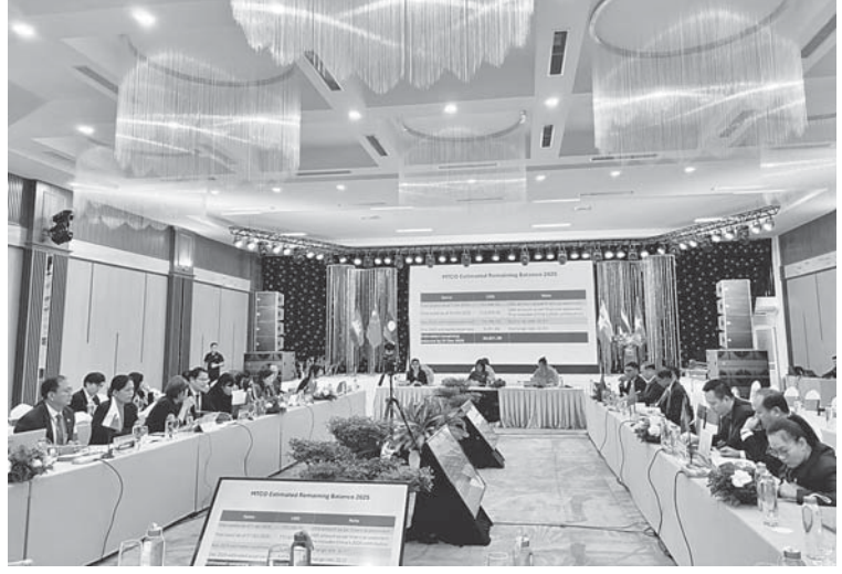
ခရီးသွားလုပ်ငန်းရှင်များအသင်းမှ ကိုယ်စား လှယ်များ ပါဝင်တက်ရောက်ကြသည်။ နိုဝင်ဘာလ ၁၇ ရက်တွင် (၅၆)ကြိမ်မြောက် မဟာမဲခေါင်ဒေသခွဲခရီးသွားလုပ်ငန်းအဖွဲ့ အစည်းအဝေးကို ဗီယက်နမ်နိုင်ငံအမျိုး သားခရီးသွားလုပ်ငန်းအာဏာပိုင်အဖွဲ့ ဒုတိယဥက္ကဋ္ဌ Ms. Nguyen Thi Hoa Mai က ဥက္ကဋ္ဌအဖြစ်ဆောင်ရွက်ပြီး အစည်း အဝေးတွင် မဲခေါင်ခရီးသွားလုပ်ငန်းဖိုရမ် ၂၀၂၅ နှင့် ဆက်စပ်အစည်းအဝေးဆုံးဖြတ်

နေပြည်တော် နိုဝင်ဘာ ၁၉ (၅၆)ကြိမ်မြောက် မဟာမဲခေါင်ဒေသခွဲ ခရီးသွားလုပ်ငန်းအဖွဲ့အစည်းအဝေးနှင့် မဟာမဲခေါင်ဒေသခွဲ ခရီးသွားလုပ်ငန်း ညှိနှိုင်းရေးရုံးဘုတ်အဖွဲ့အစည်းအဝေးများ ကို နိုဝင်ဘာလ ၁၇ ရက်မှ ၁၉ ရက်အထိ ဗီယက်နမ်နိုင်ငံ ယဉ်ကျေးမှု၊ အားကစားနှင့် ခရီးသွားလုပ်ငန်းဝန်ကြီးဌာနက ဗီယက်နမ် နိုင်ငံ နမ့်ဘင်မြို့၌ အိမ်ရှင်အဖြစ် လက်ခံ ကျင်းပသည်။ အစည်းအဝေးသို့ မဟာမဲခေါင်ဒေသခွဲ နိုင်ငံများမှခရီးသွားလုပ်ငန်းအာဏာပိုင်အဖွဲ့ ခေါင်းဆောင်များနှင့် ကိုယ်စားလှယ်များ၊ မဲခေါင်ခရီးသွားလုပ်ငန်းညှိနှိုင်းရေးရုံးမှ အလုပ်အမှုဆောင် ဒါရိုက်တာ၊ ဒေသတွင်း ခရီးသွားလုပ်ငန်းဆိုင်ရာ အစိုးရပုဂ္ဂလိက ကိုယ်စားလှယ်များနှင့် ခရီးသွားလုပ်ငန်း ဆိုင်ရာပညာရှင်များ ပါဝင်တက်ရောက်ပြီး မြန်မာနိုင်ငံမှ ဟိုတယ်နှင့်ခရီးသွားလာရေး ဝန်ကြီးဌာန ဟိုတယ်နှင့်ခရီးသွားညွှန်ကြား မှုဦးစီးဌာန ညွှန်ကြားရေးမှူးချုပ်ဦးမောင် မောင်ကျော် ဦးဆောင်သော မြန်မာနိုင်ငံ ခရီးသွားလုပ်ငန်းအဖွဲ့ချုပ်နှင့် မြန်မာနိုင်ငံ