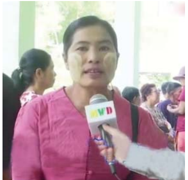
နေတဲ့အခါကျတော့ ခါးကကြာလာရင် တအားနာလာတယ်။ အခုနယ်လှည့်ဆေးကု