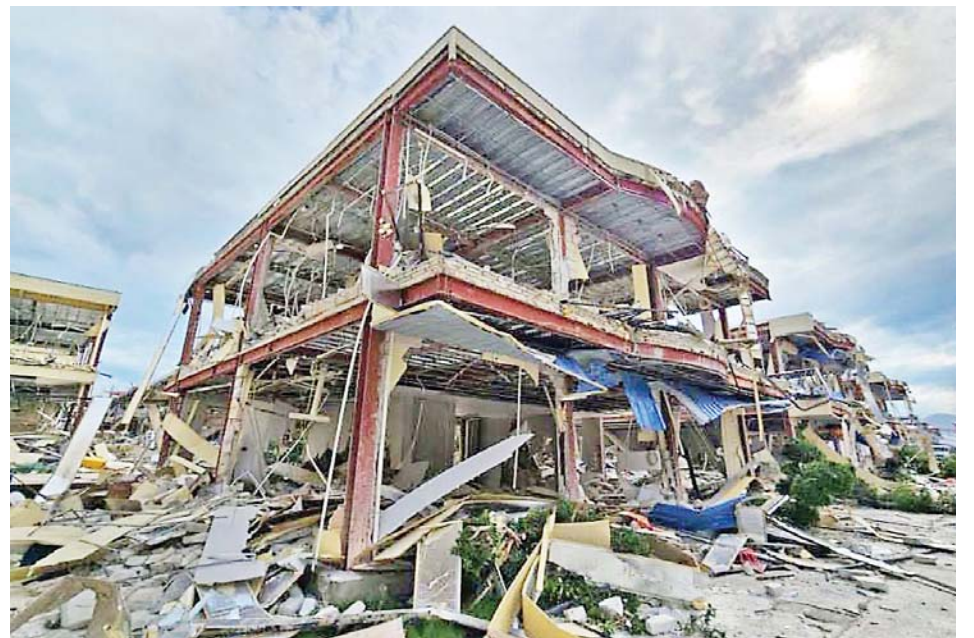
Buildings used in online gambling and scams seen after being blown up in KK Park.