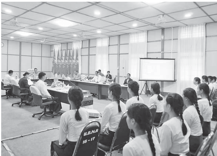
ကျောင်းသူများထားရှိမည့် အိပ်ဆောင် များ၊ စားရိပ်သာများ၊ စာသင်ဆောင်များနှင့် စိုက်ပျိုးမွေးမြူရေးဆောင်ရွက်ထားရှိမှု များကို ကြည့်ရှုစစ်ဆေးပြီး လိုအပ်သည်

ကျောင်းသူများကိုလည်းကောင်း၊ နိုဝင် ဘာလ ၁၈ ရက်မှ ၁၉ ရက်အထိ ပြည်ထောင်စု တိုင်းရင်းသားလူငယ်များ စွမ်းရည်ဖွံ့ဖြိုး ရေးဒီဂရီကောလိပ်၌ ၂၀၂၅-၂၀၂၆ ပညာ သင်နှစ် ဝိဇ္ဇာဘွဲ့၊ သိပ္ပံဘွဲ့နှင့် A.G.T.I ဒီပလိုမာ ပထမနှစ်တက် ရောက် မည့် ကျောင်းသား၊ ကျောင်းသူများကိုလည်း ကောင်း စိစစ်အတည်ပြုရွေးချယ်သည်။ ဒုတိယဝန်ကြီးသည် ကျောင်းသား၊ ကျောင်းသူများ ရွေးချယ်ရေးဆောင်ရွက် သည့် နေ့ရက်များတွင် တက္ကသိုလ်နှင့် ဒီဂရီကောလိပ်တွင် ညွှန်ကြားရေးမှူးများ၊ ပါမောက္ခ/ဌာနမှူးများ၊ ဆရာ၊ ဆရာမများ၊ ဝန်ထမ်းများ၊ ပထမနှစ်တက်ရောက်မည့် ကျောင်းသား၊ ကျောင်းသူများကို တွေ့ဆုံ အမှာစကားပြောကြားကာ ကျောင်းသား၊