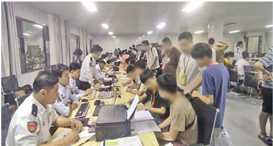
လိမ်လည် လောင်းကစားမှုကျူးလွန်မှုများ ကို အမျိုးသားရေးတာဝန်တစ်ရပ်အဖြစ် ခံယူကာ မြန်မာနိုင်ငံအတွင်း လုံးဝအခြေ

ရသည်။ ထိုသို့ ဖော်ထုတ်ထိန်းသိမ်းနိုင်ခဲ့သည့် ပြည်ပနိုင်ငံသားများကို မြဝတီမြို့နယ် ပုလွဲပူ ကျေးရွာအုပ်စု၊ ရွှေကုက္ကိုလ်မြိုင်ကျေးရွာ အတွင်း လုံထင်းဝန်းရှိ အဆောက်အအုံ၌ ထိန်းသိမ်းထားရှိပြီး တရားမဝင်ပြည်ပ နိုင်ငံသားစစ်ဆေးရေးအဖွဲ့မှ စစ်ဆေးခဲ့ရာ ပြည်ပနိုင်ငံသား ၂၀၀ ဦးကို စစ်ဆေးနိုင်ခဲ့ပြီး သက်ဆိုင်ရာနိုင်ငံများသို့ အမြန်ဆုံး ပြန်လည်လွှဲပြောင်းပေးနိုင်ရေးအတွက် ဌာနဆိုင်ရာပူးပေါင်းအဖွဲ့များ၏ လိုအပ် သည့် ကိုယ်ရေးအချက်အလက်များနှင့် မှတ်တမ်းများ စာရင်းကောက်ယူခြင်း လုပ်ငန်းများ ဆောင်ရွက်ပေးလျက်ရှိသည်။ နိုင်ငံတော်အစိုးရအနေဖြင့် Online