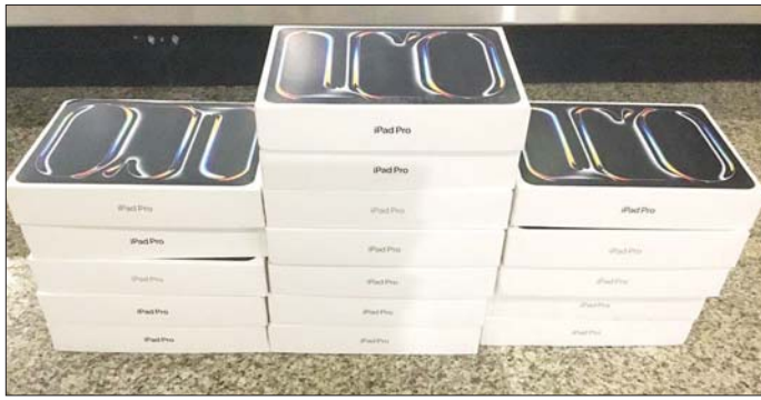
အကောက်ခွန်ဦးစီးဌာနမှ ဖမ်းဆီးရမိမှု။

စစ်ကိုင်းတိုင်းဒေသကြီး တရားမဝင်ကုန်သွယ်မှုတိုက်ဖျက်ရေးအဖွဲ့အဖွဲ့က ဒီဇင်ဘာ ၅ ရက်တွင် စစ်ကိုင်းမြို့နယ် ရတနာပုံ တံတားပူးပေါင်းစစ်ဆေးရေးဂိတ်၌ တရားမဝင်ရွှေတူးဖော်ရာတွင် အသုံးပြုသည့် မှုဆိုး ရှစ်လုံးအပါအဝင် ဆက်စပ်ပစ္စည်း သုံးမျိုး စုစုပေါင်း (ခန့်မှန်းတန်ဖိုးငွေကျပ် ၃၃၄၀၀၀၀)ကို လည်းကောင်း၊ ပဲခူးတိုင်းဒေသကြီး တရားမဝင်ကုန်သွယ်မှုတိုက်ဖျက်ရေးအဖွဲ့အဖွဲ့က ဒီဇင်ဘာ ၅ ရက်တွင် ဥသျှစ်ပင်မြို့နယ်အတွင်း၌ လိုင်စင်မဲ့မော်တော်ယာဉ် တစ်စီး (ခန့်မှန်းတန်ဖိုး ငွေကျပ် ၇၀၀၀၀၀)ကိုလည်းကောင်း၊ ရန်ကင်းဒေသကြီး တရားမဝင်ကုန်သွယ်မှုတိုက်ဖျက်ရေးအဖွဲ့အဖွဲ့က နိုဝင်ဘာ ၂၇ ရက်တွင် တိုက်ကြီးမြို့နယ် ဒဂုံမြို့သစ် (အရှေ့ပိုင်း)မြို့နယ်၊ ဒဂုံမြို့သစ်(ဆိပ်ကမ်း)မြို့နယ်၊ ကွမ်းခြံကုန်းမြို့နယ်နှင့် သန်လျင်မြို့နယ်တို့အတွင်း၌ တရားမဝင်ကျွန်းသစ် ၂ ဒဿမ ၇၂၀ တန်၊ အခြားသစ် ၀ ဒဿမ ၅၀၄ တန် (ခန့်မှန်းတန်ဖိုးငွေကျပ် ၃၄၀၂၀၀၀)နှင့် အဆိုပါသစ်များ တင်ဆောင်ထားသည့် လိုင်စင်ရှိ Toyota Probox တစ်စီး၊ Toyota Townace တစ်စီး၊ Hyundai Porter II တစ်စီး၊ လိုင်စင်မဲ့ Toyota Voxy တစ်စီး၊ (ခန့်မှန်းတန်ဖိုး ငွေကျပ် ၁၅၀၀၀၀၀) စုစုပေါင်း ခန့်မှန်းတန်ဖိုး ငွေကျပ် ၁၀၄၀၀၀၀ ကို လည်းကောင်း၊