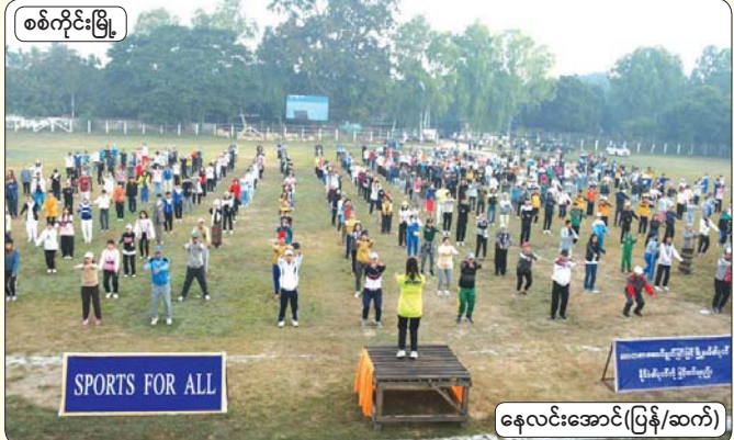
စစ်ကိုင်းမြို့

တစ်မျိုးသားလုံး ကျန်းမာကြံ့ခိုင်စေရန် ဒီဇင်ဘာလူထုအားကစားလအဖြစ် စုပေါင်း လမ်းလျှောက်ပွဲကို ဒီဇင်ဘာပထမပတ်မှစတင်၍ ဆောင်ရွက်လျက်ရှိရာ ဒီဇင်ဘာ ၂၀ ရက်က တတိယပတ်အဖြစ် စုပေါင်းလမ်းလျှောက်ပွဲများနှင့် စုပေါင်းကိုယ်ကာယကြံ့ခိုင်မှု လေ့ကျင့်ခန်းများကို နိုင်ငံတစ်ဝန်းရှိ အမြို့မြို့အနယ်နယ်၌ ကျင်းပလျက်ရှိသည်-