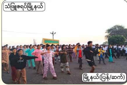
သံဖြူဇရပ်မြို့နယ်