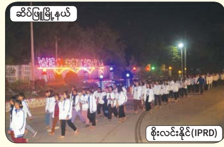
ဆိပ်ဖြူမြို့နယ်