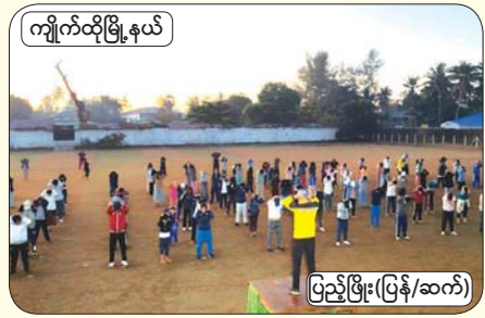
ကျိုက်ထိုမြို့နယ်