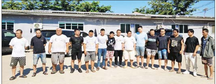
မြဝတီမြို့အတွင်း တရားမဝင်နိုင်ငံခြားသားများ ဖမ်းဆီးရရှိမှုကို တွေ့ရစဉ်။

◆ ကျော့မှူးမှ မြဝတီမြို့ မြေခိုကုန်းရပ်ကွက်အနီး လူမနေပိတ်ထားသည့် တည်းခို ခန်းအတွင်း၌ တရားမဝင်တရုတ် နိုင်ငံသား အမျိုးသား ၁၅ ဦးအား လည်းကောင်း၊ ဂိုဒေါင်နှစ်လုံး အတွင်း၌ တရားမဝင်ကုန်ပစ္စည်း များဖြစ်သော ကားကြီးတာယာ (ဆိုက် TX ၆၀) အလုံး ၂၀၀၊ မိုးကာ လိပ်အစိမ်း အလိပ် ၃၀၀၀၊ စက္ကူ လိပ်(အကြီး)အလိပ် ၂၀၊ Air Fiter ဘူး(အကြီး)အလုံး ၂၀၊ Air Fiter ဘူး(အသေး) အလုံး ၃၀၊ Battery စက်ဘီး ၁၆ စီး၊ ရေစုပ်မော်တာ (၁.၅ ကောင်) အလုံး ၁၀၀၊ Back Hoe ဘီးရွေ ၂၅ ခု၊ တစ်ရှူးဖာမျိုးစုံ ၃၀၀၀၊ စာရေးကိရိယာမျိုးစုံ ၅၀၀၀၊ အလှကုန်ပစ္စည်းအထုပ် ၂၅၀၊ သွပ်ဖာဆီလီကွန်ဖာ ၁၀၀၀၊ စက်ဘီးအစိး ၂၀၊ ကလေး တွန်းလှည်း ၁၅ ခုစုစုပေါင်း တရား မဝင်ကုန်ပစ္စည်း ၁၄ မျိုးအား လည်းကောင်း သိုလှောင်ထားရှိ ကြောင်း ဖော်ထုတ်ဖမ်းဆီးရမိခဲ့ သည်။ ထို့ပြင် မြဝတီမြို့အတွင်း၌ လည်း တရားမဝင် ဝင်ရောက် နေထိုင်သူများနှင့် အွန်လိုင်း လောင်းကစား ကျူးလွန်သူများ အား ဖမ်းဆီးရမိရေး လုံခြုံရေး ပူးပေါင်းအဖွဲ့များက သတင်းအရ မြဝတီမြို့ဝန်းကျင်တွင် ရှောင်တခင် စစ်ဆေးခြင်းများ မြဝတီမြို့အဝင်/ အထွက် လမ်းကြောင်းနေရာများ နှင့် လမ်းဆုံလမ်းခွဲနေရာများ တွင် ပိတ်ဆို့စစ်ဆေး ရှာဖွေ ရှင်းလင်းခြင်းများ ဆောင်ရွက်ခဲ့ရာ ယနေ့တွင်လည်း တရားမဝင် တစ်ထပ် အဆောက်အအုံငါးလုံး အား ထပ်စစ်ဆေးနိုင်ခဲ့ပြီး အဆိုပါ အဆောက်အအုံများ အနက်မှ