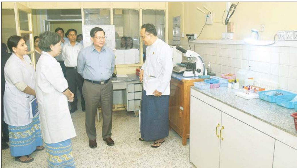
ပြည်ထောင်စုသမ္မတမြန်မာနိုင်ငံတော် ယာယီသမ္မတ နိုင်ငံတော်လုံခြုံရေးနှင့် အေးချမ်းသာယာရေးကော်မရှင်ဥက္ကဋ္ဌ ဗိုလ်ချုပ်မှူးကြီး မင်းအောင်လှိုင် မင်းဘူးမြို့ အထွေထွေရောဂါကုဆေးရုံကြီးအတွင်း ကြည့်ရှုစစ်ဆေးစဉ်။

နိုင်ငံတော်အစိုးရအနေဖြင့် မင်းဘူးဒေသဖွံ့ဖြိုးတိုးတက်ရေးအတွက် တတ်နိုင်သည့်ဘက်မှ ဆောင်ရွက်ပေးလျက်ရှိကြောင်း၊ ဒေသတွင် နေထိုင်ကြသူ