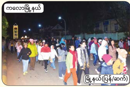
ကလေးမြို့နယ်