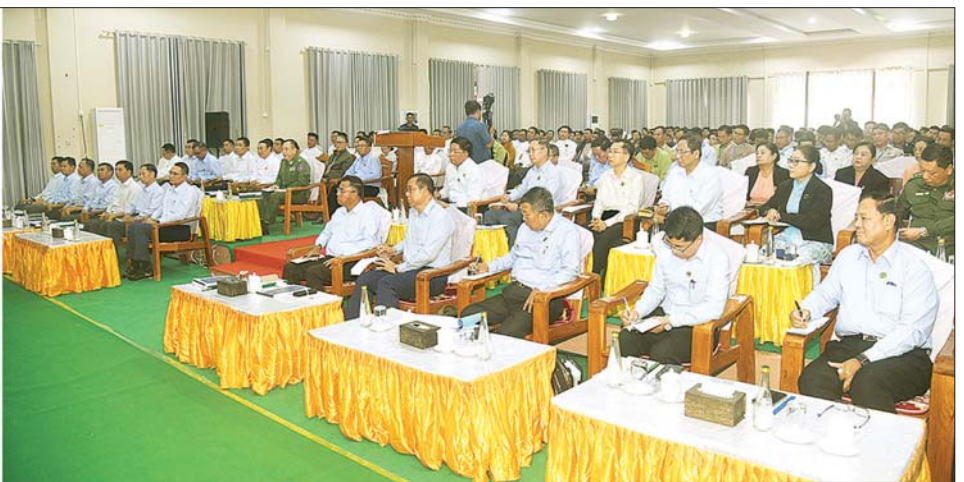
ပြည်ထောင်စုသမ္မတမြန်မာနိုင်ငံတော် ယာယီသမ္မတ နိုင်ငံတော်လုံခြုံရေးနှင့် အေးချမ်းသာယာရေးကော်မရှင်ဥက္ကဋ္ဌ ဗိုလ်ချုပ်မှူးကြီး မင်းအောင်လှိုင် မင်းဘူးမြို့ရှိ ဌာနဆိုင်ရာတာဝန်ရှိသူများ၊ မြို့မိမြို့ဖများ၊ အသေးစား၊ အငယ်စားနှင့် အလတ်စား (MSME) စီးပွားရေးလုပ်ငန်းရှင်များနှင့် တွေ့ဆုံ၍ ဒေသဖွံ့ဖြိုးတိုးတက်ရေးဆိုင်ရာများ ဆွေးနွေးပြောကြားစဉ်။