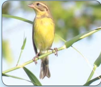
စာဝါကျားငှက်မျိုးစိတ်ကို တွေ့ရစဉ်။