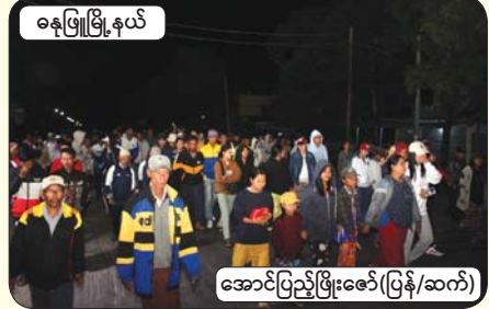
နေဖြူမြို့နယ်