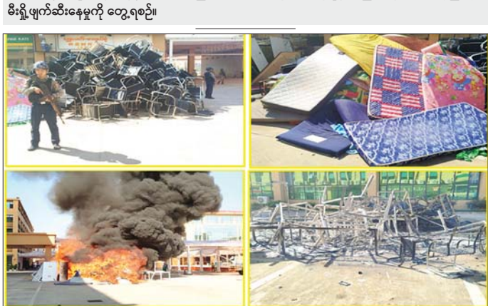
ရွှေကုက္ကိုလ်နယ်မြေအတွင်း အွန်လိုင်းလိမ်လည်လောင်းကစားသူများ အသုံးပြုခဲ့သည့် အသုံးဆောင်ပစ္စည်း များ စီးရီးပျက်ဆီးနေမှုကို တွေ့ရစဉ်။

ပျက်ဆီးခဲ့ကြောင်း သိရသည်။ နိုင်ငံတော်အနေဖြင့် အွန်လိုင်း လိမ်လည် လောင်းကစားမှု ကျူးလွန်ခြင်းများ ပပျောက်စေ ရေးကို မြန်မာနိုင်ငံအတွင်း ကျယ်ကျယ်ပြန့်ပြန့် ဆက်လက် နှိမ်နင်းသွားမည်ဖြစ်ပြီး ၎င်း လုပ်ငန်းများတွင် ပါဝင်ပတ်သက် နေသူများနှင့် နောက်ကွယ်မှ ကြိုးကိုင်နေသူများကို ဖော်ထုတ် ဖမ်းဆီး၍ ထိထိရောက်ရောက် ဆောင်ရွက်သွားမည်ဖြစ်ကြောင်း သတင်းရရှိသည်။ သတင်းစဉ်