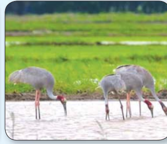
ကြိုးကြာခေါင်းနီငှက်မျိုးစိတ်ကို တွေ့ရစဉ်။

ဝါးခယ်မ ဒီဇင်ဘာ ၁၉ ရော့ဝတီတိုင်းဒေသကြီး ဝါးခယ်မမြို့နယ်ရှိ ဒေသခံ သားငှက်ထိန်းသိမ်းရေးဧရိယာအတွင်း ကျရောက် ရှင်သန်ကျက်စားလျက်ရှိသော ငှက်မျိုးစိတ်များကို စာဝါကျားကောင်ယူခြင်းလုပ်ငန်း ဆောင်ရွက်လျက် ရှိရာ လက်ရှိကာလအထိ ကမ္ဘာပေါ်တွင်သာမက မြန်မာနိုင်ငံမှာပါ ရှားပါးနေသော ငှက်မျိုးစိတ်များ ဖြစ်သည့် ကြိုးကြာခေါင်းနီ ငှက်မျိုးစိတ်၊ စာဝါကျား ငှက်မျိုးစိတ်နှင့် ကိုင်းရွှေငှက်မျိုးစိတ် သုံးမျိုး အပါအဝင် စုစုပေါင်း ငှက်မျိုးစိတ် ၁၆၉ မျိုးကို တွေ့ရှိမှတ်တမ်းတင်နိုင်ခဲ့ကြောင်း သိရသည်။ “ကြိုးကြာငှက်မျိုးစိတ်က မြန်မာနိုင်ငံမှာ ကျွန်တော်တို့ ဝါးခယ်မမြို့နယ်မှာ အများဆုံးရှိတာ။