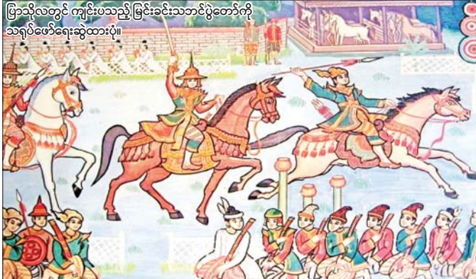
ပြာသိုလတွင် ကျင်းပသည့် မြင်းခင်းသဘင်ပွဲတော်ကို သရုပ်ဖော်ရေးဆွဲထားပုံ။

ရှေးခေတ်စာဆိုတော်ကြီးများသည် ပြာသိုလ မြင်းခင်းသဘင်ပွဲနှင့် ပတ်သက်၍ လေးချိုး၊ ရတု၊ ပျို့များဖြင့် ပွဲဆိုခဲ့ကြသည်။ စာဆိုပညာရှင်ကြီး လှိုင်မင်းက ပြာသိုလတွင်လေးချိုးတွင် “စွယ်ရောင်လျှံတောက်၊ ရဲမာန်မောက်တုံ၊ မှန်သောက်ဆန္ဒနု၊ သောင်းရှစ်ပြန်ကို၊ စိမ့်မကျင်း၊ စက်လျှင်သွင်းနု၊ မြင်းခင်းယံဗျူဟာ၊ အပြာဖြာလဲ၊ တညီလာပြု၊ ဗိုလ်သဘင်ရရှိခိုနို၊ ကိုက်နုဖူးစိပွင့်၊ အားအိအိတော့ပ၊