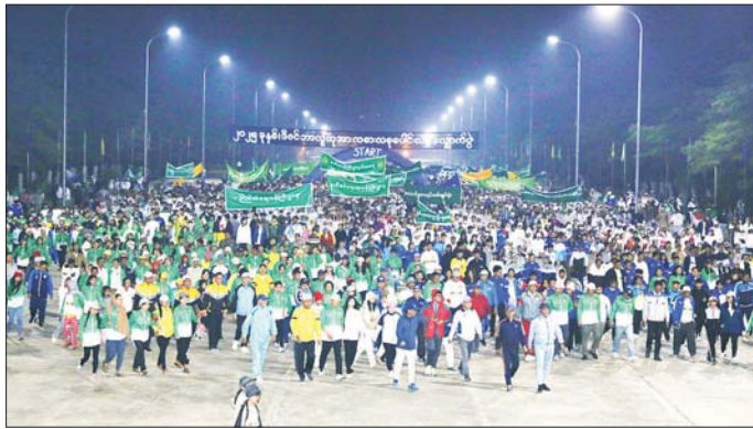
အတိုင်း ဂိတ်(A) ရှေ့အထိ ပျော်ပျော်ပါးပါး လမ်းလျှောက်ကြသည်။ (အပေါ်ပုံ) ထို့နောက် ကိုယ်လက်ကြံခိုင်ရေးလေ့ကျင့်ခန်းအတွဲ(၁)၊ (၂)နှင့် Physical Fitness Dance Exercises လေ့ကျင့်ခန်းများကို အားကစားနှင့်ကာယပညာဦးစီးဌာနမှ ဝန်ထမ်းများက သရုပ်ပြသပေး၍ စုပေါင်း

နေပြည်တော် ဒီဇင်ဘာ ၂၀ ၂၀၂၅ ခုနှစ် ဒီဇင်ဘာ လူထုအားကစားလ(တတိယပတ်) စုပေါင်းလမ်းလျှောက်ပွဲကို ယနေ့နံနက်ပိုင်းတွင် နေပြည်တော်ရှိ ဝဏ္ဏသိဒ္ဓိအားကစားကွင်း၌ ကျင်းပရာ ပြည်ထောင်စုဝန်ကြီးများ၊ ဒုတိယဝန်ကြီးများ၊ ဌာနဆိုင်ရာ အကြီးအကဲများနှင့် တာဝန်ရှိသူများ၊ ဝန်ထမ်းများနှင့် ဝန်ထမ်းမိသားစုများ စုစုပေါင်းအင်အား ၃၆၀၀ ကျော် ပျော်ရွှင်စွာပါဝင်ဆင်နွှဲကြသည်။ ဦးစွာ စုပေါင်းလမ်းလျှောက်ပွဲကို မြန်မာနိုင်ငံအိုလံပစ်ကော်မတီဥက္ကဋ္ဌ အားကစားနှင့် လူငယ်ရေးရာဝန်ကြီးဌာနနှင့် ဟိုတယ်နှင့်ခရီးသွားလာရေးဝန်ကြီးဌာန ပြည်ထောင်စုဝန်ကြီး Jeng Phang နော်တောင်က ခရားမှတ်၍ တာလွတ်ပေးရာ ပါဝင်ဆင်နွှဲကြသူများသည် ဝဏ္ဏသိဒ္ဓိအားကစားကွင်း၊ ဂိတ်အမှတ်(၁)မှ စတင်တာထွက်ကြပြီး ဝဏ္ဏသိဒ္ဓိအားကစားကွင်း၏ သတ်မှတ်လမ်းကြောင်းများ