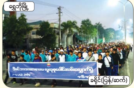
ရွှေဘိုမြို့