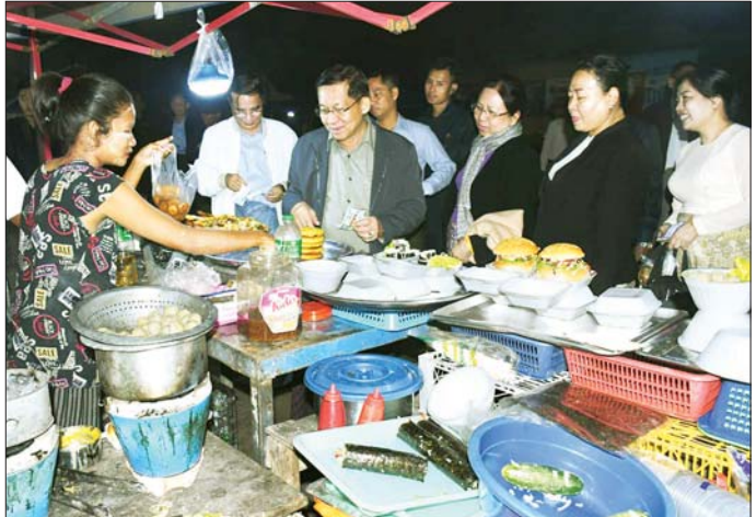
ပြည်ထောင်စုသမ္မတမြန်မာနိုင်ငံတော် ယာယီသမ္မတ နိုင်ငံတော်လုံခြုံရေးနှင့် အေးချမ်းသာယာရေးကော်မရှင်ဥက္ကဋ္ဌ ဗိုလ်ချုပ်မှူးကြီး မင်းအောင်လှိုင်နှင့် ဇနီး ဒေါ်ကြာကြာလှ ပြည်မြို့ ကမ်းနားလမ်းရှိ ခေတ္တရာညဈေးတန်း၌ ဈေးဆိုင်ခန်းများဖွင့်လှစ်ရောင်းချနေမှုကို လိုက်လံကြည့်ရှုပြီး ဝယ်ယူအားပေးစဉ်။

ရောဝတီမြစ်ရေ လက်ရှိရေမှတ်အောက် ကျဆင်းနိုင်