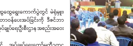
ဆက်လက်ပြီးနည်းပညာအထောက်အကူပြုဆွေးနွေးမှုများက တက်ရောက်လာကြသူများအား အီလက်ထရောနစ်မဲပေးစက် တပ်ဆင်ကိုင်တွယ် အသုံးပြုပုံအဆင့်ဆင့်အား ပြန်လည် ရှင်းလင်းပြသခြင်းကို လက်တွေ့ဆောင်ရွက်ပေးခဲ့ကြသည်။