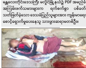
မန္တလေးတိုင်းဒေသကြီး မလှိုင်မြို့နယ်၌ PDF အမည်ခံအကြမ်းဖက်သမားများက ရက်စက်စွာပစ်ခတ် သတ်ဖြတ်ခဲ့သော အပြစ်မဲ့ဒေသခံပြည်သူများ။