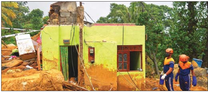
သိရိလင်္ကာနိုင်ငံ နာဂါလဘီတီယာမြို့တွင် ဆိုင်ကလုန်းမုန်တိုင်းတိုက်ခတ်ပြီးနောက် အပျက်အစီးများကို ဒီဇင်ဘာ ၁၁ ရက်က သိရိလင်္ကာတပ်မတော်ကယ်ဆယ်ရေးသမားများ ကူညီဖယ်ရှားနေစဉ်။

ဖြစ်ပေါ်ခဲ့ပြီး နိုင်ငံ၏ ဘဏ္ဍာရေးအပေါ် ဖိအားများ သက်ရောက်စေခဲ့ကြောင်း၊ ယခုပေးအပ်သော အရေးပေါ်ဘဏ္ဍာရေးအထောက်အပံ့သည် အဆိုပါ ဖိအားများကို ဖြေရှင်းပေးနိုင်လိမ့်မည်ဟု မျှော်လင့် ကြောင်း အပြည်ပြည်ဆိုင်ရာ ငွေကြေးရန်ပုံငွေအဖွဲ့ ၏ ဒုတိယမန်နေဂျင်းဒါရိုက်တာနှင့် ယာယီဥက္ကဋ္ဌ ကန်ဂျီအိုကာမူရာက ပြောကြားသည်။ သဘာဝဘေးအန္တရာယ်နှင့် ရင်ဆိုင်ရချိန်တွင် သိရိလင်္ကာအစိုးရ၏ အလျင်အမြန်ဟုပြန်ဆောင် ရက်မှုများကို ချီးကျူးမှုနှင့်အတူ ခက်ခဲသောအချိန် ကာလအတွင်း အိုင်အမ်အက်မ်အနေဖြင့် သိရိလင်္ကာ