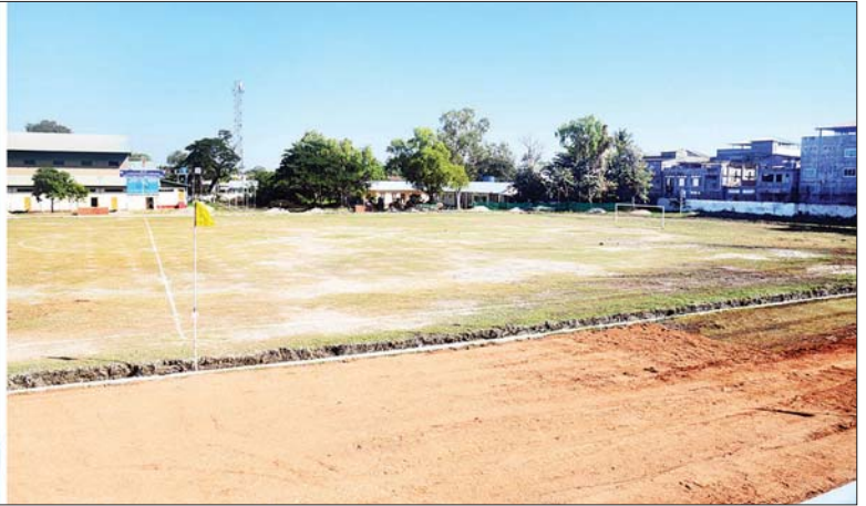
ပြည်ထောင်စုသမ္မတမြန်မာနိုင်ငံတော် ယာယီသမ္မတ နိုင်ငံတော်လုံခြုံရေးနှင့် အေးချမ်းသာယာရေးကော်မရှင်ဥက္ကဋ္ဌ ဗိုလ်ချုပ်မှူးကြီး မင်းအောင်လှိုင် မင်းဘူးမြို့ ခရိုင်ဘောလုံးအားကစားကွင်း အဆင့်မြှင့်တင်ဆောင်ရွက်နေမှုအခြေအနေများ ကြည့်ရှုစစ်ဆေးစဉ်။