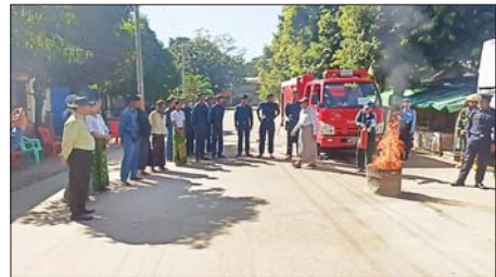
ပဲခူးတိုင်းဒေသကြီး သဲကုန်းမြို့နယ် မြို့မဈေး မီးဘေးကြိုတင်ကာကွယ်ရေးအတွက် မြို့နယ်မီးသတ်ဦးစီးဌာနနှင့် မြို့နယ်စည်ပင်သာယာရေးအဖွဲ့တို့ ပူးပေါင်း၍ မီးဘေးအန္တရာယ်ကြိုတင်ကာကွယ်ရေးအသိပညာပေး ဟောပြောပွဲနှင့် လက်တွေ့သရုပ်ပြခြင်းကို ဒီဇင်ဘာ ၁၉ ရက်က သဲကုန်းမြို့မဈေး၌ ပြုလုပ်စဉ်။ မြို့နယ်(ပြန်/ဆက်)