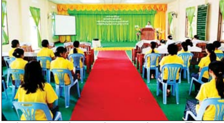
ယာဉ်အန္တရာယ်၊ လမ်းအန္တရာယ် အကြောင်းအရာများ၊ လူကုန်ကူးမှုအန္တရာယ်နှင့် တားဆီးကာကွယ်ရေးအကြောင်းအရာများ၊ မူးယစ်ဆေးဝါးအန္တရာယ်နှင့် တားဆီး

မြိတ် ဒီဇင်ဘာ ၂၀ မြိတ်မြို့ အမျိုးသမီးအိမ်တွင်းမှု သက်မွေးလုပ်ငန်းပညာ သင်ကျောင်း၌ အဆင့်မြင့်အိမ်တွင်းမှု စက်ချုပ်သင်တန်း တက်ရောက်နေကြသည့် သင်တန်းသူ အမျိုးသမီးငယ်များအား အသိပညာဗဟုသုတများ တိုးပွားစေရန်အတွက် ဒီဇင်ဘာ ၁၈ ရက်တွင် သက်ဆိုင်ရာ ဌာနများက ကဏ္ဍအလိုက် အသိပညာပေးဆွေးနွေးဟောပြောကြသည်။ ဟောပြောရာတွင် ယာဉ်စည်းကမ်း၊ လမ်းစည်းကမ်းနှင့်