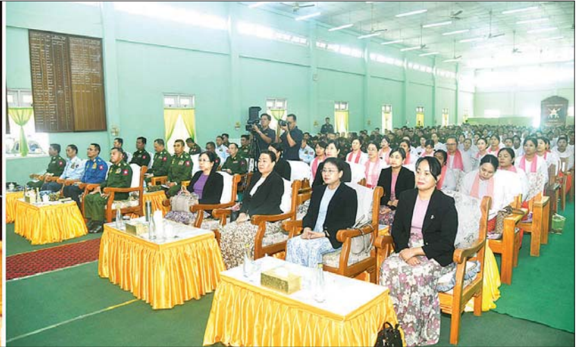
နိုင်ငံတော်လုံခြုံရေးနှင့် အေးချမ်းသာယာရေးကော်မရှင်ဥက္ကဋ္ဌ တပ်မတော်ကာကွယ်ရေးဦးစီးချုပ် ဗိုလ်ချုပ်မှူးကြီး မင်းအောင်လှိုင် မကွေးတပ်နယ်မှ အရာရှိ၊ စစ်သည် မိသားစုများအား တွေ့ဆုံအမှာစကား ပြောကြားစဉ်။