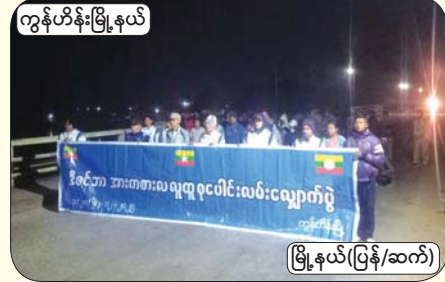
တွန်ဟိန်းမြို့နယ်