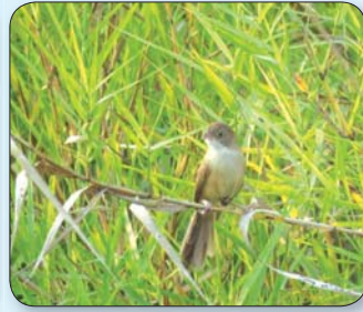
ကိုင်းရွှေငှက်မျိုးစိတ်ကို တွေ့ရစဉ်။