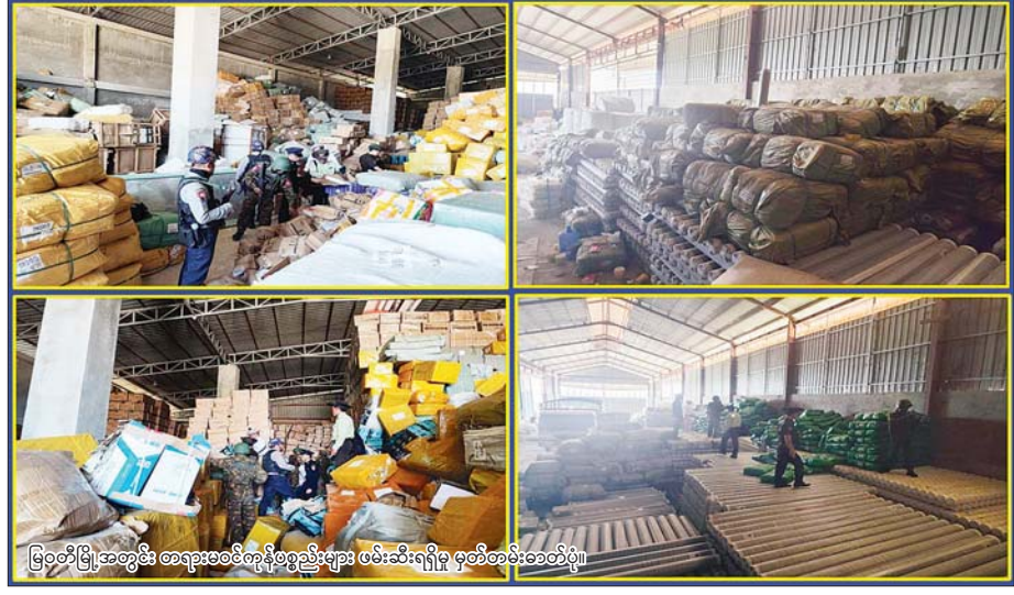
စာမျက်နှာ ၁၈ ကော်လံ ၁

နေပြည်တော် ဒီဇင်ဘာ ၂၀ မြန်မာနိုင်ငံအစိုးရအနေဖြင့် အွန်လိုင်းလိမ်လည်လောင်းကစားမှုများ အများဆုံးအခြေချလုပ်ကိုင်လျက်ရှိကြသည့် ရွှေကုက္ကိုလ်နယ်မြေနှင့် KK Park နယ်မြေများရှိ တရားမဝင်အဆောက်အအုံများအတွင်း ဝင်ရောက်ရှင်းလင်းခြင်း၊ အွန်လိုင်းလိမ်လည် လောင်းကစားမှုလုပ်ငန်း စဉ်များတွင် အသုံးပြုခဲ့သည့် သိမ်းဆည်းရမိပစ္စည်းများနှင့် တရားမဝင် အဆောက်အအုံများအား