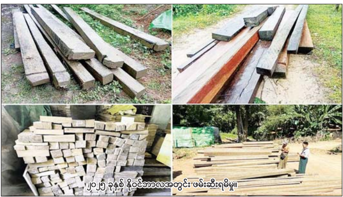
၂၀၂၅ ခုနှစ် နိုဝင်ဘာလအတွင်း ဖမ်းဆီးရမိမှု။ ပစ္စည်းများနှင့် စားသောက်ကုန်ပစ္စည်းများ အပါအဝင် လိုင်စင်မဲ့မော်တော်ယာဉ်များနှင့် လိုင်စင်မဲ့ မော်တော်ဆိုင်ကယ်များ ဖမ်းဆီးရမိခဲ့ပြီး ထိုကဲ့သို့ တရားမဝင် တင်သွင်းလာမှုများကြောင့် တရားဝင် တင်သွင်းသည့် ကုန်သည်လုပ်ငန်းရှင်များအတွက် ဈေးကွက်ယှဉ်ပြိုင်နိုင်မှုစွမ်းအား ကျဆင်းခြင်းနှင့် ထိခိုက်နှစ်နာမှုများ ဖြစ်ပေါ်နိုင်စေပြီး နိုင်ငံတော် အတွက် ရသင့်ရထိုက်သည့် အခွန်ဘဏ္ဍာ ဆုံးရှုံး

နေပြည်တော် ဒီဇင်ဘာ ၂၀ တရားမဝင်ကုန်သွယ်မှုတိုက်ဖျက်ရေး ဦးဆောင် ကော်မတီ၏ ကြီးကြပ်ကွပ်ကဲမှုဖြင့် နေပြည်တော် ကောင်စီ၊ တိုင်းဒေသကြီး/ပြည်နယ် တရားမဝင် ကုန်သွယ်မှုတိုက်ဖျက်ရေး အထူးအဖွဲ့များနှင့် အကောက်ခွန်ဦးစီးဌာနတို့မှ တရားမဝင်ကုန်သွယ်မှု တိုက်ဖျက်ရေးလုပ်ငန်းများကို ထိရောက်စွာ ဆောင်ရွက်လျက်ရှိရာ တာဝန်သိပြည်သူများ၏ သတင်းပေး တိုင်ကြားမှုများကြောင့် ၂၀၂၅ ခုနှစ် နိုဝင်ဘာလ အတွင်း သတင်းမှန်အကြိမ် ၃၀ ရရှိပြီး သတင်းရရှိမှု ကြောင့် ဖမ်းဆီးရမိခဲ့သည့် ၅၅ မှု၊ ဖမ်းဆီးရမိမှု ခန့်မှန်းတန်ဖိုးငွေကျပ် ၂၅၉၈ ဒသမ ၀၃၀ သန်းနှင့် တရားမဝင်ကုန်စည်များ တင်ဆောင်လာသည့် မော်တော်ယာဉ်များအပါအဝင် လိုင်စင်မဲ့မော်တော် ယာဉ်များ ဖမ်းဆီးရမိခဲ့သည်။ သတင်းပေးတိုင်ကြားမှုများကြောင့် အကောက် ခွန်မဲ့ကုန်ပစ္စည်းများဖြစ်သည့် လှသုံးကုန်ပစ္စည်း များ၊ လုပ်ငန်းသုံးပစ္စည်းများ၊ မော်တော်ယာဉ်အပို