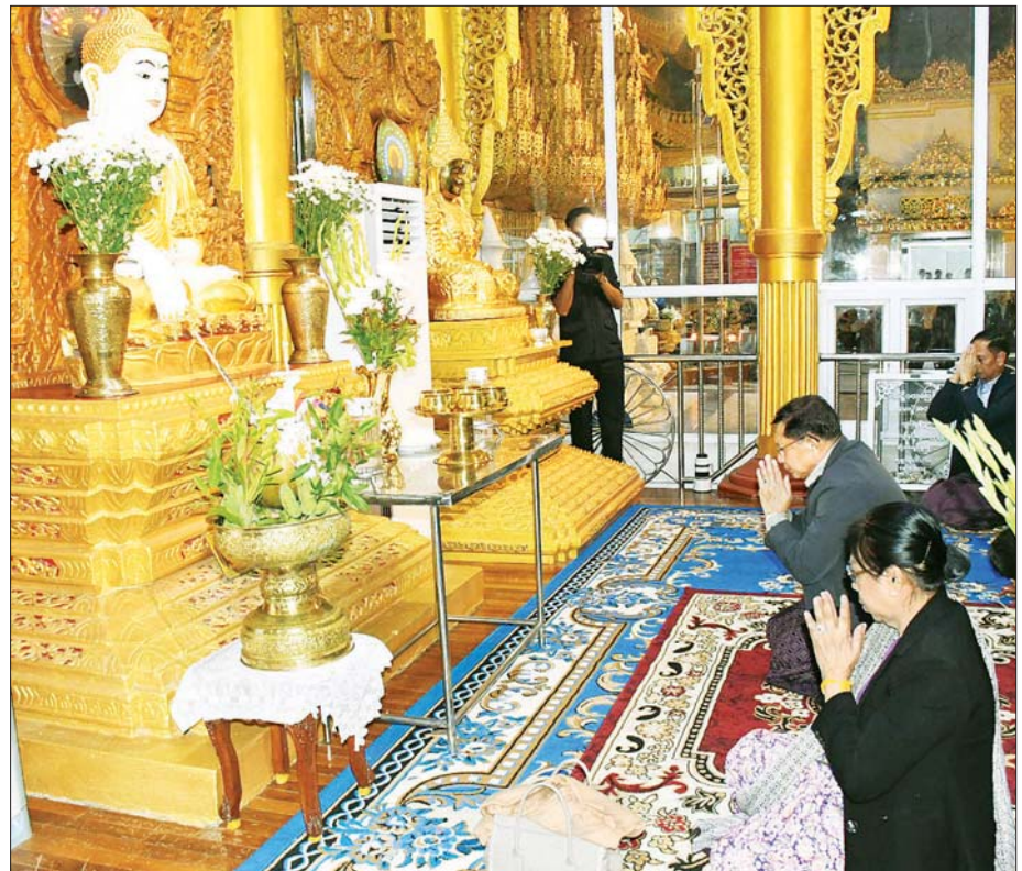
ပြည်ထောင်စုသမ္မတမြန်မာနိုင်ငံတော် ယာယီသမ္မတ နိုင်ငံတော်လုံခြုံရေးနှင့် အေးချမ်းသာယာရေးကော်မရှင်ဥက္ကဋ္ဌ ဗိုလ်ချုပ်မှူးကြီး မင်းအောင်လှိုင်နှင့် ဇနီး ဒေါ်ကြာကြာလှ ပြည်မြို့ ကျက်သရေဆောင် လေးဆူဓာတ်ပျော် ရွှေဆံတော်စေတီတော်မြတ်ကြီးအား ဖူးမြော်ကြည်ညိုစဉ်။

ရင်းရင်းနှီးနှီးနှုတ်ဆက် အလားတူ ယနေ့ညနေပိုင်းတွင် နိုင်ငံတော်ယာယီသမ္မတ နိုင်ငံတော်လုံခြုံရေးနှင့် အေးချမ်းသာယာရေးကော်မရှင် ဥက္ကဋ္ဌနှင့်