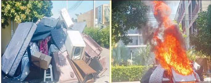
KK Park နယ်မြေအတွင်း အွန်လိုင်းလိမ်လည်လောင်းကစားသူများ အသုံးပြုခဲ့သည့် အသုံးဆောင်ပစ္စည်းများ စီးရီးပျက်ဆီးနေမှုကို တွေ့ရစဉ်။

အဆိုပါ သိမ်းဆည်းရမိတရား မဝင်ကုန်ပစ္စည်းများနှင့် ဆက်စပ် ပစ္စည်းများအား လုပ်ထုံးလုပ်နည်း များနှင့်အညီ ဆက်လက် ဆောင် ရွက်သွားမည်ဖြစ်ပြီး ပါဝင် ပတ်သက်သူများအား ဆက်လက် စိစစ်ဖော်ထုတ်ကာ တရားဥပဒေ နှင့်အညီ တရားစွဲဆိုအရေးယူ ဆောင်ရွက်နိုင်ရေးနှင့် ပြည်ပနိုင်ငံ သားများအား လူသားချင်းစာနာ ထောက်ထားမှုနှင့် နိုင်ငံအချင်း ချင်းချစ်ကြည်ရင်းနှီးမှုတို့ကို ရှေးရှု ၍ သက်ဆိုင်ရာနိုင်ငံများသို့ ပြန်လည်လွှဲပြောင်း ပေးအပ်နိုင် ရေး ဆောင်ရွက်သွားမည်ဖြစ် ကြောင်း သိရသည်။ ၎င်းအပြင် မြဝတီမြို့နယ် အတွင်းရှိ KK Park နယ်မြေနှင့် ရွှေကုက္ကိုလ်နယ်မြေတို့၌ အွန် လိုင်းလိမ်လည် လောင်းကစားမှု ကျူးလွန်ရာတွင် အသုံးပြုသည့် ပစ္စည်းများအား ထပ်မံရှာဖွေအသုံးပြု နိုင်ခြင်းမရှိစေရန်အတွက် ယနေ့ တွင်လည်း စနစ်တကျ စီးရီး