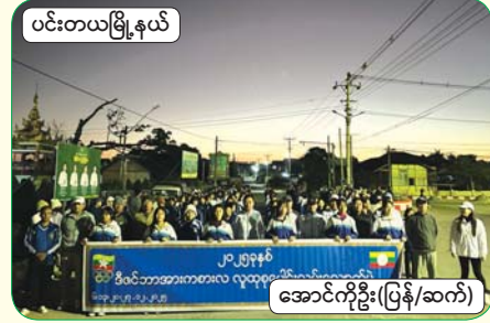
ပင်းတယမြို့နယ်