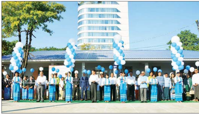
မြန်မာနိုင်ငံဆိုင်ရာ အိန္ဒိယနိုင်ငံ သံအမတ်ကြီးတို့က အဆောက်အအုံကို ဖဲကြိုးဖြတ်၍ ဖွင့်လှစ်ပြီး ကမည်းမော်ကွန်းအား နံ့သာရည်များဖြင့် ပတ်ပန်းစားကြသည်။

မန္တလေး ဒီဇင်ဘာ ၂၀ မဲခေါင်-ဂင်္ဂါစီမံချက်အရ လူမှုဝန်ထမ်း၊ ကယ်ဆယ်ရေးနှင့်ပြန်လည်နေရာချထားရေးဝန်ကြီးဌာန၊ လူမှုဝန်ထမ်းဦးစီးဌာန၊ အမျိုးသမီးကလေးများသင်တန်းကျောင်း မန္တလေး၌ အိန္ဒိယနိုင်ငံအစိုးရမှ လှူဒါန်းသည့် သင်တန်းသူအိပ်ဆောင် တစ်ထပ်ဆောင် လွှဲပြောင်းခြင်းအခမ်းအနားကို ယနေ့နံနက် ၉ နာရီက အဆိုပါ သင်တန်းကျောင်း၌ ကျင်းပသည်။