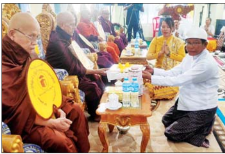
ကျောက်တန်းမြို့နယ် ကံမြောင် ဧည့်ပရိသတ်များက သီလံခံယူ ဆောက်တည်ကြသည်။

သန့်လျင် ဒီဇင်ဘာ ၂၀ သန့်လျင်မြို့နယ်၌ ဒီဇင်ဘာ ၁၅ ရက်မှ ၁၈ ရက်အထိ လေးရက်ကြာ ကျင်းပသည့် နဝမအကြိမ်မြောက် ကျင်းပခဲ့သော ခရိုင် ကိုးမြို့နယ် ဝိနည်းစာပြန်ပွဲတော် ပိတ်ပွဲ (အောင်ပွဲ) မင်္ဂလာအခမ်းအနား ကို ဒီဇင်ဘာ ၁၈ ရက်က သန့်လျင် မြို့ ကျက်သရေဆောင် မဟာ အတုလသဒ္ဓမ္မရုံသို့ သာသနာ့ ဝိဇ္ဇာဌာနတော်ကြီး၌ ကျင်းပသည်။ ဦးစွာ အခမ်းအနားကို ဘုရားကန်တော့၌ ဖွင့်လှစ်ပြီး