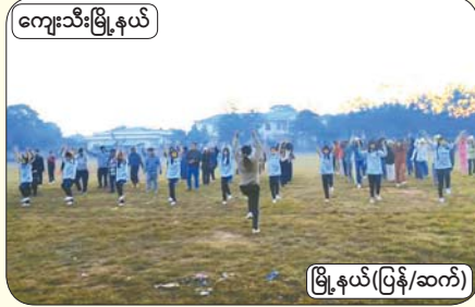
ကျေးသီးမြို့နယ်