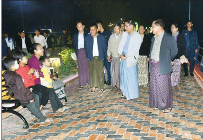
ပြည်ထောင်စုသမ္မတမြန်မာနိုင်ငံတော် ယာယီသမ္မတ နိုင်ငံတော်လုံခြုံရေးနှင့် အေးချမ်းသာယာရေးကော်မရှင်ဥက္ကဋ္ဌ ဗိုလ်ချုပ်မှူးကြီး မင်းအောင်လှိုင်နှင့် ဇနီး ဒေါ်ကြာကြာလှ ပြည်မြို့ ကမ်းနားလမ်းရှိ ခေတ္တရာညဈေးတန်း၌ လာရောက်စားသုံးကြသည့် ပြည်သူလူထုများအား ရင်းရင်းနှီးနှီး နှုတ်ဆက်စဉ်။

တကျဖြစ်ရန်လိုသည့် အခြေအနေများနှင့် ပတ်သက်၍ တာဝန်ရှိသူများကို လိုအပ်သည်များ လမ်းညွှန်မှာကြားခဲ့ကြောင်း သတင်းရရှိသတင်းစဉ်