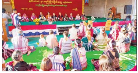
ကရင်နှစ်သစ်ကူးပွဲတော်ကို မွန်ပြည်နယ် သထုံမြို့ သိမ်ကုန်းရပ်ကွက် ရှိ ကရင်အမျိုးသားခန်းမ၌ ဒီဇင်ဘာ ၁၉ ရက်က ကျင်းပရာ သထုံခရိုင် စီမံခန့်ခွဲရေးနှင့် အုပ်ချုပ်ရေးကော်မတီဥက္ကဋ္ဌ ဦးစိုးအောင်၊ မြို့နယ် စီမံခန့်ခွဲရေးနှင့် အုပ်ချုပ်ရေးကော်မတီဥက္ကဋ္ဌ ဦးစောမိုးစိုး၊ ခရိုင် နှင့် မြို့နယ်စီမံခန့်ခွဲရေးနှင့် အုပ်ချုပ်ရေးကော်မတီအဖွဲ့ဝင်များ တက်ရောက်ကြစဉ်။ ခရိုင်(ပြန်/ဆက်)

ထို့နောက် ဝိနည်းစာပြန် ပွဲတော်ကျင်းပရေးသံဃာ့ဗဟိုဦးစီး အဖွဲ့ဥက္ကဋ္ဌ သန့်လျင်မြို့နယ်သံဃာ့ နာယကအဖွဲ့ဥက္ကဋ္ဌ ပါမောက္ခ ဒေါက်တာ ဉာဏိန္ဒထံမှ ဩဝါဒ ခံယူကာ စာအောင်သံဃာဆုနှင့် ဆွမ်းစရိတ်များကို သံဃာတော် များကိုယ်စား သန့်လျင်မြို့နယ် သုဋ္ဌေကင်း အနောက်ကျောင်း ဆရာတော်အား ဝိနည်းစာပြန် ပွဲတော် ကျင်းပရေးဦးစီးကော်မတီ ဥက္ကဋ္ဌ မြို့နယ်စီမံခန့်ခွဲရေးနှင့် အုပ်ချုပ်ရေးကော်မတီဥက္ကဋ္ဌဦးစိုး တင်က ဆက်ကပ်လှူဒါန်းသည်။ သန့်လျင်မြို့နယ်