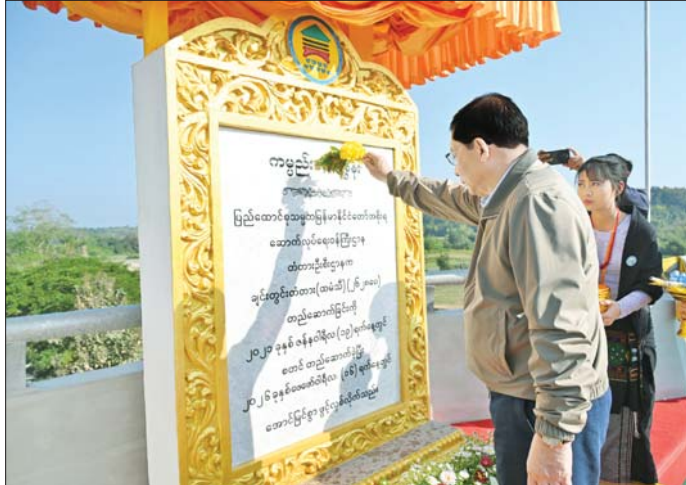
နိုင်ငံတော်ယာယီသမ္မတ ဗိုလ်ချုပ်မှူးကြီး မင်းအောင်လှိုင် ပက်ဖျန်းပေးစဉ်။

အထောက်အကူဖြစ်စေမည့် အဆိုပါ ချင်းတွင်းတံတား (ထမံသီ) အနေဖြင့် တံတားအရှည် ၂၆၅ ပေရှိပြီး သံကွန်ကရစ်တံတားအမျိုးအစားဖြစ်ကြောင်း၊ ရေလမ်းကင်းလွတ်အမြင့် ပေ ၄၀ ရှိကြောင်း၊ ယခုကဲ့သို့ ချင်းတွင်းတံတား (ထမံသီ) ကို တည်ဆောက်ဖွင့်လှစ်နိုင်ခဲ့ခြင်းဖြင့် ဟုမ္မလင်းခရိုင်နှင့် နာဂကိုယ်ပိုင်အုပ်ချုပ်ခွင့်ဒေသတို့ရှိ ပြည်သူများ၏ လူမှုစီးပွားဘဝနှင့် ဒေသဖွံ့ဖြိုးတိုးတက်ရေး၊ ဒေသထွက်ကုန်များအား လွယ်ကူလျင်မြန်စွာ ပို့ဆောင်နိုင်ရေးနှင့် ပညာရေး၊ ကျန်းမာရေး၊ စီးပွားရေးကဏ္ဍများ ဖွံ့ဖြိုးတိုးတက်စေရေးတို့ကို များစွာအထောက်အကူဖြစ်လာစေမည်ဖြစ်ကြောင်း သိရသည်။ သတင်းစဉ်