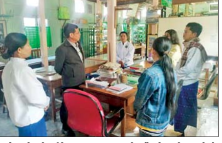
အစိုးရဝန်ထမ်းပေါင်းစုံ ငွေစု အသင်းဖွံ့ဖြိုးတိုးတက်ရေးလုပ်ငန်း ငွေချေး သမဝါယမအသင်းနှင့် ဈေးချိုတော် ဈေးသမဝါယမ အသင်းလီမိတက်တို့မှ လုပ်ငန်း ဆောင်ရွက်နေမှု များအား ကွင်းဆင်းကြည့်ရှုပြီး အသင်းမှ လိုအပ်လျက်ရှိသည့် ငွေကြေး အရင်းအနှီးများ ရရှိစေရေးနှင့်

တောင်ကြီး ဖေဖော်ဝါရီ ၁၆ ရမ်းပြည်နယ် မြောက်ပိုင်း သီပေါမြို့နယ်ရှိ သမဝါယမလုပ်ငန်း များ ဖွံ့ဖြိုးတိုးတက်ရေး အတွက် ဖေဖော်ဝါရီ ၁၆ ရက်တွင် ရမ်းပြည်နယ် သမဝါယမဦးစီးဌာန ပြည်နယ်ဦးစီးမှူး ဦးကျော်စိုးတင် နှင့် တာဝန်ရှိသူများက ကွင်းဆင်း ၍ မြို့နယ်သမဝါယမ ဦးစီးဌာနရှိ ဝန်ထမ်းများ၊ မြို့နယ်သမဝါယမ အသင်းစု အမှုဆောင်များနှင့် တွေ့ဆုံခဲ့ပြီး လုပ်ငန်းများ ဆောင်ရွက်ရာတွင် သမဝါယမ အသင်းဥပဒေ၊ နည်းဥပဒေ၊ လုပ်ထုံး၊ လုပ်နည်း၊ အမိန့် ညွှန်ကြားချက်များနှင့် အညီ လုပ်ကိုင်ဆောင်ရွက်သွားကြရန် လမ်းညွှန်မှာကြားသည်။ ဆက်လက်၍ သီပေါမြို့နယ်ရှိ