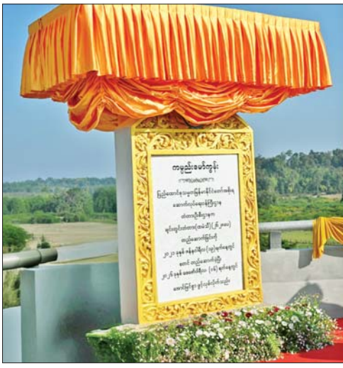
နိုင်ငံတော် ယာယီသမ္မတ နိုင်ငံတော်လုံခြုံရေးနှင့် အေးချမ်းသာယာရေးကော်မရှင် ဥက္ကဋ္ဌ ဗိုလ်ချုပ်မှူးကြီး မင်းအောင်လှိုင် ချင်းတွင်းတံတား(ထမ်သီ) ကမ္ဘာ့စံနှုန်းအား စက်လုပ်တိုင် ဖွင့်လှစ်ပေးစဉ်။

ဦးစွာ နိုင်ငံတော်ယာယီသမ္မတ နိုင်ငံတော်လုံခြုံရေးနှင့် အေးချမ်းသာယာရေးကော်မရှင် ဥက္ကဋ္ဌ နှင့် ဇနီး အဖွဲ့ဝင်များသည် စာမျက်နှာ ၇ သို့