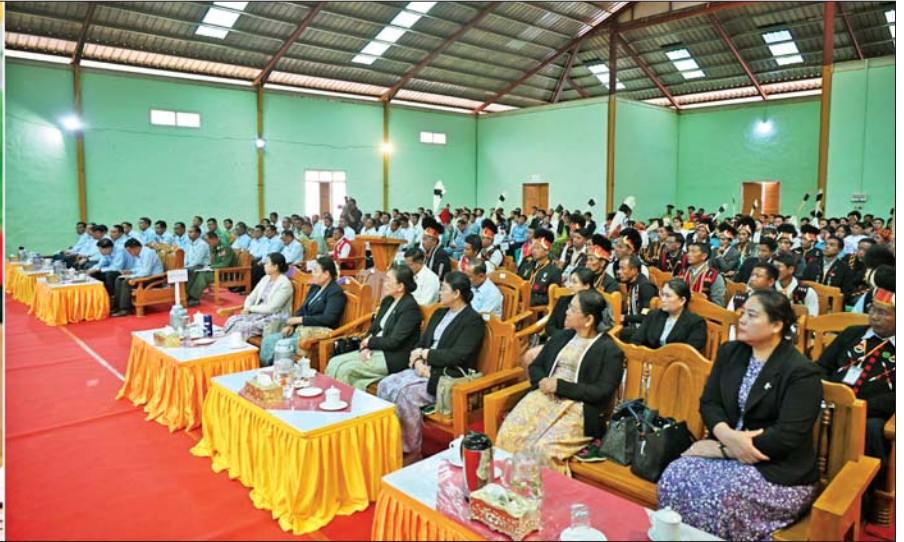
ပြည်ထောင်စုသမ္မတမြန်မာနိုင်ငံတော် ယာယီသမ္မတ နိုင်ငံတော်လုံခြုံရေးနှင့် အေးချမ်းသာယာရေးကော်မရှင်ဥက္ကဋ္ဌ ဗိုလ်ချုပ်မှူးကြီး မင်းအောင်လှိုင် နာကကိုယ်ပိုင်အုပ်ချုပ်ခွင့်ရဒေသ လဟယ်မြို့ရှိ ဌာနဆိုင်ရာ တာဝန်ရှိသူများ၊ မြို့မိမြို့ဖများနှင့် တွေ့ဆုံ၍ ဒေသဖွံ့ဖြိုးတိုးတက်ရေးဆိုင်ရာများ ဆွေးနွေးပြောကြားစဉ်။