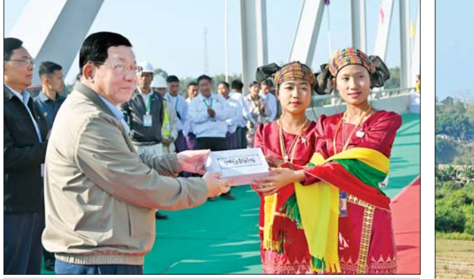
နိုင်ငံတော်ယာယီသမ္မတ ဗိုလ်ချုပ်မှူးကြီး မင်းအောင်လှိုင် ကျောင်းသား ကျောင်းသူများနှင့် တိုင်းရင်းသားအကအဖွဲ့များအား ဂုဏ်ပြုချီးမြှင့်ငွေများ ပေးအပ်စဉ်။