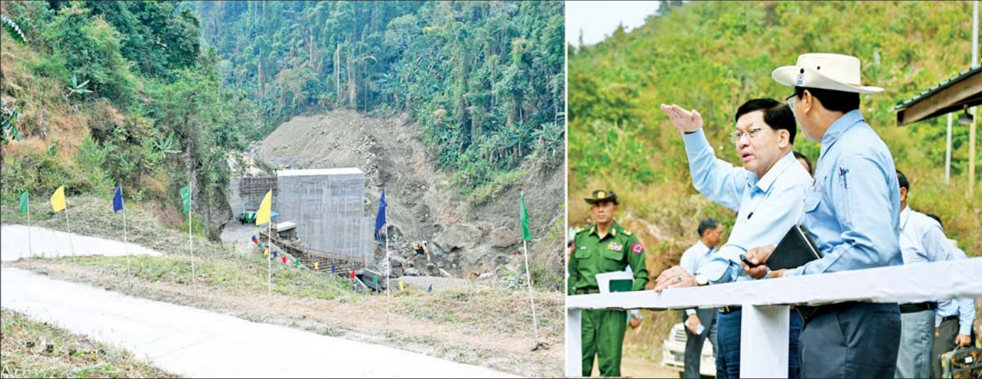
ပြည်ထောင်စုသမ္မတမြန်မာနိုင်ငံတော် ယာယီသမ္မတ နိုင်ငံတော်လုံခြုံရေးနှင့် အေးချမ်းသာယာရေးကော်မရှင်ဥက္ကဋ္ဌ ဗိုလ်ချုပ်မှူးကြီးမင်းအောင်လှိုင် နာဂကိုယ်ပိုင်အုပ်ချုပ်ခွင့်ရဒေသ လဟယ်မြို့ရှိ ဟေ့ထိုက် ရေအားလျှပ်စစ်စီမံကိန်း အကောင်အထည်ဖော်ဆောင်ရွက်နေမှုကို ကြည့်ရှုစစ်ဆေးစဉ်။

ပြည်ထောင်စုသမ္မတမြန်မာနိုင်ငံတော် ယာယီသမ္မတ နိုင်ငံတော်လုံခြုံရေးနှင့် အေးချမ်းသာယာရေးကော်မရှင်ဥက္ကဋ္ဌ ဗိုလ်ချုပ်မှူးကြီး မင်းအောင်လှိုင် နာဂကိုယ်ပိုင်အုပ်ချုပ်ခွင့်ရဒေသ လဟယ်မြို့ရှိ ဟေ့ထိုက်ရေအားလျှပ်စစ်စီမံကိန်း အကောင်အထည်ဖော်ဆောင်ရွက်နေမှု အခြေအနေများ သွားရောက်ကြည့်ရှုစစ်ဆေး၊ ထေရဝါဒ ဗုဒ္ဓသာသနာပြုကျောင်းများသို့ လှူဖွယ်ပစ္စည်းများ ဆက်ကပ်လှူဒါန်း ယခုစီမံကိန်းမှတစ်ဆင့် ဒေသ၏လူမှုအကျိုးစီးပွားကို များစွာအထောက်အကူပြုနိုင်သဖြင့် စနစ်တကျ အကောင်အထည်ဖော်ဆောင်ရွက်