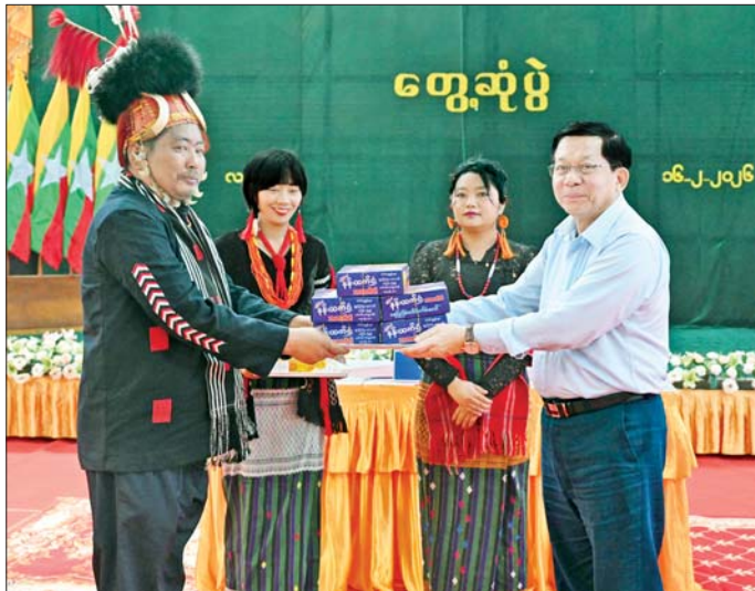
ပြည်ထောင်စုသမ္မတမြန်မာနိုင်ငံတော် ယာယီသမ္မတ နိုင်ငံတော်လုံခြုံရေးနှင့် အေးချမ်းသာယာရေး ကော်မရှင်ဥက္ကဋ္ဌ ဗိုလ်ချုပ်မှူးကြီး မင်းအောင်လှိုင် လဟယ်မြို့နယ်နှင့် လေရိုးမြို့နယ်တို့ရှိ ဌာနဆိုင်ရာ တာဝန်ရှိသူများအတွက် လက်ဆောင်ပစ္စည်းများ ပေးအပ်စဉ်။

ဆောင်ရွက်ပေးလျက်ရှိကြောင်း၊ လမ်းပန်းဆက်သွယ်မှုအခက်အခဲ များကြောင့် ဒေသဖွံ့ဖြိုးတိုးတက် ရေးလုပ်ငန်းများ ဆောင်ရွက်ရန် အတွက် ပစ္စည်းများ သယ်ယူ ပို့ဆောင်ရန် အခက်အခဲများရှိ ကြောင်း၊ ထို့ကြောင့် ဒေသတွင်း လမ်းပန်းဆက်သွယ်မှုများ လုံခြုံ ချောမွေ့စေရေး မိမိတို့အနေဖြင့် ဆက်လက် ဆောင်ရွက်ပေးသွား မည်ဖြစ်ကြောင်း။ လဟယ်မြို့နယ် ဆေးရုံအတွက် ဆရာဝန်လိုအပ်ချက်နှင့် ပတ်သက် ၍ ၂၀၂၁ခုနှစ်မှစတင်၍နာဂဒေသ အတွက် ဆရာဝန်လိုအပ်ချက်များ ရှိခြင်းကြောင့်တပ်မတော်အထူးကု ဆရာဝန်များကို စေလွှတ်ပေးခဲ့ ကြောင်း၊ လိုအပ်ချက်များရှိပါက မိမိတို့အနေဖြင့် ထပ်မံစေလွှတ် ပေးသွားမည်ဖြစ်ကြောင်း၊ ဆေးရုံ ရှိပါက ဆရာဝန်ရှိရမည်ဖြစ်သဖြင့် ဆရာဝန်များ ခန့်အပ်ပေးသွားမည် ဖြစ်ကြောင်း၊ ဆေးရုံအတွက် လိုအပ်သည့် ကုသရေးဆိုင်ရာ ပစ္စည်းများကိုလည်း တတ်နိုင်သမျှ ဖြည့်ဆည်းဆောင်ရွက်ပေးသွား မည်ဖြစ်ကြောင်း။ စာသင်ကျောင်းများအတွက် ဆရာ ဆရာမများ လိုအပ်မှုနှင့် ပတ်သက်၍ အလယ်တန်းပြဆရာ ဆရာမများ ပိုမိုလိုအပ်လျက်ရှိ သည်ကို တွေ့ရကြောင်း၊ ဘာသာစကားအရ အခက်အခဲများ