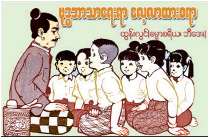
ထိုတွင် သူ့အမျှဝေသည်ကို ဝမ်းမြောက်မှုသည် "ပတ္တာနုမောဒနကုသိုလ်" ဖြစ်ပြီး အမျှမဝေဘဲလျက် ကိုယ့်ဘာသာကိုယ် ဝမ်းသာသာဓုခေါ်မှုမျိုးကျတော့ ပတ္တာနုမောဒနကုသိုလ်မခေါ်ဘဲ 'အနုမောဒန' ဟု သာ ခေါ်ရပေသည်။

အဋ္ဌကထာဆရာတို့က ပတ္တာနုမောဒနကို ပတ္တိတစ်ပုဒ်၊ အနုမောဒနတစ်ပုဒ်ဟု နှစ်ပုဒ်ခွဲခြားပြီး အဓိပ္ပာယ်ဖွင့်ပြကြသည်။ ထိုတွင် အနုမောဒနဟူသည် ဝမ်းမြောက်ခြင်းပင်ဖြစ်သည်။ ထိုဝမ်းမြောက်မှုသည် (၁) အမျှဝေသည်ကို သာဓုခေါ်ဝမ်းမြောက်မှုနှင့် (၂) သူက အမျှမဝေဘဲ ကိုယ်က သူ့ကောင်းမှုကို သိရသဖြင့် မိမိဘာသာမိမိ သာဓုခေါ်ဝမ်းမြောက်မှုဟု ဝမ်းမြောက်ခြင်းနှစ်မျိုးရှိသည်။