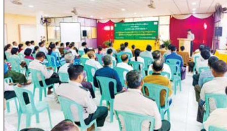
အဆိုပါ သင်တန်းသို့ သင်တန်းသား ၂၀ တက်ရောက်ပြီး သင်တန်း ဆရာ ခြောက်ဦးက လေးရက်ကြာ ဖွင့်လှစ်သင်ကြားပေးသွားမည် ဖြစ်ကြောင်း သိရသည်။