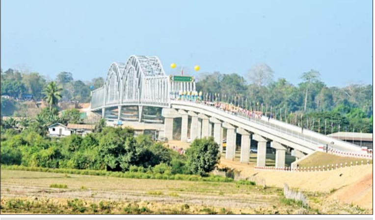
ချင်းတွင်းတံတား (ထမံသီ) ကို တွေ့ရစဉ်။