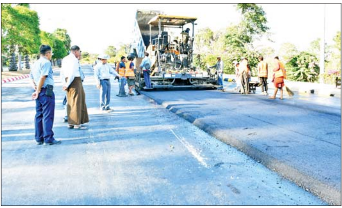
များ ပြန်လည်ပြုပြင်နေမှုကို ကွင်းဆင်းကြည့်ရှုပြီး လုပ်ငန်းအမျိုးအစားအလိုက် သတ်မှတ်စံချိန်အတွင်း အမြန်ပြီးစီးရေး၊ အရည်အသွေးပြည့်စုံသည့်ပစ္စည်းများကိုသာ အသုံးပြုရေး၊ သဘာဝဘေးအန္တရာယ်များ ခံနိုင်ရည်ရှိအောင် သတ်မှတ်စံချိန်၊ စံညွှန်းနှင့်အညီ ဆောင်ရွက်ရေးတို့ကို မှာကြားသည်။

နေပြည်တော် ဖေဖော်ဝါရီ ၁၆ နေပြည်တော်ကောင်စီဥက္ကဋ္ဌ ဦးသန်းထွန်းဦးသည် နေပြည်တော်ကောင်စီဝင်များ၊ ဌာနဆိုင်ရာ တာဝန်ရှိသူများနှင့်အတူ ယနေ့မုန်းလွဲပိုင်းတွင် နေပြည်တော်ကောင်စီ၏ ၂၀၂၄-၂၀၂၅ ဘဏ္ဍာနှစ် ငွေလုံးငွေရင်းရန်ပုံငွေဖြင့် ဧမ္မာသီရိမြို့နယ် ဉာဏသိဒ္ဓိရပ်ကွက်ရှိ အမှုထမ်းအိမ်ရာ ခြောက်ခန်းတွဲ လေးထပ်တည်ဆောက်နေမှုကို ကြည့်ရှုစစ်ဆေးပြီး လုပ်ငန်းများ သတ်မှတ်ချိန်အတွင်း အမြန်ပြီးစီးအောင် ဆောင်ရွက်ရန်၊ လုပ်ငန်းခွင်အတွင်း အရည်အသွေးပြည့်စုံသည့်ပစ္စည်းများကိုသာ အသုံးပြုရန်နှင့် လျှင်ဒဏ်အပြင် သဘာဝဘေးအန္တရာယ်ခံနိုင်ရည်ရှိအောင် သတ်မှတ်စံချိန်စံညွှန်းနှင့်အညီ ဆောင်ရွက်ရန်တို့ကို ဆွေးနွေးရာကြားသည်။ ထို့နောက် နေပြည်တော်ကောင်စီဥက္ကဋ္ဌသည် လျှင်ဘေးကြောင့် ထိခိုက်ပျက်စီးခဲ့သည့် ဧမ္မာသီရိမြို့နယ် ဧယုသိဒ္ဓိရပ်ကွက်ရှိ တိုက်အမှတ် (၄၁)၊ (၄၂)နှင့် (၄၄) နှစ်ခန်းတွဲ သုံးထပ် ဝန်ထမ်းအိမ်ရာ