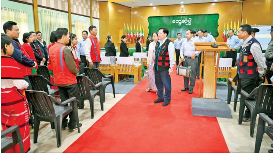
ပြည်ထောင်စုသမ္မတမြန်မာနိုင်ငံတော် ယာယီသမ္မတ နိုင်ငံတော်လုံခြုံရေးနှင့် အေးချမ်းသာယာရေးကော်မရှင်ဥက္ကဋ္ဌ ဗိုလ်ချုပ်မှူးကြီး မင်းအောင်လှိုင် လေရိုးမြို့ရှိ ဌာနဆိုင်ရာတာဝန်ရှိသူများ၊ မြို့မိမြို့ဖများနှင့် ဒေသခံတိုင်းရင်းသားပြည်သူများအား ရင်းနှီးနှီးနူး နှုတ်ဆက်စဉ်။

ကျောင်းတွင် တက်ရောက်ပြီးစီး ပါက ဟုမ္မလင်းမြို့ရှိ စိုက်ပျိုးရေး နှင့် မွေးမြူရေးသိပ္ပံသို့ တက်ရောက် ပြီး ဒီပလိုမာဘွဲ့များ ရရှိအောင် ဆက်လက်သင်ကြားနိုင်ကြောင်း၊ ထို့ကြောင့် ကျောင်းတက်ရောက် နေကြသည့် ကျောင်းသား ကျောင်းသူများအား ပညာ ပြီးဆုံးအောင် သင်ကြားနိုင်ရေး နိုင်ငံတော်မှလည်း တတ်နိုင်သမျှ ဆောင်ရွက် ပေးသွားမည်ဖြစ် ကြောင်း။ လေရိုးဒေသနှင့် လဟယ်ဒေသ တွင် ဝမ်းစာဖုလုံမှုမရှိသည့်ကို တွေ့ရကြောင်း၊ ဒေသဝမ်းစာဖုလုံ ရေးသည် အရေးကြီးလိုအပ်ချက် ဖြစ်သဖြင့် ကုန်းမြင့်လယ်များကို မဖြစ်မနေ ဖော်ဆောင်ပေးသွား မည်ဖြစ်ပြီး စိုက်ပျိုးရေးလုပ်ငန်းများ အတွက် လိုအပ်သည့် အောင်ရေ များရရှိအောင် စီမံဆောင်ရွက်ပေး သွားမည်ဖြစ်ကြောင်း၊ လဟယ် ဒေသတွင် ဝဉ္စ စိုက်ပျိုးဖြစ်ထွန်း အောင်မြင်သည်ဟု သိရှိရကြောင်း၊ ဝဉ္စမှ ဝဉ္စဆန် ထုတ်လုပ်၍ရသဖြင့် ဝဉ္စစိုက်ပျိုးရေးကို တိုးချဲ့စိုက်ပျိုး နိုင်ရေး သုတေသနပြုဆောင်ရွက် သွားရန်လိုကြောင်း၊ နိုင်ငံတော်မှ လည်း ပံ့ပိုးပေးမည်ဖြစ်ကြောင်း၊ အလားတူ ပြောင်းနှင့် အလူးများ ကိုလည်း တိုးချဲ့စိုက်ပျိုးသွားရန် လိုကြောင်း၊ ဒေသမှထွက်ရှိသည့် လက်ဖက်၊ မက်မန့်၊ ကော်ဖီ၊ လိမ္မော်နှင့် ထောပတ်ပင်များသည် နှစ်ရှည်သီးနှံများဖြစ်ပြီး ဒေသ အတွက် ဝင်ငွေများရရှိနိုင်မည်ဖြစ် သဖြင့် တိုးတက်စိုက်ပျိုးထုတ်လုပ် သွားနိုင်ရန်လိုကြောင်း။ မွေးမြူရေးနှင့် ပတ်သက်၍ စားရေးကို အထောက်အကူပြုစေ မည့် နွားနောကြာ၊ ဒေသန္တရကြာ နှင့် ဝက်များကို တိုးချဲ့မွေးမြူနိုင်ရေး ဆောင်ရွက်သွားကြမည်ဆိုပါက ဒေသဝမ်းစာအတွက် များစွာ အထောက်အကူပြုစေမည်ဖြစ် ကြောင်း၊ စာမျက်နှာ ၆ သို့ »»