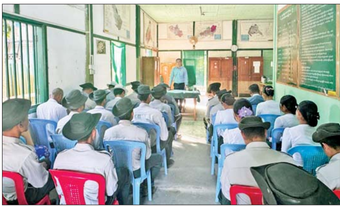
အညီ နေထိုင်၍ ပြည်သူက အားကိုးထိုက်သော တင်ပြမှုများအပေါ် လိုအပ်သည်များ ပေါင်းစပ် ဝန်ထမ်းကောင်းများဖြစ်အောင် ကြိုးပမ်းသွားကြရန် ဆောင်ရွက်ပေးခဲ့ကြောင်း သိရသည်။ တိုက်တွန်းပါကြောင်း မှာကြားပြီး ဝန်ထမ်းများ၏ သတင်းစဉ်

ထမံသီတောရိုင်း တိရစ္ဆာန်ဘေးမှတောအတွင်း ရှိ ကျားနှင့် အခြားရှားပါး တိရစ္ဆာန်မျိုးစိတ်များကို ထိန်းသိမ်းကာကွယ်သွားရန် လိုအပ်ကြောင်း၊ နိုင်ငံ အဆင့် ကျားထိန်းသိမ်းရေး လုပ်ငန်းစီမံချက်များ ရေးဆွဲ၍ ကျားထိန်းသိမ်းရေး လုပ်ငန်းများကို ဆောင်ရွက်လျက်ရှိကြောင်း၊ ဟုမ္မလင်းခရိုင်အတွင်း ဝါးနှင့်ကြိမ် အချောထည်ထုတ်လုပ်မှုလုပ်ငန်းများ ပိုမိုတိုးတက်လာပြီး MSME လုပ်ငန်းများ ဖွံ့ဖြိုးလာစေ ရေးအတွက် ပုဂ္ဂလိကနှင့် ဌာနပေါင်းစပ် ဆောင်ရွက် သွားရန်လိုအပ်ကြောင်း၊ သစ်တောနယ်မြေအတွင်း တရားမဝင်သစ်နှင့် သတ္တုများ ထုတ်ယူသိမ်းဆောင်မှု မရှိစေရေးအတွက်လည်း သက်ဆိုင်ရာဌာနများက ကြပ်မတ်စစ်ဆေး ဆောင်ရွက်သွားရမည်ဖြစ်ကြောင်း၊ ဝန်ထမ်းများအနေဖြင့်လည်း ဝန်ထမ်းကျင့်ဝတ်နှင့်