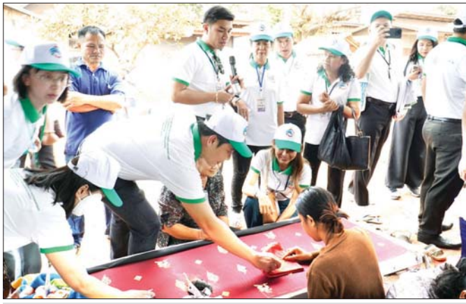
လာအိုနိုင်ငံ Xaythany ခရိုင် Don Iye ကျေးရွာ ချည်ထည်ပန်းထိုးလုပ်ငန်းသို့ သွားရောက်လေ့လာစဉ်။

လေ့လာရေးခရီးစဉ်တစ်လျှောက်မှ မှတ်သားခဲ့ရသည့် ပြည့်စုံဖွံ့ဖြိုးသော စီးပွားရေးဆိုင်ရာထုတ်ကုန်ထိုးနှင်းစီမံကိန်း ယဉ်ကျေးမှု၊ စည်းမျဉ်းစည်းကမ်းအပေါ် အခြေခံထားသည့် အတွေးအခေါ် ဒဿနတစ်ခုဖြစ်ပါသည်။ Sufficiency Economy Philosophy (SEP) သည် ကိုယ်တိုင်လက်တွေ့အကောင်အထည်ဖော် ဆောင်ရွက်ခြင်းဖြင့် ပိုမိုအားကောင်းသော လူမှုအဖွဲ့အစည်းများ ဖြစ်ပေါ်လာစေပြီး အသိပညာပဟုသုတ၊ အမြော်အမြင်များ အသုံးပြု၍ ဆောင်ရွက်ရသော ဖွံ့ဖြိုးတိုးတက်ရေးနည်းလမ်းတစ်ခုဖြစ်ကြောင်း၊ ဖွံ့ဖြိုးရေးလုပ်ငန်းများ ဆောင်ရွက်ရာတွင် အသိပညာနှင့် မွန်မြတ်သော အကျင့်သီလကို ဘဝလမ်းညွှန်အဖြစ် အသုံးပြုရမည်ဖြစ်ကြောင်း၊ ဉာဏ်ပညာအမြော်အမြင်ရှိခြင်းနှင့် ခွဲလွဲလိမ္မာရှိခြင်းသည် မိမိဘဝတစ်သက်တာတွင် စိတ်မှန်သည့် ပျော်ရွှင်မှုရရှိစေရေး ဦးတည်သွားမည့် သိသာထင်ရှားသည့် အချက်ဖြစ်ပါကြောင်းနှင့် ယင်းအချက်များကို အခြေခံထားသည့် SEP ကို ကျင့်သုံး၍ ကျေးလက်ဒေသဖွံ့ဖြိုးရေးလုပ်ငန်းများ ဆောင်ရွက်လျက်ရှိပြီး အမှန်တကယ် ရေရှည်တည်တံ့သည့် ဖွံ့ဖြိုးရေးလုပ်ငန်းများအဖြစ် အောင်မြင်မှုများရရှိနေသည်ကို မျက်ပါးထင်ထင်အားကျဖွယ် လေ့လာသိရှိခဲ့ရပါသည်။