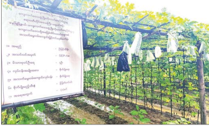
နေပြည်တော်ရှိ ကျေးရွာ စိုက်ပျိုးရေးလုပ်ငန်း။

စာရေးသူသည် ယင်းလေ့လာရေးခရီးစဉ် အတွင်း ကျေးလက်ဒေသဆင်းရဲမှုလျှော့ချရေး ဆိုင်ရာ လေ့လာတွေ့ရှိချက်များ၊ ဗဟုသုတများစွာ ကို SEP စီမံကိန်းအစီအစဉ် ပေါင်းစပ်ထည့်သွင်း၍ မြန်မာနိုင်ငံတွင် တတိယမြောက် SEP စီမံကိန်း အဖြစ် ရှမ်းပြည်နယ်(တောင်ပိုင်း) ကလေးမြို့နယ် ဟင်းခဲးကျေးရွာ၌ နိုင်ငံတော်ထောက်ပံ့ငွေကျပ် ၂၀ သန်းဖြင့် တိုးချဲ့ဆောင်ရွက်နိုင်ခဲ့ပါသည်။