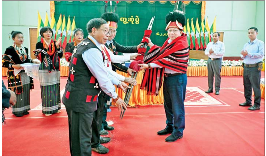
ပြည်ထောင်စုသမ္မတမြန်မာနိုင်ငံတော် ယာယီသမ္မတ နိုင်ငံတော်လုံခြုံရေးနှင့် အေးချမ်းသာယာရေးကော်မရှင်ဥက္ကဋ္ဌ ဗိုလ်ချုပ်မှူးကြီး မင်းအောင်လှိုင်က နာကကိုယ်ပိုင်အုပ်ချုပ်ခွင့်ရဒေသဦးစီးအဖွဲ့ဥက္ကဋ္ဌ၊ နာကရိုးရာ စာပေနှင့်ယဉ်ကျေးမှုကော်မတီဥက္ကဋ္ဌနှင့် တာဝန်ရှိသူများက နာကရိုးရာ ခေါင်းပေါင်း၊ မြို့ထည်နှင့် ရိုးရာလက်ဆောင်ပစ္စည်းများ ဂါရဝပြုဆင်မြန်းပေးအပ်စဉ်။

ဝန်ကြီးများ၊ စစ်ကိုင်းတိုင်းဒေသကြီး ဝန်ကြီးချုပ် ဦးမြတ်ကျော်၊ ကာကွယ်ရေး ဦးစီးချုပ်ရုံးမှ အဆင့်မြင့် တပ်မတော်အရာရှိကြီးများနှင့် ဇနီးများ၊ အနောက်မြောက်တိုင်းစစ်ဌာနချုပ်တိုင်းမှူး၊ ဒုတိယဝန်ကြီးများ၊ လဟယ်မြို့နှင့် လေရှိုးမြို့တို့ရှိ ဌာနဆိုင်ရာ တာဝန်ရှိသူများ၊ မြို့မိမြို့ဖများ၊ တိုင်းရင်းသားရိုးရာစာပေနှင့် ယဉ်ကျေးမှုအဖွဲ့များ၊ ဒေသခံတိုင်းရင်းသားပြည်သူများ တက်ရောက်ကြသည်။ ဒေသဆိုင်ရာ အချက်အလက်များနှင့် ဒေသဖွံ့ဖြိုးရေးအတွက် လိုအပ်ချက်များအား အသီးသီးဆွေးနွေးတင်ပြ ဦးစွာ လဟယ်မြို့နှင့် လေရှိုးမြို့တို့မှ နာကကိုယ်ပိုင်အုပ်ချုပ်ခွင့်ရဒေသ ဦးစီးဥက္ကဋ္ဌ ဦးထွန်းထွန်းဝင်းနှင့် လေရှိုးမြို့နယ် စီမံခန့်ခွဲရေးနှင့် အုပ်ချုပ်ရေးကော်မတီ ဥက္ကဋ္ဌ ဦးဝင်းမောင်တို့က ဒေသဆိုင်ရာ အချက်အလက်များ၊ ဒေသတည်ငြိမ်အေးချမ်းရေး လုပ်ငန်းများ ဆောင်ရွက်ထားရှိမှု၊ ပါတီစုံဒီမိုကရေစီအထွေထွေရွေးကောက်ပွဲ အောင်မြင်စွာကျင်းပပြုလုပ်နိုင်ခဲ့မှု၊ နာကဒေသအတွင်း မြေအသုံးချမှုနှင့် ပျမ်းမျှရရှိမှု၊ ကဏ္ဍကြီးများအလိုက် ကုန်ထုတ်လုပ်မှုများ တိုးတက်ထုတ်လုပ်နိုင်ခဲ့မှု၊ ရာသီအလိုက် သီးနှံများစိုက်ပျိုးလျက်ရှိမှု၊ ဒေသဝမ်းစာဖူလုံမှု၊ မွေးမြူရေးလုပ်ငန်းများ ဆောင်ရွက်ထားရှိမှု၊ နိုင်ငံစီးပွားရေးမြှင့်တင်ရေးရန်ပုံငွေများ ထုတ်ချေးပေးထားမှု