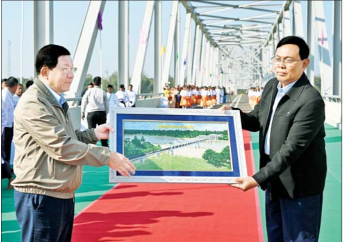
နိုင်ငံတော်ယာယီသမ္မတ ဗိုလ်ချုပ်မှူးကြီး မင်းအောင်လှိုင်ထံ ဆောက်လုပ်ရေးဝန်ကြီးဌာန ပြည်ထောင်စုဝန်ကြီးက ချင်းတွင်းတံတား (ထမံသီ) ဖွင့်ပွဲအထိမ်းအမှတ်လက်ဆောင် ဂါရဝပြုအပ်စဉ်။