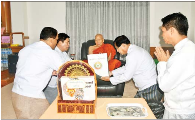
ဆရာတော် သံဃာတော်များ ဝန်ကြီးများ၊ အလှူရှင်များနှင့် ကြံ့ရောက် ချီးမြှင့်တော်မူကြပြီး ဖိတ်ကြားထားသူများ တက်ရောက် ရန်ကုန်တိုင်းဒေသကြီး ဝန်ကြီး ကြည်ညိုကြသည်။