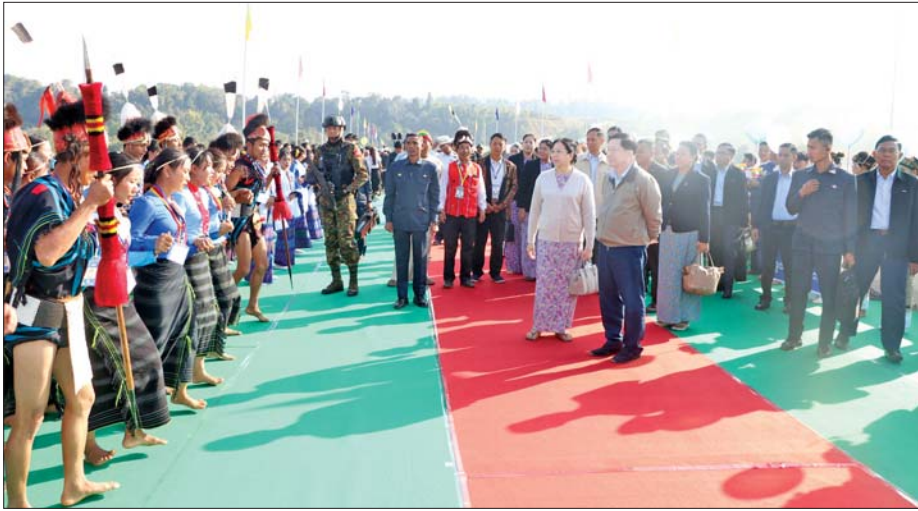
နိုင်ငံတော်ယာယီသမ္မတ နိုင်ငံတော်လုံခြုံရေးနှင့် အေးချမ်းသာယာရေးကော်မရှင်ဥက္ကဋ္ဌ ဗိုလ်ချုပ်မှူးကြီး မင်းအောင်လှိုင်နှင့် ဇနီး ဒေါ်ကြာကြာလှ တိုင်းရင်းသားရိုးရာအကဖြင့် ကပြဖျော်ဖြေမှုကို ကြည့်ရှုအားပေးစဉ်။

ယင်းနောက် နိုင်ငံတော် ယာယီသမ္မတ နိုင်ငံတော်လုံခြုံရေးနှင့် အေးချမ်းသာယာရေး ကော်မရှင် ဥက္ကဋ္ဌက ချင်းတွင်းတံတား (ထမံသီ) ကမ္ဘည်းမော်ကွန်းအား စက်ခလုတ်နှိပ် ဖွင့်လှစ်ပေးပြီး အမွှေးနံ့သာရည်များ ပက်ဖျန်းပေးသည်။ ဆက်လက်၍ ကော်မရှင်အတွင်းရေးမှူးနှင့် အခမ်းအနား တက်ရောက် လာကြသူများက ကမ္ဘည်းမော်ကွန်းအား အမွှေး