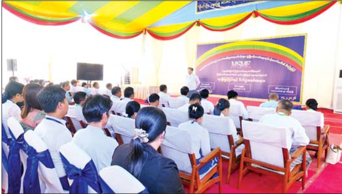
တွေ့ဆုံပွဲတွင် ပြည်ထောင်စု ပြည်ထောင်စုအဆင့် MSME ပွဲတော်၏ အားနည်းချက်၊ ဝန်ကြီးက ယခုကျင်းပမည့် ထုတ်ကုန်ပြပွဲနှင့် ဈေးရောင်း အားသာချက်များကို တော်ထုတ်၍

နေပြည်တော် ဖေဖော်ဝါရီ ၁၄ တိုင်းဒေသကြီး၊ ပြည်နယ် MSME အေဂျင်စီဥက္ကဋ္ဌများနှင့် တွေ့ဆုံပွဲအခမ်းအနားကို ယနေ့ နံနက်ပိုင်းက နေပြည်တော်ရင်ပြင် ရှိ ကွပ်ကဲရေးရုံး၌ ကျင်းပရာ အသေးစား၊ အငယ်စားနှင့် အလတ်စား စီးပွားရေးလုပ်ငန်း များ ဖွံ့ဖြိုးတိုးတက်ရေး လုပ်ငန်း ကော်မတီ ဒုတိယဥက္ကဋ္ဌ စက်မှု ဝန်ကြီးဌာန ပြည်ထောင်စုဝန်ကြီး ဒေါက်တာချာလီသန်း၊ ဒုတိယ ဝန်ကြီး ဦးသွင်အောင်နှင့် တိုင်း ဒေသကြီး၊ ပြည်နယ် MSME အေဂျင်စီဥက္ကဋ္ဌများ တက်ရောက် သည်။