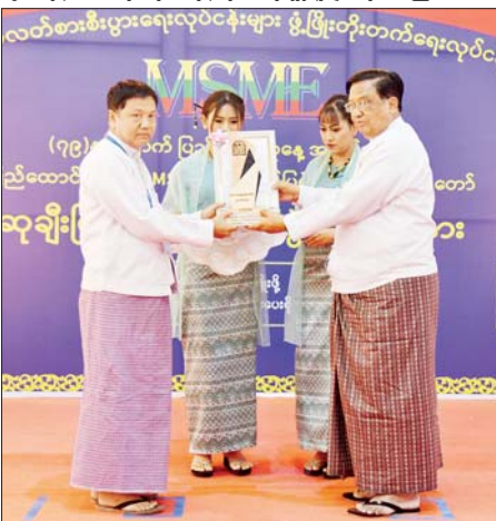
ပြည်ထောင်စုဝန်ကြီး ဒေါက်တာချာလီသန်း MSME ထုတ်ကုန်ပြပွဲနှင့် ဈေးရောင်းပွဲတော်တွင် ဆုရရှိသူတစ်ဦးအား ဆုပေးအပ်ချီးမြှင့်စဉ်။

ထို့နောက် ပြည်ထောင်စုဝန်ကြီးက လယ်ယာသုံးပစ္စည်းများ ပြပွဲပြိုင်ပွဲတွင် ဆုရရှိသူများကိုလည်း ကောင်း၊ နေပြည်တော်ကောင်စီဥက္ကဋ္ဌက တန်ဖိုးမြှင့်ထုတ်ကုန်နှင့် ထုပ်ပိုးမှုပြပွဲပြိုင်ပွဲတွင် ဆုရရှိသူများကို လည်းကောင်း၊ ဒုတိယဝန်ကြီးများက သဘာဝပတ်ဝန်းကျင်ထိန်းသိမ်းရေးနှင့် ဆေးဝါးထုတ်လုပ်ရေးလုပ်ငန်းများကို လည်းကောင်း၊ ယခင်နှစ်ဆုရရှိသူများမှ တိုးတက်မှုအကောင်းဆုံး ဆုရရှိသူများကို လည်းကောင်း၊