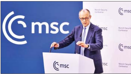
၎င်း၏ အဖွင့်မိန့်ခွန်းတွင် ပြောကြားခဲ့သည်။ ဆွေးနွေးပွဲ၌ အဓိကထားဆွေး နွေးမည့် အကြောင်းအရာများတွင် အမေရိကန်-ဥရောပ ဆက်ဆံရေး၊ ဂရင်းလန်နှင့် ယူကရိန်းအရေးတို့ ပါဝင်သည်။ ဥရောပခေါင်းဆောင်များအား ၎င်းတို့၏ ကာကွယ်ရေးစွမ်းရည် တိုက်တွန်းခဲ့ပြီး ဂျာမနီသည် နျူကလီးယားလက်နက် တားဆီး

မြူးနစ်လုံခြုံရေးညီလာခံကို ဖေဖော်ဝါရီ ၁၃ ရက်တွင် ဖွင့်လှစ် ခဲ့ပြီးသုံးရက်ကြာမြင့်မည်ဖြစ်သည်။ ဂျာမနီအစီပတီ ဖရန်ဒရစ်ချ် မာဇ်က "အမေရိကန်ကို လမ်း ကြောင်းမှန်သို့ ပြန်လည်ရောက်ရှိ ရန်နှင့် အတ္တလန္တိတ်ဒေသ၏ ယုံကြည်မှုကို ပြန်လည်အသက် သွင်းရန်" လိုအပ်ကြောင်း