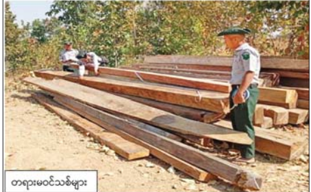
တရားမဝင်သစ်များ