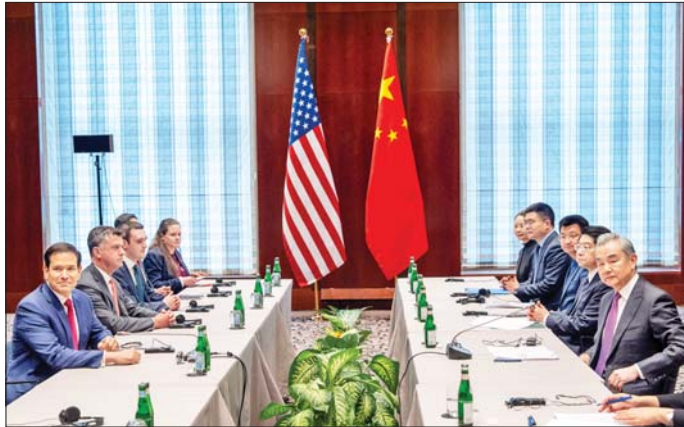
အကောင်အထည်ဖော် ဆောင်ရွက်သင့်ကြောင်း သင့်က မှတ်ချက်ပြုခဲ့သည်။ နှစ်နိုင်ငံဆွေးနွေးပွဲများကျင်းပခြင်းသည် ထိပ်

တရုတ်နိုင်ငံနှင့် အမေရိကန်ပြည်ထောင်စု တို့အကြား အပြန်အလှန်လေးစားမှု၊ ငြိမ်းချမ်းစွာ အတူယှဉ်တွဲနေထိုင်ရေးနှင့် ပူးပေါင်းဆောင်ရွက်မှု များဆီသို့ အရောက်လှမ်းနိုင်ရန် ၂၀၂၆ ခုနှစ်အတွင်း