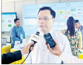
ဒုတိယဝန်ကြီး ဒေါက်တာ အောင်ဇေယျ

မေး။ ။ (၇၉)နှစ်မြောက် ပြည်ထောင်စုနေ့အထိမ်းအမှတ်အနေနဲ့ နေပြည်တော်ရင်ပြင်မှာ ကျင်းပလျက်ရှိတဲ့ ပြည်ထောင်စုအဆင့် MSME ထုတ်ကုန်ပြပွဲနဲ့ ဈေးရောင်းပွဲတော်မှာ သိပ္ပံနှင့် နည်းပညာဝန်ကြီးဌာနပြခန်းနဲ့ Digital Corner ပြခန်းတွေမှာ လာရောက်မေးမြန်းဆွေးနွေးမှုနဲ့ နည်းပညာတောင်းခံမှုအရေအတွက်ကို သိရှိလိုပါတယ်။