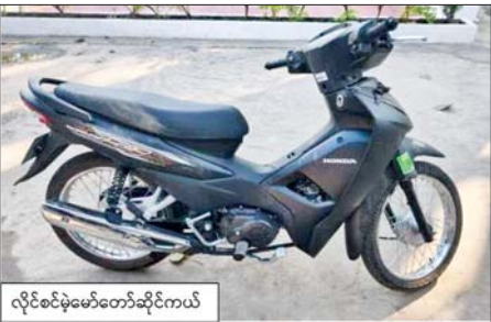
လိုင်စင်မဲ့မော်တော်ဆိုင်ကယ်