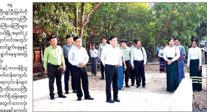
ကျေးမွေးသည့်နေရာများ၊ စားသောက်ဖွယ်ရာများ စီမံဆောင်ရွက်ထားရှိမှု အခြေအနေများကို ကြည့်ရှု စစ်ဆေးပြီး လိုအပ်သည်များကို ညှိနှိုင်းဆောင်ရွက် ပေးသည်။ ယင်းနောက်ပြည်သူများအနေဖြင့်နေထိုင်ကြံ့ခိုင် တွေ့ ရနေရသည့် ဘေးဒုက္ခအန္တရာယ်များကို ခေတ်နှင့် အညီ IT နည်းပညာအသုံးပြု၍ မီးသတ်ဦးစီးဌာနသို့ အချိန်နှင့်တစ်ပြေးညီ သတင်းပေးပို့အကူအညီ တောင်းခံနိုင်ရန်၊ အကူအညီတောင်းခံလာသည့် သတင်းပေးပို့ချက်များကို မီးသတ်ဦးစီးဌာနမှ အချိန် နှင့်တစ်ပြေးညီ တုံ့ပြန်ဆောင်ရွက်နိုင်ရန်၊ မီးသတ် ဦးစီးဌာန၏ ပြည်သူဝန်ဆောင်မှုလုပ်ငန်းများကို အားကိုးယုံကြည်မှုရရှိနိုင်စေရန်၊ နိုင်ငံတော်နှင့် ပြည်သူလူထု၏ အသက်အိုးအိမ်စည်းစိမ်များကို ကာကွယ်စောင့်ရှောက်ရာတွင် IT နည်းပညာဖြင့် အထောက်အကူဖြစ်စေရန်စသည့်ရည်ရွယ်ချက်များ

ထားဝယ် ဖေဖော်ဝါရီ ၁၄ - တနင်္သာရီတိုင်းဒေသကြီး ဝန်ကြီးချုပ်မြတ်ကို သည် တိုင်းဒေသကြီးတရားလွှတ်တော် တရားသူကြီး ချုပ် ဒေါ်ပိုင်ပိုင်ကိုအေး၊ တိုင်းဒေသကြီးဝန်ကြီးများ နှင့်အတူ ယနေ့နံနက်ပိုင်းတွင် ထားဝယ်မြို့ အမှတ်(၂) အခြေခံပညာ အထက်တန်းကျောင်းဝင်းအတွင်း စုပေါင်းသန့်ရှင်းရေးလုပ်ငန်းများ ဆောင်ရွက်နေမှုနှင့် ဒေသပွဲပြီးရေးလုပ်ငန်း ဆောင်ရွက်နေမှုအခြေ အနေများကို ကြည့်ရှုစစ်ဆေးသည်။ ဦးစွာ တိုင်းဒေသကြီးဝန်ကြီးချုပ်နှင့် တာဝန်ရှိသူ များက အမှတ်(၂)အခြေခံပညာအထက်တန်းကျောင်း ဝင်းအတွင်း စုပေါင်းသန့်ရှင်းရေးလုပ်ငန်းများ ဆောင်ရွက်နေမှုကို ကြည့်ရှုအားပေးပြီး တိုင်းဒေသကြီး ဝန်ကြီးချုပ်က ကျောင်းအနောက်ဘက်ရှိ မြေနေရာ တွင် ကျောင်းသား ကျောင်းသူများအတွက် ဘောလုံး အားကစားကွင်း တည်ဆောက်ပြီးစီးနေမှုနှင့် ကျောင်း အား ကြည့်ရှုစစ်ဆေးကာ ကျောင်းအလိုအပ်ချက်များ ကိုသက်ဆိုင်ရာတာဝန်ရှိသူများနှင့် ညှိနှိုင်းဆောင်ရွက် ပေးသည်။ ထို့နောက် တိုင်းဒေသကြီးဝန်ကြီးချုပ်နှင့် တာဝန်ရှိသူများက ထားဝယ်သူနာပြုသင်တန်း ကျောင်းဝင်းအတွင်း သူနာပြုသင်တန်းသား သင်တန်းသူများအတွက် လိုအပ်လျက်ရှိသော မီးဖိုဆောင် ဆောက်လုပ်ပြီးစီးနေမှုနှင့်ချက်ပြုတ်