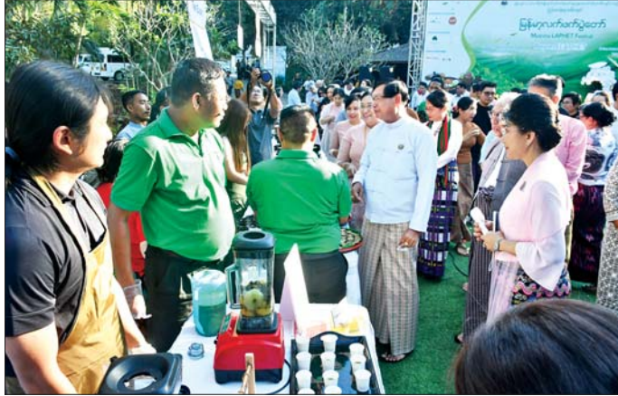
မှုများကို ပြည်သူများက ကြည့်ရှုအားပေးပြီး ဖျော်ရှင် အလားတူ ယမန်နေ့ညနေပိုင်းက ရန်ကုန်မြို့ စွာ ဆင်နွှဲကြသည်။ စိမ်းလန်းစိုပြည်ညွှပ်ညွှပ် ကျင်းပလျက်ရှိသည့် မြန်မာ

ယမန်နေ့ညပိုင်းက (၇၉)နှစ်မြောက် ပြည်ထောင်စု နေ့အထိမ်းအမှတ် ရန်ကုန်တိုင်းဒေသကြီး ကဏ္ဍ အလိုက် ဌာနဆိုင်ရာပြခန်းများပြပွဲနှင့် ဂီတဖျော်ဖြေပွဲ တွင် နိုင်ငံကျော်တေးသံရှင်များ၏ ဖျော်ဖြေတင်ဆက်