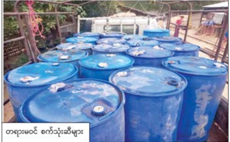
တရားမဝင် စက်သုံးဆီများ

နေပြည်တော် ဖေဖော်ဝါရီ ၁၄ တရားမဝင် ကုန်သွယ်မှု တိုက်ဖျက်ရေး ဦးဆောင်ကော်မတီ၏ ကြီးကြပ်ကွပ်ကဲမှုဖြင့် တရားမဝင်ကုန်သွယ်မှုများကို ဥပဒေနှင့်အညီ ထိရောက်စွာ တားဆီးအရေးယူနိုင်ရေး ဆောင်ရွက်လျက်ရှိသည်။