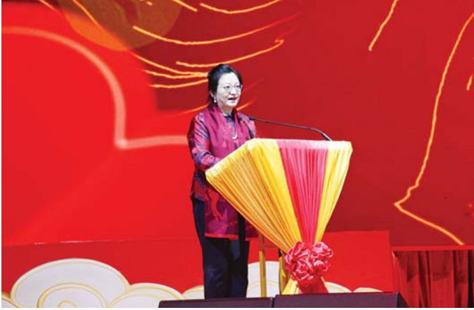
မြန်မာနိုင်ငံဆိုင်ရာ တရုတ်ပြည်သူ့သမ္မတနိုင်ငံ သံအမတ်ကြီး H.E. Ms. Ma Jia နှစ်သစ်ဆုတောင်းစကား ပြောကြားစဉ်။

၂၀၂၅ ခုနှစ်သည် တရုတ်-မြန်မာ ဆက်ဆံရေးအတွက် အရေးပါသည့် နှစ်တစ်နှစ်ဖြစ်ခဲ့ကြောင်း၊ နှစ်နိုင်ငံဆက်ဆံရေးသည် ထိပ်သီးခေါင်းဆောင်များ၏ လမ်းညွှန်မှုအောက်တွင် အဆင့်သစ်တစ်ခုသို့ တက်လှမ်းခဲ့ပါကြောင်း၊ နှစ်နိုင်ငံခေါင်းဆောင်များ နှစ်ကြိမ်တိုင်တိုင် တွေ့ဆုံခဲ့ပြီး ဂုဏ်ပြုစာလွှာများ အပြန်အလှန် ပေးပို့ခဲ့ကြကာ သံတမန်ဆက်ဆံရေး ၇၅ နှစ်ပြည့်ခြင်းကို အခွင့်အလမ်းကောင်းယူ၍ မဟာဗျူဟာမြောက် ပူးပေါင်းဆောင်ရွက်မှုကို နက်ရှိုင်းစေရန်နှင့် တရုတ်-မြန်မာ အေးအတူပူအမျှ ကံကြမ္မာတူညီရေး တည်ဆောက်ရေးကို အရှိန်မြှင့်ဆောင်ရွက်ရန် တွန်းအားပေးခဲ့ကြောင်း၊ ယင်းသည် နှစ်နိုင်ငံဆက်ဆံရေး ဖွံ့ဖြိုးတိုးတက်မှုအတွက် လမ်းညွှန်မှုနှင့် အင်အားကို ပေါ်လွင်စေခဲ့ကြောင်း၊ တရုတ်-မြန်မာ စီးပွားရေး ပူးပေါင်းဆောင်ရွက်မှုတွင် တိုးတက်မှုအသစ်များ ရရှိခဲ့ပြီး နှစ်နိုင်ငံကုန်သွယ်မှုပမာဏမှာ ၁၉ ရာခိုင်နှုန်း တိုးတက်ခဲ့ကာ တရုတ်နိုင်ငံ၏ မြန်မာနိုင်ငံအတွင်း ရင်းနှီးမြှုပ်နှံမှုမှာ ၂၃၀ ရာခိုင်နှုန်း တိုးတက်ခဲ့ပြီး နှစ်နိုင်ငံပြည်သူများအတွက် မြင်သာထင်သာသော