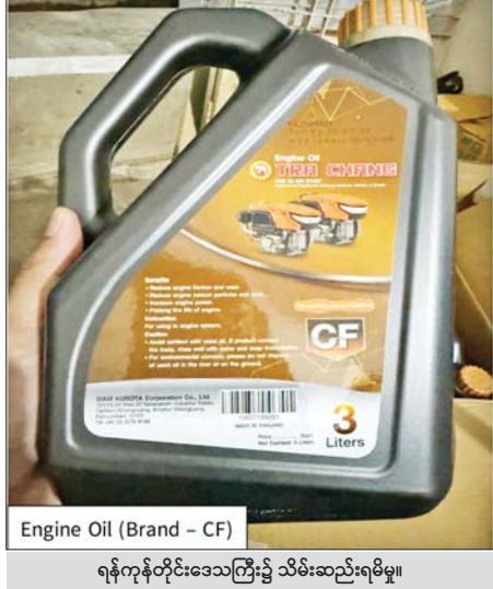
ရန်ကုန်တိုင်းဒေသကြီး၌ သိမ်းဆည်းရမိမှု။

ဖေဖော်ဝါရီ ၉ ရက်၊ ၁၀ ရက်နှင့် ၁၀ ရက်တို့တွင် သိမ်းဆည်းရမိမှု စုစုပေါင်းမှာ အမှုတွဲ ၂၆ မှု (ခန့်မှန်း တန်ဖိုးငွေ ၂၄၈၇၆၉၈၁၇၃ ကျပ်) ကို သိမ်းဆည်းရမိခဲ့သည်။ နိုင်ငံတော်၏ စီးပွားရေးဦးတည်ချက်များနှင့်အညီ ကုန်သွယ်မှု ကဏ္ဍ ဖွံ့ဖြိုးတိုးတက်အောင်