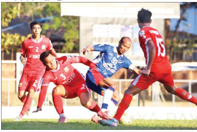
ရှမ်းယူနိုက်တက်အသင်းနှင့် ရတနာပုံအသင်းတို့ ယှဉ်ပြိုင်နေစဉ်။