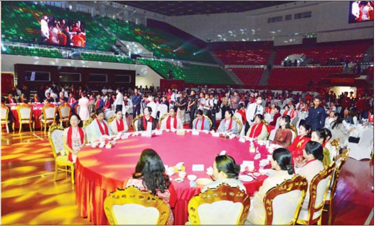
နိုင်ငံတော်လုံခြုံရေးနှင့် အေးချမ်းသာယာရေးကော်မရှင် ဒုတိယဥက္ကဋ္ဌ ဒုတိယဗိုလ်ချုပ်မှူးကြီး စိုးဝင်း တရုတ် နှစ်သစ်ကူးပွဲတော် နှစ်သစ်ဆုမွန်ကောင်းစကား ပြောကြားစဉ်။

ကြာမြင့်ခဲ့ပြီဖြစ်ကြောင်း၊ ထိုသို့ သမိုင်းကြောင်း ကြာမြင့်ပြီဖြစ် သည့် နှစ်နိုင်ငံ၏ ချစ်ကြည်ရင်းနှီး သော ဆက်ဆံရေးနှင့် ရှည်လျား သည့် နယ်နိမိတ်ချင်း ထိစပ်နေမှု များကြောင့် နှစ်နိုင်ငံအကြား နားလည်မှု၊ ယုံကြည်မှုများကို တိုးမြှင့်ပြီး “ဆွေမျိုးပေါက်ဖော်” ဆက်ဆံရေးကို အခိုင်အမာ ထူထောင်နိုင်ခဲ့ခြင်း ဖြစ်ကြောင်း။ “ဆွေမျိုးပေါက်ဖော်” ညီအစ်ကို ရင်းချာစိတ်ဓာတ်ကို အခြေခံပြီး နှစ်နိုင်ငံဆက်ဆံရေးကို ကဏ္ဍစုံ