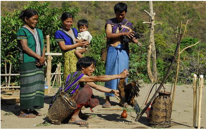
မကျန်းမာသူအတွက် ကြက်၊ ကြက်ဥတို့ဖြင့် နတ်ပူဇော်ဖို့ ပြင်ဆင်နေစဉ်

ရောဂါအတော်ကြီးမားလာရင်တော့ ဝက်သတ်၊ နွားနောက်သတ် လုပ်တော့တာပါပဲ။ အဲဒီနေရာမှာတော့ ချင်းလူမျိုးတွေရဲ့ လုပ်ပုံကိုင်ပုံကို ဘဝင်မကျလှပါဘူး။ ရက်စက်တယ်ပဲ ဆိုရမလား...။ အိပ်ရာက မထနိုင်တဲ့ လူမမာကို ဝက်သတ်ခိုင်းတယ် ခင်ဗျ။ သတ်ပုံသတ်နည်းလေးကလည်း ယဉ်သဗျာ။ အိပ်ရာထဲ လဲနေတဲ့ လူမမာကို မြားတံကိုင်ခိုင်းတယ်။ ဘေးနားကတစ်ယောက်က လေးကို တင်ပေးတယ်လေ။ ပြီးတော့ တိုင်မှာချည်ထားတဲ့ ဝက်ကို ပစ်ခိုင်းလိုက်တာပါပဲ။ လူမမာတစ်ယောက်ရဲ့ အားဆိုတာ သိတဲ့အတိုင်းပါပဲ။ ဝက်က ဘယ်မှာ သေပါ့မလဲ။ အဲဒီတော့မှ ကျန်တဲ့လူတစ်ယောက်က ဝက်ကို မသေမချင်း မြားတံနဲ့ ထိုးသတ်တော့တာပါပဲ။ အဲဒါ ချင်းတွေရဲ့ ရောဂါကုနည်းတစ်ခုပါ။ အခုနောက်ပိုင်းတော့ အကောင်ကြီးတွေ သတ်တဲ့အစဉ်အလာက ရှားသွားပါပြီ။ ကြက်မွေး မီးရှို့တာလောက်၊ ကြက်ဥတင်တာလောက်ပဲ ရှိပါတော့တယ်။