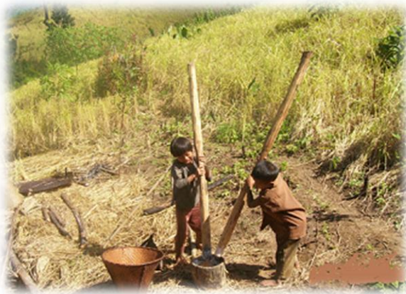
ချင်းကလေးငယ်များ ဆပ်ဝါဖွတ်နေပုံ