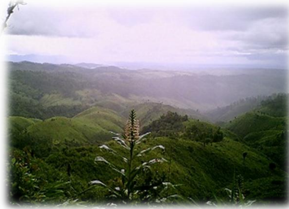
ဆပ်ဝါပင် တစ်ပင်

မစားရတဲ့ အတွက် အစားအသောက်က ရယူရမယ့် အားကို ခေါင်ရည်က ရယူလိုက်ပါတယ်။ ခေါင်ရည်ဆိုတာက ဆပ်နီတွေကို အဆီထုတ်ထားတဲ့ သဘောလိုလည်း ပြောပါတယ်။ ဟုတ်တန်ကောင်းရဲ့လို့တော့ တွက်မိသား။ ချင်းလူမျိုးတွေ အလုပ်ပင်ပင်ပန်းပန်း လုပ်ကြရတယ်။ အလုပ်လည်း လုပ်နိုင်ကြတယ်လေ။ ခေါင်ရည်ကို စိတ်ဝင်စားသွားပါပြီ။ ရွာက မပြန်ခင်တော့ ရအောင် လေ့လာဦးမယ်လို့ တေးမှတ်ထား လိုက်ပါတယ်။