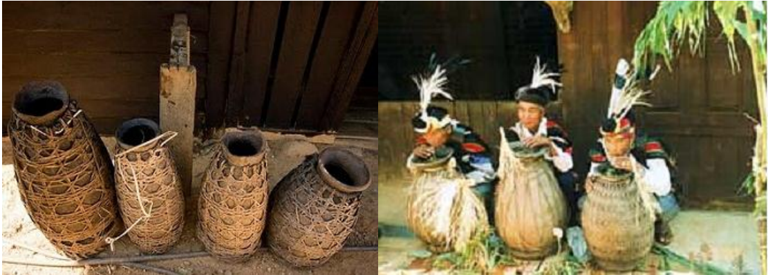
ခေါင်ရည်အိုးအလွတ်များ

ကျွန်တော့် အတွေ့အကြုံအရတော့ ပိုက်လုံးနဲ့ စုပ်သောက်တာ ပိုမူးတယ်ခင်ဗျ။ အဲဒီ ခေါင်ရည်အိုးမျိုးဟာ ချင်းအိမ်တစ်အိမ်မှာ အနည်းဆုံး ၃အိုးကနေ ၄အိုးအထိ ရှိပါတယ်။ မင်းတပ်လို မြို့မျိုးမှာ ရောင်းတဲ့ ခေါင်ရည်တွေကို ဝယ်မသောက်ဖို့ ရွာကလူတွေက ပြောပါသေးတယ်။ အစစ် မဟုတ်ပါဘူးတဲ့။ ဆေးရွက်ကြီးတွေ ထည့်တတ်တယ်၊ သကြားရည်တွေ ထည့်တတ်တယ်တဲ့။ သူတို့ ရွာတွေမှာ ရှိတာမျိုးကတော့ ခေါင်စစ်စစ်ပါပဲတဲ့ ခင်ဗျာ။ ဟုတ်လဲ ဟုတ်ပါတယ်။ ကြိုက်သလောက်သောက် မနက်အိပ်ရာထရင် လူကို လန်းဆန်းနေတာပါပဲ။ အေးတဲ့အရပ်ဒေသတွေမှာ ဝမ်းချုပ်သလို ဖြစ်ရင် ခေါင်ရည်သာ သောက်လိုက် ဝမ်းကို မှန်နေစေရပါမယ်။ နောက်ပြီး ခေါင်ရည်မူးတာလေးကလည်း ယဉ်သဗျ။ အရှိန်ကို လျှော့မသွားပါဘူး ကြာလေ တက်လေ၊ ကြာလေ တက်လေပါပဲ။