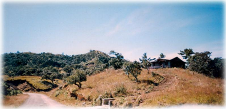
မင်းတပ် မတူပီကားလမ်း ၄၅မိုင်မှ ဘုန်းတော်ကြီးကျောင်းလေး

ကျွန်တော်တို့ ၄၅မိုင်ကို ရောက်ခဲ့တဲ့ အချိန်က အိမ်၇ လုံးလောက်ရှိပြီး၊ ကားလမ်းကို စောင့်ရှောက်ဖို့အတွက် တာဝန်ကျနေတဲ့ ဆောက်လုပ်ရေး ဝန်ထမ်းတွေလဲ စခန်းချနေကြတာ ရှိပါတယ်။ ဘုန်းကြီးကျောင်းလေးမှာတော့ ဘုန်းကြီးမရှိပါဘူး။ ၄၅မိုင်မှာ ရေသိပ်ရှားတော့ တော်ရုံတန်ရုံ ကားလမ်းပေါ်မှာ တက်မနေနိုင်ကြတာပါ။ နောက်တစ်ချက် ၄၅မိုင် ကားလမ်းပေါ်မှာ ရာသီဥတုက အတော့်ကို ဆိုးပါတယ်။ လေတိုက်ကြမ်းသလောက် အတော့်ကို အေးတဲ့နေရာဖြစ်နေပါတယ်။ နေလည်နေ့ခင်း နေလို့ထိုင်လို့ မဆိုးပေမယ့်၊ ညနေစောင်းလာရင်တော့ မြူတွေကျပြီး အေးစိမ့်လာတာပါပဲ။ အဲဒီတော့ တောင်အောက်ကို ဆင်းပြီးနေကြတာများပါတယ်။ ၄၅မိုင်ကနေ အောက်ကိုဆင်းသွားရင် ရွာလေးတစ်ရွာရှိပါတယ်။ ရွာထဲမှာတော့ ရာသီဥတုမျှပြီး ရေလည်းပေါတဲ့ အတွက် လူအနေလည်း များပါတယ်။ ကျွန်တော်တို့ ဦးတည်တဲ့နေရာက တောင်အောက်က ရွာလေးဆီသို့ပါ။ ဒီအတွက် ၄၅ မိုင်မှာ ခဏနေပြီး တောင်အောက်ရွာလေးဆီသို့ ဆက်ပြီး ဆင်းဖြစ်ခဲ့ကြပါတယ်။