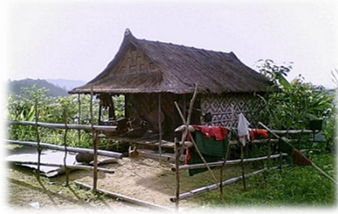
ရောင်လောင်း ရွာထဲက ချင်းအိမ်လေးတစ်အိမ်