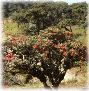
တောင်လေပိန်