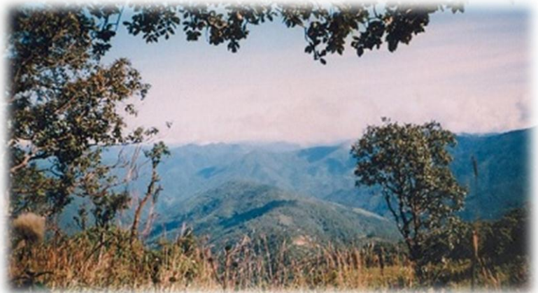
၄၅မိုင်မှ ကြည့်လျှင် တွေ့ရမည့် အနိမ့်ပိုင်း တောင်ကြောလေးတစ်ခုပေါ်တွင် တည်ထားသော ‘ရောင်လောင်း’ ရွာ