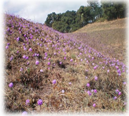
ကြာနဲ့ ခပ်ဆင်ဆင်တူတဲ့ တောင်ကြာ