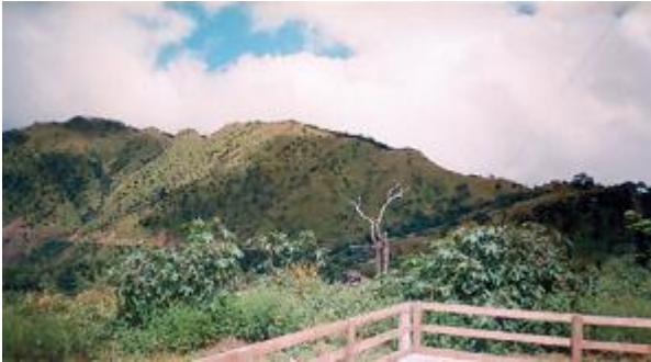
၅၆မိုင် အဝေးမြင်ကွင်း

၅၆မိုင် ဘုန်းတော်ကြီးကျောင်းလေးဟာ မင်းတပ်ကလာတဲ့သူတွေပဲ ဖြစ်ဖြစ်၊ မတူပီကလာတဲ့ သူတွေပဲဖြစ်ဖြစ် ခရီးတစ်ထောက်နားလို့ရတဲ့နေရာဆိုရင်လည်း မမှားပါဘူး။ မတူပီမှာ ဗျူဟာစိုက်တဲ့ ဗျူဟာကြီးတွေတောင် ၅၆မိုင်ဘုန်းကြီးကျောင်းလေးမှာ ဝင်ပြီး ခဏနား ထမင်းစား အမောဖြေတတ်ကြပါတယ်။ ၅၆မိုင်ကို တို့ဒိန်ရွာဆိုပြီး နောက်တစ်မျိုးလဲ ခေါ်တတ်ပါသေးတယ်။ ‘တို့’ ဆိုတာက ချင်းစကားနဲ့ ‘ရေ’ လို့ ခေါ်ပြီး၊ ‘ဒိန်’ ဆိုတာကတော့ ‘ကျ’ တာပေါ့။ နှစ်ခုပေါင်းတော့ ‘ရေကျ’တဲ့ ရွာပေါ့ ခင်ဗျာ။