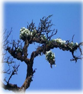
သစ်ခွဖြူ