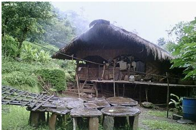
ခေါင်ပွဲအထိမ်းအမှတ် ကျောက်ဖျာထပ်ထားရာ အိမ်တစ်အိမ်

အဲသလို ခေါင်ပွဲများများ လုပ်ပေးဖူးတဲ့ သူတစ်ယောက်ဟာ ချင်းလူမျိုးတွေကြားမှာ ဘယ်လိုနေရာ ရသလဲဆိုရင် ဧည့်ခံပွဲလိုအခါမျိုးမှာ မျက်နှာကြီးပါတယ်။ နွားနောက်ချိုအမှည့်လို ဆိုတဲ့ ဝါနစ်နစ် အရောင်ရှိတဲ့ နွားနောက်ချိုနဲ့ ခေါင်ရည်တိုက်တာကို လက်ခံရပါတယ်။ ဒီလို နွားနောက်ချိုအမှည့်ဆိုတာ တော်ရုံလူ သောက်ခွင့်မရပါဘူး။ နောက်ပြီး ခေါင်ပွဲလုပ်တဲ့သူဟာ အိမ်ခေါင်မိုးမှာ မြားတံလိုလို အချွန်လေးတွေကို စိုက်ထူခွင့်ရပါတယ်။ တိုင်ကို ဖောက်ပြီး ပန်းကန်ပြား စွပ်ခွင့်ရပါတယ်။ ကျောက်ဖျာထပ်ပြီး အထိမ်းအမှတ်လုပ်ခွင့်လည်း ရပါသေးတယ်။ ခေါင်ပွဲဆိုတာ ချင်းလူမျိုးတွေရဲ့ စိတ်ကူးယဉ် အိပ်မက်တစ်ခုဆိုတာ မှားအံ့မထင်ပါဘူး ခင်ဗျာ။