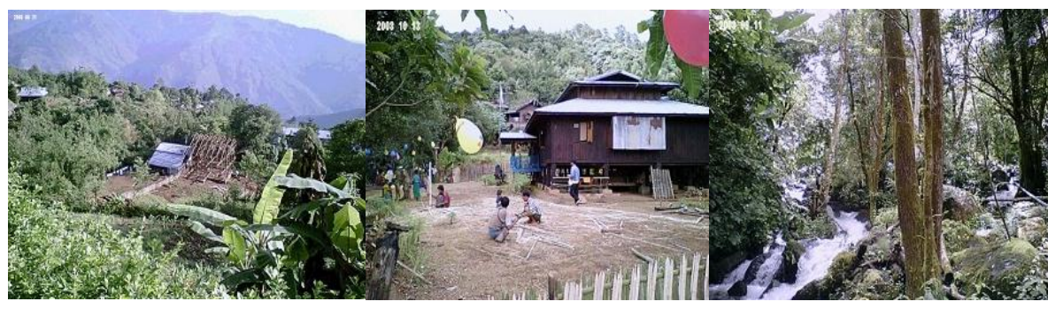
တို့ဒိန်ရွာဟောင်း - ရွာအတွင်း ဘုန်းတော်ကြီးကျောင်း - ဒီလို တောင်ကျရေရှိတဲ့အတွက် တို့ဒိန်(ရေကျ)ရွာနာမည်တွင်

၅၆မိုင်ကနေ လှမ်းကြည့်ရင် ခပ်လှမ်းလှမ်းမှာ မိုးထိတောင်ဆိုတာ တစ်တောင် ရှိပါသေးတယ်။ မိုးထိတောင်ဟာ ဝိတိုရိယာပြီးရင် ဒုတိယအမြင့်ဆုံးတောင်လို့ ဆိုရမလားပဲ။ မိုးထိတောင်ထိပ် ပေါ်မှာ ဉာဏ်တော် သိပ်မမြင့်တဲ့ စေတီတစ်ဆူရှိပါတယ်။ သို့သော်... စောင့်ရှောက်မယ့်သူ မရှိတော့ ပျက်စီးယိုယွင်းစပြုလာပါပြီ။ တောင်ပေါ်မှာ နေမယ့်သူတွေလည်း မရှိ စေတီတော်ကို စောင့်ရှောက်မယ့်သူလည်း မရှိဖြစ်နေရတယ်။ အခု ၅၆မိုင်မှာ ဉာဏ်တော် ၁၈တောင်မြင့်တဲ့ စေတီတစ်ဆူ ထပ်ရှိလာပါတယ်။ ဒီစေတီတော်ကတော့ မင်းတပ် မတူပီလမ်း တစ်လျှောက်မှာ ဉာဏ်တော်အမြင့်ဆုံး ဆိုလို့ရပါတယ်။ စေတီကို ထီးတော်တင်တဲ့အချိန်ကတော့ ခမ်းခမ်းနားနားပါပဲ။ မင်းတပ် မတူပီ ကန်ပက်လက် နယ်မြေတစ်ကျောက် အစိုးရအမှုထမ်းတွေ အကုန်လာရောက်ကြပါတယ်။ မလာလို့လဲ မဖြစ်ကို ခင်ဗျ။ ဗျူဟာမှူးကြီးကိုယ်တိုင်က ဦးစီးဦးဆောင် လုပ်ဆောင်သွားခဲ့တာကို။