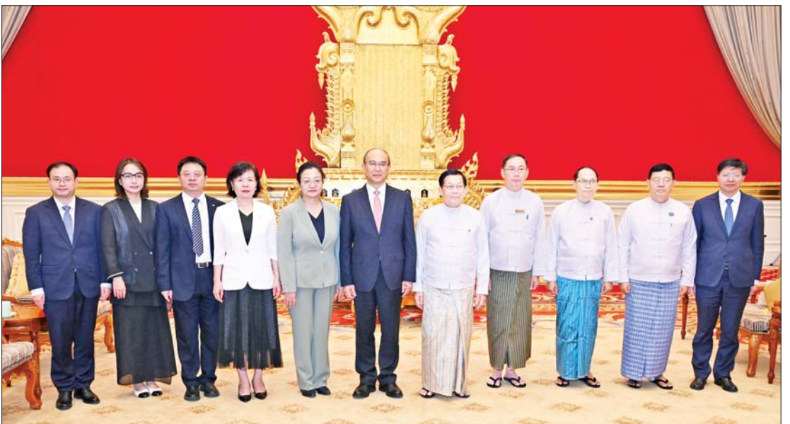
ပြည်ထောင်စုသမ္မတမြန်မာနိုင်ငံတော် နိုင်ငံတော်သမ္မတ ဦးမင်းအောင်လှိုင် တရုတ်ပြည်သူ့သမ္မတနိုင်ငံ ဟေလုံကျွန်းပြည်နယ် ပြည်သူ့ကွန်ဂရက် အမြဲတမ်းကော်မတီ ဥက္ကဋ္ဌနှင့် တရုတ်ကွန်မြူနစ်ပါတီ၏ ဟေလုံကျွန်းပြည်နယ်ဆိုင်ရာကော်မတီ အတွင်းရေးမှူး H.E. Mr. Xu Qin ဦးဆောင်သော ကိုယ်စားလှယ်အဖွဲ့နှင့်အတူ စုပေါင်းမှတ်တမ်းတင် ဓာတ်ပုံရိုက်စဉ်။

ထိုသို့တွေ့ဆုံရာတွင် နှစ်နိုင်ငံနှင့် နှစ်နိုင်ငံ ခေါင်းဆောင်များအကြား ချစ်ကြည်ရင်းနှီးမှုနှင့် ပူးပေါင်းဆောင်ရွက်မှုများ ရှည်ကြာကောင်းမွန်ခဲ့ပြီး ဆွေးနွေးပေါက်ဖော် ချစ်ကြည်ရေးရှိသည့် အခြေအနေများ၊ နှစ်နိုင်ငံအကြား ငြိမ်းချမ်းစွာ အတူယှဉ်တွဲနေထိုင်ရေး မူကြီး(၅)ရပ်နှင့်အညီ အေးအတူ ပူအမျှ အသိုက်အဝန်း တည်ဆောက်လျက်ရှိမှု အခြေအနေများ၊ မြန်မာနိုင်ငံနှင့် ဟေလုံ ကျွန်းပြည်နယ်တို့အကြား ပူးပေါင်း ဆောင်ရွက်မှုများမြှင့်တင်ပြီး နှစ်နိုင်ငံ ဆက်ဆံရေးကို ပိုမိုမြှင့်တင်ဆောင်ရွက် နိုင်မှုအခြေအနေများ၊ နှစ်နိုင်ငံအဆင့်မြင့် ခေါင်းဆောင်များ ချစ်ကြည်ရေးခရီးစဉ် များ အပြန်အလှန်လည်ပတ်ခဲ့မှုအခြေ အနေများ၊ သိပ္ပံနှင့်နည်းပညာကဏ္ဍ၊ စက်မှုကဏ္ဍ၊ စိုက်ပျိုးရေးကဏ္ဍ၊ လုံခြုံရေး ကဏ္ဍ၊ ခရီးသွားလာရေးကဏ္ဍ၊ ကျန်းမာ ရေးကဏ္ဍ၊ ယဉ်ကျေးမှုကဏ္ဍ၊ လူငယ် ကဏ္ဍနှင့် ပညာရေးကဏ္ဍများအပါအဝင် ကဏ္ဍပေါင်းစုံ၌ ပူးပေါင်းဆောင်ရွက်မှု များ ပိုမိုမြှင့်တင်ဆောင်ရွက်သွားမည့် အခြေအနေများ၊ စိုက်ပျိုးရေးလုပ်ငန်းများ တိုးတက်စေရေး နှစ်နိုင်ငံအကြား လယ်ယာထုတ်ကုန်ပစ္စည်းများ ထုတ်လုပ် ရေးနှင့် စိုက်ပျိုးရေးနည်းပညာများ တိုးတက်စေရေး ပူးပေါင်းဆောင်ရွက်နိုင်