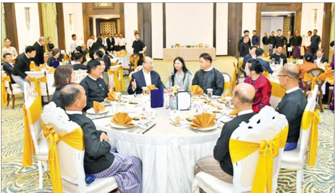
အသင်းချုပ်ဥက္ကဋ္ဌ၊ မြန်မာ-တရုတ် ရင်းနှီးမြုပ်နှံမှုနှင့် ကုန်သွယ်မှုမြှင့်တင်ရေးအဖွဲ့ဥက္ကဋ္ဌနှင့် အဖွဲ့ဝင်များ တက်ရောက်ကြသည်။ က နှုတ်ခွန်းဆက်စကားပြောကြားပြီး ဟေလုံကျန်း ပြည်နယ် ပြည်သူ့ကွန်ဂရက်အမြဲတမ်းကော်မတီ ဥက္ကဋ္ဌနှင့် တရုတ်ကွန်မြူနစ်ပါတီ၏ ဟေလုံကျန်း ပြည်နယ်ဆိုင်ရာကော်မတီ အတွင်းရေးမှူး H.E. Mr.