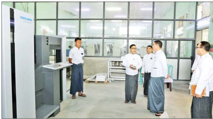
ပြည်ထောင်စုဝန်ကြီး ဦးထိန်လင်း နေပြည်တော် ပုံနှိပ်စက်ရုံ၌ ကြည့်ရှုစစ်ဆေးစဉ်။

နေပြည်တော် ဧပြီ ၂၁ ပြန်ကြားရေးဝန်ကြီးဌာန ပြည်ထောင်စုဝန်ကြီးနှင့် ပုံနှိပ်ရေးနှင့် ထုတ်ဝေရေးဦးစီးဌာနနှင့် သတင်းနှင့် စာနယ်ဇင်းလုပ်ငန်းတို့မှ ဝန်ထမ်းများ တွေ့ဆုံပွဲကို ယနေ့နံနက်ပိုင်းတွင် နေပြည်တော် ဇေယျာသီရိ မြို့နယ် ၁ ရေပင်လမ်းခွဲရှိ ဘိုးဝဇီရခန်းမ၌ ပြုလုပ်သည်။ တွေ့ဆုံပွဲ ပြည်ထောင်စုဝန်ကြီး ဦးထိန်လင်းက နိုင်ငံတော်သမ္မတနှင့် အစိုးရအဖွဲ့၏ မူဝါဒများ၊ မိန့်ခွန်းများ၊ လမ်းညွှန်ချက်များကို ပြည်သူများ အချိန်နှင့် တစ်ပြေးညီ သိရှိအောင် ပြန်ကြားပေးရန်၊ အလားတူ ဥပဒေပြုရေးမဏ္ဍိုင်၊ တရားစီရင်ရေးမဏ္ဍိုင်တို့၏ လုပ်ဆောင်မှုများကိုလည်း ပြည်သူများသိရှိအောင် ပြန်ကြားပေးရန်၊ အစိုးရအဖွဲ့သစ်၏ ရက်(၁၀၀) အတွင်း အကောင်အထည်ဖော် ဆောင်ရွက်မှုများကို ပြည်သူများ သိရှိအောင် ထုတ်ပြန်ပေးရန်၊ မိမိတို့ထမ်းဆောင်ရမည့် လုပ်ငန်းတာဝန်များအား မိသားစုစိတ်ဓာတ်ဖြင့် ညီညီညွတ်ညွတ် လက်တွဲဆောင်ရွက်ကြရန်၊ ကျောင်းသားလူငယ်များ