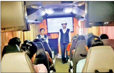
An Luggage Industry Co.,Ltd. Co.,Ltd. အထည်ချုပ်စက်ရုံတို့တွင် အိတ်ချုပ်စက်ရုံနှင့် Kamra ဆောင်ရွက်သည်။ Manufacturing (Myanmar) ဦးစွာ အင်းစိန်ခရိုင်ရုံးမှ

အလုပ်သမား ဝန်ကြီးဌာနအလုပ်ရုံနှင့် အလုပ်သမားဥပဒေစစ်ဆေးရေးဦးစီးဌာန ရန်ကုန်တိုင်းဒေသကြီး အင်းစိန်ခရိုင်ရှမ်းက သင်ထောက်ကူမော်တော်ယာဉ်ဖြင့် လုပ်ငန်းခွင်ဘေးအန္တရာယ်ကင်းရှင်းရေးဆိုင်ရာ ကိစ္စရပ်များနှင့် အလုပ်သမားများ၏ ဥပဒေပါ ရပိုင်ခွင့်များဆိုင်ရာ အသိပညာပေး ဆွေးနွေးပွဲကို ဧပြီ ၂၁ ရက်က အင်းစိန်မြို့နယ်ရှိ ရွှေပြည်သာ စက်မှုဇုန်(၄)မှ Heng