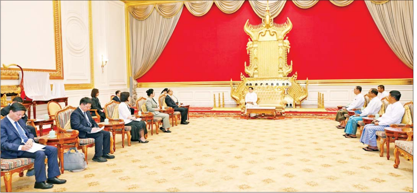
ပြည်ထောင်စုသမ္မတမြန်မာနိုင်ငံတော် နိုင်ငံတော်သမ္မတ ဦးမင်းအောင်လှိုင် တရုတ်ပြည်သူ့သမ္မတနိုင်ငံ ဟေလုံကျွန်းပြည်နယ် ပြည်သူ့ကွန်ဂရက်အမြဲတမ်းကော်မတီဥက္ကဋ္ဌနှင့် တရုတ်ကွန်မြူနစ်ပါတီ၏ ဟေလုံကျွန်းပြည်နယ်ဆိုင်ရာကော်မတီ အတွင်းရေးမှူး H.E. Mr. Xu Qin ဦးဆောင်သော ကိုယ်စားလှယ်အဖွဲ့အား လက်ခံတွေ့ဆုံစဉ်။