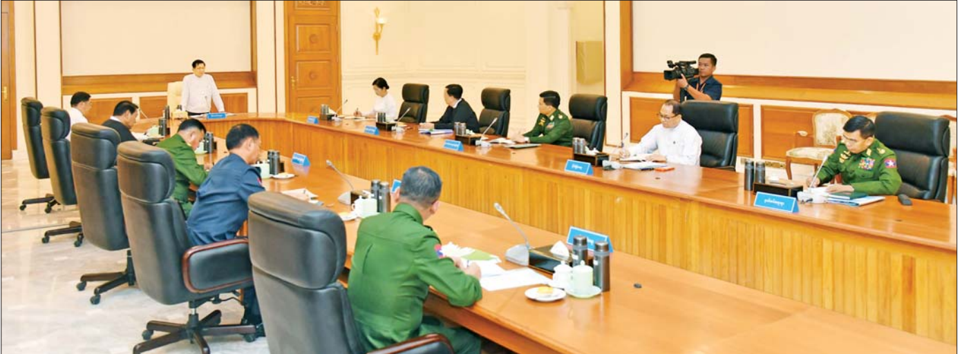
နိုင်ငံတော်သမ္မတ ဦးမင်းအောင်လှိုင် ပြည်ထောင်စုသမ္မတမြန်မာနိုင်ငံတော် အမျိုးသားကာကွယ်ရေးနှင့် လုံခြုံရေးကောင်စီအစည်းအဝေးတွင် အမှာစကားပြောကြားစဉ်။